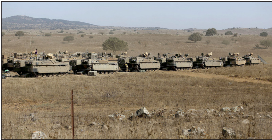
قوات اسرائيلية في الجولان

يرد اسرائيلي حاد ولهذا فقد فصلت إيران ان تبعه عنه الدليل من خلال جهة خارجية. لقد كان رد اسرائيل السريع والحازم بهجوم قوي على القوات السورية جوبايا صهيونيا واستراتيجية فائقة، فقد اوضحت للإيرانيين بأنه ليس لهم مخيا تحت شمس الاستخبارات الاسرائيلية وكل جديد مالها الفشل. تأنيبا، نفهم انصالحات الاعمى الإيرانية وقد قدمت بحلقة الاضعف في السلسلة. إذا كان الجيش السوري سينهار - فان قبضتهم في سوريا كلها سننتهي. ان حادثة الصواريخ هي بالفعل هامة في معادلة الردع التي ينبغي لاسرائيل ان تخلقها حيال الجبال الغفوضي السوري