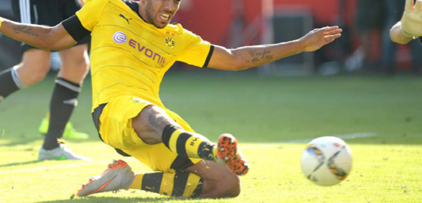
أوباميانغ تائق وسجل هدفي لدورتموند

■ جنيف - أ ب ب: اعتبر الحامي السويسري فرانسوا كارار المعين من الاتحاد الدولي لكرة القدم لإجراء إصلاحات في ظل أزمة فساد هائلة تضرب أروقة ان مواطنه ورئيس فيفا جوزيف بلاتر تتم معاملته بشكل غير عادل. وقال كارا: «هناك شيء غير عادل في طريقة التعامل معه، أقول ذلك وأنا مستقل تماما. صحيح أنه ارتكب بعض الأخطاء، لكنه قدم مساهمات إيجابية... يعامل هذا الرجل بطريقة ظالمة»، وتم تعيين كارار (77 عاما) رئيسا لجانة الإصلاحات في 11 آب/أغسطس وستعقد اجتماعها الأول في 2 أيلول/سبتمبر في العاصمة السويسرية بيرن. وأعلن بلاتر في 20 تموز/يوليو إنشاء لجنة الإصلاحات على أن تقدم مقترحاتها إلى مؤتمر الفيفا الاستثنائي لانتخاب خليفة للسويسري يوم 26 فبراير القادم في اجتماع الجمعية العمومية وسط توقعات بفوز الفرنسي ميشيل بلاتيني الرئيس الحالي للاتحاد الأوروبي. وجاءت تصريحات بلاتر اليوم خلال بطولة سنوية لكرة القدم ينظمها بالقرب من مسقط رأسه في سويسرا وسبق لبلاتيني الحضور في نسخ سابقة لكنه لم يحضر هذه المرة رغم دعوته.