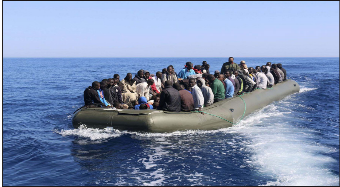
مهاجرون غير شرعيين في المتوسط

وتستغل شبكات لتجريب الأشخاص الفوضى العارمة في ليبيا لإيصال مهاجرين غير شرعيين نحو إيطاليا وكسب المال.