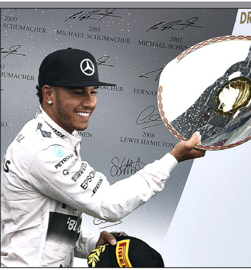
هاميلتون يعرض جائزة السباق بعد فوزه