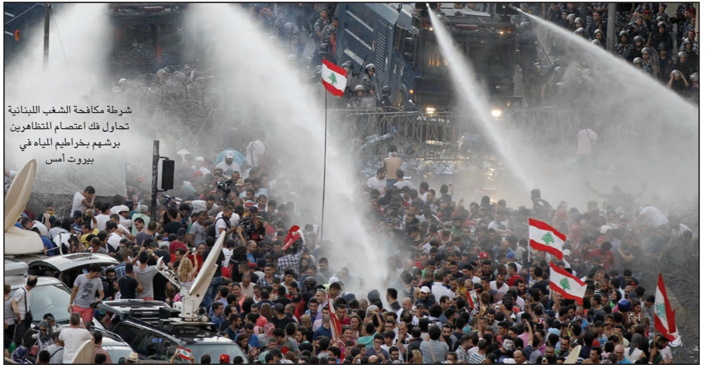
شرطة مكافحة الشغب اللبنانية تحاول فك اعتصام المتظاهرين برشهم بخراطيم المياه في بيروت أمس