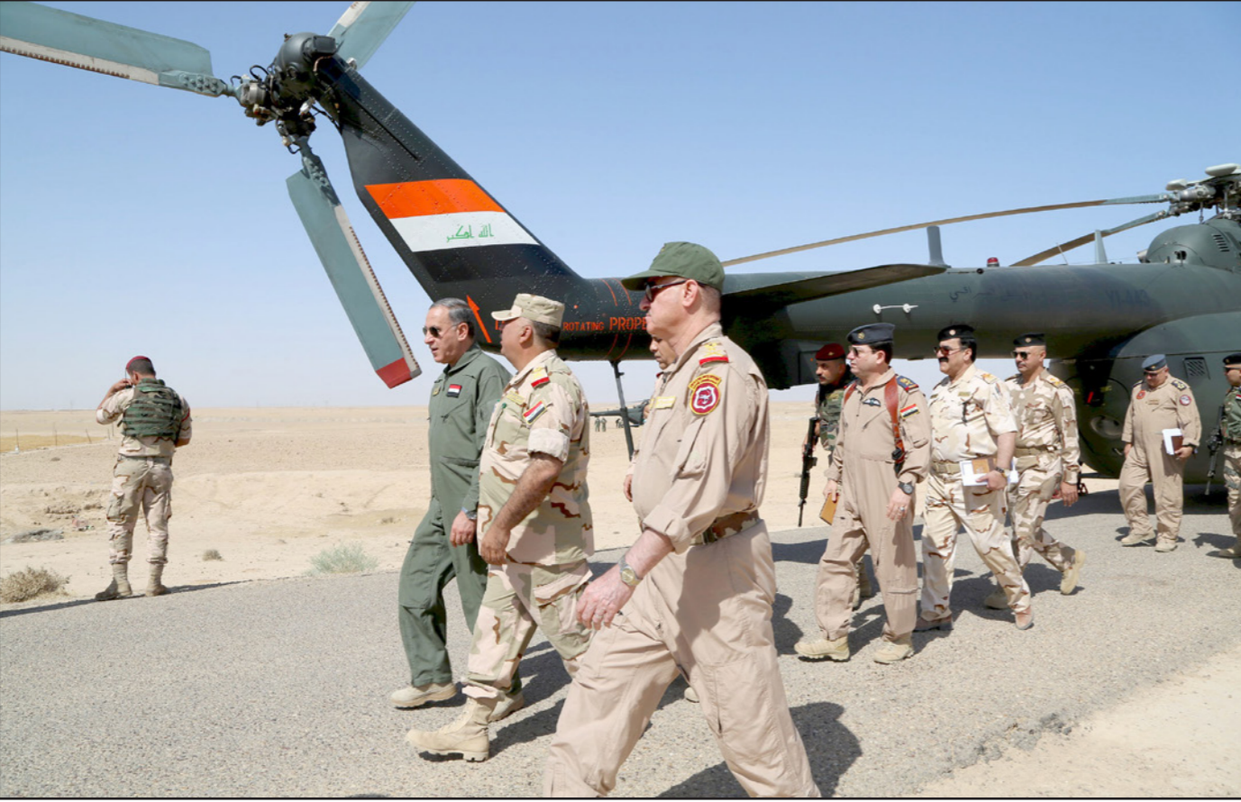
وزير الدفاع العراقي خالد العبيدي في زيارة لمحافظة الانبار

الموصل حيث استهدفت وحدات تكتيكية ومبان ومواقع قتالية وأسلحة ومركبات، كما استهدفت الغارات قوات تابعة لعناصر «داعش» قرب تسع مدن عراقية أخرى.