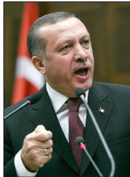
رجب طيب اردوغان

في سياق آخر، قضت محكمة تركية، الأحد، باعتقال خمسة أشخاص من بينهم رئيساً بلديتي قضائي «سور»