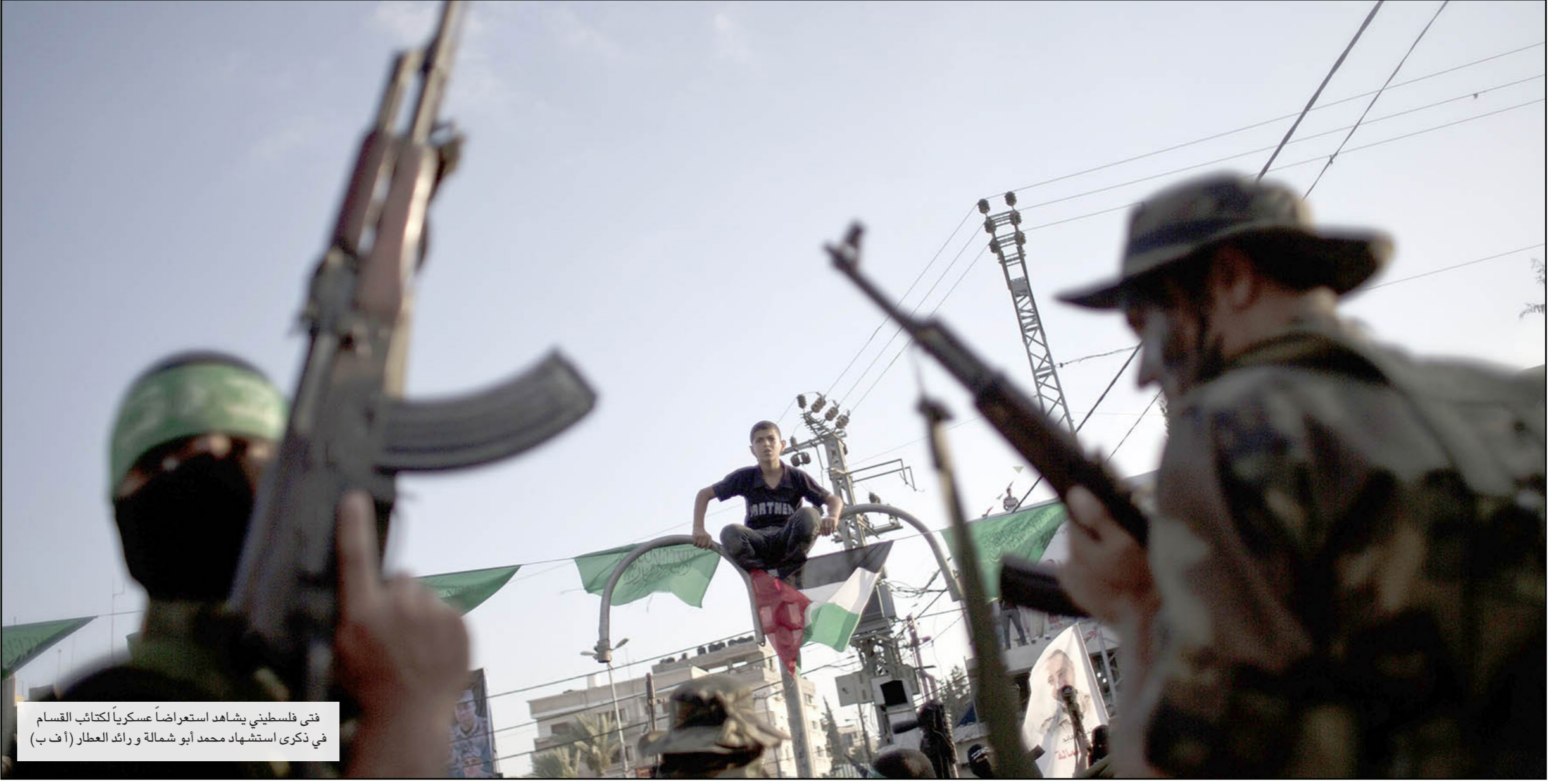
فتى فلسطيني يشاهد استعراضاً عسكرياً لكثائب القسام في ذكرى استشهاد محمد أبو شمالة ورائد العطار

وتنافي تصريحات يعلون وجلعاد هذه، ما يجري على الأرض، من عقد مسؤولين دوليين أبرزهم مبعوث الرباعية السابق توني بلير، لقاءات مع رئيس المكتب السياسي لحماس خالد مشعل أكثر من مرة في العاصمة القطرية الدوحة لبحث ملف التهدة الطويلة الأمد، التي نقلت