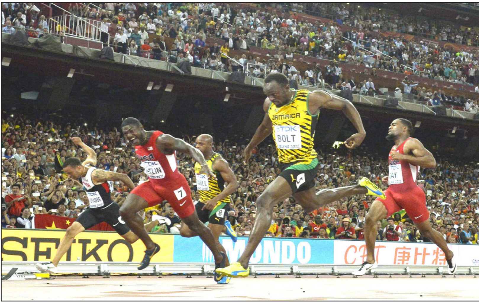
بولت (يمين) تتفوق على غاتلين بفارق عشر واحد من الثانية

بينما جاء القطري أشرف الصفي، المولود في مصر، في المركز التاسع مسجلا 74.09 متر.