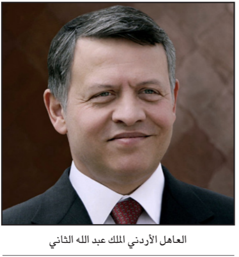
العامل الأردني الملك عبد الله الثاني

وبالتالي الاتجاه نحو تغيير وزاري موسع، خصوصا بعدما صرح رئيس مجلس النواب وبيصفته ناطقا باسم جميع زملائه بأن المشاورات البرلمانية التي أفضت لتشكيل حكومة النصور «عبء» على الجميع ويمكن الاستغناء عنها والعودة للصيغة القديمة بعبوان الصلاحيات الحصرية للملك في تشكيل الحكومة.