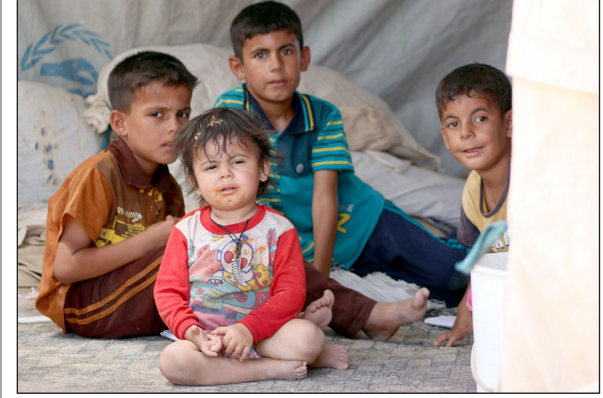
أطفال عراقيون في أحد مخيمات اللاجئين

«يؤلني كثيراً أن أرى العديد من أبناء بلدي من الأساتذة والمفكرين وهم يحملون من الوعي وبمقظة الضمير أكثر بكثير مما يحمله الكثيرون من السياسيين ومسؤولي الدولة ولكنهم مستبعدون عن السلطة ومراكز القرار. «يزداد» حين أرى غيرهم من المسطحين والبسطاء من قبلي الوعي وضعيفي الضمير وهم يتبانون مراكز القرار في السلطة والدولة بعد أن افتعلوا فلسفة المحاصصة المقيتة التي لم يستفد منها إلا الزبويون والطاقفون وتجار الدين. «الشكوك له همتي الكبير عن ضياع العراق ونمزقه وانتشار الفساد فيه، فاجابني بمرارة وأسى أن من سميتهم أهل الحل والعقد هم المسؤولون قبل غيرهم عن تزييق البلد وتدميره لأنهم ففلسوا مصالحهم الحزبية والفئوية على مصالح شعبيهم بل قدموا موهومهم الخاصة والعائلية على هوموم وطنهم وأمتهم وحتى أحرابهم وطوائفهم.