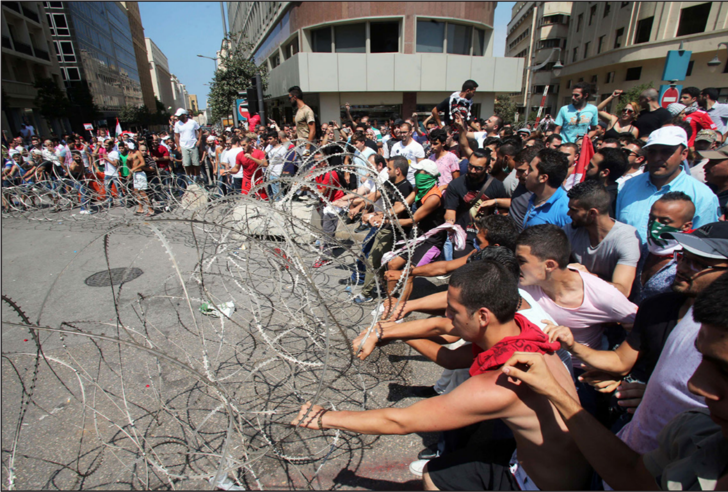
متظاهرون لبنانيون يسحبون الأسلاك الشائكة خلال تظاهرة «طلعت ريحتكم» احتجاجاً على أزمة القمامة

وعلق الرئيس السابق للحكومة نجيب ميقاتي على الحوادث التي حصلت في ساحة رياض الصلح بالقول: «ندمنا بدأ التجمع الشيعي بعد الظهر في وسط بيروت بطريقة سلمية ومن دون سلاح قلت في نفسي هذه حركة جديدة تلغي 14 و 8 آذار لتنتشج حركة جديدة هي حركة