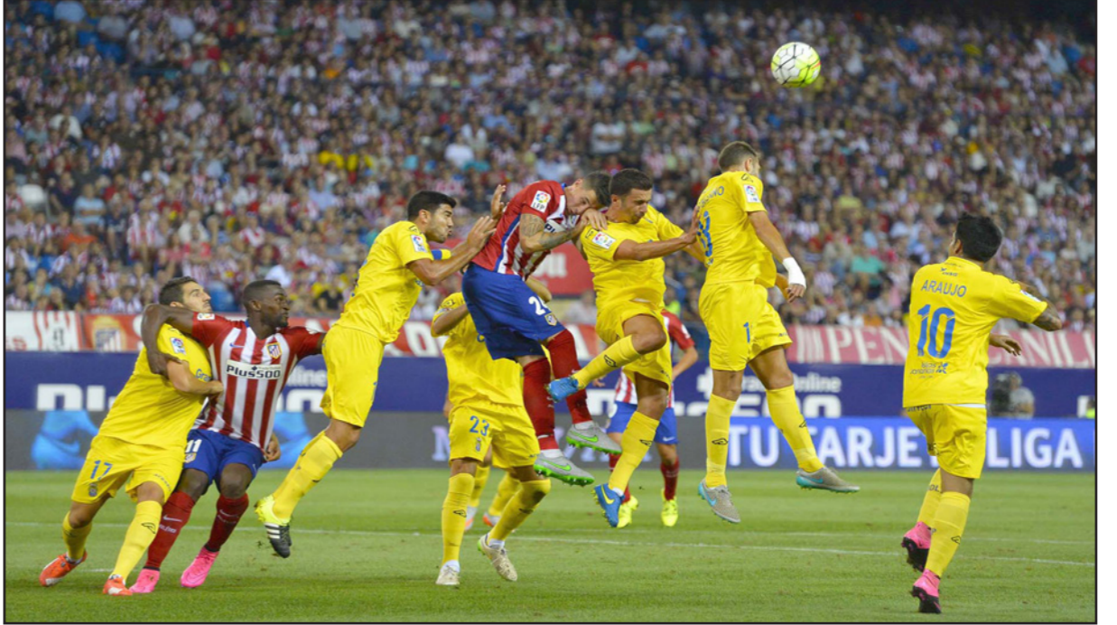
قطار بشري من لاعبي أتلتيكو ولاس بالماس في انتظار تسديد كرة عالية

ليقود أتلتيكو مدريد إلى فوز ثمين وصعب 1/صفر على ضيفه لاس بالماس في المرحلة الأولى من الدوري الأسباني.