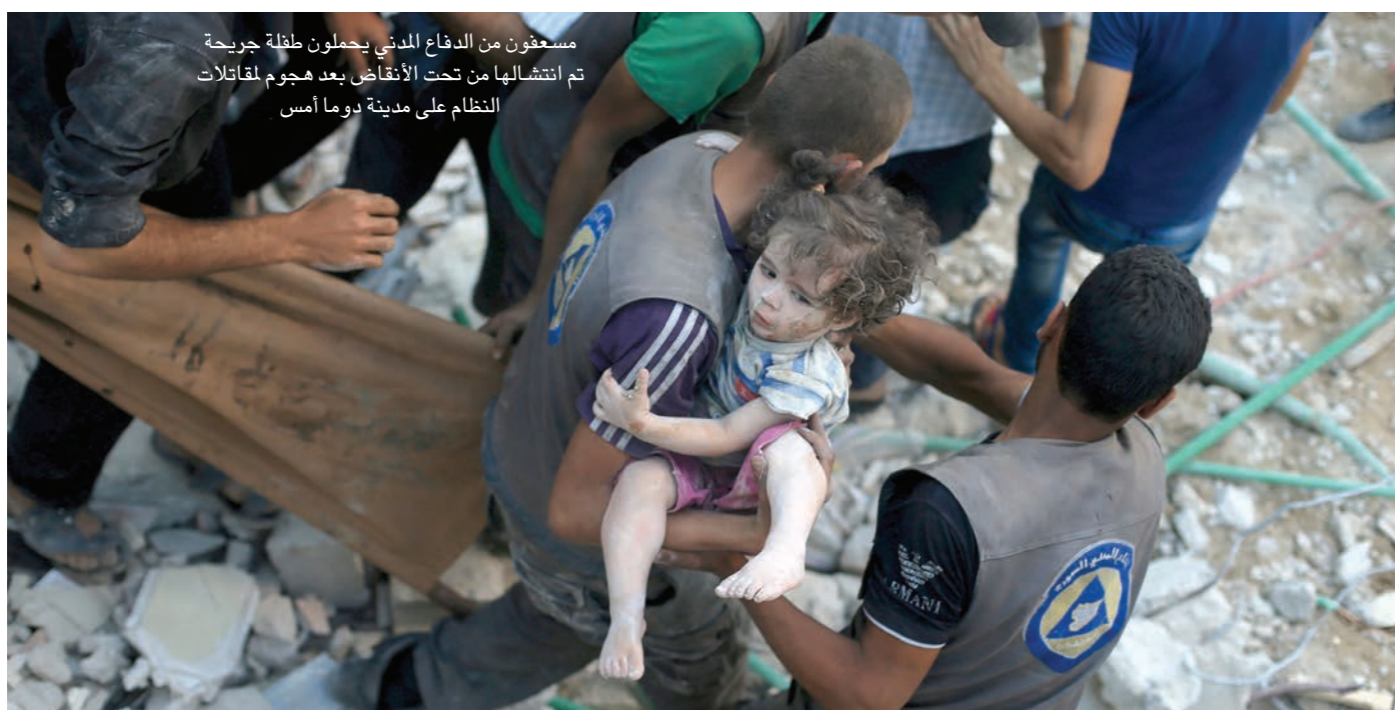
مسجونون من الدفاع المدني يحملون طفلة جرحية تم انتشالها من تحت الأنقاض بعد هجوم لمقاتلات النظام على مدينة دوما أمس

تزامنت الغارات الأخيرة للنظام السوري على دوما والتي سوت مبانها بأكملها بالأرض، وسقط فيها مئات القتلى والجرحى، مع الذكرى السنوية الثانية للهجوم بالسلاح الكيماوي الذي استهدف المدينة في 21 آب/ أغسطس 2013 وأوقع مئات القتلى. من جانبه، قال المرصد السوري لحقوق الإنسان، إن صاروخ أرض-أرض على الأرجح أصاب الأجزاء الأكثر اكتظاظا بالسكان في المنطقة التي يقم بها ربع مليون مدني على الأقل، وتبع الهجوم بغارات جوية.