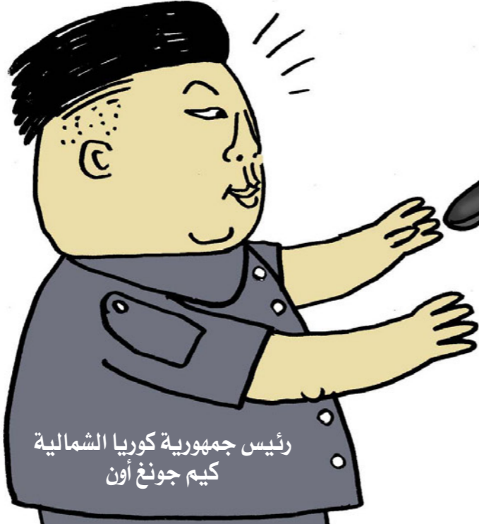
رئيس جمهورية كوريا الشمالية كيم جونغ أون