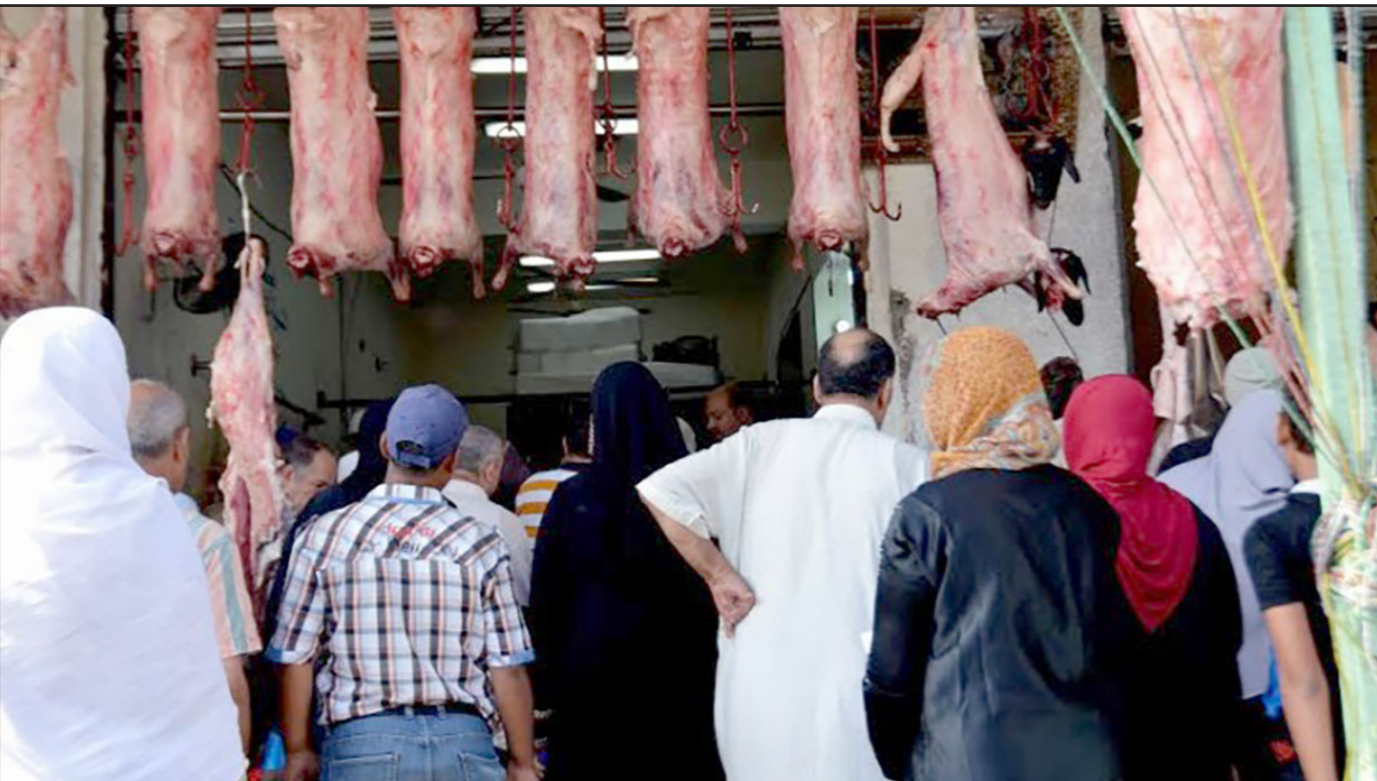
مصريون في إحدى الجمعيات الاستهلاكية أمس طلبا للحوم المدعومة الأسعار

منظومة لتحديد سعر ثابت ومقبول للحوم لمنع مغالاة الجزارين في أسعارها»، وغرد نشطاء «تويتر» عبر هاشتاغ «مقاطعة اللحم» مساندين لحملة إذ جاءت تعليقاتهم تنادي بضرورة العاطي الجازرين، وساعين لخفض الأسعار قبيل عيد الأضحى المبارك، وتباينت ردود فعل نشطاء التواصل الاجتماعي إذ تعاطف مع فكرة الحملة أغلبية منهم.