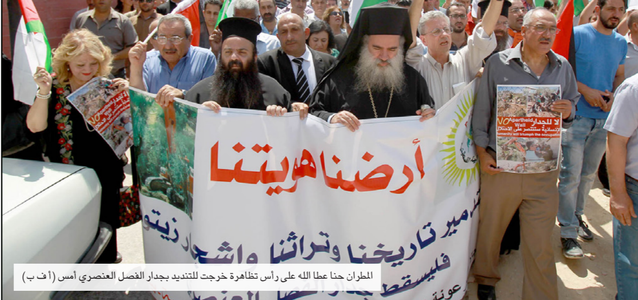
المطران حنا عطا الله على رأس تظاهرة خرجت للتنديد بجدار الفصل العنصري أمس

وبعد مواجهات الأسبوع الماضي مع جيش الاحتلال اعتدء الجيش على الرموز الدينية والمواطنين بعنف أعلن عن «أحد التغيير ونداء الواجب» من قبل اللجنة الشعبية لمقاومة الجدار والإستيطان والقوى الوطنية والمؤسسات الأهلية والكثاوس والساجد في مدينة بيت جالا وبحضور المطران عطا الله حنا والأبناء