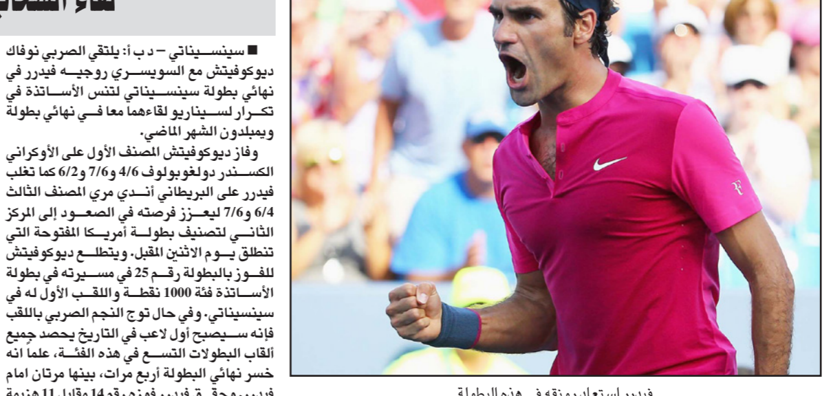
فيدرر استعاد رونقه في هذه البطولة