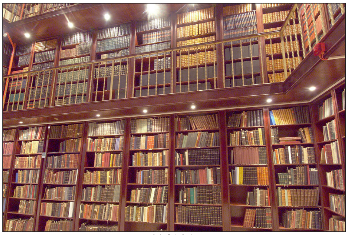
مكتبة قطر الوطنية

والترميم. الجدير بالذكر أن مكتبة قطر الوطنية تحتوي على مجموعة تراثية تسهم بطريقة فريدة في إثراء المشهد الثقافي لدولة قطر، وكان الشيخ حسن بن محمد بن علي آل ثاني قد وضع النواة الأولى لهذه المجموعة في بداية الثمانينيات من القرن الماضي، وتمثل هدفه الأساسي من إنشائها مع بدايات ظهور الطباعة، مثل الكتب التي تمت طباعتها في مطبعة الشوير في لبنان، وحبس والوصل ويولات والحجاز.