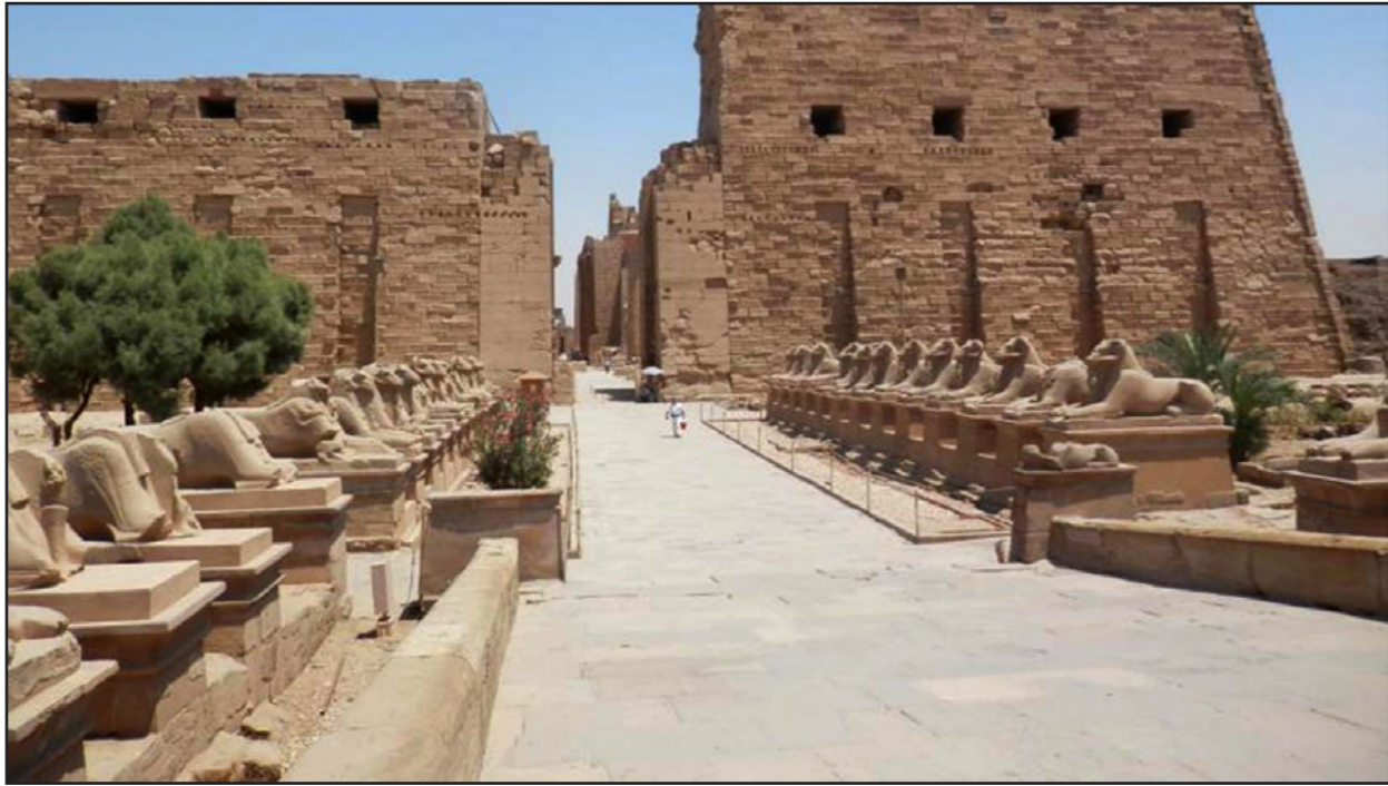
طريق الكباش في الاقصر

ارتفاع الودائع في البنوك الفلسطينية بنسبة 7.7 في المئة الأول من العام الفات إلى 8.4 مليار دولار، أي بنسبة 7.7 في المئة. وخلال نفس الفترة بلغ إجمالي ودائع غير المقيمين في الضفة والقطاع ومؤسسات الدولة) حتى نهاية النصف الأول من العام الجاري قرابة 727.5 مليون دولار أمريكي. ويعمل في السوق الفلسطينية 16 مصرفا محليا ووافدا، 7 مصارف محلية منها مصرفين إسلاميين وخمسة مصارف تجارية، و9 مصارف تجارية وافدة، منها 7 بنوك أردنية، وبنك مصري وبنك بريطاني.