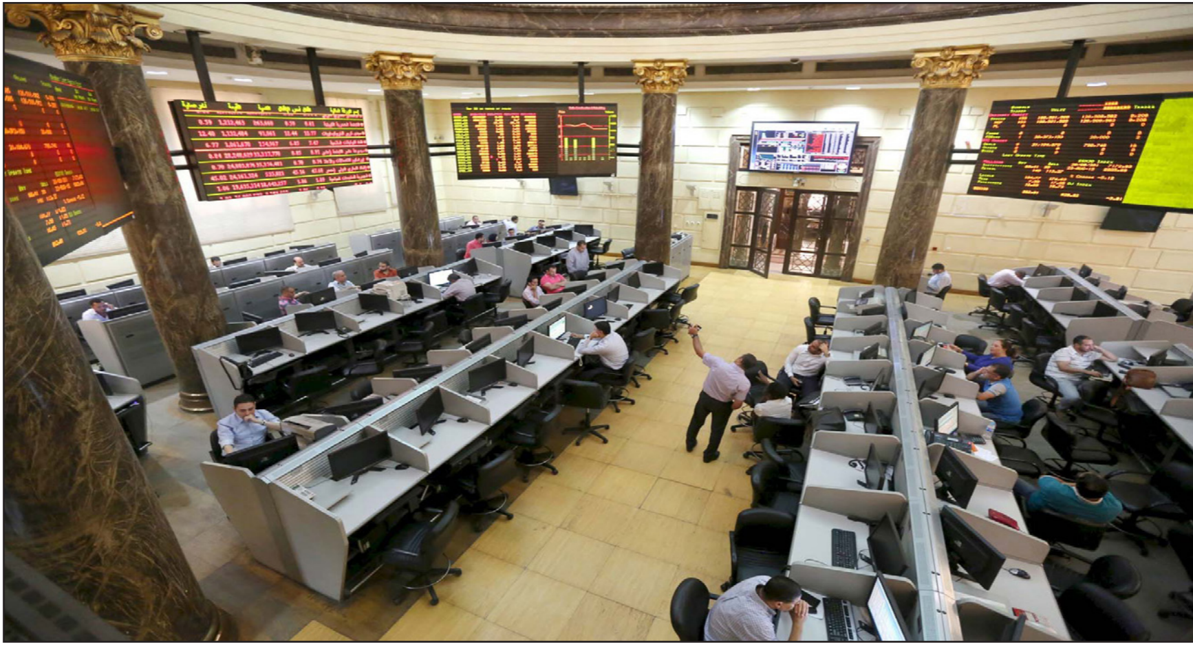
متعاملون في البورصة المصرية

وقد يتطلب أن تستقر أسعار النفط وأسواق الأسهم الأجنبية الرئيسية، ومن ثم انخسار المخاوف بشأن الاقتصاد الصيني، كي تتوقف عمليات البيع في الخليج. وأضاف أنه عندما يحدث ذلك فقد نرى إعادة شراء كبيرة في أسواق مثل الإمارات، حيث بلغت التقييمات مستويات مغرية. والأسهم الإماراتية متداولة قرب