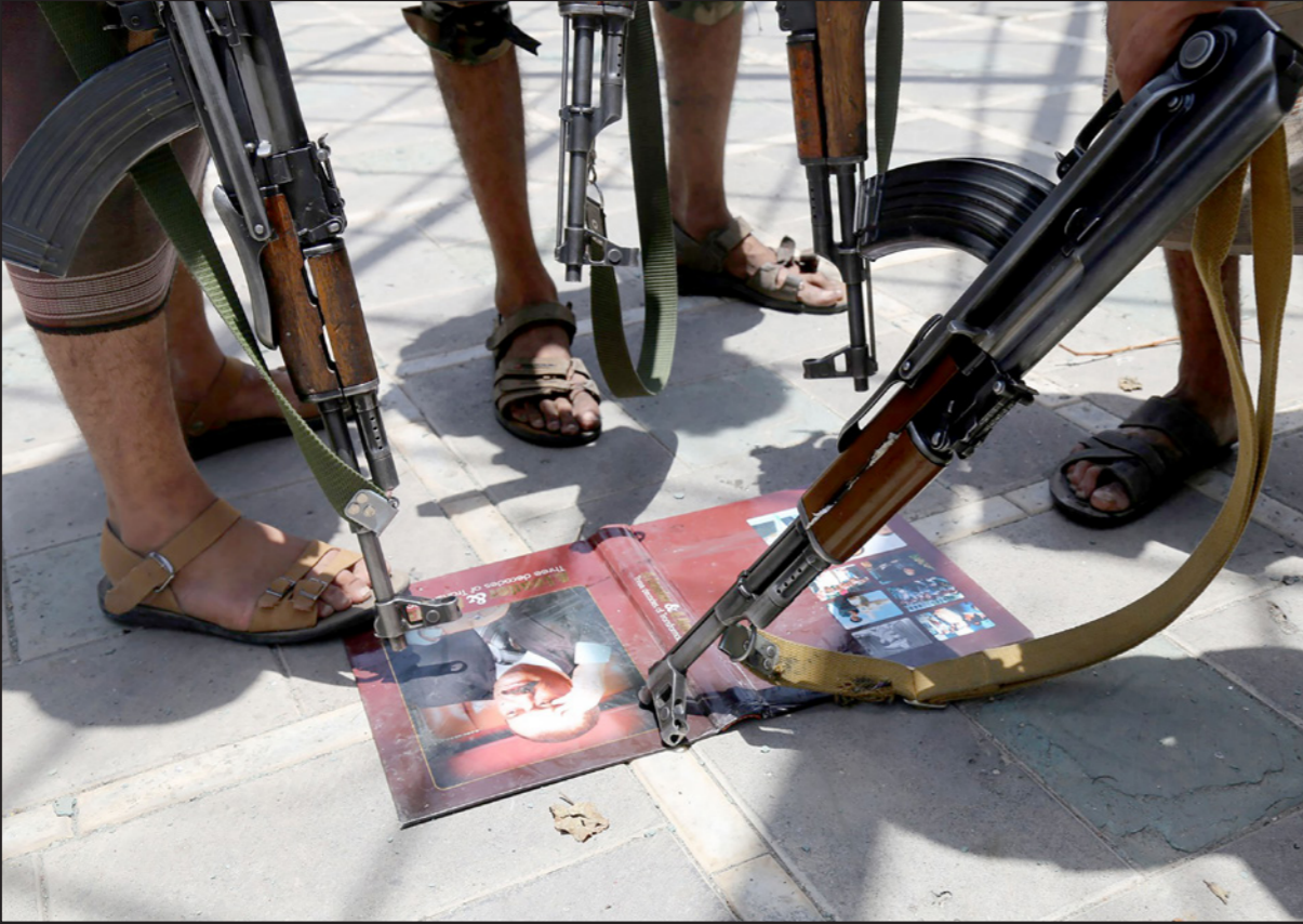
مقاتلون مؤيدون للرئيس اليمني عبدربه منصور هادي يصوبون أسلحتهم على صورة لسلفه في عدن أمس

وأدت الحرب إلى مقتل أكثر من 4500 شخص ووقف الامم المتحدة. احتجاز استمر أشهراً اثر مفاوضات تولتها الحكومة اليمنية. يذكر ان المدرس البريطاني مارك هارفي