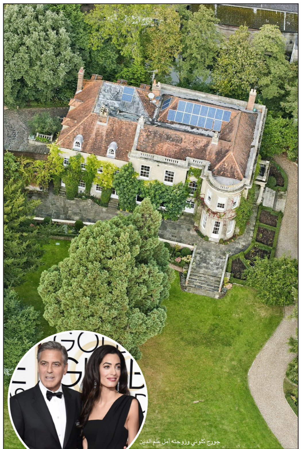
جورج كلوني وزوجته أمل علم الدين

إرحيم، وهي إحدى الصحافيات اللاتي كتبن لـ «القدس العربي»، ما تزال مقيمة في مدينة حلب السورية، وتعمل على تدريب مواطنين صحافيين، في ظروف الحرب القاسية، وقد قامت بتدريب قرابة 100 مراسل صحافي داخل سوريا، لتنتهج تقريبا من النساء، وذلك للعمل في الصحافة المطبوعة والتلفزيونية، كما ساهمت في تأسيس صحف ومجلات داخل سوريا.