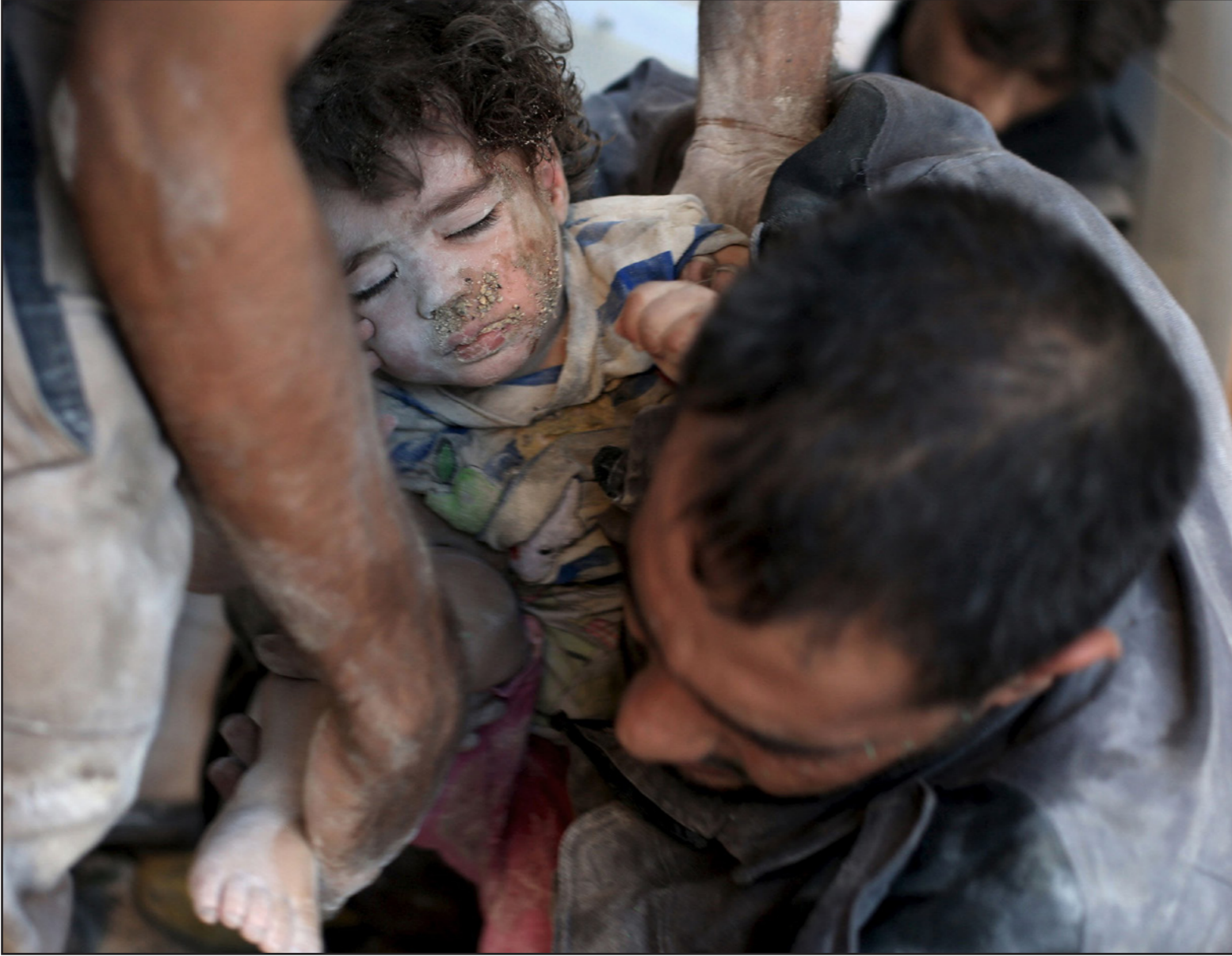
مسجونون ينتشلون طفلة من تحت الأنقاض في مدينة دوما عقب غارات لقوات النظام السوري