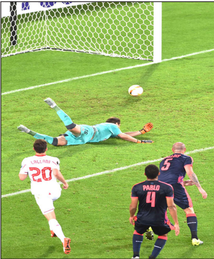
نجم ليفربول لانا (20) يسجل هدف فريقه في مرعى بورو

ليبريتش بهدف، وفي المجموعة السابعة، انتزع دينيرو الأوكراني، وصيف البطل في النسخة الماضية، تعادلا صعبا 1/1 من ضيفه لاتسيو، بينما تعادل سانت آتيان مع روزنيرغ النرويجي 2/2، واقتصر لوكوموتيف موسكو فوزا ثميناً 1/3 من ضيفه لشبونة في المجموعة الثامنة، كما تغلب بشكتاش التركي 1/صفر على ضيفه سكينديريبو اليوناني، وتلقى فيورنتينا خساره موجعة 2/1 أمام ضيفه بازل في المجموعة التاسعة، بينما تعادل ليخ بوژنان البولندي مع