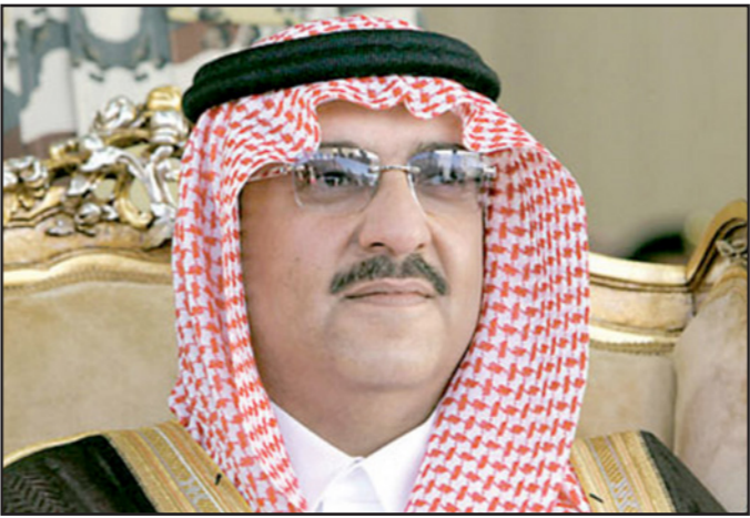
وزير الداخلية السعودي وولي العهد الأمير محمد بن نايف

وصرح وزير الصحة السعودي خالد الفالح الخميس بأنه لم يتم بعد التعرف على هوية تسعة من القتلى ويعتقد أن جثثين لا تزالان تحت الرافعة.