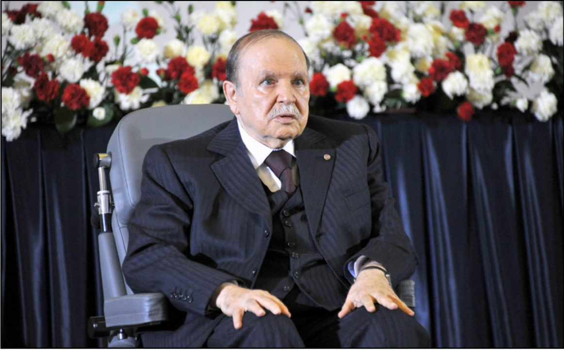
الرئيس الجزائري عبدالعزيز بوتفليقة

المخضرم من حزب «جبهة التحرير الوطني» وينافسهم على النفوذ الختبة من رجال الأعمال وكبار قادة الجيش.