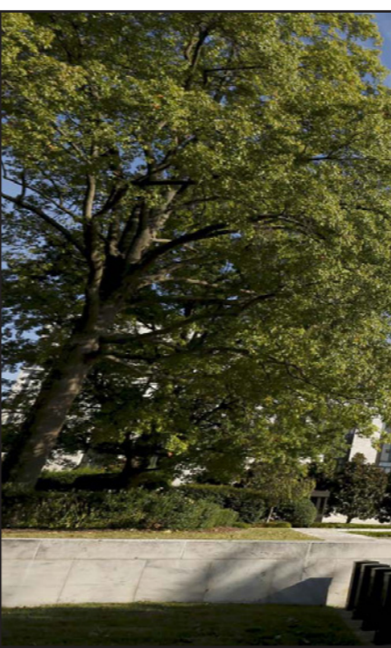
مقر مجلس الاحتياطي الفدرالي

وارتفعت أسعار الفائدة دون تغيير أمس الجمعة إلى 1135.51 دولار للأونصة (الأونصة) الساعة 1158 بتوقيت جرينتش، بعدما لاس في وقت سابق 1138.80 دولار، لينجيه المعدن الأصفر إلى انتهاء موجة خسائر استمرت ثلاثة أسابيع. وأبقى المركزي الأمريكي أسعار الفائدة دون تغيير أمس الأول، فيما يشير إلى المخاوف بشأن الاقتصاد العالمي، وتقلب أسواق المال، وتباطؤ التضخم في الداخل. وترك البنك المركزي الأمريكي الباب مفتوحا أمام احتمال تشديد السياسة بشكل محدود في وقت لاحق هذا العام، إلا أن المزيد من خبراء الاقتصاد باتوا يتساءلون الآن عما إذا كان البنك سيستخدم إجراءات أصلا. وزاد مسؤولون إنдонيسيون المخاوف بشأن الإمدادات، حيث قالوا أمس الجمعة إن تصريح