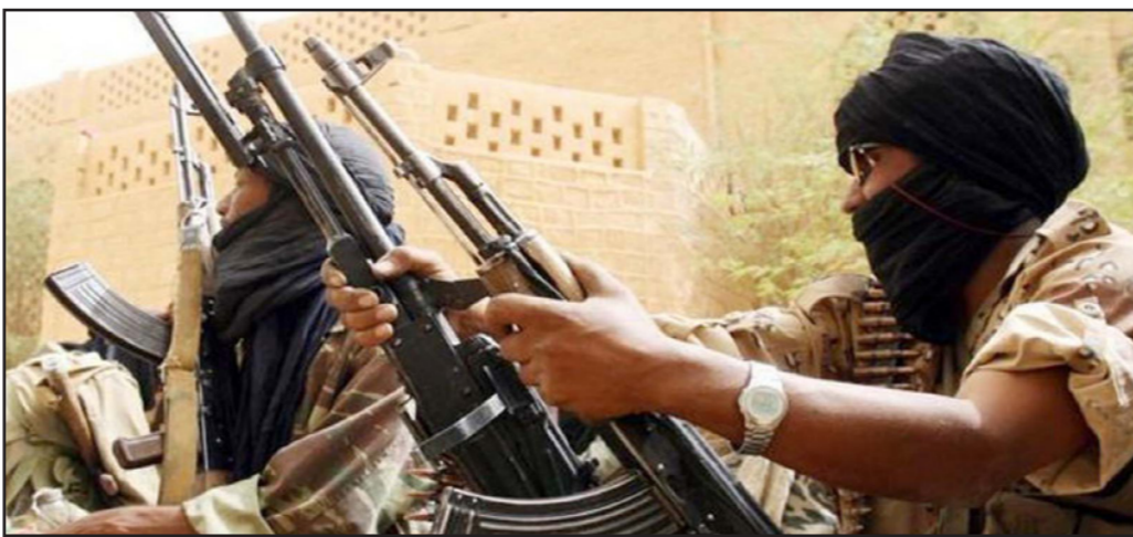
مقاتلون من الطوارق

20 يوما فقط حتى تجددت المعارك في ليبيا، أكدت فرار نحو 11,280 شخصا من الاقتتال في أوباري، أغلبهم من النساء والأطفال وكبار السن. وفي 22 أيلول/سبتمبر من العام نفسه هدات الاشتباكات، بعد توصل الأطراف المتقاتلة إلى اتفاق برعاية قبائل أخرى، أوقف بموجب إطلاق النار بينهما.