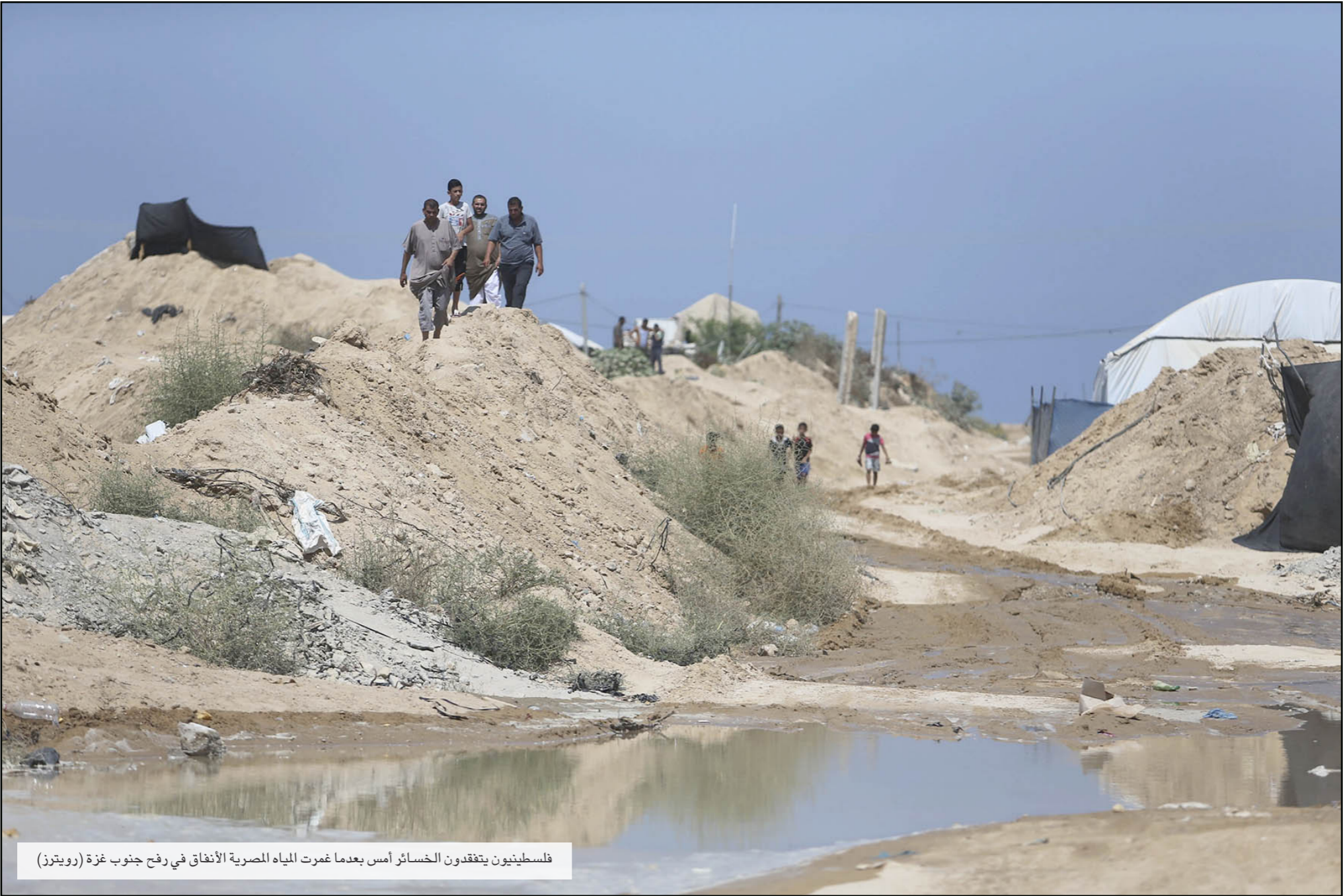
فلسطينيون يتفقدون الخسائر أمس بعدما غمرت المياه المصرية الأنفاق في رفح جنوب غزة (رويترز)

وتمكن مهربيون من إدخال كل المواد التي تمنع إسرائيل إدخالها إلى غزة بموجب الحصار وأهمها المواد الخام ومواد البناء والكثير من الأدوية، ولكن في ظل استعمار مصر في هذا المخطط الأخطر منذ أن بدأت مصر في عمليات وقف التهريب، فإن آمال السكان الفلسطينيين في الحصول على أي من المواد المنوعة من جهة إسرائيل ستكون معدومة في ظل التشديد المصري الجديد.