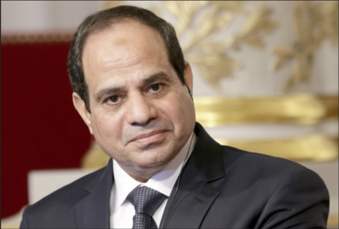
الرئيس المصري عبد الفتاح السيسي

حقيقة، فالمفترض أن مجلس الشعب طرف حقيقي من طراف الجمهورية من في مصر، طبقا لما منحه له دستور 2014 من صلاحيات.