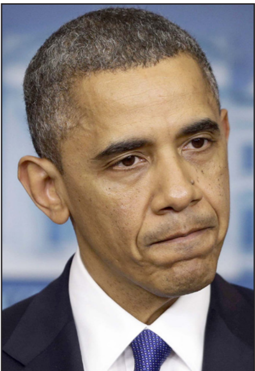
الرئيس الأمريكي باراك أوباما

آلاف يهدف تدمير داعش؟ لأنني أرى بأنه إن لم نقم بذلك فسوف نهزم».