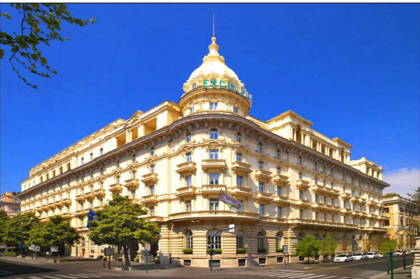
فندق «ويستن إكسلسيور» في روما

وكانت مسودة الموازنة العراقية لعام 2016 قد نشرت على الموقع الإلكتروني. وتقدر الوزارة موازنة حجمها 113.5 تريليون دينار عراقي (99.65 مليار دولار) مع عجز