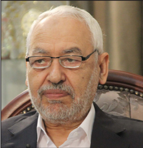
الشيخ راشد الغنوشي

وتابع الغنوشي «هذه السياسية التي هي عزل من منطلقات أيديولوجية تقدم بالنتيجة خدمة للإرهاب، والإرهاب يريد القول: انظروا هناك عودة لأئمة العهد الماضي وعزل لكل الأئمة الذين آتت بهم الثورة، إذا هذه الحكومة لا تلتزم بالدين بل تحاربه وهذا هو خطاب الإرهاب،