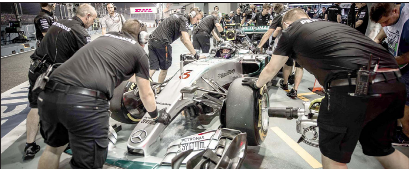
الألماني روزبيرغ يخضع للمصانة خلال فترة التجارب الحرة الأولى

■ الدوحة - د ب أ: قلب الريان تأخره بهدف إلى فوز ثمين 1/2 على الخريطات في المرحلة الثانية من دوري نجوم قطر والتي شهدت أيضا فوزا ثمينا للفرقة 1/صفر على سيمير. ووجه الريان (الريحي) إنذارا جديدا لباني الفرق بعدما حقق انتصاره الثاني على التوالي وأكاد عودته القوية لدوري النجوم حيث رفع وصيده إلى ست نقاط لينفرد بالصدارة فيما تجدد رصيد الخريطات عند ثلاث نقاط. وانتهى الشوط الأول بالتعادل السلبي ثم باغت الخريطات الريان بهدف مبكر في الشوط الثاني سجله جباله السري في الدقيقة 47 ولكن الريان رد بقوة وسجل هدفين عن طريق ناتان أوتافيو والباراغواني فيكتور كاسيريس في الدقيقة 68 و 63 على الترتيب.