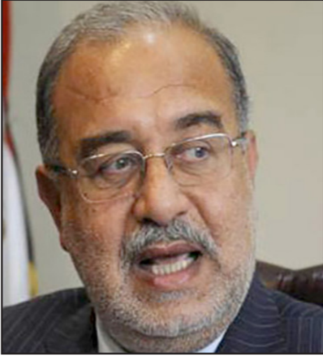
المهندس شريف إسماعيل

وأشار إلى أن مصير القوائم يتوقف على نسبتها قس البرلمان فإذا كانت الأكثرية من المعارضة لن تؤيد سياسات الحكومة وإن كانت من أنصار النظام سيكون التوافق أكبر مشيرا لعدم وجود أحزاب فاعلة رغم أن عددهم وصل 126 حزبا ويرى أن عدد الأعضاء بأي حزب من المفترض ألا يقل عن 300 ألف موزعين بين الشمال