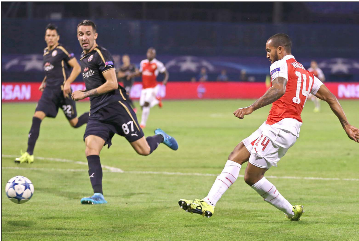
والكوت الذي سجل هدف ارسنال الوحيد في اوووبا يأمل بان يكون أساسيا أمام تشلسي اليوم

وتوتهنام مع كريستال بالاس وليفربول مع نوريتش وسوانزي مع إيفرتون وأستون فيلا مع ويست بروميتش البيون.