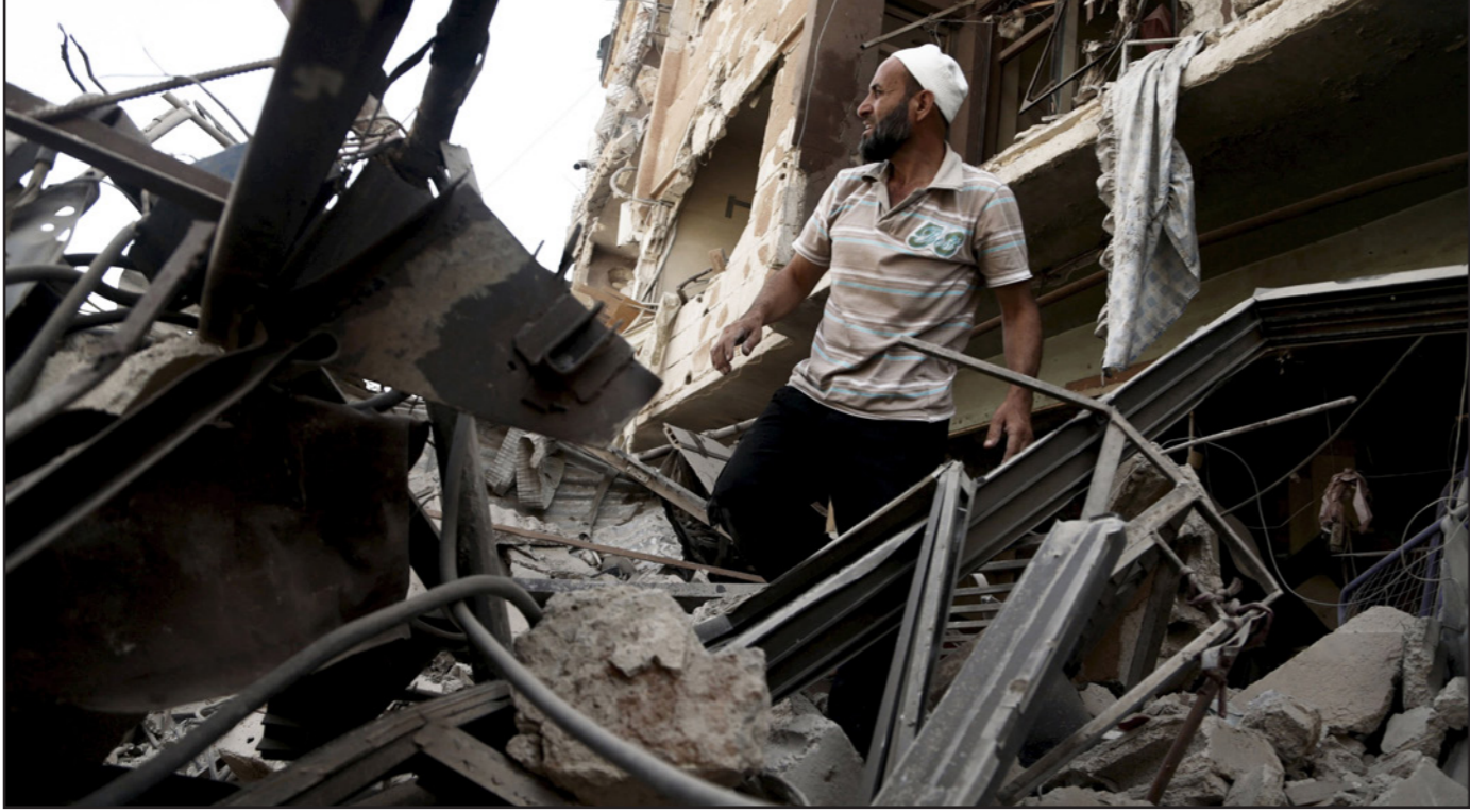
رجل يتفقد الأضرار التي ألحقت بمنزله عقب غارات النظام على بلدة دوما، شرق الغوطة

والصواريخ الغراغية، وبالرغم من كل هذا القصف يمكن الثوار دائما من تنفيذ هجمات مباغطة تكبد الحزب والنظام خسائر فادحة في الأرواح والعتاد.