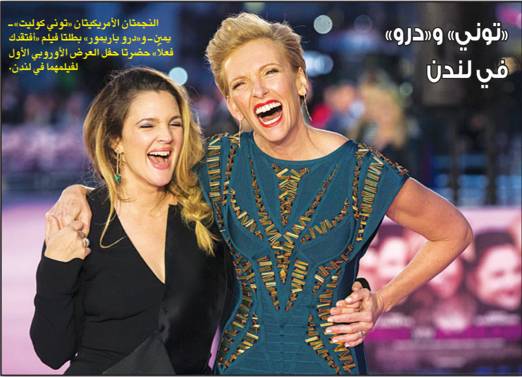
«توني» و«درو» النجمتان الأمريكيتان «توني كوليت» - بين- و«درو باريمور» بطلتا فيلم «أفتدك فعلا» حضرتا حفل العرض الأوروبي الأول لفيلمهما في لندن.

■ سيدني- د ب أ: حصل عالم استرالي على جائزة «إيج نوبل» للعلوم بعدما توصل إلى اختراع لإعادة البیضة نینة بعد سلقها. وابتكر عالم الكیمياء كولن راستون وفريقه من جامعة فلینڈرز في مدينة أدیلاید الاسترالية اختراعا يطلق عليه اسم «جهاز الإسالة عن طريق الدوران» ويستطيع تفكيك البروتينات التي تكسب البیضة صلابة بعد سلقها. وتعتمد فكرة الجهاز على استخدام الطاقة الميكانيكية عن طريق الدوران لتغيير تأثير الطاقة الحرارية التي تتعرض لها البیضة عند سلقها. وتؤدي الحرارة إلى اندماج البروتينات الطويلة داخل زلال