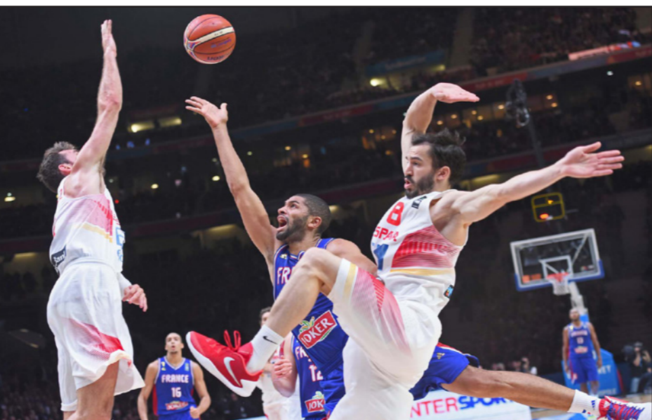
صراع على الكرة بين الأسبان والفرنسين خلال اللقاء المشير بينهما

■ سنغافورة - د ب أ: تفوق الألماني نيكو روزبيرغ على البريطاني لويس هاميلتون زميله بفريق مرسيدس ليسجل أسرع زمن في التجربة الحرة الأولى لسباق الجائزة الكبرى بستغافورة والذي يفاز غدا الأحد ضمن منافسات بطولة العالم لسباقات فورمولا-1. وحقق روزبيرغ أسرع زمن للفة على مضمار «مارينا باي» البالغ طوله 5073 مترا مسجلا دقيقة واحدة و47.995 ثانية، الأحد، ويتصدر هاميلتون الترتيب العام للفة السائقين