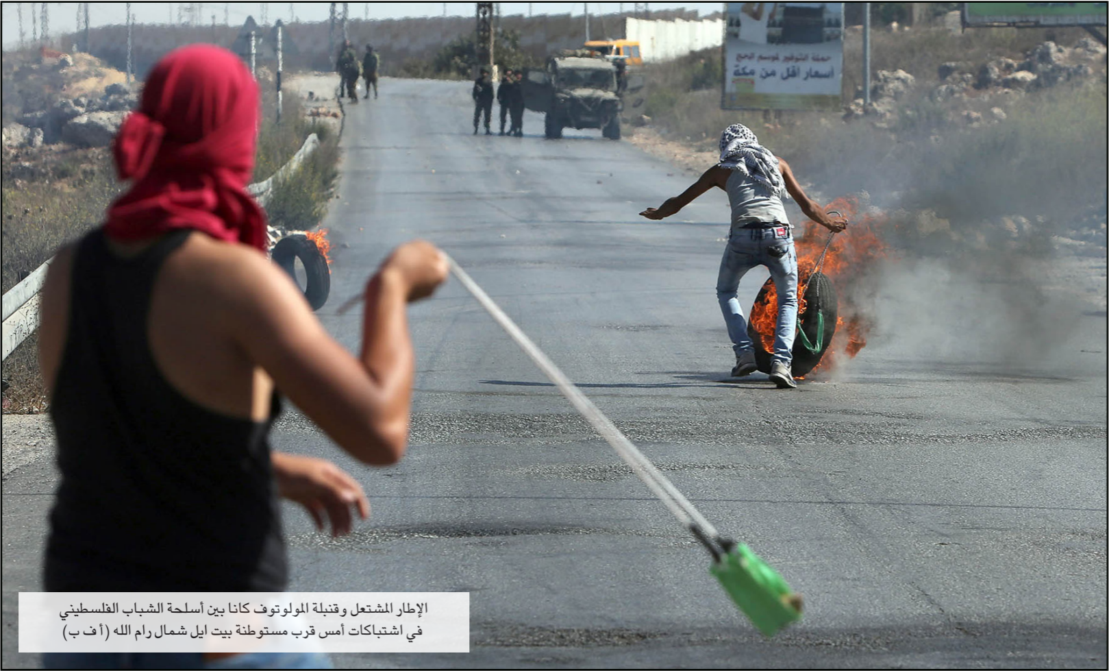
الإطار المشتعل وقنبلة المولوتوف كانا بين أسلحة الشباب الفلسطيني في اشتباكات أمس قرب مستوطنة بيت ايل شمال رام الله