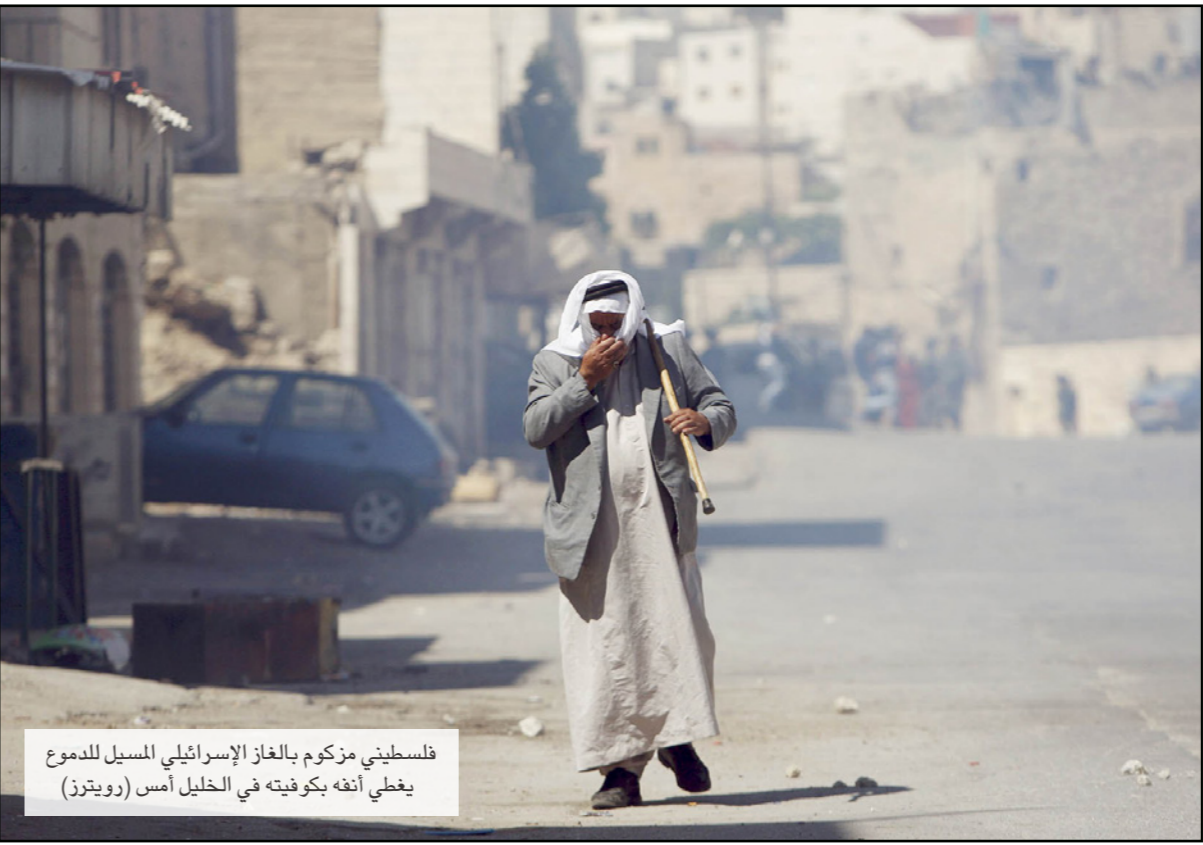
فلسطيني مزكوم بالغاز الإسرائيلي المسيل للدموع يغطي أنفه بكوفيته في الخليل أمس