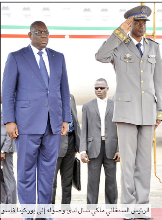
الرئيس السنغالي ماكي سال لدى وصوله إلى بوركينا فاسو

وفيما يتعلق ببعض تقارير صحافية حول زيارة جديدة لقاسم سليماني إلى روسيا، نفى