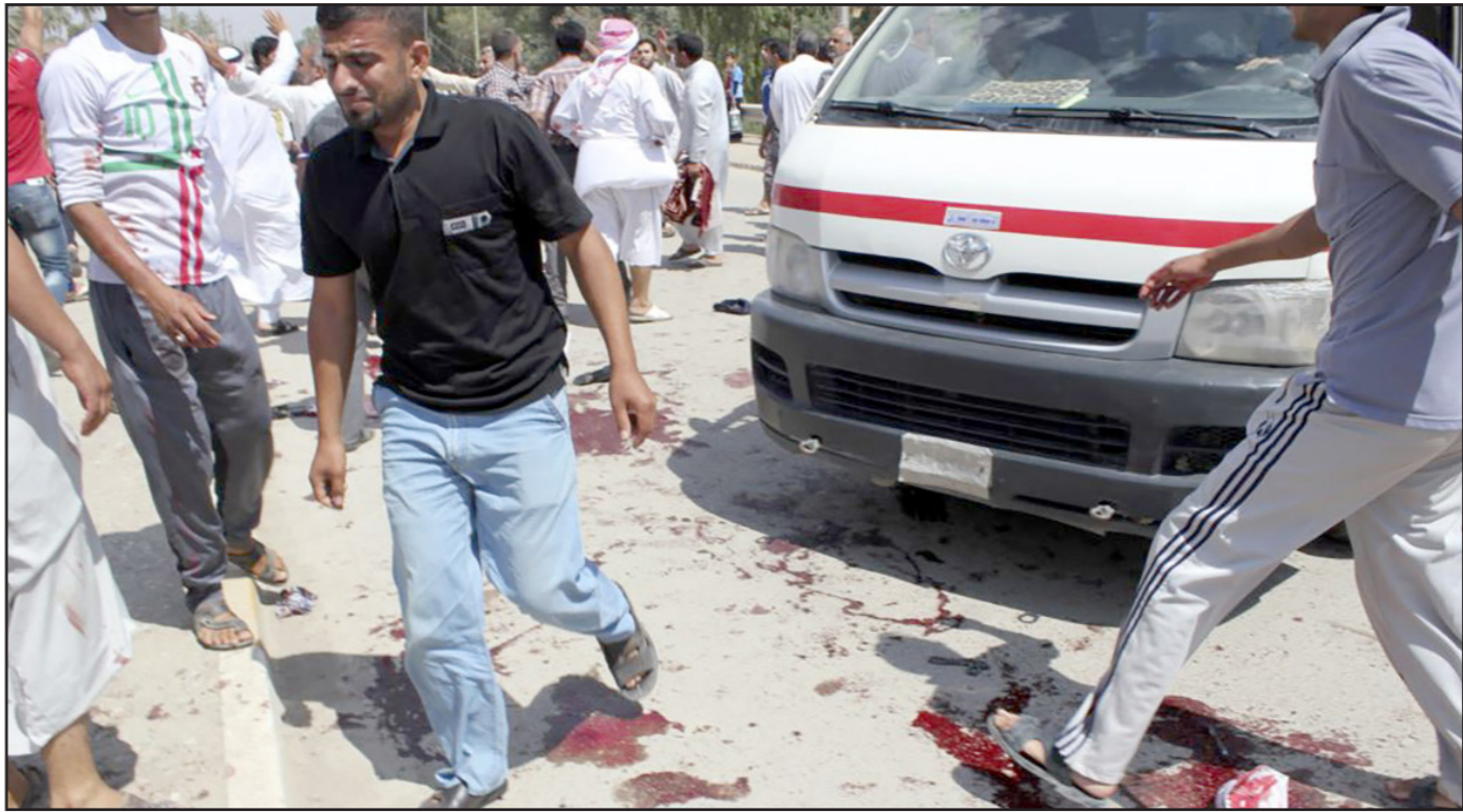
جانب من الانفجارات في بعقوبة

داعيا الدولة «إلى تخفيف الثقل والتوجه لفتح قنوات القطاع الخاص والاهتمام به وتسهيل قوانينه وإعادة النظر بقوانين أخرى تقف حائلا أمام تنشيطه».