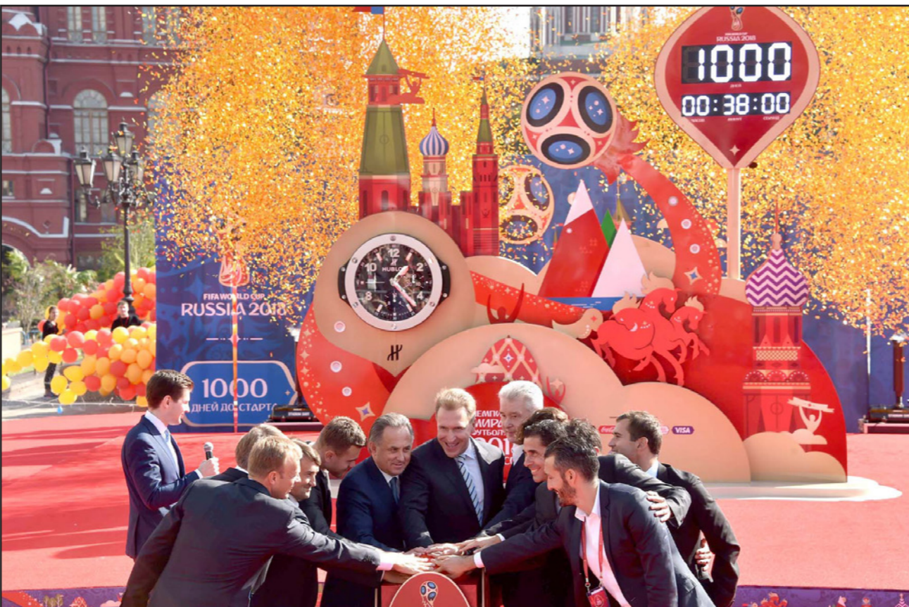
وزير الرياضة الروسي سوبيانين يتوسط رموز كرة القدم في حفلة العد التنازلي لمونديال 2018 وسط موسكو