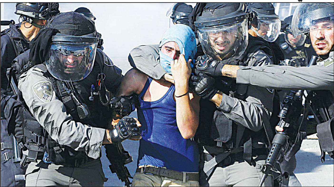
عناصر من حرس الحدود الإسرائيلي يمسكون بشاب فلسطيني أثناء احتجاجات في مخيم شغاف للاجئين قرب القدس أمس