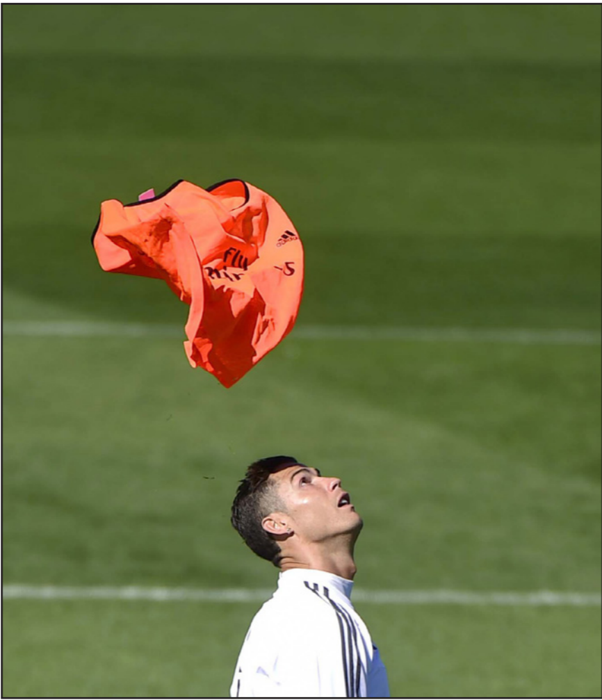
رونالدو تملأه الثقة خلال الحصة التدريبية الأخيرة للريال

خطيرة في الركبة اليمنى خلال المباراة أمام روما. كذلك يغيب عن الفريق الحارس كلاوديو برافو وداني الفيش ودوغلاس، ولا يزال يتبقى أمام جيرارد بيكيه مباراة واحدة كي ينهي عقوبة الإيقاف التي فرضت عليه لأربع مباريات. وعادة ما يتلقى ليفانتي هزائم ثقيلة على ملعب «كامب نو» معقل برشلونة، لكن المدافع المخضرم خوانفران غارسيا يأمل في تغادي مثل تلك الهزائم في مباراة الأحد. أما ريال مدريد الذي يحتل المركز الثاني بفارق نقطتين خلف برشلونة وبفارق الأهداف فقط أمام سيلتا فيغو وفاريال وإيبار، فيخوض مباراته بالمرحلة الرابعة اليوم حيث يستضيف غرناطة المتواضع على ملعب «سانتياغو برنابيو». ويعيش ريال مدريد أجواء رائعة خاصة بعد الأهداف الثمانية التي سجلها النجم البرتغالي كريستيانو رونالدو في المباراتين الأخيرتين أمام إسبانيول وشاختر دونييتسك، وأشاد رافايل بينيتز مدرب الريال برونالدو بعد ثلاثيته في شبك شاختر بدوري الأبطال، قائلا: «إنه يقدم