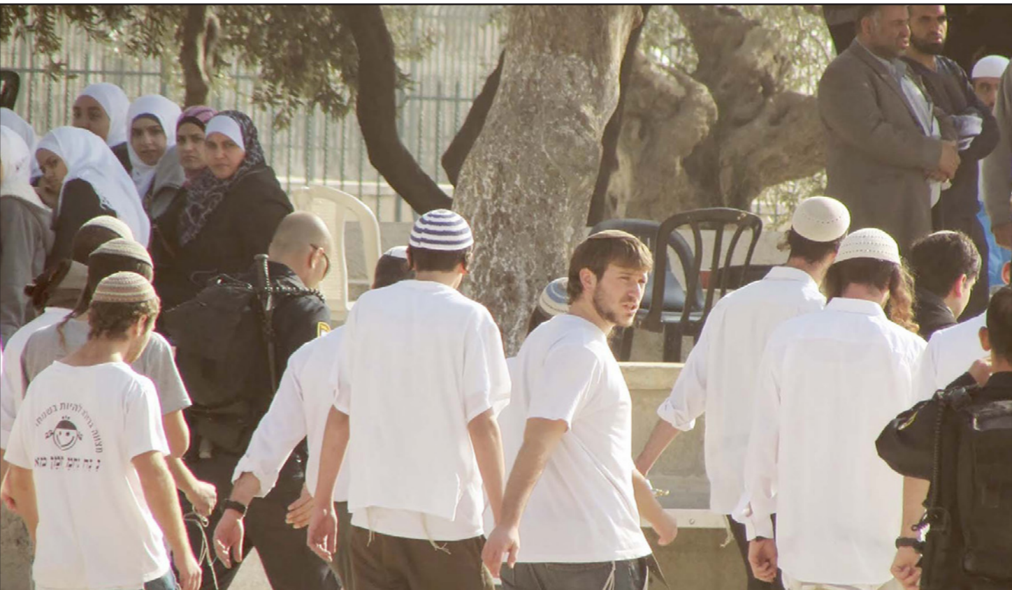
متطرفون يهود يقتحمون الأقصى

«الوضع القائم ينتصر عليه القطار»، قال، ما الذى يجب أن يفعله نتنتياهو؟ سألت. «يجب عليه أن يقف ويعلم: الوضع القائم منذ 1967 لن يتغير. هكذا كان وهكذا سيكون، ومن سيحاول الحاق الضرر به يستيضر».