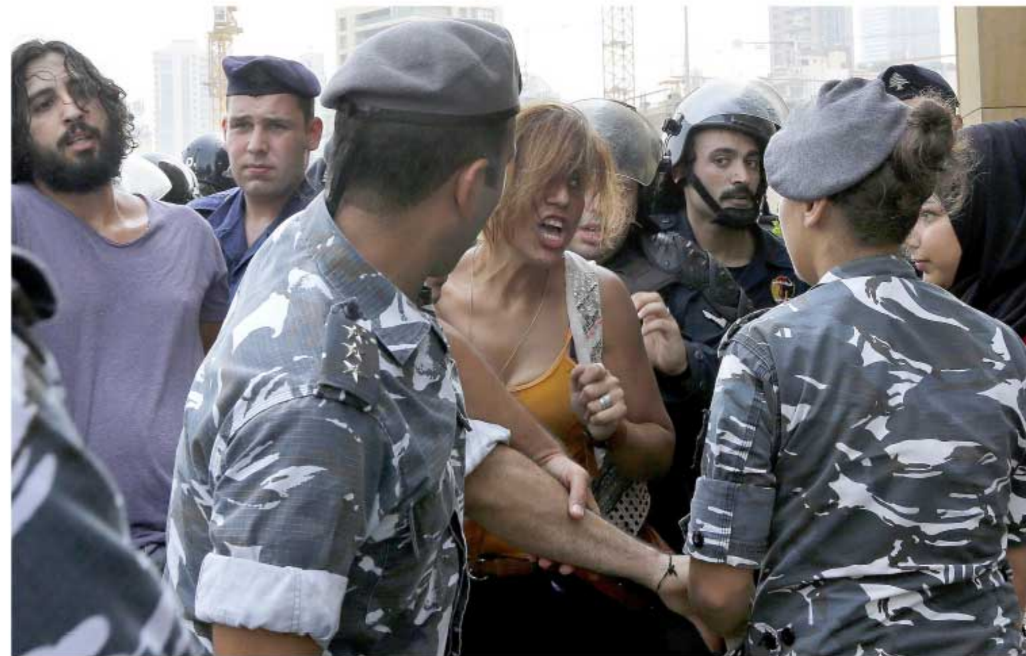
بيروت - «القدس العربي»: ناديا الياس

قبل موعد لتظاهرة بـ 3 أيام على الأقل، ووفقاً للقرار نفسه فإنّ «العلم» يختلف من لترخيص، وهو مجرد بلاغ عن وجود قرار بالتظاهر، خلافاً للترخيص الذي يفترض إنتظاره بالقبول أو الرفض من قبل الجهة المختصة. ويفترض بالعلم أن يتضمّن «سبب الدعوة إلى التظاهر، إسم وصفة الجهة الداعية لها والشعارات الأساسية التي ستطلق، أسماء للمتظاهرين، وهم بالضرورة لبنانيون لا يقل عددهم عن 3 مع تحديد مكان إقامتهم، وعدد المشاركين التفرّيتي، مكان وساعة الإنطلاق ومكان التفرّق، خط سير التظاهر للفرج، كما يتضمّن «العلم» أيضاً تفهّداً بالسلوكية الكاملة عن أيّ ضرر قد تسببه التظاهرة للأشخاص والممتلكات الخاصة والعامة موقفاً من مقدمي الطلب.