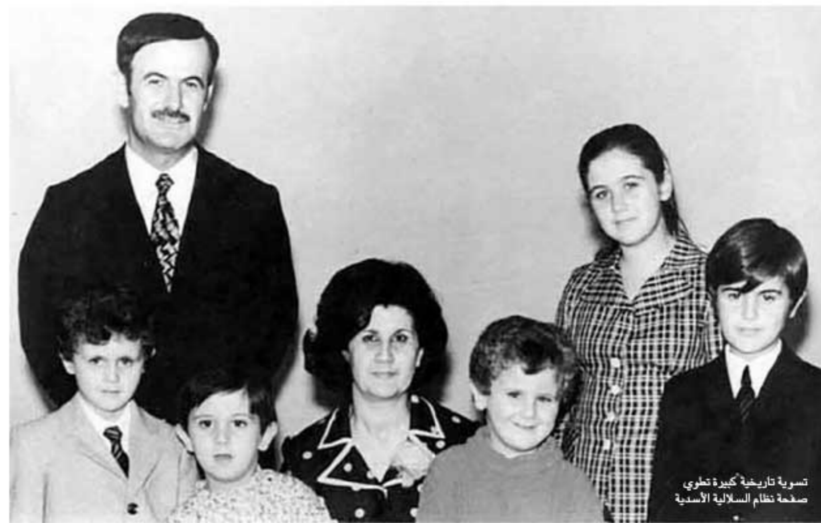
تسوية تاريخية كبيرة تطوي صفحة نظام السلالية الأسيدي

اتسم التعاطي الغربي مع الصراع السوري منذ وقت مبكر بمجموعة من الخصائص التي تثير التساؤل عن الكفاءة السياسية والفكرية للنخب والقادة السياسيين في الغرب. من أول هذه الخصائص التعامل مع النتائج، وليس مع الجذور والأسباب وتالياً قُصر النظر السياسي على شريحة رفيقة من الحاضر، ليس دون عمق تاريخي، بل ودون حتى إحاطة بلوحة الصراع الجاري ودينامياته. والخاصية الثانية هي افتقار سياسات القوى الغربية إلى جدر قيمي واضح، يتصل بفضايا العدالة والحرية والكرامة الإنسانية، وغالباً أيضاً الافتقار إلى رؤية سياسية حول الصراع، والافتقار على المنهج «إدارة الأزمة» التي يهمل البعد الأخلاقي ويتعامل مع آخر المستجدات، ويؤول على المدى الأجل إلى جعل المشكلات الواضحة مشكلة تعقيداً، وثالث الخصائص لنظرة التجزيئية التي تقطع الصراع إلى أجزاء مفصولة عن بعضها، وتعامل مع بعضها دون بعضها الآخر، وهو يؤول بدوره إلى أوضاع شديدة صعوبة من قبل، وتتصل بالخاصية السابعة، تجزؤ النظر، خاصة رابعة تحل إلى الافتقار إلى منظور عالمي في التعامل مع مشكلات هي عالمية أصلاً في جانب منها، وإزادات عالية خلال أربع سنوات ونصف من الصراع. والشال البارز على قصر التعامل على النتائج هو سياسات الأوروبيين الأمنية حيال اللاجئين السوريين حيث تعتبر مشكلات إنسانية مفصولة عن جذرها السياسي، أما المثال الأبرز على