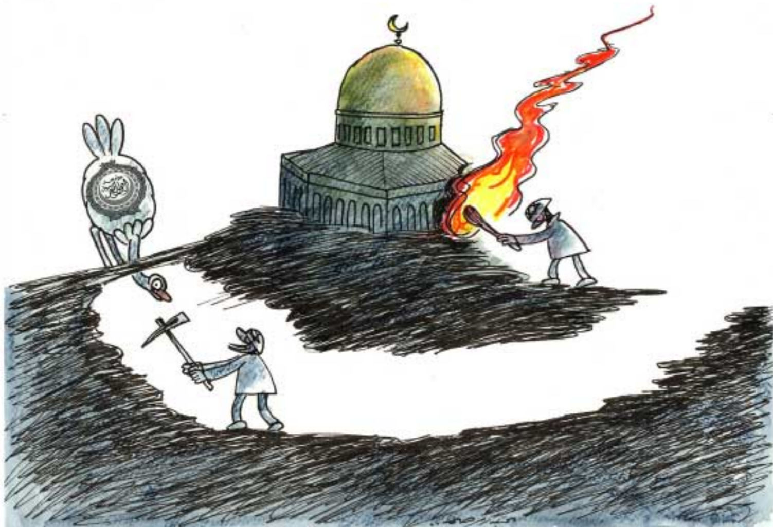
كاريكاتير: عبد الإرحيم ياسر