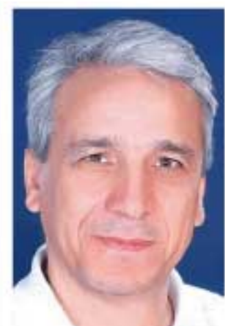
ياسين الحاج صالح

اتسم التعاطي الغربي مع الصراع السوري منذ وقت مبكر بمجموعة من الخصائص التي تثير التساؤل عن الكفاءة السياسية والفكرية للنخب والقادة السياسيين في الغرب. من أول هذه الخصائص التعامل مع النتائج، وليس مع الجذور والأسباب وتالياً قُصر النظر السياسي على شريحة رفيقة من الحاضر، ليس دون عمق تاريخي، بل ودون حتى إحاطة بلوحة الصراع الجاري ودينامياته. والخاصية الثانية هي افتقار سياسات القوى الغربية إلى جدر قيمي واضح، يتصل بفضايا العدالة والحرية والكرامة الإنسانية، وغالباً أيضاً الافتقار إلى رؤية سياسية حول الصراع، والافتقار على المنهج «إدارة الأزمة» التي يهمل البعد الأخلاقي ويتعامل مع آخر المستجدات، ويؤول على المدى الأجل إلى جعل المشكلات الواضحة مشكلة تعقيداً، وثالث الخصائص لنظرة التجزيئية التي تقطع الصراع إلى أجزاء مفصولة عن بعضها، وتعامل مع بعضها دون بعضها الآخر، وهو يؤول بدوره إلى أوضاع شديدة صعوبة من قبل، وتتصل بالخاصية السابعة، تجزؤ النظر، خاصة رابعة تحل إلى الافتقار إلى منظور عالمي في التعامل مع مشكلات هي عالمية أصلاً في جانب منها، وإزادات عالية خلال أربع سنوات ونصف من الصراع. والشال البارز على قصر التعامل على النتائج هو سياسات الأوروبيين الأمنية حيال اللاجئين السوريين حيث تعتبر مشكلات إنسانية مفصولة عن جذرها السياسي، أما المثال الأبرز على