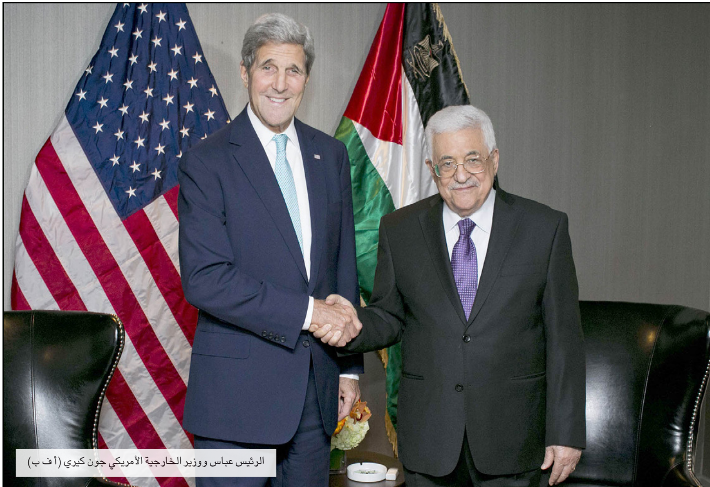
الرئيس عباس ووزير الخارجية الأمريكي جون كيري

يشار إلى أنه ستسقى خطاب أبو مازن في الأمم المتحدة مراسم رسمية أمام مقر الجمعية العامة سيتم خلالها رفع العلم الفلسطيني لأول مرة في تاريخ الأمم المتحدة. وقال ديوان رئيس الحكومة الإسرائيلية إن نتنياهو «سيجادل التعبير أمام المجتمع الدولي عن مشاعر المواطنين الإسرائيليين بعد توقيع الاتفاق النووي وتوقعات إسرائيل من المجتمع الدولي». كما سيتطرق خطاب نتنياهو إلى العملية السلمية مع الفلسطينيين وسيتطلب بوقف التحريض الفلسطيني في موضوع الحرم القدسي.