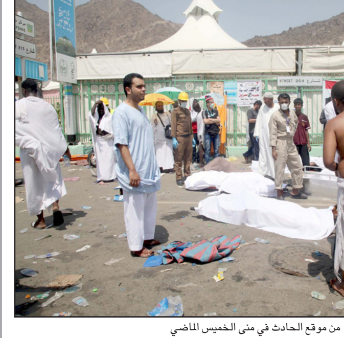
من موقع الحادث في منى الخميس الماضي

القاهرة - الأناضول: قال سفير الاتحاد الأوروبي لدى مصر، جيمس موران، إن 60% من المهاجرين المصريين إلى إيطاليا «أطفال وقصر». وافتتح السفير جيمس موران بالقاهرة امس الثلاثاء ورشة عمل حول الإطار القانوني الدولي لهجرة الأطفال بدون تويهم تحت رعاية الاتحاد الأوروبي. وقال إن هناك 500 ألف شخص وصلوا إلى أوروبا خلال الفترة الأخيرة وهي أكبر أزمة لاجئين منذ الحرب العالمية الثانية، مضيفا أن أكثر من 60% من المهاجرين المصريين إلى إيطاليا من الأطفال.