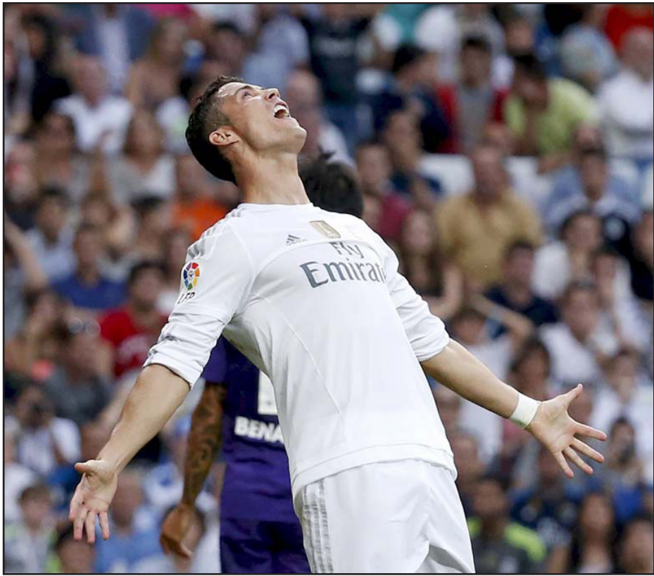
رونالدو يعرب عن خيبة عقب اخفاق جديد في التسجيل

مدرّب - د ب أ: كشفت تقارير صحفية أسبانية أن النجم البرتغالي كريستيانو رونالدو يمر بفترة عقم تهديفي جديدة بعد تفاول الجميع في بداية الموسم الحالي.