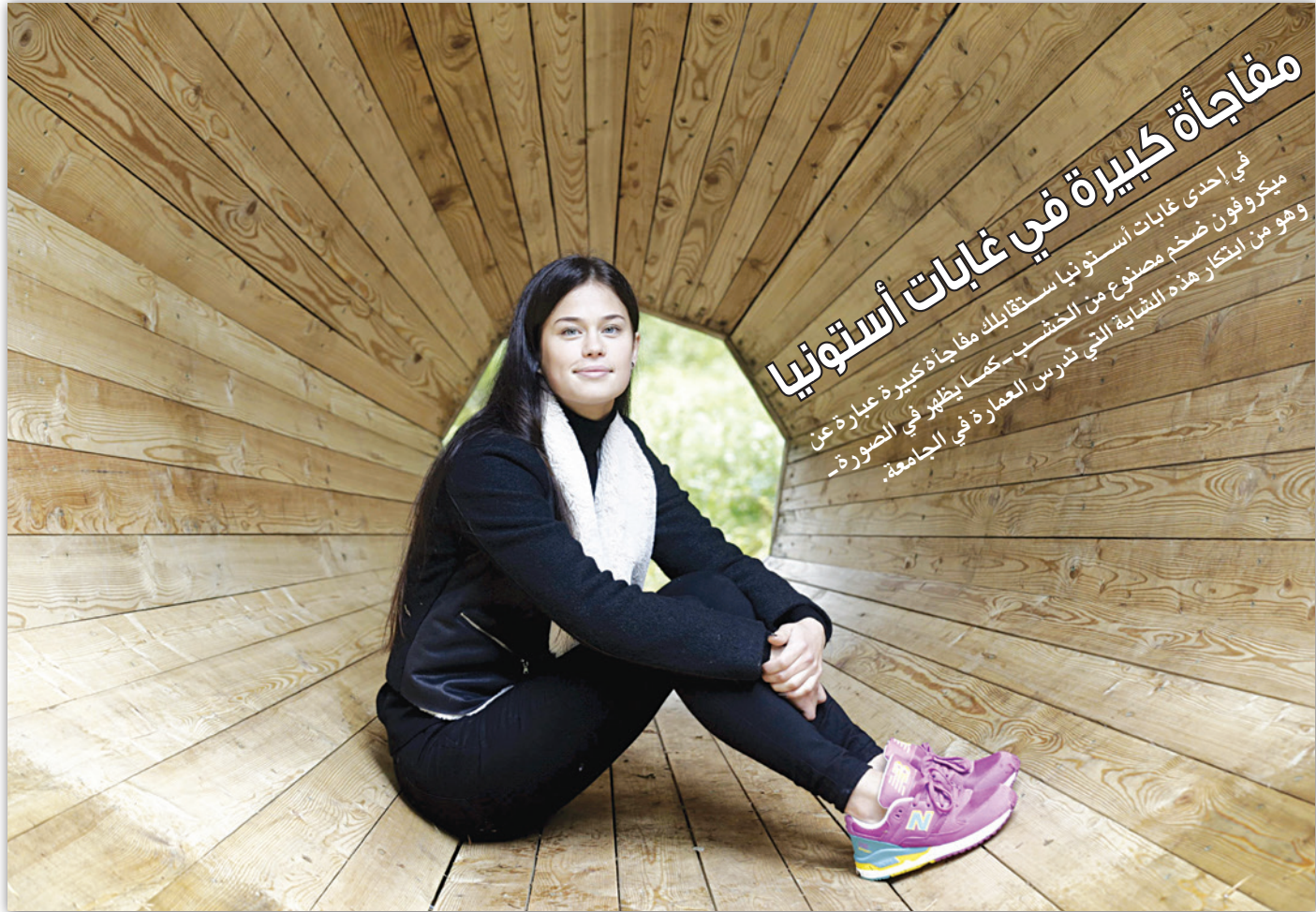
مفاجأة كبيرة في غابات أستراليا في إحدى غابات أستراليا، مكافأة كبيرة على عملها، وهو من ابتكار هذه التقنية التي تزرع العماردة في الجامعة.

وأوضح في بيان صادر عن الجامعة «إن أعشاب البحر تخزن احتياجات ضخمة من الكربون داخل الرواسب التي تنمو وسطها، وعند استهلاك مزيد من أعشاب البحر يتم إطلاق الكربون المخزون، بحيث يمكن أن ينبعث إلى الغلاف الجوي المحيط بالأرض مما يسهم في تسارع معدلات التغيير المناخي».