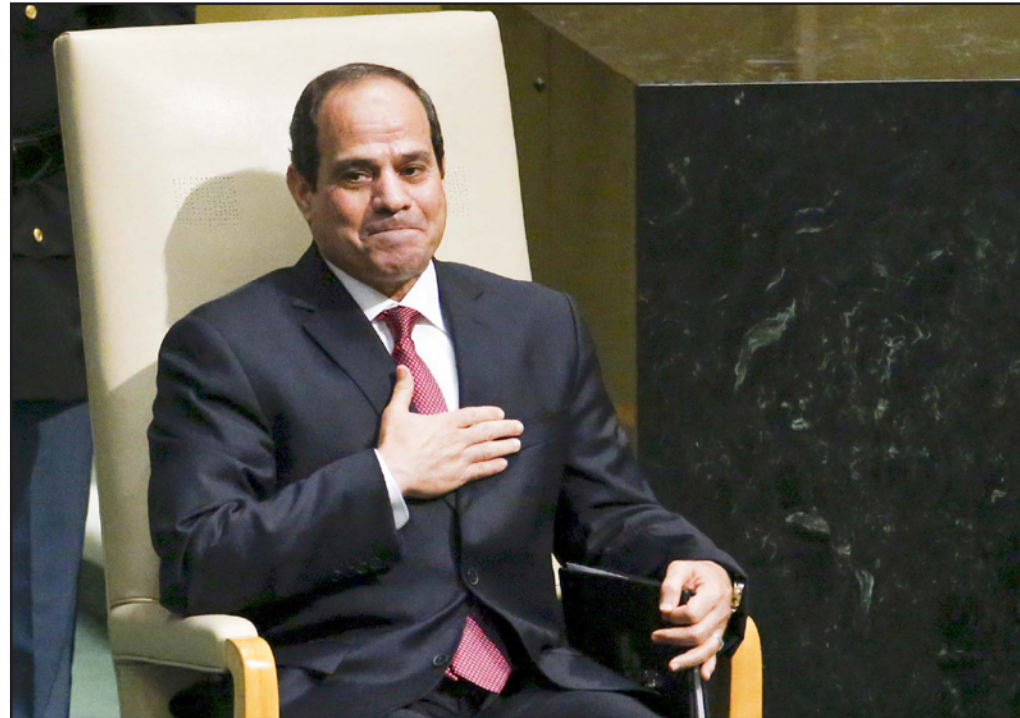
الرئيس المصري عبد الفتاح السيسي في الأمم المتحدة

التطرف - لا شك في أن أكثر من مليار ونصف المليار مسلم يرفضون أن يخضعوا لخطر تلك القلة القليلة التي تدعي أنها تحترق التحدث باسمهم، بل تسعى من خلال تطرفها وعنفها إلى إقصاء وإسكات من يعارضها.. وهو ما ينبغي أن يدركه العالم.. لكنني أشعر بأسى وحرز كل مسلم حول العالم عندما يواجه التمييز والأحكام المسبقة لجرد اتهامه لهذا الدين العظيم.. وهو الأمر الذي تعتبره قوى التطرف نجاسة غير مسبوقة لهذا إذ أن من بين