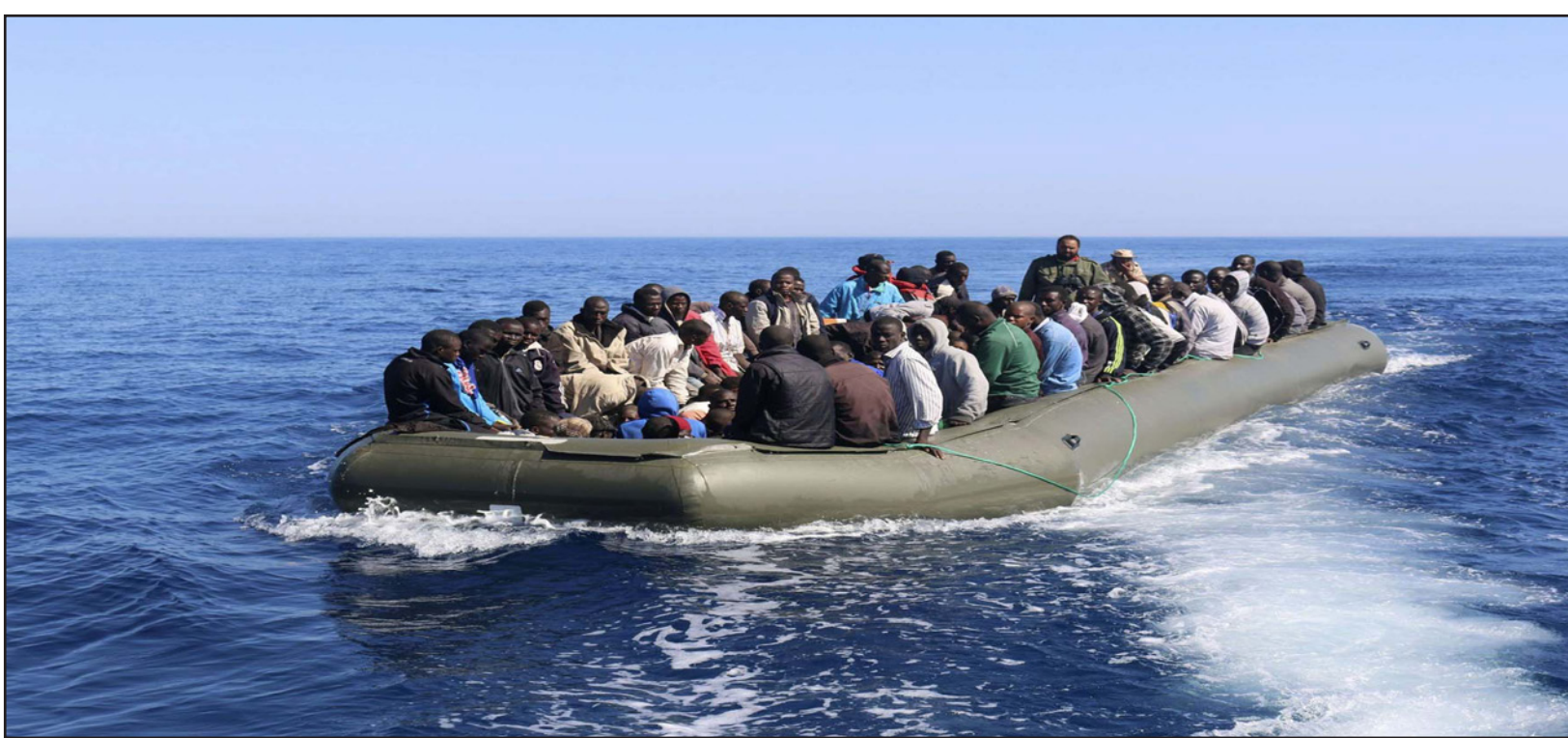
مهاجرون غير شرعيين في المتوسط

بروكسل - روما - وكالات: أطلق الاتحاد الأوروبي الاثنين اسم «صوفيا» على عملية البحرية لمكافحة شبكات مهربي اللاجئين في البحر المتوسط، وهو اسم فُتاة أُنصرت النور بعد إنقاذ مهاجرين على مركب كان يواجه صعوبات، كما أعلن مصدر رسمي.