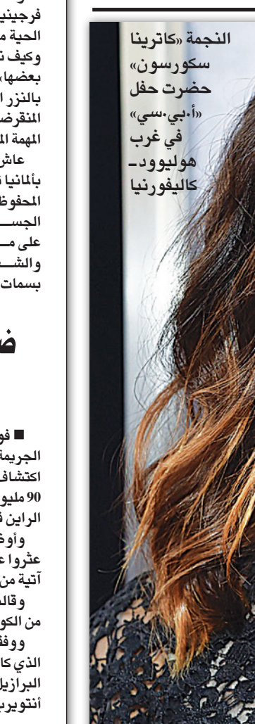
النجمة «كاترينا سكورسون» حضرت حفل «أ.بي.سي» في غرب هوليفورد - كاليفورنيا

■ برلين - د ب أ: تتناول السيدات أدوية موصوفة طبياً أكثر من الرجال، بما في ذلك أقراص تحديد النسل أو علاج حمول الغدة الدرقية أو الوقاية من هشاشة العظام بعد انقطاع الطمث، لكن عندما يتعلق الأمر بالتجارب على أدوية جديدة، فينضم الرجال العينة التي يتم اختيارها لإجراء تلك التجارب.