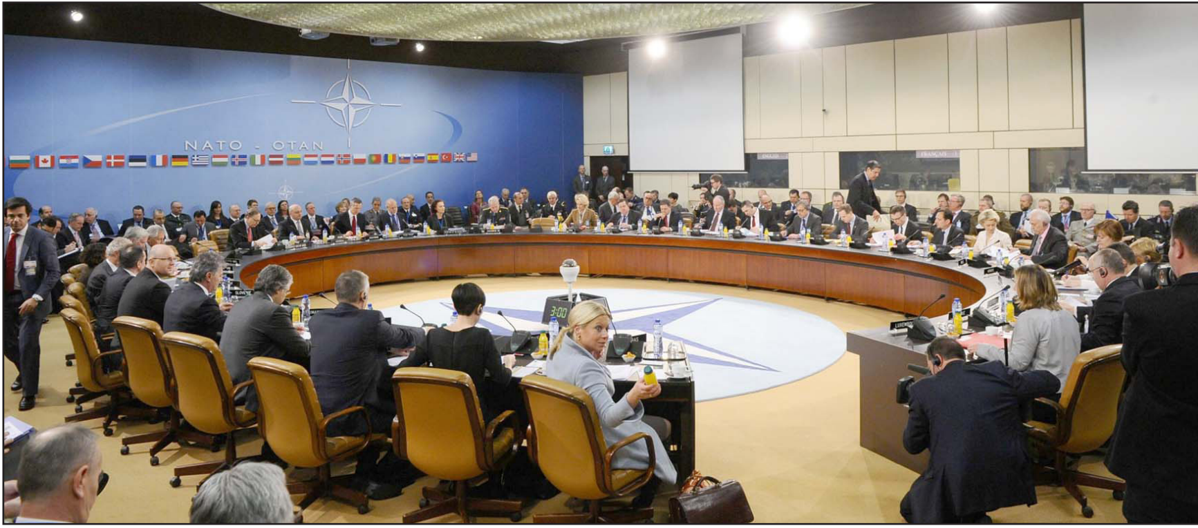
جانب من اجتماع سابق لقادة الناتو