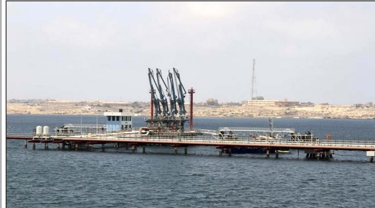
رصيد تصدير النفط في ميناء الحريقة الليبي

بغرض عمل. وذكر المسؤول أن ميناء الزويتينة الليبي يعمل أيضا كالمعتاد، بعد استئناف الإنتاج في الحقول المتصلة به. ويعمل الميناءان البريقة والحريقة أيضا بصورة طبيعية.