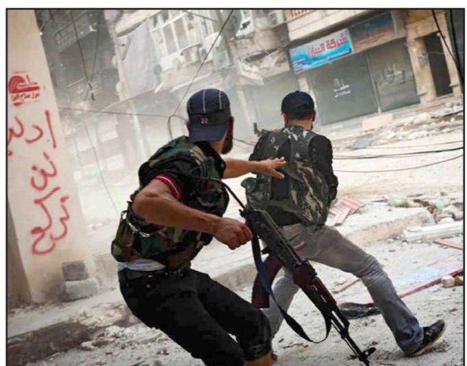
جانب من المواجهات اليومية في المعارك في سوريا

في تحقيق هدفين: اسقاط الاسد وتدمير سوريا تصيق، هذا لا يعني أن الجيش الاسرائيلي لن يرد بعد اليوم على النار من هناك او حتى على النار بالخطأ. مثلما كان في بداية الاسبوع – ولكن الاصعب على الزناد سيكون أكثر حذرا بكثير، ولا بد أن اسرائيل ستفكر جيدا جيدا قبل أن تقر إطلاق طائرات سلاح الجو إلى سماء غصص اقليمية ويضعف إيران وحزب الله.