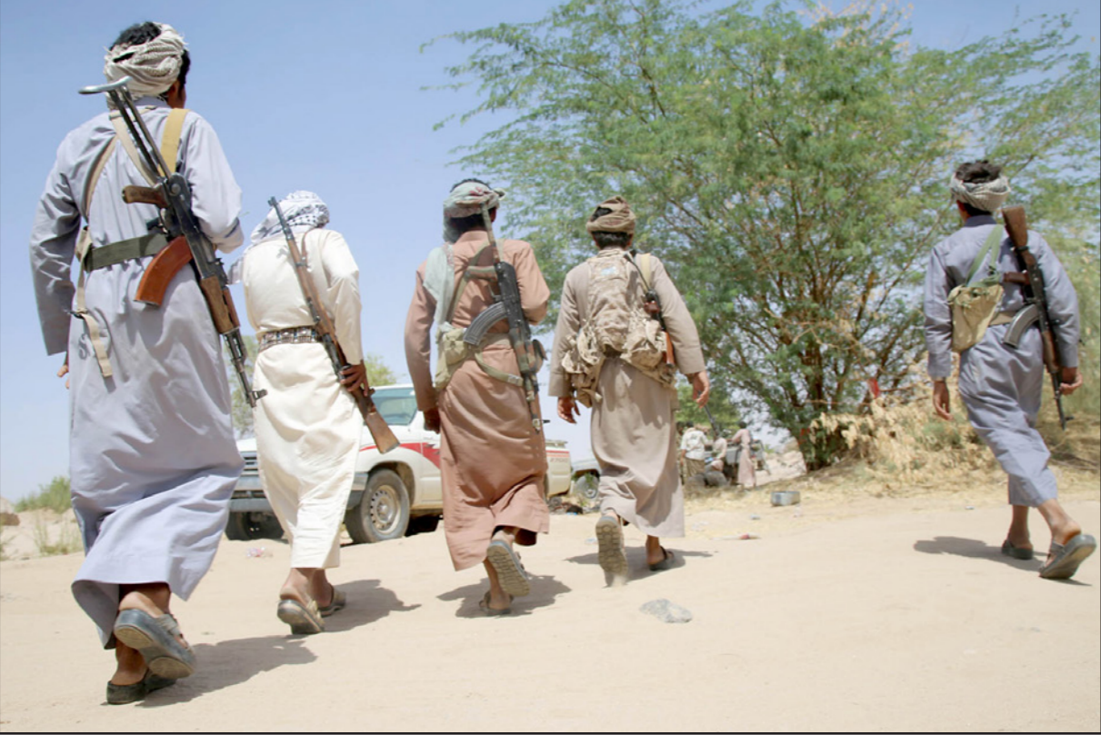
عناصر من العاشرة اليمنية الموالية للرئيس عبد ربه منصور هادي بالقرب من سد مأرب