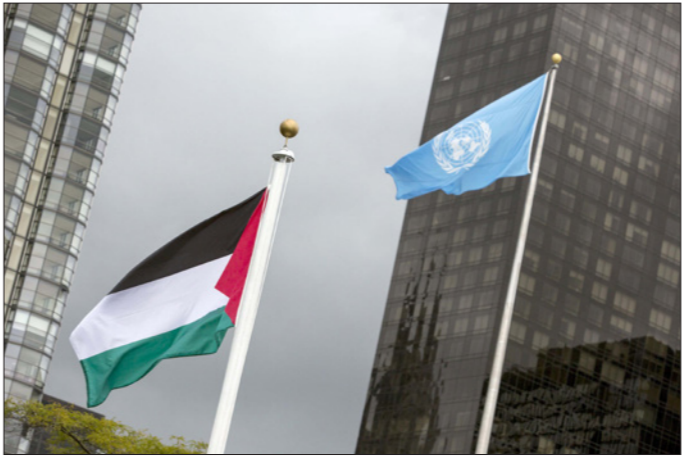
العلم الفلسطيني يرفرف في الأمم المتحدة

ووصل في أعقابهم وزراء الخارجية، وكان من بينهم وزير الخارجية الفرنسي، لوران فابيوس، ووزير الخارجية الروسي، سيرجيبه لافروف، ووزير الخارجية الإيراني، محمد جواد ظريف وغيرهم. المهمة الاسمي التي كانت امامهم هي التذرع إلى الصف الأول ليكونوا موجودين في اللحظة التاريخية، طالما انهم يتصرون بجانب العلم فانهم قد قاموا بدورهم في حل الصراع الاسرائيلي الفلسطيني.