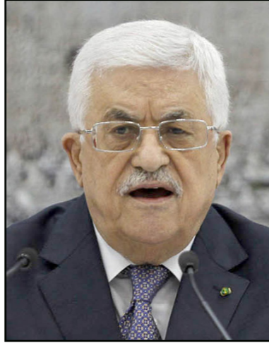
الرئيس محمود عباس

ورفض المتحدث باسم حركة فتح أسماء القواسمي موقف حماس من الخطاب، وقال إن موقف أسراراً من جهة وموقف حماس من جهة أخرى «هي مواقف مطابقة تماماً في الشكل والتحرير وتشكيل حكومة وحدة وطنية ورفع الحصار عن غزة».