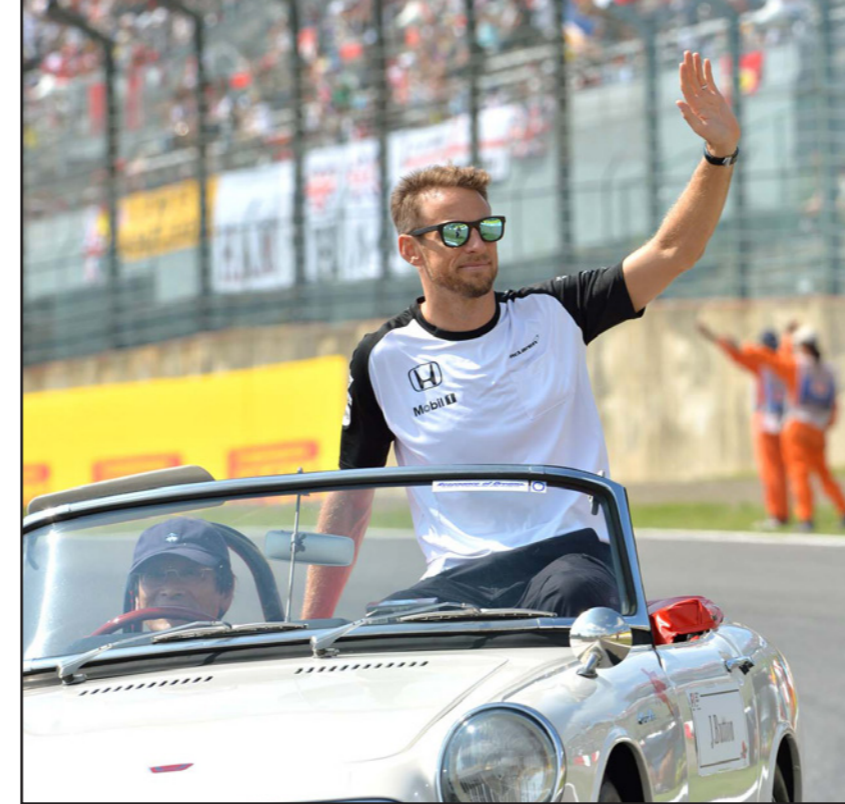
باتون يجي الجماهير قبل سباق اليابان الاسبوع الماضي

لندن - رويترز: تم تقديم موعد سباق استراليا الافتتاحي موسم فورمولا-1 العام المقبل والذي تستضيفه ملبورن على 20 مارس/ آذار للسماح بفترة كافية لعطلة أغسطس/ آب بعدما كان قد وضع في السابق في موعد متأخر أكثر من المعتاد يبدأ في الثالث من إبريل/ نيسان. وصادق المجلس العالمي لرياضة المحركات على نسخة مبدئية منقحة لجدول فورمولا-1 في 2016 تتضمن 21 سباقاً، وهو رقم قياسي، خلال اجتماع في باريس، وكان الموعد المبدئي في الثالث من إبريل، والذي سيذهب الآن لإقامة سباق البحرين ليكون الجولة الثانية من الموسم، سيصبح أكثر موعد متأخر ينطلق فيه الموسم منذ 1988. ومن بين التعديلات الأخرى التي طرأت على الجدول تبادل البحرين والصين المركز، حيث سيصبح السباق المقرر في شنغهاي هو الجولة الثالثة من الموسم وسيقام في 17 إبريل. وتم تقديم النسخة الأولى من سباق انزبريجان المقرر في باكو من 17 يوليو/ تموز إلى 19 يونيو/ حزيران بعد أسبوع من سباق كندا وهو ما يعني أن نيكو هالكينبرغ متسابق فورس انديا لن يتمكن من الدفاع عن لقبه في سباق لومان 24 ساعة للتحمل الذي سيقام أيضاً في 19 يونيو. وقال الاتحاد الدولي للسيارات إن موعد انطلاق السباق في باكو سيتم توقيته بحيث لا يتعارض مع ختام سباق لومان. وسيقام سباق بريطانيا في العاشر من يوليو بدلاً من 26 يونيو. وسيقام سباق المغرب قبل سباق ألمانيا وليس بعده بينما سيؤشر سباق هولندا في 31 يوليو تموز لعلقة أغسطس اب التي طالبت الفرق بالبقاء عليها خوفاً على طواقمها بسبب الموسم الطويل.