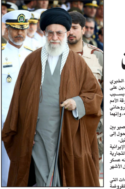
آية الله علي خامنئي

باريس - الأناضول: قدمت فرنسا أمس الخميس، مقترحاً إلى مجلس الأمن الدولي، طالبت فيه منع الدول دائمة العضوية، من استخدام حق النقض الفيتو، في حالات مثل «الإبادة والقتل الجماعي». وكان وزير الخارجية الفرنسي «لوران فابيوس»، في كلمة نقلتها وسائل إعلام فرنسية، أن «قبول هذا المقترح سيسهل عمل مجلس الأمن»، مشيراً أن المجلس لم يستطع التحرك إزاء الحالات كذلك التي حصلت في سوريا. وحمل المقترح الفرنسي بتأييد أكثر من 75 دولة، بينها عضوان من أعضاء مجلس الأمن الدائمين، هما الولايات المتحدة الأمريكية وبريطانيا، فيما لم تحب روسيا والصين المقترح الفرنسي. ويحتاج المقترح الفرنسي إلى موافقة ثلثي أعضاء مجلس الأمن البالغ عددهم 15، شرط عدم تصويت أحد الدول الخمس التي تمتلك حق النقض الفيتو ضد القرار. وكان الرئيس التركي «رجب طيب أردوغان»، قد انتقد الفيتو ضد القرار، الذي تمتلكه حق النقض الفيتو، قائلًا: «العالم أكبر من 5، لا يمكن للضمير العالمي أن يقبل ووقوف الأمم المتحدة عاجزة أمام قرارات مجلس الأمن، إذ أن مصير كل قرار المجلس مرتبطة بموافقة أو معارضة دول معينة».