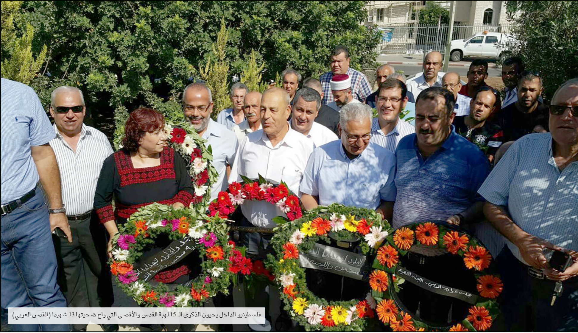
الناصرة - القدس العربي