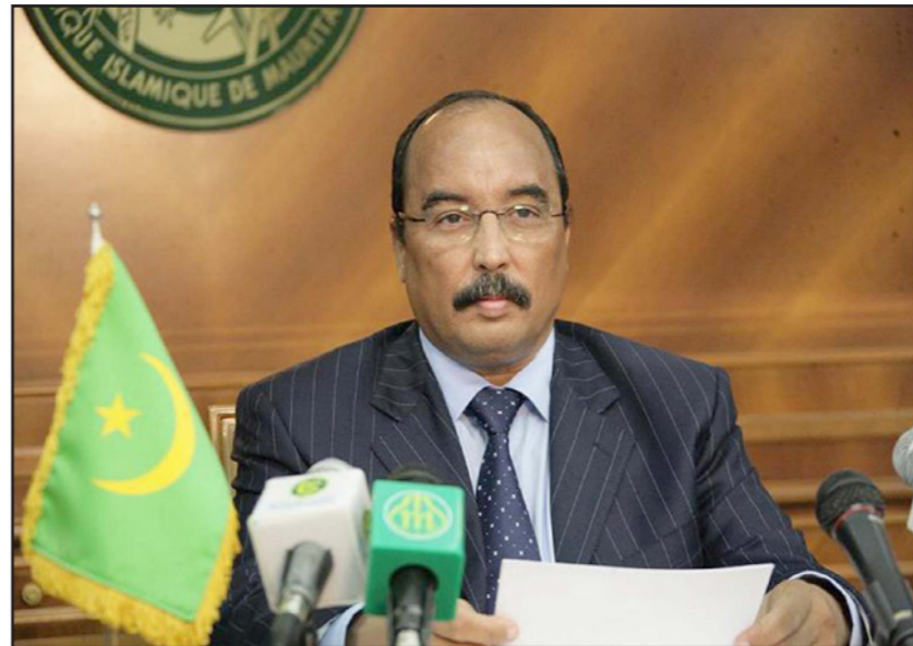
محمد ولد عبد العزيز

وقعوا ضحية لدعايات المنظمات الإرهابية حيث تمكنت الأجهزة الحكومية من إعادة هؤلاء الشبان للاعتدال وإبعادهم عن التطرف». وقال «إن الحل العسكري على أهميته لا يكفي وحده بل لابد من الحوار مع اجنثات أسباب الإرهاب، وهي انعدام العدل وعدم توفر السكان على ظروف الحياة المناسبة وعدم حل المشكلات الاجتماعية، فهذه كلها، يضيف الرئيس الموريتاني، مشاكل يجب حلها لكونها مسببة للإرهاب، مضيفا «أن الحل يكمن في تحسين الظروف المعيشية للسكان وتحسين القطاعات الخدمية من صحة وتعليم وفرص عمل». حسب تعبيره». وحول عودة الاستقرار لليبيا أعرب الرئيس ولد عبد العزيز عن «أسفه لتحويل ليبيا إلى ساحة للعمل الإرهابي معربا في الوقت نفسه عن أمه في «أن يتمكن الليبيون من حل مشاكلهم بأنفسهم عبر الحوار والتفاهم». وتحدث الرئيس الموريتاني عن وجود عشرات الآلاف من اللاجئين المليونين وعدد كبير من اللاجئين السوريين في موريتانيا فأوضح «أنه على الحكومات أن تتحمل مسؤولياتها الإنسانية أمام هذا الوضع»، مضيفا «أن موريتانيا قائمة بواجبها في هذا الصدد بوصفها عضوا في الأمم المتحدة». وأعرب عن أمه في أن تستتب الأوضاع الأمنية في البلدان غير المستقرة ليتمكن اللاجئون من العودة إلى دولهم».