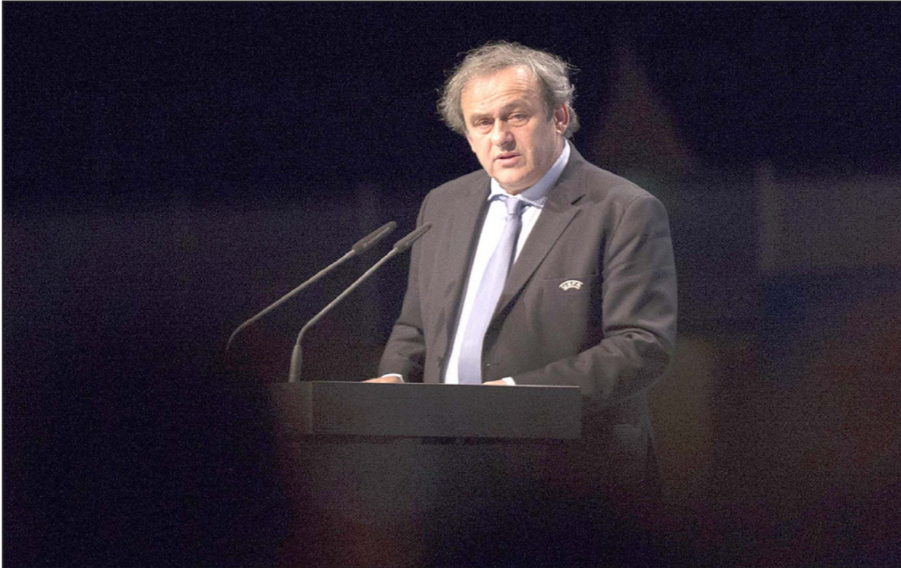
أعضاء الشبهات باتت تحوم حول النجم الفرنسي السابق بلاتيني

برلين - د ب أ: بعيداً عن موقفه في القضية، أثارت التفسيرات التي ساقها الفرنسي ميشيل بلاتيني رئيس الاتحاد الأوروبي لكرة القدم (يوييفا) حول ضلوعه في الفضيحة الأخيرة للفيفا الكثير من الشكوك حول مصداقيته. وقالت صحيفة «ليكيب» الفرنسية: «بلاتيني في خطر». وأصبح اللاعب الفرنسي السابق موضعاً للشبهات بعدما كشفت النيابة العامة السويسرية أنه قاضي مبلغ مالي يقدر بمليونين فرانك سويسري من السويسري جوزيف بلاتر رئيس الفيفا عام 2011، مقابل بعض الأعمال الاستشارية التي قدمها لصالح المسؤول السويسري في الفترة بين عامي 1999 و2002. وأوضح بلاتيني سبب انتظاره تسع سنوات حتى يحصل على أمواله، مبرراً ذلك بأن الفيفا كان يمر بمرحلة تقشف. بيد أن بعض وسائل الإعلام العالمية شككت في صحة القصة التي سردها رئيس اليوييفا وأكد أن الفيفا أعلن في 2002 عن تحقيقه أرباحاً بلغت 115 مليون فرانك. ورغم ذلك، أمر بلاتيني على ترشيح نفسه خلال الانتخابات الرئاسية للفيفا المقبلة والتي يسعى من خلالها لخلافة بلاتر الذي تعرض مؤخراً لضربات قاسية. ومن جانبه، قال باتريك كانير وزير الرياضة الفرنسي أنه يأمل بأن يتمكن موطنه من درء جميع هذه الشبهات خلال مقوله أمام لجنة القيم التابعة للفيفا والتي