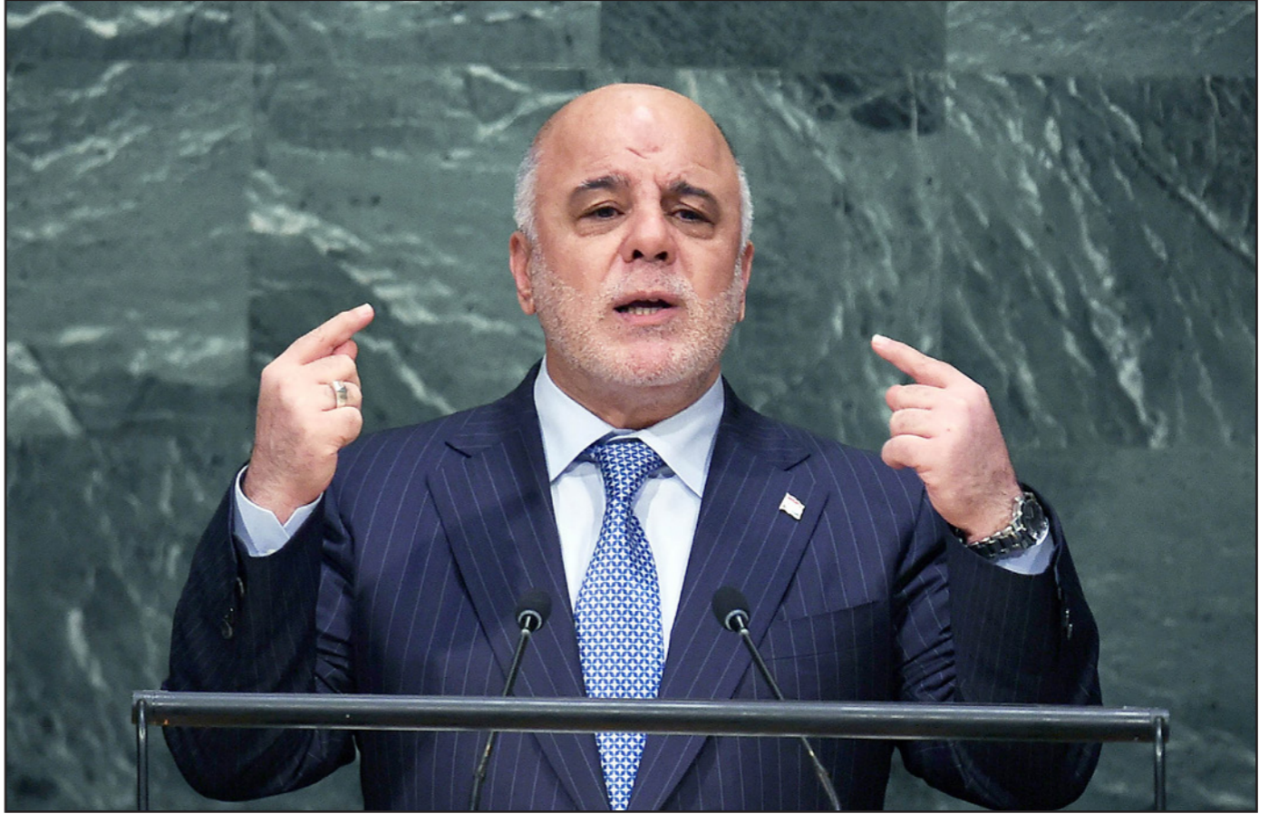
رئيس الوزراء العراقي حيدر العبادي يلقي كلمة بلاده في الجمعية العامة للأمم المتحدة

وكان رئيس الوزراء العراقي حيدر العبادي يلقي كلمة بلاده في الجمعية العامة للأمم المتحدة