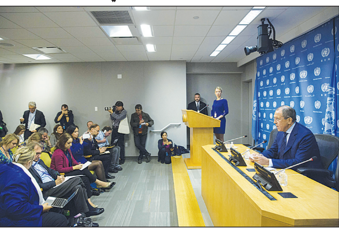
وزير الخارجية الروسي سيرغي لافروف خلال مؤتمر صحفي أثناء اجتماعات الجمعية العامة للأمم المتحدة في نيويورك أمس