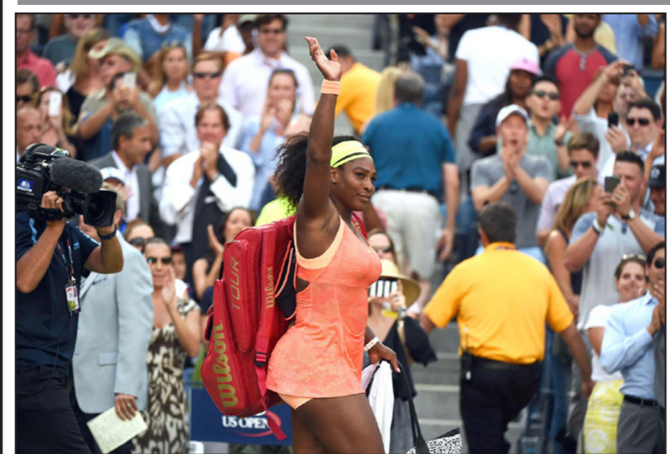
سيرينا تودع الجماهير وتبتعد عن البطولتين المقبلتين

وقت لاحق من العام الجاري»، وأضافت: «عندما أعود، ساركز بشكل كبير كي أتمكن من مواصلة رحلتي في هذه اللعبة الجميلة». وتلقت سيرينا (34 عاماً) ثلاث هزائم فقط خلال 58 مباراة خاضتها في عام 2015 وستنهي الموسم في صدارة التصنيف العالمي، للعام الخامس على التوالي.