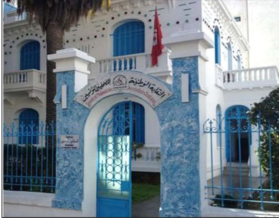
مبنى النقابة الوطنية للصحفيين التونسيين