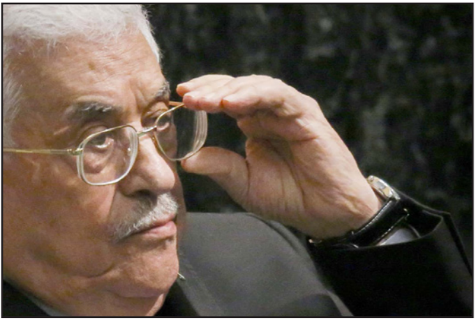
محمود عباس خلال رفع العلم الفلسطيني في الأمم المتحدة