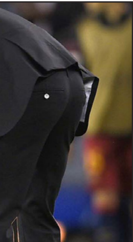
ماسكيرانو يتلقى تعليمات من مديره انريكي في مباراة البارسا الأخيرة

مصلحة الضرائب في إسبانيا. وأقادت المحكمة الكاثوليكية أن النيابة العامة اتهم ماسكيرانو بالتهرب الضريبي من عدة أنواع من الألعاب ارتكب جريمة تلاعب عندما قام بالتنازل عن حصة في الشركة لشركات تعمل في بلدان أخرى تتمتع بنظام ضريبي أفضل. واتهمت النيابة العامة اللاعب الأرجنتيني بارتكاب جريمة بعد عدم إدراجه لأرباحه عن حقوقه التجارية عامي 2011 و2012 في إقراره الضريبي. وفي أيلول/سبتمبر الجاري، قام ماسكيرانو بعد خضوعه للتحقيق من مصلحة الضرائب العامة برب مبلغ مليون ونصف