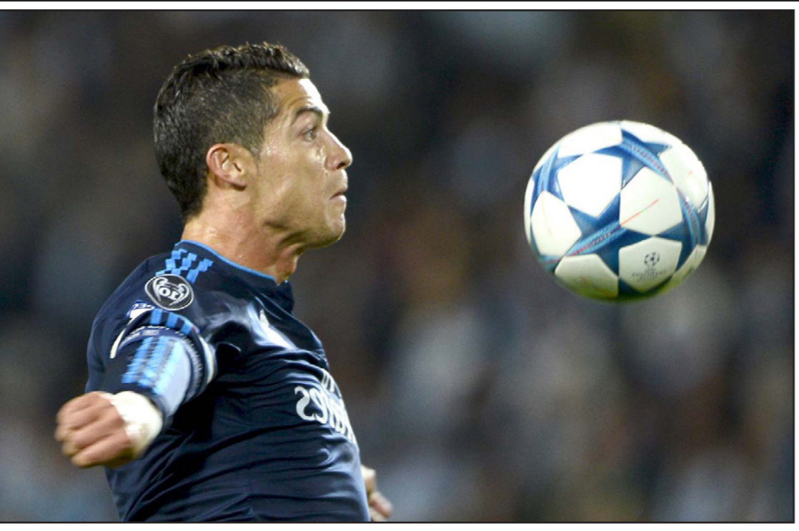
الانظار مترکز على رونالدو في دربي مدريد يوم الأحد

بالطريقة الأفضل لتحقيق الفوز وعليه أن يكون صورة واضحة عما يرد أن يقوم به... علينا أن نهاجم وأن نسجل الأهداف وأن نلعب بشكل جيد إذا كان هذا ممكناً. وفي الحقيقة، يصب الريال تركيزه على الدفاع وعدم استقبال الأهداف معتمداً على نجومه الكبار في قيادة الهجوم، فقد كان هذا هو ما حدث تحديداً في مالو عندما سجل كريستيانو هدفي فريقه وهو الأمر الذي لم يحدث يوم السبت الماضي عندما سقط الفريق المديري في فخ التعادل أمام ملقة. وقالت صحيفة «أس» الإسبانية: «استراتيجية بنيتيز عملية بعض الشيء اعتماداً على نظام التناوب بين اللاعبين وإراحة البعض الآخر بهدف خلق فريق قوي داخل الملعب ولكن يقصده المظهر الجمالي». وأصبح الأمر يتعلق الآن بتربط ما سبقه الريال خلال الموسم الجاري واستبيان إذا كان سيستمر في انتحاج نفس الاستراتيجية أم سيختار مدربه الانصياع لرغبات الجماهير التي تأمل في بعض التغييرات. ويمر أتلتيكو بنفس مرحلة الشك والتخبط، لكن