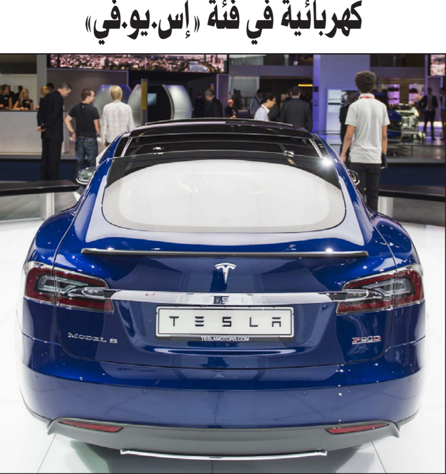
«تيسلا موتورز» تقدم سيارتها الكهربائية الجديدة

تقارير إعلامية عن مدونة «تيسلا موتورز كلوب» على الإنترنت. ويقول إيلون ماسك، الرئيس التنفيذي للشركة، أن تكلفة السيارة موديل إكس ستزيد بمقدار 5 آلاف دولار عن السيارة الصالون موديل إس التي يبدأ سعرها من 70 ألف دولار بحسب خبراء صناعة السيارات.