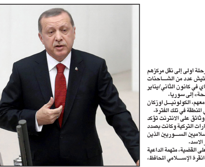
الرئيس التركي رجب طيب أردوغان

عواصم - وكالات: قال الرئيس التركي رجب طيب أردوغان إن بلاده لن تسمح للإرهاب بأن «يجد موطناً قديماً» فيها أو أن «يفرض أمراً واقعاً» على حدودها في إشارة على ما يبدو للعمليات التي تجريها سوريا في العراق. جاءت تصريحات أردوغان خلال خطاب لقاؤه أمام البرلمان في أنقرة. وبدأت القوات الجوية الروسية شن غارات في سوريا يوم الأربعاء مستهدفة مناطق على مقربة من مدينتي حمص وحماه في غرب البلاد حيث تقاوت قوات الجيش السوري بشار الأسد عندما من الفصائل المسلحة المعارضة للنظام. تركيا تعرب عن «قلقها البالغ» بشأن الضربات الجوية الروسية في سوريا (الخارجية) من جانبها، أعرب وزير الخارجية التركي فريدون سينيغلي أوغلو والخميس عن «القلق البالغ» بشأن التقارير بأن أولى الضربات الجوية الروسية أصابت مدينتين وعناصر من المعارضة السورية من مسلحي تنظيم الدولة الإسلامية. ولقد عن الوزير قوله «يشعر بالقلق البالغ بشأن المعلومات بأن الضربات الجوية الروسية في سوريا استهدفت مواقع للمعارضة بدلاً من داعش (الدولة الإسلامية)، وأنه نتيجة لذلك قتل مدنيون». وقالت في بيانها «القتل المبرح» الذي شهدته مدينتي إدلب وحمص في سوريا، حيث قتلوا جنديين تركيين خلال توجههما إلى عملهما أمس الخميس (أول أكتوبر تشرين الأول) في منطقة ديار بكر جنوب شرق تركيا. وقتل أكثر من 100 من رجال الأمن ومئات المقاتلين الأكراد منذ 69 شهراً.