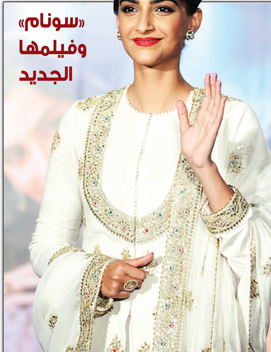
نجمة السينما الهندية «سونام كابور»، حضرت حفلاً للترويج لفيلمها الجديد في مومباي بصحبة بطل الفيلم «سلمان خان»

ولم ترد الأكاديمية على طلب للتعليق بشأن المزاد الذي أقامته دار مزادات (بروفايانز إن هيسنوري) في هوليوود.