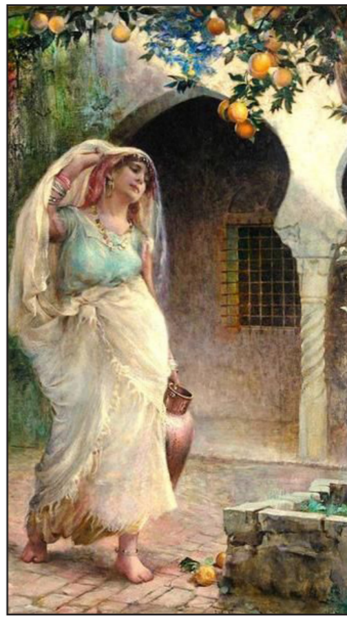
«حاملة الماء» للفنان إيساك ستومان

متذبذبة بين الشفقة والرغبة فهي مظهرهده ومقهورة أو منهتكة لتسلكي عارية في تراخ وكسل. وفي رأيه أن المجتمعات تعرف من خلال الأزياء التي يرتديها مواطنوها وأن الحجاب «تحول إلى معركة ضخمة عبات قوى الاحتلال (الفرنسي في الجزائر) من أجلها أغز الموارد وأخترها تنوعا وأظهر فيها المستعمر قوة مذهلة»، ويضيف أن الفرنسيين «عملوا على بذل أقصى مجهوداتهم ضد ارتداء الحجاب بوصفه رمزا لتمثال المرأة الجزائرية، طوال احتلالهم للجزائر الذي بدأ عام 1830. يرى أنه بعد تهاولي عروش الملكيات بأوروبا حدث «تطرف أشد عنقا» فازدهرت الأعمال الفنية التي عنيت بالجسد. ويقول إنه مع بزوغ عصر التنوير في أوروبا «جاء العربي كاسحاً... أصبح هناك غاية من الأجساد العارية الرسومة أو المحفورة... أصبح الجسد ذو الشك المعارف عليه بأنه النموذج الكامل - الرمز الأعلى للإيمان الأوروبي».