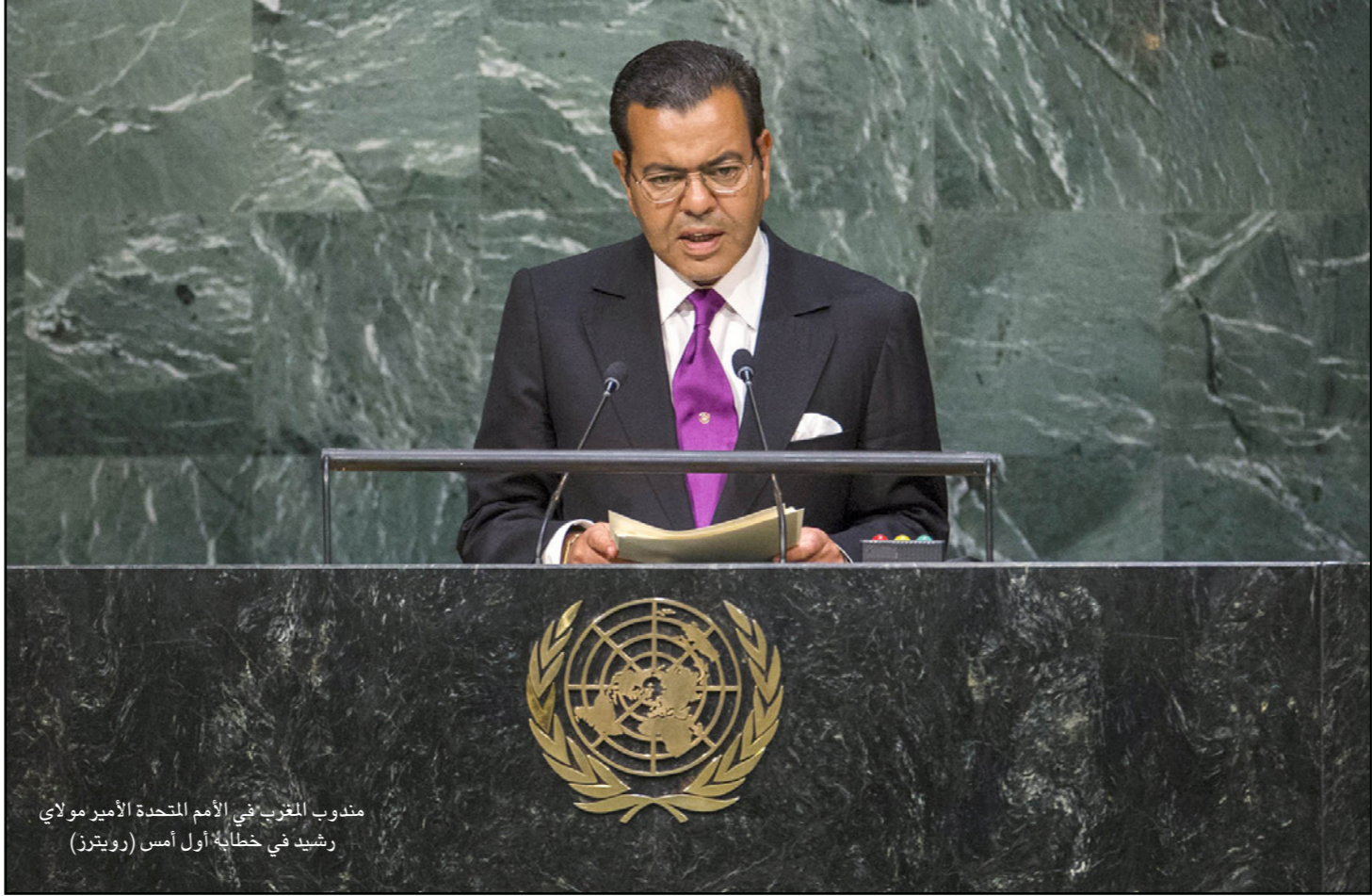
مندوب المغرب في الأمم المتحدة الأمير مولاي رشيد في خطابه أول أمس

أجدادهم يتنقلون في شواطئنا في القرون الماضية»، وقال رئيس الحكومة المغربية أن «المواطنون المغربية الصحراويين، من خلال كل المحطات الانتخابية التي ينظمها المغرب، كانوا أكثر تعبئة حتى من إخوانهم المتواجدين في شمال المغرب»، بحيث صوتوا بكثافة في كل هذه الاستحقاقات، وهو ما يجعل على أن أطروحة «الكيان الوهمي» أصبحت متجاوزة وأن على المجتمع الدولي الانخراط أكثر من أجل طي صفحة هذه المسألة التي عمرت