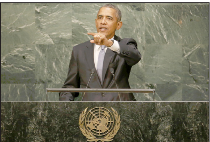
الرئيس الأمريكي باراك اوباما في الجمعية العامة للأمم المتحدة

متباعدة كان حسن النية بدون فائدة سياسية حقيقية (ريغان في هاييتي). ما الذي سيعيد الولايات المتحدة إلى الشرق الأوسط؟ خطر واضح وفوري يهددها – هذا هو الجواب الاسفل. فالأمريكيون دخلوا إلى الحرب العالمية الثانية فقط بعد أن تعرضوا للهزيمة في بيرل هاربر، وبادروا إلى حرب الخليج الاولى بسبب التهديد المباشر لآبار النفط في الشرق الاوسط. النفط الذي غذى اقتصادهم، وقرروا الدخول إلى أفغانستان بعد العمليات في برجي التجارة العالمية.