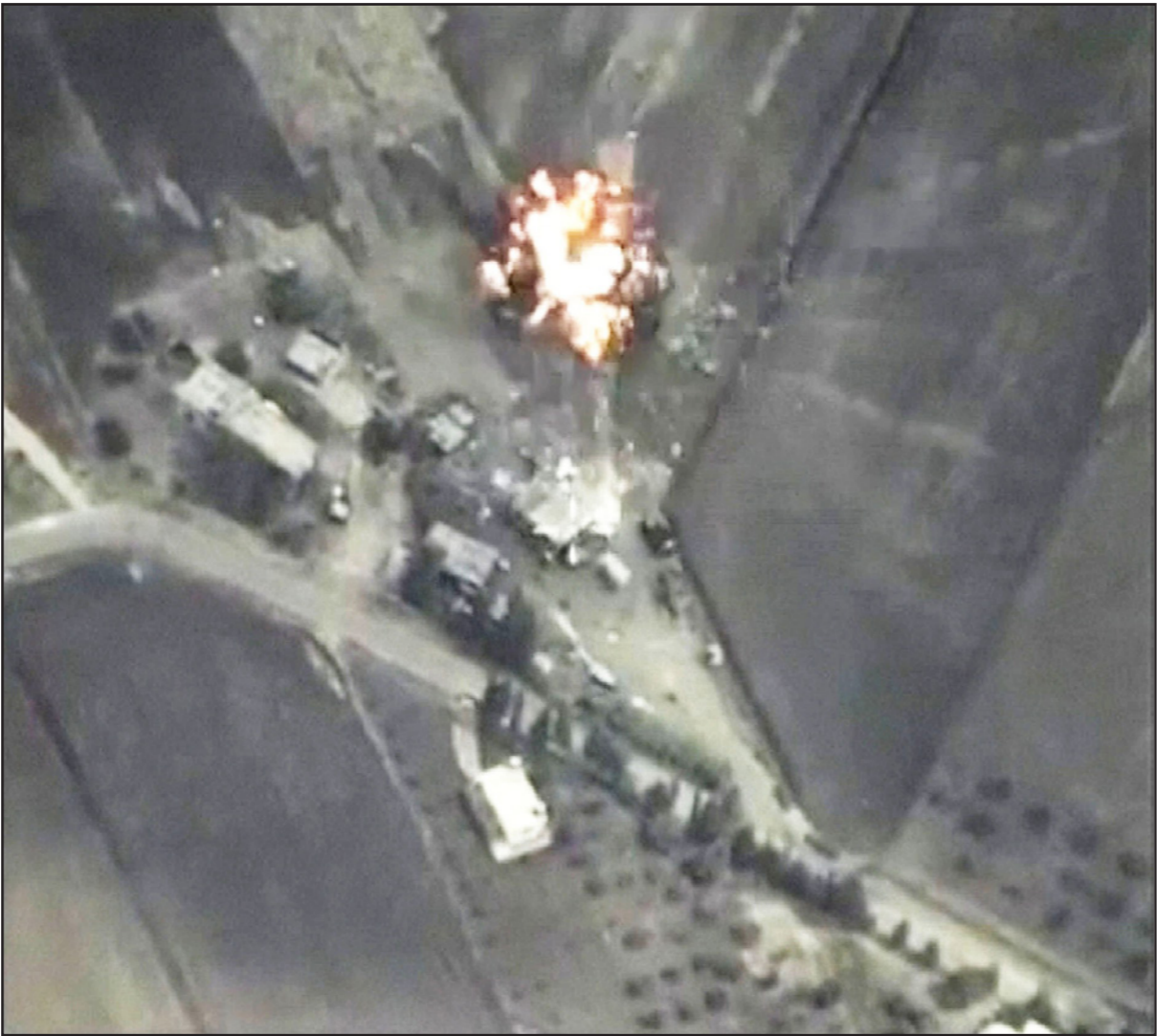
لقطة نشرتها وزارة الدفاع الروسية تظهر الضربات الجوية الدقيقة لسلاح الجو الروسي يوم الأربعاء 30 سبتمبر 2015

وقالت الناطقة باسم وزارة الخارجية الايرانية مرصية أفخم أن «جمهورية إيران الإسلامية تعتبر العملية للدول وإذكاء النزاعات الطائفية الإرهابية المسلحة في سوريا مرحلة في مكافحة الإرهاب وتسوية الأزمة الحالية في المنطقة.» وأضافت ان «مكافحة عملية وعميقة ولاهراب (...)، اسمر لا بد منه، موضحة أن ذلك يتطلب تصميمًا جديًا وتحركًا دوليًا مشتركًا يستندان إلى التعاون مع الحكومتين العراقية والسورية اللتين تتحملان المسؤولية الرئيسية لمكافحة الإرهاب.»