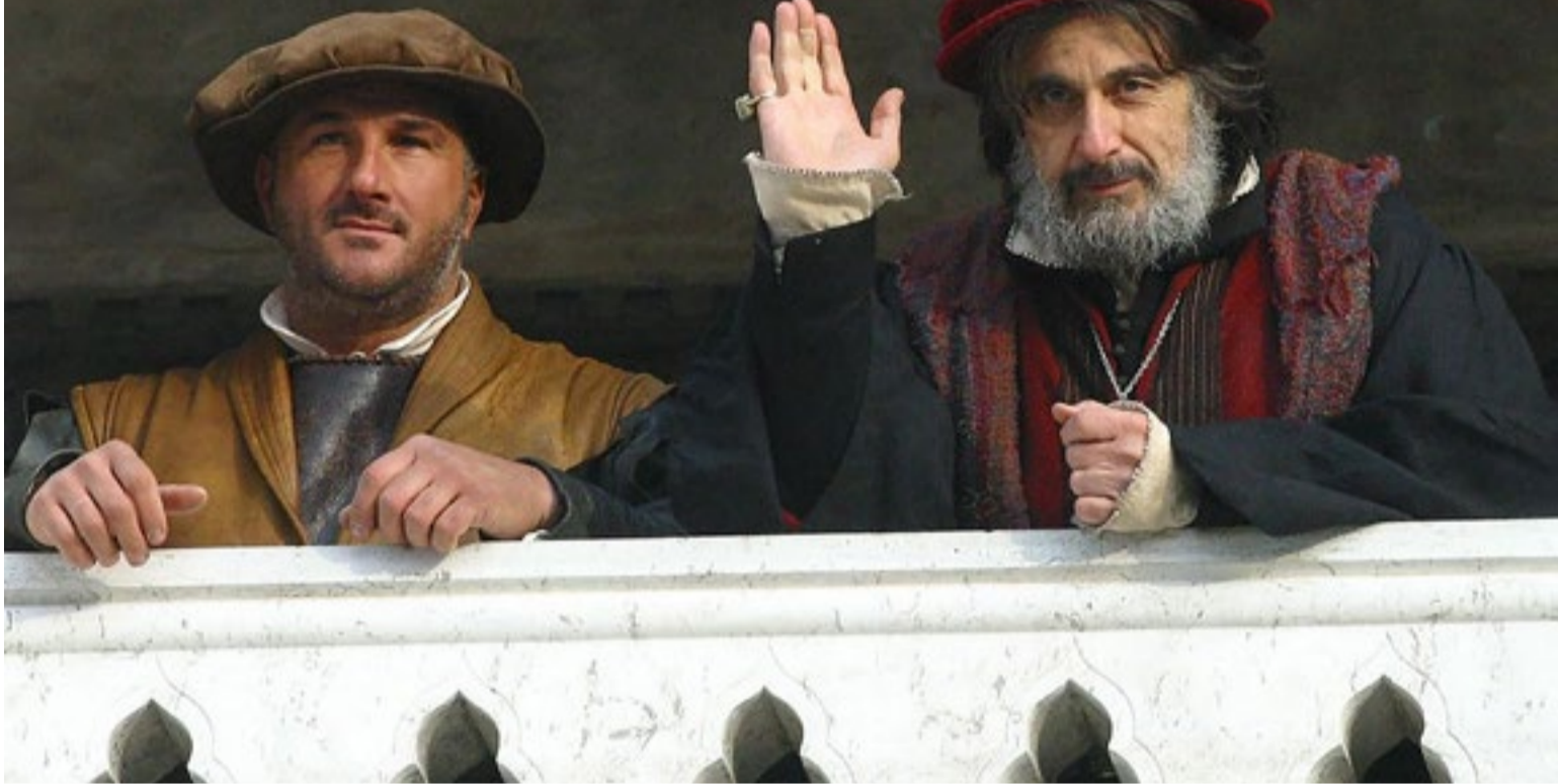
فيلم «تاجر البندقية»