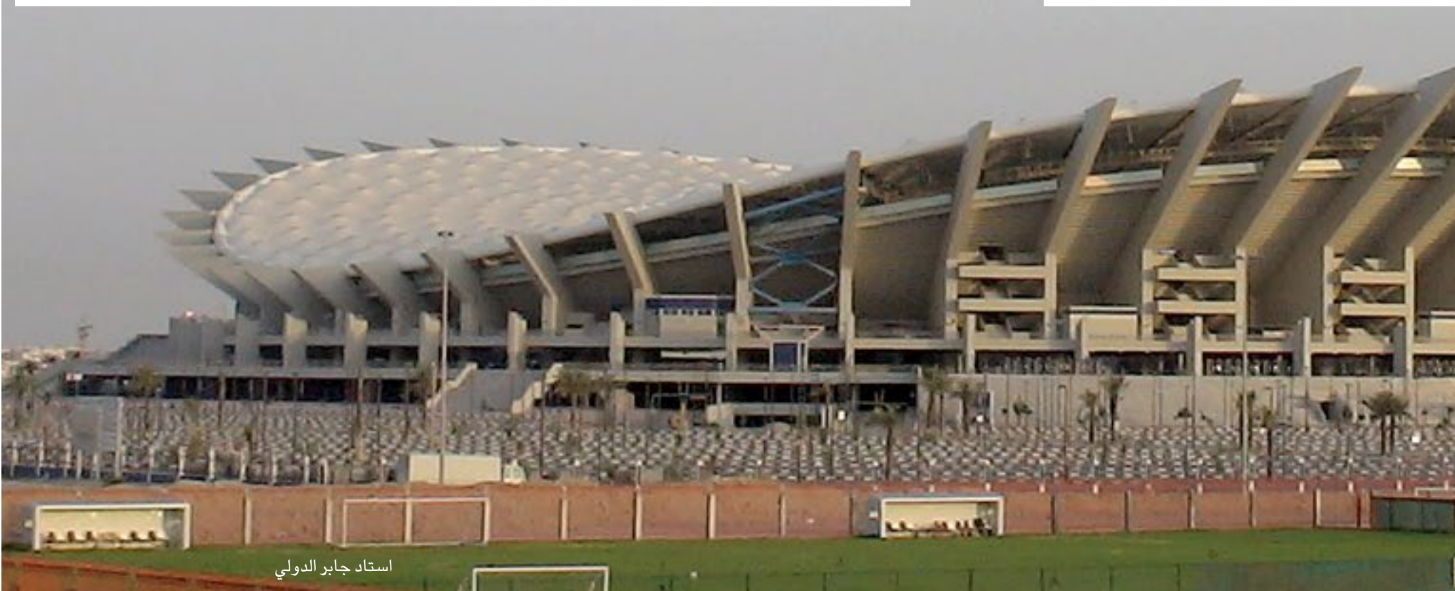
استاد جابر الدولي

وأثيرت مخاوف الشارع الخليجي من أن تلقي التكهّنات الإعلامية بشأن مستقبل الرياضة الكويتية بظلالها على الحدث الخليجي عندما تستضيف الكويت النسخة الثالثة والعشرين من بطولة كأس الخليج (خليجي 23) التي عادت لموعدها المقرر سابقا لتنتقل في كانون الأول/ ديسمبر المقبل حتى الرابع من كانون الثاني/ يناير على ملعب استاد جابر ونادي الكويت. لكن الخزعل أكد عدم التأجيل بقوله: «البطولة ستقام في موعدها، لقد تلقينا توجيهات عليا بذلك وتم العمل بموجبهنا ويسرنا الترحيب بكل الاشقاء الخليجيين واليمن والعراق في بلدهم الثاني».