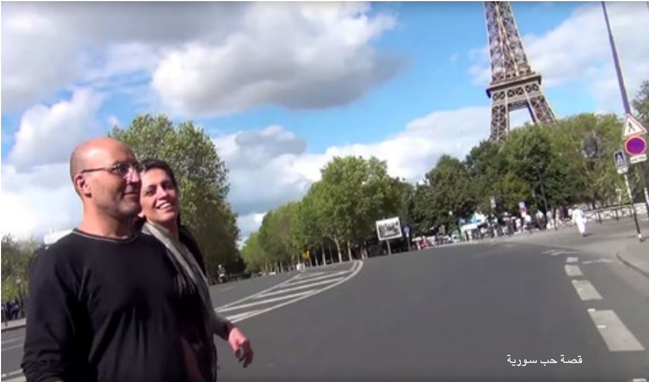
قصة حب سورية

صحة. سافرت إلى تركيا في قرية من بلدي. كل النشاطات التي تخص سوريا تتحدد في تركيا الشعب السوري لم يكن عنده خيار اللجوء. أنا تحديدا عرض علي اللجوء في السويد والدنمارك وكنت أرفض. أريد ان أموت في بلدي. الوطن بالنسبة لي ليس مجرد حجر وطننا بل يتمل عننا نحن تخلينا عنه.