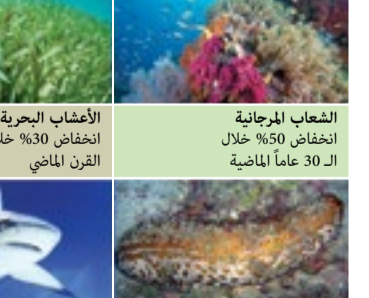
المرجع: Deep Blue World Living Blue Planet Report by World Wildlife Fund

وتوجد في الكاميرا شرائح استشعار تقوم باستكشاف درجة اهتمام صاحبه بما يراه، وقد تمت برمجة الاهتمام أو الحساسية لتكون موزعة على درجات من 1 إلى 100، حيث إنها تبدأ التصوير بمجرد أن يبلغ الإهتمام أو عمالقة التكنولوجيا اختراع أجهزة تتواصل مباشرة مع دماغ الإنسان وتقراً ما يدور فيه من أفكار، حيث سبق أن ابتكرت شركة يابانية