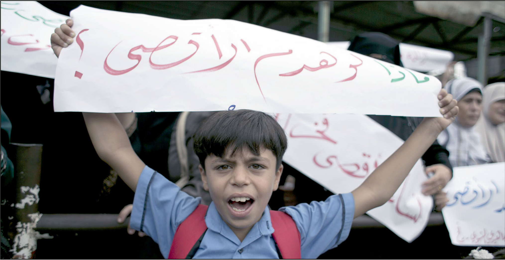
اطفال غزة يشاركون في الاحتجاجات ضد الإجراءات الإسرائيلية في القدس المحتلة أمس (أ ف ب)