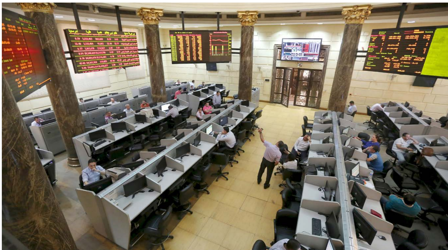
قاعة التداول في البورصة المصرية

لبناء طرق وجسور، بما سيسهل الوصول إلى مجمع متنزهات الشركة الذي من المنظر افتتاحه العام المقبل. وصعد المؤشر العام لسوق أبوظبي واحداً في المئة مدعوماً بصعود سهم بنك أبوظبي التجاري القيادي 2.6 في المئة إلى 7.86 درهم. وفي أواخر الأسبوع الماضي رفع «بيت الاستثمار العالمي/غلوبل» تقييمه لسهم بنك أبوظبي التجاري إلى توصية «قوية بالشراء» من توصية «بالاحتفاظ» محددًا سعره المستهدف عند 9.66 درهم.