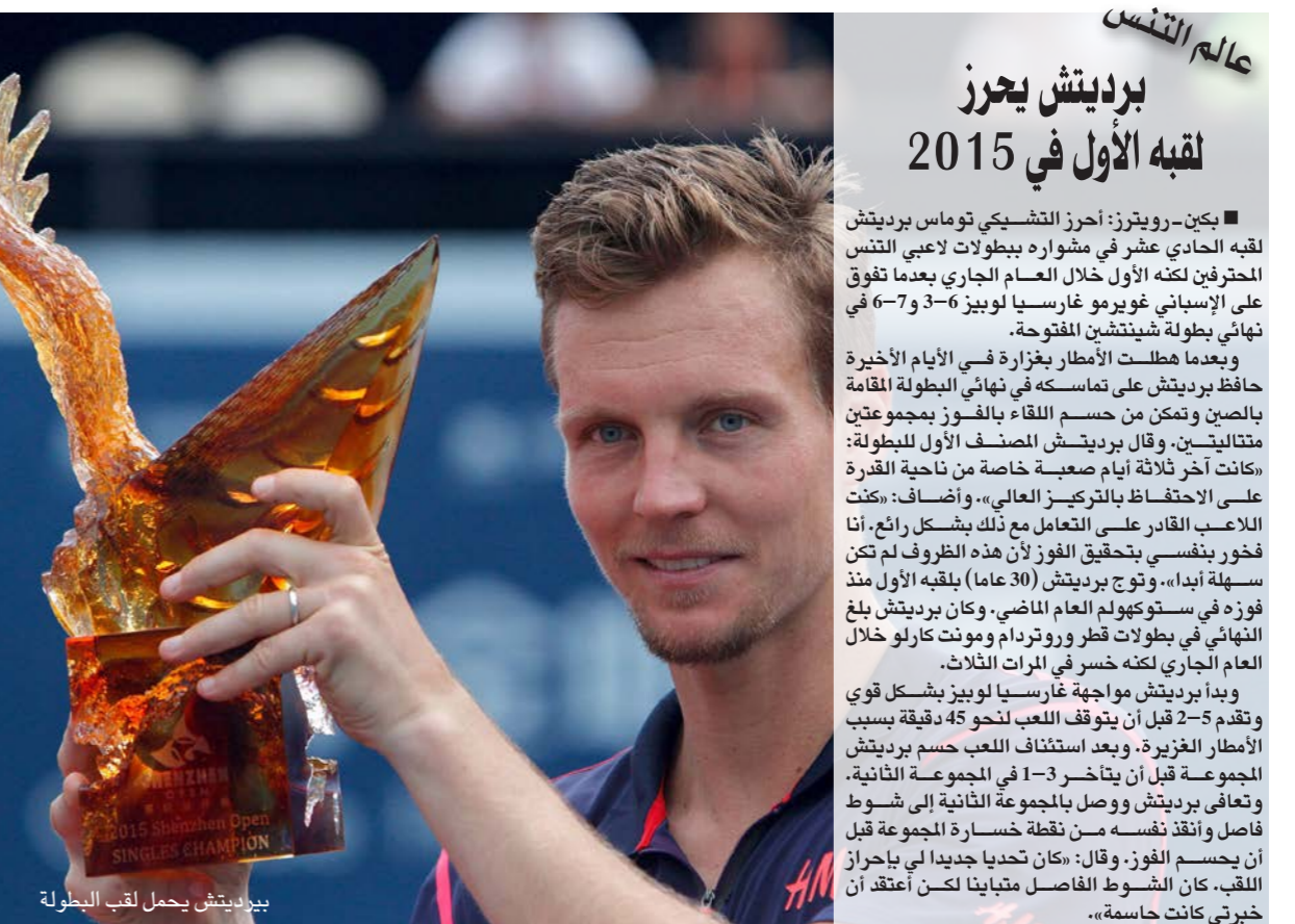
بيدريتش يحمل لقب البطولة

برلين - د ب أ: تقدم الأسباني ديفيد فيرير للمركز السابع في التصنيف العالمي لحترفي التنس في النسخة الجديدة والصادرة وأسس عن الرابطة العالمية لحترفي التنس يتبادل موقعه مع مواطنه رافاييل نادال الذي تراجع للمركز الثامن. وحافظ ديكوفيتش على صدارته للتصنيف برصيد 15 ألف و645 نقطة مقابل 9420 نقطة لروجر فيدرر و8640 نقطة لاندني مري في المركزين الثاني والثالث على الترتيب. ولم تشهد المراكز العشرة الأولى سوى تغيير واحد آخر بعدما تبادل نادال وفيرير موقعيهما. وكانت المراكز من الرابع إلى العاشر على الترتيب من نصيب السويسري ستانيسلاس فافرينكا (6005 نقاط) والتشيكي توماس بيرديتش (4900 نقطة) والياباني كي نيشيكوري (4540 نقطة) والأسباني ديفيد فيرير (3945 نقطة) والأسباني رافاييل نادال (3770 نقطة) والكندي ميلوس راونيتش (2740 نقطة) والفرنسي جيل سيمون (2530 نقطة).