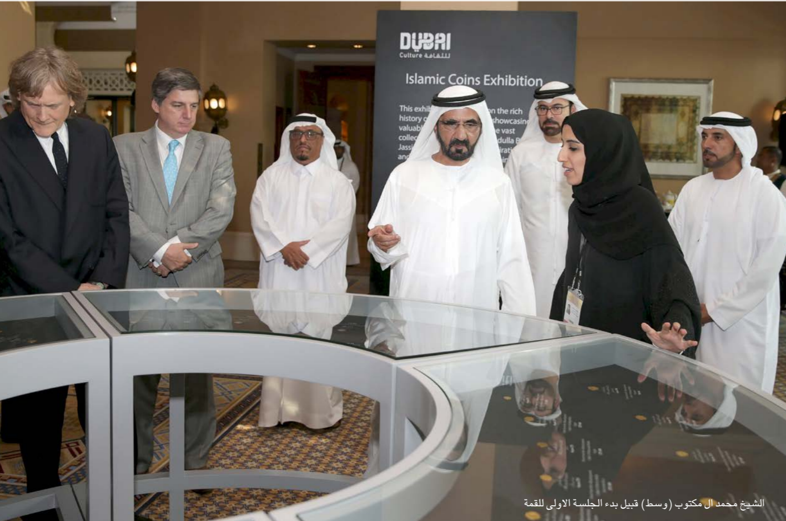
الشيخ محمد آل مكتوم (وسط) قبيل بدء الجلسة الأولى للقمة

■ دبي- رويترز: انطلقت أمس الإثنين في دبي القمة العالمية للاقتصاد الإسلامي 2015، التي تستمر يومين، بتنظيم من غرفة تجارة وصناعة دبي ومؤسسة تومسون رويترز، وسط آمال عريضة بأن تساهم هذه الفعالية في دفع عجلة الاقتصاد الإسلامي الأخذ في النمو والتوسع، ووضع حلول عملية للمشاكل التي تعترض طريقه، والتجارب مع التحديات التي تواجهه. ويقول القاتون على القمة، التي تعقد تحت رعاية الشيخ محمد بن راشد آل مكتوم حاكم دبي ونائب رئيس الدولة ورئيس مجلس الوزراء في دولة الإمارات العربية المتحدة، انها ستكون منصة تجمع أكثر من 2000 من صانعي القرار وقادة الأعمال من جميع أنحاء العالم الإسلامي وخارجه. وقال عبدالله محمد العور، المدير التنفيذي لمركز دبي لتطوير الاقتصاد الإسلامي، في كلمة أمام القصة «تجتمع العقول وتتوحد الرؤى والإرادات في سبيل استكمال مسيرة تطوير الاقتصاد الإسلامي، وتمكينه من أداء دوره التاريخي، في إثراء العمل الاقتصادي الحديث بالأخلاقيات والقيم الإنسانية ومعايير الاستدامة الحقيقية». وأضاف أنه مر عامان على إطلاق مبادرة «دبي عاصمة الاقتصاد الإسلامي»، ومر عامان على انعقاد القمة العالمية الأولى للاقتصاد الإسلامي، ومنذ ذلك الوقت القصير في المقياس التاريخي تحقق الكثير على صعيد هذه المبادرة. وقال «لقد نجحت دبي في الانتقال بالاقتصاد الإسلامي من مرحلة التعريف بما هي هذه المنظومة الاقتصادية إلى مرحلة تقديمها للعالم أجمع كإضافة متكاملة للعلوم الاقتصادية والعمل الاقتصادي من حيث سبله وآلياته وغاياته». وقال «أمس نلتقي بعد عامين لنستكشف الفرص التي يتيحها الاقتصاد الإسلامي في قطاعاته السبعة».