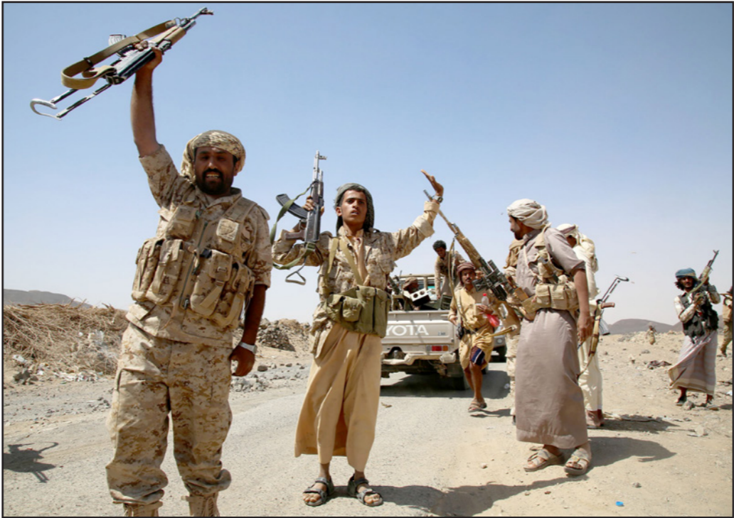
عناصر من المقاومة والجيش الوطني يبتعدون بطرد ميليشيات الحوثي من منطقة العاوفي مأرب

وقال العامل السعودي «إن الملكة مع اليمين على الدوام وستظل كذلك محبة للشعب اليمني وداعمة له على مختلف المستويات»، واطلع على نتائج زيارة هادي لمدنية عن خلال عيد الأضحى المنصرم، قبل نحو عشرة أيام والاتطلاع على الاحتياجات الملحة التي ينتظرها اليمن في الأرحال القبلية. وأشاد هادي بجهود المملكة العربية السعودية وقوفها إلى جانب الشعب اليمني وتوسيعه في المحنة التي يمر بها حالياً والتي كان للملكة الدور المحوري