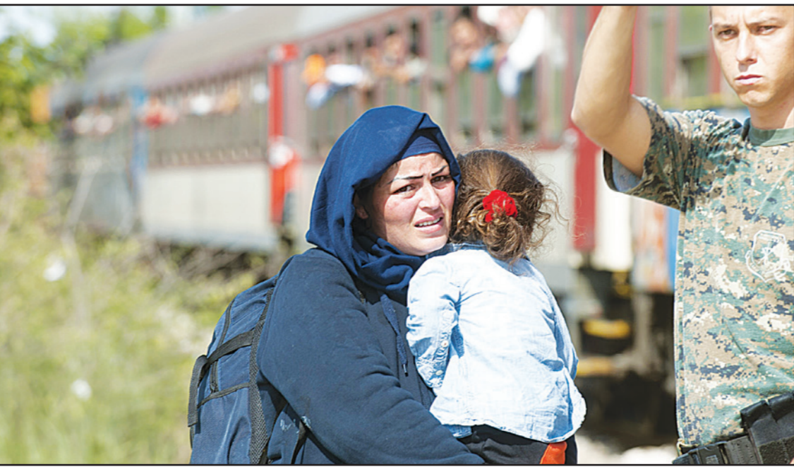
سورية تحمل طفلتها بانتظار ركوب قطار في اليونان في طريق الهجرة لاوروبا

■ عواصم - وكالات: حذرت أنقرة موسكو من تكرار اختراق مجالها الجوي خلال غارات شنتها على سوريا، فيما ندد حلف شمال الأطلسي بهذا التوغل الروسي «بالغ الخطورة»، داخل الأجواء التركية، ودعا روسيا إلى «الوقف الفوري لهجماتها ضد المعارضة السورية والمدنيين». وقال وزير الخارجية الأمريكي جون كيري أمس الاثنين إن الولايات المتحدة «تشعر بقلق بالغ» من انتهاك طائرة روسية المجال الجوي التركي في مطلع الأسبوع. وقال إن روسيا يجب أن تتقل بشكل مباشر إلى الرئيس السوري بشار الأسد ما هو منتظر منه في إطار تحول سياسي في سوريا. وقال «أود أن أقول لروسيا إن عميلهم الذي أصبح يواجه متاعب كبيرة يجب أن يعرف بطريق مباشر ما نقلته روسيا إليها وما هو مطلوب منه للوفاء بالتوقعات الدولية في هذا الشأن»، وكانت أنقرة أعلنت أن مقاتلات أف 16 تركية اعترضت السبت طائرة حربية روسية انتهكت المجال الجوي التركي عند الحدود السورية وازعمتها على العودة، وفق وزارة الدفاع التركية.