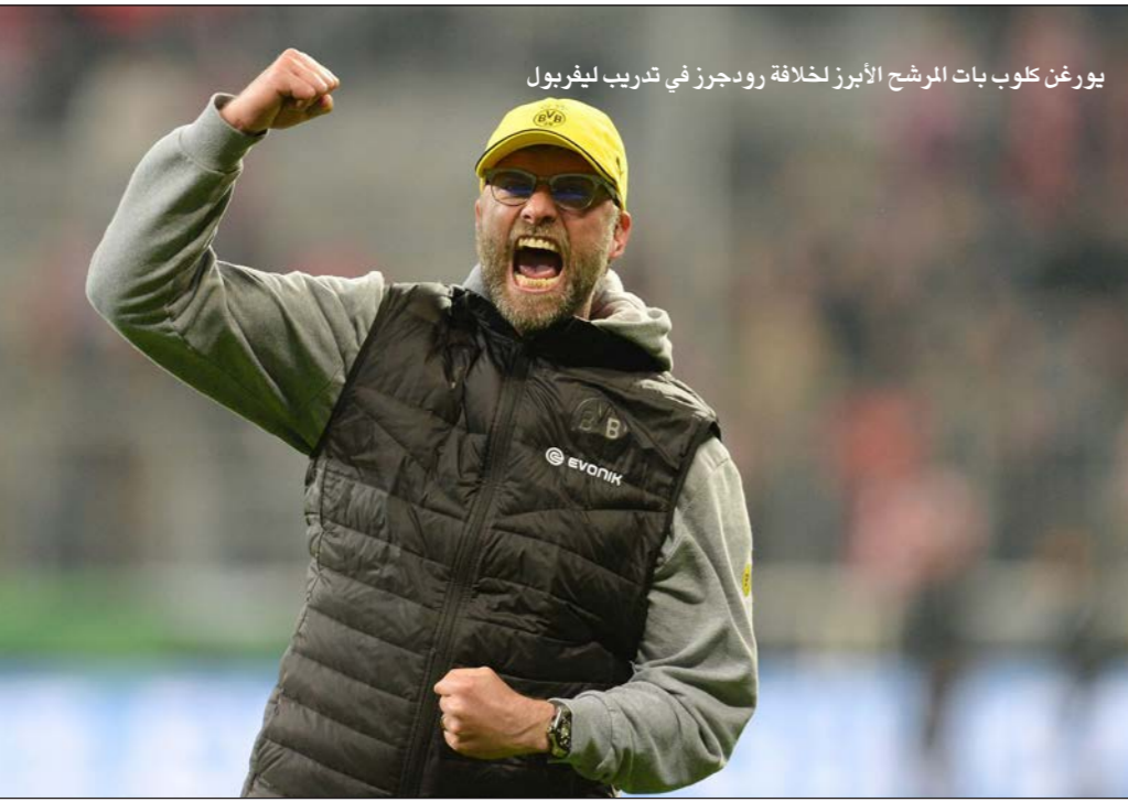
يورغن كلوب بات المرشح الأبرز لخلافة رودجرز في تدريب ليفربول

وعلى استاد «يوفنتوس» بمدينة تورينو، تقدم بولونيا بهدف ميكو سجله أنتوني موني في الدقيقة السادسة ودد يوفنتوس بقوة عبر ثلاثة أهداف أحرزها الفارو موراتا والأرجنتيني باولو ديبالا والألماني ساسي خضيرة في الدقائق 34 و53 من ركلة جزاء و44. ورفع يوفنتوس رصيده إلى ثمانية نقاط ليتقدم إلى المركز الثاني عشر ويتجمد رصيده بولونيا عند ثلاث نقاط في المركز الأخير بعدما مني بالهزيمة الثالثة على التوالي وهي السادسة له في سبع مباريات.