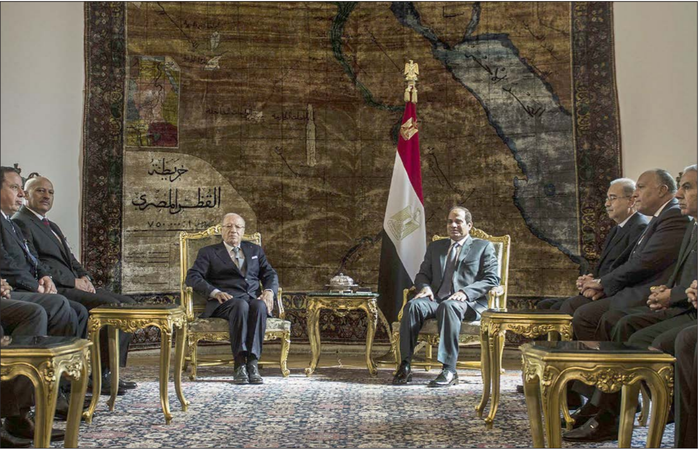
الرئيس المصري عبدالفتاح السيسي مع نظيره التونسي الباجي قائد السبسي أثناء اجتماعهما الرسمي حيث خلعت القاعة من علم تونس

العربية، وأرجو أن لا تتصرف تونس في استقبال السبسي كما تصرفت مصر في استقبال قائد السبسي». يذكر أن بعض النشطاء انتقدوا «زلة لسان» للرئيس التونسي خلال المؤتمر الصحفي، حيث أكدوا أن آخر زيارة لرئيس تونس لمصر كانت منذ أكثر من نصف قرن، من دون الإشارة إلى الزيارة التي أداها الرئيس السابق المنصف المرزوقي إلى القاهرة في منتصف 2012.