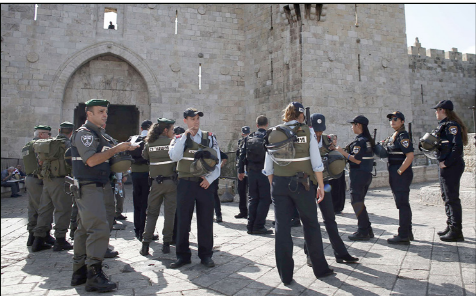
جنود الاحتلال يحرسون باب العمود المدخل الرئيسي للبلدة القديمة في القدس المحتلة أمس

من جهته ينقل مركز «كيوبرس» عن مدير مركز القدس