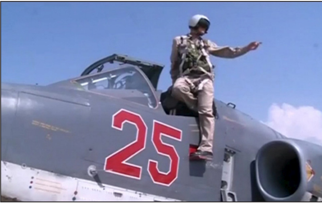
لقطة من شريط فيديو وزعته وزارة الدفاع الروسية أمس تظهر قائد مقاتلة جوية روسية طراز Su25 في قاعدة حميميم السورية