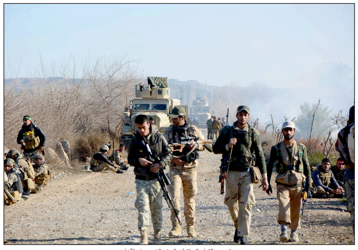
عناصر من القوات العراقية و«الحشد الشعبي» في الأنبار