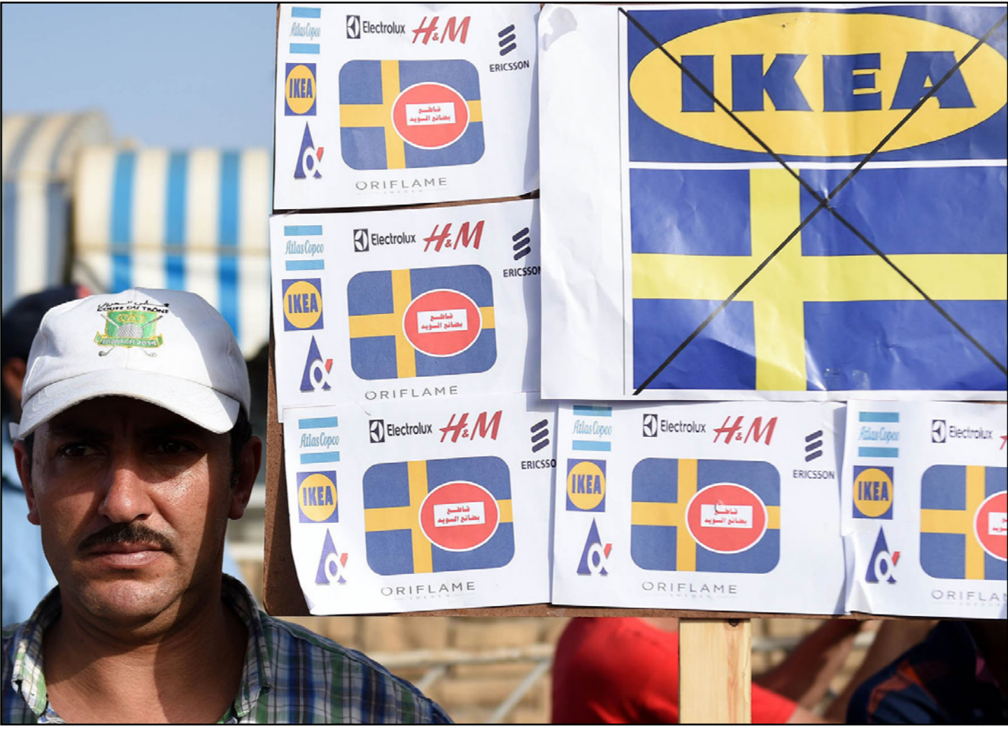
أحد المظاهرين المغاربة خارج السفارة السويدية في الرباط أمس

الرباط - «القدس العربي»: امتنع حزب اليساري المغربي عن المشاركة بوفد حزبي توجه للسويد لإقناعها بعدم الاندفاع والاعتراف بالجمهورية الصحراوية التي تشكلها جبهة البوليساريو. وقال حزب «الطلیعة الديمقراطي الاشتراكي» أنه في وفد مشكل من بعض الأحزاب المغربية لزيارة السويد في موضوع مستجدات الصحراء المغربية، إلا أنه لن يشارك لأنه ليس في حاجة للانخراط في أي مبادرة رسمية أو شيء رسمي في هذا المجال، في إشارة منه إلى رفض الدعوة التي توصل بها من طرف وزير الداخلية. وأضاف الحزب في بلاغ أرسل له «القدس العربي» أن استرجاع المغرب لصحرائه يدخل في نطاق حقه المشروع، كما تنص على ذلك المواثيق الأممية المتعلقة بسيادة الشعوب ووحدة أراضيها في استكمال وحدته الترابية التي سبق تمزيقها من قبل الاستعمارين الفرنسي والإسباني، والتي لن تتم إلا باسترجاع سبئية وميلية وباقي الجزر المحتلة. وانتقد الانفراد المستمر في تدبير ملف الصحراء المغربية، والذي ارتكب وما يزال يرتكب أخطاء جسيمة على المستويين الداخلي والخارجي تؤثر سلبا على التواصل مع مختلف القوى التقدمية الدولية، حاكمة كانت أو معارضة، في موضوع الدفاع عن الوحدة الترابية ومواجهة الطرح الانفصالي ومخاطره على استقرار وتقدم المنطقة المغاربية برمتها. وقال بلاغ حزب «الطلیعة» أن الدبلوماسية المغربية ما زالت تعاني من أعطاب بنيوية ولا تنبني على قراءة علمية وتشخيص استراتيجي لما يجري في العالم من تحولات سريعة وكبرى تتطلب مفاطمة الدول والشعوب بقاموس جديد، وتجاوز ردود الفعل السريعة، التي لا ترقى إلى مواجهة ما يمارسه خصوم وحدتنا الترابية من خطط استباقية وتعبئة مستمرة للراي العام السياسي والحقوق داخل المجتمعات الغربية.