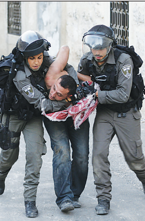
جنديان إسرائيليان يعتقلان شابا فلسطينيا خلال اشتباكات أمس