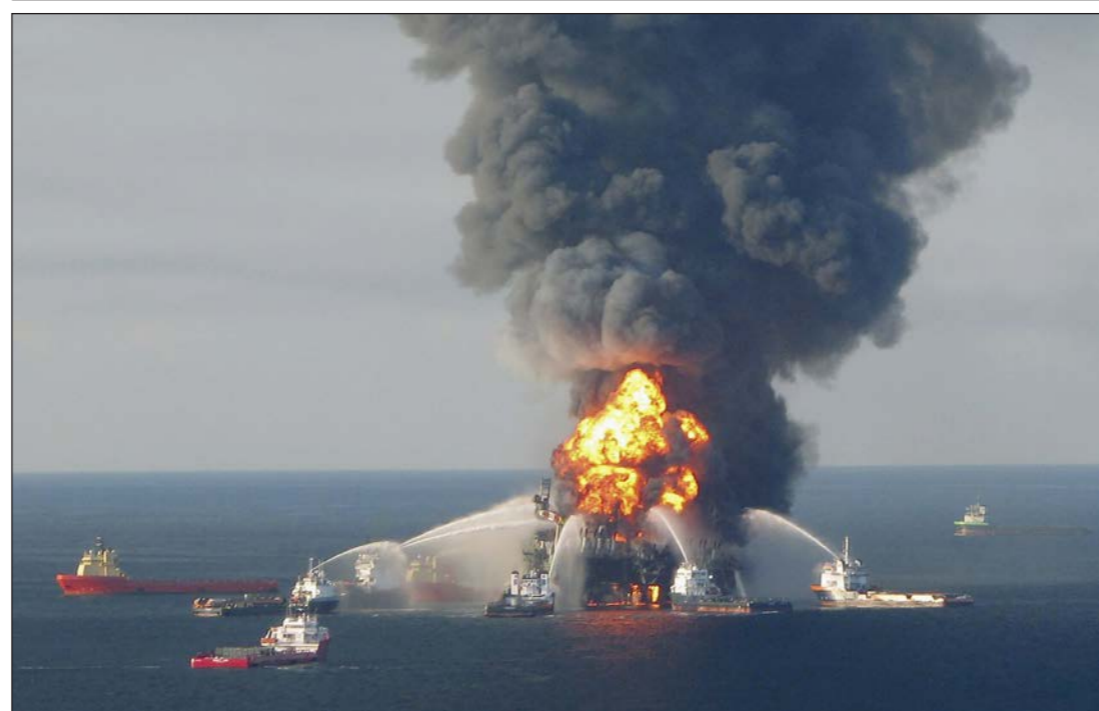
محاولات إطفاء الحريق في منصة «ديبوتر هورايزون»

واشنطن - أ ف ب: أفاد تقرير للبنك الدولي نشر أمس الأول ان نسبة الذين يعيشون تحت عتبة الفقر في العالم ما دون 4% من سكان العالم، الا ان هذه النسبة تبقى «مقلقة جداً» في أفريقيا ما وراء الصحراء. وجاء في هذا التقرير ان نحو 702 مليون شخص سيعيشون هذه السنة تحت عتبة الفقر اي بأقل من 1.90 دولار في اليوم، بعد ان كانت هذه العتبة 1.25 دولار في اليوم، والسبب ارتفاع نسبة التضخم. ونشر هذا التقرير استعداداً لاجتماع الجمعية العامة لصندوق النقد الدولي مع البنك الدولي الاسيوع المقبل في ليمّا في البيرو، في عام 2012، عندما صدرت آخر الأرقام بهذا الصدد، كان عدد الأشخاص الذين يعيشون تحت عتبة الفقر 902 مليون نحو 13 في المئة من سكان العالم. ووصلت هذه النسبة إلى 29 في المئة عام 1999.