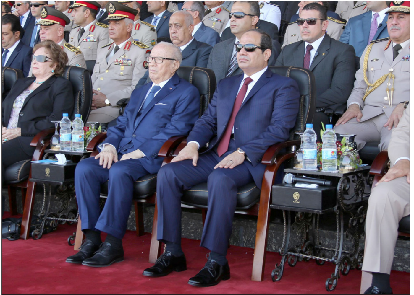
الرئيس المصري عبد الفتاح السيسي ونظيره التونسي الباجي قائد السبسي يشاهدان العرض العسكري في القاهرة أمس

القاهرة - الأناضول: قالت جماعة الإخوان المسلمين في مصر إنهم «ترفض الاحتلال الروسي الإيراني لسوريا»، موجبة انتقادات لدعم السلطات المصرية للضربة الروسية للأراضي السورية. وفي بيان لها مساء الأحد بعنوان «حول غزو المحتل الروسي الإيراني لسوريا»، قالت الجماعة: «في ظل مؤامرة دولية على منطقتنا العربية وشعبونا وهويتنا الإسلامية السنية، تخوض سوريا الأبية ورجالها العظام معركة تاريخية في مواجهة المحتل الإيراني الروسي يتعاون عبد الفتاح السيسي». وأضاف البيان أن «جماعة الإخوان المسلمون تؤكد على موقفها المساند للشعب السوري، وكامل دعمها للشورة الأبية الراقضة للعلوي المجرم بنشار الأسد، وأنها ترفض إجراءات تقسيم سوريا برعاية ملاي إيران وروسيا المجرمة والصهيانية، بغطاء عربي يقوده السيسي». وتابعت: «استمرار هذا الاحتلال الروسي الإيراني لسوريا يعني تآزم الأمور أكثر، ويعني أن تجارب المقاومة في الشيشان وأفغانستان ستتكرر وسيكون وبالها على