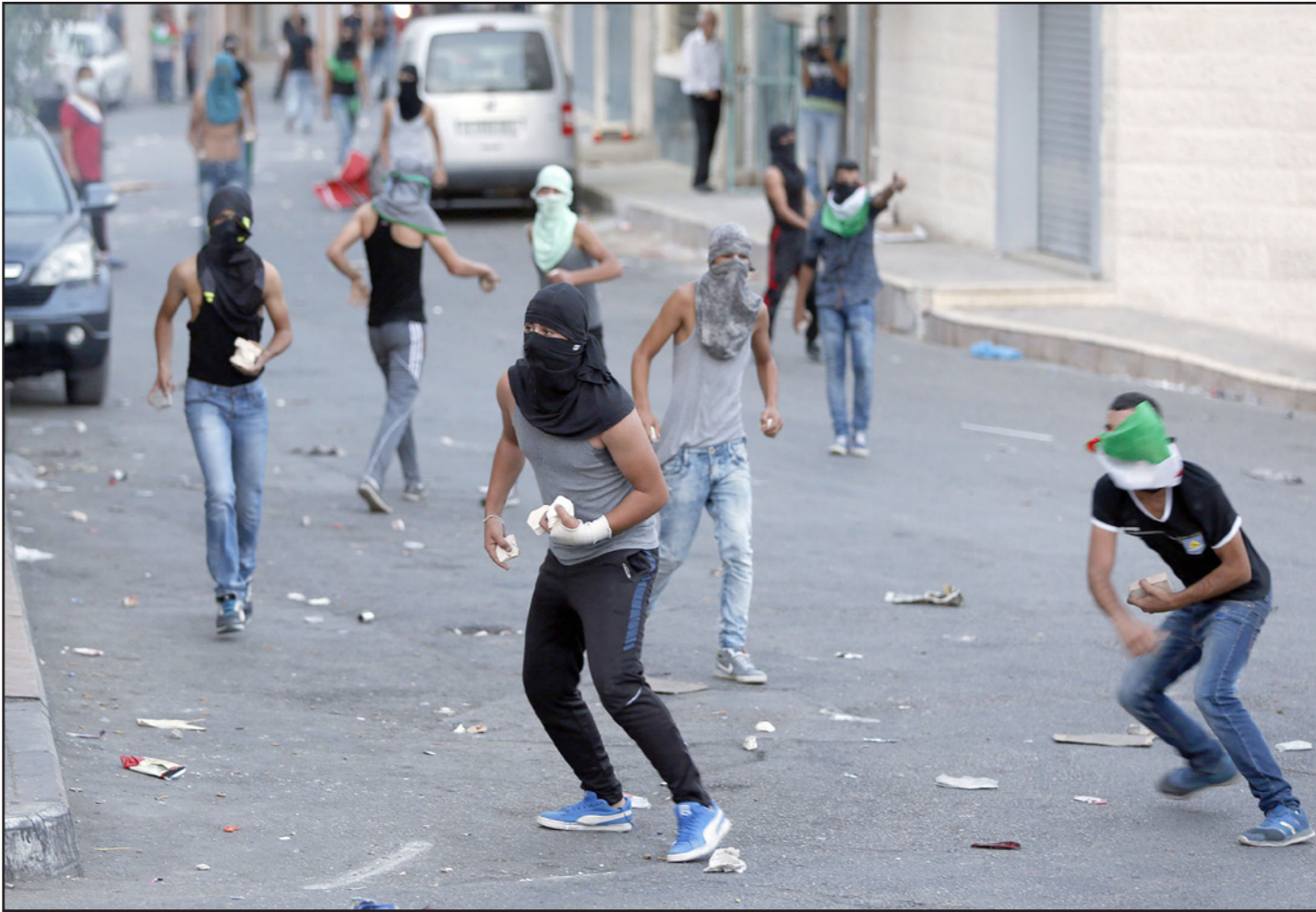
شباب فلسطينيون يلقون بالحجارة على الجيش الاسرائيلي

■ منذ 2009 على نتنياهو مسؤولية لا بأس بها في اليأس، وانعدام الامل، لقد غرق الفلسطينيون في اليأس، وحكومة اسرائيل لم تفعل شيئا، في أي مجال يؤثر على حياتهم، لقد تركتهم يغرقون.