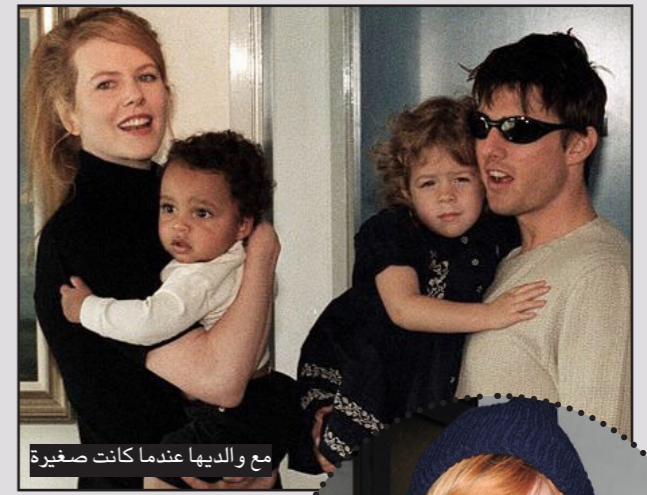
مع والديها عندما كانت صغيرة