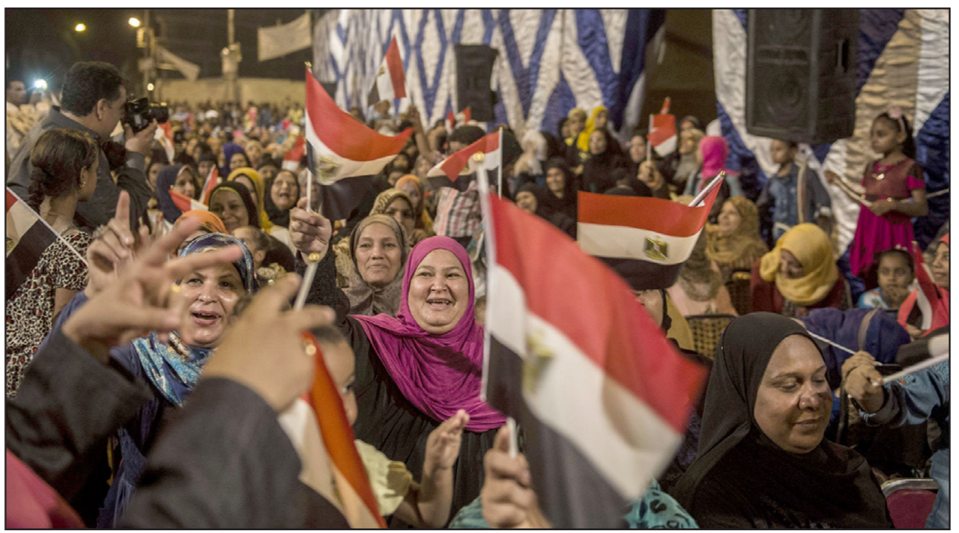
أحد التجمعات الانتخابية في القاهرة أمس

المشاركون اعلاماً مصرية، وصورا تعبر عن انتصارات الجيش المصري، مرددين هتافات من قبيل «تحيا مصر تحيا مصر»، «إسرائيل عدو»، «بالزمان مع الذكرى 42 لحرب أكتوبر / تشرين الأول 1973، والتي تنظم فيها احتفالات رسمية، لاحتفاء انتصار القوات المصرية على إسرائيل». وشهدت العاصمة المصرية مظاهرة معارضة، انطلقت من ميدان «البنان»، رفق خلالها المتظاهرون لافتات أبرزها «إسرائيل عدو»، مذكرين بما أسموه «انتصار جنود مخلصين في حرب أكتوبر». وخرجت مظاهرات معارضة في منطقة «الرمل» في محافظة الإسكندرية (شمال)، ومدنية «البنجات»، في محافظة البحيرة (شمال)، ومدينة بلطيم والحسينية في محافظةني غفر الشيخ والشرقية (دلتا النيل / شمال)، ومدنية بسسالموط في محافظة المنيا (وسط)، بحسب المصادر ذاتها. ورفع المشاركون في المظاهرات العلم المصري واشراوات رابعة، مرددين هتافات مناهضة لإسرائيل والسلطات المصرية وعلاقتها مع إسرائيل. كما شهدت محافظات مصر، فعاليات محدودة من موكبي السلطات المصرية، فنظمت مسيرات للاحتفال بذكرى حرب أكتوبر في كل من محافظة المنوفية (شمال) والمنيا (وسط)، ورفع