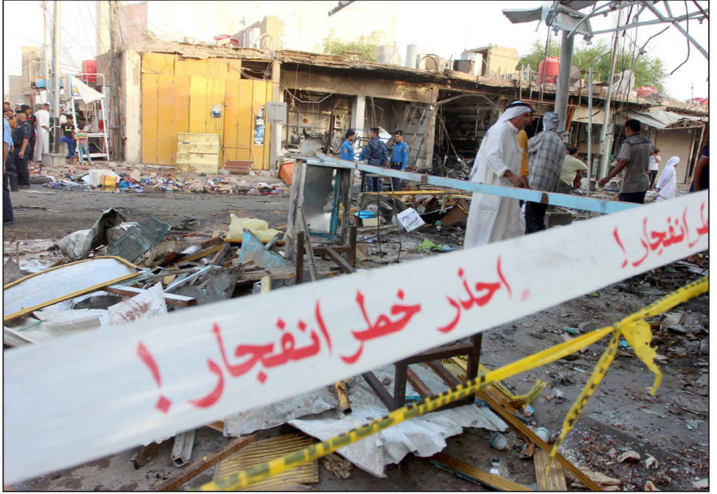
عراقيون في مكان الانفجار في البصرة أمس

وللحكومة العراقية التي يهيمن عليها الشيعة علاقات وثيقة مع إيران، الحليف الرئيسي لروسيا في الشرق الأوسط الأمر الذي يجعل لحالة الاعتقال لموسكو خيارا طبيعيا لقادة الحكومة العراقية، خاصة بسبب امتعاضهم من ضغوط الولايات المتحدة على بغداد من أجل تقديم تنازلات