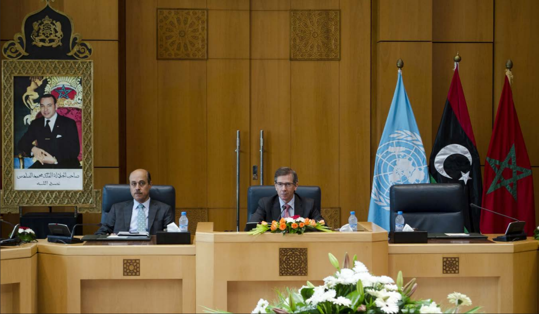
المبعوث الأممي الخاص إلى ليبيا برناردينو ليون في اجتماع الحوار السياسي الليبي في المغرب