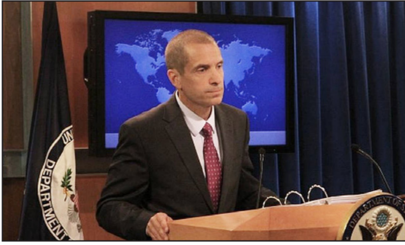
نائب الناطق باسم الخارجية الأمريكية مارك تونر

حول ترحيب الأكراد، السوريين، بالضربات الجوية الروسية فوق سوريا، قال نائب المناطق باسم الخارجية الأمريكية مارك تونر، الاثنين، إن الولايات المتحدة تحترم الأكراد العراقيين في قتالهم ضد تنظيم «الدولة الإسلامية» في العراق. أما عن الغارات الروسية فلقد أوصحنها موقفتنا بكل جلاء منذ أن بدأت تلك الغارات. وقلنا مرارا إننا نرحب بالدور الروسي البناء إذا قررت موسكو مقاتلة تنظيم «الدولة الإسلامية»، ولكن ماشاهدنا حتى الآن ان روسيا لا تشن غارات ضد «تنظيم الدولة». ونسمع كلاما روسيا عن انها تريد قتال «تنظيم الدولة» ولكن روسيا تدخلت في الحرب الأهلية الجارية في سوريا