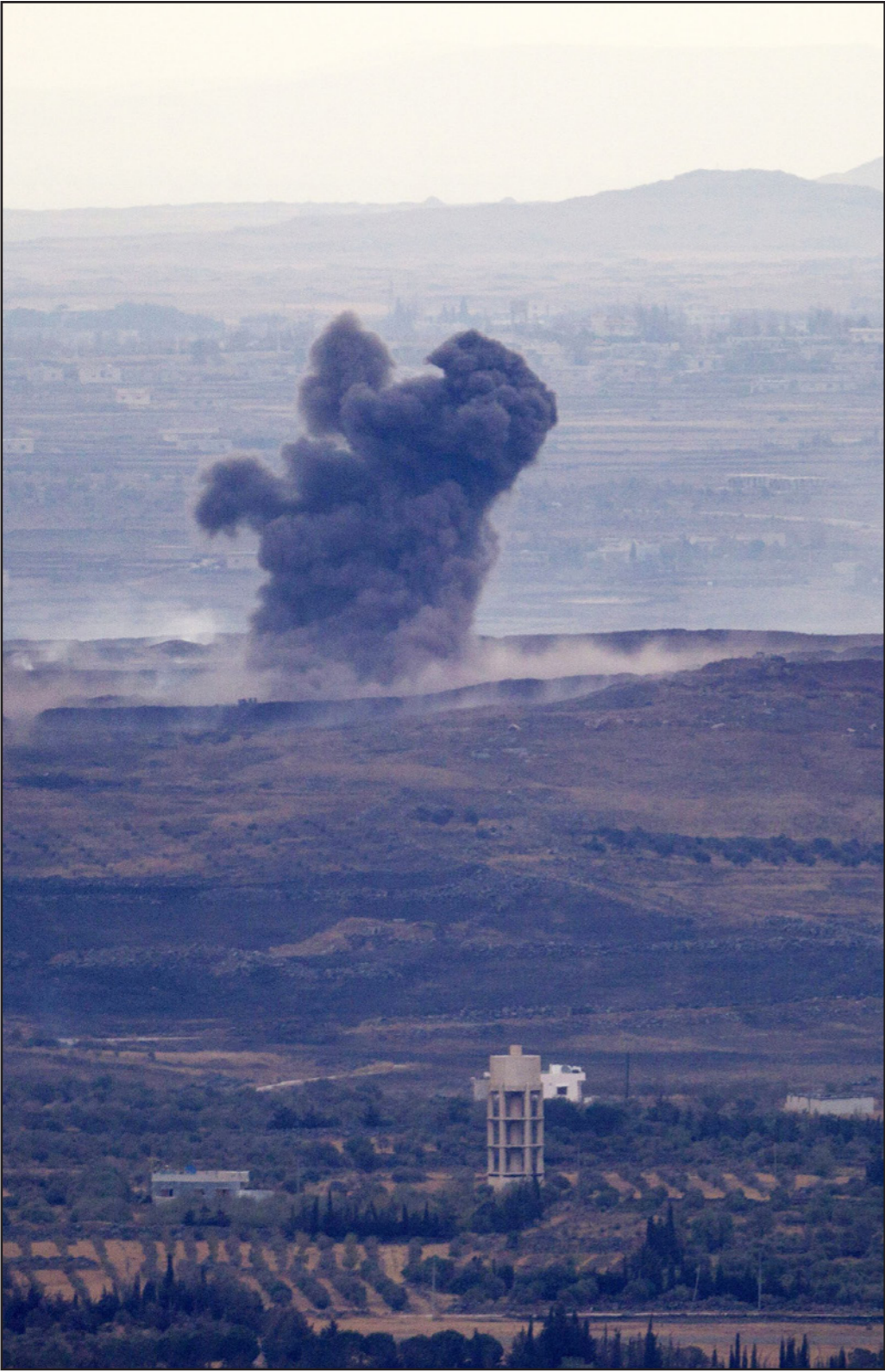
صورة مأخوذة من قرية في مرتفعات الجولان السورية المحتلة تظهر دخان متصاعد زعم أنها تم قصفها من قبل النظام السوري

بان الاختراقات الروسية لأجواء تركيا العضو في الحلف كانت بطريق الخطأ. وبررت، على لسان متحدتها، بان سوء الأحوال الجوية، في سوريا، أدى إلى انتهاك الطائرة الروسية لأجواء التركية. غير أن التلفزيون الرسمي الروسي، وفي نشرة الأحوال الجوية في سوريا، أعدها في الـ3 من تشرين الأول/أكتوبر الحالي، جاءت لتكذب هذه الرواية إذ قالت إن حالة الطقس في سوريا ستكون ملائمة للطيران خلال الشهر المذكور.