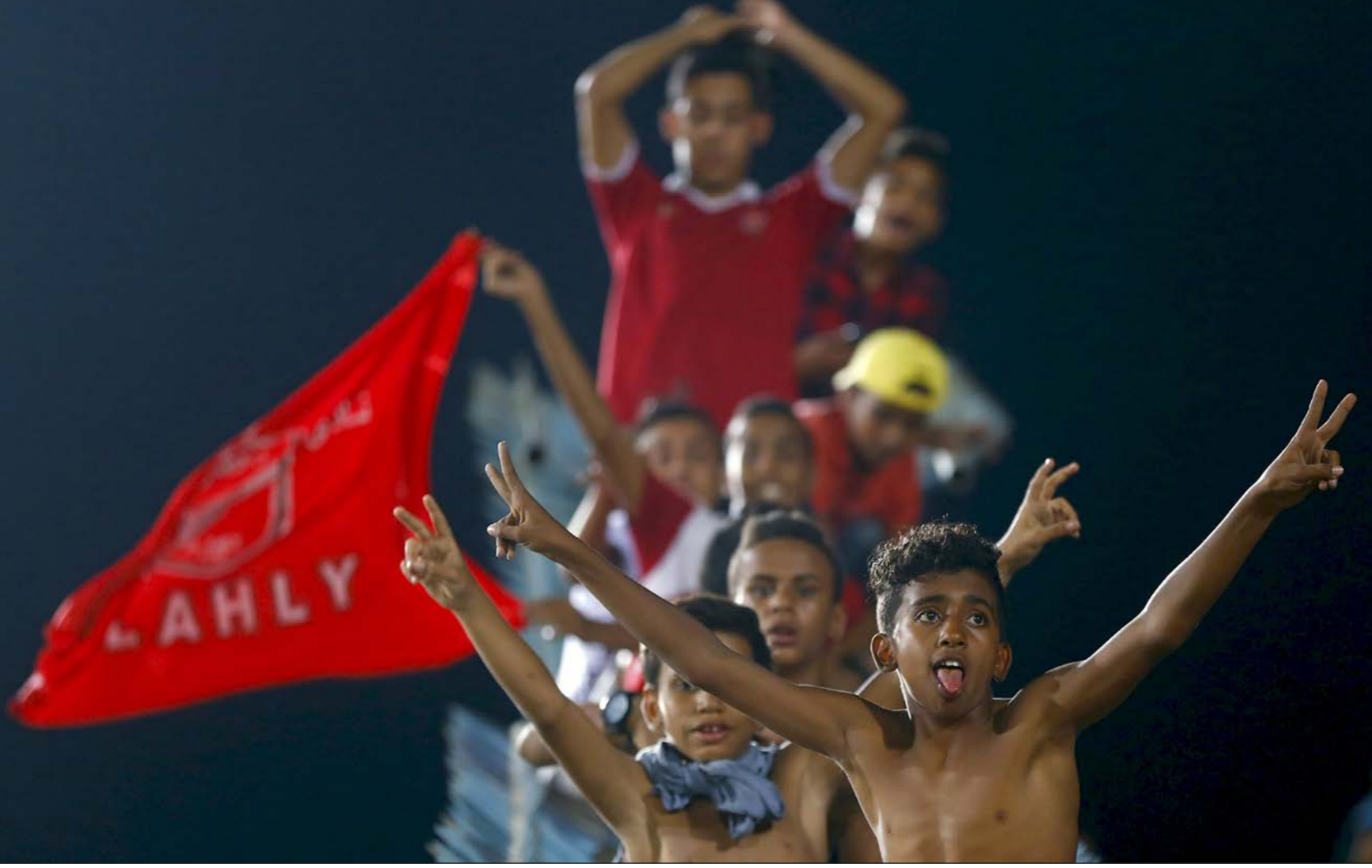
صغار السن من جماهير الاهلي استمروا في تشجيع الفريق رغم الخيبات الاخيرة