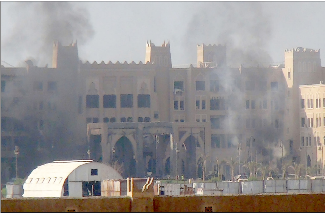
أعمدة المدخان تتصاعد من فندق القصر الذي استهدفته صواريخ الحوثيين وصالح حسب رواية الحكومة اليمنية

وشدد سفير جيبوتي لدى الرياض ضياء الدين باخمره على أن بلاده «تؤيد المملكة ودول التحالف العربي في حربها لإعادة الشرعية إلى اليمن وطردهم الانقلابيين من الحوثيين وقوات علي صالح».