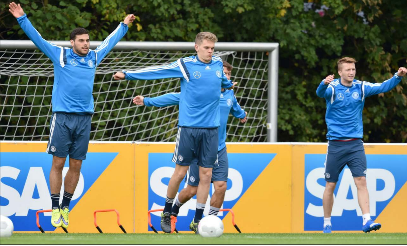
جانب من تدريبات المنتخب الألماني الذي خلا من عدد من نجومه المعتادين

برلين - د ب أ: بعد البداية المتذبذبة التي واجهها المنتخب الألماني بطل العالم في مشواره في تصفيات كأس الأمم الأوروبية (يورو 2016)، يتطلع الفريق إلى كتابة نهاية قوية لشواره بالتصفيات من خلال مباراته المقررتين أمام أيرلندا وجورجيا ضمن منافسات المجموعة الرابعة. ولم يحسم المنتخب الألماني حتى الآن تأهله إلى النهائيات المقررة في فرنسا، بعدما خسر مباراته الثانية أمام بولندا ثم تعادل على أرضه مع أيرلندا في الجولة الثالثة، لكنه حقق صراحة حقيقية بعدها واستطاع التآثر من نظيره البولندي بالفوز عليه 1/3 كما تغلب على اسكتلندا في غلاسغو 2/3، ليصبح الآن بحاجة إلى نقطة واحدة فقط لحسم تأهله وأربع نقاط من المباراتين المتبقيتين للفوز بصدارة المجموعة. وقال المدرب يواخيم: «نرغب في التعامل مع التصفيات بجدية وتحافظ على تركيزنا حتى النهاية، هدفنا هو الفوز بكلتا المباراتين أمام أيرلندا وجورجيا للتأهل إلى النهائيات من صدارة المجموعة». وأضاف: «هؤلاء اللاعبين يخوضون التحديات باستمرار مع أنديةهم في مسابقات الدوري والمنافسات الأوروبية، فهم يتمتعون بإيقاع لعب جيد، إنه توقيت رائع لخوض هذه المباريات الحاسمة بالمجموعة». وكان لوف على دراية بأن الوقت القصير الذي يفصل بين مباريات مسابقات الدوري المحلية مثل مباراة بايرن ميونخ وبوروسيا دورتموند التي أقيمت مساء الأحد، وبين مباراة أيرلندا غدا الخميس، يمثل مشكلة، لكنها ليست بحجم التحدي الذي واجهه المدرب نفسه قبل عام عندما كان مطالباً بإعادة بناء الفريق بدون المعتزّلين فيليب لام وبيير ميرتسكار وميروسلاف كلوزه، وفي ظل غياب