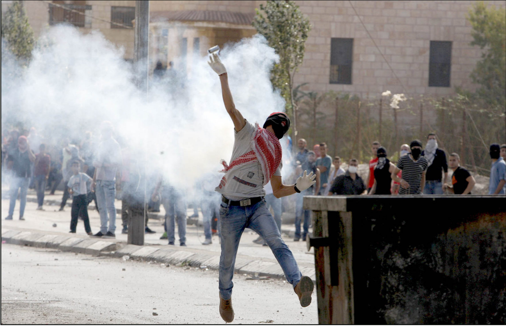
مواجهات بين الفلسطينيين وقوات الاحتلال في معظم نقاط التماس في الضفة الغربية أمس

إلى «النفير العام»، لمواجهة تصاعد جرائم الاحتلال، ومواجهة قرارات حكومته الأخيرة «الإرهابية العنصرية»، ووصفت الجبهة في تصريح صحفي صحافي تلقت «القدس العربي» نسخة منه قرارات ما يسمى بالجلس الأمنى المصغر باتخاذ خطوات مختلفة ضد ما أسماه «الإرهاب»، وفي مقدمتها هدم منازل منغذي العليات، وقيامها بتفجير وهدم عدد من منازل الشهداء بـ«رهاب الدولة المنظم»، ورأت الجبهة في هذه السياسة الإسرائيلية القديمة الجديدة «أسلوباً انتقامياً عقيباً ثبت فشله، وانقلب ضدهم، وزاد من تصميم شعبنا على مواجهة الاحتلال».