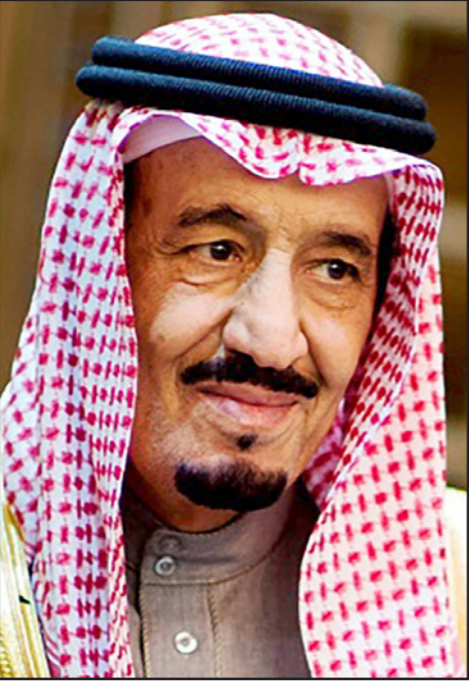
العاهل السعودي الملك سلمان بن عبد العزيز