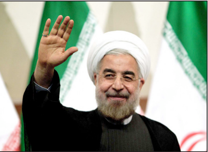
الرئيس الإيراني حسن روحاني

وطالب 4 وزراء إيرانيين في رسالة موجهة إلى الرئيس الإيراني، حسن روحاني، بإجراء تغيير في السياسة الاقتصادية بغية تفادي حدوث أزمة عميقة بسبب تدهور أسعار النفط. وأكد وزراء الاقتصاد والصناعة والعمل والدفاع في رسالتهم أن تدهور أسعار النفط والمنتجات الأساسية خصوصا المعادن وبعض القرارات الاقتصادية والسياسية غير المناسبة داخل البلاد أدت إلى تدهور غير متوقع في بورصة طهران.