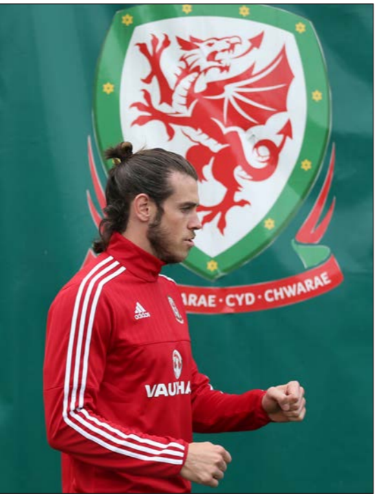
بيل خلال التدريبات مع منتخب ويلز حيث تألق معه في الشهور الأخيرة

كارديف - رويترز: اختار الاتحاد الويلزي لكرة القدم غارث بيل مهاجم ريال مدريد أفضل لاعب في ويلز هذا العام، للمرة الخامسة وهو ما يشكّل رقماً قياسياً. وسجل بيل، الذي خاض 52 مباراة مع منتخب بلاده، الهدف الوحيد في المباراة التي فازت بها ويلز 1-صفر على بلجيكا في كارديف في يونيو/ حزيران الماضي وسجل هدفاً للفوز على قبرص في اللقاء الذي أنهته بانتصار ويلز 3-صفر في سيبتمبر/ أيلول الماضي ضمن تصفيات بطولة أوروبا. ووضع هذا الانتصار ويلز على مقربة من بلوغ أول نهائيات لبطولة كبرى خلال أكثر من 50 عاماً. وخاض اللاعب البالغ من العمر 26 عاماً موسماً رائعاً في أول ظهور له مع الريال حيث سجل هدف الفوز في نهائي كأس الملك وكذلك خاض نهائي دوري أبطال أوروبا. ومع ذلك لم يبل بفترة صعبة في ثاني موسمه حيث خسر الريال لقب دوري الأبطال الذي ذهب لغيره من البرشلونة وكان يتعرض لصحبات الاسترخاء من الجماهير، ونقلت وسائل إعلام بريطانية عن كريس كولمان مدرب ويلز قوله: «انظر إلى العام الماضي سجلت أنه سجل بعض الأهداف الرائعة لنا»، وأضاف: «كافة اللاعبين أدوا بشكل رائع ولكنه ومن وجهة نظري فإنه يستحق تلك الجائزة لما قام به هذا الموسم»، وتحتل ويلز حالي المركز الثامن في تصفيات الفيفا وهو أعلى مركز تبلغه البلاد على الإطلاق. ومع ذلك لا يبدو كولمان راضياً عن فشل الفريق في جذب المنتخبات الكبيرة للعب أمامه في مباريات ودية دولية رغم هذا التقدم الذي تحقق في المستوى. وقال كولمان عندما سئل عما إذا كانت المنتخبات الأخرى تخشى مواجهة ويلز: «لا أعلم... ربما... هذا محبط». وأضاف: «اعتقدنا أن بوسنغا غرأ أسبانيا أو ألمانيا تولى مدى التطور الذي حققناه إلا أن الفرق الكبيرة لم تظهر أي اهتمام بواجبنا».