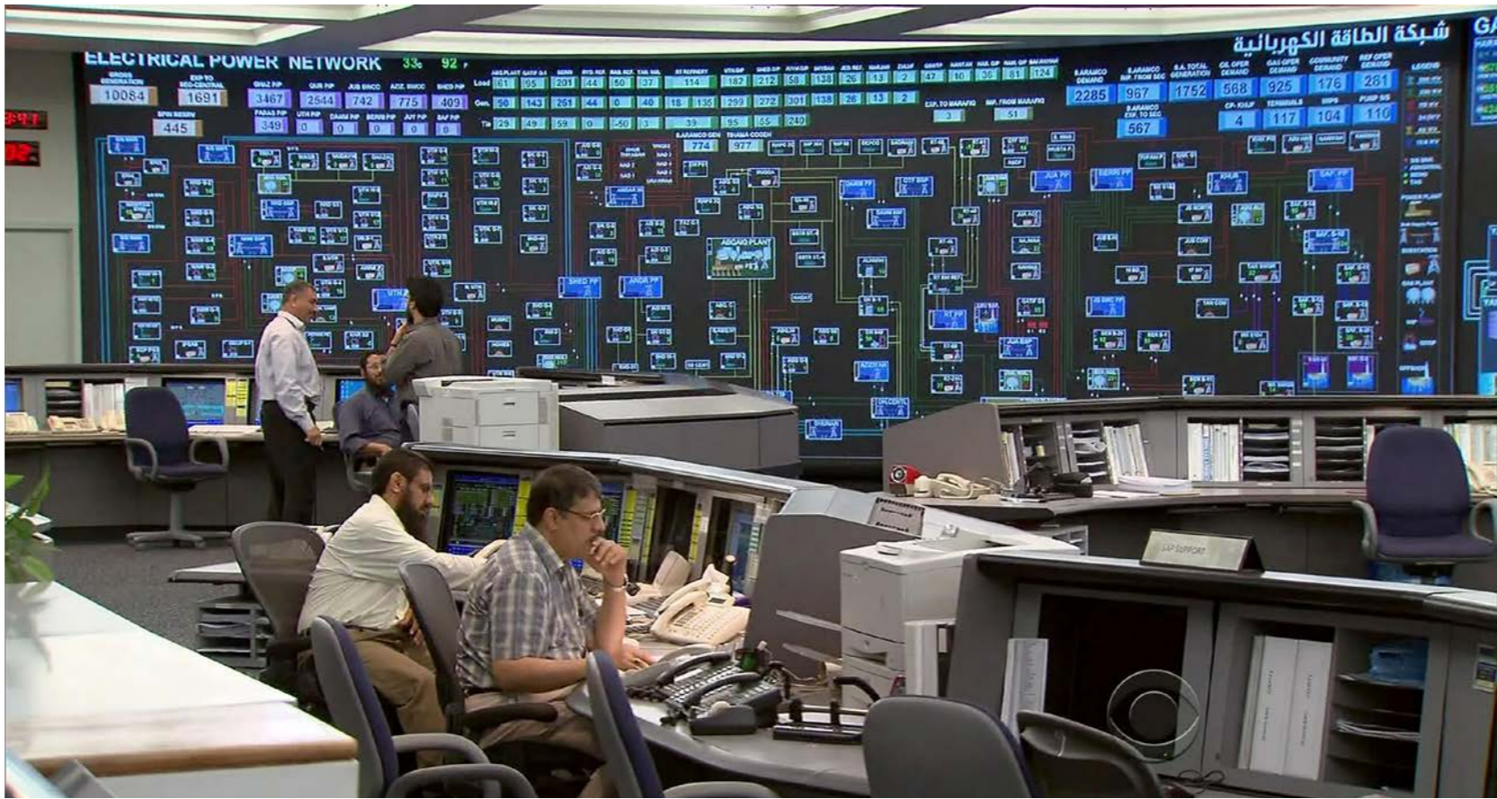
مركز التحكم والسيطرة في المقر الرئيسي لشركة «أرامكو» في الظهر

ليبعب الخام في وقت يزيد فيه المعروض من الدول الأخرى». وامتنتت الشركة السعودية عن التعليق، ولم يتسن الاتصال بممثل للشركة الصينية للتعقيب. وطلبت المصادر عدم الكشف عن هويتها لأن مصفاة ومصنع البترولوكيموايل. وقال أحد المصادر «معظم القيمة بالنسبة لأرامكو تكمن في الصفاة. يتيح ذلك وضعها جيدا للسعودية