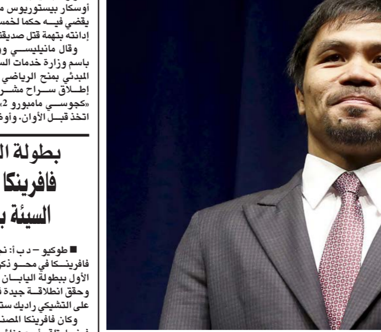
باكيو يتزك عراك الحلبات ليخذل معتزك السياسة

إطار ترشحه لمجلس الشيوخ، والساحة السياسية في الفلبين متعددة الأحزاب وتهيمن عليها منذ فترة طويلة العشائر القوية إلى جانب نجوم السينما والرياضة. وطالما جذبت مباريات الملاكمة التي يشارك بها باكيو، وهو مجند بالاحتياط برتبة ليقتان كولونيل، سكان البلاد. واتخذ مبارياته المتريدين الماويين والمتشددين الإسلاميين الذين يقاوتون القوات الحكومية في الجنوب بعيداً عن ساحات القتال إلى شاشات التلفزيون. وخسر باكيو أكبر جائزة في تاريخ الملاكمة الشهر الماضي أمام الأمريكي فلويد ماويوز. وساهمت المباراة في وصول الاثنين إلى تجرى كل ست سنوات.