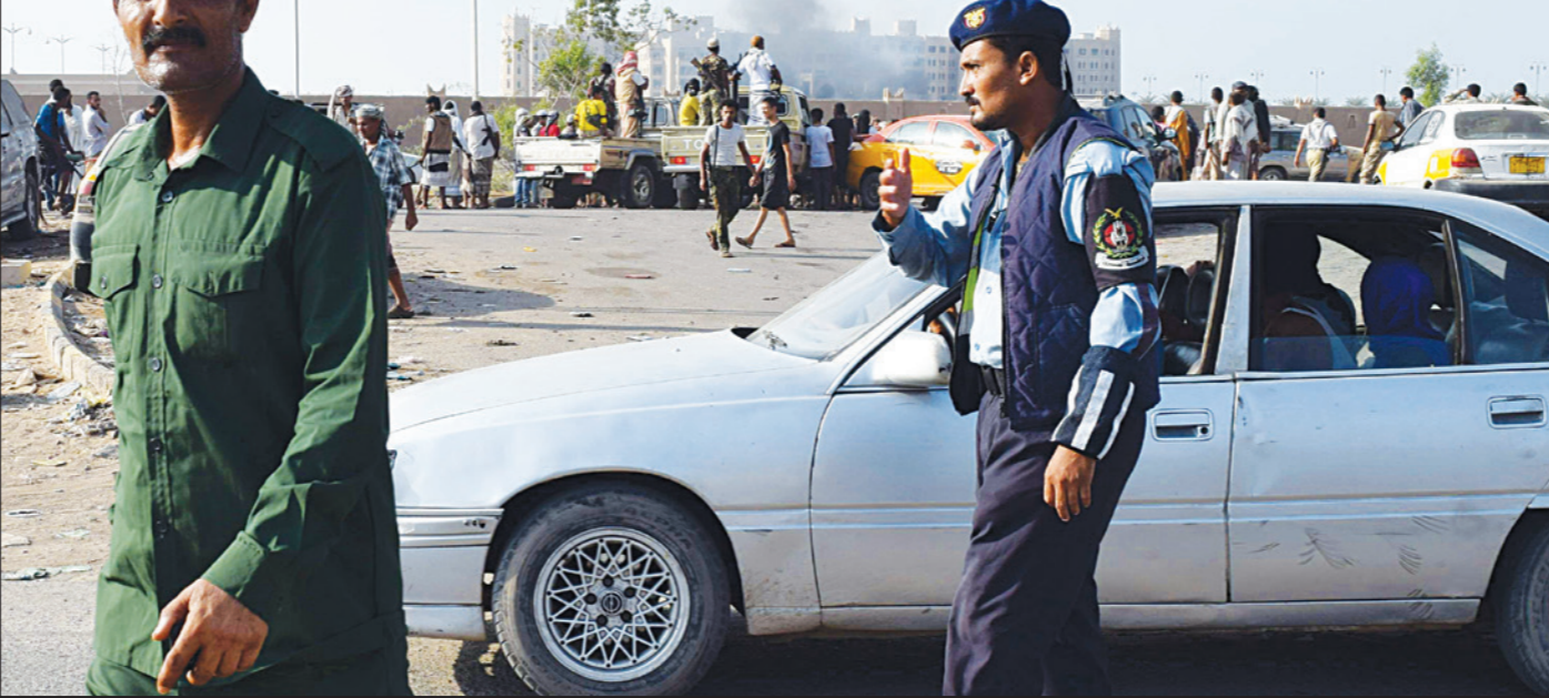
قوات أمن يمنية تحرس قصر شيخ بن فريد (إلى الخلف) والذي يستخدم كقاعدة للقوات السعودية بعيد قصفه بصاروخ أسس

الغدق بعد سقوط الصواريخ على الفندق، مؤكداً أن صالح والحوثيين وراء الهجمات التي يحاولون تغطيتها باسم تنظيم «داعش»، وفي السياق، ذكر المصدر الأمني أن ثلاث سيارات مفخخة استهدفت القصر الجمهوري في مديرية الشعب ومقرين للقيادة العسكرية الإماراتية في مديرية البريقة. (تفاصيل من 10 وراي القدس 23)