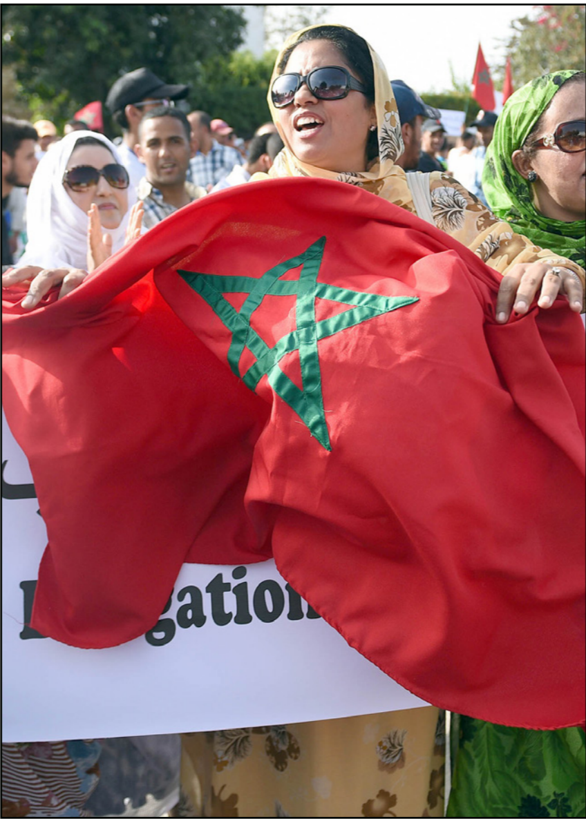
تظاهرة ضد قرار السويد خارج سفارتها في الرباط

بـ«الجمهورية الصحراوية». وخلال اليوم الأول للزيارة التي يقوم بها وفد أحزاب اليسار للسويد تم عقد لقاءات أيضا مع عدد من مراكز الأبحاث في ستوكهولم بهدف تقديم حقيقة تطورات قضية الصحراء، وتقدم المسلسل الذي انخرط فيه المغرب على درب بناء الديمقراطية ودولة الحق والقانون ومن المرتقب أن يلتقي الوفد المغربي، الثلاثاء، برئيس لجنة القدس في البرلمان السويدي، بالإضافة إلى لجنة الشؤون الخارجية في البرلمان السويدي، لشرح الموقف المغربي والمقترحات الأخيرة لبعض الدبلوماسيين المغاربة وقادة الأحزاب السياسية، واشترط تقديم الرباط حججها التي تؤكد أن حكومة ستوكهولم تنوي الاعتراف