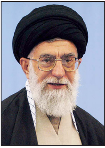
المردش الأعلى للثورة الإيرانية آية الله خامنئي

اجل تقديمها الصناعي، القلق الإيراني من دخول ثقافة اجنبية يجب التعامل معه بعدم التسليم به، الدولة اللقطة لا تمنح تسهيلات على شروط منح الفيزا للسائح الاجانب وقد أعلنت إيران الاسبوع الماضي انها ستسمح فيزا في المطار للزوار لمدة 30 يوم (بالمقارنة مع 15 يوم في السائبر) ومواظني دول أوروبا يستطيعون الاستفادة من هذه التسهيلات، اما مواظني تركيا مصر لبنان سوريا إلى فيزا، فقط مواظني الولايات المتحدة وكندا الاردن العراق وافغانستان وباكستان يحتاجون إلى فيزا في دولهم، وهدف هذه التسهيلات هو زيادة عدد المسافرين من أجل ادخال 30 مليار دولار حتى العام 2025.