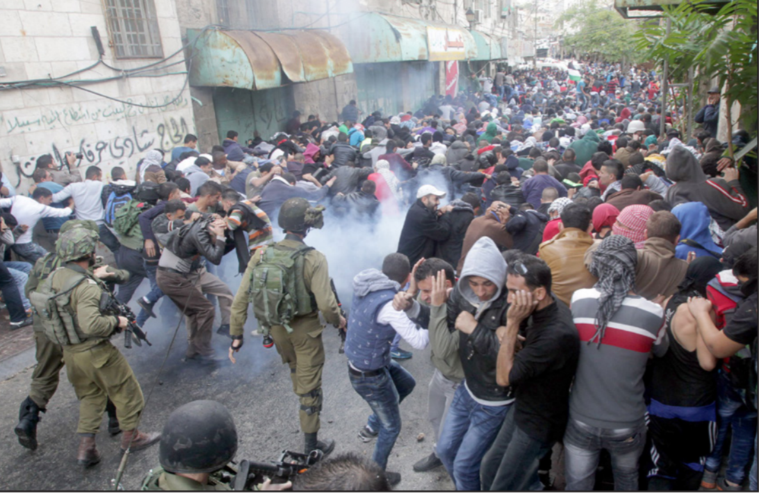
مواجهات بين الجيش الاسرائيلي والفلسطينيين في الضفة الغربية