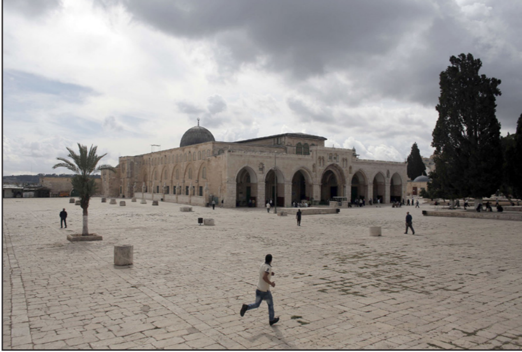
الحرم القدسي الشريف

بانه منذ منتصف ايلول، حين بدأ التوتر حول الحرم، بسد تدهور سريع في العلاقات بين إسرائيل والاردن بلغ في ذروة الازمة إلى وضع من شبه القطيعة التامة بين الطرفين. ام بمعنى قوة الآخرين على أن يتكثروا بتصريحات غير مناسبة.