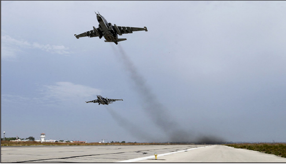
صورة أرشيفية صادرة عن وزارة الدفاع الروسية لمقاتلات سوخوي سو 25 تلعب من قاعدة جوية قرب اللاذقية في سوريا