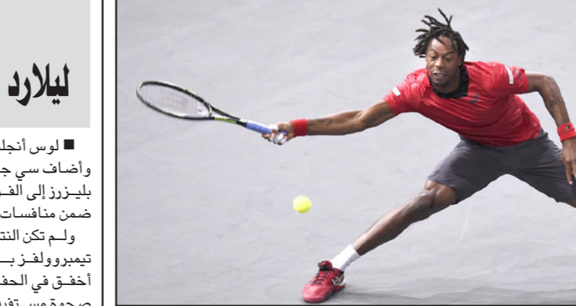
مونفيس خذل مشجعيه وخرج من الدور الأول

لوس أنجلوس - د ب أ: سجل داميان ليلارد 34 نقطة وأضاف سي جيه ماكولوم 18 نقطة ليقدوا بورتلاند تريل بليزرز إلى الفوز على مينيسوتا تيمبروولفز 106/101 ضمن منافسات دوري كرة السلة الأمريكي للمحترفين. ولم تكن النتيجة متوقعة في بداية المباراة حيث تقدم تيمبروولفز بـ 17 نقطة خلال الربع الأول. لكن الفريق أخفق في الحفاظ على تقدمه، وسمح لبليزرز بتقدم صخرة مستقيما من تالق ليلارد الذي قاد الفريق للتقدم بفارق عشر نقاط قبل خمس دقائق و39 ثانية من النهاية. وحافظ بليزرز على تفوقه حتى النهاية ليتلقى تيمبروولفز