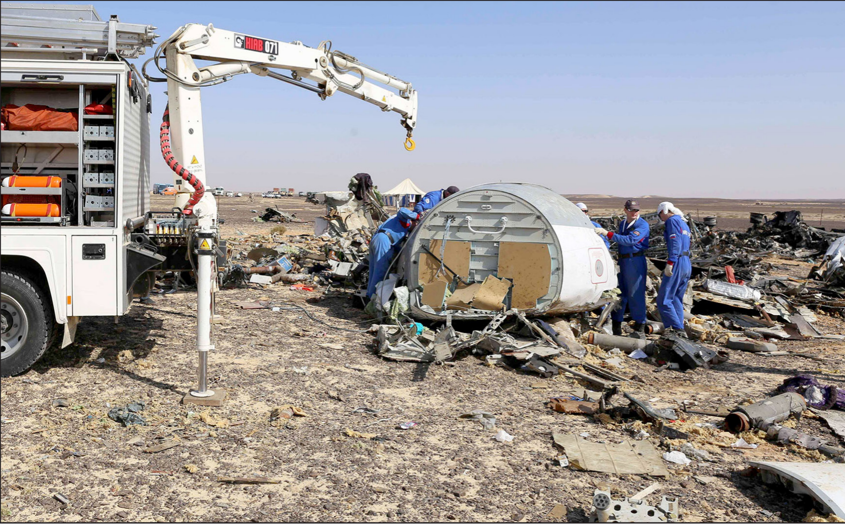
فنيون روس يفحصون حطام الطائرة المنكوبة