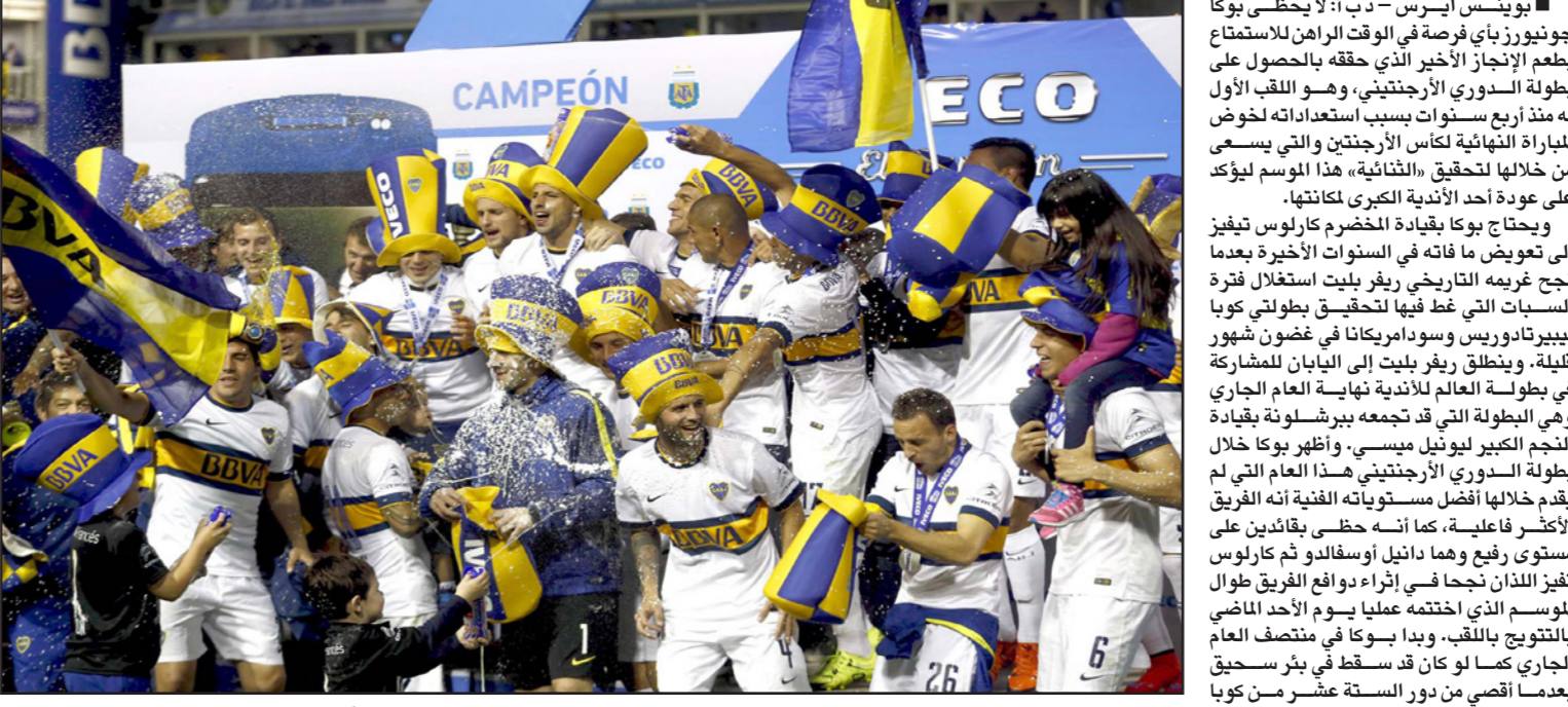
لاعبو بوكا يتحتفلون بلقب الدوري قبل لقاء الليلة في نهائي الكأس

مرة أخرى بعد الليلة الطويلة التي قضاها لاعبو يحتفلون بحصولهم على لقب الدوري استعداداً لمواجهة روساريو سنترال في نهائي الكأس مساء اليوم.