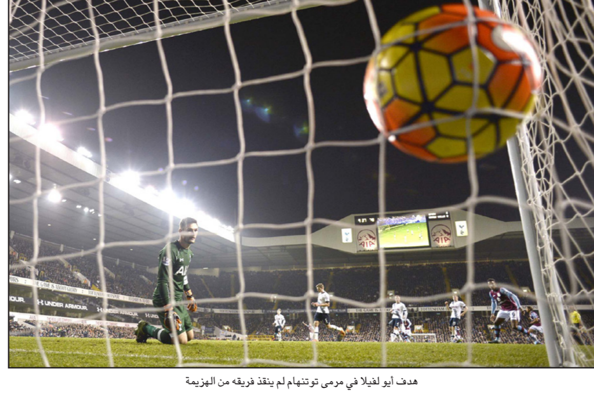
هدف أيو ليفيلا في مرمى توتنهام لم ينفذ فريقه من الهزيمة

وتقدم توتنهام، الذي لم يخسر في الدوري منذ هزيمته في الجولة الافتتاحية أمام مانشستر يونايتد، عن طريق موسى يوديليكو بتسديدة من زاوية صعبة في الدقيقة الثالثة وضاعف نفوقه في نهاية الشوط الأول عندما أطلق ديلبي أي تسديدة منخفضة قوية من عند حافة منطقة الجزاء.