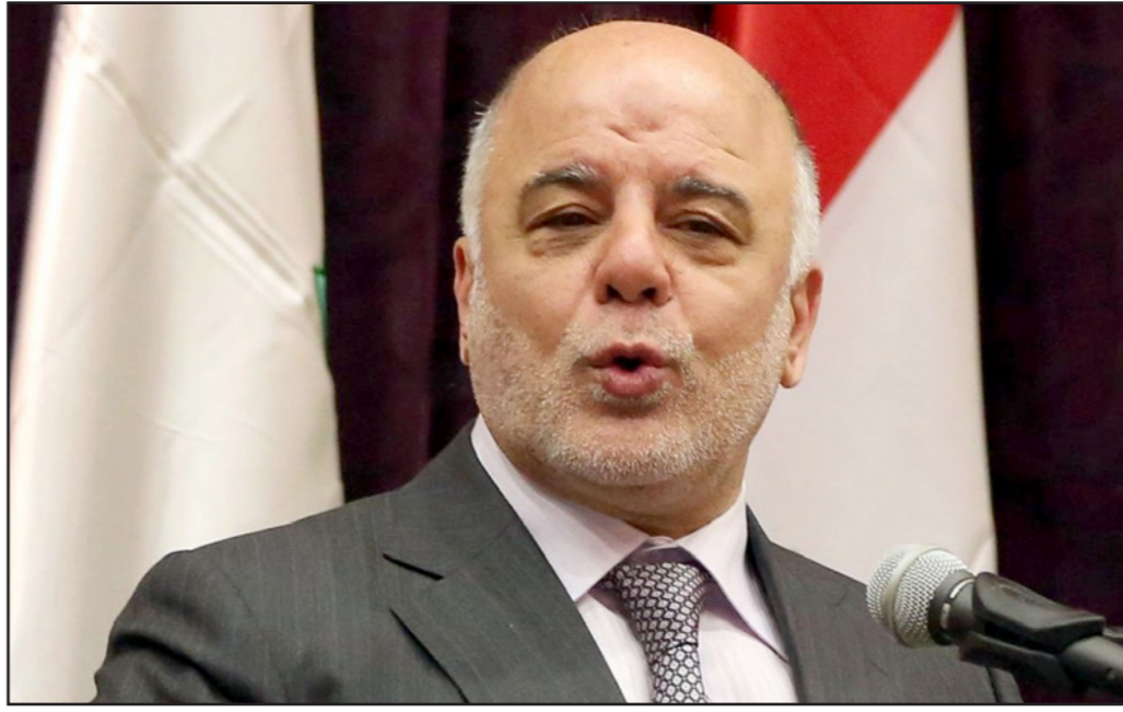
رئيس الوزراء العراقي حيدر العبادي

■ بغداد- أ ف ب: أكد رئيس الوزراء العراقي حيدر العبادي عزمه وإصراره على المضي في الإصلاحات ومحاربة الفساد غداة قرار مجلس النواب الذي وضع قيوداً على تطبيق الحكومة للإصلاحات بمطالبتها بالعودة إليه قبل اتخاذ القرارات. وأعلن مجلس النواب العراقي الاثنين أن الحكومة لا تملك صلاحية تطبيق بعض بنود خطة الإصلاحات التي أعلنها رئيسها حيدر العبادي، كون العديد من هذه البنود تحتاج إلى قوانين من السلطة التشريعية.