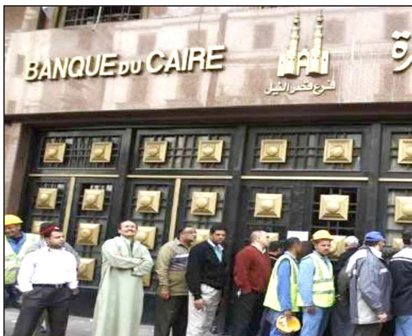
بنك القاهرة فرع قصر النيل

نحو 43 في المئة من المحافظ الائتمانية قبل 10 سنوات إلى 9.8 في المئة الآن، وهناك مخصصات نقدية تغطي حوالي 95 في المئة من هذه النسبة... القطاع يضاى مستوى الأداء والقياسات ونظم العمل المتأخر بها في مجموعة الدول الصناعية السبع ووسط أوروبا،