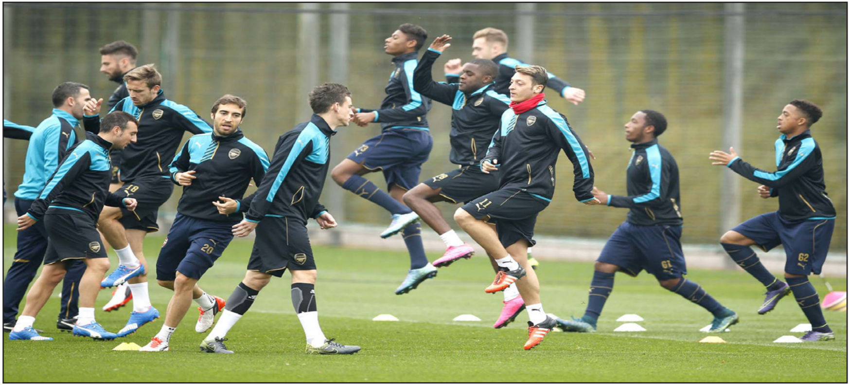
تجموع أرسنال خلال الحصة التدريبية الأخيرة قبل مواجهة بايرن ميونخ الليلة