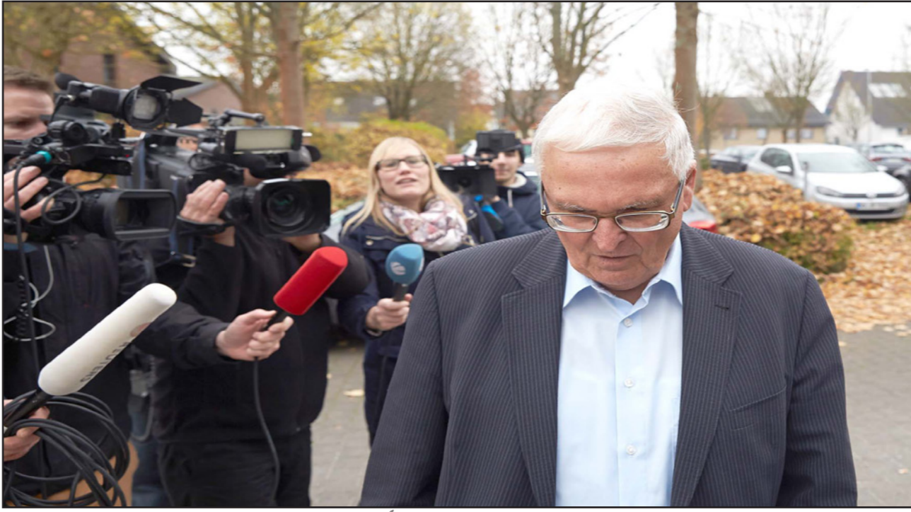
رئيس الاتحاد الألماني السابق زفانتسيغرفر يبدو قلقاً من الحديث إلى الصحافة