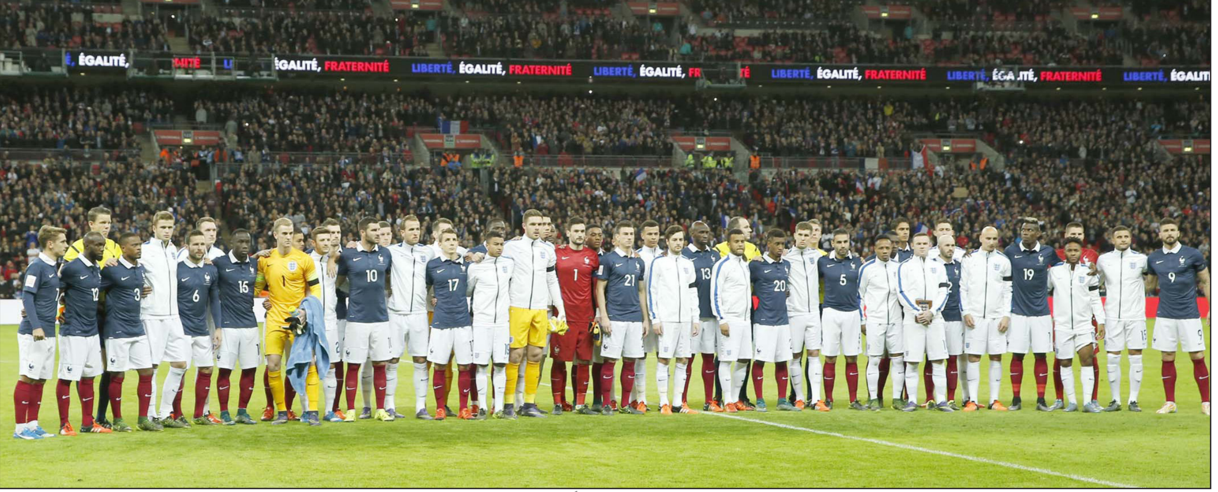
نجوم المنتخبين الإنكليزي والفرنسي اصطفا معاً لينشدا السلام الوطني الفرنسي