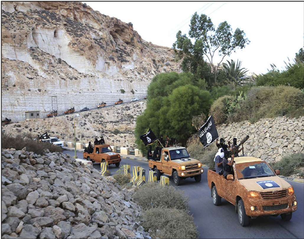
مقاتلون من تنظيم الدولة الإسلامية في ليبيا

تونسي تلقى تدريبات في ليبيا. وأعلن تنظيم «الدولة الإسلامية» مسؤوليته عن الهجومين. وقال الوزير أن التنظيم المنطرف يسيطر على مدينة سرت (شرق) وهو منتشر في مناطق عدة مثل درنة وبنغازي (الشرق). وحذر من أن مدينة «أجدانيا شرق ليبيا قد تصبح الآن معقلاً جديداً للتنظيم المنطرف، موضحاً أنه يبدو أن «سلسلة اغتالات أئمة سلفيين وضباط في الجيش» من قبل تنظيم «الدولة الإسلامية»، تمهد الطريق لهذا التقدم.