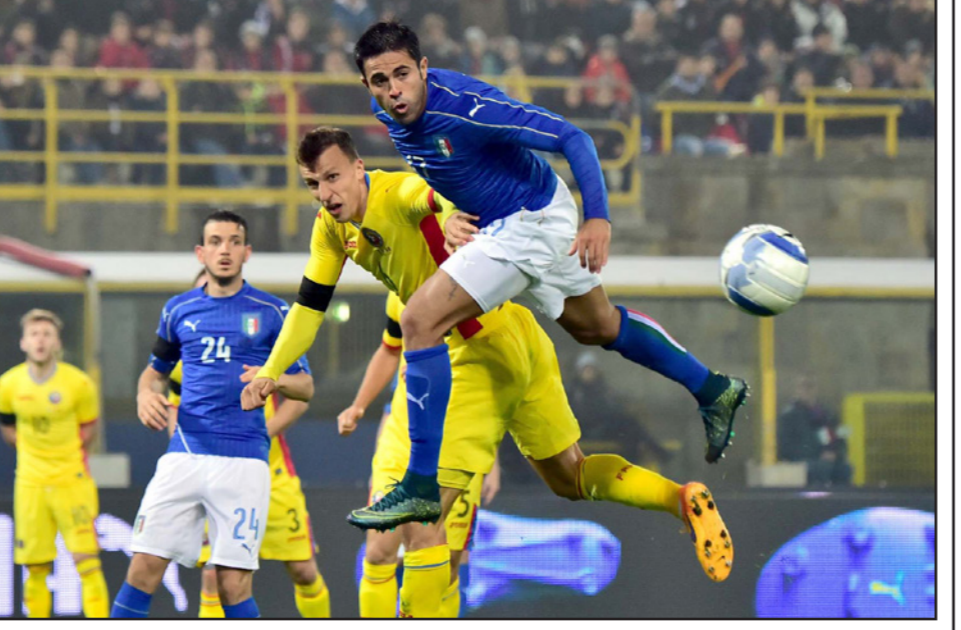
اليطالي ايدر (يمين) يتغدى في كرة عالية مع الروماني تشيريش