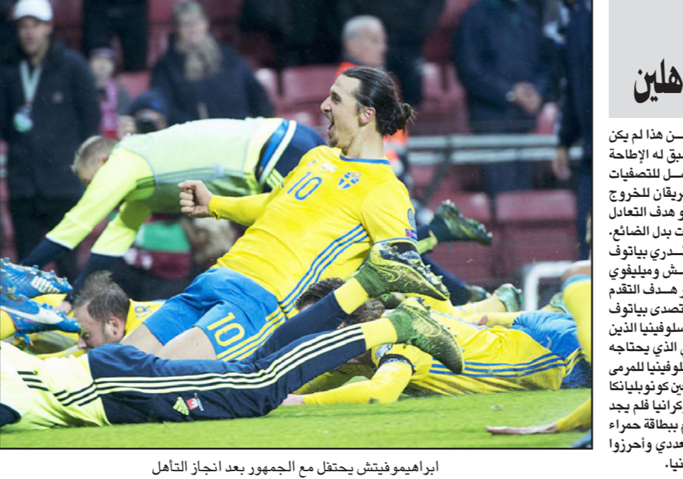
إبراهيموفيتش يحتفل مع الجمهور بعد إنجاز التأهل

برلين - د ب أ: رفضت لجنة الاستئناف في الاتحاد الدولي لكرة القدم (فيفا) طلب الاستئناف المقدم من السويسري جوزيف بلاتر رئيس الفيفا والفرنسي ميشيل بلاتيني رئيس الاتحاد الأوروبي للعبة (يويفا) ضد قرار إيقافهما المؤقت لمدة 90 يوماً عن ممارسة أي نشاط يتعلّق بكرة القدم. وأيدت لجنة الاستئناف قرار الإيقاف الصادر بحق بلاتر وبلاتيني في تشرين الأول/أكتوبر الماضي من لجنة القيم بالفيفا. وجاء إيقاف بلاتر وبلاتيني من الغرفة القضائية بلجنة القيم في أعقاب بدء تحقيقات جنائية في سويسرا مع بلاتر في 25 أيلول/سبتمبر الماضي، وفي إطار التحقيقات السويسرية، طوّل بلاتيني بتقديم معلومات عن مدفوعات بمبلغ مليوني فرنك سويسري صدق عليها بلاتر في 2011 وحصل عليها بلاتيني. وذكر بيان للفيفا أن لجنة الاستئناف «رفضت بشكل قاطع طلب الاستئناف القديم من جوزيف بلاتر وميشيل بلاتيني». وأيدت قرار إيقافهما، وتنظر الغرفة القضائية بلجنة القيم قضية بلاتر ولايسل بإمكانها «تأكيد أو إلغاء أو تعديل قرار الإيقاف المؤقت». وأضاف بيان الفيفا أنه يحق لبلاتر وبلاتيني الاستئناف أمام محكمة التحكيم الرياضي الدولية.