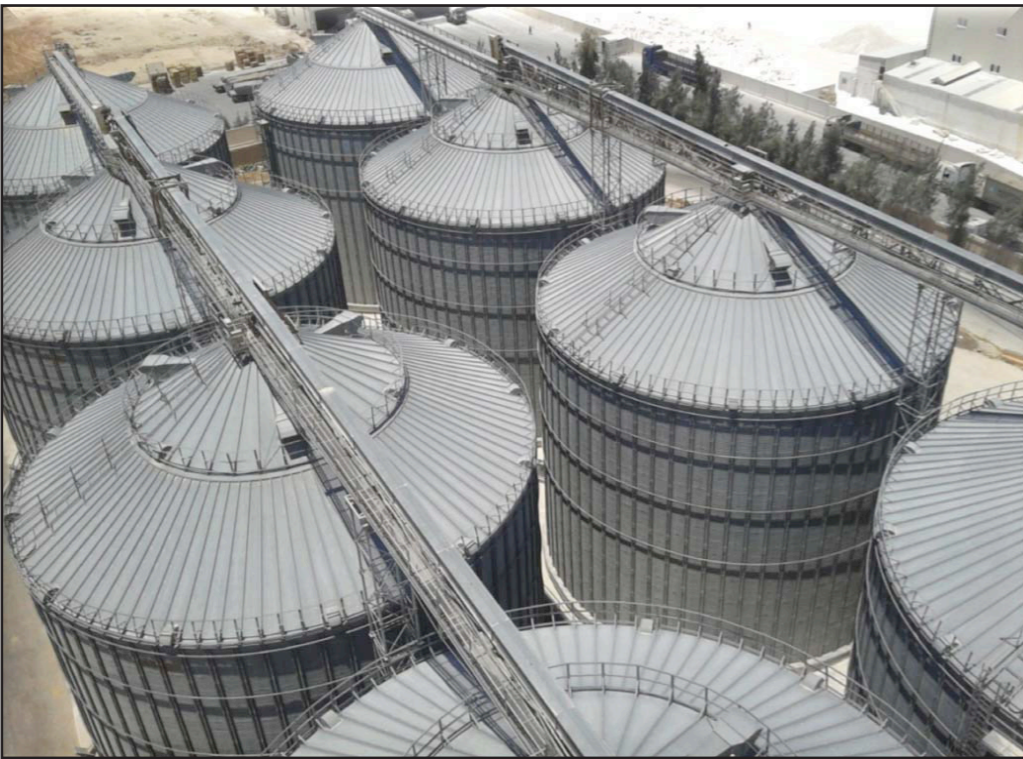
صوامع لتخزين القمح قرب الإسكندرية