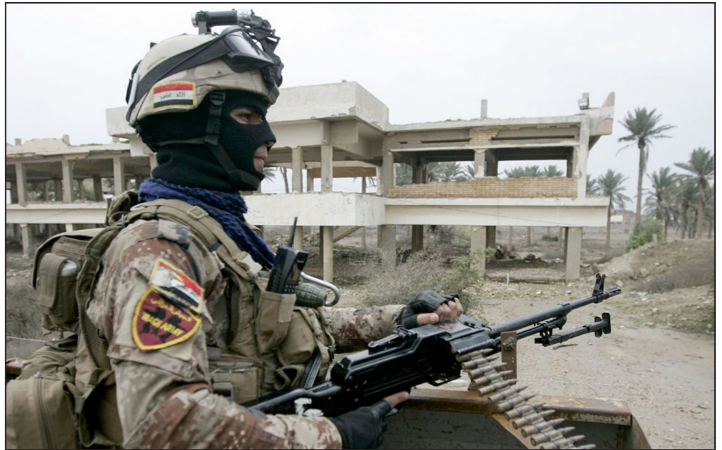
جندي عراقي في سنجر بعد تحريرها من تنظيم «الدولة»