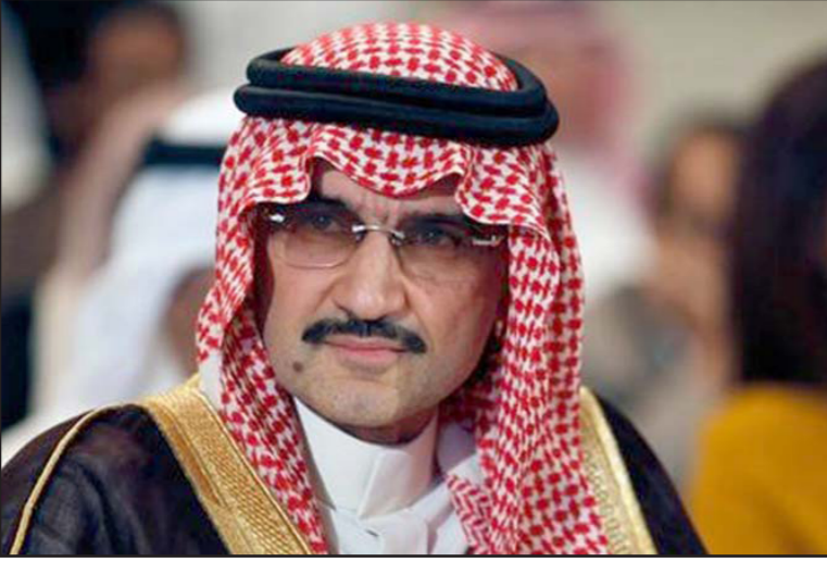
الامير الوليد بن طلال

■ الرياض - أف ب: أعلنت شركة «المملكة القابضة»، المملوكة لبغليبيتها الأمير السعودي الوليد بن طلال، شراء أسهم إضافية في «يورو ديزني» بقيمة 49.2 مليون يورو (52.37 مليون دولار) في إطار خطة إعادة هيكلة رأس المال والتمويل.