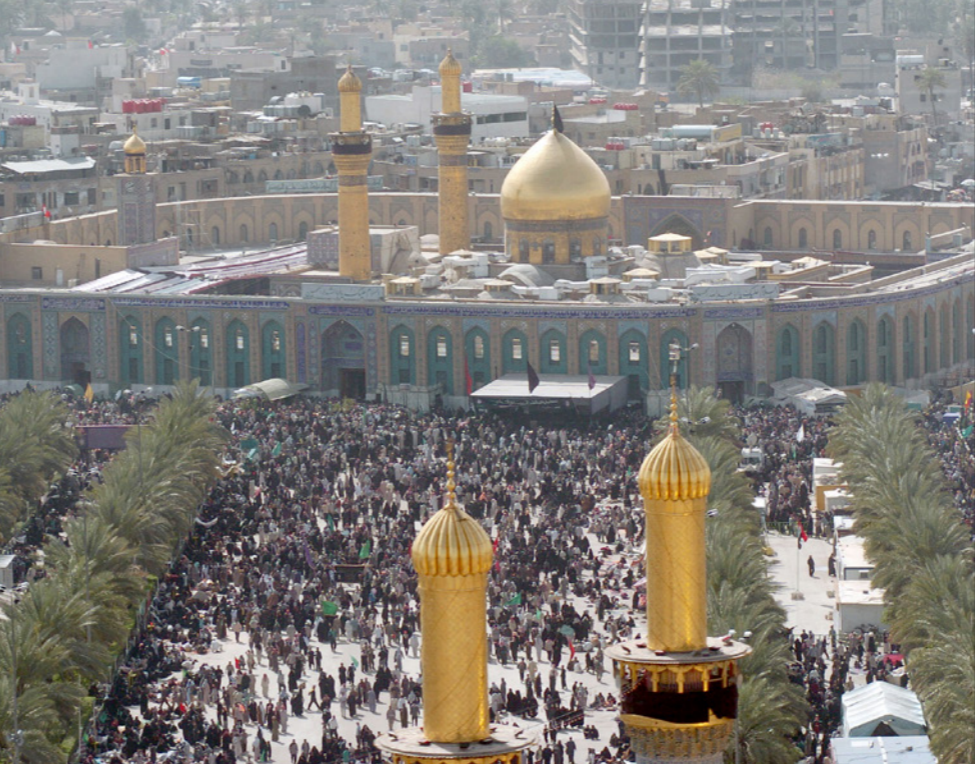
شيعية يحتفلون بارتعابية الإمام الحسين في كربلاء

■ بغداد - الأناضول: قالت فيان دخيل عضو مجلس النواب العراقي، أمس الأربعاء، إن 5830 إيزيدياً فقدوا، فيما قتل 1800 آخرون، منذ سيطرة «الدولة» على مدينة الموصل بمحافظة نينوى شمالي البلاد صيف العام الماضي. وأضافت «دخيل» (إيزيدية) أن «الفي إيزيدي استطاع الهروب من قبضة داعش، أو أطلق سراحه مقابل فدية». وأشارت عضو المجلس إلى أن المقابر الجماعية المكتشفة بعد تحرير قضاء سنجر بنينوى قبل أيام بلغ عددها حتى اليوم 9 مقابر، متوقعة العثور على عدد آخر خلال الفترة المقبلة. ولم يتسنّ التأكد مما ذكرته دخيل من مصدر مستقل. وسيطرت قوات البيشمركة الكردية، التابعة لحكومة إقليم شمال العراق،