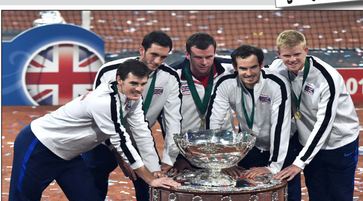
موراي يحتفي مع زملائه بكأس ديفيز بعد أحرازه للفريق البريطاني

■ جنيت (بلجيكا) - د ب أ: فاز البريطاني أندى موراي على البلجيكي نيفيد غوفين 3/6 و5/7 و3/6، ليقود بلاده للتتويج بلقب كأس ديفيز للمرة الأولى منذ 79 عاماً، عقب فوز الفريق البريطاني على نظيره البلجيكي في الدور النهائي. وجاء النجاح أمام 13 ألف متفرج حضروا ملعب فلاندرز اكسبو، ليشهدوا فوز بريطانيا ببطولة الفرق العالمية للمرة الأولى منذ 1936، وأنهى موراي الموسم الأفضل في حياته بتسجيله رقماً قياسياً في بطولة كأس ديفيز بالفوز بـ11 مباراة بدون هزيمة، حيث فاز في ثمانية مباريات خاضها في منافسات الفردي. وانضم موراي للثلاثي جون ماكنروي وماتس فيلاندر ليصبحوا اللاعبين الثلاثة الوحيدين الذين