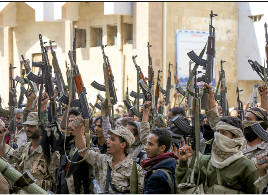
مقاتلون مؤيدون للرئيس عبد ربه منصور هادي في تعز أمس

■ عواصم - وكالات: قتل 16 مسلحاً في اشتباكات في محافظة الضالع بجنوب اليمن بين المتحاربين للحوثيين وحلفائهم، والقوات الموالية للرئيس عبد ربه منصور هادي المدعومة من التحالف العربي الذي نفذ غارات جوية عدة أمس الأحد، بحسب مصادر عسكرية. وقالت المصادر أن 12 مسلحاً من الحوثيين والقوات الموالية للرئيس السابق علي عبدالله صالح، وأربعة مسلحين من القوات الموالية لهادي، وغارات للتحالف العربي (بقيادة السعودية) في جنوب مدينة دم، ثاني كبرى محافظة الضالع الجنوبية، والضالع واحدة من خمس محافظات جنوبية استعادتها قوات هادي بدعم جوي وبري من التحالف في تموز/يوليو. إلا أن الحوثيين استعادوا هذا الشهر، بعض المناطق التي فقدوها في المحافظة، إلا سيما دم. في ذلك، تواصل المعارك في محافظة تعز (جنوب غرب)، حيث بدأت القوات الموالية لهادي في 16 تشرين الثاني/نوفمبر، هجومًا واسعاً لطرد الحوثيين وحلفائهم، إلا أنها تواجه صعوبة في التقدم. وأفادت مصادر عسكرية وطبية عن مقتل ثلاثة مدنيين وجرح 20 جراء إطلاق الحوثيين قذائف مساء السبب على مدينة تعز التي لا تزال تحت سيطرة القوات الموالية، إلا أن الحوثيين يحاصرونها منذ الشهر. وفي صنعاء التي يسيطر عليها الحوثيون منذ أيلول/سبتمبر 2014، شن التحالف غارات «سي الانف منذ أسابيع»، بحسب ضابط مقيم في المدينة.