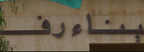
معبر رفح

وواصلت السلطات المصرية أمس إغلاق هذا المعبر لأكثر من 100 يوم متتالية، في الوقت الذي ترتفع فيه أعداد المسجلين من أصحاب الحاجة للسفر، يواصلوا إلى أكثر من 30 ألف مسجل، بينهم آلاف المرضى.