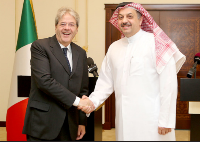
وزير الخارجية القطري الشيخ خالد العطية مصافحاً نظيره الإيطالي في الدوحة أمس

■ الدوحة - الأناضول: أعرب خالد بن محمد العطية وزير الخارجية القطري عن ثقته في أن «تركيا وروسيا ستجدان طريقة للحل السياسي والدبلوماسي» عقب حادثة إسقاط الطائرة الروسية بعد اختراقها للأجواء التركية الثلاثاء الماضي. جاء هذا خلال مؤتمر صحفي، عقده العطية، أمس الأحد، في العاصمة القطرية الدوحة مع نظيره الإيطالي باولو جينيتيلوني، وأعرب خلاله الأخير عن «أمله» (لا يكون هناك تصعيد بين البلدين، «لاقتنا إلى ضرورة احترام الأراضي التركية» وعدم تكرار هذا الاختراق مرة أخرى. وأستقبلت طارتان تركيتان من طراز «إف-16»، مقاتلة روسية من طراز «سوخوي-24»، انتهت المجال الجوي التركي عند الحدود مع سوريا في ولاية «هطاي» (جنوب)، الثلاثاء الماضي، وذلك بموجب قواعد الاشتباك المعتادة دولياً، وقد وجهت المقاتلتان 10 تحذيرات للطائرة الروسية خلال 5 دقائق، قبل أن تسقطها. وسبق أن انتهكت طائرات حربية تابعة لروسيا، الأجواء التركية مطلع تشرين أول/أكتوبر الماضي، واعتذر المسؤولون الروس آنذاك عن ذلك مؤكداً حرصهم على عدم تكرار مثل تلك الحوادث مستقبلاً، في حين حذرت تركيا من أنها ستطبق قواعد الاشتباك التي تتضمن رداً عسكرياً ضد أي انتهاك لجبالها الجوي.