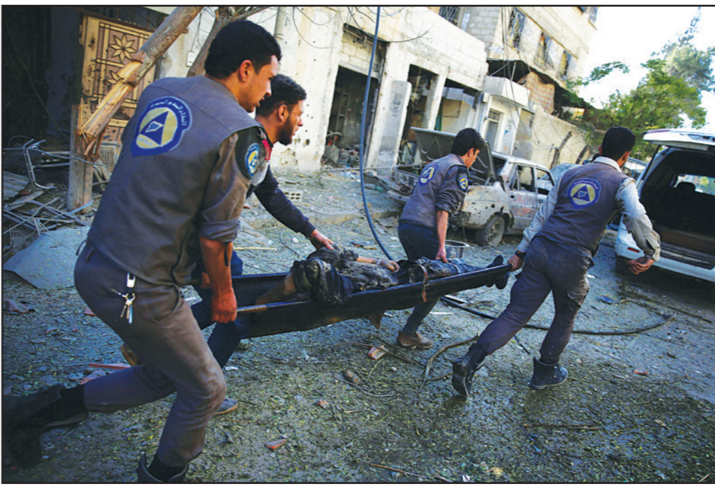
عناصر دفاع مدني في بلدة دوما يحملون مصابا بعد غارة لقوات النظام أمس

■ دمشق - وكالات: أعلنت الحكومة السورية عن مقتل 40 مدنيا وأصيب عشرات آخرون بجروح مختلفة، صباح اليوم الاثنين، بعد غارة لقوات النظام على بلدة دوما شمالي سوريا.