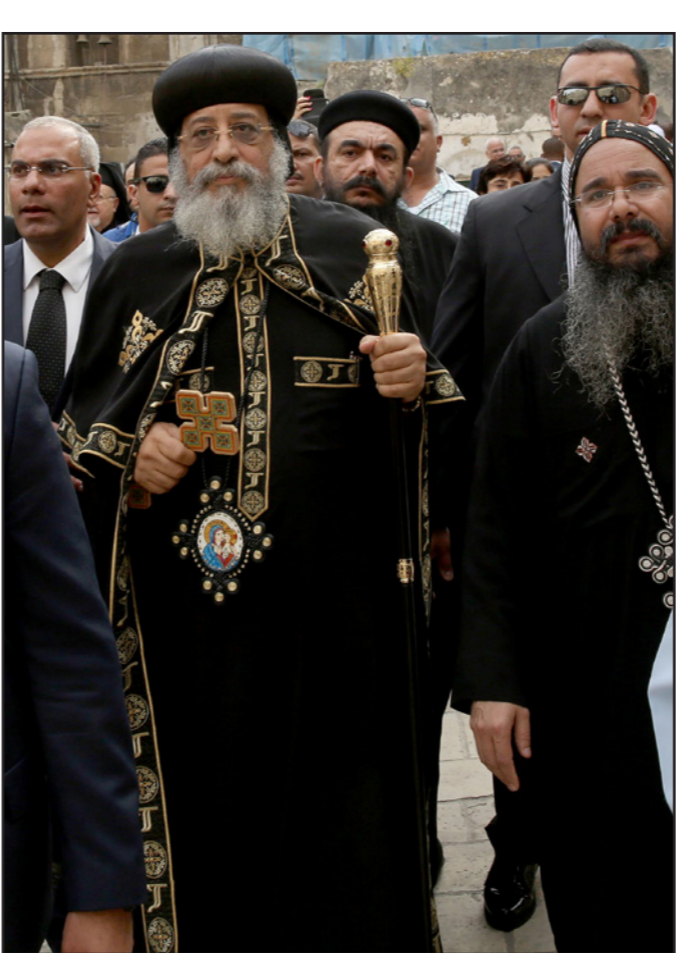
البابا تواضروس الثاني

مباشرة إلى تل أبيب، بعد توقف شركة طيران «العال» الإسرائيلية، التي كانت تنظم رحلات من القاهرة إلى تل أبيب منذ شهور بسبب خسارتها المالية.