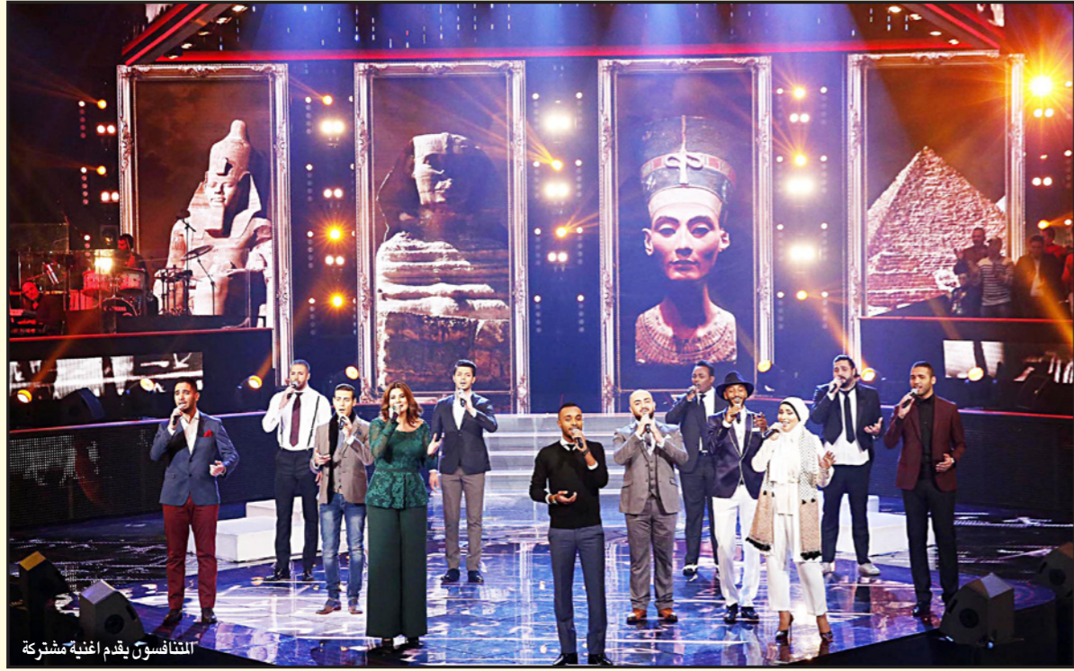
الشيرين تقدم أغنية عشقك