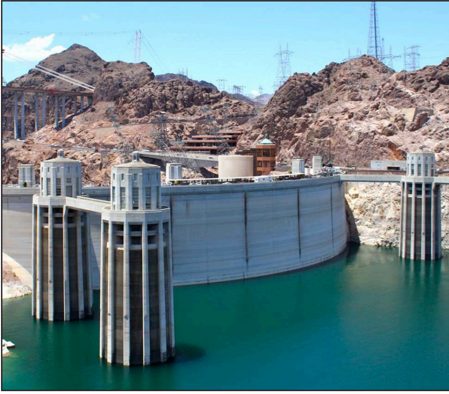
جزء من سد قيد البناء... وكل لمن سكنون هناك مياه كافية للثمة؟

■ هل سيحتلم العالم لفترة طويلة آثار ارتفاع حرارة الجو الحالي، ما العمل لتحسين الأمن العالمي؟ ■ هذه المشاكل مستند إلا إذا تم التحسب لها بشفقة جيد، يجب التفكير باليات تعاون. على سبيل المثال بشأن المياه، فقير ما لهذا المورد أهمية حيوية لاحظنا تاريخيا أن البلدان كانت تميل بالأحرى إلى التعاون. والجزر المهددة بالغرق قلقة لا تستصبح عليه مياهها الإقليمية التي تحدد قياسا إلى المسافة من الشاطئ. لكن يمكن ترسيم هذه الحدود مع إحدائيات جغرافية أخرى.