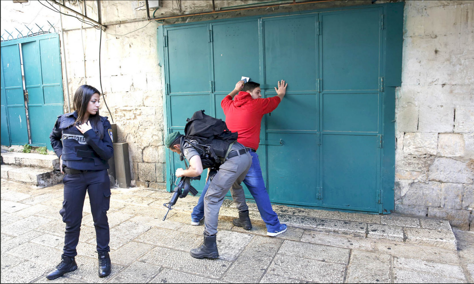
جندي إسرائيلي يفتش شابا فلسطينيا في البلدة القديمة في القدس المحتلة أمس

بشدة إقدام جيش الاحتلال على إغلاق إذاعة «دريم» في مدينة الخليل، وهي ثالث إذاعة يغلقتها الاحتلال ويستولي على أجهزة البث التابعة لها في المدينة بعد إغلاق إذاعة «الخليل» و«الحرية» ومنعها من البث. وقالت المتحدث باسم الحكومة إيهاب بيسيسو «إن استهداف سلطات الاحتلال لوسائل الإعلام الفلسطينية من أجل قمع حرية التعبير والحقيقة ومنع نقل الرسالة الفلسطينية هو جزء من مسلسل الاعتداءات والانتهاكات الإسرائيلية المتواصلة بحق شعبنا وأرضه وممتلكاته والتي ترتكب على مرأى ومسمع من العالم بشكل يخالف كافة الأعراف والاتفاقات الدولية».