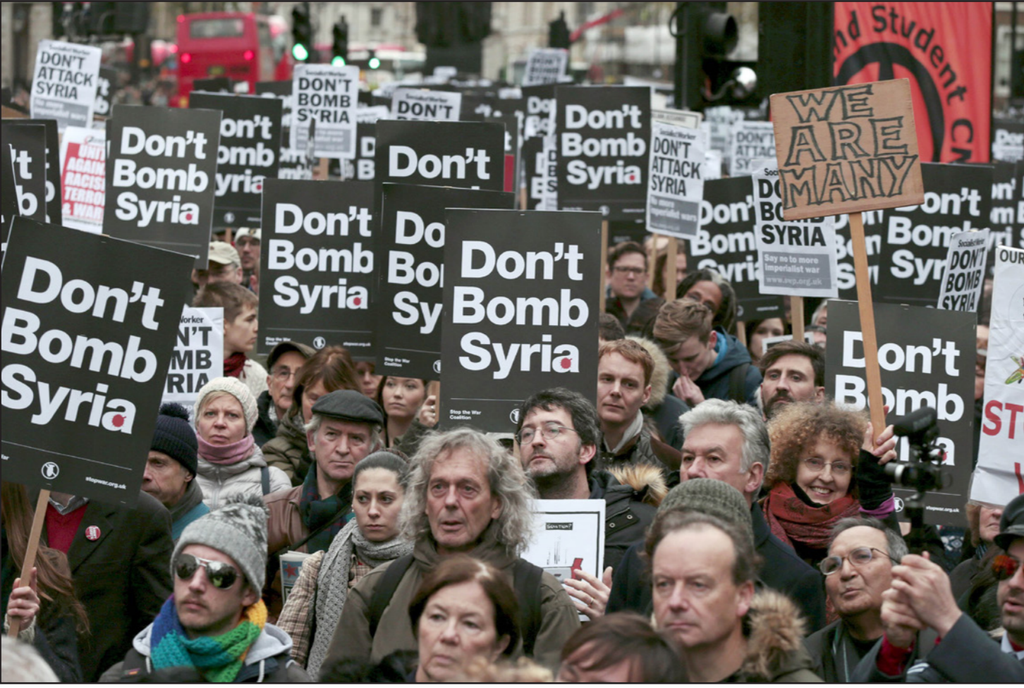
تظاهرة في لندن ضد خطة كاميرون لضرب سوريا