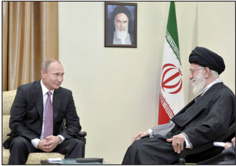
خامنئي التقى بوتين في طهران

نفس الوقت عملت أيضا، وبنجاح، على اشراك إيران في الخطوات الدولية التي تستهدف ايجاد حل سياسي في سوريا. والدليل على ذلك - ضم إيران إلى المحادثات التي جرت في هذا السياق في فيينا في بداية الشهر. وحياجالتشأن السياسي والعسكري المتزايد لروسيا بالنسبة لسوريا، يبرز على نحو خاص طهران الاسبوع في مستوى تدخل الولايات المتحدة في هذه الجسات، فوزير الخارجية، جون كيري، وان كان جلس إلى جانب وزير الخارجية الروسي لافروف على رأس المحادثات في فيينا، ولكن دون أن يترك الانطباع بان أمريكا هي التي تقرر الخطوات، كما ان الرئيس براك اوباما يواصل الحديث،