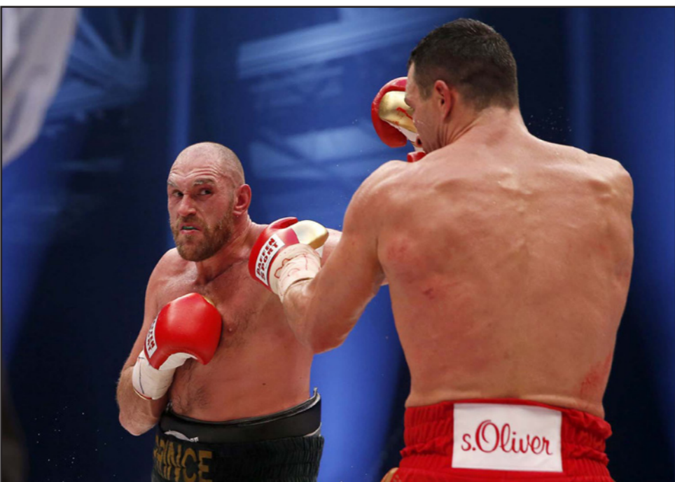
فيوري يوجه لكمرة قوية الى وجه كليتشكو

■ بوطنبي - د ب أ: توج الألماني نيكو روزبيرغ سائق فريق مرسيدس بسباق جائزة الإمارات الكبرى آخر سباقات الموسم الحالي في بطولة العالم لسباقات فورمولا 1، ليتوج بالسباق الثالث على التوالي. وقال روزبيرغ: «لقد كان مضمار وأوقف روزبيرغ، الذي حصل على المركز الثاني في ترتيب السائقين، مسلسل انتصارات زميله في الفريق لويس هاميلتون الذي توج باللقب هذا العام للمرة الثانية على التوالي والثالثة التي يمكن أن يبدأ من الغد بالنسبة لي. أنا الذي سحجته إلى عطلة». وبدد ثالث انتصار على التوالي يحققه روزبيرج بعد انطلاقه من المقدمة لسداس مرة على التوالي أيضاً أمال هاميلتون في