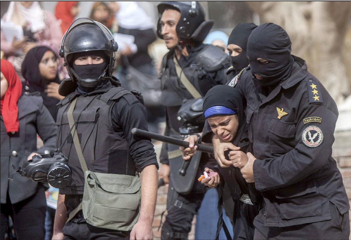
غضب من عنف الشرطة الذي يتسبب في موت مواطنين