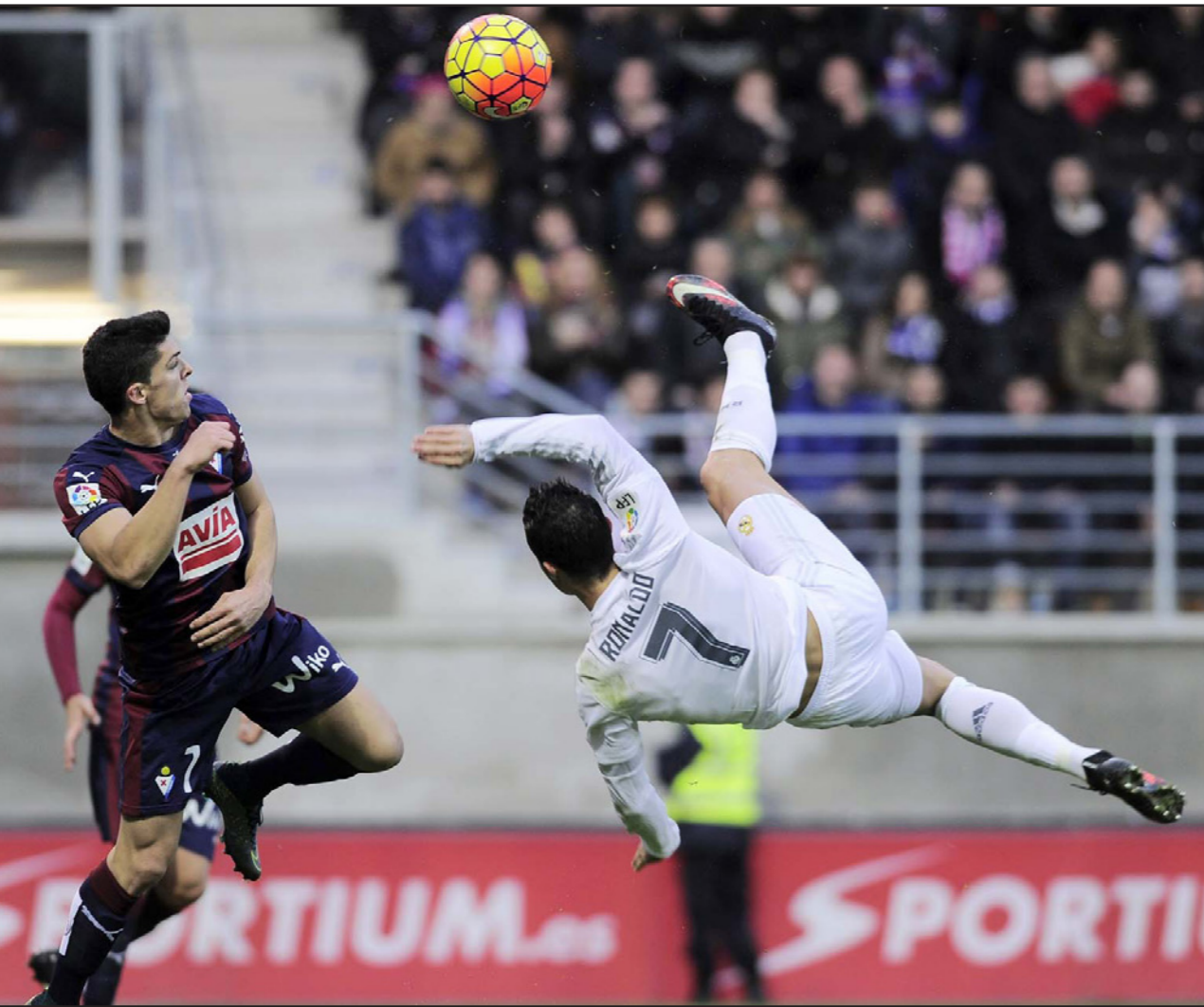
محاولة أكروباتية من نجم الريال رونالدو للتصدي في مواجهة مدافع إيبار كايا