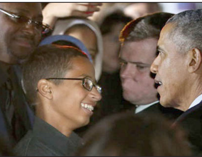
الرئيس الأمريكي باراك اوباما اثناء تكريمه الطفل السوداني مخترع الساعة

ومن أجل تحقيق هذا الهدف كان عليهم مواجهة أربعة تحديات: الأول، إنشاء دول سويدية مع أجهزة ومؤسسات ناجحة تعتمد على المواطنين الذين يتشاركون فيها. الثاني، تطوير قدرات إنتاجية تكنولوجية من أجل المنافسة على المستوى الدولي من ناحية اقتصادية. الثالث، وضع الإسلام في إطار يغذي الجمع بالقيم مثل الهوية والتضامن وعلى نفس الوقت تحييد القوات المنيقة التي تسعى للعودة إلى الوراء. الرابع، التخلص من تأثيرات الكولونيالية الغربية والعمل في الساحة الدولية كلاعبين مستقلين.