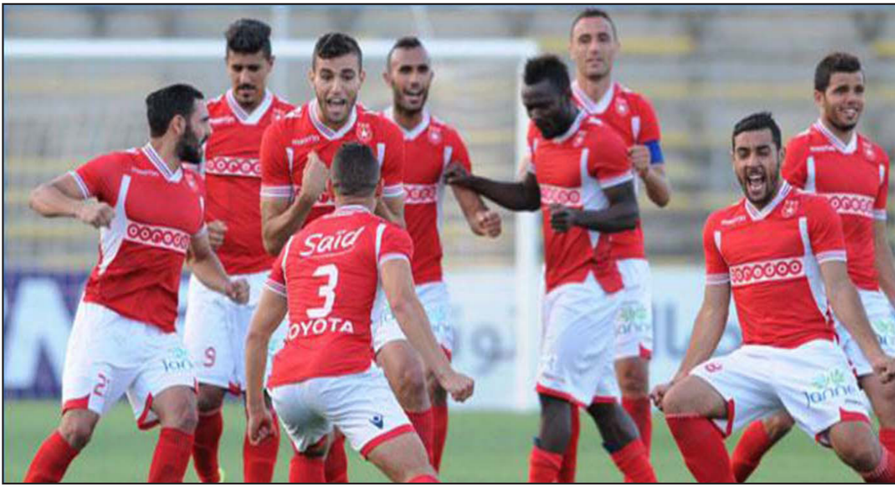
لاعبو النجم الساحلي يحتفلون بأحرازهم للقب

■ القاهرة - د ب أ: أعلن خالد عبدالعزيز وزير الشباب والرياضة المصري أنه اتفق مع رؤساء الاتحادات المنافسة بالدوري الممتاز على الاستعانة بشركة من خاصة تساهم فيها جميع الأندية بالتعاون مع وزارة الشباب والرياضة المصرية واتحاد الكرة لحفظ الأمن بالملاعب المستضيفة للمباريات. وأوضح أن عودة الجماهير للمرجحات خلال مباريات الدوري ستكون تدريجية، وعلى حسب أهمية المباراة، وبسعة وإمكانات وتوافر الشروط الأمنية بالملاعب المستضيفة. وأضاف أن هناك اجتماعاً تعاملاً أخصر الأسبوع المقبل لصياغة جميع التصورات والمقررات النهائية، بالتنسيق مع وزارة الداخلية المصرية وعرضها على مجلس الوزراء في منتصف الشهر المقبل وهو الموعد المبني الذي تم اقتراحه للبدء في السماح للجماهير بحضور المباريات.