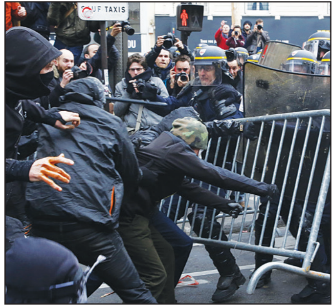
متظاهرون يشتبكون مع شرطة الشغب خلال احتجاجات على قمة المناخ التي تبدأ أعمالها في باريس اليوم

■ عواصم - وكالات: من سيدني إلى برلين شارك مئات الآلاف، أمس الأحد، في أكبر الأنشطة في العالم لمكافحة تغير المناخ، من أجل الضغط على زعماء العالم المجتمعين اليوم في العاصمة الفرنسية، حتى يتحدوا في محاربة الاحتباس الحراري خلال قمة باريس المناخية. ونظمت أكثر من 2000 فعالية في مدن بينها سيدني وبرلين ولندن وساو باولو ونيويورك، وهو ما يجعل يوم أمس أحد أكثر الأيام التي تنظم فيها فعاليات بشأن مؤتمر باريس المقرر أن يستمر من 30 تشرين الثاني/نوفمبر وحتى 11 كانون الأول/ديسمبر.