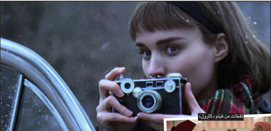
لقطات من فيلم «كارول»

أما جائزة أفضل ممثل فكانت من نصيب مايكل كيتون، عن دور قائد فريق صحافيين استقصائيين في جريدة «بوسطن غلوب» يكشفون عن ظاهرة استغلال منات الأطفال جنسيا في الكنيسة الكاثوليكية على يد قسبيسين في فيلم توم كاترني «سبوتلايت»، الذي يُتوقع أن يلعب في جوائز الأوسكار. يذكر أن كيتون سوف ينافس في فئة أفضل ممثل مساعد في جوائز الأوسكار وليس في فئة أفضل ممثل،