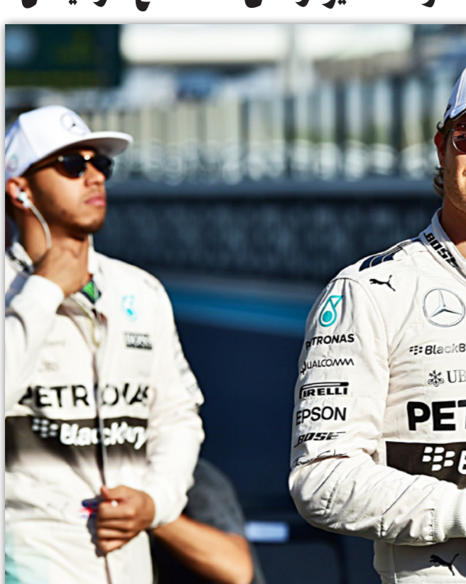
روزبيرغ (يمين) وخلفه هاملتون لا يتفقان دائماً مختلفان

■ لندن - د ب أ: يرى السائق البريطاني لويس هاملتون بطل العالم أن علاقته بزميله الألماني نيكو روزبيرغ لا تمثل أي مشكلة بالنسبة لفريق مرسيدس صاحب لقب بطولة العالم لسباقات فورمولا-1. وقال هاملتون في مقابلة مع شبكة «بي بي سي» الإذاعية البريطانية والتي من المقرر بثها بالكامل في 12 كانون الأول/ ديسمبر الجاري: «لم تنسب في أي مشكلة والطاقة الإيجابية داخل الفريق جيدة للغاية». وأضاف السائق البريطاني الذي فاز باللقبين الأخيرين لفورمولا-1: «لن نصح أبداً أفضل صديقين ولكننا سنسوي الأمور بيننا في وقت ما». وجاءت كلمات هاملتون بعدما طالب توتو وف المدير الرياضي لفريق مرسيدس من السائقين أن يضعوا نهاية لصراعاتهما الداخلية، مهدداً بإجراء تغييرات داخل الفريق. وكان وف قال في تصريحات نقلها عنه موقع «موتورسبورت.كوم»: «يوجد اتحاد كبير داخل الفريق ولكن العلاقة المعقدة بين السائقين هي نقطة ضعفنا وهذا ليس بالأمر الجيد»، وتابع: «دائماً ما تصادفنا المفاجآت وهذا أمر يؤثر على الفريق ويجب أن ينتهي».