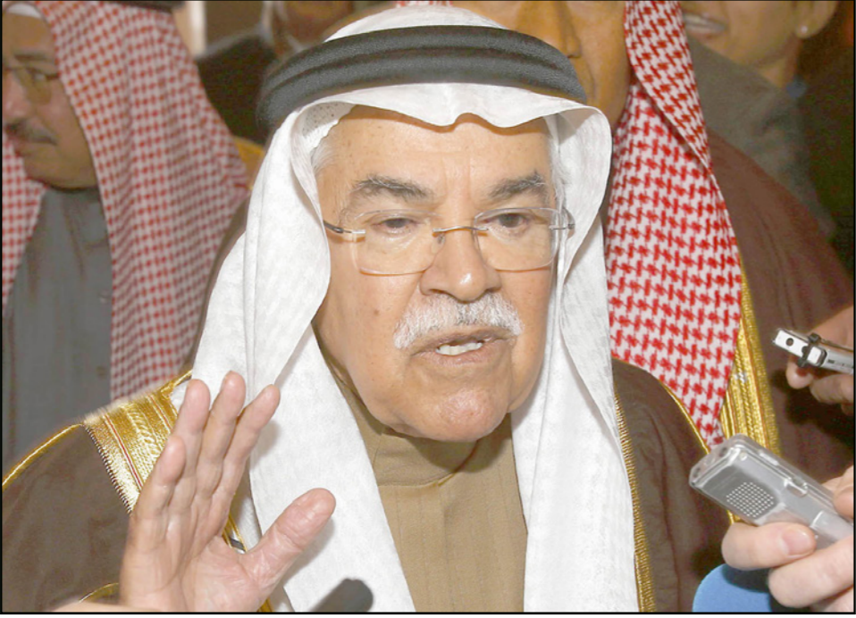
وزير النفط السعودي علي النعيمي يتحدث إلى الصحفيين في مقر أوبك في فيينا