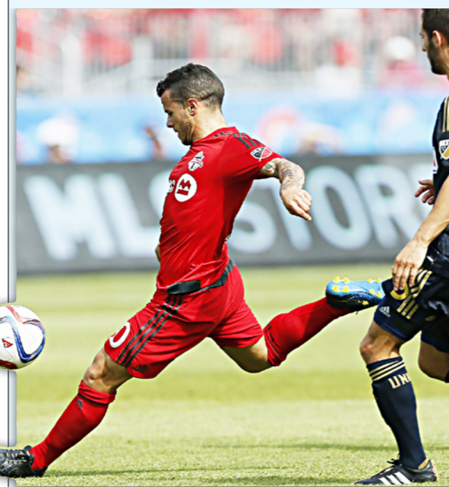
جوفينكو تالغ في موسم الاول مع تورونتو

■ باريس - د ب أ: أهدر كان فرصة تقليص الفارق مع باريس سان جيرمان متصدر الدوري الفرنسي، بعدما سقط في فخ التعادل 1/1 مع مضيفه موناكو في المرحلة السادسة عشرة، ولم تلعب الأرض مع أصحابها في معظم مباريات المرحلة، حيث فاز ريمس على مضيفه غانغان 1/2، وانجاسكيو على مضيفه مونيبيليه 2/صفر، وباستيا على ضيفه بوردو 1/صفر، وتولوز على ضيفه تروا 3/صفر، فيما تعادل ليل مع ضيفه سانت ايتيان بدون أهداف، ورفع كان رصيده إلى 29 نقطة، ليظل متأخرا بفارق 13 نقطة عن سان جيرمان، الذي تعادل سلبا مع ضيفه انجيه، فيما ارتفع رصيد موناكو إلى 25 نقطة في المركز السابع، محققا تعادله الثاني على التوالي، وفشل الفريقان في هز الشباك خلال الشوط الأول الذي انتهى بالتعادل السلبي، قبل أن يجادر جويدو كاريو بالتسجيل لصحة موناكو في الدقيقة 56، قبل أن يدرك روني رودين التعادل لكان قبل النهاية بربع دقائق، ليحتفل كل فريق بالحصول على نقطة واحدة فقط.