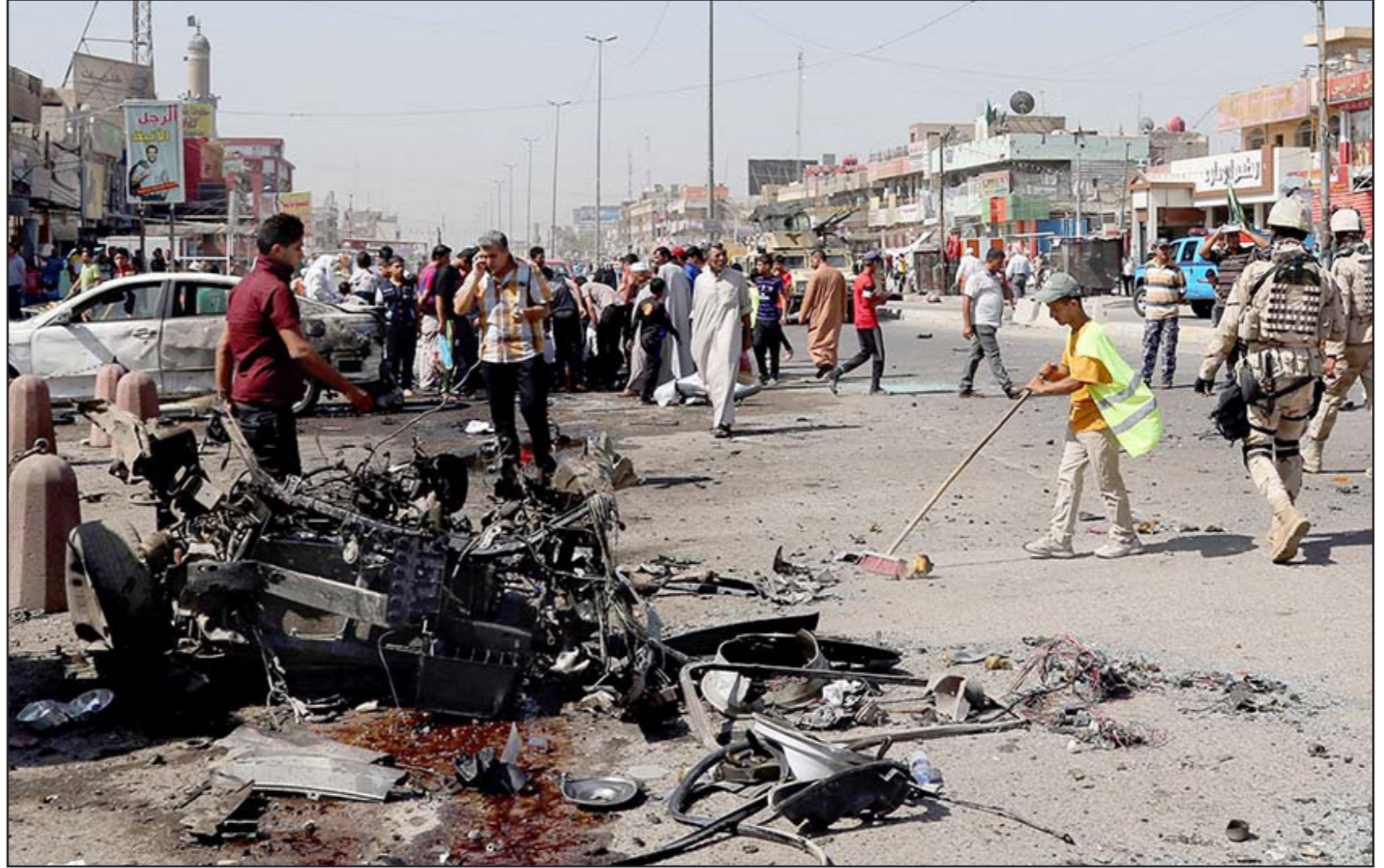
أثار التفجيرات التي ضربت بغداد أمس

وحد نائب عن التحالف الوطني، رئيس الوزراء حيدر العبادي من «مغبة» موافقته على نشر قوات برية أمريكية أعلنت الولايات المتحدة عزم نشرها في العراق.