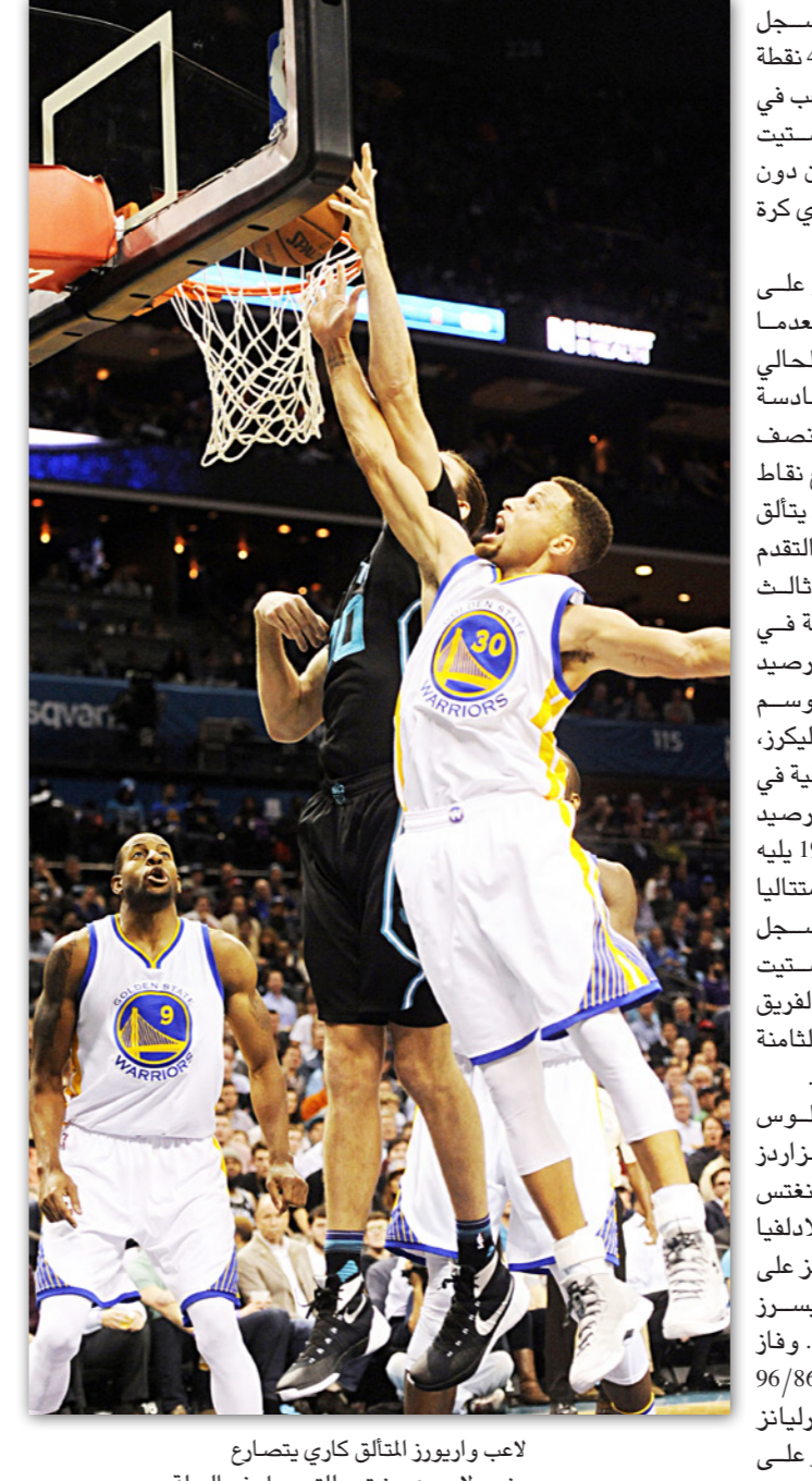
لاعب واريوز التائق كاري يتصارع مع سبينسر لاعب هورنتس للسجل في السلة

■ لوس أنجليس - د ب أ: سجل ستيفن كاري 28 نقطة من أصل 40 نقطة في الربع الثالث قبل أن يغادر الملعب في الربع الأخير ليقود فريقه غولدن ستيت واريوز لتحقيق فوزه العشرين دون هزيمة في الموسم الحالي من دوري كرة السلة الأمريكي للمحترفين. وفاز غولدن ستيت واريوز على تشارلوت هورنتس 116/99 بعدما وأصل كاري تألقه في الموسم الحالي وسجل 40 نقطة أو أكثر للمرة السادسة هذا الموسم. وأنهى غولدن ستيت نصف المباراة الأول متقدماً بفارق تسع نقاط بعد تسجيل كاري 12 نقطة قبل أن يتألق في الربع الثالث ويمنح فريقه التقدم 93/70. ويات واريوز صاحب ثالث أطول مسيرة انتصارات متتالية في تاريخ دوري كرة السلة الأمريكي برصيد 24 انتصاراً متتالياً منذ نهاية الموسم الماضي. يذكر أن لوس أنجليس ليكرز، يمتلك أطول مسيرة انتصارات متتالية في تاريخ دوري كرة السلة الأمريكي برصيد 33 انتصاراً في موسم 1972/1971 يليه ميامي هيت برصيد 27 انتصاراً متتالياً حققها في موسم 2011/2010. وسجل كلاي تومبسون 21 نقطة لغولدن ستيت والفرنسي نيكولا باتوم 17 نقطة لفريق تشارلوت الذي تعرض للهزيمة الثامنة هذا الموسم مقابل عشرة انتصارات. وفي مباريات أخرى، فاز لوس أنجليس ليكرز على واشنطن ويزاردز 108/104 وشيكاغو بولز على دنفر غنتس 99/90 ونيويورك نيكس على فيلادلفيا 99/87. كما فاز ديترويت بيستونز على فينكس صنز 127/122 واندجانا بيسرز على لوس أنجليس كليبرز 103/91. وفاز تورنتو رابترز على اتلانتا هوكس 96/86 وهوستون روكتس على نيو أورليانز 108/101 وسان أنطونيو سبيرز على ميلواكي بكس 95/70.