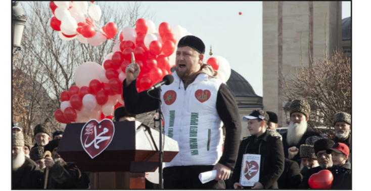
رئيس منقطة الشيشان الروسية رمضان قديروف

■ موسكو - رويترز: قال رئيس منطقة الشيشان الروسية رمضان قديروف أمس الخميس إن المسؤول عن ذبح مواطن شيشاني سيقتل، وذلك بعد بث تسجيل فيديو منسوب لتنظيم الدولة الإسلامية يصور الواقعة. وقال للصحافيين «نعم كان روسيا من الشيشان. لقد ذبح.. هناك حقائق مؤكدة... من قتل ذلك الرجل... لن يعيش طويلا». ونشر موقع سايت المتخصص في مراقبة المواقع المتشددة على الإنترنت أمس الأربعاء مقطع فيديو نشره تنظيم الدولة الإسلامية يظهر إعدام رجل قال بالتنظيم إنه جاسوس روسي.