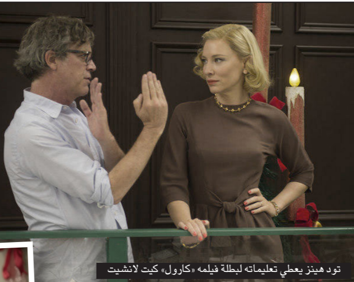
تود هينز يعطي تعليماته لبطلة فيلمه «كارول» كيت بلانشيت

الأفلام، صوتي جوائز الأوسكار. ففي العام الماضي تصدر فيلم «الصبيا» هذه الجوائز، ولكن لاحقا حصد فيلم «الرجل الطائر» الأوسكار لأفضل فيلم ويرز في جوائز عدة أخرى. الثري هو أنه بعد إعلان 3 جوائز لم يتألق فيلم واحد ليتصدر تهنيتات جوائز الأوسكار، إذ أن «سبوتلايت» تصدر جوائز غوثام للأفلام المستقلة بداية هذا الأسبوع بينما كرم المجلس الوطني للنقاد بالأمس فيلم جورج ميلر «ماكس المجنون: طريق الغضب» بجائزة أفضل فيلم ومنح فيلم ريديلي سكوت «الريخي» جوائز أفضل مخرج وأفضل ممثل مات ديون وأفضل سيناريو لندرو غودارد. ويذكر أن فيلمين مهمين جدا وهما فيلم دايفيد أوراسيل «جوي» وفيلم الجاندررو نريكو غونزاليس «ذي ريفنانت» لم يتنافس في هذه الجوائز، ويتوقع أن يتصدرا جوائز الـ«غولدن غلوبس» و«الأوسكار» في كل الفئات المهمة.