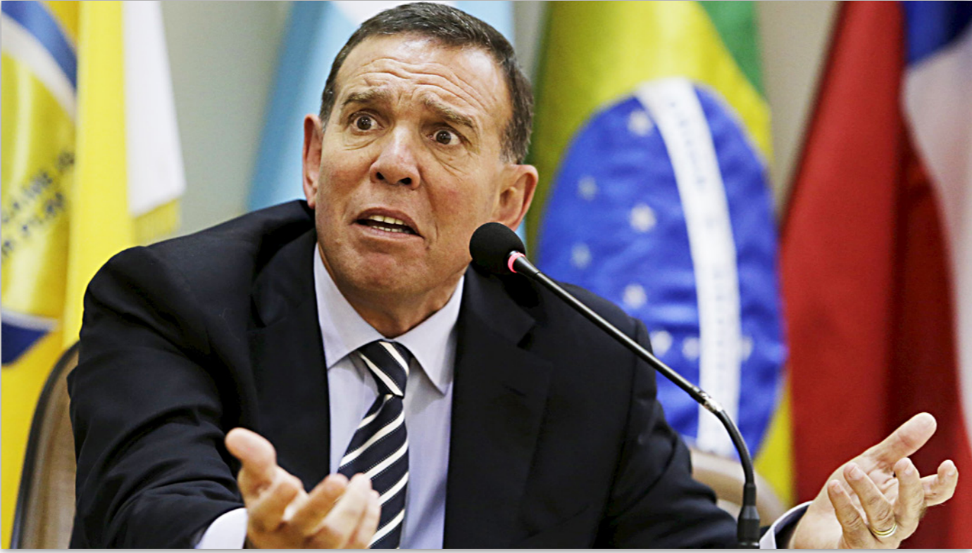
نابوت رئيس اتحاد «كونميبول» الذي ألقى السلطات السويسرية عليه القبض أمس