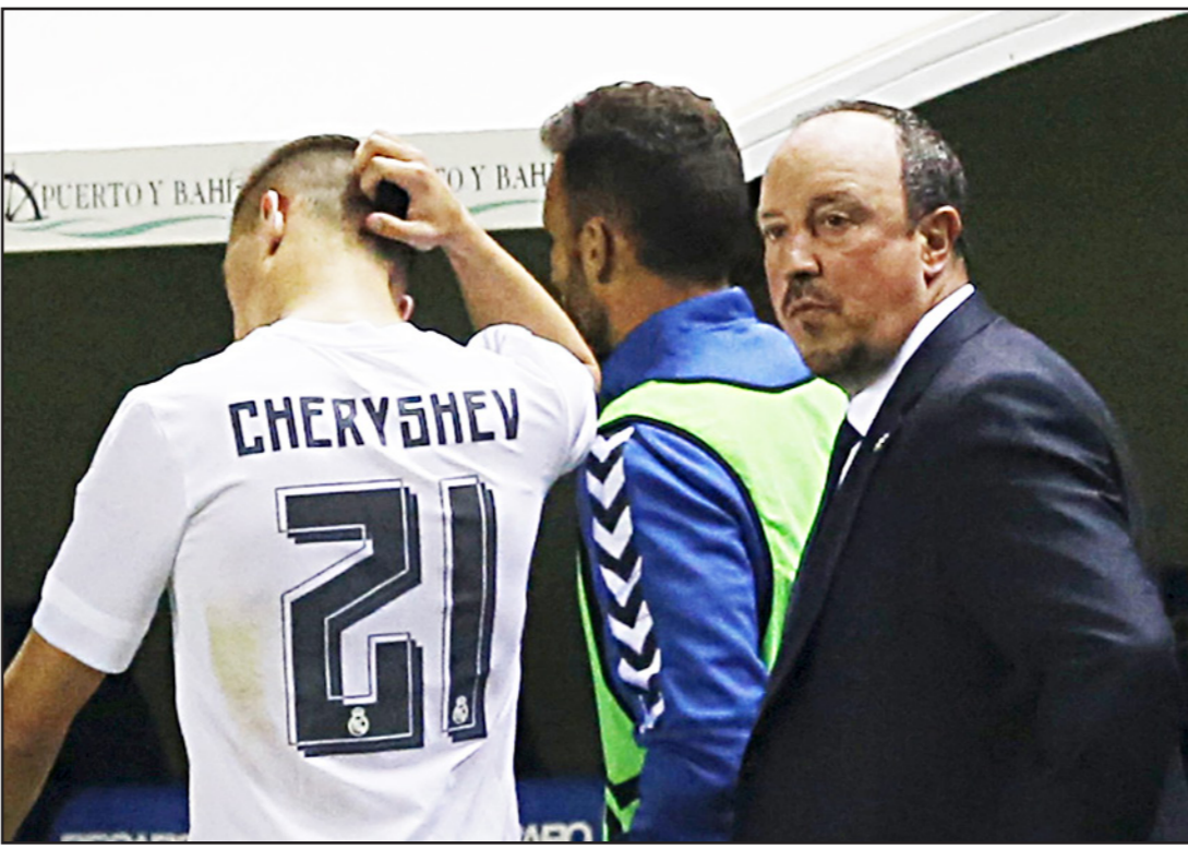
مدرب الريال بيتيتر سستركا يشيرشيف في مطلع الشوط الثاني