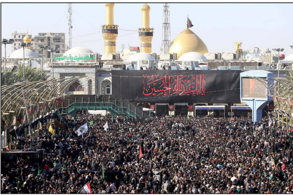
آلاف الشيعة يحتفلون في كربلاء

قد استتكرت تدفق مئات الآلاف من الإيرانيين عبر البوابات الحدودية العراقية والدخول إلى العراق دون الحصول على تأشيرات الدخول الأصلية.