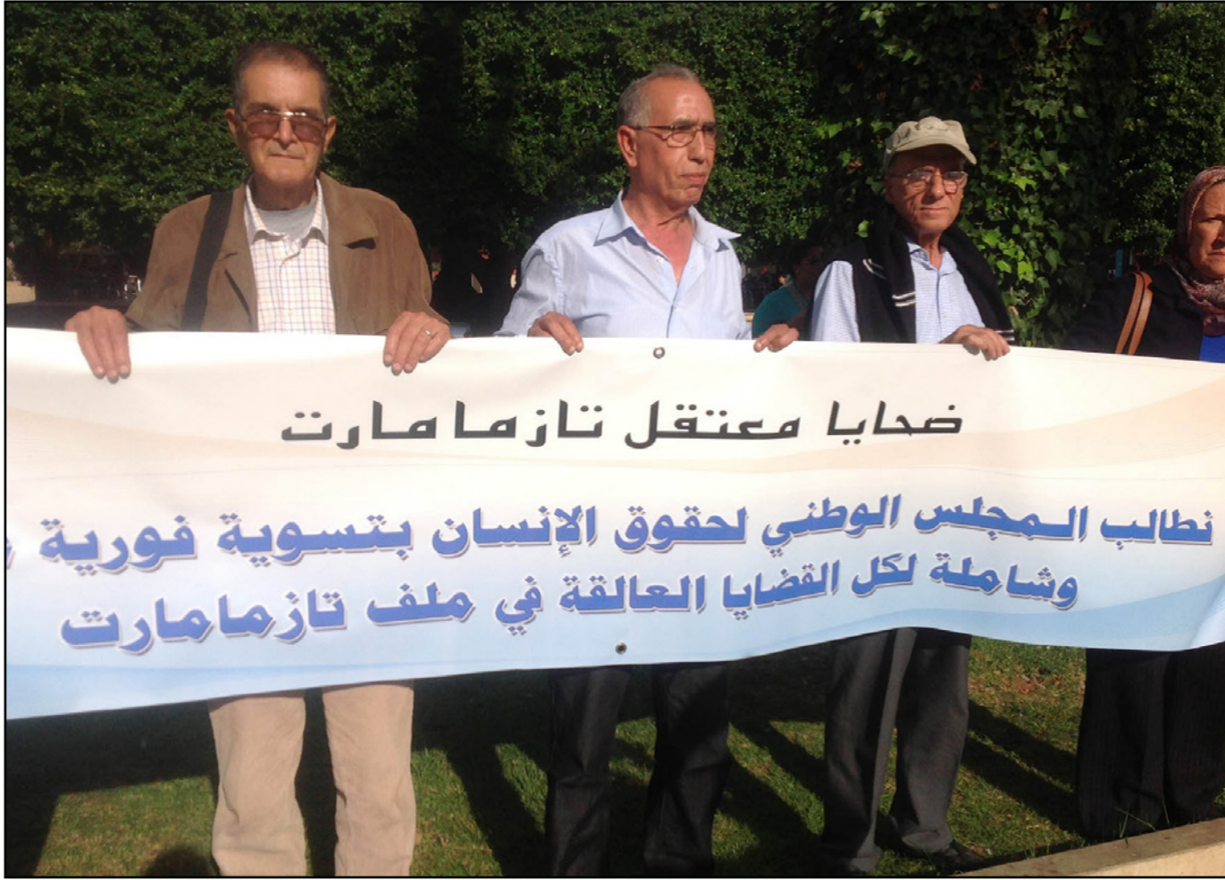
من وقفة تضامنية مع ضحايا معتقل «تازمامارت» (أرشيفية)

وضعتهم الإدارية على غرار باقي ضحايا الانتهاكات الجسيمة لحقوق الإنسان، وطالب المنظمون للقافلة، بالحفاظ الإيجابي على ذاكرة الاختفاء القسري من خلال التحفظ على مراكز الاعتقال والمدافن الفردية والجماعية، وتحليلها إلى أماكن للذاكرة، ونخش بالذكر المعتقل السري تازمامارت وتحديد هوية رفات المتوفين داخله. وناشدوا الدولة للمساهمة في رد الاعتبار لقرية تازمامارت طبيا وإنسانيا وعلى جبر الضرر الجماعي لسكان هذه القرية التي عانت الكثير.