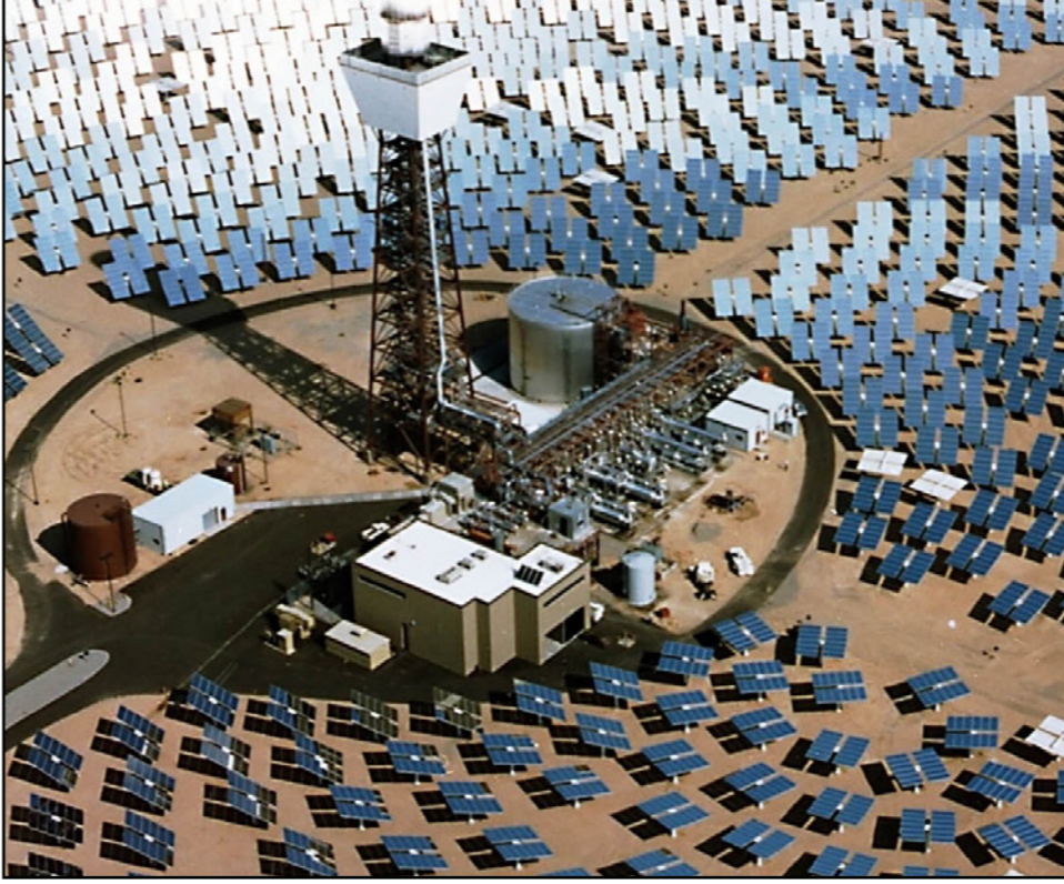
صورة بالمكبيوتر لحطة الطاقة الشمسية في وازارات