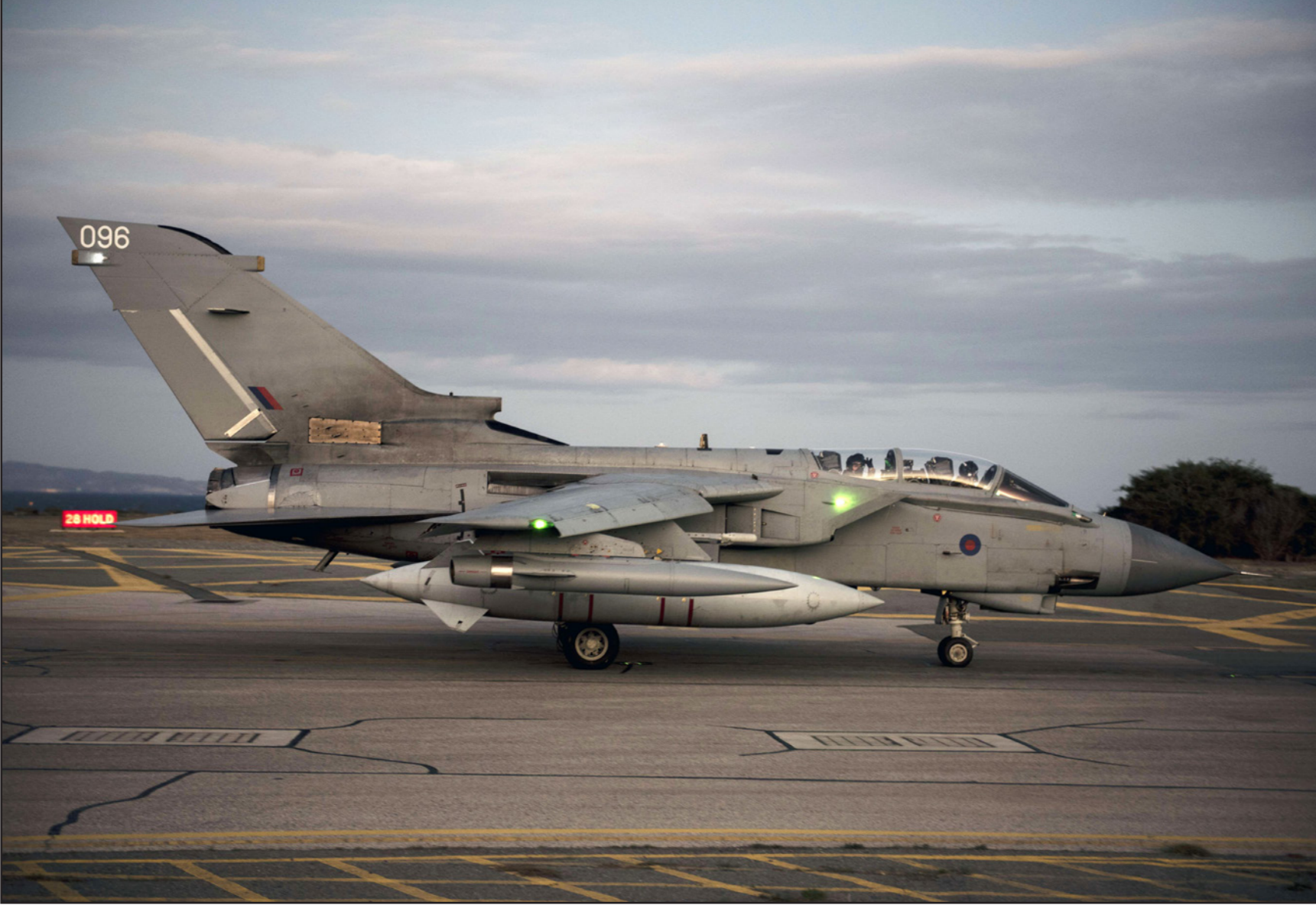
طائرة «تورنادو GR4» تابعة لسلاح الجو الملكي البريطاني تحط على مدرج القاعدة الجوية البريطانية أول من أمس في أكروتييري في قبرص

■ عواصم - وكالات: دعا وزير الخارجية الأمريكي جون كيري في بلغراد الخميس إلى نشر قوات برية «عربية وسورية» لمواجهة تنظيم الدولة الإسلامية في سوريا. وقال كيري في العاصمة الصربية في اجتماع وزاري لمنظمة الأمن والتعاون في أوروبا «من دون امكانية تشكيل قوات برية جاهزة لمواجهة داعش، لا يمكن كسب هذا النزاع بشكل كامل بالضربات الجوية فقط». واقترح الوزير الأمريكي نشر قوات «عربية وسورية» وليس غربية لهذا الغرض. وأوضح «إذا تمكنا من تنفيذ عملية انتقال سياسي، سيكون في الامكان جمع الدول والكیانات معا: الجيش السوري مع المعارضة، والولايات المتحدة مع روسيا، وغيرهم سيتوجهون لمحاربة داعش، متوقعا فوزا سريعا في تلك الحالة». وأضاف «لكم أن تتخيلوا مدى السرعة التي سيتمت خلالها القضاء على هذه الآفة، حرفيا في غضون بضعة أشهر، إذا كنا قادرين على التوصل إلى هذا الحل السياسي». وتأتي تصريحات وزير الخارجية الأمريكي غداة إقرار البرلمان البريطاني قرار شن ضربات جوية ضد الجهاديين في سوريا. وكانت الحكومة الألمانية قد صادقت الثلاثاء على تفويض يتيح مشاركة جيشها في الحملة ضد تنظيم الدولة الإسلامية، وخصوصا في سوريا، في مهمة يمكن أن تحشد فيها 1200 عسكري، وزادت وتيرة الهجمات التي تشنها روسيا و«وحدات حماية الشعب الكردية» وتنظيم «داعش» الإرهابي، بشكل متزامن، على ممرات استراتيجية بين الحدود التركية ومدينة حلب (شمال) التي تسيطر عليها قوات المعارضة وأسادت مصادر محلية أن مقاتلي