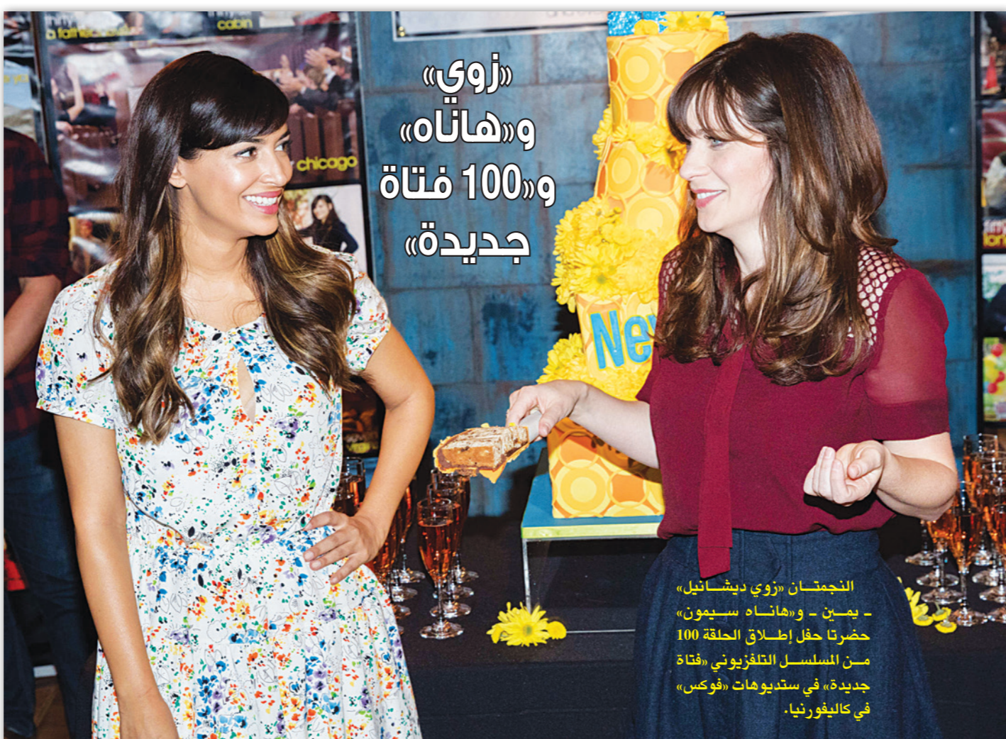
النجمتان «زوي ديشانيل» - «مسن» - و«هاناه سيمون» - «صن» حفل إطلاق الحلقة 100 من المسلسل التلفزيوني «فتاة جديدة» في سديوهات «فوكس» في كاليفورنيا.

سانت لويس - الأناضول: طوّر باحثون أمريكيون مركبا دوائيا جديدا لعلاج أدمغة الأطفال الذين يعانون من مرض التوحد، ويمكن أن يكون بديلا للعلاجات المحدودة المتاحة حاليا التي تعالج الأعراض ولا تستهدف مسببات المرض. وأوضح الباحثون في جامعة سانت لويس الأمريكية، في دراستهم التي نشرها نتائجها في العدد الأخير من دورية «العلوم العصبية»، أن المركب الدوائي الجديد الذي يحمل اسم (SR1078)، يستهدف الجينات التي تكون منخفضة في أدمغة الأطفال المصابين بالتوحد. واختبر الباحثون المركب الدوائي الجديد على الفئران، قبل أن يكون جاهزا للاختبار على البشر. ووجدوا أن هذا المركب قادر على الوصول إلى الدماغ واستهداف الجينات المسببة للتوحد. وأشاروا إلى أنهم سيستكملون أبحاثهم، بإجراء تجارب سريرية على البشر، قبل أن يستخدم الدواء كعلاج للأطفال المصابين بالتوحد. وأضاف الباحثون أنهم يتطلعون إلى خروج هذا الدواء إلى السوق، لعدد عدد الخيارات العلاجية المتاحة لعلاج الأطفال المصابين بالمرض، حيث أن الأدوية المعتمدة هي بعض الأدوية المضادة للذهان التي تعالج الأعراض فقط ولا تستهدف مسبباته. ونوه الباحثون إلى أن التوحد هو اضطراب عصبي يؤدي إلى ضعف التفاعل الاجتماعي والتواصل لدى الطفل، وتتطلب معايير تشخيصه ضرورة أن تصبح الأعراض واضحة، قبل أن يبلغ الطفل من العمر ثلاث سنوات، ويؤثر التوحد على عملية معالجة البيانات في المخ. ووفقا للمراكز الأمريكية للسيطرة على الأمراض والوقاية منها، فإن حوالي 1-2 من كل 100 شخص يصابون بالمرض حول العالم، ويصاب به الذكور أكثر من الإناث بأربع مرات.