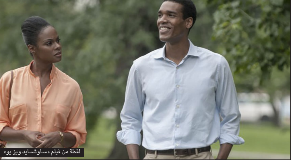
لقطة من فيلم «ساوشايد ويز يو»