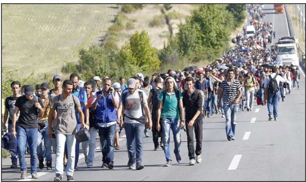
لاجئون سوريون في الطريق إلى أوروبا

في اجل اقتلاع الهجرة الجماعية للملايين المسلمين إلى أوروبا، يجب حشد جهود مكثف لاستقرار الشرق الأوسط، الذين سعوا إلى فرض قوانين الشرعية داعش، وتنغي الإشارة إلى أن البربرية السائدة اليوم في المنطقة يمكن أن تجزئها أيضا إلى الساعي الفاشلة من جانب براك اوياما لارضاء إيران والنهج بناء الجسور والذي اتبعه مع الدول المعادية على حساب حلفائه. نقطة الانعطاف كانت الغاء التزامه للمعل بعد أن استخدم الاسد السلاح الكيماي ضد أبناء شعبه، فضيحة أخرى هي حقيقة أن الجامعة العربية ومنظمة التعاون الإسلامي التي تضم 57 دولة توجه إلى الاسرة الدولية غير الإسلامية كي تسوي مشاكل خلقها الطرف الإسلامي الذي يعود مصدره إلى صوفوها.