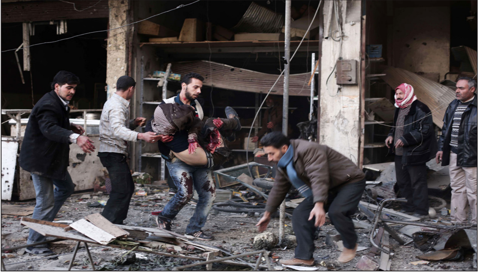
مسعف يحمل جريحاً أصيب خلال غارات النظام على منطقة الغوطة الشرقية، في ضواحي العاصمة دمشق

مادة تطالب دول الاتحاد الأوروبي بتقديم المساعدة العسكرية للقضاء على تنظيم الدولة الإسلامية في العراق وسوريا. وانضمت بريطانيا الخميس إلى حملة القصف التي تقودها الولايات المتحدة في سوريا وضربت حقلاً للنفط يسيطر عليه التنظيم.