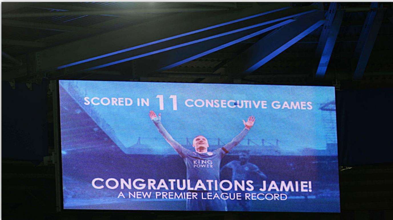
الجميع يتطلعون إلى المزيد من التألق والارقام القياسية من مهاجم ليستر جيمي فاردي

■ لندن - د ب أ: يخوض مانشستر سيتي وليستر الشريكان في صدارة الدوري الإنكليزي الممتاز منافسات المرحلة الخامسة عشرة تحت شعار «لا للتراجع» حيث أن أي كعوبة لأحدهما ربما تكلفه الكثير خلال وقت قصير.