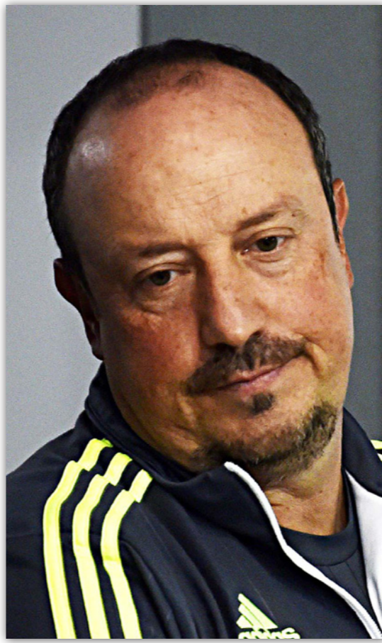
مدرب الريال بيتيتر استقبل يوم أمس بخير استبعاد فريقه

■ مدريد - رويترز: قالت محطة «كادينا سير» الإذاعية الإسبانية إن ريال مدريد استعد من كأس الملك بداعي إشراكه لاعب موقوف في مباراة ذهاب دور 32 أمام قادش يوم الأربعاء.