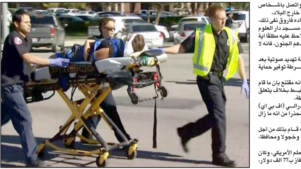
أحد ضحايا الهجوم على كاليفورنيا الذي أودى بحياة 14 شخصا

سان برناردينو منذ نحو ثلاثة عقود ولم تشهد مثل هذا العمل الشائن». وأضاف «لوقينا مع الضحايا الإبرياء وعائلاتهم». وأشار موقع لرصد أعمال إطلاق النار الجماعي إلى ان الهجوم الأخير يرفع عدد هذه الحالات إلى 352 في الولايات المتحدة هذا العام، ويعرف إطلاق النار الجماعي بأنه إصابة أربعة أشخاص أو أكثر في حادث واحد.