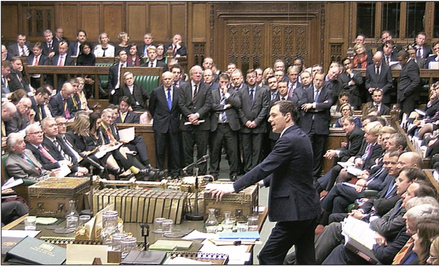
البرلمان البريطاني وافقت أغلبيتها على إرسال طائرات لشن حملات على مواقع تنظيم «الدولة» في سوريا

وكتب فريز في «إيلي تلغراف»، قاتلاً إن إحدى الملامح المثيرة للقلق في النقاش حول سوريا هي أن «الروس على ما يبدو لديهم حجة، فلاديمير بوتين لا يملك فقط استراتيجية تدخل عسكري واضحة وتعتمد على قوات في الميدان ونجح باقتناع المعارضة الجلاء عن محض، ولكن رؤية الكرملين حول من يجب التعامل معه باتت معقولة»، ويشير إلى ما قاله وزير الخارجية الروسي سيرغي