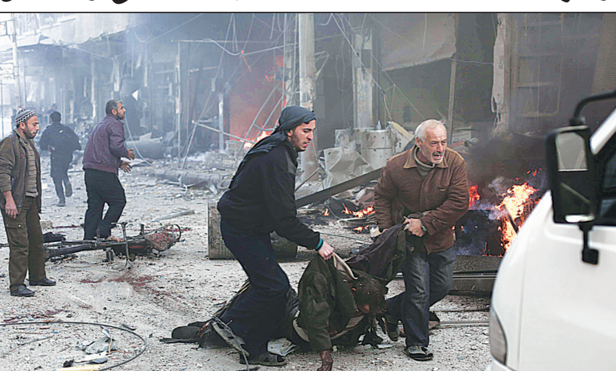
سوريون يحملون أحد ضحايا قصف مقاتلات روسية وسورية لبلدة جسرين قرب دمشق أمس

دمشق - من محمد مستو: قتل عشرات المدنيين في قصف لمقاتلات روسية ومقاتلات النظام السوري على غوة دمشق الشرقية وريف حمص الشمالي، جنوبي ووسط سوريا. وتسبب ذلك بمقتل 56 مدنيا على الأقل بينهم 16 طفلا، الجمعة، في غارات وقصف لقوات النظام السوري في شرق دمشق، وكذلك في وسط وجنوب البلاد، وفق ما أفاد المرصد السوري لحقوق الإنسان. وقال المرصد إن «طائرات النظام قصفت بلدتي جسرين وغربطنا في غوة دمشق الشرقية، ما أسفر عن 35 قتيلا على الأقل بينهم ستة أطفال إضافة إلى إصابة العشرات». وفي منطقة دوما بريف دمشق أيضا قتل ستة أشخاص بينهم طفلان بسقوط صواريخ. وفي شريف فيديو بثته ناشطون على الإنترنت من منطقة الجسرين يظهر شخص قائلا «لحم سوري للبيج». من جهة، حمل الائتلاف السوري المعارض القوات الروسية مسؤولية الهجوم على جسرين، وكتب على موقع تويتر إن «الطيران الروسي استهدف سوقا شعبية في الجسرين ما أسفر عن مقتل 11 شخصا وإصابة خمسين آخرين». وفي وسط البلاد، قتل 11 شخصا بينهم أربعة أطفال في قصف للطيران السوري استهدف مدينة تلبيسة في محافظة حمص، بحسب المرصد. ومنذ 2012 تسيطر الفصائل المقاتلة على تلبيسة التي تقع على الطريق التي تربط حمص بحماة (وسط)، وبدت قوات النظام مدعومة بالطيران الروسي في منتصف تشرين الأول/أكتوبر هجوما برييا على محافظة حمص لقطع طرق الإمداد بين حمص وحماة. وعلى جبهة أخرى، قتل أربعة أطفال في قصف للنظام على بلدة الحارة في محافظة درعا بجنوب البلاد. كذلك، قتل أربعة مدنيين آخرين في بلدة سلمين التي تبعد 30 كلم من الحارة، ولم يتمكن المرصد من تحديد مسا إذا كان الهجوم قد شنته قوات النظام أو مقاتلو المعارضة. وجدير بالذكر أن الأزمة السورية دخلت منعقفا جديدا، عقب بدء روسيا بهجومها على مدن وبلدات في سوريا.