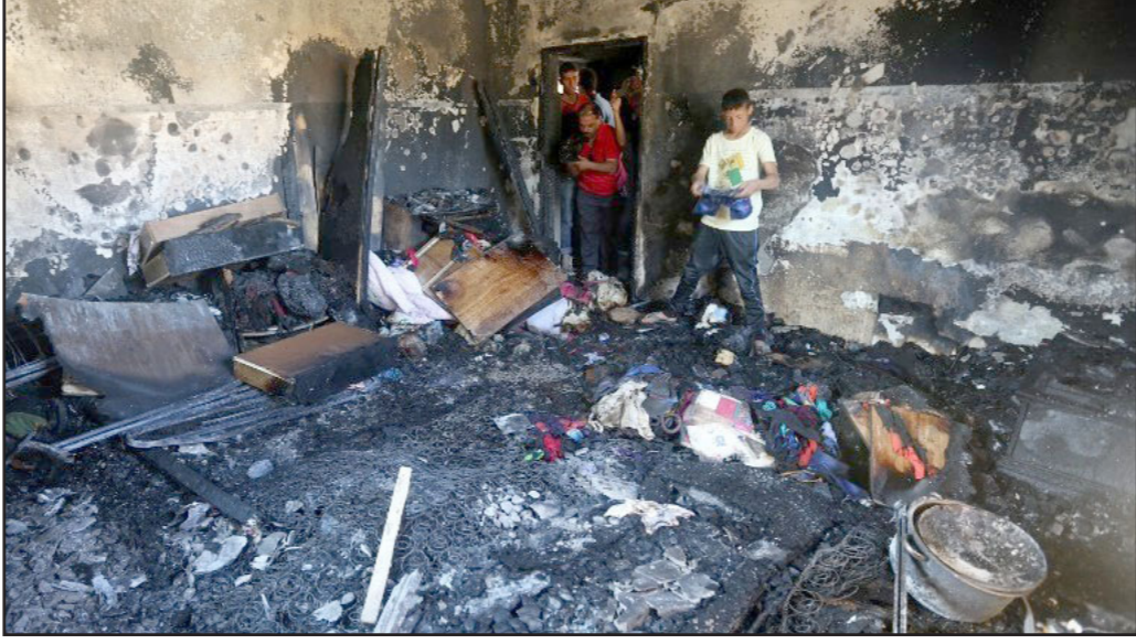
منزل عائلة الدوابشة بعد إحراقه على يد متطرفين يهود

حينه عادت وظهرت في أعمال «شارة النمن»، حيث كانت الذرورة في عملية القتل في دوما. يمكن الاعتقاد أن عاصفة ستهب عندما يتم نشر أسماء المشوّهين بالقتل. وهناك من سيقلي بالووم على كل الوسط. الاتهام الجماعي سيدفع إلى الرد من الطرف الثاني مثلما حدث بعد قتل راينين وهكذا دواليك. هذا شيء خاطيء، فليس صحيحا وليس عادلا اتهام جماعة كاملة من السكان بسبب مخالقات أفراد، ولكن ليس خاطئا أو مرفوضا طلب اجابات من اولئك الذين يزعمون قيادة هذا الجمهور – الاحامات ورؤساء مجلس «يشع» والمجالس المحلية واعضاء الكنيست من البيت اليهودي، هؤلاء الأشخاص يعرفون كيفية الطلب من الآخرين، وهم متسامحون تجاه ما يحدث في بيوتهم، في قضية «بنون مغيل» اضطروا للحظة إلى النظر إلى الداخل وعملوا ما هو مطلوب، لكن المسألة كانت صغيرة نسبيا واستندت الاستخلاصات على الإجماع، أما القتل في دوما فهو قصة مختلفة تماما. الميتولوجيا اليونانية تتحدث عن الترحس الذي كان جميلا ويجب نفسه، الآلهة تمشين فرضت عليه عقوبة شديدة، حيث حبسته أمام مظهره العكوس في بركة مياه، حيث أحب نفسه حتى مات.