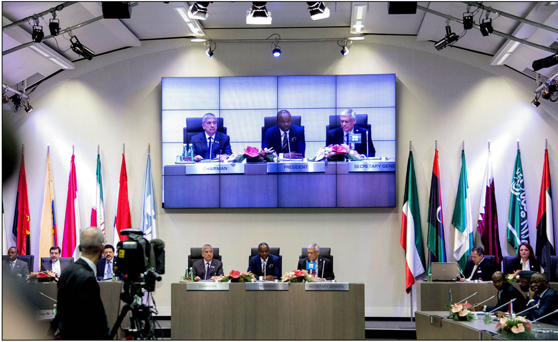
منصة الرئاسة في اجتماع أوبك أمس

■ فيينا- رويترز: قالت مصادر في «أوبك» ان المنظمة أقيمت في اجتماعها أمس الجمعة على سياساتها لضخ النفط بكميات تشبه قياسية، مع عدم إتخاذها أي خطوات لخفض واحدة من أسوأ التخم النفطية في التاريخ، والتي دفعت الاسعار للهبوط.