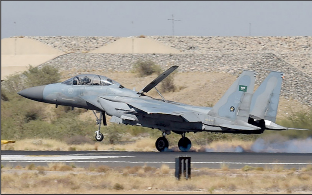
مقاتلة سعودية تنطلق من قاعدة جوية جنوب غرب المملكة أمس

عواصم - وكالات: شنت مقاتلات التحالف العربي، أمس الجمعة، غارات جوية استهدفت مواقع وتجمعات للحوثيين والقوات العسكرية الموالية للرئيس اليمني السابق علي صالح بمحافظة شبوة وتعز. وقالت مصادر محلية، إن نحو تسع غارات جوية استهدفت مواقع واليات عسكرية للحوثيين وقوات صالح بمديريتي حريب وبيحان في محافظة شبوة 474 كيلومترا شرق العاصمة صنعاء، وأسفرت عن مقتل 10 منهم وجرح آخرين لم يتسنى تحديد أعدادهم.