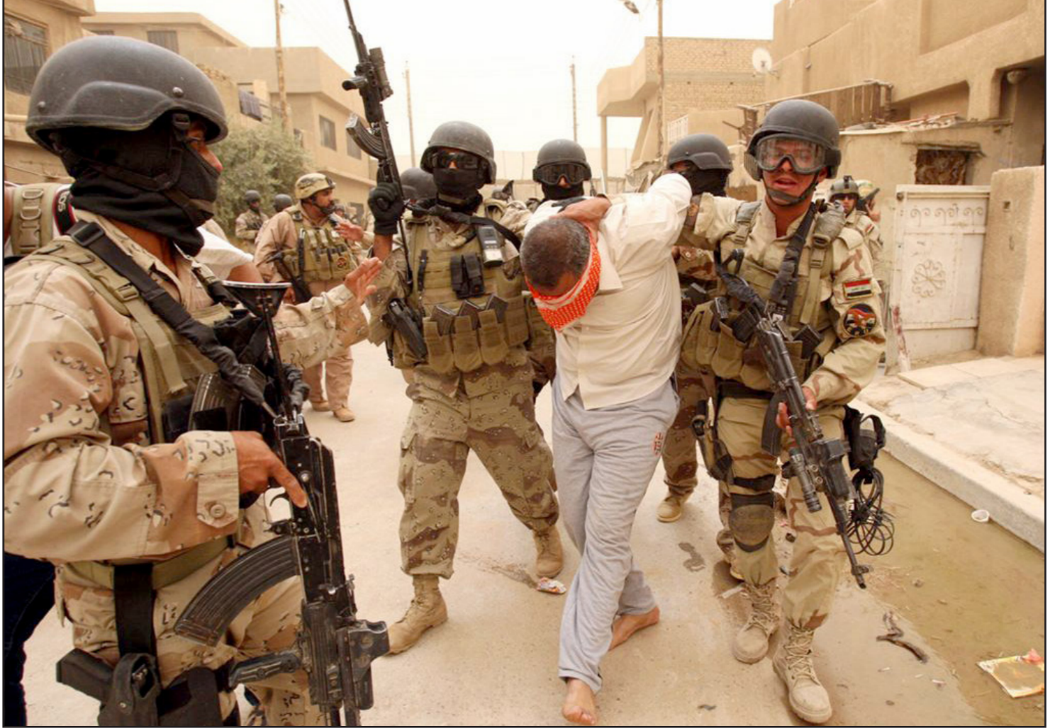
عناصر من الجيش العراقي يلقبون القبض على احد المتورطين في الانفجارات في بغداد

وأضافت وري أن «هذه الجهة معلومة لدى الحكومة العراقية وغير منتمية للمؤسسة الأمنية»، مشيرة إلى أن «عدد المختطفين بلغوا 1200 مختلف وتم تحويلهم