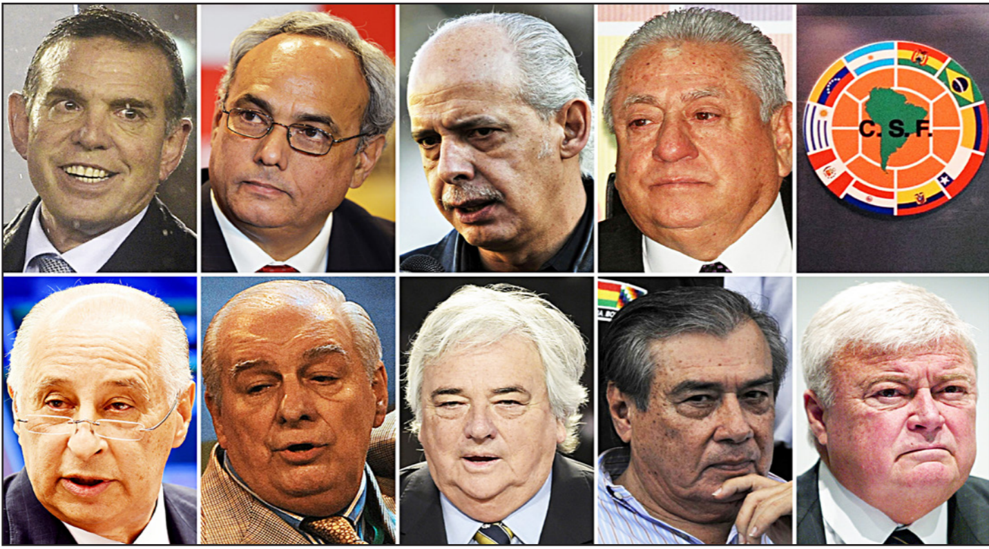
مجموعة من المسؤولين في أمريكا الجنوبية اتهموا بالاختلاس والفساد