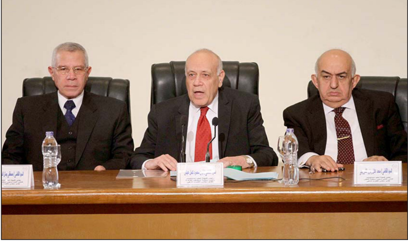
أعضاء في اللجنة العليا للانتخابات المصرية خلال مؤتمر صحافي لإعلان النتائج النهائية للبرلمان

بالكفاءة ومحبة للدولة المصرية ولديها خبرة في الشؤون النيابية والتشريع تكون بالفعل قادرة على أن تتولى رئاسة البرلمان، ولكننا لم نحسب رئاسة البرلمان في الأسماء معينة مثل عمرو موسى أو المستشار عدلي منصور أو المستشار أحمد الزند، وذلك لأن مصر مليئة بالكثير من الشخصيات التي تصلح لتولي هذا المنصب، ونحن في حزب مستقبل وطن، نرحب بأي شخص مؤهل لهذا المنصب ويتحمل المسؤولية ويدعم الدولة ومؤسساتها وينهض بها».