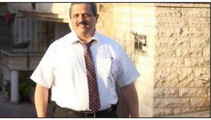
قائد الشرطة الإسرائيلية روني الشيك

يوجد في الكتاب قول مهم، حسب رأيي، وهو أن الرئيس المصري أنور السادات أصدر في 1 تشرين الأول 1973 أمرا سريا هو: «النقطة المركزية في نظرية الامن الإسرائيلية هي اقناع مصر أنه لا فائدة من العداء مع إسرائيل، لذلك لا مناص من الحصول على شروطها... ستقوم بعملية عسكرية حسب قدرتنا بهدف تكبير الضحايا للعدو وأن استمرار احتلال اراضيها له ثمن كبير. النتيجة سنُمكن من ايجاد حل محترم لازمة في الشرق الأوسط.» «في العادة يتحدثون في إسرائيل عن حرب يوم الغفران على أنها انتصار