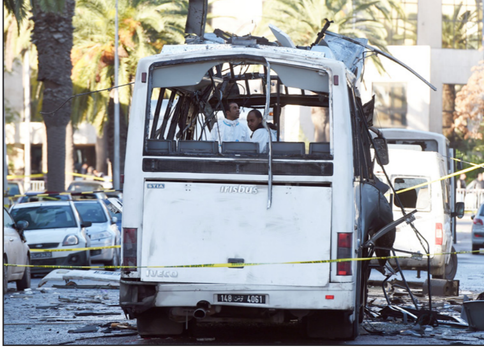
حافلة الأمن الرئاسي التي تعرضت للهجوم الإرهابي في العاصمة التونسية

مباشر في عدم استقرار تونس، ولذلك من الطبيعي أن تتحدث وسائل الإعلام عن محاولتها التدخل في الشأن التونسي». واستدرك بقوله «يجب أن لا ننسى العلاقة المعروفة بين الإمارات وحزب نداء تونس والتي ظهرت بشكل مفضوح خلال الانتخابات، وحاليا ثمة شقان في النداء ومن غير الواضح من منهما الأقرب للإمارات». وكانت حركة «النهضة»، دعت وسائل الإعلام إلى «تغليب المصلحة الوطنية وتحري الزهامة والمهنية في بعض الأعمال الإعلامية بعيدا عن الاستفزاج المجاني لجيران تونس وأصدقائها، وعدم التوظيف السياسي والإيديولوجي للجرائم الإرهابية بما قد يؤدي إلى توترات في علاقات بلادنا الخارجية». وأضافت في بيان أصدرته الخميس تعليقا على ما ورد في قناة «تونستا»: «الخطر الإرهابي آفة دولية نواجهها بوحدةنا الوطنية. كما نواجهها بالزيد من الحلفاء والأصدقاء في محيطنا العربي والإسلامي والدولي (...). والمستفيد من إثارة الشبهات المجانية وتوتير علاقاتنا الخارجية في معرفتنا مع الإرهاب هو الإرهاب نفسه، وذلك ينقص من فعاليتنا في مواجهته ومن قدرتنا على تحقيق التنمية في بلادنا. نذكر أن هيئة الاتصال السعوي والتمسي (الهايك) قررت إيقاف إمامة بث الحلقة التي تتضمن تصريحات الضابط المغربي وسحبها من الموقع الإلكتروني للقناة.