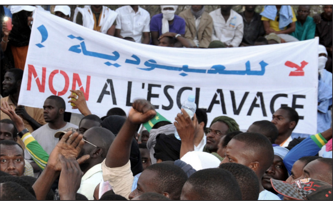
صورة أرشيفية لموريتانيين يتظاهرون ضد التمييز العنصري في نواكشوط

المساوية للعبيد في موريتانيا والمئات من حالات الرق التي كشفتها منظمات حقوق الإنسان، بما فيها ذلك ما حصل في السنة الجارية». وأضاف «ومما لا يدع مجالاً للشك في صدقية ما سبق من اتهامات أن هذه الإطالة المساوية تأتي أسبها فقط بعد إقرار الحكومة ما يسمى بخارطة طريق من واحد وعشرين نقطة تحت ضغط لجنة الأمم المتحدة المكلفة بحقوق الإنسان وتصويت البرلمان لصالح القانون المدين والجرم لممارسات الاستعباد والعدل للقانون رقم 0048-2007 وما قراران تم اعتبارهما في ذلك الوقت شجاعين وبدخلان ضمن القطيعة مع المواقف التقليدية لأنظمتنا، إلا أنه ظهر - بعد أن تكون أفعالا قوية تستجيب للمتطلبات الوطنية - أنها لم تكن سوى مفاوضات للإلهاء والتنمية موجهة للاستهلال الخارجي، حتى تستطيع موريتانيا التي تعتبر على القائمة كأول دولة استعبادية في العالم المعاصر تلميع صورتها والتغيير من ترميها». وأكد حزب التحالف الشعبي التقدمي الذي يجعل من القضاء على الرق إحدى أولوياته الأساسية «أنه يدين بشدة تصريحات الرئيس ولد عبدالعزيز التي تعتبر إنكارا خطيرا وصريحا