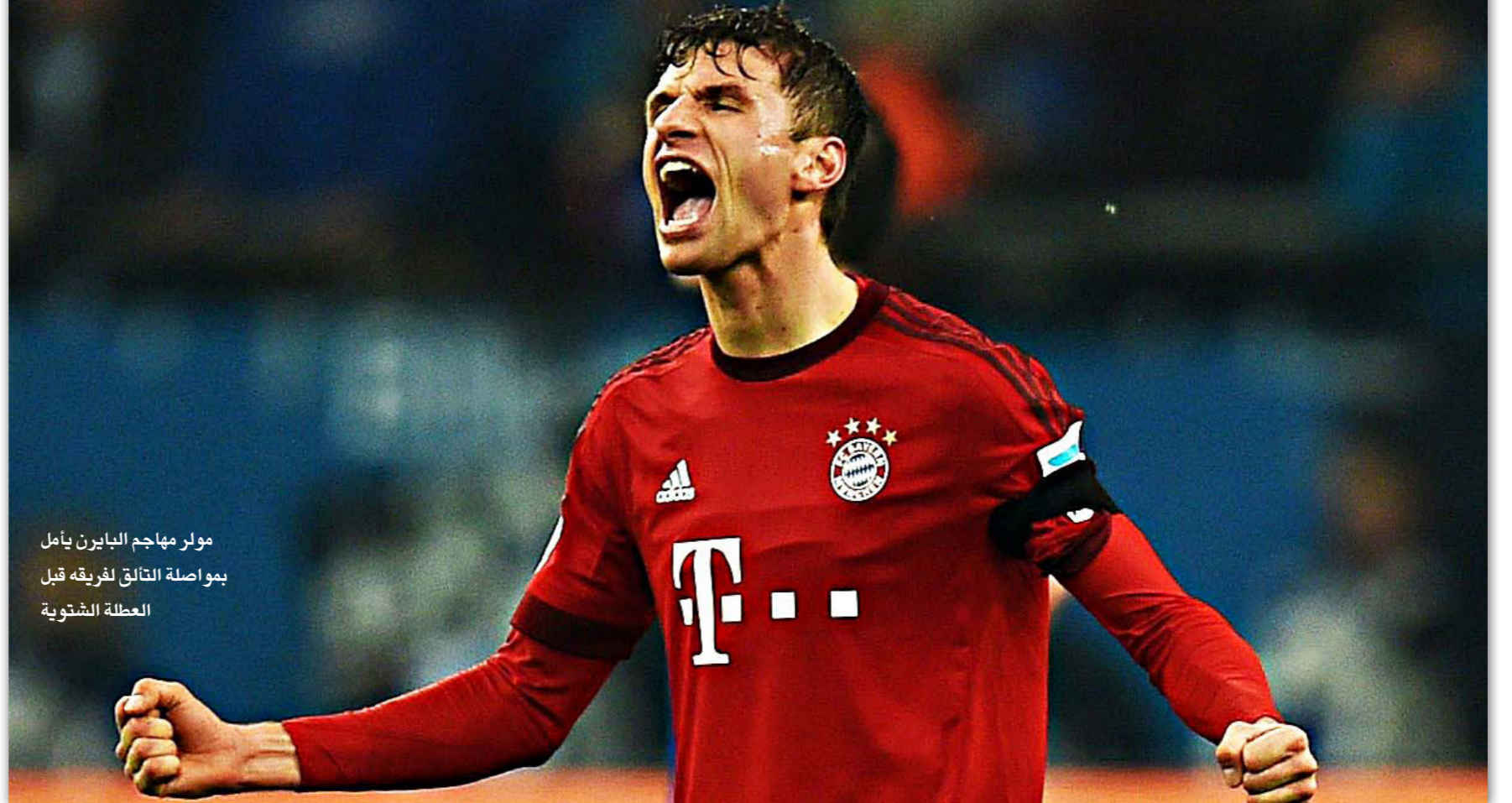
مولر مهاجم الباييرن يأمل بمواصلة التألق لفريقه قبل العطلة الشتوية

■ برلين - د ب أ: يسعى بايرن ميونخ للحفاظ على سجله خاليا من الهزائم في الدوري الألماني، عندما يحل ضيفا على بوروسيا مونشنغلاذباخ في المرحلة الخامسة عشرة اليوم. ويمتلك مونشنغلاذباخ سجلا لا بأس به خلال مبارياته أمام الباييرن في المواسم الأربعة الأخيرة للبطولة، حيث فاز على الباييرن في ثلاث مناسبات، مقابل تعادلهن وثلاث هزائم، علما أنه تغلب على الفريق البافاري في مرحلتي الذهاب والعودة خلال موسم 2011/2012، كما تغلب الخسارة أمام الباييرن خلال الموسم الماضي، الذي حصل خلاله على المركز الثالث، وتعادل الفريقان سلبا خلال اللقاء الذي جرى بينهما على ملعب «بروسيا بارك» في مرحلة الذهاب، قبل أن يفوز مونشنغلاذباخ 2/صفر في الإياب، وعانى