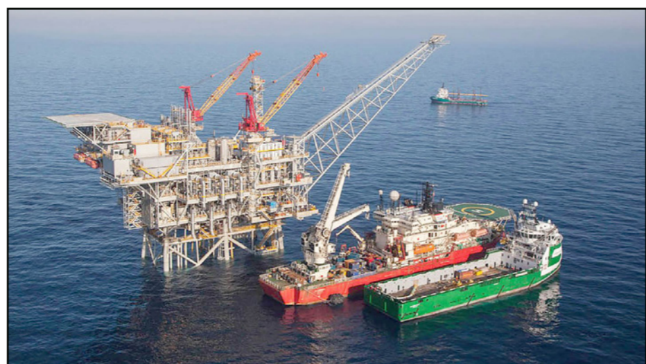
منصة حفر واستخراج النفط في حقل «ليفان» الغازي البحري الإسرائيلي

وعلى الرغم من شراكة الحكومة المصرية في تصدير الغاز الطبيعي إلى إسرائيل في التسعينيات، عبر شركة البحر المتوسط المملوكة لحسين سالم، فإن هذه العقود ظلت بعيدة عن البرلمان المصري، ولم يمارس بحقها دوره الرقابي، رغم إصرار المعارضة قبل ثورة 25 يناير على إلغاء هذه الاتفاقية لاعتبارات قومية واقتصادية. وثمة إشكالية قانونية أخرى ستكون عيقة أمام صفقة تصدير الغاز من إسرائيل لمصر وهي الخاصة بموقع الغاز الطبيعي بالبحر المتوسط، حيث تم توقيع اتفاقية بهذا الشأن بين مصر وقبرص وإسرائيل، رسمت حدود مصر خارج منطقة حقل الغاز.