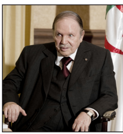
الرئيس الجزائري عبدالعزيز بوتفليقة

بشأن الوضع الصحي للرئيس، كما أن الحديث عن زيارة خاصة قبل الحديث عن الفحوص الطبية، هدفه طمأنة الرأي العام بخصوص صحة الرئيس، خاصة أن أي تسريب لإشاعات بشأن صحة الرئيس، مثلما كان عليه الحال قبل أيام، يفتح الباب أمام توتر إعلام جزائرية سارعت لتكذيب الخبر، مؤكدة تعودت السلطات التعامل به مع موضوع صحة الرئيس. جدير بالذكر أن متابعي الرئيس الصحية بدأت سنة 2005 عندما أصيب بوعكة صحية اضطرت نقله إلى فرنسا، وقيل آنذاك بحسب الرواية الرسمية إن بوقفليقة أصيب بقرحة معدية، لكن الرئيس عولج بفرنسا لعدة أسابيع، وحتى بعد أن عاد لم يستعد صحته العيادية، قبل أن يصاب بسنة 2013 بحلطة دماغية اضطرت نقله مجددا للعلاج في فرنسا التي مكث فيها أكثر من 80 يوما، ومنذ أن عاد وأوضاعه الصحية لم تعد كما كانت عليه، من دون أن يضعه ذلك من الترشيح لولاية رئاسية رابعة، لكن موضوع صحته أصبح يطرح باستمرار في النقاش السياسي، خاصة أن المعارضة جعلت من أحد النقاط الأساسية التي تركز عليها في انتقاد السلطة.