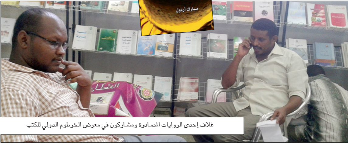
غلاف إحدى الروايات المصدرة ومشاركون في معرض الخرطوم الدولي للكتاب