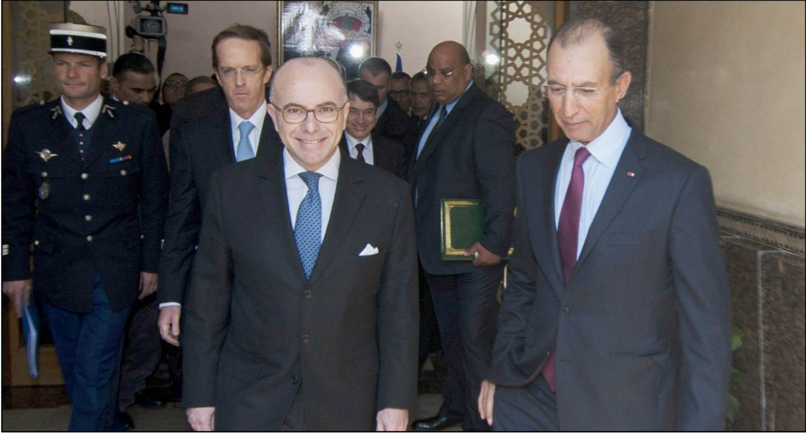
وزير الداخلية المغربي محمد حصاد (يمين) ونظيره الفرنسي برنار كازنوف