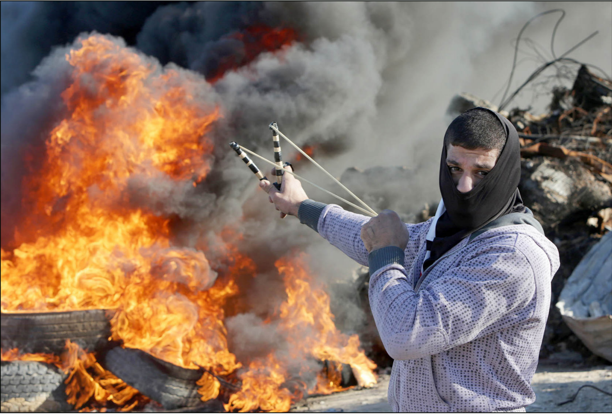
شاب فلسطيني يرمي قوات الاحتلال الإسرائيلية بججارة مقلعة في اشتباكات أمس بإحدى الضواحي الشرقية لمدينة غزة

ونص هذا الاتفاق على وقف إطلاق النار الذي رعته مصر ووقف الجانبين الهجمات المتبادلة