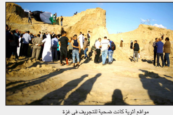
مواقع أثرية حصية للتجريف في غزة