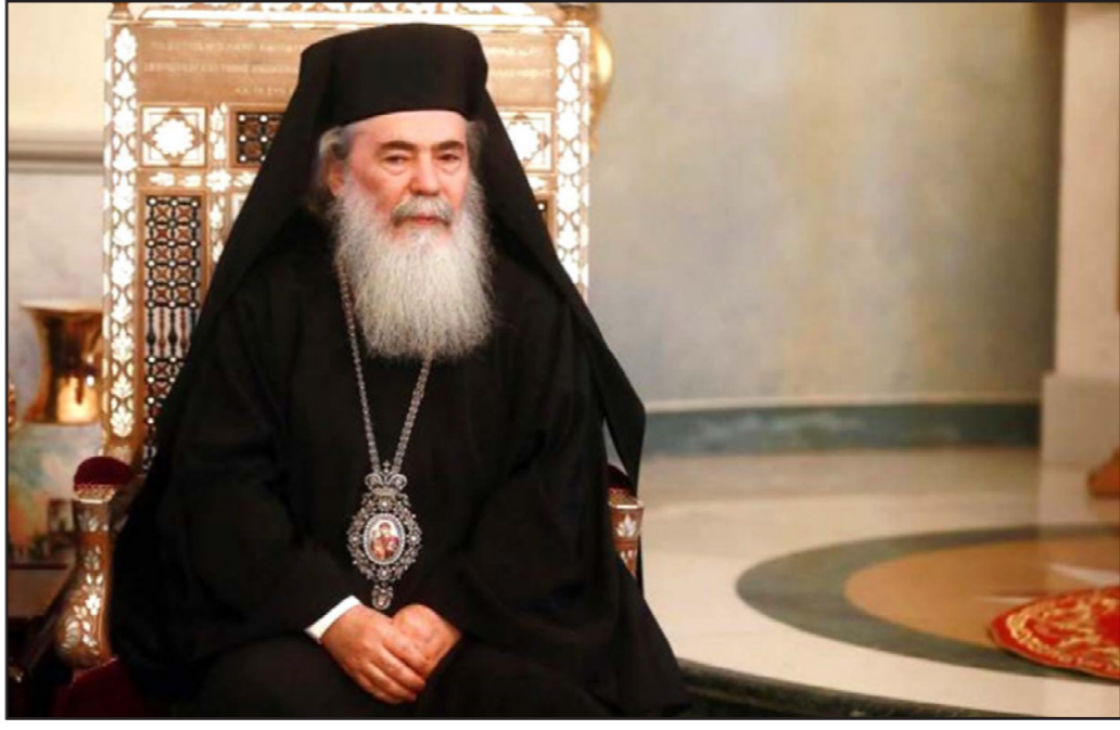
بطريرك الروم الأرثوذكس ثيوفيلوس الثالث

عاما في غالب الأحيان، لكن بعد انتهاء المدة تصبح العقارات «المؤجرة» ملكا للجهات التي دفعت ثمنها، كما أن ثمن المباني الموجودة في هذه الأراضي يقدر بعشرات ملايين الدولارات مما يثير شبهات حول طبيعة هذه الصفقات. ويستدل من الوثائق الثلاث التي نشرتها «هآرتس» يوم الجمعة الماضي أنه يتبين أن الجهات التي استأجرت/ اشترت العقارات هي شركات خاصة اجنبية مسجلة في دول تعتبر «ملجأ الضرائب» التي تهرب الشركات فيها من دفع ضرائب، وغالبا ما تكون شركات مشبوهة، ولا يمكن الحصول على معلومات أصحاب الأسهم في هذه الشركات أو معرفة هوية الموقعين على الصفقات، وهي صفقات تتم بواسطة محامين إسرائيليون عادة. ولفتت الصحيفة إلى أن معظم هذه الأراضي اشترتها البطريركية اليونانية الأرثوذكسية أو أنه تم نقل ملكيتها إليها وتسجيلها باسم البطريركية، ما يعني أن الملكين الأصليين وهيو أراضي للكنيسة. وأبرمت صفقات بيع أراضي البطريركية اليونانية الأرثوذكسية في العقود الماضية مع جهات إسرائيلية رسمية، بينها ما يعرف بـ«كيرن كيمت