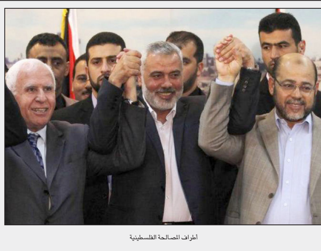
أطراف المصالحة الفلسطينية