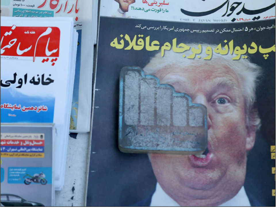
خبر عن موقف ترامب من الاتفاق النووي مع طهران في صحف إيرانية