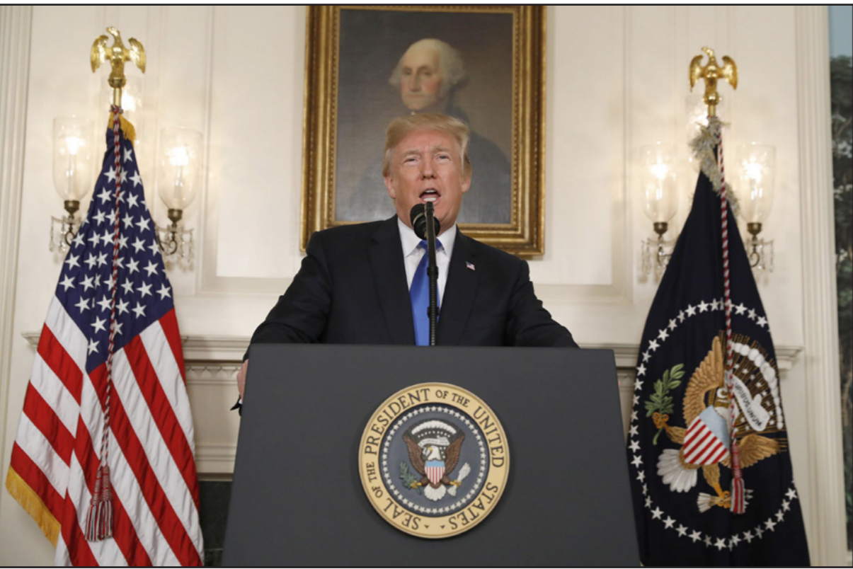
الرئيس الأمريكي دونالد ترامب خلال إلقاءه خطاب الاتفاق النووي مع إيران

حتى لو فرض الكونغرس عقوبات جديدة، وينبغي حتى لو تكون ناجحة، فينبغي أيضا أن يكون كل باقي الدول الخمسة الوقعة على الاتفاق، تستنصم