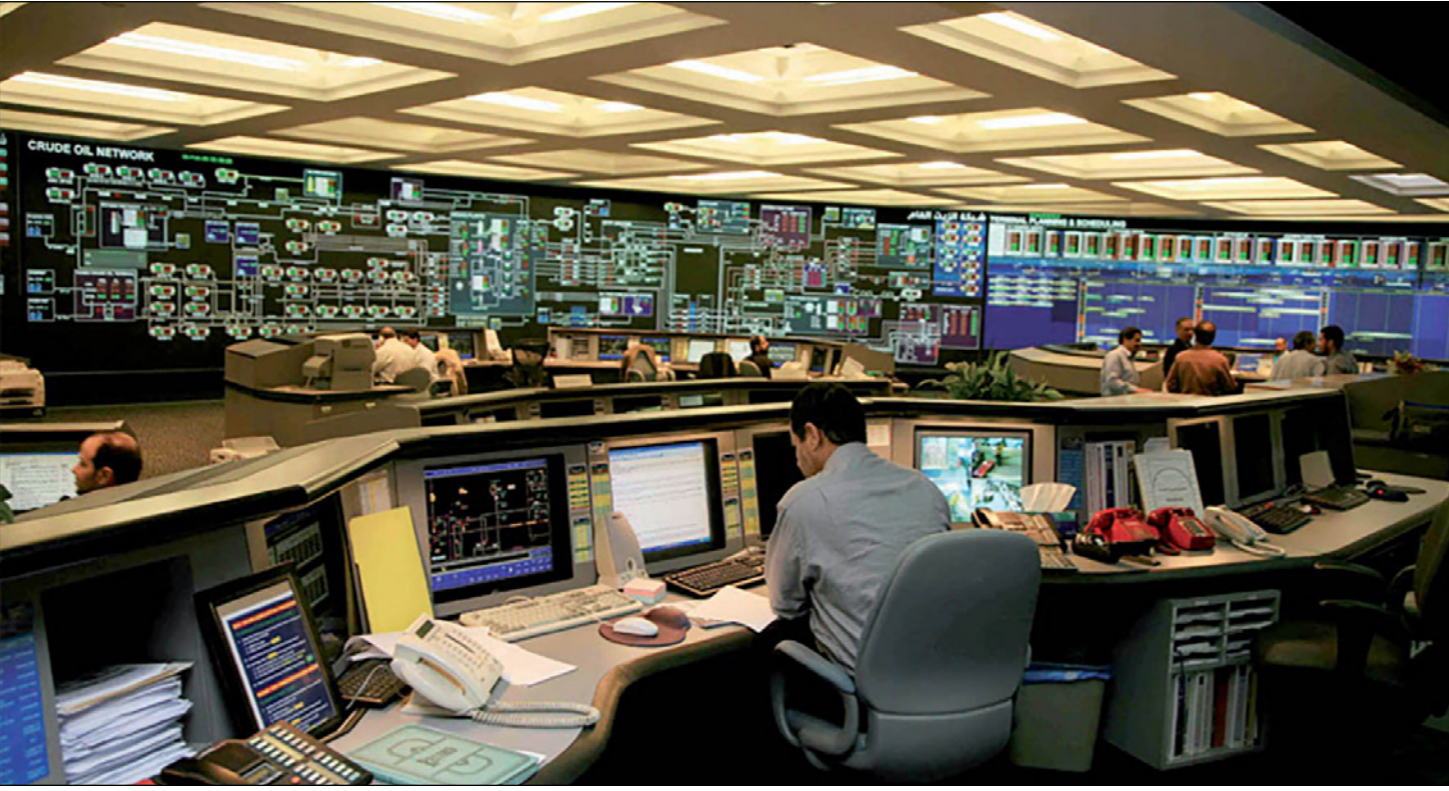
مركز السيطرة في شركة «أرامكو السعودية»

في بريطانيا من أنه سيُضعف حماية المستثمر. وأضاف المصدر الثالث أن تأجيل طرح العام الدولي ما بعد 2018 مازال إلى حد كبير خياراً، على الرغم من أن طرح