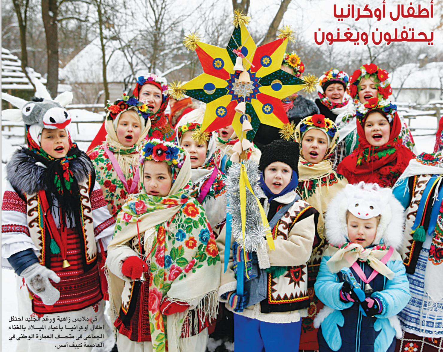
في ملابس زاهية ورغم الجليد احتفل أطفال أوكرانيا بأعياد الميلاد بالغناء الجماعي في متحف العمارة الوطني في العاصمة كييف أمس.