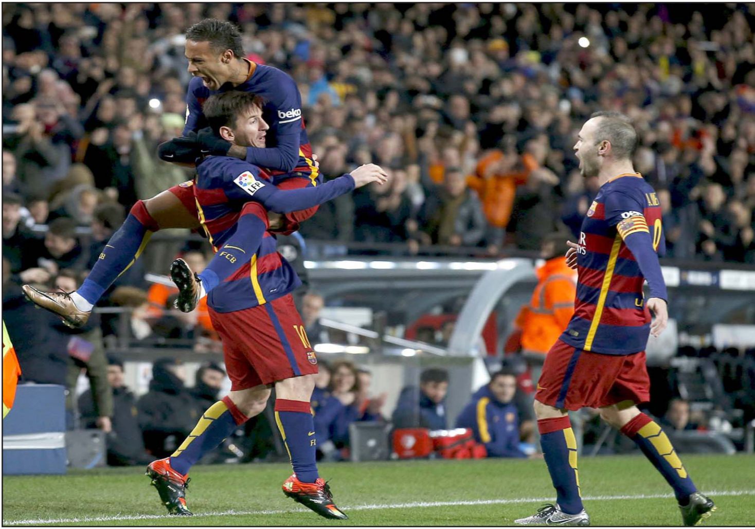
نيمار يعانق ميسي ويهتف على هدفه وأنيستا يقرب للتهنئة

بقال لويس انريكى مديرب برشلونه: يوجب أن تكون كرة قدم وليست كرة قدم أمريكية... ويتسامل الكثيرون الآن هل هناك متنوع من الوقت للسيطرة على الموقف وتعديل مساره؟ وهو التسؤال الذي يفرض نفسه بقوة خاصة مع اقتراب مباراة الدوري الجديد الأسبوع المقبل. وقالت صحيفة «موندو ديبورتيفو»: «على الفريقين أن يسيطروا على المسببين في إشعال الحرائق ومحاولة إطفاء النيران التي لا تزال مشتعلة. التصريحات تفيد أن الجولة الثالثة من مباريات الدوري ستكون فظيعة لأنهم لا يستطيعون حتى ملء درجات ملعبهم، سنرى إذا كانوا سيتمكنون من ملء الملعب في العودة لأنه لم يكن ممكناً في ذلك اليوم (السبت)». ومن جانبهم، قال بايبي ديوب لاعب اسبانيول: «لا يمكن أن نقول أننا لجأنا إلى العنف، لم يكن هناك دم، إذا كنا نرغب في ذلك كان بإمكاننا أن نخرج لاعبي برشلونه من الملعب محمولين على محفلات».