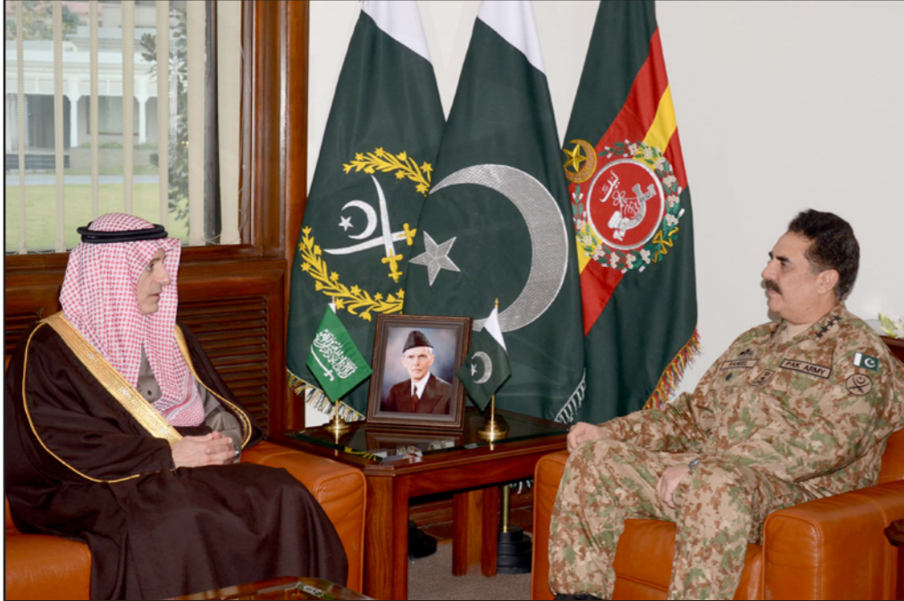
وزير الخارجية السعودي أثناء لقائه قائد الجيش الباكستاني أسن في إسلام آباد

■ إسلام آباد - الأناضول: التقى وزير الخارجية السعودي «عادل الجبير»، أمس الخميس، «برحيل شريف» رئيس هيئة الأركان الباكستانية، وبحثا مع العديد من القضايا المتعلقة بالأمن الإقليمي. وجرت أحداث اللقاء في مقر هيئة الأركان الباكستانية في العاصمة إسلام آباد التي وصلها «الجبير» في وقت سابق أمس، لإجراء محادثات رسمية، بحسب بيان صادر عن الجيش الباكستاني، في هذا الشأن.