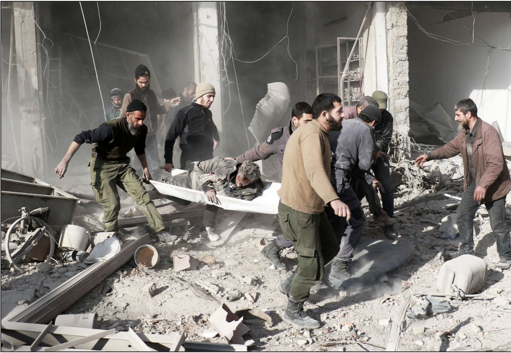
سوريون يعملون على إجلاء رجل أصيب عقب غارات النظام على ضاحية الزمكا