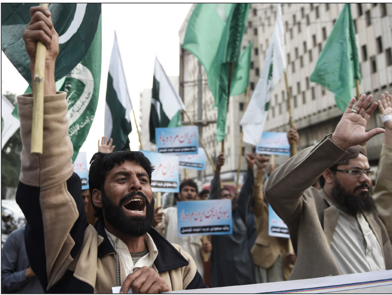
مسلمون باكستانيون سٲة يطلقون احتجاجات ضد إيران أسس في كرانشي

وعد الطلاب الإيرانيين في سوريا. من الأدب إلى الدعاية