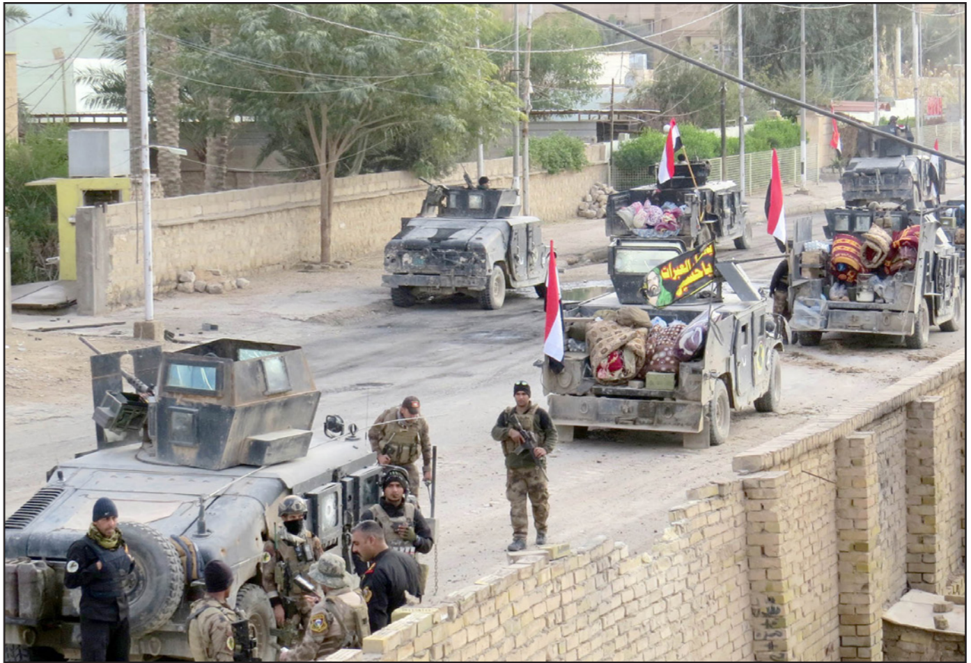
عناصر من الجيش العراقي وسط مدينة الرمادي

وأشارت المصادر أن مجلس محافظة نينوى وحكومة الأقليم «سابق وأوروبي» عن رغبتهم بعودة عناصر حزب العمال التركي إلى تركيا بعد انتهاء معركة تحرير سنجار التي ساهموا بجهد محدود فيها «وذلك من أجل إعادة تأهيل المناطق التي يوجدون فيها تمهيداً لإعادة سكان سنجار النازحين في الخيمات» إلا أن تلك الجماعة رفضت الانسحاب من مناطقها في سنجار.