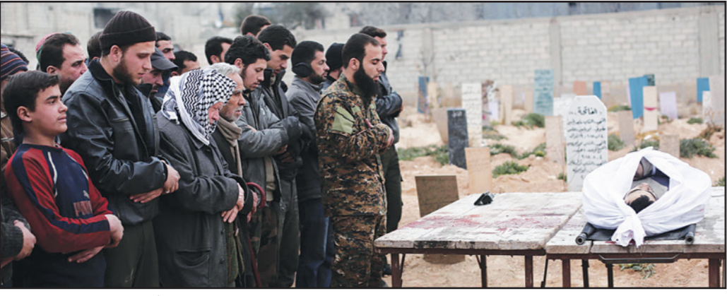
سوريون يؤدون صلاة الجنزة على مدني قتل بعد غارة روسية على بلدة دوما أمس

القاهرة - «القدس العربي» - وكالات: قالت مصادر أمنية في مصر إن مسلحين يستغلون دراجة نارية أطلق النار على سياح أثناء صعودهم إلى حافلة سياحية في مدينة الجيزة القريبة من العاصمة، أمس الخميس، لكن الهجوم لم يسفر عن إصابات. وأضافت المصادر أن الهجوم وقع خارج فندق يقع على طريق يؤدي إلى منطقة الأهرامات، مشيرة إلى أن الأمن ألقي القبض على مسلح في موقع الحادث، بينما يحاصر المسلح الآخر في منطقة أخرى. وتابعت المصادر إن إسرائيليين كانا من بين السياح الذين استهدفهم الهجوم. لكن وزارة الداخلية المصرية أعلنت رواية مختلفة للحادث قالت فيها إن سبهما تارية وأعييرة من بنادق