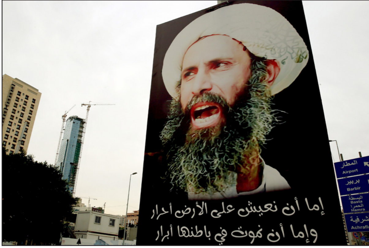
لوحة تحمل صورة نمر الثمر الذي اعدم مؤخرًا

صادقت الحكومة الإيرانية في اجتماع طارئ على قرار بغرض الحظر على استيراد السلع والبضائع من المملكة العربية السعودية، وفي الجانب الدعائي للسرود الإيراني على قطع الرياض علاقاتها مع طهران، اعتبر نائب القائد العام للحرس الثوري، العبد حسين سلامي، بأن الرياض تسير على خطى الرئيس الراحل العراقي الأسبق، صدام حسين المجيد. وأعلن حرس الحدود الأكراني أنه القى القبض على مواطن إيراني بسبب انتهاك الحظر التسليحي المفروض على الجمهورية الإسلامية الإيرانية، ويطلب من السلطات الألمانية، وإفادت وكالة مهر للأنباء التابعة لمنظمة الدعوة الإسلامية الإيرانية، أن مجلس الوزراء الإيراني صادق على قرار حظر دخول السلع السعودية إلى البلاد عبر المداخل المختلفة منها المناطق الحرة والخاصة الاقتصادية. وعقد مجلس الوزراء الإيراني اجتماعاً طارئاً برئاسة حسن روحاني تم خلاله بحث بنود البرنامج السادس للتنمية، ووافق في هذا الاجتماع على قرار حظر دخول السلع المنتجة في السعودية أو المصدرة منها إلى البلاد من كافة الطرق ومنها المناطق الحرة والخاصة الاقتصادية، كما وافق المجلس على استمرار عدم إرسال البعثات لاداء العرة.