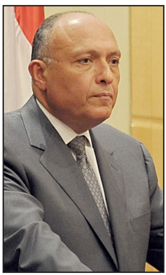
وزير الخارجية سامح شكرى

القاهرة- الأناضول: قال وزير الخارجية المصري «سامح شكرى»، إن «أمن الخليج جزء لا يتجزأ من أمننا القومي»، مشيراً إلى أهمية «أحواء الأزمت عبر الوسائل السلمية». جاء ذلك في تصريحات أدلى بها الوزير المصري، مساء أمس الأول لإجراء جلسة مباحثات موسعة عقدها مع نظيره الألماني «فرانك فالتر شتاينماير» في الخارجية الألمانية. وذكر أن «أحواء الأزمت، يجب أن يكون دون التفریط بالحقوق الخاصة للدول العربية وأمنها، وعدم التدخل في شؤونها الداخلية، وإقامة علاقات على أسس من المصالح المشتركة وليس السعي لتحقيق نفوذ على حساب الدول الجارة». وأضاف الوزير المصري، قائلاً «الجانب الألماني والدول الأوروبية ليفقها التوتر في الشرق الأوسط، لتأثيره على الاستقرار وانتشار ظاهرة الإرهاب والمخاطر التي قد تنتج عن ذلك بالنسبة للساحة الأوروبية». وأصدرت الخارجية المصرية، بيانا حول المباحثات، ذكرت فيه أن «مباحثات مصرية ألمانية موسعة، أجريت، أمس الأول الأربعاء، حول تطورات الأوضاع في المنطقة لاسيما مستقبل سوريا، وتداعيات تدخل إيران في الشؤون السعودية، ومنع نشوب بؤرة توتر جديدة في المنطقة». ولفت البيان إلى أن «الشرق المتوسطي والأوضاع الإقليمية، استغرق جانبا طويلاً من المحادثات، وعكس رغبة الجانب الألماني في التعرف على تطورات الأوضاع السياسية والأمنية في ليبيا، وسبل تجاوز التوتر الحالي في العلاقات السعودية الإيرانية، كما استعرض الجانبان الأوضاع في اليمن بشكل تفصيلي». وحول مستقبل سوريا، تناولت المحادثات الثنائية، الجهود الدولية الخاصة بدفع العملية السياسية في البلاد، والخطوات التي يقوم بها المبعوث الأممي «ستيفان دي ميستورا» بهذا الشأن. واتفق الجانبان المصري والألماني