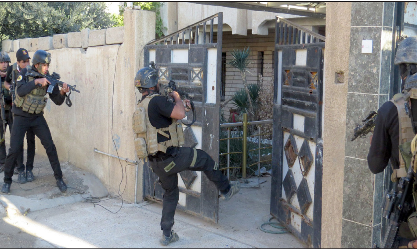
قوات من الشرطة العراقية يفتحمون إحدى المنازل في ديالى تحسبا لوجود عناصر م تنظيم «الدولة»

وقال المصدر إن «مواجهات بين عناصر داعش وقوة من الحشد الشعبي في محور ناحية الصينة غربي قضاء بييجي أسفرت عن مقتل ثلاثة من عناصر الحشد الشعبي».