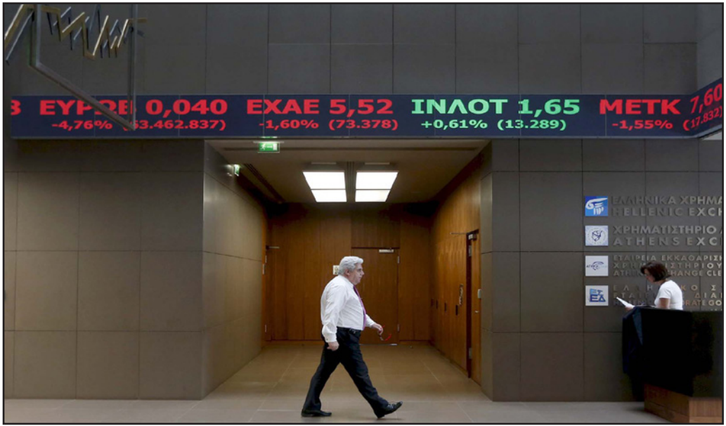
أحد العاملين في بورصة أثينا يرمز بلام لوحة للأسهم

برلين - وقال تسالكوتوس فور وصوله إلى بروكسل «وجدت في كل مكان تعاطفا والناس تبحث عن حلول وليس مشاكل». ويذكر أن اليونان وافقت في تموز/يوليو على خطة المساعداات الدولية الثالثة في خمس سنوات والبالغ حجمها 86 مليار يورو، وتعهدت في المقابل إطلاق العديد من الإصلاحات الاجتماعية والاقتصادية. ومن المتوقع عودة ممثلي الدائنين، البنك المركزي الأوروبي والمفوضية الأوروبية وألية الاستقرار الأوروبي، وصندوق النقد الدولي، التي أُنشئت اعتباراً من 18 كانون الثاني/يناير لإجراء تقييم حول التقدم المحرز خلال فترة ستة أشهر.