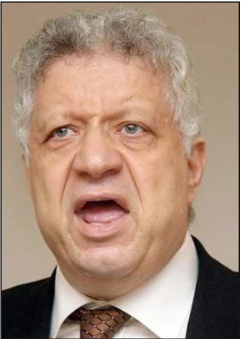
المستشار مرتضى منصور

بزيارة لمجلس النواب وعقد اجتماعاً طارئاً مع د.علي عبدالعالم، رئيس مجلس النواب، داخل مكتبه في المجلس، وقالت مصادر إن رئيس الوزراء قدم التهنئة لرئيس المجلس والوكيلين بانحقاد البرلمان والاتفاق على آليات العمل بين المؤسسات التشريعية والتقنيّة.