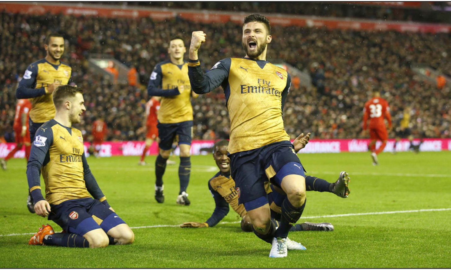
جيرو يحتفل بتسجيله الهدف الثالث لأرسنال وسط فرحة زملائه