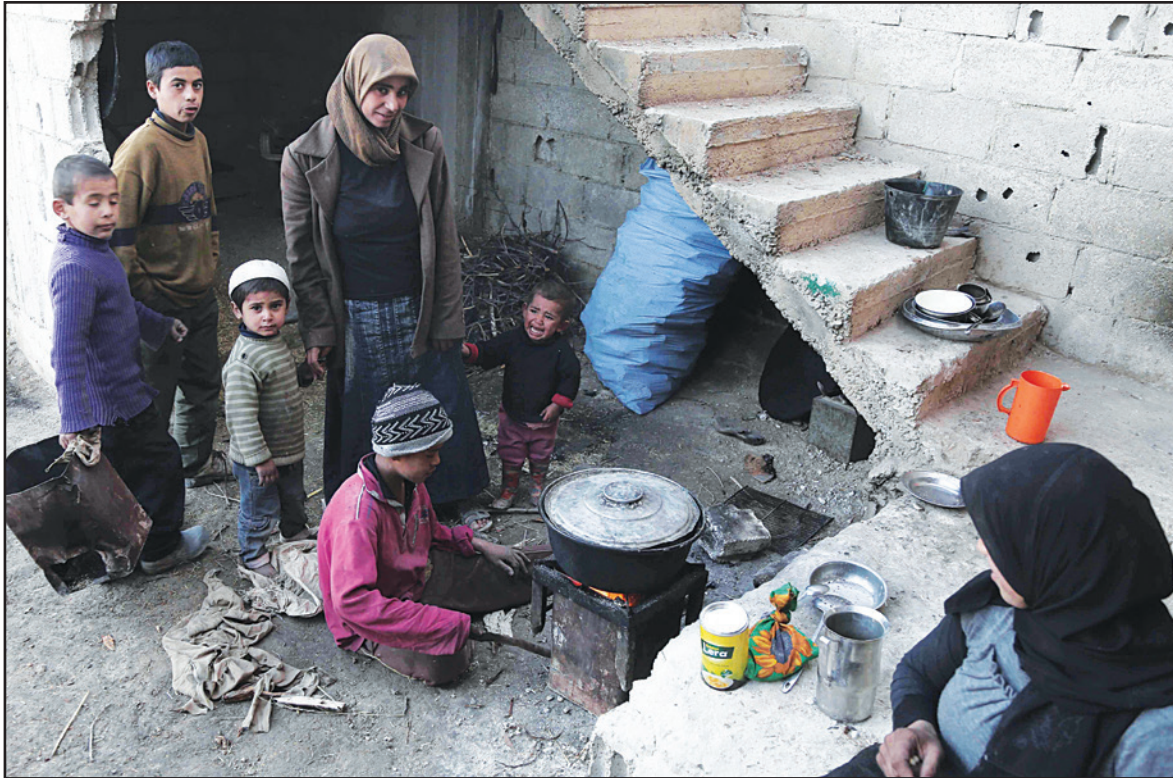
عائلة سورية تخبز طعامها في الغوطة الشرقية التي تسيطر عليها قوات المعارضة

الرمز يوم 25 كانون الثاني/يناير غير واقعي، وجدد التأكيد على مطالب المعارضة برفع الحصار عن كل المناطق ووقف إطلاق النار والإفراج عن المعتقلين قبل بدء المفاوضات. وقال المعارض البارز جورج صبرا عبر الهاتف «أنا شخصيا لا أرى أن موعد 25 يناير هو موعد المفاوضات، بل إننا نرى أن زيل كافة العقبات الموجودة أمام المفاوضات».