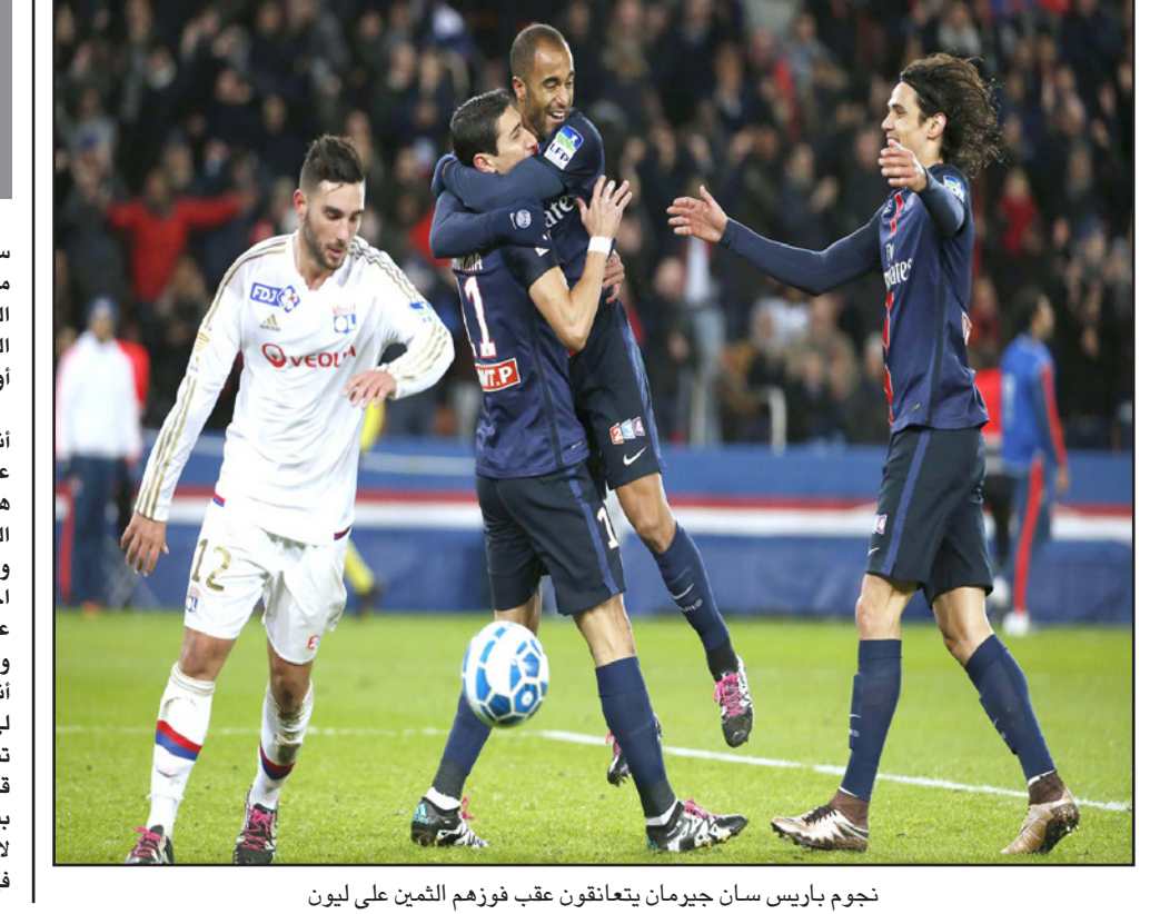
نجم باريس سان جيرمان يتعانقون عقب فوزهم الثمين على ليون

■ سانتياغو - د ب أ: أعرب خورخي سامباولي مدرب منتخب تشيلي، عن استيائه مجدداً من التسريبات الإعلامية لتفاصيل عقد العمل الخاص به، إلا أنه لم يكشف بوضوح في الوقت نفسه عن قراره النهائي حول استمراره أو رحيله عن الفريق. وقال سامباولي في بيان: «ليس حقيقياً أنني لا أرتب في العمل والعيش في تشيلي، على العكس، أنا موجود هنا منذ سبع سنوات، وهدفني من الناحية الإجتماعية والعملية هو البقاء في تشيلي، لا أزال أعيش في سنتياغو». وأشارت تكهات أن سامباولي سيعين عقب اجتماعه مع المسؤولين في الاتحاد التشيلي، عن رحيله عن منصبه الذي تقلده في 2012. وأضاف سامباولي: «أرغب في أن أوضح أنه خلال الأيام الأخيرة حدث موقف جديد لي ظهرت خلاله معلومات غير صحيحة، تم تسريب تفاصيل عقد العمل الخاص بي، حيث قام الاتحاد نفسه بهذا الانتهاك وهو ما أضر بسمعتي وعلاقتي بشعب تشيلي، هذا الموقف لا يمكن تجاوزة، أشجع أنني أمك حسابات في مناطق أخرى تتمتع بنظام ضريبي أفضل