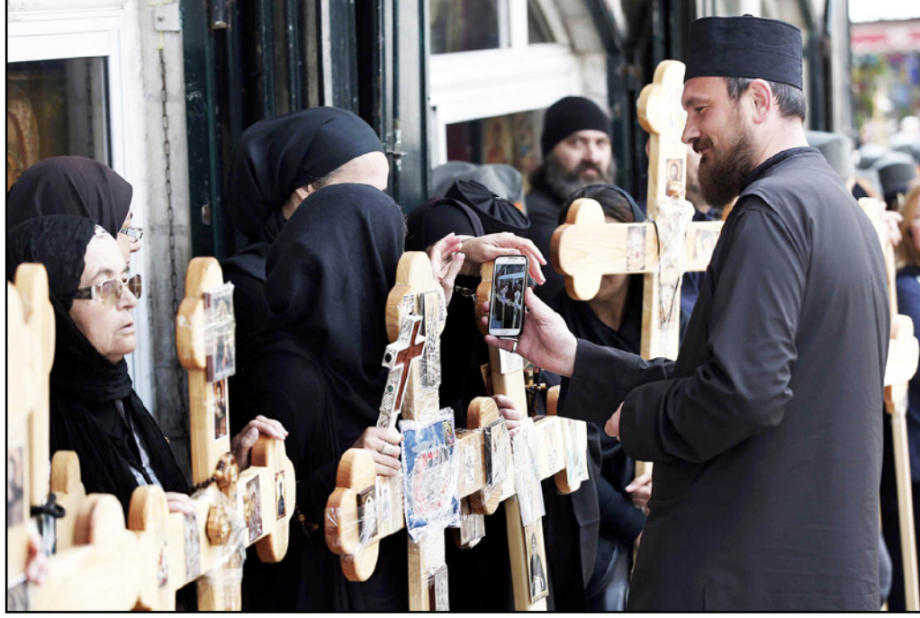
الرهبان يتعرضون لاعتداءات اليهود المتزمتين في القدس المحتلة

الناصرة - «القدس العربي» من وديع عواودة: في كل يوم تتجلى في إسرائيل مشاهد العنصرية والكراهية لغير اليهود، وتزايد الدعوات ضدهم، بدعم أو تجاهل المؤسسة الحاكمة ووسط دعوات لعنة جديدة لطرد المسيحيين من البلاد، من بينها دعوة رئيس حركة «لهاغه» بنتسي غوفشتاين لمنع الاحتفالات بعيد الميلاد، ووصف المسيحيين بأنهم «مصاصو دماء». غوفشتاين الذي يقود جمعية تعنى بمنع زواج اليهوديات من غير اليهود شدد على الواجب بطرد المسيحيين من البلاد، وحتى اليوم ما زال طليقا رغم مطالبات بالتحقيق معه. وفي مقال نشره الموقع المتدين «كوكرك» بعنوان «لنجنت مصاصي الدماء» زعم غوفشتاين أنه لا مكان لعيد الميلاد في الأرض المقدسة، ويجب عدم السماح بعوطة قدم هنا للتبشيرية المسيحية. ولا تتوقف ظاهرة الاعتداءات شبه اليومية على الرهبان في القدس المحتلة من قبل متطرفين ومعتدين مزمتين يهود دون حساب أو رقيب، وقالت صحيفة «يديوت احرونوت» إن مراسليها راقفوا بعض الرهبان في الشهور الأخيرة عدة مرات في تحركاتهم اليومية داخل البلدة القديمة في القدس المحتلة فعادوا بشهادات صادمة.