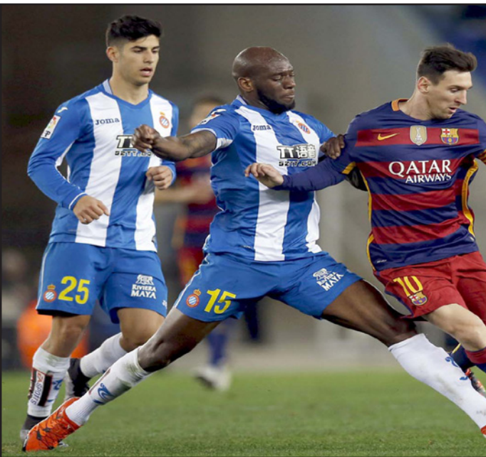
ميسي تالق رغم خشونة دفاع اسبانيول