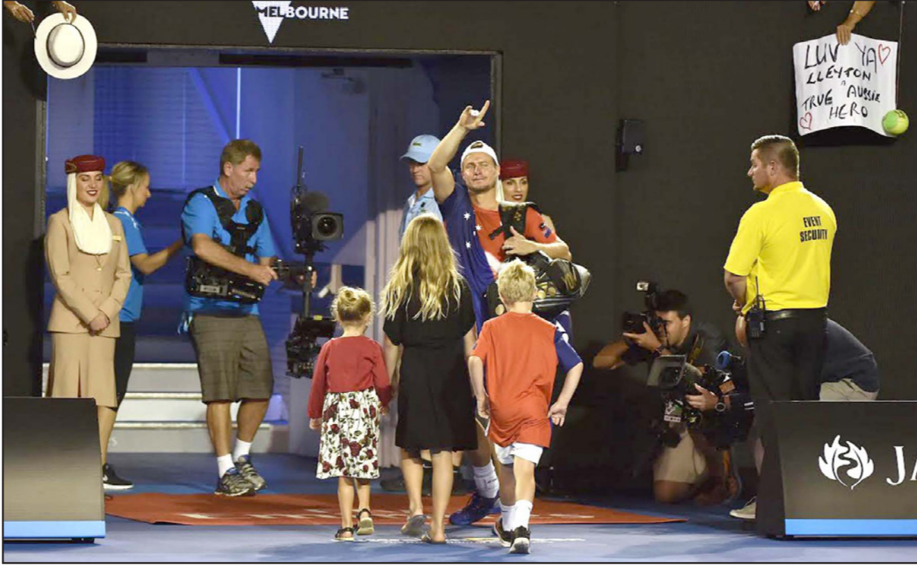
هويت ودع ملايين التنس بصحبة أطفاله الثلاثة

كل فرد منكم، مساندتكم طوال أعوام عديدة تعني الكثير لي، هذا هو المكان الأفضل لأضع فيه نهاية لسيرتي". ولم يستطع توني روتش، المدرب السابق للبطول الأسترالي من حبس دموعه أثناء كلمة الوداع. وتم عرض أحد المقاطع المصورة عبر شاشات العرض في ملعب "رود ليفر"، ظهر خلاله اللاعبون روجيه فيدرر ورافاييل نادال وأندي موراي، أفضل ثلاثة لاعبين في عالم التنس في العقد الأخير، وهم يودعون هويت. وقال فيدرر: "تشكر على كل ما قمت به لرياضة التنس"، فيما أضاف نادال: "دائما ما كنت تمثل لي شيئا مميزا، أنت مصدر رائع للإلهام انعكس على أدائي وتفكيري، أنت مرجع كبير للمستقبل، تشكر على شغفك الذي أظهرته لي الملعب". وفي منافسات البطولة، نفذ موراي خطة وضعا قبل مواجهة الأسترالي صمويل غروث ليفوز عليه 6-صفر و6-4 و6-1 ويتأهل للدور الثالث. وقال موراي عقب مباريات الدور الأول أنه يعلم تماما ما ينتظره أمام غروث الذي يسدد إرسالات قوية ونجح اللاعب البريطاني في تنفيذ ما أراده بالضبط للتغلب على منافسه غير متفهم من تعذيب بلاده في بطولة كأس ديفيز، 29 دقيقة لينهي المجموعة الأولى لصالحه. وعلى الرغم من أن إرسال غروث بدأ يوتي ثماره في المجموعة الثانية إلا أن موراي نجح في الفوز بالنقاط المهمة، وسيطر اللاعب البريطاني على منافسه في المجموعة الثالثة وتقدم 3-صفر قبل أن ينهي المباراة لصالحه ويتأهل لمواجهة البرتغالي جواو سوزا.