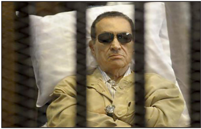
محمد حسني مبارك

القدم ضد حسين سالم، وقبول طعن النيابة العامة شكلا بالنسبة للمدعومين ضدهم عدد حسين سالم، وفي الموضوع تقض الحكم بالسجن المؤبد ضد حسني مبارك عن تهم الاشتراك في القتل العمد والكفالة، وعدم جواز طعن النيابة العامة