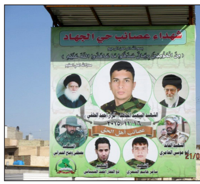
ملصق لبعض ضحايا الميليشيات في العراق