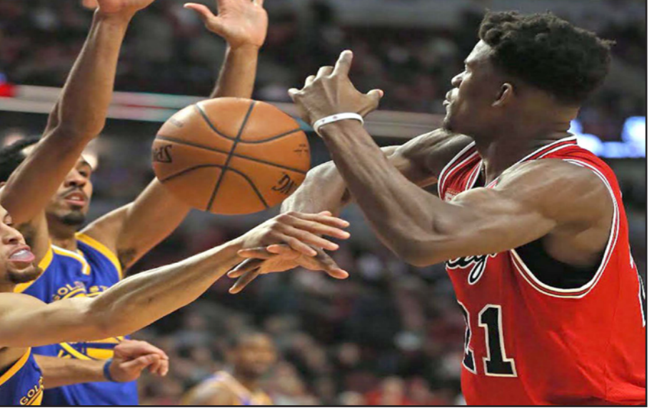
كرة حائرة بين لاعبي واريوزر وبولز

■ وكاف بولز الذي تلقى الهزيمة 17 مقابل الانتصار في 24 مباراة، وخسر بولز مباراته هذا الموسم أمام غولدن ستيت، وتقدم بولز في أول أربع دقائق