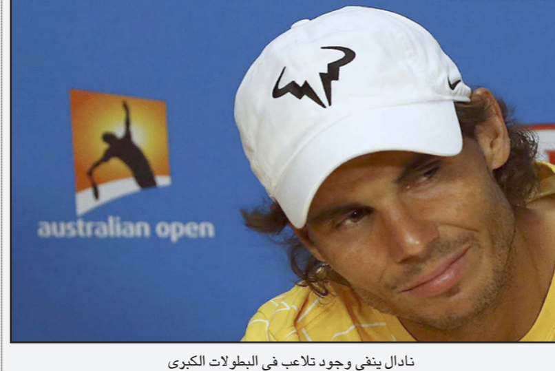
نادال ينفي وجود تلاعب في البطولات الكبرى

■ مليونر (أستراليا) - د ب أ: قال لاعب التنس الإسباني رافاييل نادال إنه ليس متأكدا من وجود رهانات غير قانونية في بطولات التنس الكبرى، مطالبا هيئة الإذاعة البريطانية (بي بي سي) وموقع "بازفيد نيوز" بتوثيق الاتهامات بالاذلة والأسماء. وقل المصنف الأول على العالم سابقا: "لم أشعر بحدوث أمر كهذا أو رأيته يحدث في موسم بطولات الرباط العالمية للمحترفين، كما لم يتواصل معي أحد في هذا الشأن طوال حياتي وليس لدي أي معلومات أن هذا الأمر يحدث، أسمع عن هذا في البطولات الصغرى للهواة، هناك أساس يقومون بذلك في تلك البطولات". وكانت "بي بي سي" وموقع "بازفيد نيوز" أشارا مؤخرا إلى أن 16 لاعبا، من المصنفين الـ50 الأوائل في الترتيب العالمي، بعضهم فاز بالقب في بطولات "غراند سلام"، يشكبه في تورطهم في عملية تلاعب بنتائج المباريات. ولا يعتقد نادال، الذي فاز بـ14 لقباً لبطولات "غراند سلام"، أن هناك أي تلاعب في هذه القضية: "في البطولات التي نخوضها من المستحيل أن يكون هناك أحد الفائزين ببطولة من غراند سلام قام بالتلاعب بنتائج المباريات... عليهم أن يكفوا عن الأسماء الحقيقية، لا يمكن القول أنهم أبطال لغراند سلام وحسب، عمادا نتحدث على المنافسات