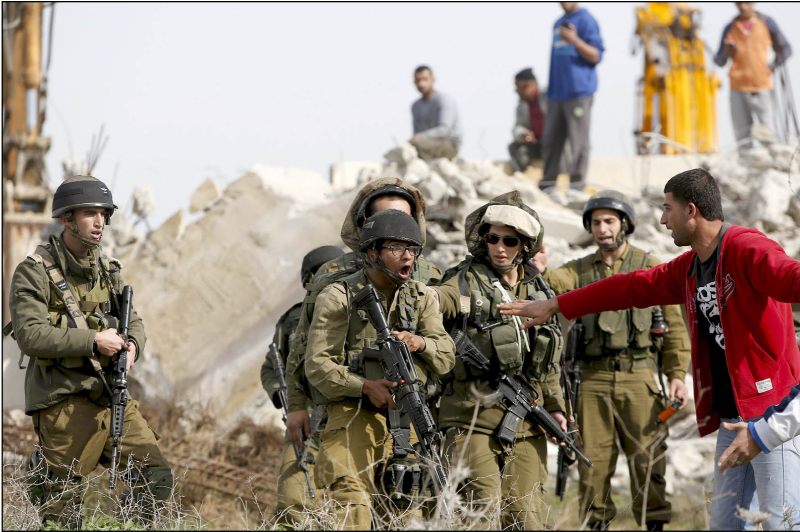
فلسطيني يتجادل مع قوات الاحتلال الاسرائيلي أثناء هدم منزل عائلته في الخليل

وجاء من الناطقة بلسان منسق عمليات الحكومة في الضفة أنه «بناء على قرار القيادة السياسية والغصص الذي أجرته الجهات المعنية، تمت المصادقة على الإعلان ويجري الإعداد حاليا للنشر على اعتبار هذه الأراضي تابعة للدولة». وفي موضوع آخر أعلن جهاز الشاباك الإسرائيلي أنه اعتقل خمسة فلسطينيين من منطقة طولكرم خططوا لتنفيذ عمليات في إسرائيل وعملا بتوجيه من حزب الله، وتم تقديم لوائح اتهام ضد الخمسة في المحكمة العسكرية في الشهر الماضي. وحسب الشاباك فقد تم تجنيد رئيس الخلية محصور زغول 32 عاما من قبل جواد نصرالله ابن زعيم حزب الله حسن نصرالله عبر شبكة الانترنت. وكان جواد يهدف إلى تفعيل خلية إرهاب عبر الانترنت حسب الشاباك. وقام ناشط آخر من حزب الله اسمه فادي بتوجيه زغول لفتح بريد الكتروني لتلقي التوجيهات من التنظيم. وحسب الشاباك فقد أزع جواد نصرالله لزغول بتنفيذ عمليات بواسطة أحمزة ناسفة وانتحاريين وتعقب قوات الأمن الناشطة في المنطقة، وطلب زغول من نصرالله مساعدته في الحصول على سلاح وتحويل.