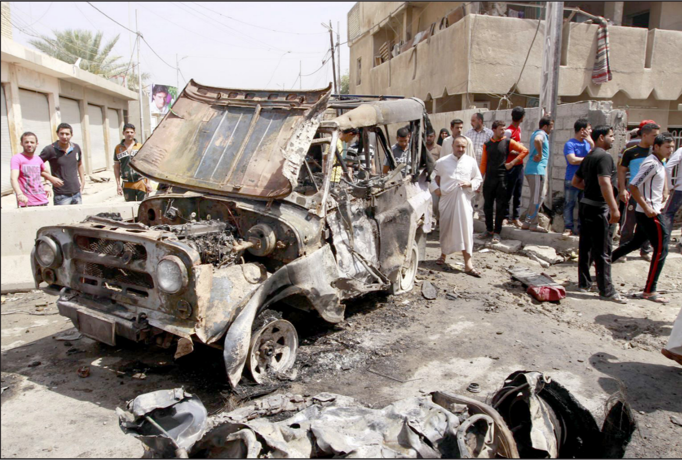
جانب من التفجيرات التي ضربت بغداد

كانت لسنوات ساحة معارك وتحتوي آلاف الخلفات الحربية كالتفجيرات والألغام غير المتفجرة الباقية من الحروب بين العراق وإيران والتحالف الدولي، والتي تتسبب في سقوط الكثير من الضحايا المدنيين.