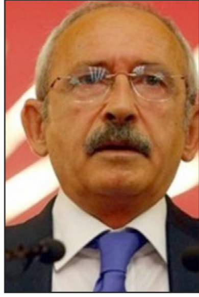
كمال كليتشدار أوغلو