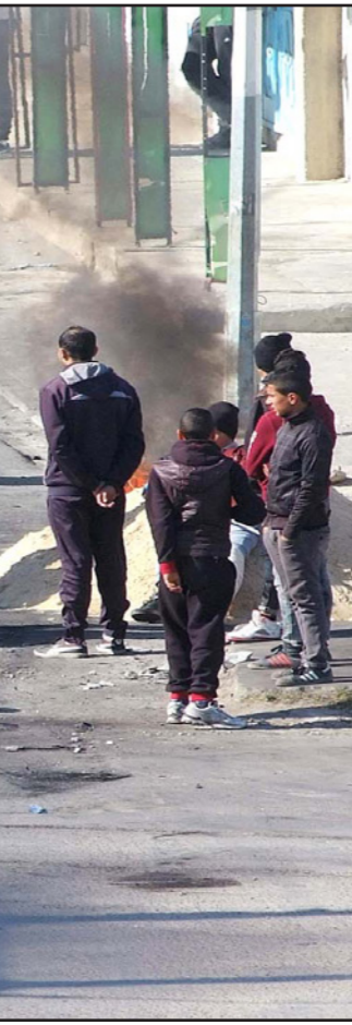
جانب من الاحتجاجات المتواصلة في مدينة القصرين التونسية

وأضاف لـ«القدس العربي»: «الحكومات المتعاقبة التي أتت بعد الثورة إلى اليوم لم تلب تطلعات الحركات الاجتماعية، حيث انتهت سياسة رأسمالية متوحشة تطبق فيها حرقاً وأمر صندوق النقد الدولي، في ما يقدر انهيار حوالي 40 بالمئة من القدرة