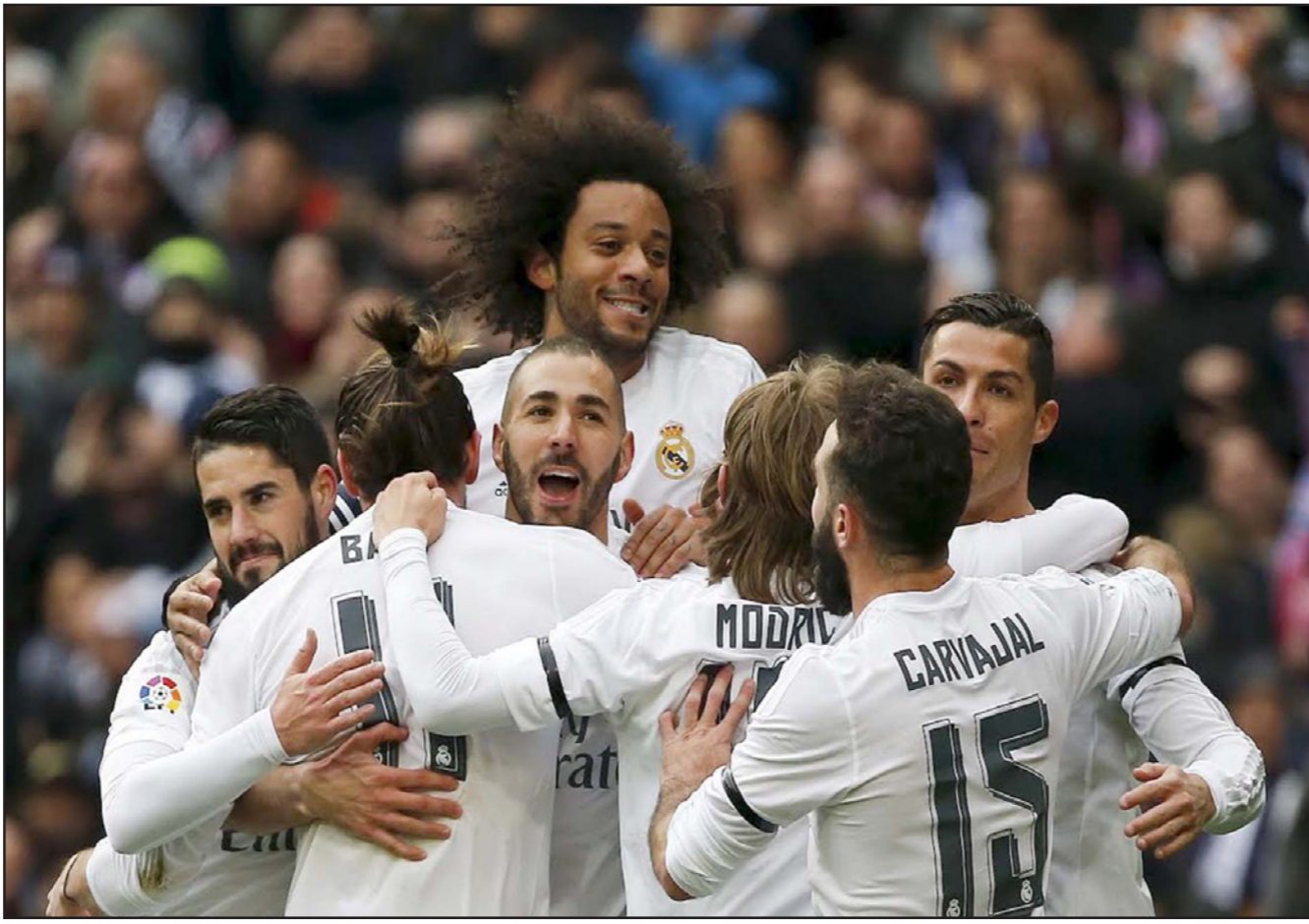
نجوم ريال مدريد ساهموا في جعل ناديهم الاثري في العالم

لندن - د. أ. كشف بحث لمجموعة ديلويت للخدمات المالية عن أن نادي ريال مدريد الإسباني ما زال يحتفظ بالصدارة في قائمة أغنى أندية العالم في الوقت الذي تراجع فيه بايرن ميونخ الألماني لأدنى مرتبة له منذ نحو عقد من الزمان. وبلغت إيرادات ريال مدريد 577 مليون يورو في موسم 2014/2015 ليتصدر التقرير المالي السنوي لأندية كرة القدم لمجموعة ديلويت للعام الحادي عشر على التوالي. واستعداد برشلونة بطل أوروبا وأسبانيا المركز الثاني محققا إيرادات بلغت 560.8 مليون يورو يليه مانشستر يونايتد الإنجليزي في المركز الثالث بإجمالي إيرادات 519.5 مليون يورو. وأوضح التقرير: "بالنسبة لمانشستر يونايتد فإن حفاظه على المركز الثالث في القائمة إنجاز كبير، وهناك احتمال أن يتصدر الفريق القائمة في العام المقبل". وجاء باريس سان جيرمان بطل فرنسا في المركز الرابع بإيرادات بلغت 480.4 مليون يورو يليه البايرن في المركز الرابع بإيرادات 474 مليون يورو، ليحتل بذلك أدنى مرتبة له منذ موسم 2007/2008. وقال التقرير: "البايرن يحصل عادة على أفضل تناقصية من خلال مساهمته القوية في السوق الألماني لكن في موسم 2014/2015 ولأول مرة حققت ستة أندية إيرادات اعلانات بأكثر من 200 مليون يورو، وفي خلال المواسم الثلاثة الماضية،