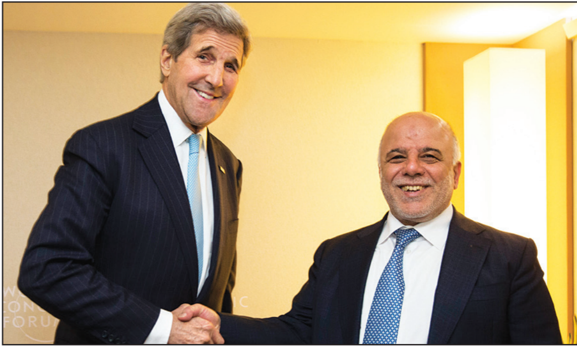
وزير الخارجية الأمريكي جون كيري يصافح رئيس وزراء العراق حيدر العبادي في ملقني دافوس أمس

على صعيد آخر ندد الرئيس العراقي فؤاد معصوم ونواب أكراد في مجلس النواب الاتحادي بالاعتداءات التي يتعرض لها الطوار في محافظة صلاح الدين بين عناصر «الحشد الشعبي» والبيشمركة، وبعد تصاعد الخلافات بين بغداد وأربيل منذ فترة رئيس الوزراء السابق نوري المالكي.