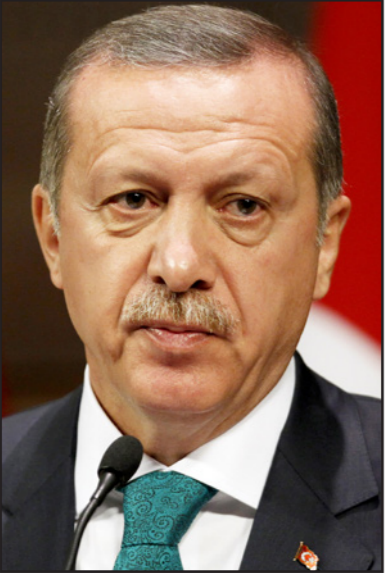
رجب طيب أردوغان