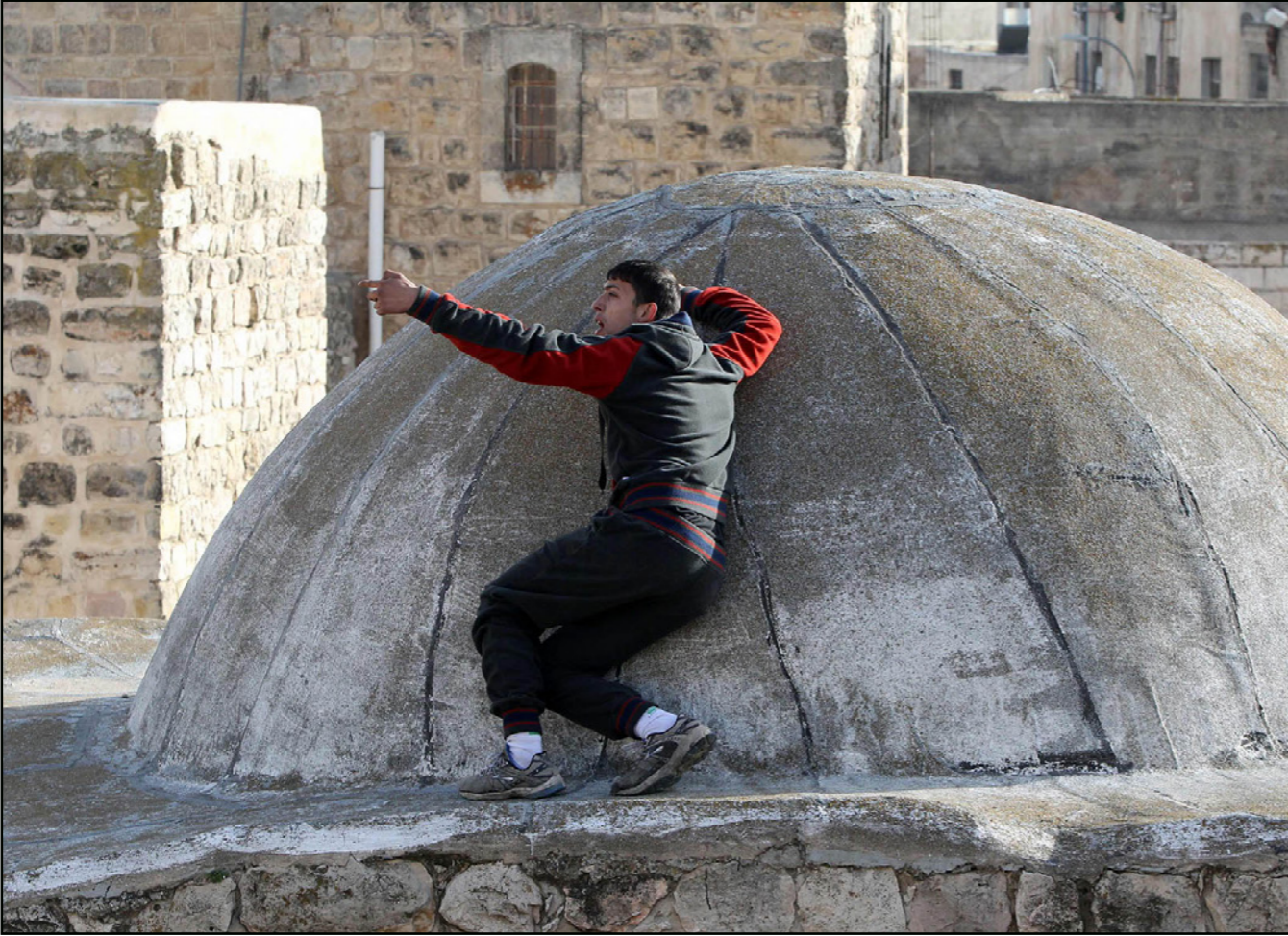
شاب فلسطيني يبرشق قوات الاحتلال بالحجارة