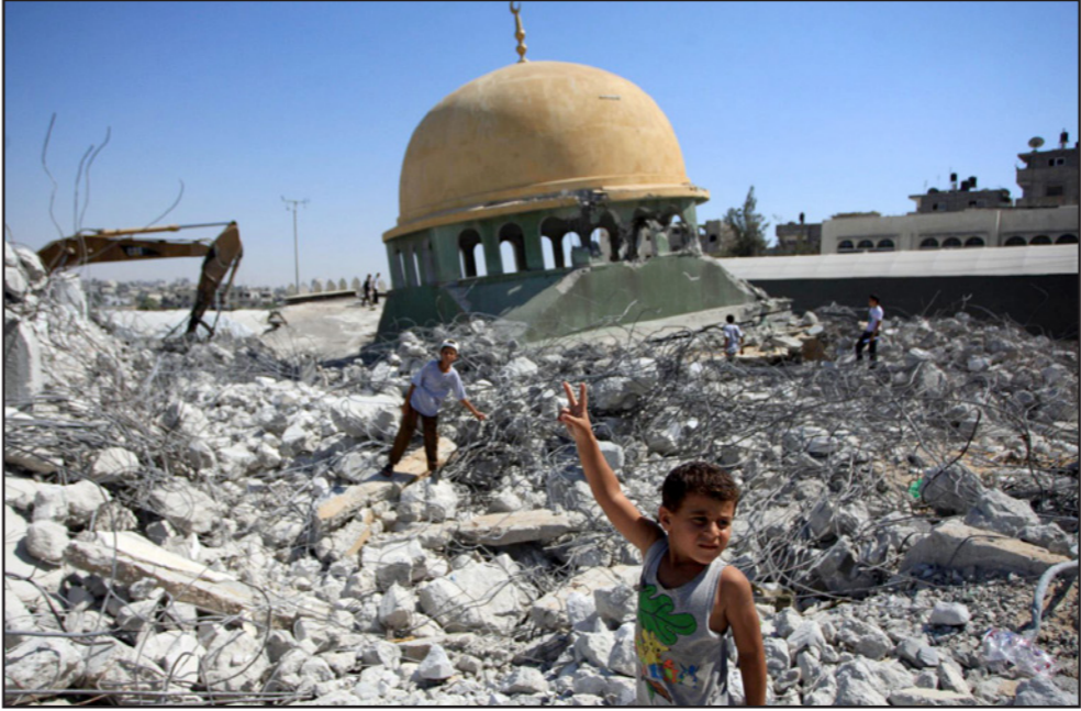
جانب من الدمار الذي أصاب غزة على يد الجيش الإسرائيلي

يسبب عنف في العائلة. 50 في المئة من الشبان في غزة اعلنوا في استطلاعات مختلفة بانهم يريدون الهجرة من القطاع إلى ابيد، ووجد الجيش الاسرائيلي شهود على الظاهرة: طلاب حصولا على تصاريح عبور في ايرز، يخرجون من القطاع ويقفون الارض، من ناحية، فقد تحروروا من السجن. فترة العودة انكسرت، دعوهم فقط بهربهم، حتى منتصف 2015 كانت العائلات التي تمكنت من ذلك انصرفت عبر الاتفاق إلى مصر أو إلى ليبيا، وبحثت عن سفينة إلى أوروبا.