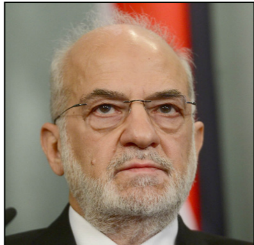
وزير الخارجية العراقي إبراهيم الجعفري