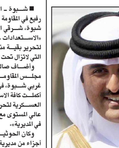
أمير قطر الشيخ تميم بن حمد آل ثاني

■ الجهد وتكثيف الاتصالات من أجل المساهمة في إيجاد حل للأزمة السورية». هذا وتأتي هذه الخطوة في ظل التقارب الحاصل بين موقفي الدوحة وموسكو بعد إزاحة الجليد عن علاقتهما التي تأثرت في وقت سابق على ضوء الخلافات الاستراتيجية بين الطرفين حول عدد من القضايا. وكان الشيخ تميم بن حمد آل ثاني توجه إلى موسكو في أول زيارة له إلى روسيا الاتحادية منذ تأجيل القمة التي