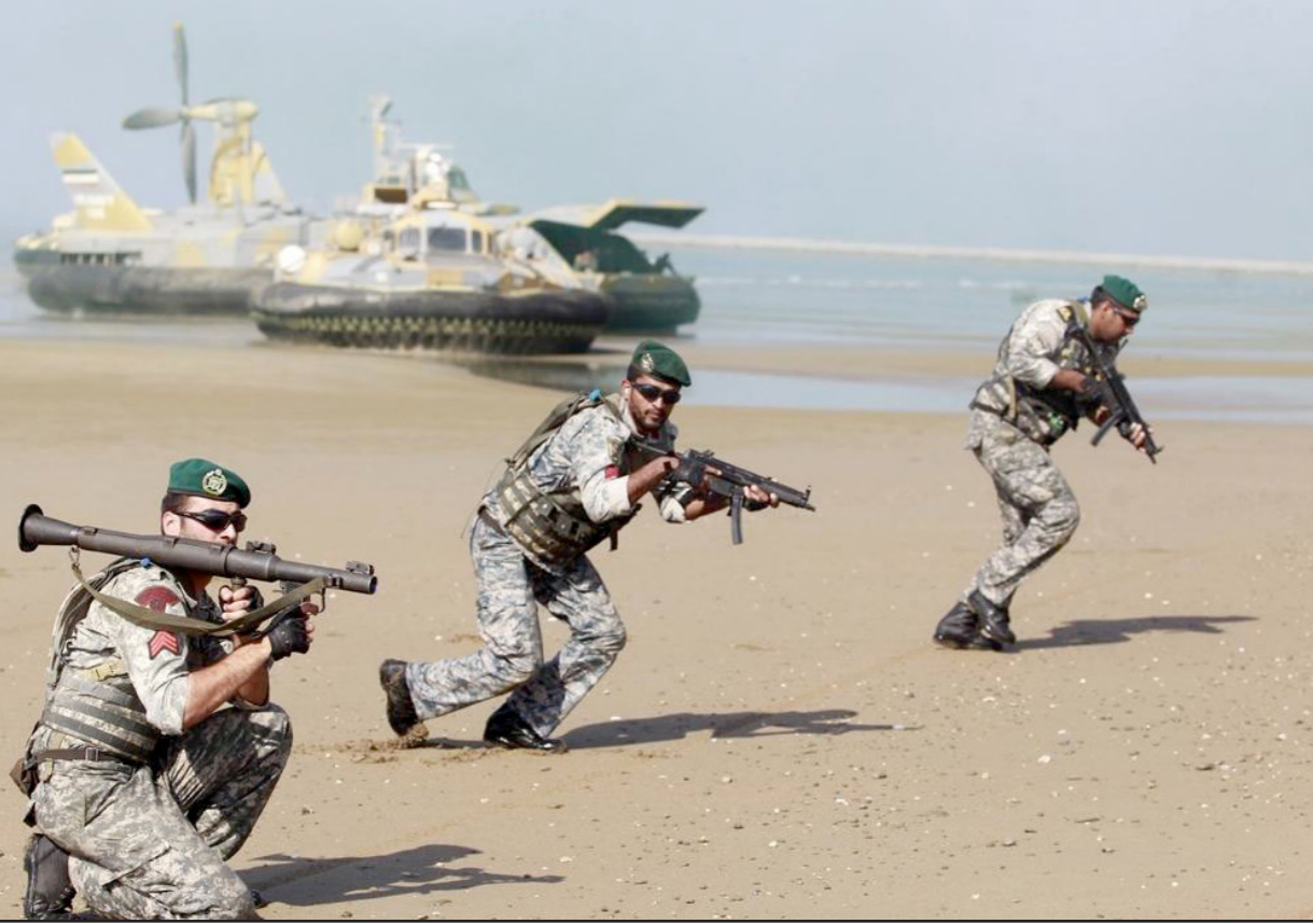
جانب من مناورات «رعد الشمال»

■ الرياض - رويترز: - تجري حاليا على الأراضي السعودية أكبر تدريبات عسكرية على الإطلاق في الشرق الأوسط. وقالت السعودية الدولية المضيفة للمناورات أمس الإثنين إن من شأنها تعزيز التعاون بين 20 دولة مسلمة تشارك فيها في وقت تسعى فيه المملكة لكبح النفوذ المتنامي لمنافستها الإقليمية إيران. ويشارك في مناورات «رعد الشمال» التي بدأت يوم 14 فبراير/ شباط وتستمر حتى العاشر من مارس/ آذار أكثر من 150 ألف جندي من دول الخليج العربية ومصر والمغرب وباكستان وبنجلادش والأردن والسودان والسنغال. وقال مجلس الوزراء السعودي في بيان إنّه يأمل «أن تحقق تلك المناورات ما تم تحديده من أهداف في تبادل الخبرات ورفع مستوى التنسيق العسكري». وأشار البيان كذلك «بمراحل الاستعداد والإمكانات الإدارية والتدريبية التي وفرتها الجهات المعنية لإنجاح مناورات» رعد الشمال «التي تعد أكبر تدريبات عسكرية يشهدها تاريخ منطقة الشرق الأوسط». وتشعر السعودية بالقلق من تنامي النفوذ الإقليمي لإيران التي خرجت لها من سنوات من العزلة بسبب عقوبات اقتصادية دولية رفعت بموجب اتفاق دولي بشأن برنامجها النووي. والرياض التي تسهم بأكثر عدد من القوات في المناورات قلقة أيضا من تراجع دور حليفها الرئيسية الولايات المتحدة في المنطقة وتوسعي لبناء تحالفات عسكرية بديلة لمواجهة إيران. وتقول السعودية تحالفا من دول إسلامية تدعمه الولايات المتحدة وبريطانيا وفرنسا في حرب في اليمن المجاور وتقول إنها ستستهم