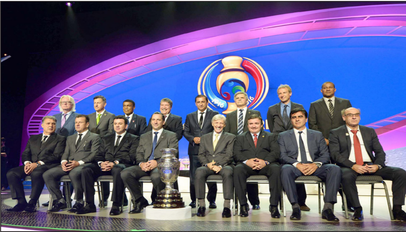
مدرّبو المنتخبات الـ16 المشاركة في البطولة عقب مراسم القرعة