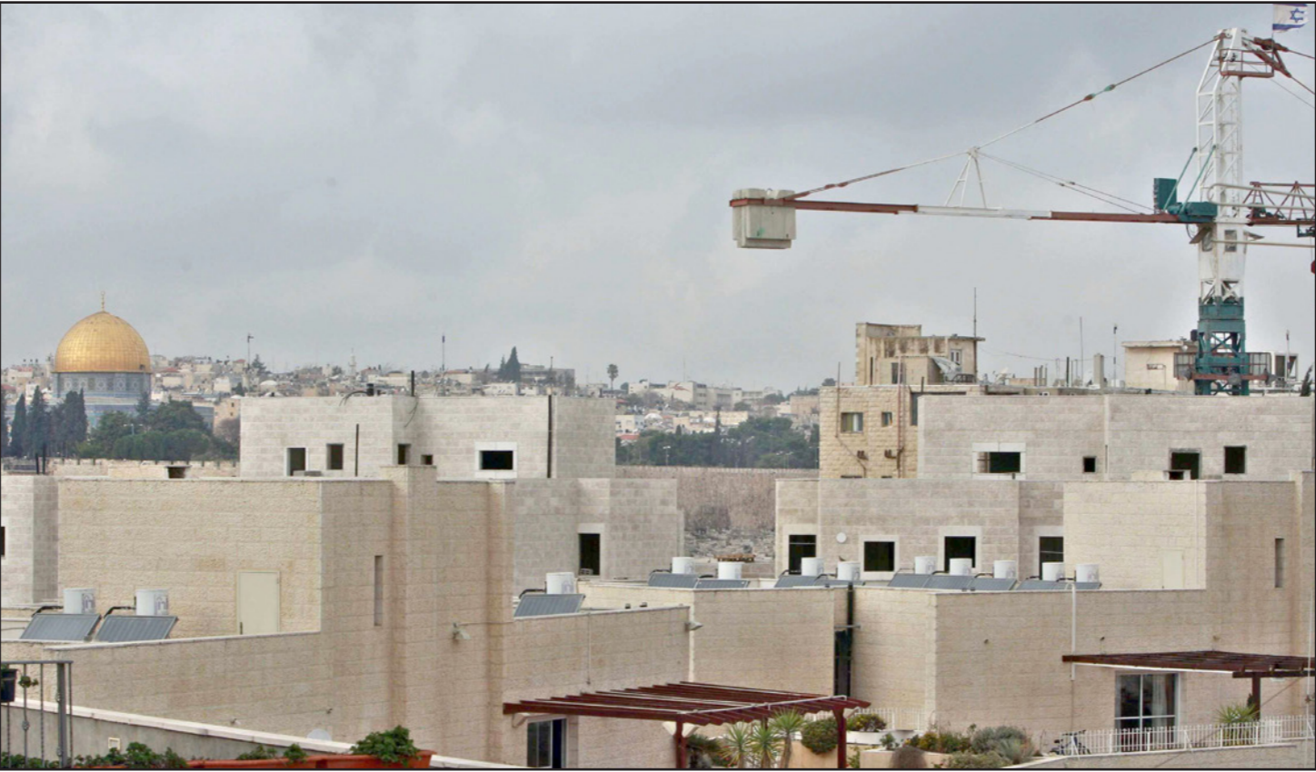
الكتل الاستيطانية عائق أمام الدولة الفلسطينية

(ب) على حساب المناطق التي توجد الآن تحت السيطرة الاسرائيلية، أن لم يكن السعي إلى ضم باقي «المناطق التي توجد اليوم تحت مسؤولية اسرائيل»، أي مناطق كل ج ك ذلك ملتما في اليمين، على أمل التسبب للفلسطينيين على المدى البعيد بالتسليم بمبدأ الدولة الملتصقة بين جين ورام الله الغير قابلة للحياة.