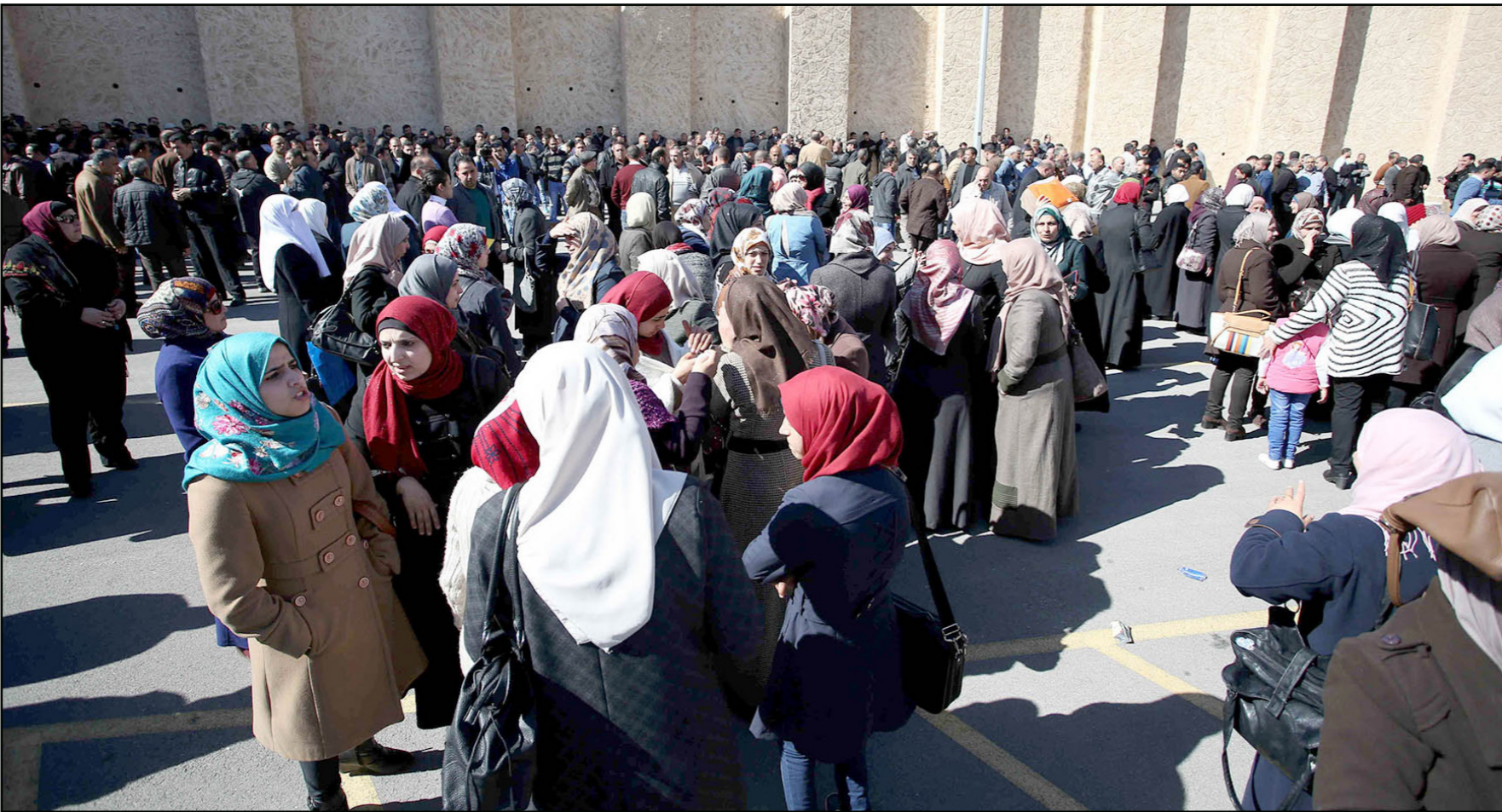
إضراب المعلمين الفلسطينيين في الضفة الغربية يتواصل

والاستعداد لامتحانات التجريبية قبل التقدم لامتحان الثانوية العامة الرسمي من الوزارة أواخر مايو/ أيار المقبل.