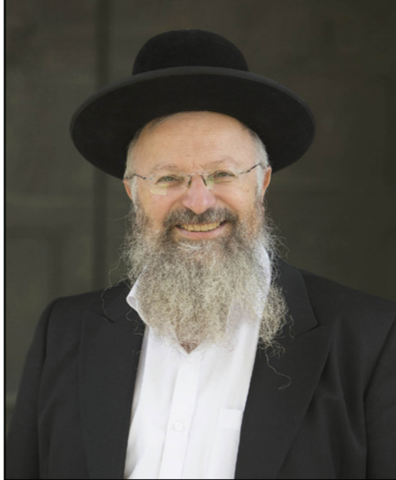
حاخام صغد شموئيل الياهو

لعد تم العنصرية السافرة في إسرائيل تقتصر على فئات متطرفة مثل تهيمين على التيار المركزي وتطال حتى الجامعات، ويتضح أن عددا متزايدا من الحاخامات يصمون الزيت على نارها بدلا من العكس. وفي «عظة» دينية جديدة يقول حاخام مدينة صغد المحلطة عام 48، إن اليهود سلكوا العرب في اتفاق أو سولو على أمل أن يقتتلوا داخليا إلا أنهم وجها السلاح نحونا، وتوجه أمس كل من «المركز الإصلاحي للدين والدولة» و«الائتلاف لناهضة العنصرية» في إسرائيل برسالة إلى وزيرة القضاء الإسرائيلية، إيليت شاكيد، طالبا تقديم حاخام صغد، شموئيل الياهو، لجلسة تاديبية بسبب تكرار تصريحاته العنصرية والتحريضية على العرب. وأوضحت الرسالة أن هذا ليس التوجه الأول للمركزين المذكورين بطلب محاسبية الياهو حيث سبق وأن أرسلتا رسالتين سابقتين تم من خلالها رصد تصريحاته ضد العرب إلا أن وزارة القضاء لم تقم بأية خطوات أو ردة فصل حيال التوجهات السابقة، ونكرت المذكرة أن الياهو عاد مؤخرا ليطلق تصريحاته العنصرية والتحريضية ضد المواطنين العرب خاصة، و ضد الفلسطينيين عامة، حيث نشر مؤخرا عظة في مجلة «صوت مشاهدك»، بصفتها الرسمية حاخام صغد كان عنوانها «سيطرادك العدو حتى يتمكن منك، احذر من الأفيار». وجاء في العظة المذكورة أن على اليهودي ليس فقط الحذر من العربي، وإنما العمل على «قتل الظالمين»، مؤكداً على أن كل فلسطيني هو إرهابي بدرجة معينة، وطالب الياهو من قرائه، مقتبساً مصادر من التوراة للتضليل، أن يمتنعوا عن الحصول على خدمات طبية من طبيب من الأفيار (والقصد عربي) إلا إذا كان قد أكمل اختصاصه، كما وطلب منهم رفض أي مساعدة عن مرضية مولدة عربية إلا إذا قامت بواجبها بحضور العائلة وبمراقبتها، وطلب منهم في «فتوى» جديدة عدم قص الشعر عند حلاق عربي.