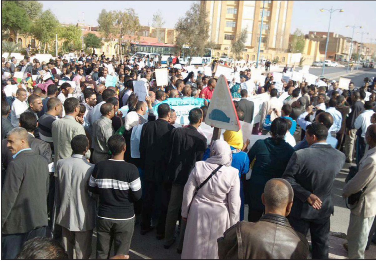
جانب من مسيرة احتجاجية في الجزائر

الكاذبة» و «لا للمحسوبية.. العمل حق دستوري»، و«معتصمون إلى يوم يبعثون»، وغيرها من الشعارات. وأوضحت الصحفية أن العاطلين عن العمل عادوا إلى الاحتجاج مجدداً بعد نفاذ المهلة التي منحها هؤلاء للسلطات والمقدرة بـ10 أيام، للاستجابة إلى مطالبهم المتمثلة في إيجاد مناصب شغل في الشركات القطاعية العاملة في المنطقة. ورفض المعتصمون مغادرة المكان حتى حصولهم على وثائق تؤكد استفادتهم من مناصب شغل، مشددين على أنهم لن يتخلوا عن هذا المطلب حتى لو كلفهم الأمر حياتهم» واتهموا المسؤولين المحليين بالتلاعب وعدم الجدية، موضحين أن لجان التشغيل التي تأسست منذ فترة ويراأسها الوالي (الحافظ) لم تحقق أي نتيجة أو تقدم في موضوع البطالة. رغم الاحتجاجات المتكررة على طريقة منح مناصب الشغل. واعتبر العاطلون عن العمل أن هذه اللجان لم تقم سوى بإرسال تقارير مغلوطة إلى السلطات المركزية في العاصمة من أجل إيهامها بأنها تكفلت بملف العاطلين عن العمل. كما اتهموا السلطات المحلية بإدارة ظهورها الاحتجاجات، وعدم قدوم عدد من المسؤولين المحليين للحديث إليهم، خاصة رئيس المجلس الشعبي الولائي، فضلاً عن المنتخبين المحليين. كما انتقلت شرارة الاحتجاجات إلى مدينة تفرط، حيث قام العشرات من العاطلين عن