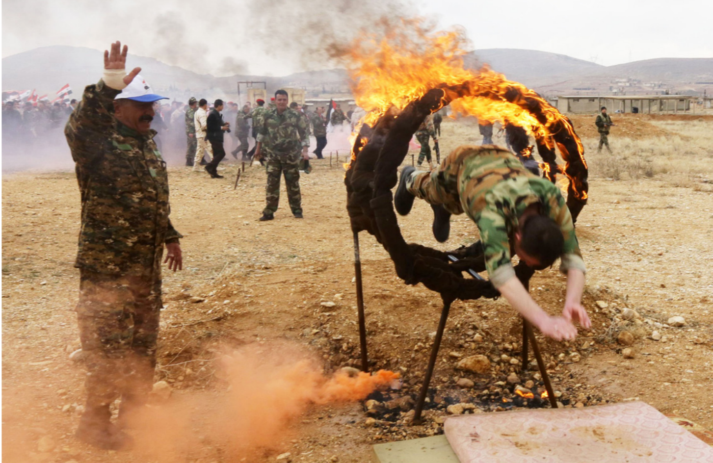
متطوعون سوريون يشاركون في تدريبات شبه عسكرية قام بها الجيش السوري في قتيقة أمس