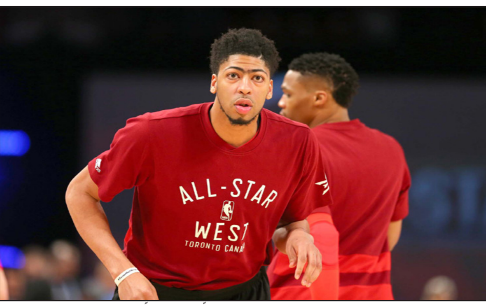
ديفيز تالق مع بيليكازن وحقق رقما قياسيا جديدا

برشلونة - د ب أ: سجل الألماني سيبستيان فيتيل سائق فيراري أسرع زمن في اليوم الأول من التجارب التمهيدية للموسم الجديد من بطولة العالم لسباقات فورمو-1 والتي افتتحها البريطاني لوييس هاميلتون سائق مرسيدس، حامل لقب بطولة العالم. وحقق فيتيل أسرع زمن للفة على مضيفة ديترويت بيبستونز 106/111 ضمن منافسات دوري كرة السلة الأمريكي للمحترفين. ويات ديفيز صاحب أعلى عدد من النقاط في مباراة بدوري السلة الأمريكي منذ سجل نجم لوس انجليس ليكرز السابق شاكيل أونيل 61 نقطة و23 متابعة أمام لوس انجليس كليبرز في السابع من آذار/مارس 2000. وسجل البديل غرو هولديا 20 نقطة وتسع تمريرات حاسمة ليليكازن الذي حقق الانتصار 22-22 في الموسم مقابل 33 هزيمة. وعلى الجانب الآخر، سجل ريجي جاكسون 34 نقطة وأضاف أندري رامون 21 نقطة لبيبستونز الذي مني بالهزيمة 29 هذا الموسم مقابل 27 انتصارا. وفي مباريات أخرى، تغلب كليفلاند كافاليرز على أوكلاهوما سيتي ثاندر 92/115 وسان أنطونيو سبيرز على فينيكس صنز 111/118 وشيكاغو بولز على لوس انجليس ليكرز 115/126 وبورتلاند تريل بيليرز على يوتا جاز 111/115، وبوسطن سيلتيكس على مضيفة دنفر نغتس 103/121 وتشارلوت هورنتس على بروكلين نتس 96/104 وتورونتو رابترز على ميسيس غريزليس 95/98 وإنديانا بيسرز على مضيفة أورلاندو ماجيك 102/105.