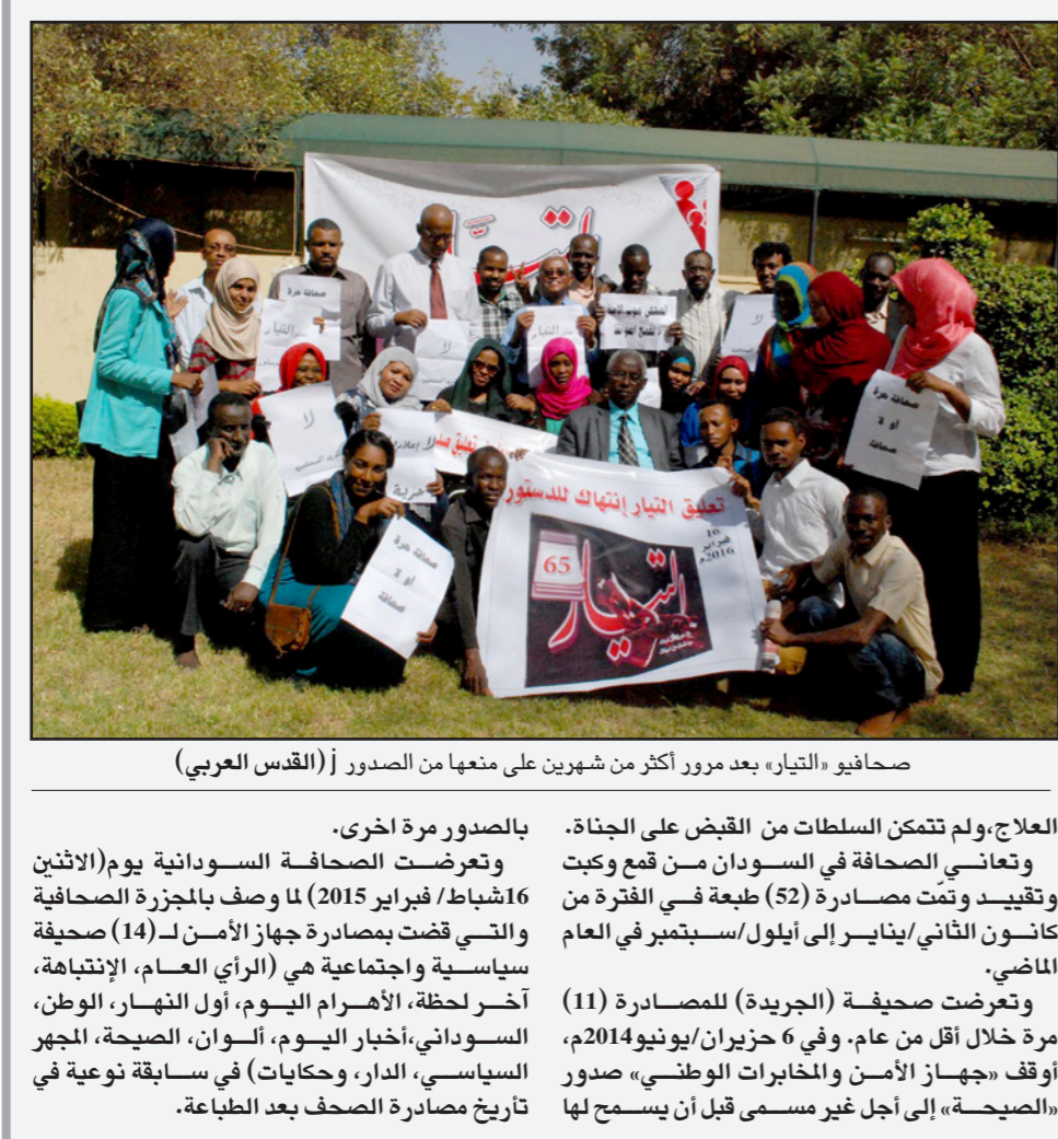
صحافيو «التيار»، بعد مرور أكثر من شهرين على منعها من الصدور

المقبلة لاستعادة السيطرة على مدينة هيت ومنطقة كبيسة القريبة منها». وتقع هذه المنطقة غرب الرمادي (100 كلم غرب بغداد). وتمكن التنظيم المنظر من السيطرة على بلدة هيت بشكل كامل إثر انسحاب القوات الأمنية منها منتصف تشرين الأول/أكتوبر 2014. وتشن القوات العراقية بمساندة من الحشد الشعبي، ميليشيات شيعية، ومقاتلين من عشائر الأنبار ودعم من التحالف الدولي عمليات ملاحقة في مناطق متفرقة ضد الجهاديين في الأنبار. وتمكنت القوات العراقية بمساندة التحالف الدولي بقيادة واشنطن، نهاية العام الماضي من استعادة السيطرة على مدينة الرمادي.