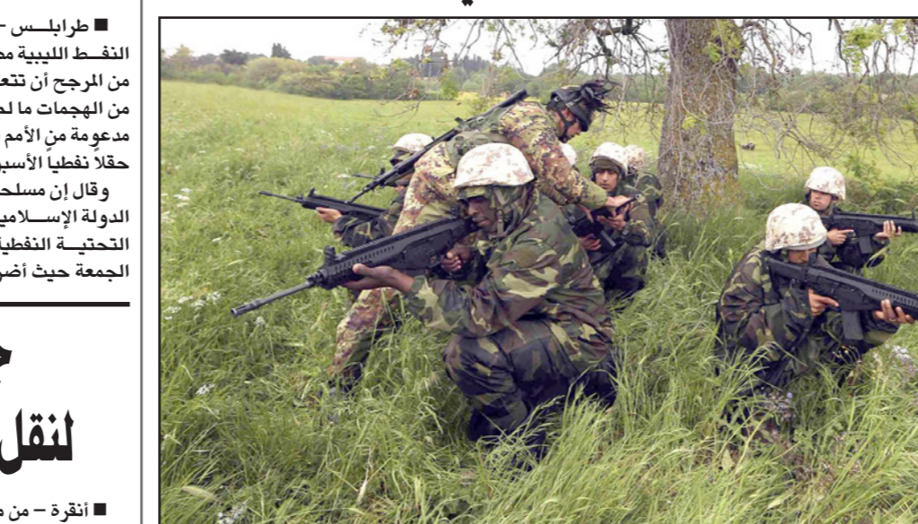
عناصر من الجيش الليبي خلال تدريبات عسكرية

ويأتي العنف في وقت تحاول فيه حكومة الوحدة التي تم تعيينها بموجب خطة ساندتها الأمم المتحدة الفوز بصفة البرلمان المعترف به دولياً في شرق البلاد، ويأتي أيضاً بعد يومين من استهداف غارة جوية أمريكية لما يشتبه أنه معسكر تدريب لتنظيم الدولة الإسلامية في مدينة صبراتة غرب ليبيا مما أسفر عن مقتل نحو 50 شخصاً بينهم اثنتان من موظفي السفارة الصربية كانا قد خطفا في ليبيا في تشرين الثاني/نوفمبر.