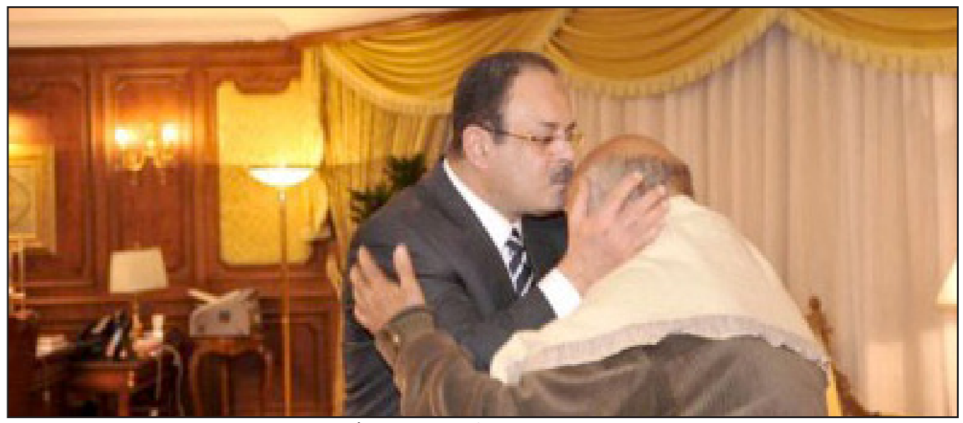
وزير الداخلية المصري يقبل رأس والد قتيل الدرب الأحمر