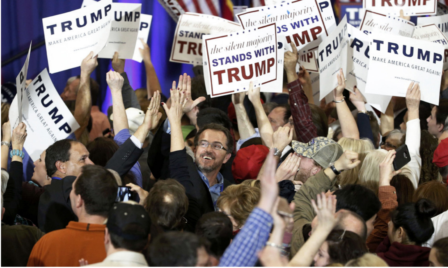
مناصرو المرشح الرئاسي الجمهوري الأمريكي دونالد ترامب خلال إحدى حملاته الانتخابية

كثرت التكتين في الأونة الأخيرة حول الدور الأمريكي في المنطقة العربية، خاصة العلاقات الأمريكية - السعودية. ويعد اليوم مجلس العلاقات الخارجية الأمريكي ندوة حول السعودية والتوتر الزائد بينها وإيران والأزمات الإقليمية والعلاقات مع الولايات المتحدة وتشارك فيها كارين إيوت هانوس، وهي مؤلفة كتاب عن السعودية وبيبرنارد هيكل وهو أكاديمي متخصص بالمنطقة والحركة الإصلاحية اليمنية وجاكسون ديبييل للمعل في صحيفة «واشنطن بوست» وهي جزء من تقييم للسياسات التي اتخذتها السعودية في الأونة الأخيرة. وكانت إيوت قد كتبت قبل أيام مقالاً على موقع مركز هوفر للدراسات التابع لجامعة ستانفورد الأمريكية تحدثت فيه عن الدور الإقليمي المتزايد للسعودية. وقالت في المقال «بعد عقود من الاعتماد الكبير على الحماية الأمريكية تلقى اليوم المملكة الدفاع عن نفسها بنفسها». وعزت هذا التطور لسببين: الأول هو التغيير الجيلي للقيادة في السعودية وتعيين أمير شاب ونشط وهو محمد بن سلمان، نجل الملك سلمان وليا لولي العهد. ويجمع الأمير محمد في دوره الجديد بين منصب وزير الدفاع ومسؤول عن الملف الاقتصادي بما في ذلك شركة «رامكو» النفطية والتي تشكل 70% من موارده الدولة. وتقول الكاتبة إن الأمير الشاب يقوم بهيئ النظام الجاهل. ولم تشهد المملكة منذ الملك عبد العزيز بن سعود، المؤسس أميراً شاباً لديه السلطة التي بيد محمد بن سلمان. ورغم غضب بعض الأمراء من أبناء العائلة لصعوده إلا أن دعم والده له يؤكد سيطرته، أما الأمر الثاني فيتعلق بعلاقة السعودية مع الولايات المتحدة التي ظلت توفر الحماية للمملكة من التهديدات الخارجية.