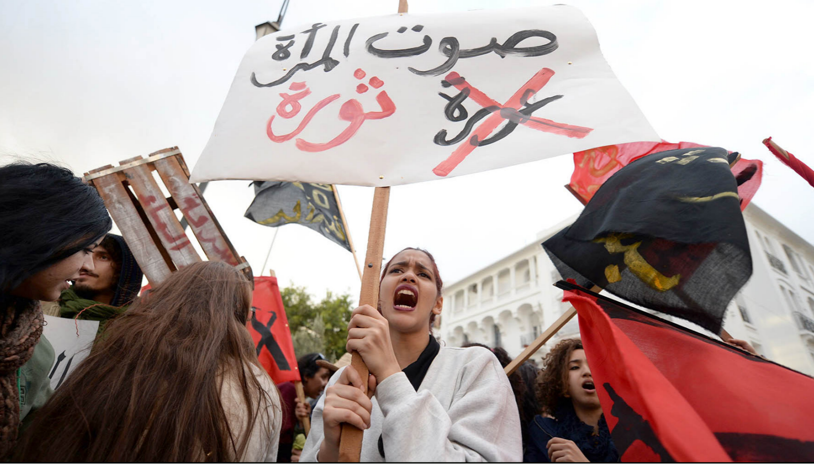
جانب من المسيرات الاحتجاجية التي نظمتها حركة «20 فبراير» في الرباط (أ ف ب)

ودعا كل الهيئات السياسية والحقوقية التي تشكك في عدم الوضوح السياسي لحركة 20 فبراير، لأن تطلع على الوثائق التأسيسية للحركة، خاصة بلاغ 14 فبراير، الذي طالب بإحداث إصلاحات جوهرية، تنتقل المغرب إلى ملكية برلمانية، والغناء دستور 1996، ميرزا أن حركة 20 فبراير كان لها وضوح سياسي، ويفضلها سقط جدار الصمت، وأصبح الاحتجاج حقا مشروعا.