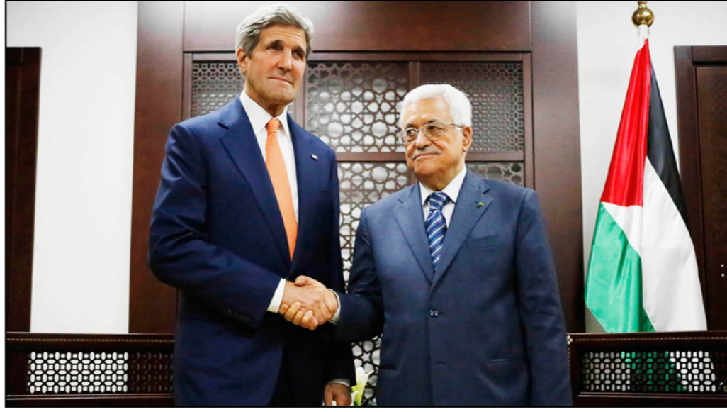
الرئيس الفلسطيني محمود عباس (يمين) ووزير الخارجية الأمريكي جون كيري

وفي السياق اتهم الدكتور واصل أبو يوسف عضو اللجنة التنفيذية لمنظمة التحرير الفلسطينية، الإدارة الأمريكية بالتغطية على جرائم الاحتلال برغم فشلها في تحقيق السلام في المنطقة. وأشار إلى أنه لا يمكن المراهنة على الدور الأمريكي في الضغوط على إسرائيل، مشيراً إلى أن الإدارة الأمريكية لا تريد أن يحدث أي تحرك فلسطيني تجاه المجتمع الدولي، في الوقت الذي تواصل فيه التغطية على عمليات الاستيطان التي تحول دون تجسيد الدولة الفلسطينية على أرض الواقع.