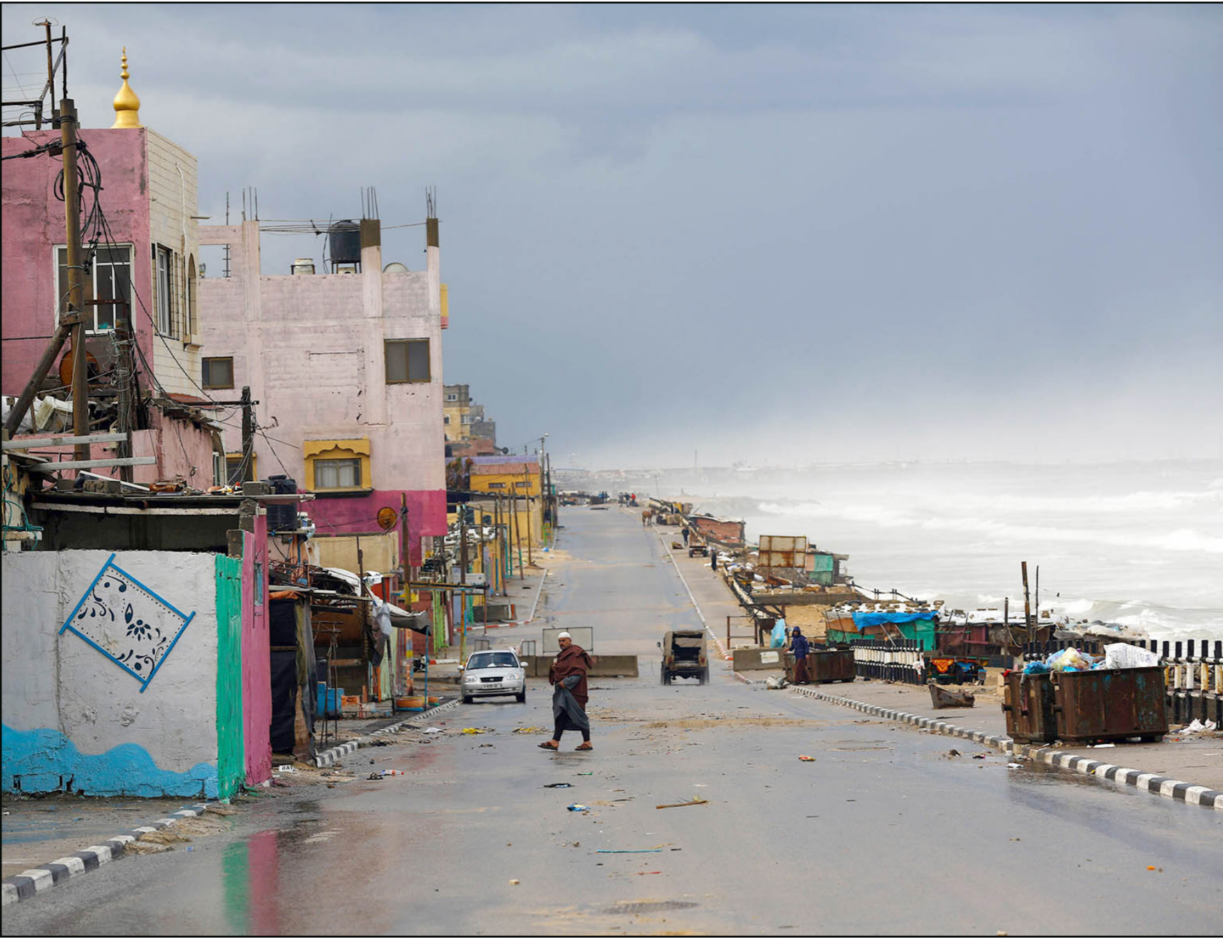
الكورنيش في مخيم الشاطئ غرب مدينة غزة بعد يوم مطر أمس