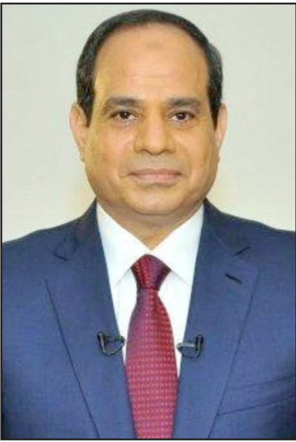
عبد الفتاح السيسي

السيسي عزز شرعيته بناء على هذا التمييز بين