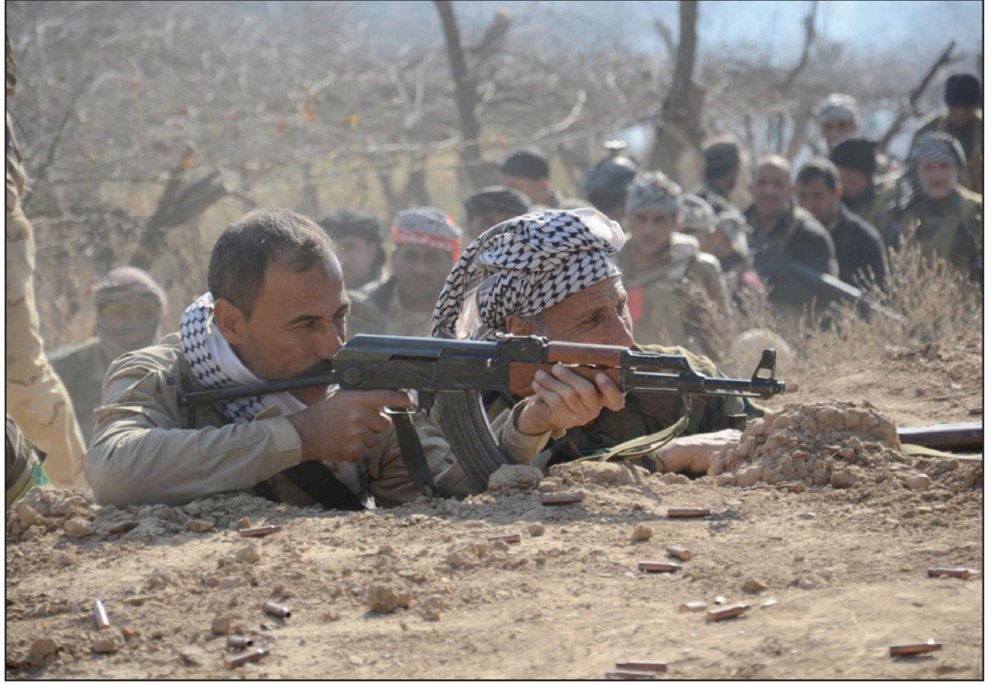
عناصر من «الحشد الشعبي» في مواجهات مع تنظيم «الدولة»

العراق - الأناضول: كشفت مصادر عسكرية عراقية عن مقتل مدير الشرطة وأحد مراقبيه في ديالى بتفجير سيارته، إضافة إلى مقتل 3 جنود شرقي الرمادي، خلال هجمات نفذها تنظيم داعش في عدد من المناطق. وقال اللواء الركن إسماعيل المحلاوي، قائد عمليات الأنبار أمس الإثنين، إن قوات الجيش العراقي أحبطت هجوماً لتنظيم «الدولة» على مقرين تابعين لها في الرمادي. وأوضح أن تنظيم «الدولة» شن هجوماً عنيفاً بعشرات العناصر التابعة له على أحد مقرات الجيش التابعة للفرقة العاشرة المتواجدة في منطقة الحامضية شرق الرمادي، على الطريق الدولي السريع، مبيناً أن «الهجوم كان من منطقة البوعبيد التي يسيطر عليها التنظيم شرق الحامضية».