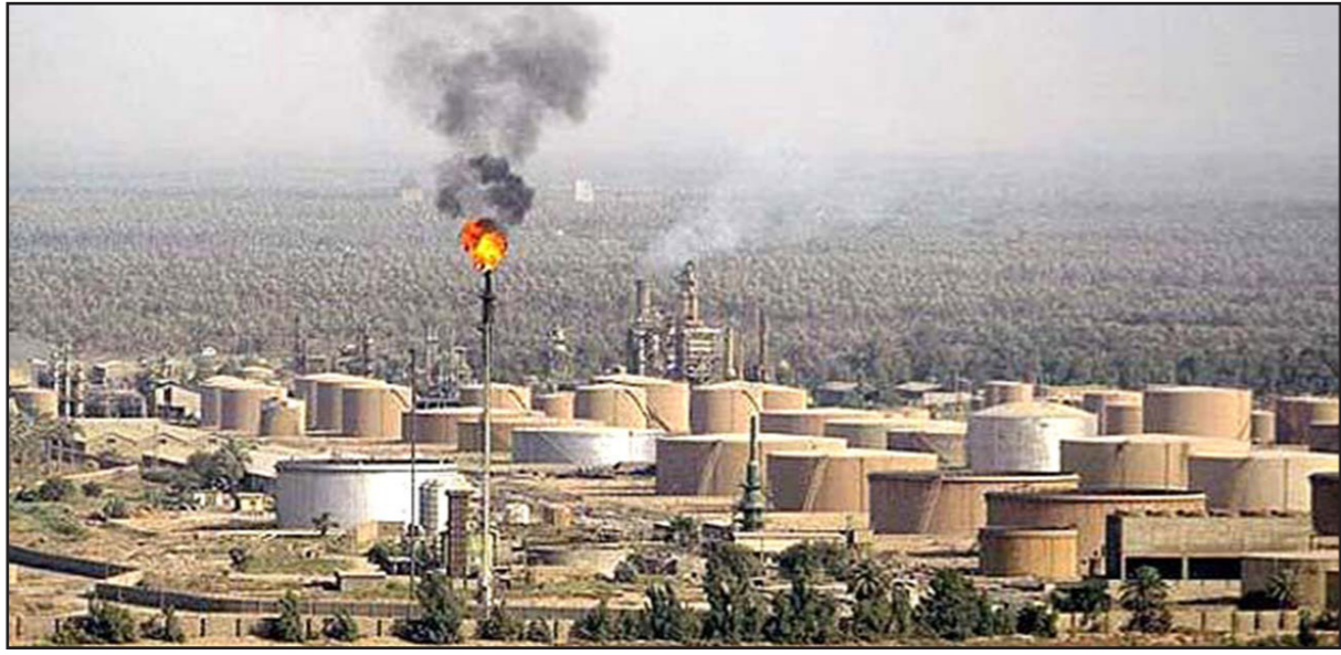
خزانات نفط من حقل غرب القرنة 2 الذي تديره «لوك أويل» الروسية