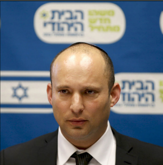
وزير التعليم الإسرائيلي نفتالي بينيت

وطلب التركيز على أهمية المعيار الأمني. وسأل ممثل الكنيست المحامي غور بلي عن وضع تكون فيه حالة معتقلين الصحية متشابهة تماماً لكن أحدهما يضرب عن الطعام لأسباب شخصية ولا يوجد خطر بأن يؤدي إضرابه إلى أبعاد اجتماعية واسعة بينما الأسير الثاني يضرب لأسباب