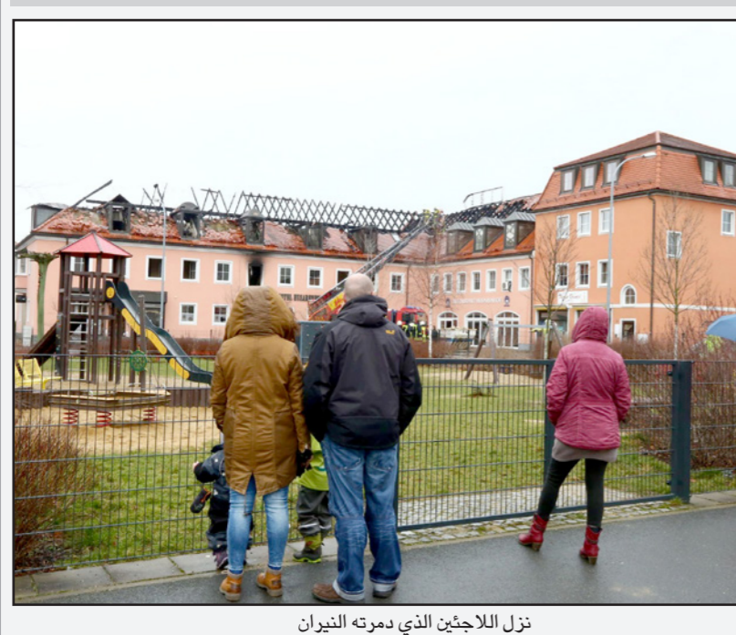
نزل اللاجئين الذي دمّره النيران