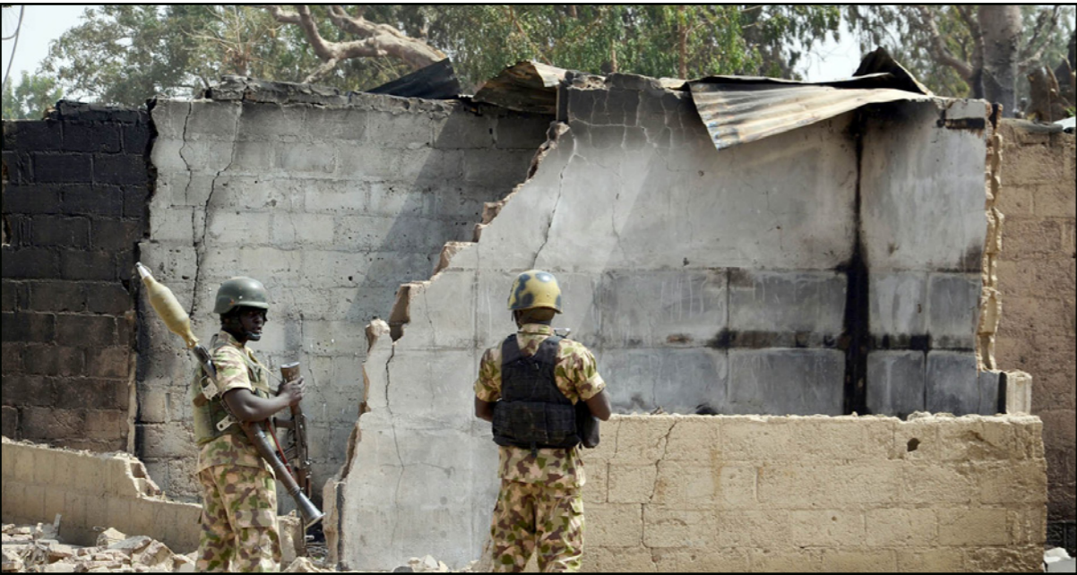
جنود نيجيريون يتفقدون واحداً من مواقع عمليات بوكو حرام الإرهابية

والتقى عدد من كبار ساسة وإعلاميي الكاميرون البلد الذي يتضرر شماله من عمليات بوكو حرام الإرهابية، استمعوا للتراخي في تهيئة هذه القوة المشتركة حيث مر عام كامل على تأسيسها بدون أن يدفع المتعهدون بتموليها أي مبلغ مما التزموا به. وحسب هذه التحليلات فإن تفعيل هذه القوة المشتركة يتطلب وسائل كبيرة، ويستلزم سرعة في تنفيذ الإجراءات والتأسيس وهو ما لا يعير غالبية دول القارة أهمية مما يمكن حركة بوكو حرام من الاستمرار في بث الرعب وفي تحصين ألياتها الإرهابية وفي اختراق المجتمعات البشة. وبالرغم من الجهود التي تبذلها القوات العسكرية والأمنية لدول النيجر والكاميرون وتشاد ونيجيريا مقرر الحركة الإرهابية، فإن عناصر بويكر شيشو زعيم الحركة يواصلون