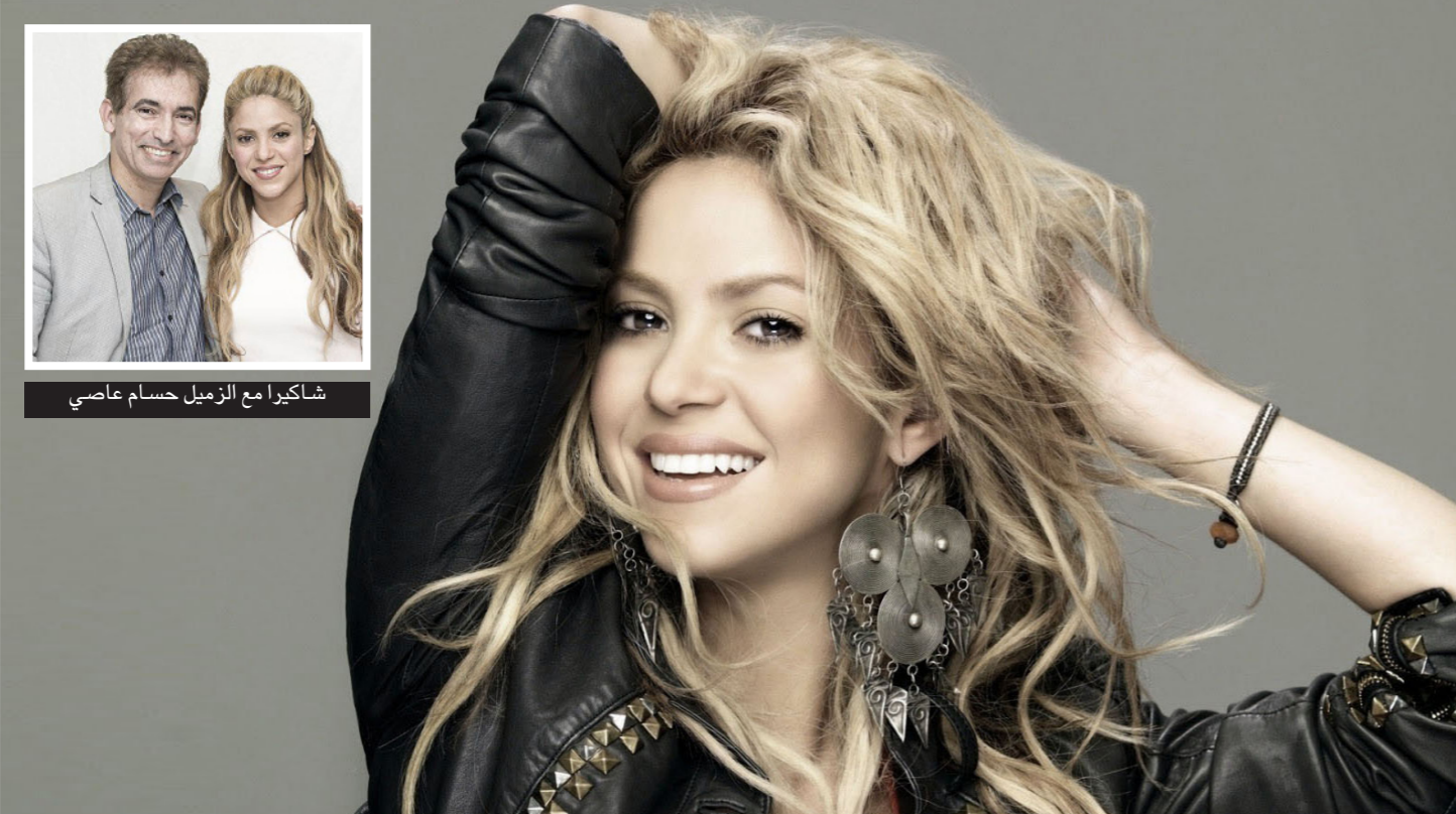
شاكيرا مع الزميل حسام عاصي

«أنا أريد لكل طفل في العالم، بغض النظر عن وضعه، عرقه، جنسه أو خلفيته، أن يحصل على تعليم جيد، من جيل ميكرو. أعتقد أن التعليم هو تلك الفرصة التي تجعلنا كلنا متساوين وأن كثيرا من مشاكل العالم الإجتماعية والصراعات والتفرقة الشاسعة بين الفقراء والأغنياء وخاصة في العالم الثالث هي نتيجة عدم وجود مثل هذه الفرص»، تقول شاكيرا. وتعترف أن طفلها، ميلان بيك مبارك (3 أعوام) وساشا بيك مبارك (عام واحد)، يستهلكا معظم وقتها، ولكنها قررت هذا العام أن تعود إلى إنتاج الموسيقى، وكشفت لي أنها جاهزة لتسجيل ألبومها الجديد وأنها ستبدأ العمل عليه غدا. «أنا مشتاقة جدا للغناء والرقص على المنصة أمام الناس وسماهم يغنون معي، وربما هذا يبدو تافها وغورا، ولكنه ضروري جدا لي، فهذا ما أجسده وكل ليف في حياتي مصنوع من ذلك وإذا لا أعني أو أكتب، أشعر وكأن جزءا مني يختنق. قبل شهرين كنت مغفورة بغطو الأطفال والهيئات وقناني الحليب، وكل هذه الأشياء حرمتمني من التركيز على ابتداء الموسيقى. وفي الوقت نفسه، تلك المغفورة كانت نعمة بالخفية، لأنها منحتني الموضوعية في الإبداع والبعد عنه الذي كنت بحاجة له لكي أشتاق لأداء الموسيقى من جديد»، تختم شاكيرا. وقبل أن نفرق، قالت لي مبتسمة: «سلم على لبنان».