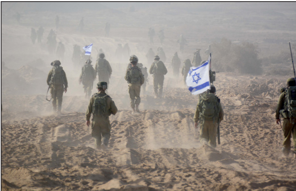
عملية «الجرف الصامد»

سيفشل. موجات العنف المتكررة والتي تتمتع بين إسرائيل وحماس في القطاع لن تسمح بتجديرات اتفاق مع الفلسطينيين في يهودا والسامرة. الاعتراف بوجود احتمال ومير وحاجة لإجراء سياسي في قطاع غزة، هدفه البعيد هو نزع السلاح مقابل البناء والطرق، يجد اژدهارا في الحكومة نفسها، وزير المواصلات إسرائيل كاتس نشر قبل ستة ونصف خطة «عدم الانفعال» التي اعتمدت على اقامة جزيرة صناعية أمام شواطئ القطاع حيث يكون فيها ميناء ومطار. وزير الزراعة اوري اريئيل