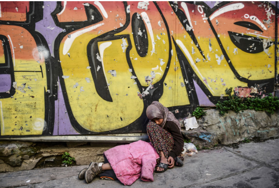
فتاة سورية تجلس على حافة الطريق وبجانبتها طفل آخر في وسط مدينة اسطنبول

المتحدة ما اقترحه الكاتب من تعديلات للمدخل الحالي، وسيشمل أي اتفاق المدن السورية الكبرى مثل حلب وحمص وحماة، ويمكن للروس البقاء وتوفير الحماية للمناطق العلوية والسليبية - أي مناطق الأسد، ولكن على الولايات المتحدة وحلف الناتو لعب دور في حفظ السلام وكذا الجامعة العربية، فبدون قوة تبدأ من 50.000 وتطور إلى 100.000 جندي فأي اتفاق سينهار. ويعتقد الكاتب أن سوريا تعتبر حالة معقدة ومن الصعب تطبيق أي اتفاق فيها بسبب وجود جماعات متعددة وقوى خارجية لها أجندات ومصالح مختلفة وبسبب المعاناة الشديدة التي عانى منها الشعب والتي زادت من مشاعر الكراهية وعدم الثقة، ومن هنا فالتمسح الكوفندرالي الذي يقترحه الكاتب يجعل من الحاجة لقوات حفظ سلام كبيرة خاصة أن المناطق ذات الحكم الذاتي سيكون ارتباطها بحكومة مركزية ضعيفا، بدلا من محاولة تجميع سوريا من جديد وهي مهمة صعبة وتحتاج لعدد أكبر من قوات إشراف دولية. ويقول إن الأيام المقبلة ستكشف عن محدودية المدخل الأمريكي القائم على اعتقاد وإيمان بوجود سياسة وموقف يتجنب التدخل المباشر في الحرب - أي سياسة رفع اليد - وهذا مدخل يجعل الولايات المتحدة تتجاهل الطبيعة التي تجري هذه الأيام. وفي الوقت نفسه تعرض الولايات المتحدة نفسها للمخاطر وكذا حلفائها، ويختم بالفؤل «نحن بحاجة لأن نتعامل بجدية مع سوريا وفات على الرئيس براك أوباما حل المشكلة وهو في السلطة لكن لم يفت الأوان بعد لبداية محاولات الحل».