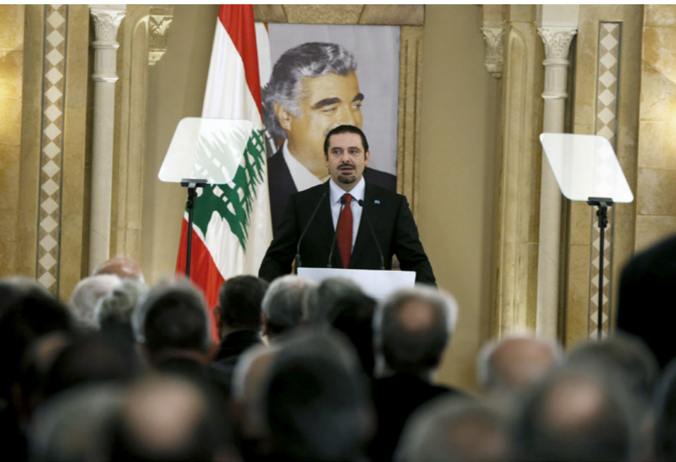
رئيس وزراء لبنان الأسبق سعد الحريري يتحدث خلال مؤتمر صحفي في بيروت أمس الأول

استقالته كذلك لم يعلن سلام رفض الاستقالة. ترامنا، عقد رئيس حزب القوات اللبنانية سمير جعجع مؤتمراً صحفياً في مدينتها في مدينتها في مجلس الوزراء الأخير لجهة أزمة العلاقة مع المملكة العربية السعودية، واصفا إياها بأنه «شعر بشعر». وقال «أن العلاقة مع المملكة العربية السعودية ودول الخليج مهمة جداً ولكن الأهم وضع لبنان ككل، ويمكن أن تكون دول الخليج راضية أو غير راضية عن البيان الوزاري، والفرق كبير بين ما جرى في الحكومة وبين الواقع». وإذ شد على «أن الأزمة الحالية تكمن في أن أصدقاؤنا في «حزب الله» يخوضون أزمتنا أعمق من بيان مجلس الوزراء، يجب تطبيق نظرية الوحدة الوطنية على جميع الأصدقاء» متمسكاً: «أين هي الوحدة الوطنية من خوض حزب الله معارك شاملة في المنطقة ككل؟ وأين هي الوحدة الوطنية التي تتجهج مع السعودية؟ فكل هذا الفهم يستعمل بشكل مجتزأ، وبكل بساطة أزمتنا أعمق من بيان مجلس الوزراء، وعلى الحكومة النظر بعقود إلى الأزمة، إلا وهي خوض «حزب الله» معارك ضد الحور السعودي، لأننا بهذه الطريقة نأخذ لبنان إلى مواجهة، أكثرية الشعب اللبناني لا يريد هذا، ونحن لا نؤمن بالادولة التي تعطلها الدولة اللبنانية».