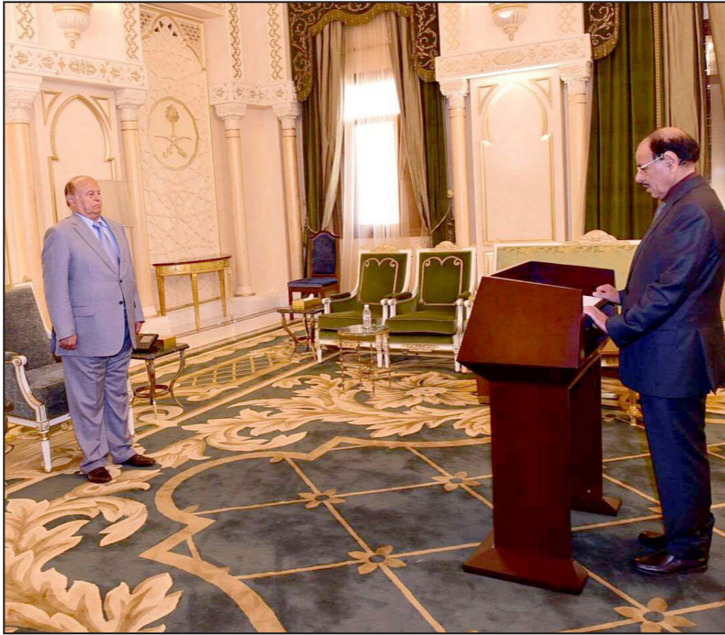
اللواء الأحمر يؤدي اليمين الدستورية أمام الرئيس هادي أمس

في هذا الموقع العسكري الرفيع، وشهد على «ضرورة تعزيز العمل العسكري الميداني وروح الثقة لدى حماة الوطن البواسل، والمقاومة الشعبية التي تجتريح المآثر في سبيل الانتصار لإرادة الشعب وشرعيتها الدستورية وإفشار مخطط الانقلابيين واجندتهم الدخيلة» إلى ذلك أكد الفريق الركن علي محسن الأحمر أنه «سيظل مدافعا عن قضايا الوطن والعمل مع الشرعية الدستورية ممثلة بالرئيس عبدربه منصور هادي لإخراج اليمن من التحديات التي يمر بها، والانتصار على فلول التمرد التي ألحقت الأذى ببلدنا ومجتمعنا وجيراننا».