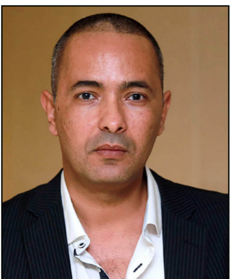
الكاتب كمال داود

بعد إهدار دمه.. فتوى جديدة تطارده الجزائر: الكاتب كمال داود ينفي معاداته للإسلام ويؤكد انسحابه من ساحة النقاش العام البناني أمين معلوف، وقد حصل كمال داود بعدها على جائزة الفونكتور للرواية الأولى، وهي جائزة من مرتبة ثانية مقارنة بالفونكتور، ثم فاز قبل أيام بجائزة جان لوك لاغارد لأفضل صحافي في فرنسا، عن مقاله المنشورة في مجلة لوبوان الفرنسية، وأسماه الكاتب لكون الجوائز التي يحصل عليها تعد تكريماً له ككاتب جزائري يعيش في الجزائر لا تحظى بالاهتمام اللازم، في حين يتم تسليط الضوء على الجدل الذي تثيره كتاباته، بدون أن يكلف من يهاجمونه أنفسهم عناء قراءة ما يكتب. وكان الكاتب قد أثار جدلاً قبل سنتين عندما صدرت فتوى تهدر دمه، من طرف عبد الفتاح حمداش زيراي، وهو أحد رموز السلفية في الجزائر، بسبب رواية كمال داود الأولى، دون أن يقرأ الرواية، مكتفياً ببعض الأجزاء المنشورة في الصحافة.