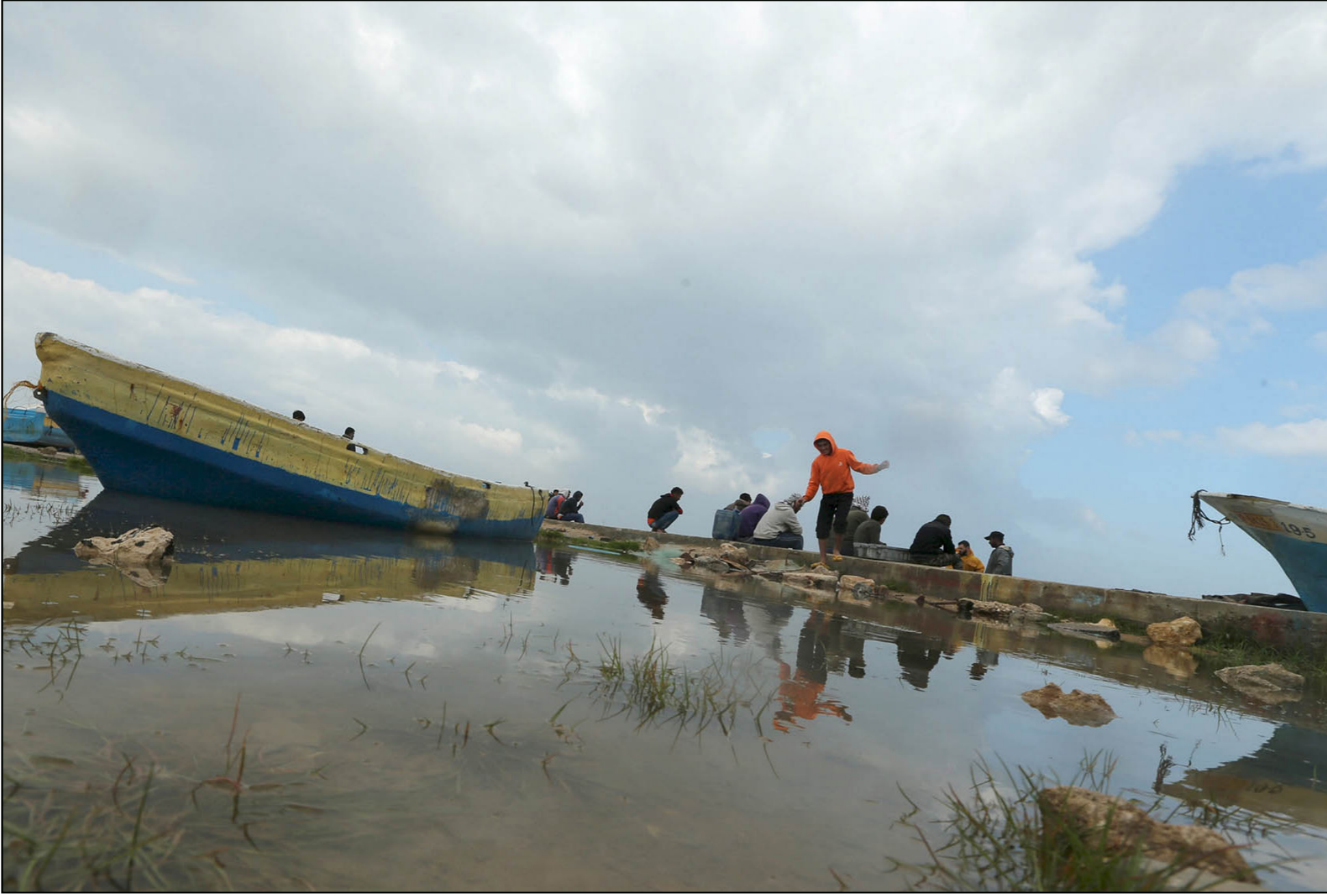
صائد أسماك فلسطيني يعود إلى شاطئه غزة بعد أن تعرضت مراكب الصيادين للثيران الإسرائيلية أمس

في رد سريع على تصريحات وزير الجيش الإسرائيلي موشيه يعلون التي أعلن فيها هدوء الأوضاع على الجبهة الجنوبية مع قطاع غزة. حذرت الفصائل الفلسطينية من خطورة الأوضاع الميدانية، وهو ما يتماشى مع تحذير إسرائيلي سابق ينذر بانفجار الأوضاع في القطاع الذي يعاني الفقر والحصار، في وجه الجميع. وكان يعلون قد قال خلال تفقده المزارع العسكري بين الجيشين الإسرائيلي والأمريكي، إنه منذ انتهاء الحرب الأخيرة ضد غزة صيف عام 2014، والحدود هناك «تشهد هدوءاً لا مثيل له منذ سنوات طويلة». وأضاف: «حماس لم تطلق رصاصة واحدة، ومع هذا لا نكتفي بذلك، فنحن نستعد للتعامل مع أي تصعيد من حماس».