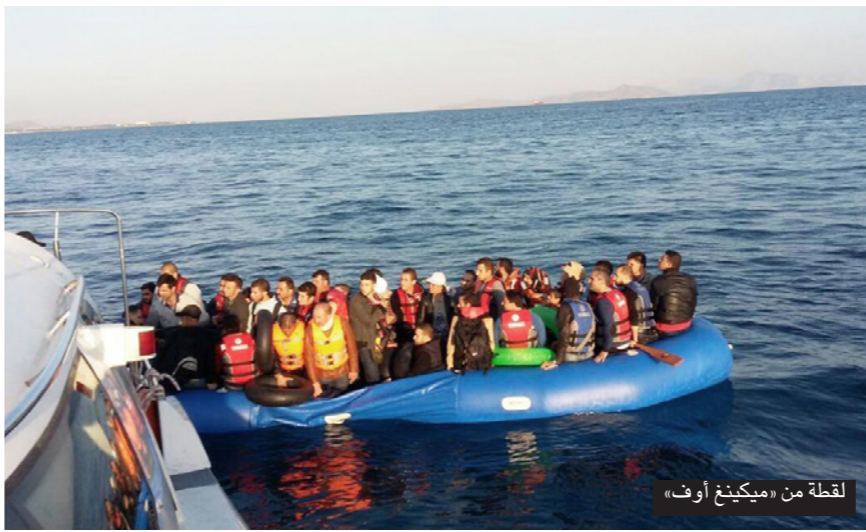
لقطة من «ميكينغ أوف»

يقول مخرج الفيلم «بعد خروجي من سوريا إلى بيروت، تمّ الدوحة ثمّ عمان ثمّ بيروت ثمّ اسطنبول، قابلت العديد من الشباب السوريين العاملين في المجال الفني والإبداعي، وتابعت قصص تنقلهم بين البلدان بحثاً عن بقعة استقرار تساعدهم على إكمال حياتهم والعمل على مشاريعهم الفنية الشخصية، سنسقط الضوء في الفيلم على مشكلة تاشيرات الدخول وتغير المناخات السياسية في بلدان اللجوء، الأمر الذي أدى إلى تغيير تعامل حكومات تلك البلدان مع السوريين».