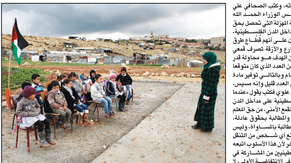
معلمة فلسطينية تدرس تلاميذ من البدو قرب مستوطنة معالي أودوميم في بلدة العازرية شرق القدس

نصبت أجهزة أمن السلطة الفلسطينية الحواجز على مداخل المدن لمنع المعلمين المضربين من الوصول إلى رام الله للاعتصام أمام مقر رئيس الوزراء ورام الله خلال جلسة الحكومة الأسبوعية للمطالبة بحقوقهم. وعلقت «القدس العربي» أن تهديدات وصلت قبل ذلك لأصحاب شركات الحافلات للحيلولة دون نقل المعلمين إلى رام الله. وتفاعلاً للفلسطينيين صباح أمس بوجود حواجز أمنية فلسطينية لم يسبق لها مثيل في كافة مدن الضفة الغربية، وسعت إلى الطرقات المؤدية إلى رام الله، خصصت للحصن السيارات والحافلات والتدقيق بهويات الركاب بحثاً عن معلمين ومعلمات ممنه من الوصول إلى رام الله للاعتصام بالتمتع. وأشارت هذه الإجراءات سخط الشارع