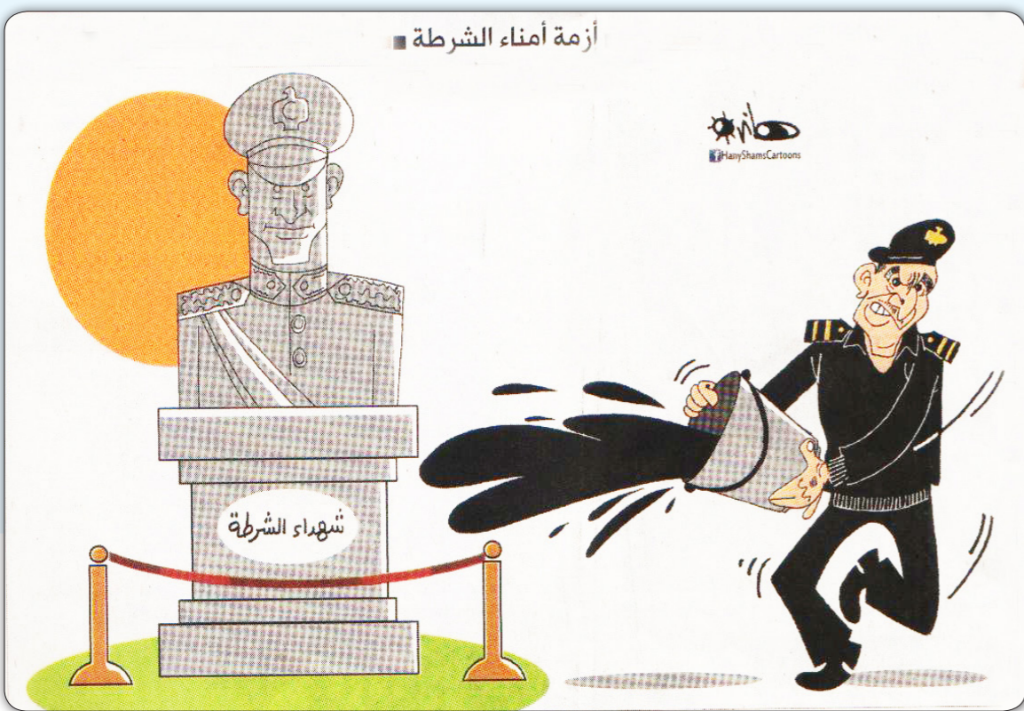
أزمة أمناء الشرطة