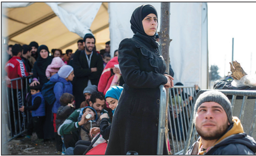
لاجئون سوريون على بوابة العبور للحدود اليونانية مع القديونية أمس

ولمحت مصادر دبلوماسية والصحافة الأمريكية إلى أن الخطة الجديدة قد تشمل على تدخل عسكري للولايات المتحدة والتحالف. وقال فيليب هاموند وزير الخارجية للبرلمان البريطاني «ما شهدناه خلال الأسابيع الأخيرة هو أدلة مقنعة للغاية على التنسيق بين القوات الكردية السورية والنظام السوري وسلاح الجو الروسي، وهو ما يجعلنا نشعر بارتياح واضح من دور الأكراد في كل هذا». وقالت سبيري الأتاسي عضو الهيئة العليا للمعارضة السورية إن «القافية الهدنة تشكل ترجاعاً خطيراً عن قرار مجلس الأمن 2254 خصوصاً فيما يتعلق بالبندين 12 و13 من هذا القرار، والاتفاقية تعطي شرعية لشاركة قوات النظام في «محاوية الإرهاب» مع التحالف الدولي الذي تقوده أمريكا. (تفاصيل ص 4)