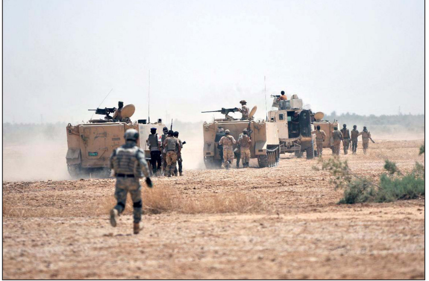
قوات عراقية في مواجهات مع تنظيم «الدولة»، في الأنبار