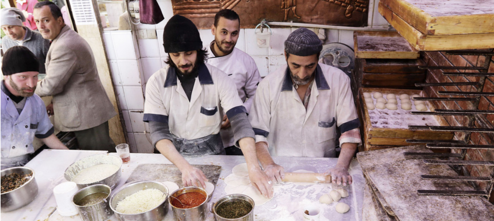
موظفون يحضرون البيتزا في متجر في العاصمة دمشق أمس، بعد يوم من اتفاق وقف إطلاق النار (أ ف ب)

بالإعلان الأمريكي الروسي الذي يأتي بعد فشل محاولة ستيفان دي ميستورا بمبعوث المنظمة الدولية للسلام في سوريا لاستئناف محادثات السلام في جنيف، وقال ستيفان دوجاريك المتحدث باسم بان «بحث الأمين العام الأطراف بشفرة على الالتزام بشروط الاتفاق. هناك الكثير من العمل في الفترة القادمة لضمان تنفيذ».