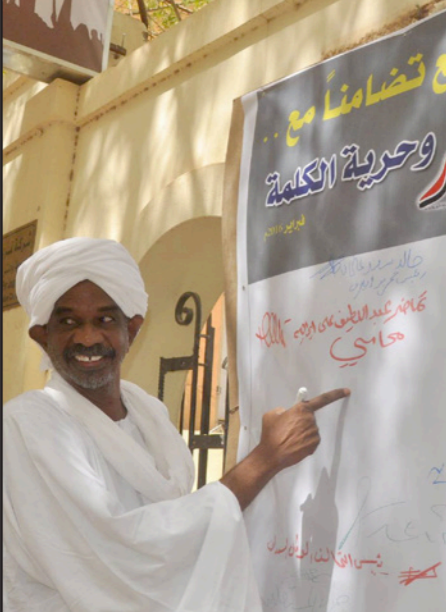
الخرطوم - «القدس العربي»:

شارك سياسيون وناشطون وقادة في المجتمع المدني السوداني وناشطون وصحافيون في حملة التأييد توقيع التي ابتدتها صحيفة «التيار» السودانية أمس احتجاجا على منعها من الصدور من قبل جهاز الأمن دون إبداء الأسباب.