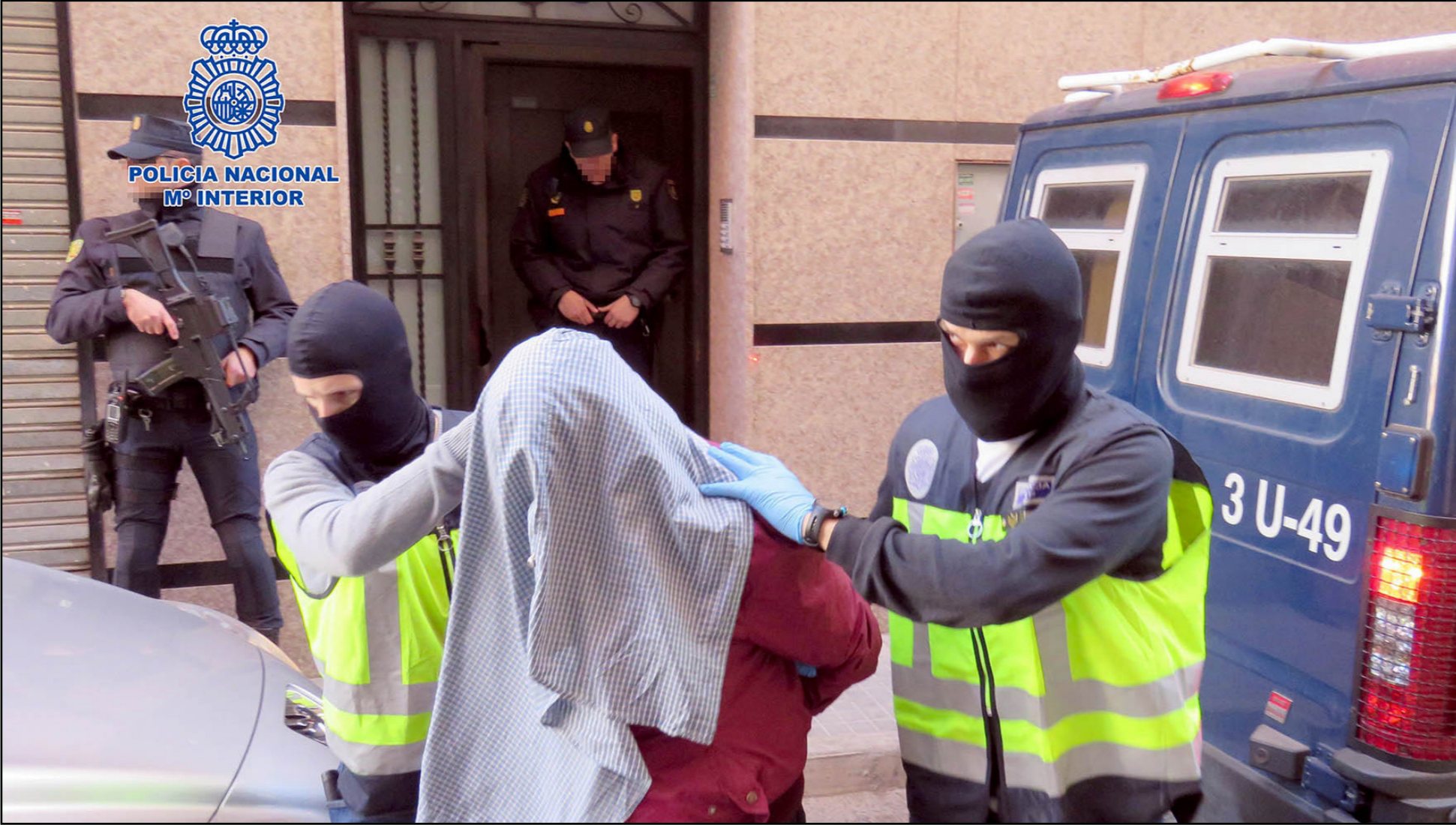
صورة أطلقتها الشرطة الوطنية الاسبانية لعملية اعتقال الخلية الإرهابية المرتبطة بتنظيم الدولة الإسلامية