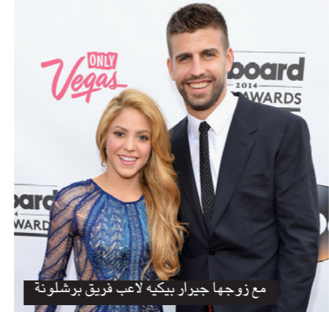
مع زوجها جيرار بيكيه لاعب فريق برشلونة

سجلت شاكيرا ألبومها الأول، «ماجيا»، عام 1990 عندما كانت في الـ13 من عمرها. «ماجيا» لقي نجاحا في كولومبيا، ولكنه لم يخلق السوق اللاتينية، التي اكتشفها شاكيرا عام 1996 بتحرير اليوم «بيز ديسكالزوس»، الذي احتل الرقم الأول في 8 دول. وفي عام 2001، نشرت أول ألبوم باللغة الانكليزية، وهو «لودنري سيرفيز»، الذي احتل المرتبة الأولى في أغلب دول العالم، محسولا إياها إلى نجمة عالمية. وفي عام 2010، قامت بأداء أغنية افتتاحية واختتم ألعاب كأس العالم لكرة القدم الأبيض عام 2010 لمناقشة مشاكل نمو الأطفال.