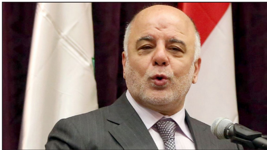
رئيس الوزراء العراقي حيدر العبادي