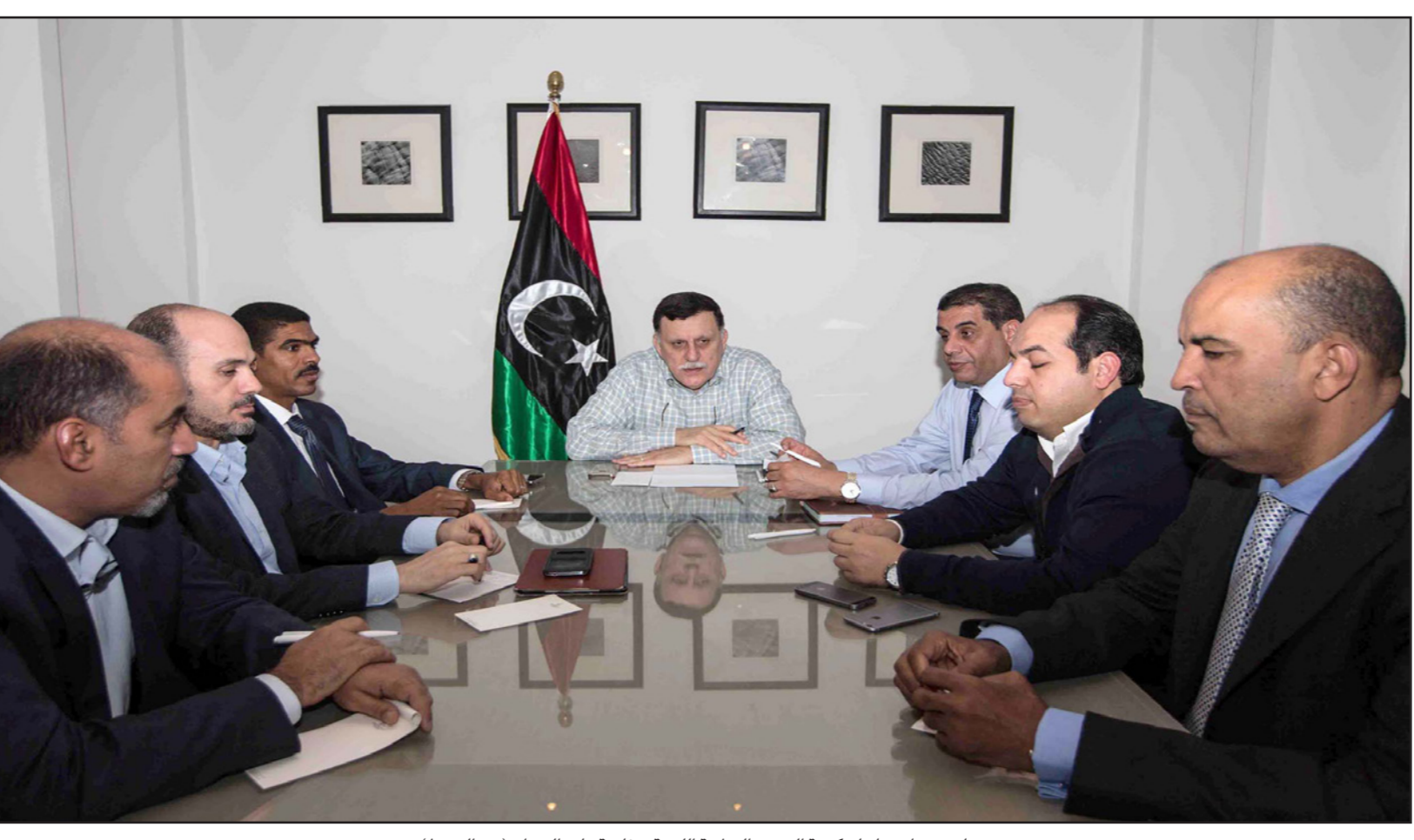
جانب من اجتماع حكومة الوحدة الوطنية الليبية برئاسة فايز السراج (في الوسط)