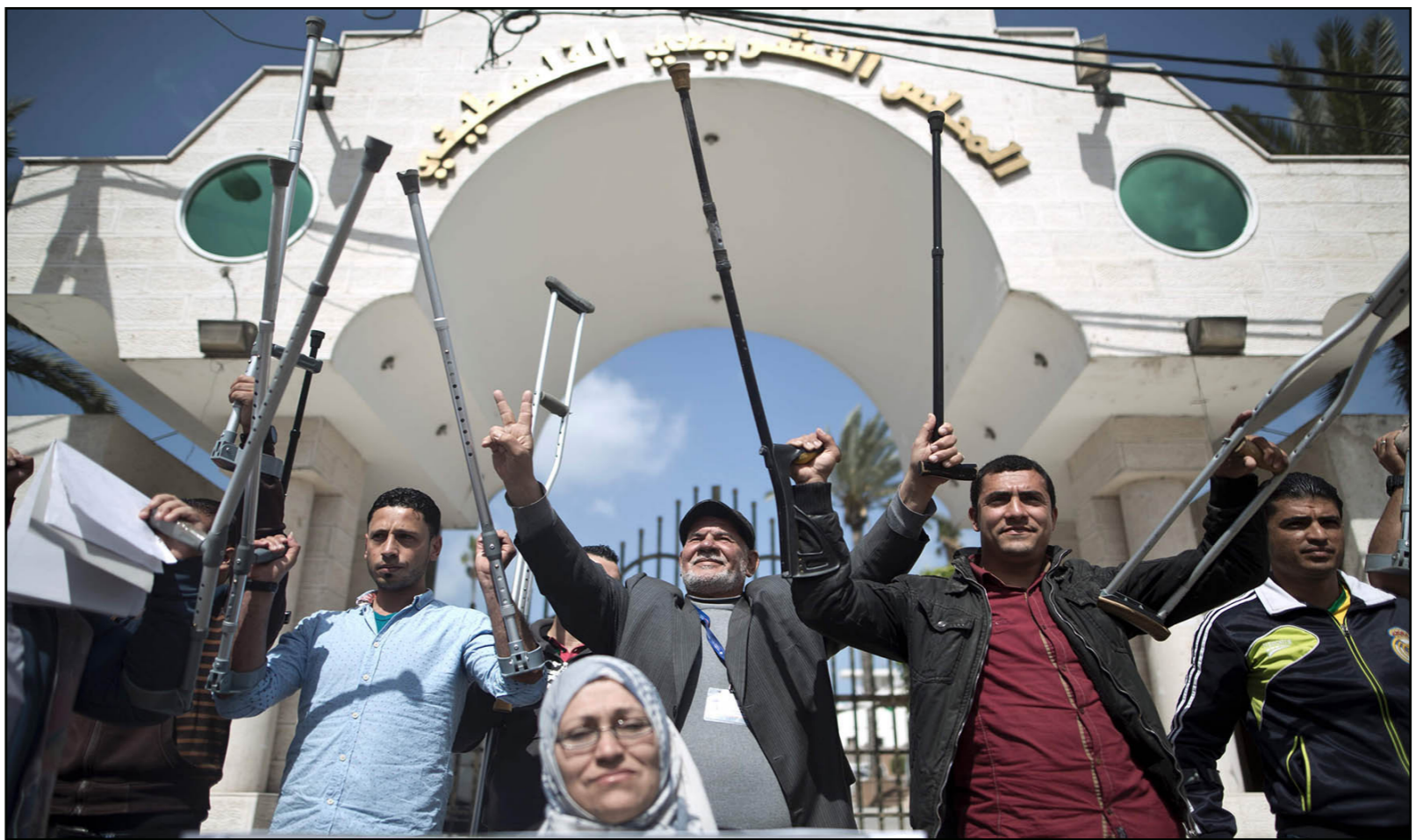
فلسطينيون ممن فقدوا اطرافها جراء الحرب على غزة في صيف 2014 خلال اعتصام أمام المجلس التشريعي للمطالبة بعلاج أفضل وأطراف اصطناعية أسس

من المقرر أن يبدأ قريباً دفع تعويضات تصل قيمتها إلى 33 مليون دولار، لأصحاب المنازل التي دمرت جزئياً خلال الحرب الإسرائيلية الأخيرة على قطاع غزة. وقال وزير الأشغال العامة والإسكان الدكتور فهد الحسينية، في تصريح صحفي، إنه سيتم توقيع مذكرة تفاهم بين وزارته وبرنامج الأمم المتحدة الإنمائي (UNDP) بتعويض أصحاب الوحدات السكنية المتضررة جزئياً. وأشار إلى أنه وفق هذه الاتفاقية سيكون إجمالي المبلغ المقدم 33 مليون دولار وستستفيد منه قرابة 20 ألف أسرة، وأوضح أنه سيتم وفق هذه المنحة بناء ثلاث مدارس. وأشار إلى أنه سيتم خلال الأيام القليلة المقبلة صرف المبالغ المالية للأسر المتضررة وذلك وفقاً لتقييم اللجنة المشتركة بين الوزارة و(UNDP). وقال إن هذه المنحة تعد «ثمرة الجهود الحثيثة لرئيس الوزراء رامي الحمد الله في التواصل مع الدول العربية الشقيقة والدول الأوروبية الصديقة، من أجل جلب منح الإعمار وتمويل إعادة إعمار البيوت المدمرة». وأشار إلى أنه عقب انتهاء الحرب عقد مؤتمر للماتين في العاصمة المصرية القاهرة، جرى خلاله تعهدت الدول المشاركة بتوفير مبلغ مالي قدره 5.4 مليار دولار لصالح إعمار قطاع غزة، غير أنه لم يصل من هذا المبلغ سوى القليل، بسبب عدم التزام غالبية المانحين دفع ما عليهم من التزامات. وتواجه عملية إعمار قطاع غزة صعوبات كبيرة، خاصة مع مرور أكثر من عام ونصف على انتهاء الحرب الإسرائيلية الأخيرة على قطاع غزة، التي دمرت خلالها قوات الاحتلال عشرات آلاف المنازل بشكل جزئي وكلي.