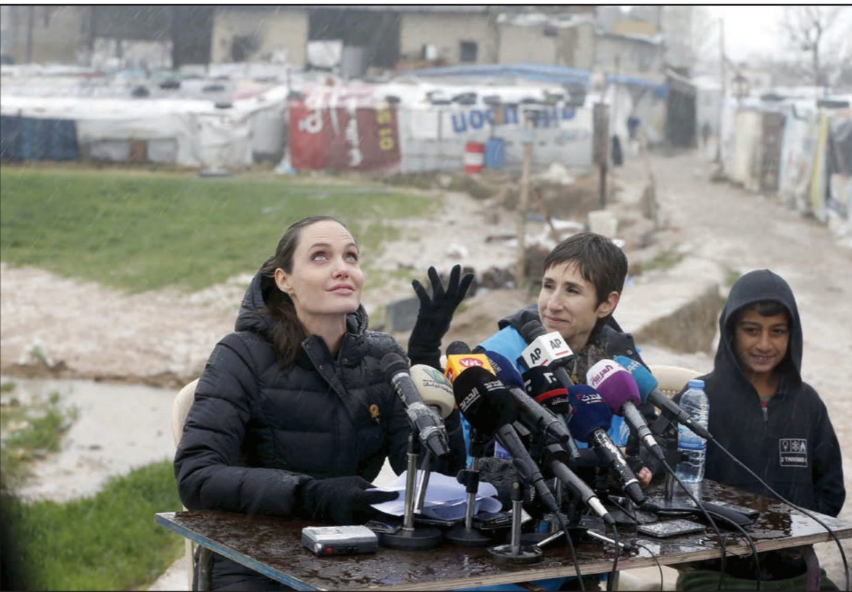
الممثلة الأمريكية وسفيرة الأمم المتحدة للاجئين أنجلينا جولي خلال مؤتمر صحفي في مخيم للاجئين السوريين في لبنان

سعدنايل (لبنان) - من جون ديفيسون: حثت الممثلة الأمريكية الشهيرة أنجلينا جولي المبعوثة الخاصة للمفوضية السامية للاجئين خلال زيارة لها إلى مخيم اللاجئين في منطقة البقاع في لبنان العالية على فعل المزيد لإنهاء الحرب المستمرة منذ خمسة أعوام في سوريا ومساعدة ملايين الفارين من النزاع. وقالت أثناء زيارتها مخيما مؤقتا موحلا في بلدة سعدنايل في منطقة البقاع اللبنانية التي تبعد 15 كيلومترا عن الحدود مع سوريا. وفي إشارة إلى موجة اللاجئين السوريين الهائلة التي تدفقت على دول الجوار التي تستضيف الملايين على أراضيها قالت جولي إن المشكلة «لا تنحصر في أوضاع عشرات الآلاف من المهاجرين في أوروبا».