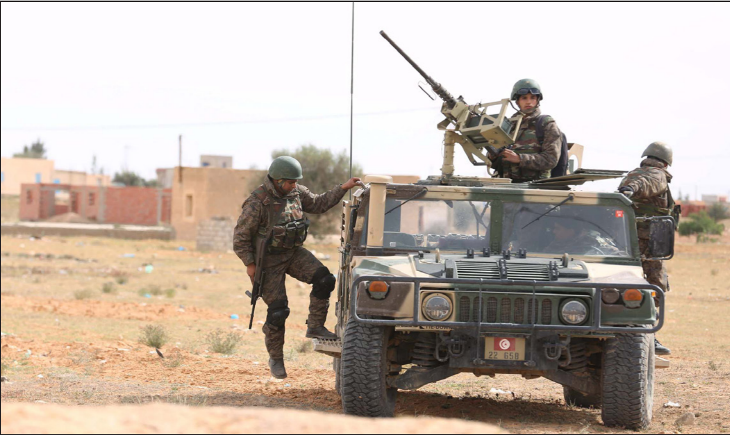
قوات أمن تونسية قرب الحدود الليبية عقب الهجوم الإرهابي في مدينة بن قردان