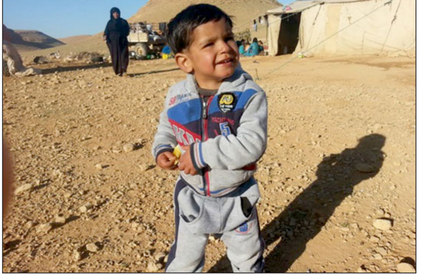
أحدى خيام أهالي القائم في الصحراء (القدس العربي)

قال قائد عسكري عراقي إن بعض المقاتلين المحليين في صفوف تنظيم «الدولة» انشقوا عن التنظيم مع استعداد القوات العراقية لعملية لاستعادة السيطرة على مدينة الموصل بشمال البلاد. وانتشر آلاف الجنود العراقيين في الشمال خلال الأسابيع الأخيرة مسلحين بالأسلحة الثقيلة وأسسوا قاعدة مع قوات أمريكية وقوات من إقليم كردستان العراق شبه المستقل في مدينة مخمر الواقعة على بعد نحو 60 كيلومتراً جنوبي الموصل. ووصف اللواء الركن نجم الجبوري قائد عمليات محافظة نينوى والمسؤول عن العملية المنتظرة لتنظيم «الدولة» بأنها مستنزفة لكنه قال إن المناقشة بين القوى المختلفة التي تستعد للمشاركة في معركة الموصل تصب في مصلحة المتشددين. وقال إن عملية تحرير نينوى ستتم على مراحل وإن القوات تنتظر الأمر الأعلى للبدء في الخطوة الأولى. وسقطت مدينة الموصل عاصمة نينوى التي يعيش فيها نحو مليوني شخص في أيدي تنظيم «الدولة» إثر هجوم خاطف في 2014. والمدينة هي أكبر المدن التي يسيطر عليها التنظيم المتشدد في العراق وسوريا. وسيكون الهجوم العراقي المضاد بدعم من ضربات جوية ومستشارين من التحالف بقيادة واشنطن أكبر هجوم مضاد يتعرض له التنظيم على الإطلاق. وتقول مصادر عسكرية كردية وعراقية إن أولى التحركات ستشكون غرباً من مخمر إلى بلدة القيارة على نهر دجلة مما سيقطع الشريان الرئيسي لتنظيم «الدولة» بين الموصل والأراضي الخاضعة لسيطرتها جنوباً وشرقاً.