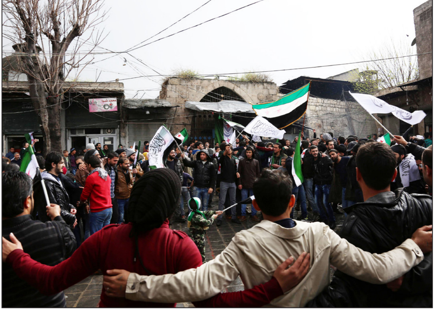
سوريون يحملون أعلام الثورة، أمس، خلال تجمع حاشد بمناسبة الذكرى الخامسة لبدء النزاع في حلب