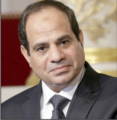
الرئيس المصري عبد الفتاح السيسي