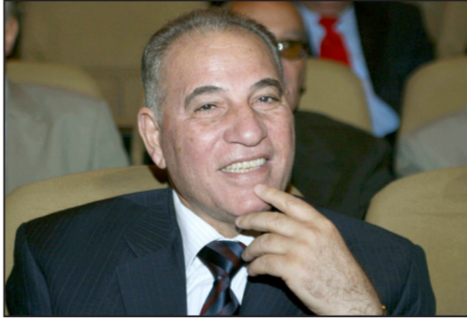
الاستشار أحمد الزند

يؤخر له أي منصب تنفيذي وهذا ما علمه عن المستشار أحمد الزند عن يقين». وأضافت في تصريح لها في برنامج «العاشرة مساءً» على فضائية «دريم»، أن «الزند يعتبر منصب وزير العدل تكليفاً له في مرحلة صعبة تمر بها مصر الوطن والدولة، وعليه سابق الزمن من أجل رجعت بلاده والعدالة في مصر». وأكدت: «ما استوقفتني هو المسلك السياسي المحيط بالقرار، ومنها ما قاله قضاة كبار بشأن الضغوط التي مارست على المستشار الزند من أجل تقديم استقالته».