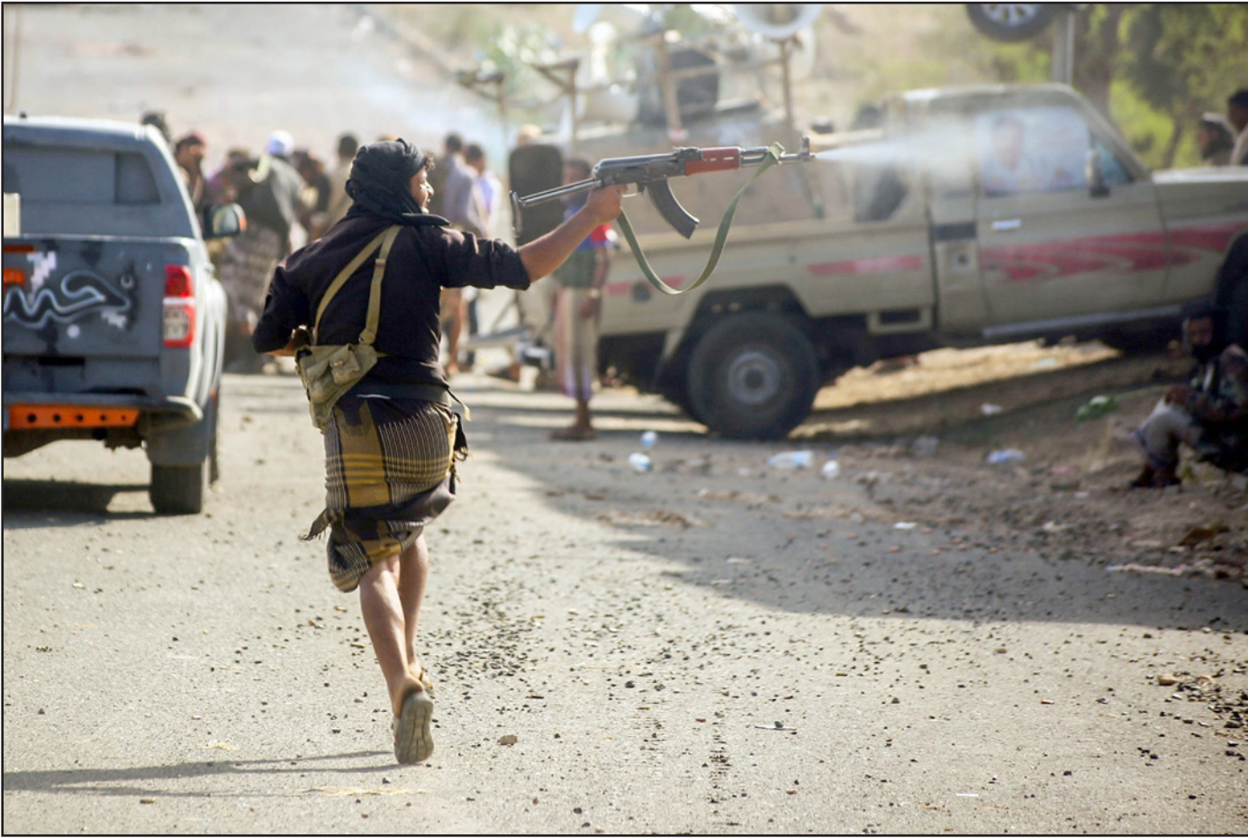
مواجهات بين المقاومة المؤيدة للرئيس اليمني عبد ربه منصور هادي والحوثيين في تعز (ا ف ب)

الشعبية على مقربة من منطقة السلم في بيحان في محافظة شبوة، وأشارت المصادر إلى أن طيران التحالف العربي شن غارات جوية على مواقع الحوثيين وقوات صالح في بيحان، ما أسفر عن تدمير دبابة تابعة للحوثيين وقوات صالح.