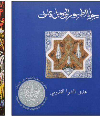
هدى الشوا القديسة