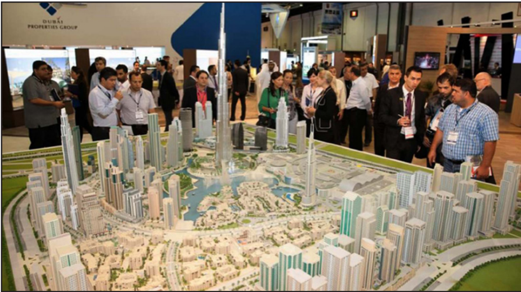
زوار «سي تي سكيب تركيا» يتطلعون إلى مجسم لأحد المشاريع العقارية المعروضة

وطرابزون واماكن أخرى، كما ان استثماراتهم في هذه الاماكن ليست فقط على صعيد المؤسسات بل أيضا على الصعيد الفردي. واستطرد «سنستطيع القول ان تركيا تحتل الرقم الأول في استثمارات الدول الخليجية»