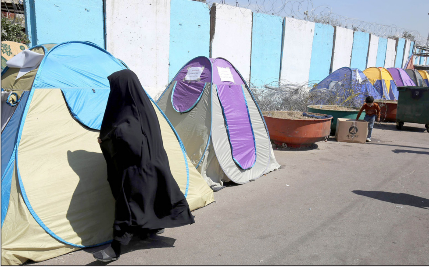
عراقية تسير بجانب خيام في وسط بغداد نصيبها معتمسون مطالبون بالإصلاح الحكومي (آ ف ب)

حالات انتحار في نينوى والفلوجة». ومن جهة أخرى، دعا الفرجي «الحكومة العراقية إلى غسل عار جسر بزييز وسيطرة الرزاوة والسماح للمواطنين الفارين من الموت بالذبول بلا شروط إلى عاصمتهم أو المدن الأخرى». وطالب الفرجي البرلمان بـ«عقد جلسة طارئة لمناقشة الأوضاع المساوية لأهالي هذه المناطق. ودولياً، وصف تقرير لبعثة الأمم المتحدة في العراق مدينة الرمادي، التي تم تحريرها من تنظيم داعش نهاية العام الماضي، بأنها «أكثر المدن في العالم تلوثاً بالألغام، ومعظم أحيائها غير آمنة بسبب هذه القنذرات». ونكر بيان للبعثة أن «المثلة المقيمة لبرنامج الأمم المتحدة الإنمائي ومنسقة الشؤون الإنسانية في العراق، لينز غراند، زارت الرمادي برفقة محافظ الأنبار، ضهير الراوي، لتقييم الأوضاع وتقديم الدعم اللازم بصورة عاجلة للأسر العائدة إلى ديارها».