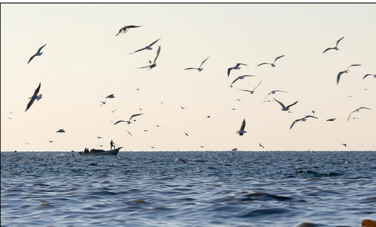
شاب فلسطيني يصطاد السمك في بحر غزة

وكان نتنياهو بحسب بيان صادر عن ديوانه قد هاتف رئيس الوزراء البلجيكي شارل ميشيل ووزيرة الخارجية للاتحاد الأوروبي فيديريكا موفريني لتقديم التعازي. لكن الرسالة الحقيقية ليست العزاء أو أمنيات الشفاء للجرحي بل ما