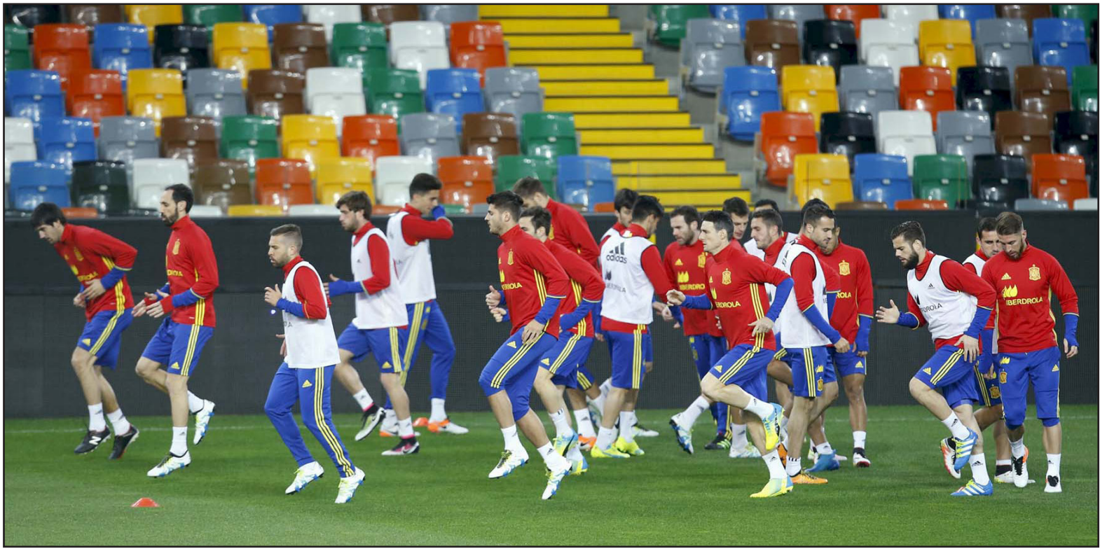
لاعبو منتخب اسبانيا في حصة تدريبية

ونيلع أسبانيا مباراتها أمام إيطاليا ثم تواجه رومانيا بعد أربعة أيام، حيث أكد دل بوسكي أن جميع اللاعبين سيحظون بنصيب من المشاركة: «هدفنا هو أن يلعب جميع المنضمين، بما فيهم سيرخيو ريكو (حارس إشبيلية)». وأشاد دل بوسكي بالمنتخب الإيطالي قائلا: «إيطاليا مليئة باللاعبين الجيدين، إصابة فيراني أو ماركيزيو أمر يسير بالنسبة لهم».