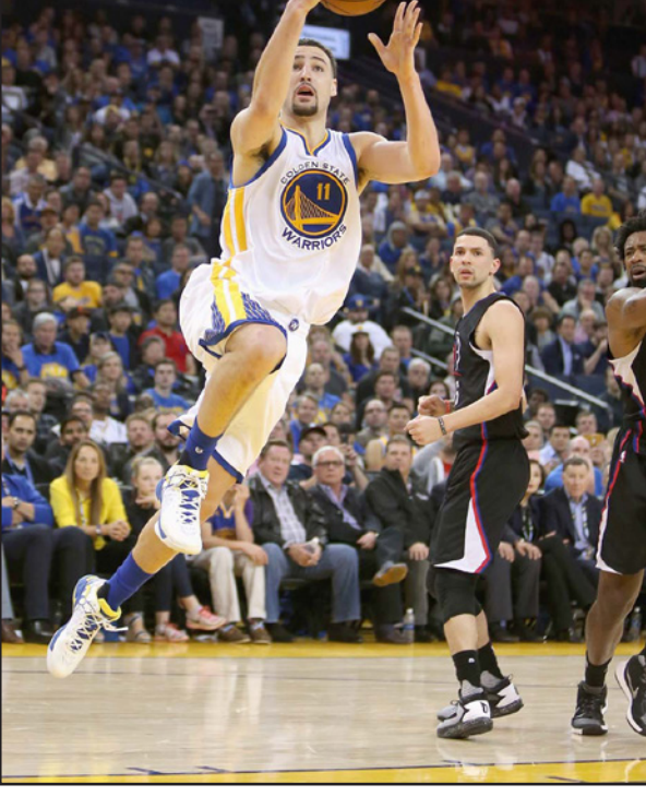
نجم جولدن ستيت واريورز كلي سمبسون يحاول التسديد

وسجل ستيفن كيري 33 نقطة وأضاف زميله كلاي طومسون 32 نقطة منها 25 نقطة في الشوط الثاني من المباراة ليقودا واريورز إلى تحقيق الفوز الحادي والخمسين على التوالي في المباريات التي يخوضها الفريق بملعبه علما بأن منها 33 انتصارا في الموسم الحالي و18 انتصارا في الموسم الماضي. وحقق واريورز في هذه المباراة الفوز الرابع والستين له مقابل سبع هزائم في رحلة الدفاع عن لقبه بالسابقة وأصبح الفريق بحاجة للفوز في تسع من 11 مباراة متبقية له في المسابقة هذا الموسم ليحطم الرقم القياسي لعدد الانتصارات التي يحققها أي فريق في مباريات الموسم المنتظم على مدار تاريخ البطولة، وما زال هذا الرقم القياسي مسجلا باسم شيكاغو بولز الذي حقق 72 انتصارا في موسم 1996 / 1995.