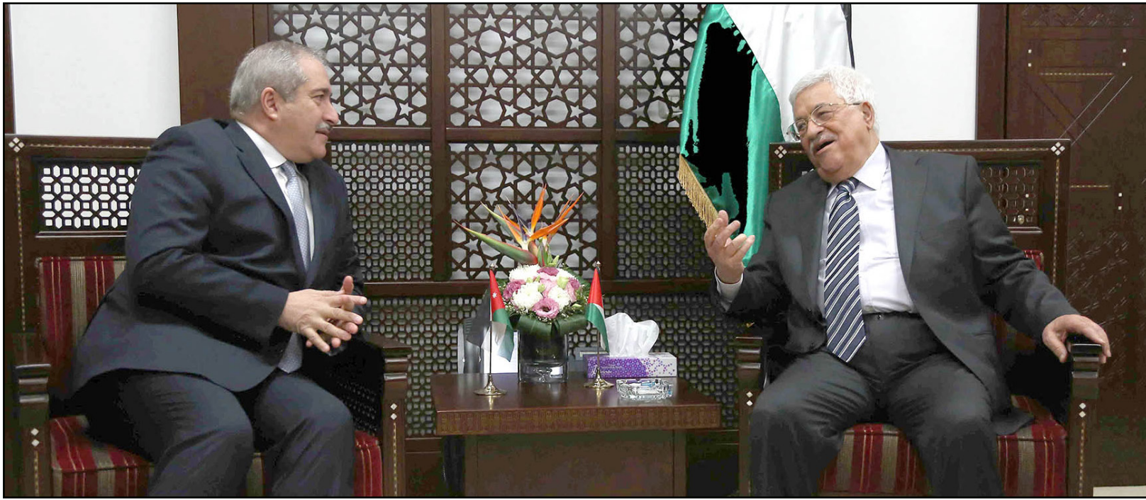
الرئيس الفلسطيني محمود عباس ونائب رئيس الوزراء الأردني ناصر جودة

وشدد عباس، لدى استقباله في مدينة رام الله نائب رئيس الوزراء الأردني وزير الخارجية ناصر جودة، على أن المقدسات هي تحت الوصاية الأردنية -إلى أن يتم تحرير القدس وإقامة الدولة الفلسطينية، بحسب ما أوردت وكالة الأنباء الفلسطينية الرسمية «وفا».