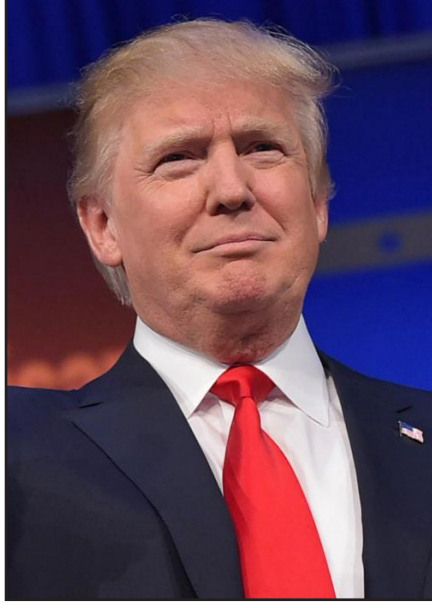
المرشح الجمهوري دونالد ترامب

من العنصرية الفظة، احذروا من العنف. احذروا من الطريقة التي يحرف فيها الجمهور الغفير ويفعل به ما يشاء، على مدى التاريخ كان الديماغوجيين ومحركي الكراهية مثل ترامب، هم الاعداء الأكبر لليهود. في عدد كبير من الدول وفي اوقات متعددة، دفع اشخاص مثل ترامب إلى حدوث صدامات و غضب شعبي أدت في نهاية المطاف إلى مطاردة اليهود، ويقرض أن يقشعر بدن كل يهودي عند الوقوف أمام ظاهره ترامب. هل سنستقف صامتين حينما يتحدثون عن المسلمين كما تحدثوا عننا؟ هل سنشارك عندما يتم جمع ملايين المهاجرين الاخرين داخل محطات الشرطة؟ من الواضح ان فيلم ترامب هو فيلم ربع. ومن الواضح انه سينتهي في لحظة. في الوقت الذي سيرفض فيه أمريكا للخطر سيدوس ايضا على كل ما ترمز اليه اليهودية. ترامب يحاول تسويق الخدعة لأنه كان حليفا مخلصا لإسرائيل. لكن ترامب اتعزالي، وإذا أصبح رئيسا فانه سيفقد الناتو وينسحب من الأمم المتحدة وينسحب يده من الشرق الاوسط من اجل التركيز على المشكلات الأمريكية الداخلية.