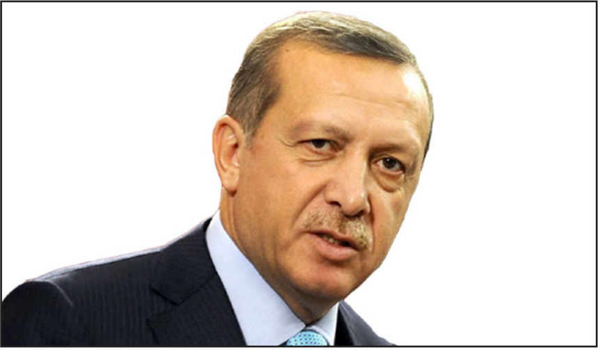
الرئيس التركي رجب طيب اردوغان

للتفكير بالمفارقة التي تشوه السياسة الإسرائيلية، أكثر من 38 في المئة منهم عاطلون عن العمل، وفي اوساط الشباب تحمل نسبة البطالة التي 53 في المئة، وهم ايضا لا يعملون بشكل زائد في اعمار منازلهم لأن مواد البناء التي تصل إلى القطع تبلغ تقريبا 14 في المئة مما يحتاجون اليه. لا توجد لإسرائيل سياسة واضحة تجاه غزة باستثناء الحصار، لا توجد لها اهداف واضحة أو خطط عمل باستثناء العبء الجماعي الذي لا يقول ما يريد تحقيقه. كل ما بقي للغزيرين ليعفوه هو الزهارة عن اردوغان، وخصوصا على داعش أو أي منظمة إرهابية اخرى في تركيا. بان تصيب إسرائيلييين بالصدمة، الأمر الذي سيجرح العلاقات بين تركيا وإسرائيل لاحدات العجزة. الفاتنازيا احيانا يمكن ان تتحقق.