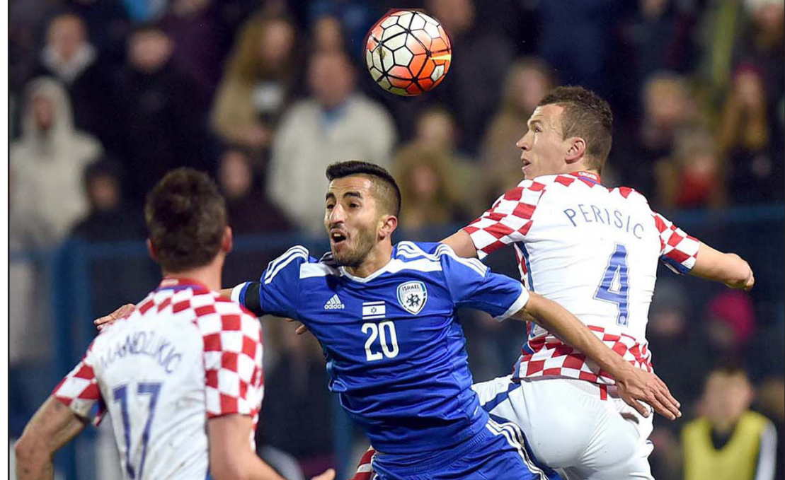
صراع هوئي على بين لاعبي منتخب إسرائيل وكرواتيا

■ أرسو - رويترز: سجل ياكوب بواشتكوفسكي هدفا في الشوط الأول ليمنح بولندا التي خاضت المباراة في مباراة ودية متكافئة الأربعاء الماضي عانى خلالها الفريق التاهل لبطولة أوروبا 2016 لكرة القدم في اختراق الدفاع الصربي القوي. وسجل بواشتكوفسكي الذي يلعب على سبيل الإعارة مع فيورنتينا الإيطالي هدفا في الدقيقة 28 بتسديدة من داخل منطقة الجزاء. ولم يعد الجناح البالغ عمره 30 عاما من اللاعبين الأساسيين في تشكيلة فيورنتينا مؤخرا لكنه عزز فرصته في المشاركة مع بولندا في بطولة أوروبا التي تنطلق في بولندا في مباراة ودية مع صربيا.