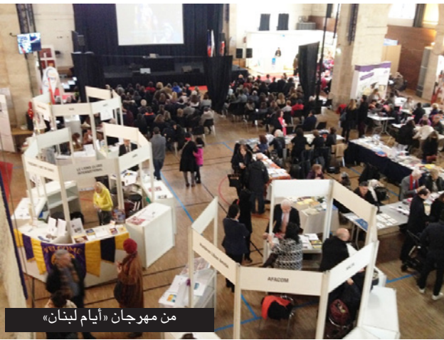
من مهرجان «أيام لبنان»

على مدى 3 أيام، استضافت باريس مهرجاناً ثقافياً هو الثاني بعد العام 2015، بعنوان «أيام لبنان»، يتناول الحياة الثقافية والاجتماعية والسياحية في لبنان، ويضم سلسلة من المشاركات الهادفة إلى إظهار «الصورة المتفتحة» لبلد الأرز. لا سيما أن هذه المبادرة تسعى عبر عروض أفلام لخرجين لبنانيين، وحرف وأشغال يدوية، وعروض ومذاقات، إلى تعريف المواطن الفرنسي ذي الأصول اللبنانية ببلده وتاريخه، وتقرب أبناء هذا الجيل المهاجر من الوطن، متجاوزة الاختلافات السياسية والطائفية الراهنة، إضافة إلى إتاحة الفرصة للفرنسيين بالتعرف إلى بلد سمي يوماً ما «بسيوسرا الشرق».