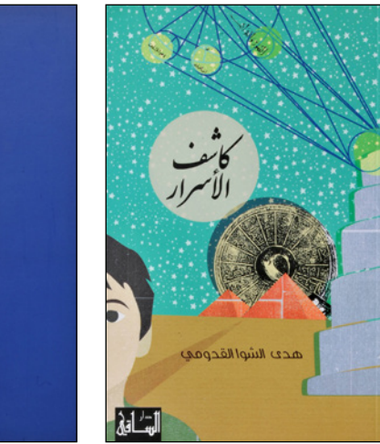
هدى الشوا القديسة