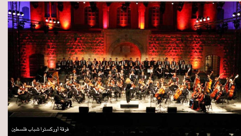
فرقة أوركسترا شباب فلسطين

وأضاف قبل بدء الحفل «هدفنا الأساسي هو نحاول قدر الإمكان تعزيز الهوية الفلسطينية، وما نثور شيء أو ما نثيت شيء آخر لآخر، يعني إحنا مش مضطرين نثيت لآخر إحنا إرهابين أو مش إرهابين، إحنا في الآخر فلسطينيين شعب موجود مقاوم عنده ثقافة