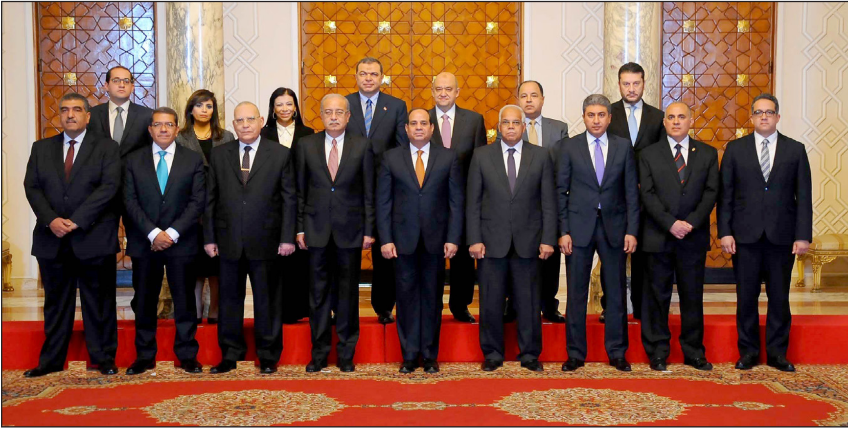
أعضاء الحكومة المصرية بتشكيلها الجديد