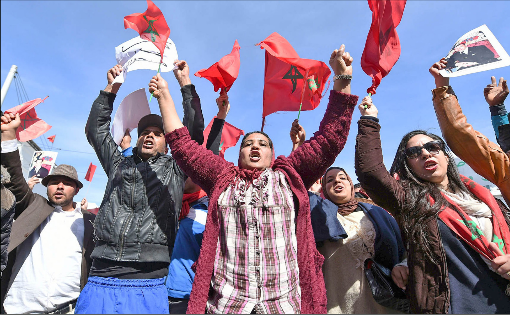
متظاهرون مغاربة في وقفة احتجاجية على تصريحات الأمين العام للأمم المتحدة

وتحدثت تقارير عن إمكانية إعفاء الدبلوماسي الأمريكي كريستوفر روس، من مهمته كبعوث شخصي للأمين العام للمنظمة الدولية في الصحراء، بعد فشله في تقريب وجهات النظر بين المغرب وجبهة «البوليساريو» المدعومة من طرف الجزائر، ومساهمته بشكل أو بآخر في تاجيج الوضع بالمنطقة، ويحمل المغرب المسؤولية الأساسية لعرقلة تسوية سلمية للنزاع الصحراوي لروس وطالب في وقت سابق بإغاثته إلا