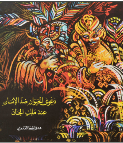
هدى الشوا القديسة

فالتحولات الواقعية التي كانت جزءاً من المتخيل، هذه التي تتحدث عنها ميسون في صور بلاغية موحية، تتأتى من روح الشاعر، الشاعر المتمرد، ذلك الشاعر الحالم بالثورات حينما كانت، ذلك أنها سحبت الخلقة وتحرك الرايح والأبدى والمقر من أعوان الابد الطولي: «تشتعل الثورات، تتسكّر، كل في مكانها، نطق