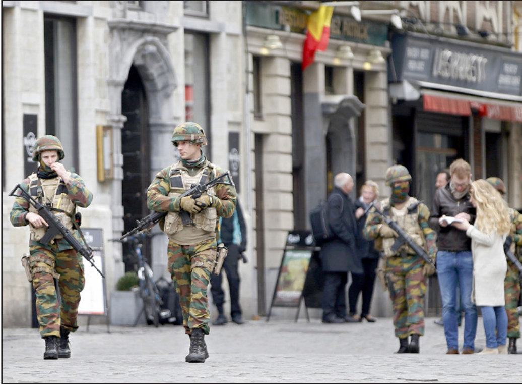
جنود بلجيكيون يمشون في شوارع بروكسل بعد الهجمات الأخيرة

■ بروكسل. الإرهاب يضرب بلجيكا بطريقة مختلفة عما يضرنا. هذا الإرهاب من النوع القديم المبني على خلايا سرية تقوم بتجهيز أعضائها لفترة من الزمن في قلب السكان الذين يشبهون بالشرطة رغم أنهم لا يتعاونون مع الإرهاب. للوهلة الأولى يمكن إفسال هذا النوع من الإرهاب. والحقيقة هي أن عدد كبير من مفندي هجوم داعش في باريس وبروكسل قد تم اعتقالهم في السباق للتحقيق. عرفوا عنهم، لكن ذلك لم يؤد إلى الإفشال. الاخفاق قليل. وهو أنقل لأن كل من يعيش في بروكسل يفهم أن هذا ليس الاخفاق الاخير. السلطات في بلجيكا متخصصة فيما بينها ومشولة. وما كان هو ما سيكون نحن الإسرائيليون نصدد أمام هذا الإرهاب ونضع كل شيء في رزمة واحدة: البحر هو نفس البحر المسلمون هم نفس المسلمون والإرهاب هو نفس الإرهاب. هذا ما يقوله لنا زعمائنا ونحن نصدق ذلك. إذا كان كل شيء مشتابها، كل شيء داعش، إذا نحن معيقون من مواجهة إرهابيا بجديدا، ما يغلغه إرهاب داعش في أوروبا، يجب علينا تعلم عدم استخدامه كواقي لصفير فلغ. بروكسل هي مركز فخر تشبه قوة عظمى كونيالية سابقة وعاصمة للاتحاد الأوروبي. ومن حولها، على بعد دقائق سيرا على الاقدام، تمتد أحياء المهاجرين. كل حي هو بمثابة مدينة بحد ذاتها. لقد عرفنا في طفولتنا أسماء هذه الأحياء حسب فرق كرة القدم التي مثلتها: اندر ليخت وموليك. ونحن نعرفها اليوم بسبب المبدأ الذي ووجه فيها نشطوا الإرهاب. تمثل بروكسل باعتبارها وحرف على الأحياء التي تحيط بها. إنها لا تعرف كيف تتعلمها ولا كيف تتلقاها.