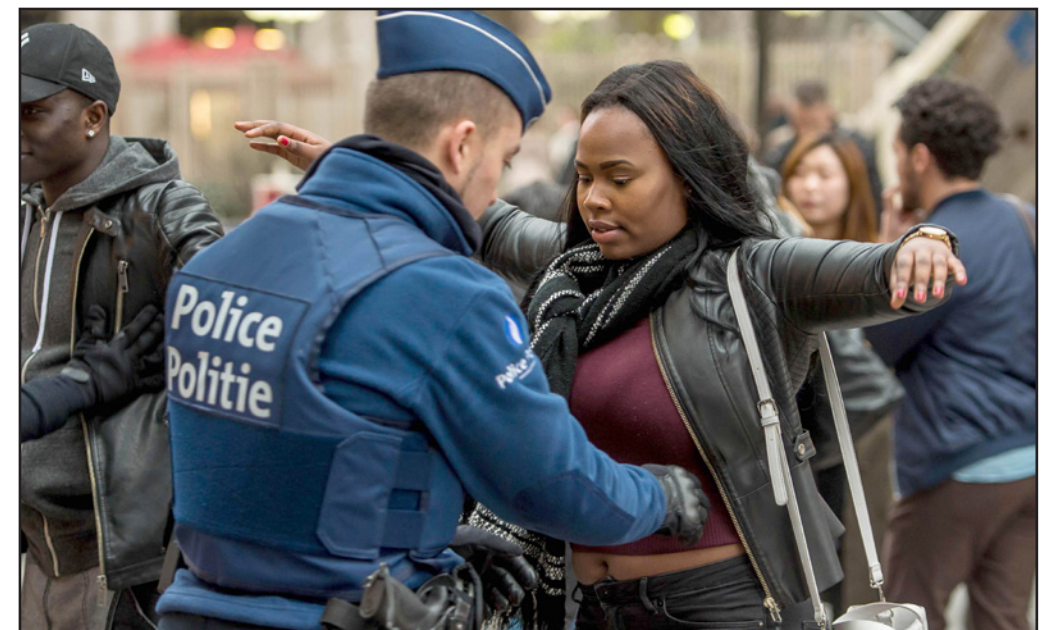
شرطي يتفحص شابة أمام محطة القطارات في بروكسل

جديدين متورطين في هجمات بروكسل. وأشارت الشرطة إلى أن الشخص الأول مشتبه به جديد قد يكون متورط بهلجوم الانتحاري»، الذي استهدف محطة مترو مالبيك. إن كان إلى جانب الانتحاري خالد الكيرواي في لغظات كاميرات المراقبة. أما الثاني فهو الرجل الرابع الذي كان في المطار وظهر إلى جانب الانتحاريين، الكيرواي والعشراوي في تسجيل كاميرا مراقبة، وهما يدفعان عربةتي حقائب أمامهما.