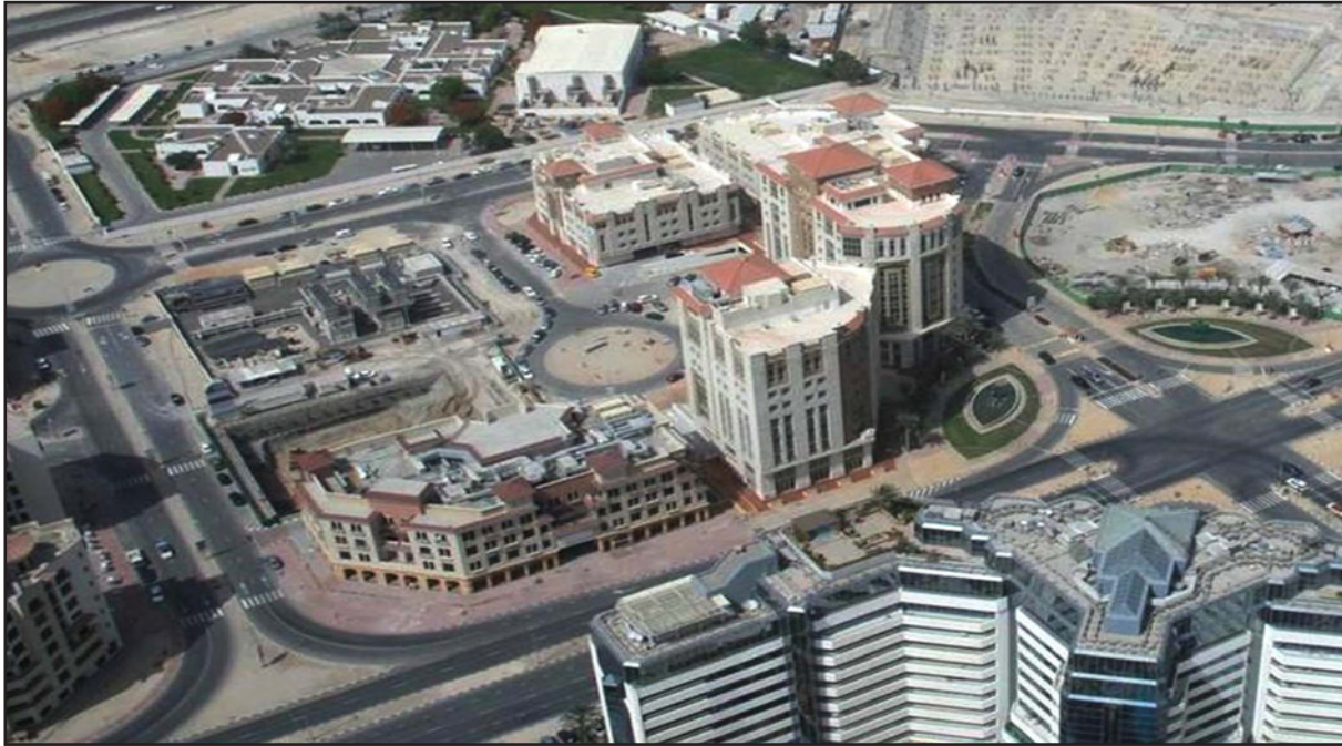
صورة من الجو لمدينة دبي الطبية