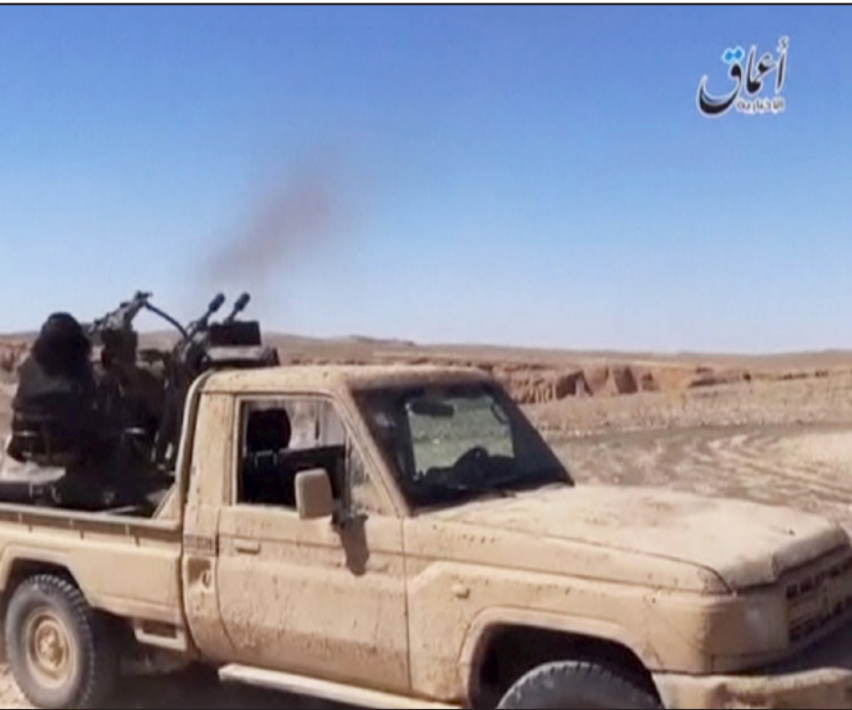
صورة مأخوذة من فيديو لمقاتل في «الدولة الإسلامية» يطلق النار من مدفع مضاد للطائرات باتجاه طائرات النظام على مشارف مدينة تدمر (رويترز)

وأكد لودريان ان «المعارك في تدمر التي يشارك فيها الروس مستمرة»، متوقفا «استعادة المدينة»، ومشيرا إلى «تفكير التنظيم المتطرف في العراق كما في سوريا»، مؤكدا ان داعش خسرت 25 في المائة من الأراضي التي احتلتها منذ العام 2014، (ومن بينها مدينة الشدادي معقل المتطرفين في محافظة الحسكة (شمال شرق