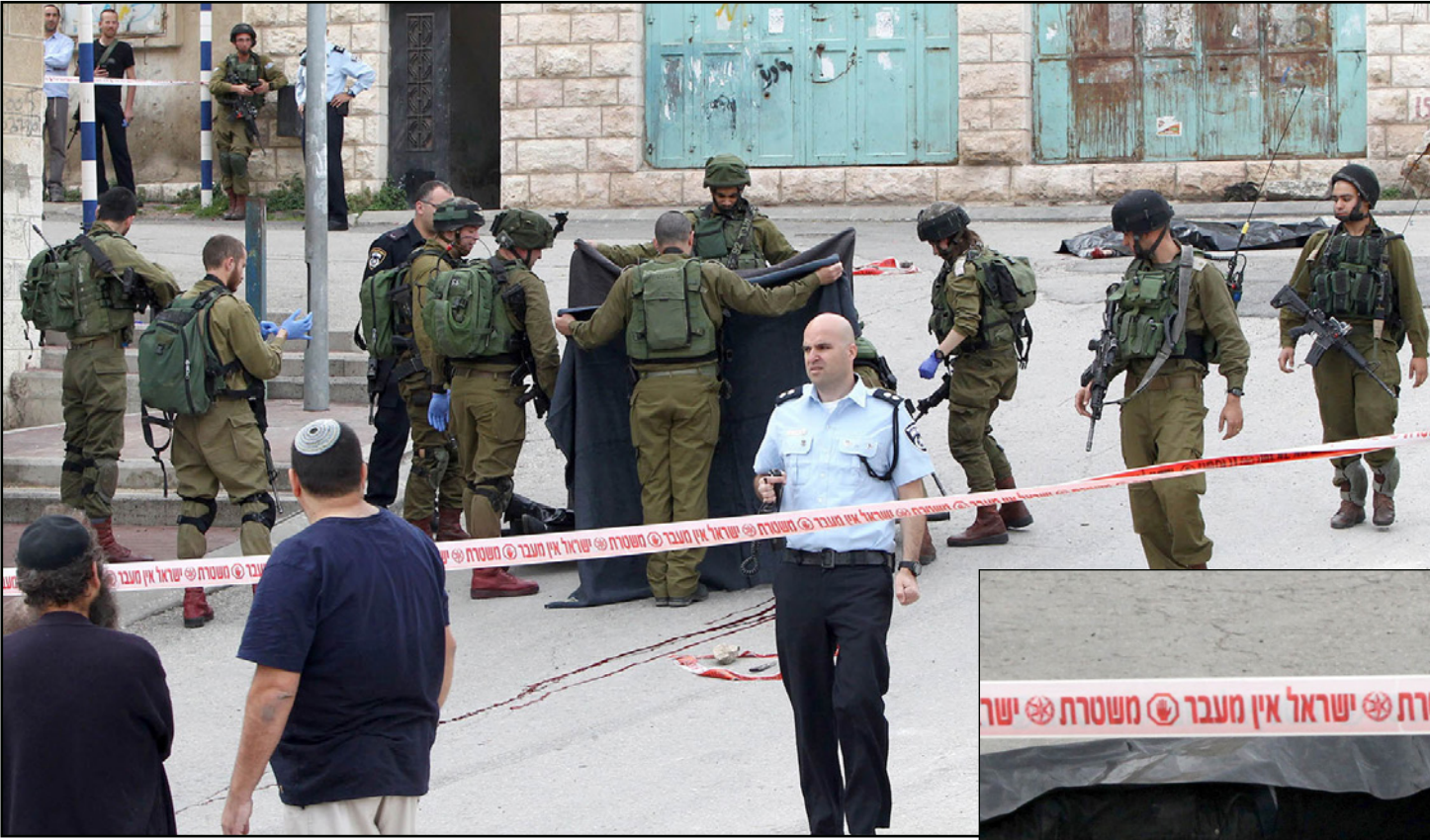
جنود قوات الإحتلال الإسرائيلي عقب إطلاقهم النار على شاب فلسطيني في مدينة الخليل، وفي الإطار جثمان أحد الشهيدين

ودائرة الآثار الإسرائيلية وقاعات مؤتمرات وغرف تعليمية ومواقف لسيارات السياح والمستوطنين ولاستخدامات سياحية ومحلات تجارية ومكاتب خاصة لجمعية العاد. بدوره أعرب مركز المعلومات ولجنة حي وادي حلوة في بيان مشترك عن استنكارهما للمصادقة على مشروع جمعية العاد الاستيطانية الذي يترجم على إدخال الحي، كون هذه المصادقة على المشروع لا تخدم سوى الأجندة الاستيطانية، وستكون مقدمة للموافقة على كافة المشاريع الاستيطانية في سلوان. وطالب بيان المركز واللجنة منظمة الأمم المتحدة للتربية والعلوم والثقافة اليونسكو بالتدخل الفوري لأن تنفيذ هذا المشروع يعني الساس بمدينة تاريخية كمدينة القدس المحتلة ومسجلة بالتراث العالمي الذي أصبح مهددا بالخطر.