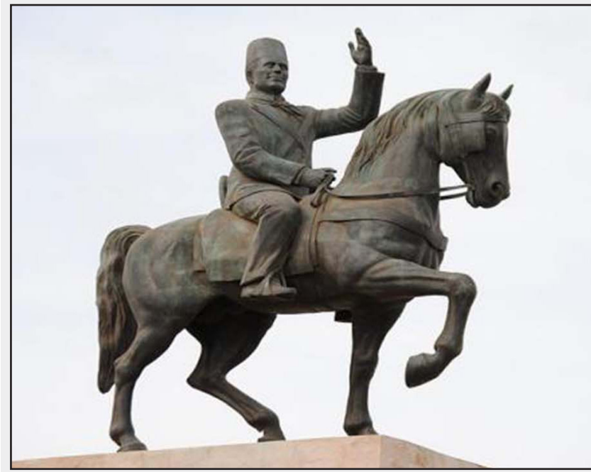
تمثال الحبيب بورقيبة

تونس - وكالات: أعلنت الولايات المتحدة الجمعة منح تونس «أول قسط» من مساعدات تبلغ قيمتها نحو 25 مليون دولار، لإقامة نظام مراقبة إلكتروني على حدودها مع جارتها ليبيا العارقة في الفوضى، فيما قال رئيس الحكومة التونسية الحبيب الصيد أن عملية بن قردان أسفرت حتى الآن عن القضاء على 55 عنصراً إرهابياً وإيقاف 52 آخرين. كما قال الصيد أن حكومته تفتأ ينقشها عن تصريحات الناطق باسم الحكومة التي دعا فيها إلى عودة بن علي. فقد أكدت السفارة الأمريكية في تونس في بيان منحه القسط الاول من عقد بقيمة 24.9 مليون دولار لمشروع يهدف إلى تعزيز قدرات تونس الأمنية الحدودية على طول الشريط الحدودي، مع ليبيا. وأضافت ان هذا العقد «سيوفر نظام مراقبة متكامل للحدود استناداً إلى أجهزة الاستشعار عن بعد، مع تقديم معدات أساسية لأن الحدود، فضلاً عن دورات مع الجيش والدرك