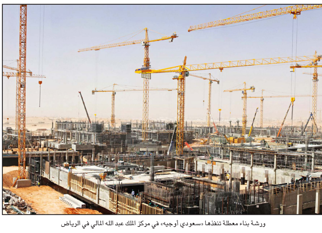
ورشة بناء معطلة تغذيها «سعودي أوجيه» في مركز الملك عبد الله المالي في الرياض

ويوضح الموظف، الذي امضى اعواماً طويلة في الشركة، انه «لا يملك خيار، الانتقال إلى مؤسسة أخرى، مشيراً إلى ان «سعودي أوجيه» وعدت في رسالة إلى الموظفين، بعودة تسديد الأجر نهاية آذار/مارس الجاري. وفي حين أثار تراجع الإيرادات النفطية للحكومة إلى الأوضاع الجديدة لشركات عدة تعتمد بشكل كبير على مستحقات حكومية، إلا ان مطلعين على وضع «سعودي أوجيه» يقولون ان مشاكلها بدأت منذ اعوام عدة.