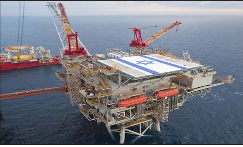
منصة استخراج في حقل صام البحري الاسرائيلي للغاز

على حساب المستهلكين. وطالبوا المحكمة العليا بوقفه، منددين أيضا بمساورات رئيس الوزراء للاتفاق على قانون منع الاحتكار. والاتفاق الذي رفضته المحكمة يتصل بتطوير حقل ليفيانان الواقع قبالة حيفا في شرق المتوسط، والذي يوصف بأنه واحد من أكبر حقول الغاز الطبيعي المكتشفة في الفترة الأخيرة، وتنتسب لـ«نوبل إيجسي» و«ديليك غروب» معا منذ 2013 حقل تامل الواقع على بعد حوالي 80 كلم قبالة سواحل حيفا. ورفضت هيئة المنافسة الاتفاق الاول بين الحكومة والشركات في كانون الاول/ديسمبر 2014، ما أجبرها على العمل لآخر تحت ضغوط سياسية واقتصادية كبيرة لمرافعتها. ودافع وزير الطاقة الإسرائيلي يوفال شتاينيتز من جهته عن الاتفاق، مشيرًا إلى الضرورة الملحة لإسرائيل لضمان أمنها في الطاقة.