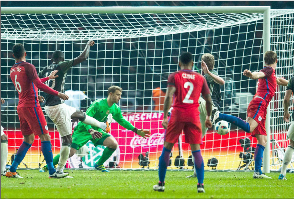
نجم منتخب انكلترا اريك داير (يمين) يسجل هدف الفوز في مرعى المانيا

برلين - رويترز: سجل البديل جيمي فاردي هدفا من لمسة ساحرة وأضاف زميله إريك داير هدفا بضربة رأس في الثواني الأخيرة لتحول انكلترا تأخرها بهدفين إلى فوز 3-2 على غريمتها ألمانيا في لقاء ودي ضمن استعدادات المنتخبين لبطولة أوروبا 2016 لكرة القدم السبيت الماضي. ويدان ألمانيا مستحققة انتصارا تقليدا على انكلترا عقب تقدمها بعد مرور ساعة من اللعب بنتيجة 2-0 صفر بفضل هدفي توني كروس وماريو جوميز - الذي هز الشباك مع بلاده لأول مرة منذ بطولة أوروبا 2012. لكن هاري كين غير مسار اللقاء بعدما استغل فرصة قبل أن يسجل فاردي بركب قدمه بشكل رائع في مرعى الحارس مانويل نوير بعد دخوله بحوالي ثلاث دقائق فقط. ارتقى داير أعلى من دفاع ألمانيا ليسكن برأسه الكرة في شباك نوير بعد ركلة ركنية نفذها جوردان هندرسون في الدقيقة الأولى من الوقت المحتسب بدل الضائع. وهذه أول مرة تحول فيها انكلترا تأخرها بهدفين إلى فوز منذ تفوقت 3-2 على إيطاليا في 1976 كما أنها أول مرة على الإطلاق تخسر فيها ألمانيا أو ألمانيا الغربية مباراة على أرضها بعد التفريط في التقدم بغارق هدفيين. ورغم أن الفوز جاء في لقاء ودي فإنه سيسمح لانتكرا دفعة مهمة في ظل الاعتماد على تشكيلة يفتقرها الخبرات. وقال يواكيم لوف مدرب ألمانيا لحظة زدي. إن التفريط يودعها «استحققت انكلترا الفوز وحتى عند تقدمنا 2-0 صفر سنحت لانكلترا العديد من الفرص. هذا درس جيد