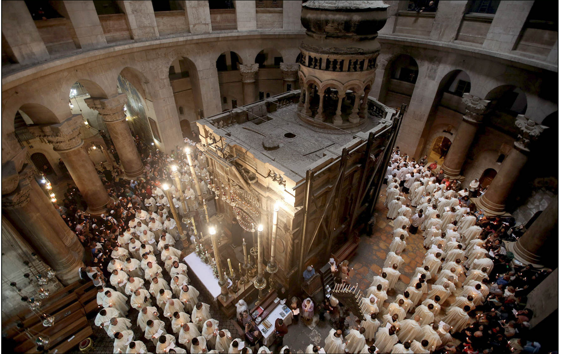
جانب من احتفالات عيد الفصح في مدينة القدس

و جاء ذلك بعد أن سمحت سلطات الاحتلال لـ 847 فلسطينياً من مسيحيي قطاع غزة، بالخروج من معبر بين حانون «إيرز» بعد حصولهم على تصاريح خاصة، إلى مدينة القدس، ولزيارة منطقة نهر الأردن. وهذه الخطوة غابت منذ عدة سنوات، منذ أن بدأت إسرائيل بفرض حصارها للحكم على قطاع غزة قبل نحو عشر سنوات. وأصدرت إسرائيل بعد طلب من هيئة