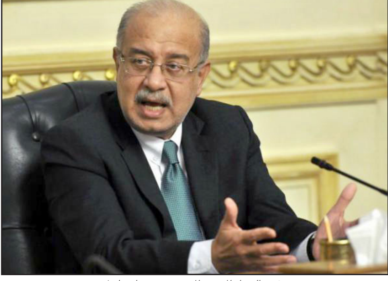
رئيس الوزراء المصري المهندس شريف إسماعيل

مجالس محلية منذ يونيو / حزيران 2011 عندما صدر حكم من محكمة القضاء الإداري بحلها في أعقاب الانتفاضة الشعبية التي أطاحت بالرئيس الأسبق حسني مبارك في فبراير / شباط من نفس العام. وأجريت آخر انتخابات للبرلمان المحلي الذي كان يقوده مبارك، وقال إسماعيل: «ستعمل الحكومة على تهيئة المناخ المناسب لإجراء الانتخابات المحلية خلال الربع الأول من عام 2017 بوصفه أحد أهم مقومات العملية الديمقراطية، وهذه أول مرة تحدد فيها الحكومة تاريخاً محتملاً للانتخابات المحلية التي طال انتظارها. انتخب البرلمان الحالي في أواخر العام الماضي وعقد أولى جلساته في العاشر من يناير كانون الثاني الماضي، ويهيمن على البرلمان مؤيدو الرئيس الحالي عبد الفتاح السيسي الذي انتخب بعد عام على إعلانه حين كان قائداً للجيش ووزيراً للدفاع عزل الرئيس السابق محمد مرسي المنتمي لجماعة الإخوان المسلمين عام 2013 إثر احتجاجات حاشدة على حكمه. وتعهد رئيس الوزراء بأن تعمل حكومته على تأسيس نظام سياسي ديمقراطي يحترم مبادئ حقوق الإنسان ويقوم على سيادة القانون». وتتهم دول غربية ومنظمات حقوقية محلية ودولية السلطات المصرية بارتكاب انتهاكات واسعة لحقوق الإنسان منذ عزل مرسي بالإضافة إلى تفويض المكاسب الديمقراطية التي انتزعتها المصريون بعد إطاحة مبارك، ونقسي مصر ذلك وتقول إنها ملتزمة بالديمقراطية ومعايير حقوق الإنسان. وشكّلت حكومة إسماعيل في 19 سبتمبر / أيلول الماضي بعد أسبوع من استقالة حكومة إبراهيم محلب. والمضي شمل عشرة وزراء جدد من بينهم وزراء المالية والاستثمار والسياحة.