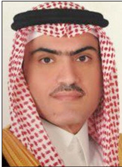
السفير السعودي ثامر السبهان

وقالت في بيانها إن «السبهان تجاوز الخطوط المرعد هذه