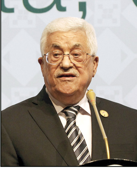
الرئيس الفلسطيني محمود عباس

وقدم مجموعة من الباحثين الذي شاركوا في إعداد هذا التقرير ملخصاً اليوم السبت لأهم ما تضمنه خلال ندوة في رام الله نظمتها مركز مدار.