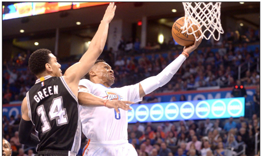
روسيل وستبروك نجم أوكلانوما سيتي ثاندر يحاول التسديد في سلة سان انطونيو سيرز

■ لوس أنجلوس - د ب أ: رغم غياب خمسة من النجوم تقدم سان انطونيو سيرز بشكل مفاجئ على أوكلانوما سيتي ثاندر قبل أن يصنع روسيل وستبروك الفارق. وسجل روسيل وستبروك 29 نقطة وثمان تمريرات حاسمة ليقود ثاندر للفوز على سيرز 92/111 السبت الماضي ويحقق الفريق فوزه السابع على التوالي في دوري كرة السلة الأمريكي للمحترفين. وسجل كيفين دورانت 31 نقطة وعشر متابعات لفريق ثاندر الذي لم يخسر منذ هزيمته 93 / 85 أمام سان انطونيو في 12 اذار/مارس الجاري. وحقق ثاندر فوزه رقم 51 مقابل 22 هزيمة حتى الآن، ويات هو الموسم على سيرز الذي فاز مرتين هذا الموسم على سيرز الذي تعرض لهزيمته الثانية عشر مقابل 61 انتصارا حتى الآن. وقرر جريج بوبوفيتش مدرب سيرز جرحى واحدا وخمس من 17 نقطة لكل منهما لفريق سيرز.