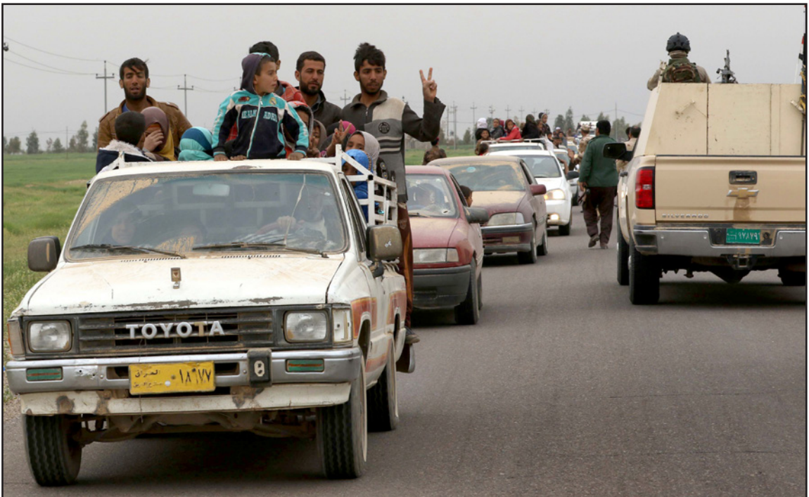
مواطنون يخرون من المعارك الدائرة بين القوات العراقية وتنظيم «الدولة» في الموصل