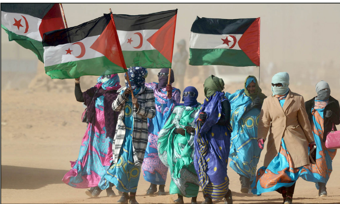
سيدات صحراويات يرفعن علم جمهورية الصحراء

على طلب منهم». وأضاف بلاغ المنوبية بأنه «رغم مرور 22 يوماً من إضرابهم المزعوم عن الطعام، يتضح أن حالتهم الصحية عادية ولا تدعو إلى القلق؛ مما يفيد بأن إضرابهم المفرض عن الطعام هو إضراب صوري وان المنوبية العامة حرصت على قياس مجموعة من مؤشراتهم الحيوية، لكن حرصها هذا قابل بالرفض من طرفهم». وأكد البلاغ إن «الأسباب الحقيقية الكامنة وراء إضراب هؤلاء المعتقلين عن الطعام لا تمت بصلة لظروف اعتقالهم بالمؤسسة المذكورة، وإنما لها نواع وأهداف وأجندة غير ملعن عنها».