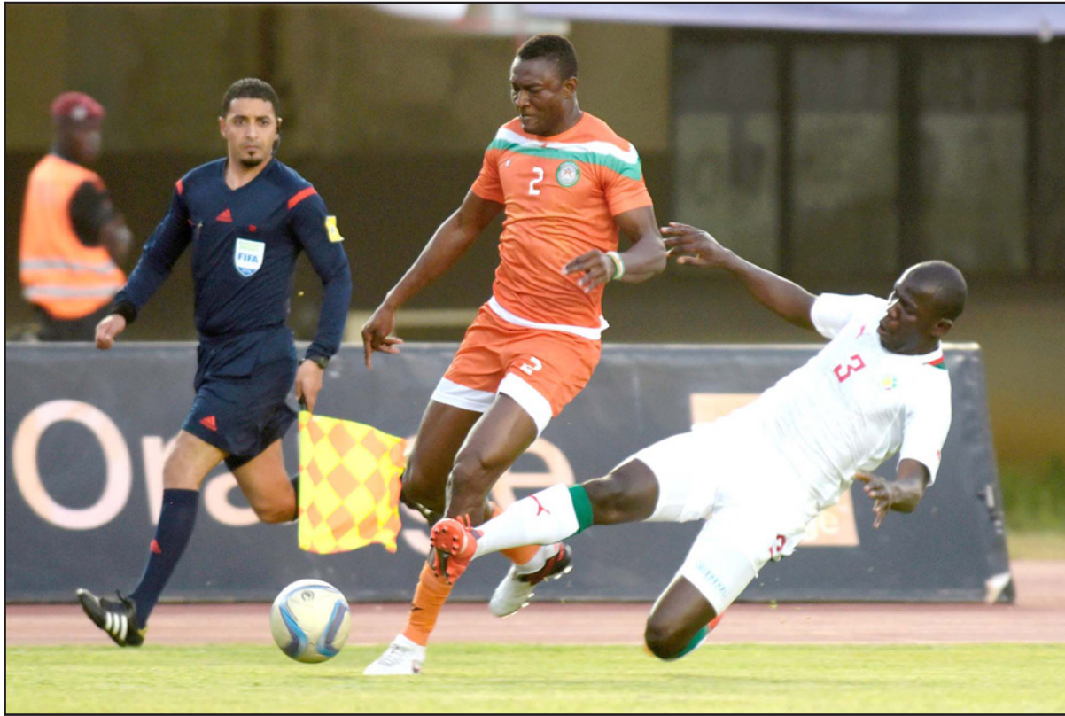
نجم منتخب السنغال كاليدو (يمين) في صراع على الكرة مع نجم منتخب النيجر اونو موسى

■ برابيا - د ب أ: انقرد المنتخب المغربي بصدارة المجموعة السادسة في التصفيات المؤهلة لنهائيات أمم أفريقيا التي ستقام مطلع العام المقبل بالجابون بتغلبه على مضيفه منتخب الرأس الأخضر / كاب فيردي / 1 / صفر السبت الماضي في الجولة الثالثة. ورفع المنتخب المغربي رصيده إلى تسع نقاط في صدارة المجموعة فيما توقف رصيده لمنتخب كاب فيردي عند ست نقاط في المركز الثاني. ويدين المنتخب المغربي بهذا الفوز للاعبه يوسف العربي الذي سجل هدف المباراة الوحيد في الدقيقة 25 من ضربة جزاء. وتعد هذه المباراة هي أول مباراة رسمية يقود فيها الفرنسي هيرفي رينار تدريب الفريق عقب توليه المسؤولية خلفًا لليادو الزاكي. وتقام مباراة العودة بين الفريقين بمدينة مراكش يوم الثلاثاء المقبل.