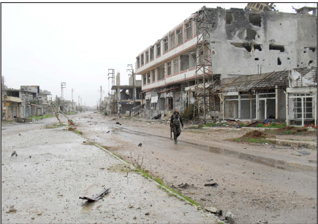
عصر من الفصائل السورية المقاتلة في أحد شوارع درعا وقد حُلى من السكان

لثرائ العالمي. وأعلنت القيادة العامة للجيش في بيان نقلته الجزيرة الرسمية إن «السيطرة على مدينة تدمر تشكل قاعدة