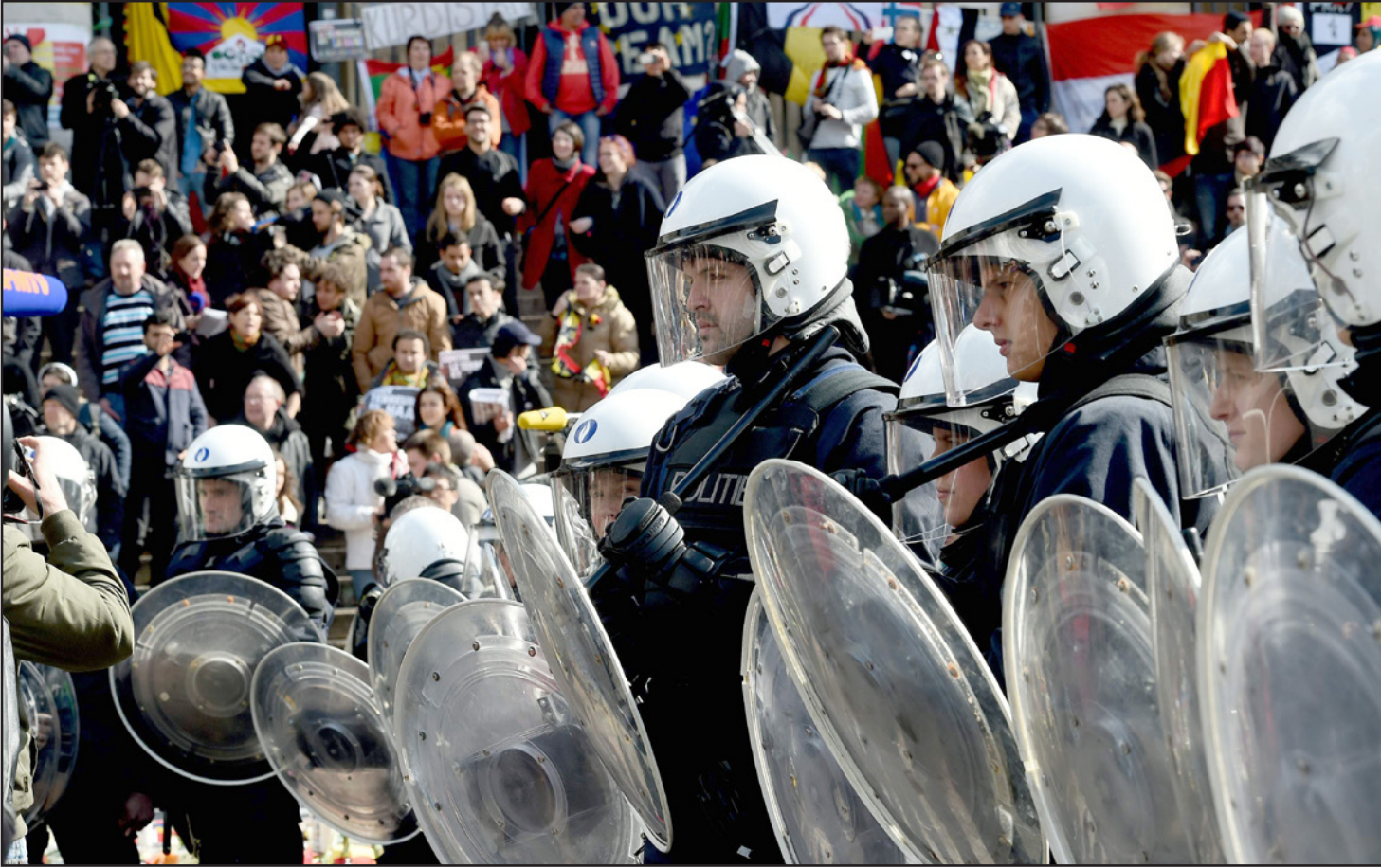
قوات من شرطة الشغب البلجيكية خلال مواجهات مع متطرفين يمينيين وسط بروكسل

ومع ذلك فقد أثارت التحضيرات الطويلة للهجمات وبدون أن تعرف السلطات الأمنية بها وعلاقتها مع هجمات باريس غضب السياسيين والرأي العام والحلفاء في أوروبا وفي الخارج. وسأل النائب في البرلمان البلجيكي ماركو فان هيس وزير الداخلية «ماذا كل هذا العجز المستمر». وترى الصحفية أن بلجيكا مثلت مشكلة كبيرة في الكفاح ضد المتشددين. وكان تفكيك شبكية إرهابية في فيرفيه في جنوب البلاد والتي أحبطت عملية كبيرة نصرأ للسلطات الأمنية لكنه غطى على الشبكة ولم يحلها وقد انفجرت لاحقا