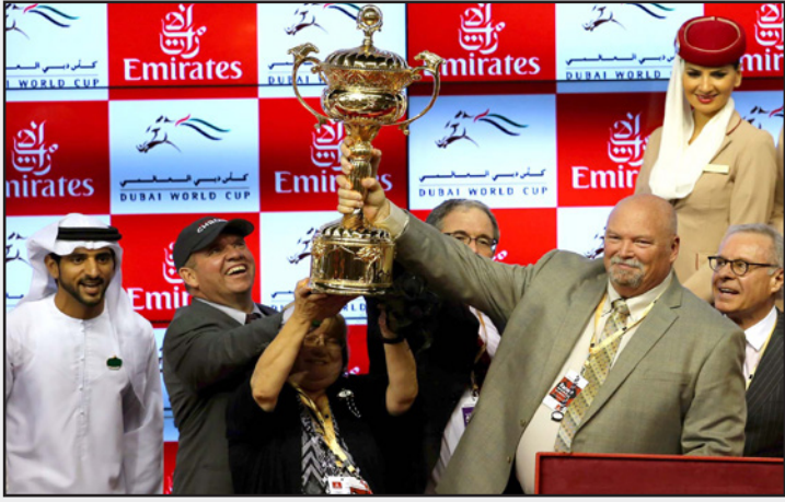
الأمريكي مالك الجواد كالفورنيا كروم يرفع كأس دبي العالمية للخيول

جواد هذا العام امريكيون. وأبلغ دي كوك الصحافيين بأنه لا يزال يشعر بالفخار لأداء ميتهج صاحب المركز الثاني والملوك للشايخ محمد بن خليفة آل مكتوم. وقال «إنه بالتأكيد ليس جواد أريد منحه راحة الآن.. إنه حسان أرغب في استمراره». وكان كروم مرشحا للفوز العام الماضي لكنه جاء في المركز الثاني على نحو مفاجئ وكان موجودا في دبي منذ أكثر من شهرين في حين جاء العام الماضي قبل عشرة أيام على السباق. والجواد البالغ عمره خمسة أعوام ملوك لكالفورنيا كروم ليميتد وهو أيضا بطل سباق كيتاي داري وبريكس عام 2014.