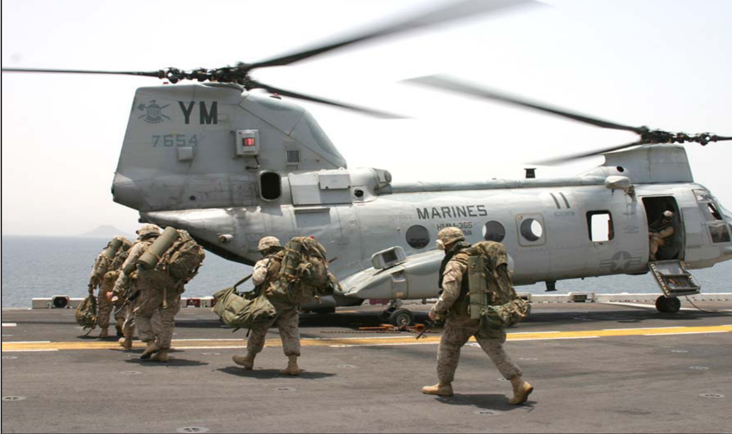
الطائرة المروحية بوينغ المخصصة لعمليات الكوماندو والإجلاء

وتعتبر روتا قاعدة عسكرية مشتركة بين إسبانيا