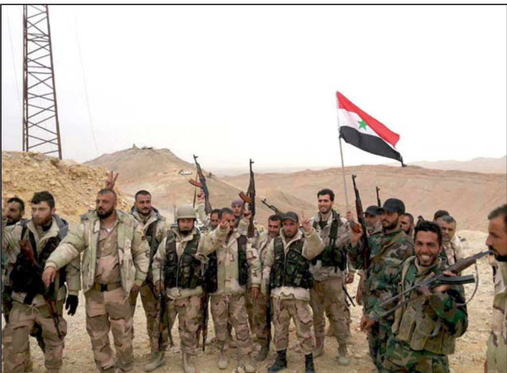
عناصر من الجيش السوري ترقع العلم على مدينة تدمر الأثرية

واعتبر أيضاً أن ذلك يظهر «عدم جدية التحالف الذي تقوده الولايات المتحدة ووضم أكثر من ستين دولة في محاولة الإرهابيين بالنظر إلى ضلالة ما حققه هذا التحالف منذ إنشائه قبل نحو عام