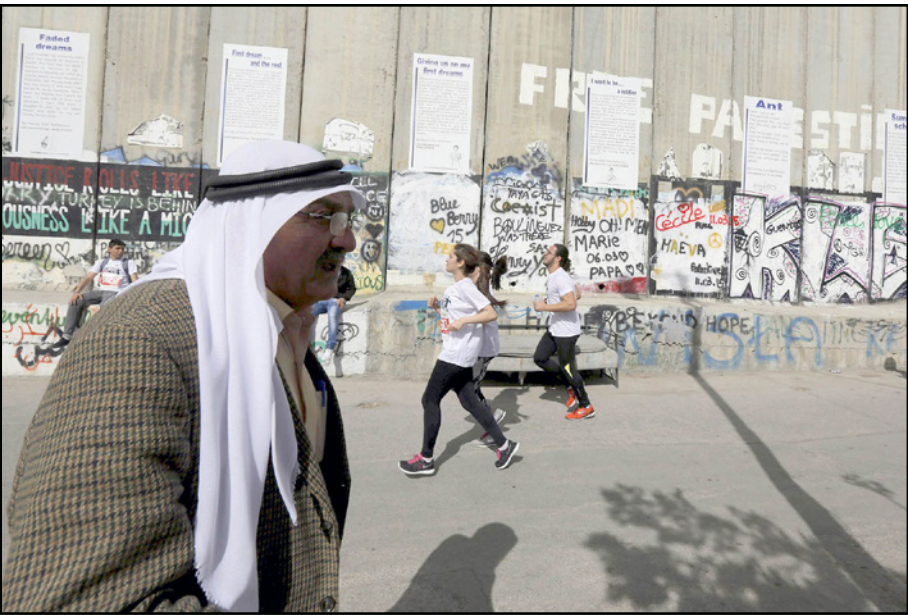
صورة أرشيفية للمراثون العام الفانت

وأكد زيدان أن المجموعات المختصة للركض تتدرب في مختلف المدن الفلسطينية من بيت لحم ورام الله والقدس وغزة والأراضي الفلسطينية المحتلة في عام 1948. وفي دول عدة في أوروبا وأمريكا قبيل موعد المراثون والبراة الفلسطينية كهدف أساسي لدعم حريتها خاصة في كل شيء وحرية حركتها من خلال ممارسة الرياضة والركض وهو ما سجل نجاحاً بالغ.