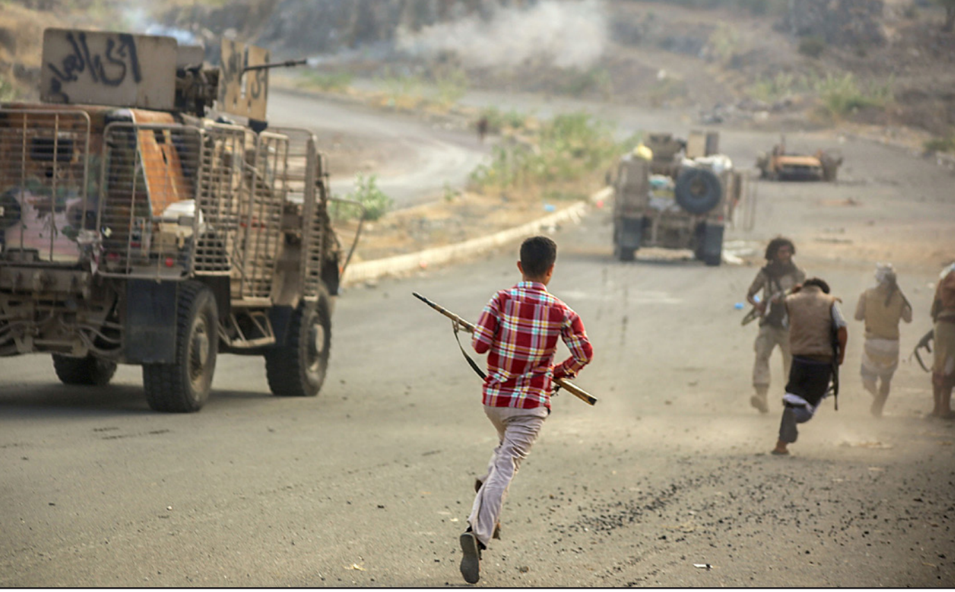
مقاتلون مؤيدون للرئيس اليمني عبدربه منصور هادي في تعز

ويعبر البيان عن «رفضه القرارات التي أصدرها قبل أيام نائب وزير التعليم العالي، عبد الله الشامي، المعين من قبل الحوثيين، بتعيينه قيادة جديدة للجامعة، وأوضح البيان أن أي محاولة لرفض هذه القرارات ستكون لها مآلات، نخجل من يقف خلفها المسؤولون الكاملة عن كل ما يترتب عليها». وكان نائب وزير التعليم العالي المكلف من قبل الحوثيين، قد أصدر قرارات بتعيين رئيس جديد للجامعة،