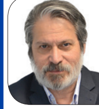
الإندبندنت: بين إدوارد سعيد وروبرت فيسك