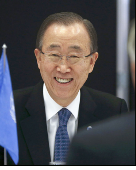
الأمين العام للأمم المتحدة بان كي مون