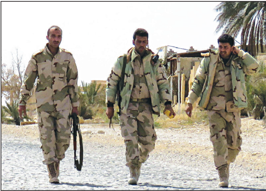
عناصر تابعة للنظام السوري في مدينة تدمر بعد السيطرة عليها أمس