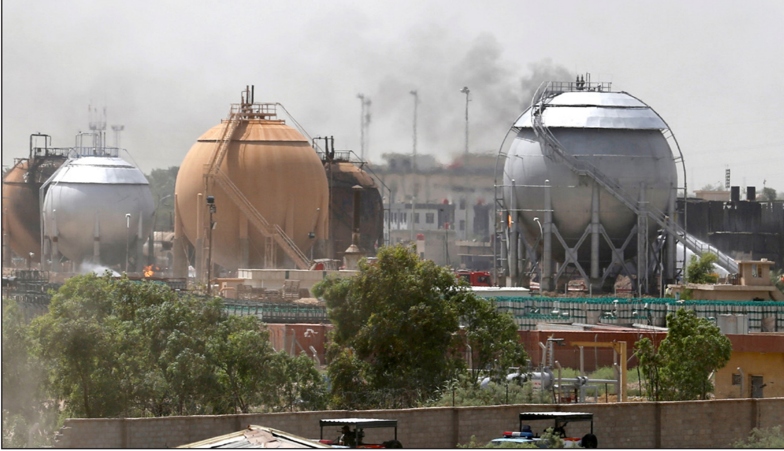
معمل الغاز الذي استهدفه تنظيم «الدولة» في منطقة التاجي شمال بغداد

وجاءت تلك المحاولة ضمن محاولات التنظيم لإحداث خروقات أمنية في المناطق المحيطة في العاصمة، والمسماة بـ«حزام بغداد» لتشتيت جهود القوات المسلحة وتخفيف الضغط عليه. وتعرض التنظيم الجهادي، الذي سيطر في منتصف عام 2014 على ثلث مساحة العراق، لهزائم متوالية في محافظات الأنبار وصلاح الدين وديالى وأجزاء من الموصل وكركوك.