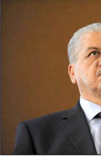
عبد الملك سلال

تصريحات سلال تأتي مناقضة لتضخيم الخبراء الذين يؤكدون أن الوضع خطير، وأن الأخطار هو أن الحكومة الحالية لا تمتلك أية إستراتيجية حقيقية من أجل الخروج من هذه الأزمة الاقتصادية، وأن كل ما قامت به الحكومة هو اتخاذ بعض الإجراءات الاقتصادية، وأن الحكومة تتحكم في الوضع، وذلك في رد شبه مباشر على الرئيس الفرنسي الأسبق نيكولا ساركوزي، الذي أكد أن الجزائر قبلت موقوتة قد تتفجر في أي لحظة. وأضاف أمس الأحد على هامش افتتاح معرض للسياسة أن السياسة الاقتصادية المتبعة من قبل الحكومة ستتمكن البلاد من الخروج من الأزمة الاقتصادية التي تعاني منها، موضحا أنه حتى وإن كانت الجزائر قد تآثرت بشكل كبير بتراجع أسعار النفط، مما تسبب في تراجع مداخيلها، لكن الحكومة متحمكة في الوضع، والقرارات والإجراءات التي تم اتخاذها من أجل مواجهة تقلبات أسعار النفط ستجنّب الجزائر التعرض لاهتزازات قوية. وتذكر أن الجزائر تسير في الطريق الصحيح من أجل إعادة بناء اقتصادها والخروج من التبعية النفطية، وهو ما اعتبرته وكالة الأنباء الحكومية أنه رد من قبل رئيس الوزراء الجزائري على بعض المسؤولين الأجانب الذين تنبأوا بانهايار الاقتصاد الجزائري، في إشارة إلى الرئيس الفرنسي السابق نيكولا ساركوزي الذي كان يتحدث عن الوضع في المنطقة العربية والمغربية، ولما وصل إلى الجزائر قال: «لا أريد التحدث عن الجزائر لأن لدى الأصدقاء في الجزائر حساسية، ولكن أكتب بشكل قاطع كل من يدعي أنه لا وجود لتساؤلات حول الوضع في الجزائر، وخافوا من انهيار الاقتصاد، بسبب تراجع أسعار المواد النفطية.»