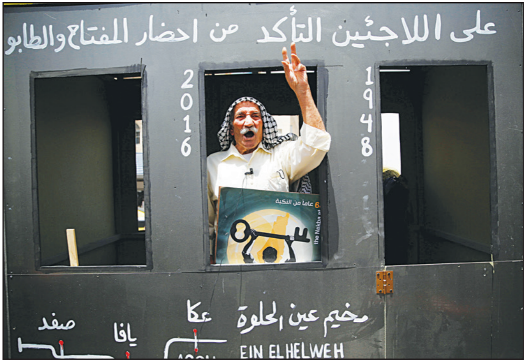
عجوز فلسطيني يلوح من «قطار العودة» خلال إحياء ذكرى النكبة في مدينة بيت لحم أمس

ميدان الجندي المجهول في غزة، ووصلت إلى مقر الأمم المتحدة، ورفع خلالها المشاكرون لافتات تطالب بإنهاء الاحتلال. وتحت على إحدى اللافتات «حق العودة حق مقدس لا يسقط بالتقادم». وتقول لافتة أخرى «الاحتلال إلى زوال». ورفع المشاكرون جرساً لـ«مفتاح كبير».