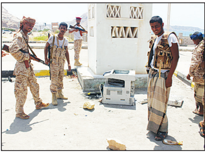
جنود يمنيون بعد اشتباهم بوجود متفجرات بعد هجوم انتحاري في المكلا أمس