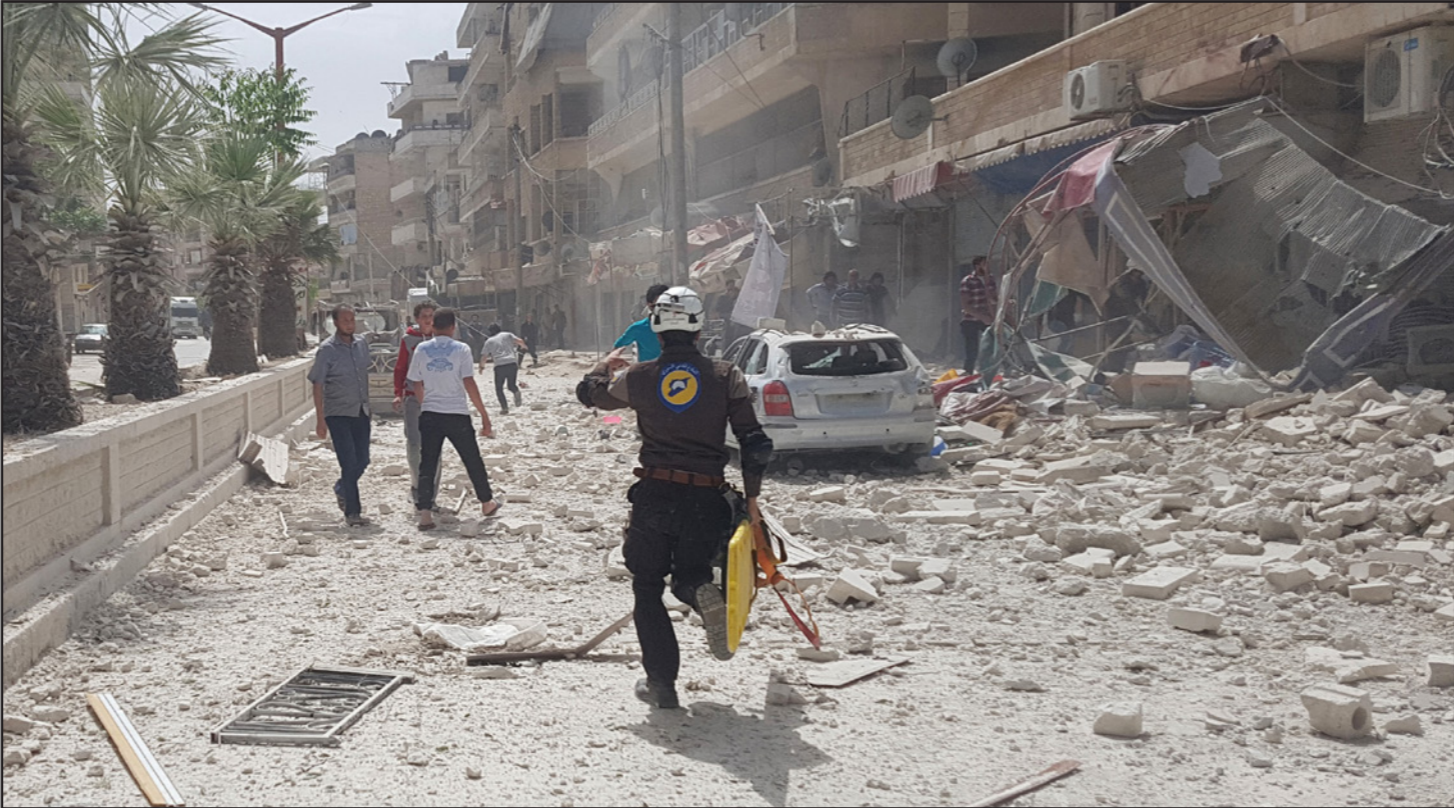
عنصر من الدفاع المدني يهرع إلى موقع قصفه النظام السوري على مدينة إدلب وريفها

البلاد، وأضاف المرصد أن تنظيم «الدولة» قتل 35 على الأقل من أفراد القوات المسلحة السورية واحتجز بعض أعضاء الطاقم الطبي في المستشفى. وقال المرصد إن القتال داخل المستشفى وبالقرب منه أدى كذلك إلى مقتل 24 على الأقل من مقاتلي الدولة الإسلامية. وذكرت وكالة «أعماق» المرتبطة بتنظيم «الدولة» إن مقاتلي التنظيم شنوا هجوما كبيرا على الطرف الجنوبي الغربي من دير الزور السبت واقتحموا مستشفى الأسد وقطعوا طريق الإمدادات بين قاعدة للجيش السوري والمطار. وسيطر التنظيم على معظم محافظة دير الزور ويفرض حصارا منذ آذار/مارس من العام الماضي على المناطق التي لا تزال تحت سيطرة الحكومة في المدينة التي تحمل الاسم ذاته والقريبة من الحدود الشرقية لسوريا مع العراق. وتربط محافظة دير الزور بين الرقة التي اتخذها التنظيم عاصمة له وبين المناطق الخاضعة لسيطرته في العراق الجاور. ونقلت وكالة الإعلام الروسية للأنباء السبت عن مصدر داخل المطار العسكري قوله إنه تم صد هجوم للتنظيم. وقال المرصد السوري ووكالة «أعماق» إن اشتباكات عنيفة تتواصل بين القوات الحكومية وتنظيم «الدولة» في المنطقة بعد الهجوم. وقال التنظيم إنه قتل 80 على الأقل من قوات الحكومة وأسرى ثلاثة ودمر عددا من العربات المدرعة. وتقوم الحكومة السورية وحليفها روسيا بإسقاط المساعدات على المدينة المحاصرة من حين لآخر كما تعرض الأهداف التابعة للتنظيم داخل دير الزور وحولها لغارات جوية متكررة.