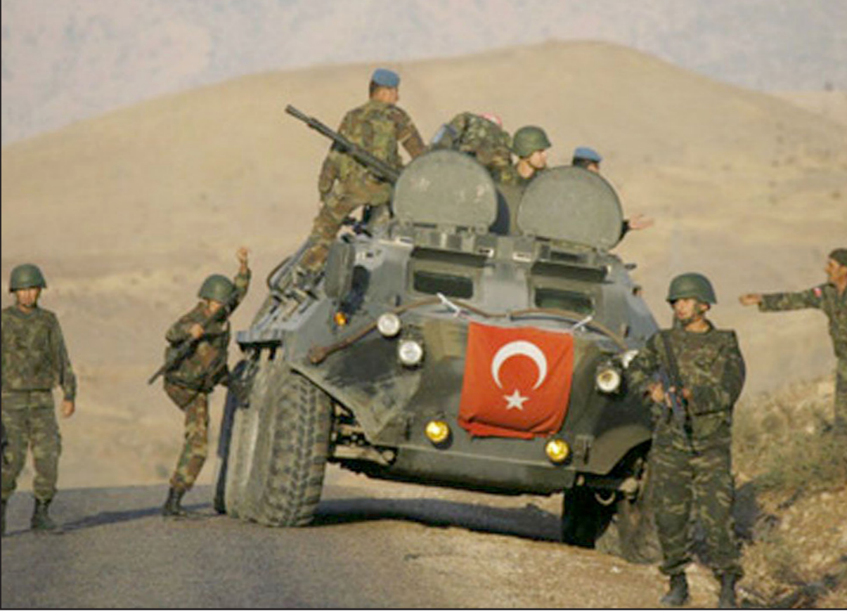
معارك مستمرة بين الجيش التركي والمتمردين الأكراد جنوب شرق البلاد

وبينما يشهد العالم قلقاً سياسياً وعسكرياً متزايداً في أعقاب إسقاط مروحية بصاروخ روسي متطور في جنوب شرق البلاد، فإنَّ أنقرة تتوهم أن «بي كا كا» تدعم المتمردين الأكراد في سوريا، وتخشى من أن تكون هذه المروحية من صنع روسيا، وهو ما ترفضه الحكومة التركية. وتؤكد أنقرة أن إسقاط المروحية ليس له أهداف سياسية، وإنما هو محاولة لاحتواء المتمردين الأكراد في جنوب شرق البلاد، وتحتفظ بالحق في الرد على أي تهديدات أمنية.