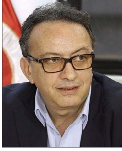
حافظ قائد السبسي

على صفحته في موقع «فيسبوك»: «استقالة رضا بلحاج من الهيئة التأسيسية لحزب النخلة (نداء تونس) كانت متوقعة في إطار تواصل عملية تعبئة الطريق لابن أبيه، حافظ قائد السبسي، للسيطرة على حزب أبيه و لتحقيق حلم والدته لخلافة والده في قصر قرطاج».