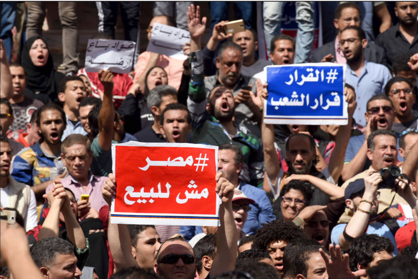
صورة أرشيفية لتظاهرة في مصر ضد تسليم الجزيرتين للسعودية