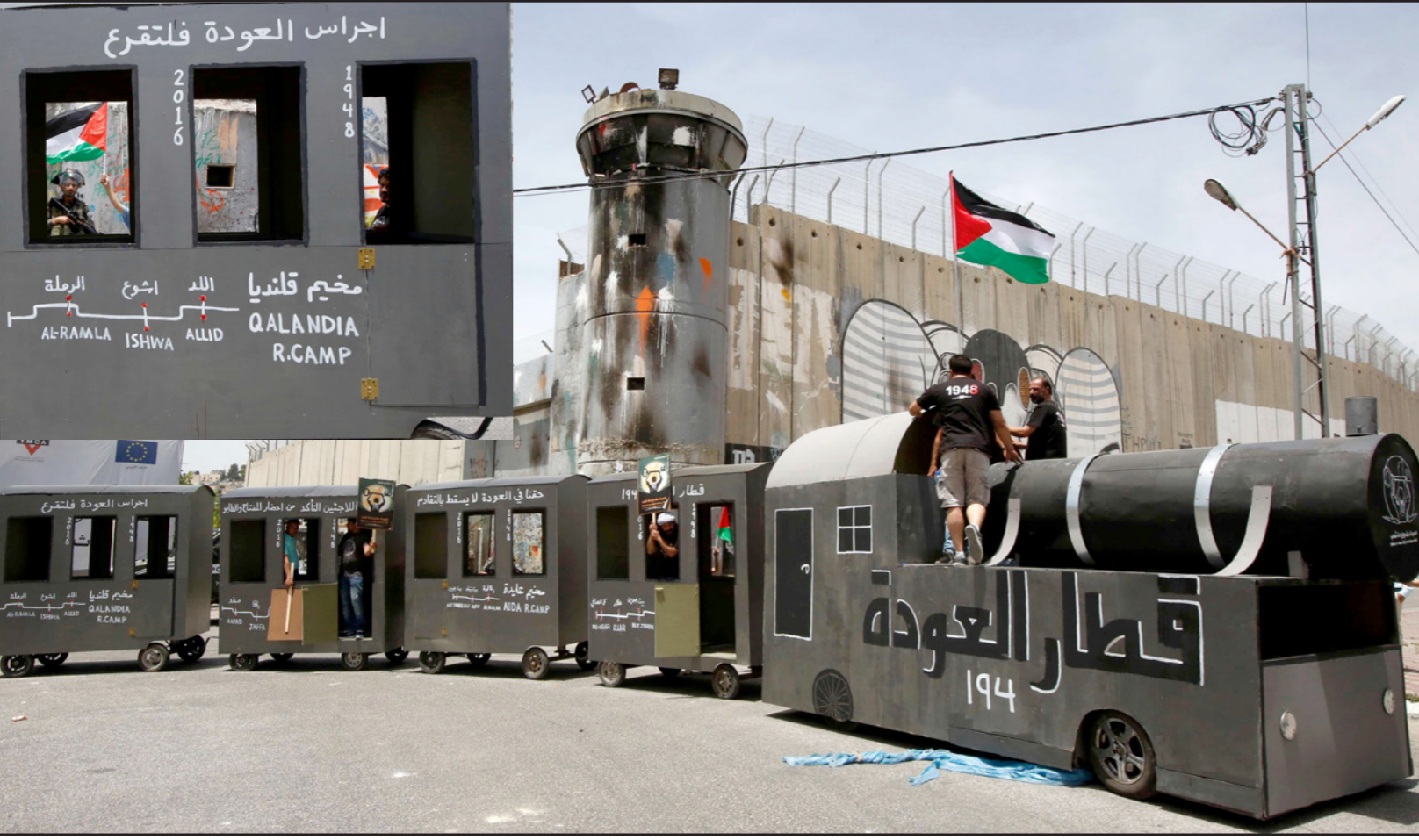
قطار العودة في بيت لحم أمس

ويعتبر الفلسطينيون أن نكبتهم لم تتوقف عند احتلال فلسطين وسرقة الأرض، فالتنكبات الداخلية في حياتهم اليومية كثيرة، منها ما هو متعلق بالاحتلال كالمرور على العابر الحدودية والحوار العسكرية بين المدن الفلسطينية أو بعض القوانين الجديدة التي وضعتها السلطة الفلسطينية وأثارت الشارع الفلسطيني وأخرها قانون مؤسسة الضمان الاجتماعي الذي جاء بعد أزمة المعلمين الفلسطينيين وقانون الأعلى للإعلام الذي أوقف إقراره لحين تعديله، وجاءت قضية الضمان الاجتماعي لتسلط الضوء على «هيئة التقاعد الفلسطينية الموجودة أصلاً وسبب إقرار قانون الضمان في ظل وجود مؤسسة أخرى شبيهة وهو ما زاد من إثارة الشارع على اعتبار أنها مؤامرة متقنة».