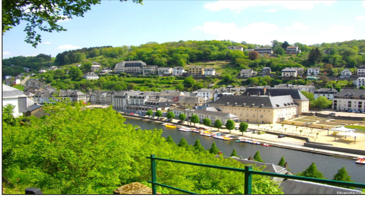
مدينة سياحية بلجيكية وقد خلّت من السواح