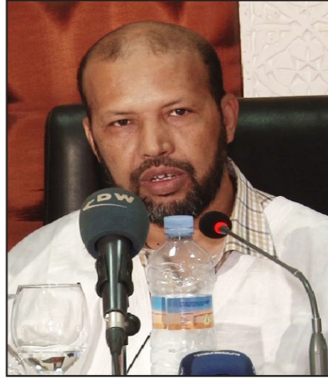
النائب محمد غلام

لحزب التجمع قبل أشهر، وهي اللائحة التي استبدل بموجبها رئيس الكتلة البرلمانية للحزب المختار ولد محمد موسى بالأمين العام للحزب حمدي ولد ابراهيم. واعتبر، «أن إعفاء محمد غلام ولد الحاج من منصبه جاء بعد أيام من انتقادات حادة وجهها إليه الرئيس الموريتاني محمد ولد عبد العزيز في خطابه الأخير ضمنياً دون أن يسميه». ويرفض الحزب، يضيف الموقع، أي تأثير للتوتر القائم مع السلطة على قراراته الداخلية، لكن إعفاء ولد الحاج الشيخ من ثاني منصب يمتلك الحزب في هرم السلطة القائمة وفي هذا التوقيت، يثير الكثير من الأسئلة حول مدى خضوع الحزب للضغوط الخارجية التي تمارسها الحكومة وبعض الأطراف القريبة منه، وذلك في خضم جدل متصاعد بشأن الحوار ومطالباته». ويحتج قرار إقالة النائب محمد غلام إلى تصويت الأغلبية داخل البرلمان من أجل تمريره، وهو ما سيرجي بسهولة بحكم خلاف الرجل مع قطاب الأغلبية داخل البرلمان وخارجه ولكن النائب يترجم التيار المتشدد في رفض سياسات الحكومة داخل البرلمان. ويثير النائب محمد غلام جدلاً كبيراً داخل الساحة الموريتانية وذلك بتصريحاته التارية المعارضة لنظام الرئيس محمد ولد عبد العزيز والتي يشبه فيها ولد العزيز بعبد الفتاح السيسى أكبر خصم للإخوان. واستجوب ولد الحاج الشيخ بندرة قاسية، ووزراء الداخلية والخارجية والشؤون الإسلامية والتجهيز والتجارة حول العديد من القضايا الحساسة المطارة داخل قطاعاتهم. وحسب موقع «زهرة شنقيط»، فإن «ولد الحاج