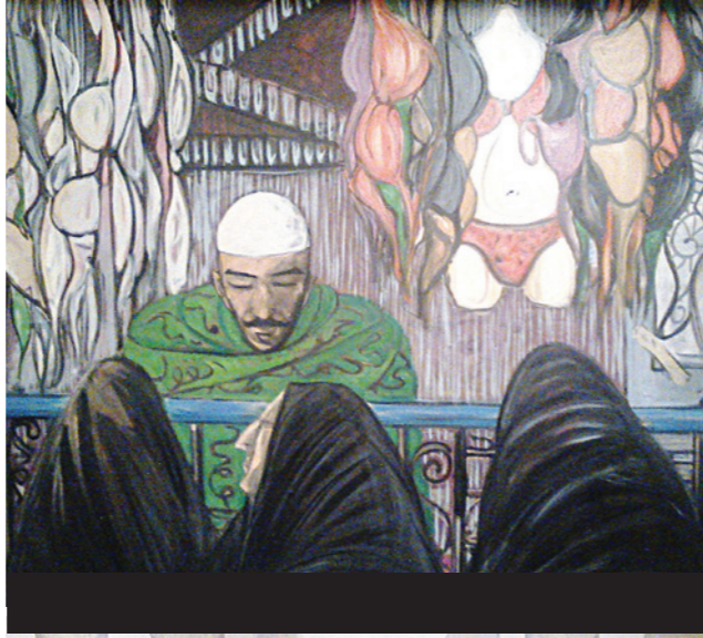
أعمال الفنان إياد عربي