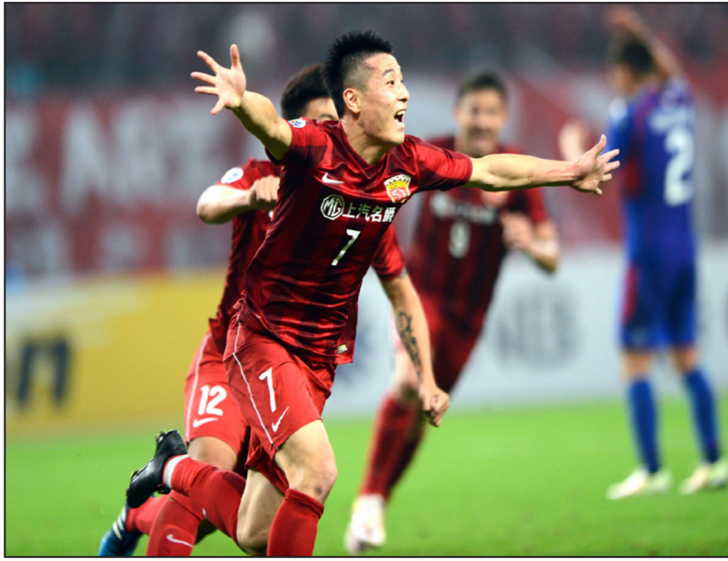
لي يحتفل بتسجيل هدف في الوقت القاتل ليؤهل شغبها الى الدور التالي