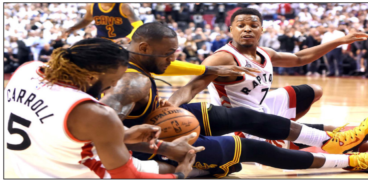
صراع أرضي على الكرة بين لاعبي رابتنورز وكافاليرز