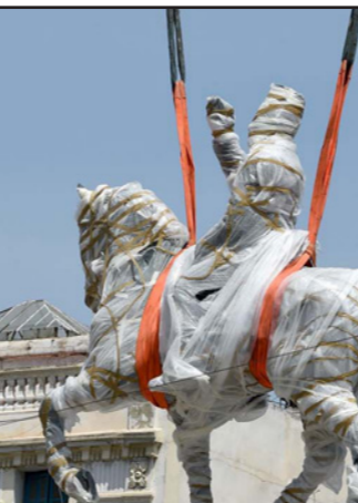
تمثال الرئيس التونسي الأسبق الحبيب بورقية

تونس - من يسرى ونأس : عاد تمثال الرئيس التونسي الأسبق، «الحبيب بورقية»، إلى ساحة 14 جانفي، وسط العاصمة تونس، بعد نحو 28 سنة من نقله إلى منطقة خلق الوادي، الضاحية الشمالية للعاصمة، وبعد 16 عاماً من وفاة بورقية، أول رئيس لتونس بعد الاستقلال.