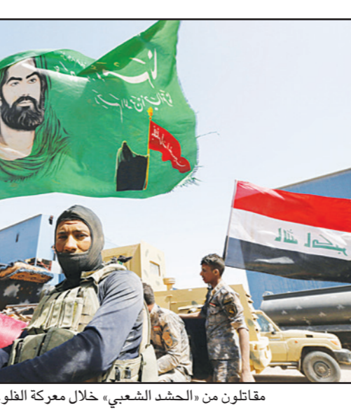
مقاتلون من «الحشد الشعبي» خلال معركة الفلوجة