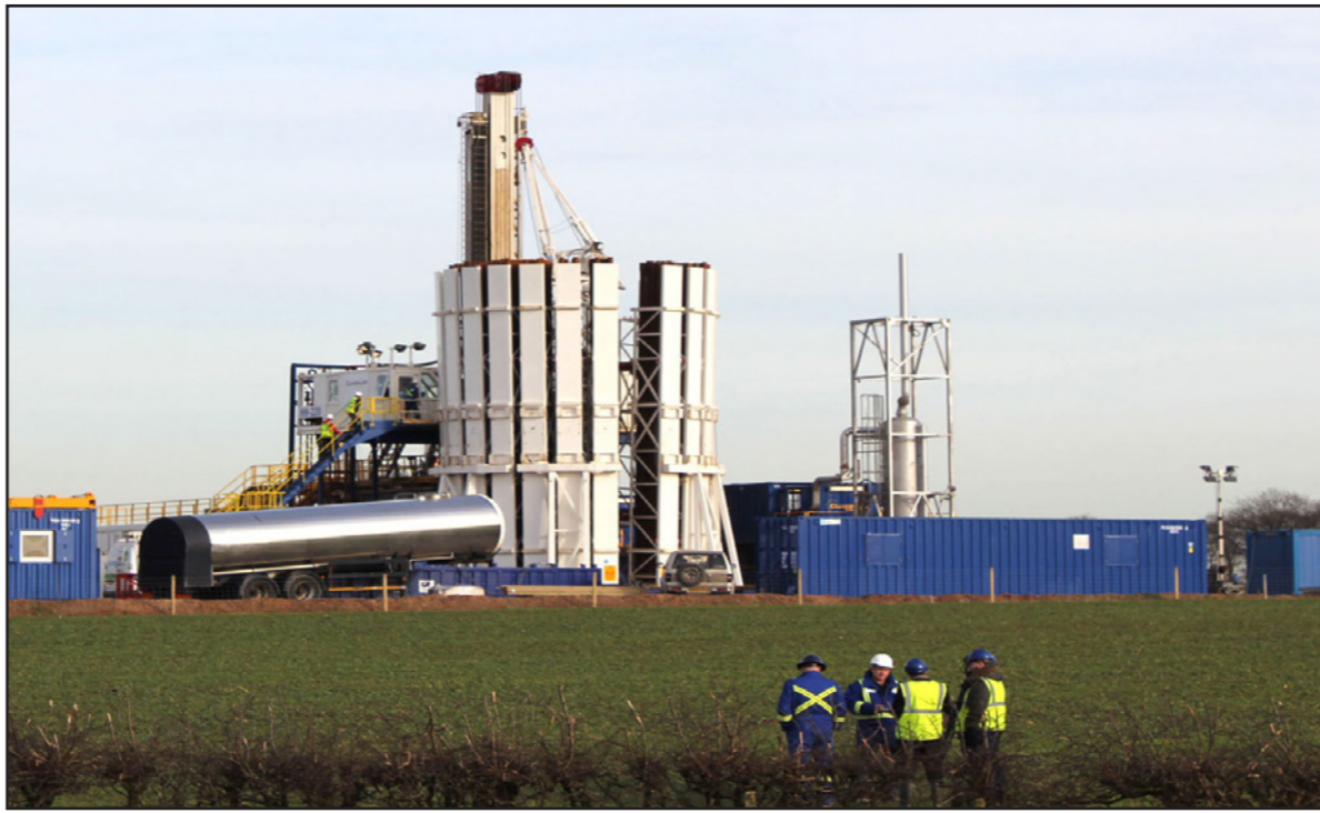
معدات للتكسير الهيدروليكي في الموقع الذي سمحت الحكومة فيه باستخراج الغاز بهذه الطريقة

لا أن قامت شركة «كوادريلا ريسورسز ليمتد» بالحفر على سبيل الخطأ في منطقة ما، مما دفع الحكومة إلى وقف استخدام هذه التقنية اعتباراً من تشرين ثاني/نوفمبر 2011 إلى كانون أول/ديسمبر 2012، في الوقت الذي كانت الحكومة تعيد فيه النظر في القانون