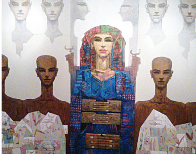
أعمال الفنان علاء أبو الحمد