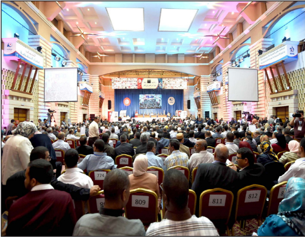
جانب من مؤتمر حركة النهضة التونسية

وحول إيداء النهضة، استعددها لقبول جميع التونسيين في صفوفها بغض النظر عن التزامهم الديني، قال العوني «هذا الأمر خاص بالنظام الداخلي لحركة النهضة فكل حزب له الحق في بعض القانون الداخلي لاختيار الأشخاص المناسبين، ونحن في جبهة الإصلاح نقول إن العمل السياسي يحتاج إلى أشخاص يعيدون عن الميوعة».