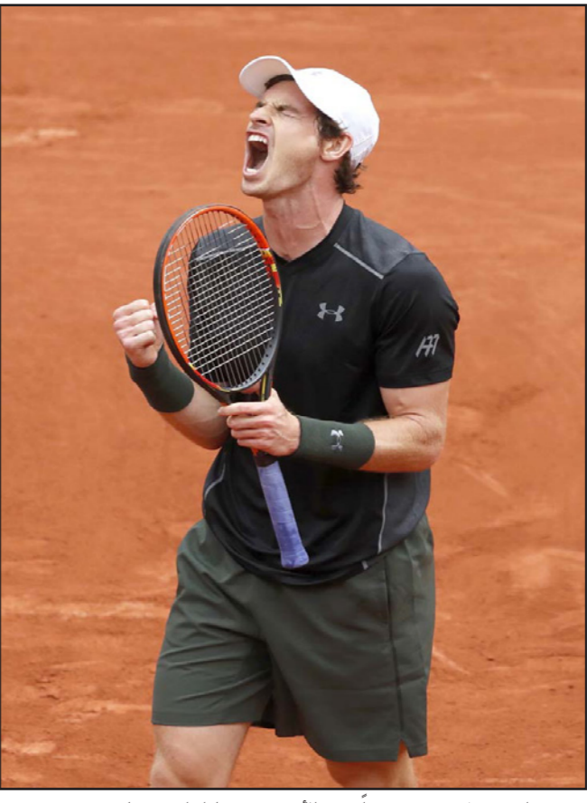
موراى يحتفل بتحقيقه فوزاً بشق الأفض في مباراة امتدت على مدى يومين