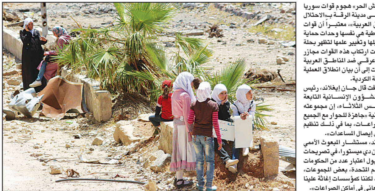
فتيات سوريات يحملن باصات في بلدة داريا التي تحاصرها قوات النظام السوري

لندن - «القدس العربي»: وسط اعتراف فلسطيني غير رسمي ورفض إسرائيل التعليق، تحدثت صحيفة «يديوت آخرونوت» الإسرائيلية عن ترتيبات تجري تحت السطح لعقد «قمة ثلاثية» حتى يظهر الدخان الأبيض في القاهرة تجمع بين الرئيس الفلسطيني محمود عباس ورئيس الوزراء الإسرائيلي بنيامين نتانياهو والرئيس المصري عبد الفتاح السيسي، في محاولة لإحياء المفاوضات بين إسرائيل والفلسطينيين. والقاهرة، يسود التقدير بأن إسرائيل ستجد صعوبة في رفض المبادرة المصرية خاصة وأن نتانياهو صرح مؤخرا بأنه مستعد للقاء أبو مازن وإجراء مفاوضات مباشرة معه في باريس، غير أن رئيس الوزراء الفلسطيني رامي الحمد الله أعلن الرفض الفلسطيني لاقتراح نتانياهو بعقد مفاوضات مباشرة.