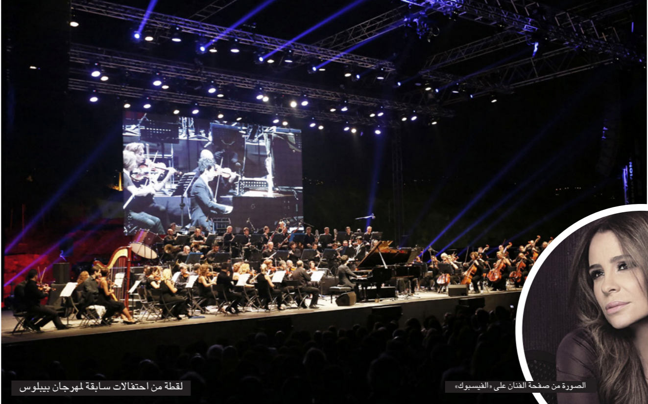
لقطة من احتفالات سابقة لمهرجان بيبيلوس

من عجائب زمن ثورة المعلومات في عالمنا العربي، بروز القاب وشخصيات تحت الضوء من العدم في الواقع إلى نجومية العالم الافتراضي.