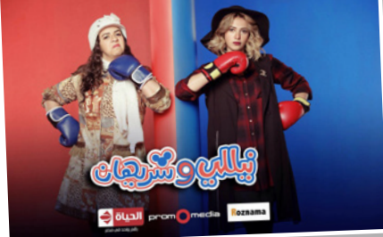
لقطة من مسلسل «نيلي وشريهان»