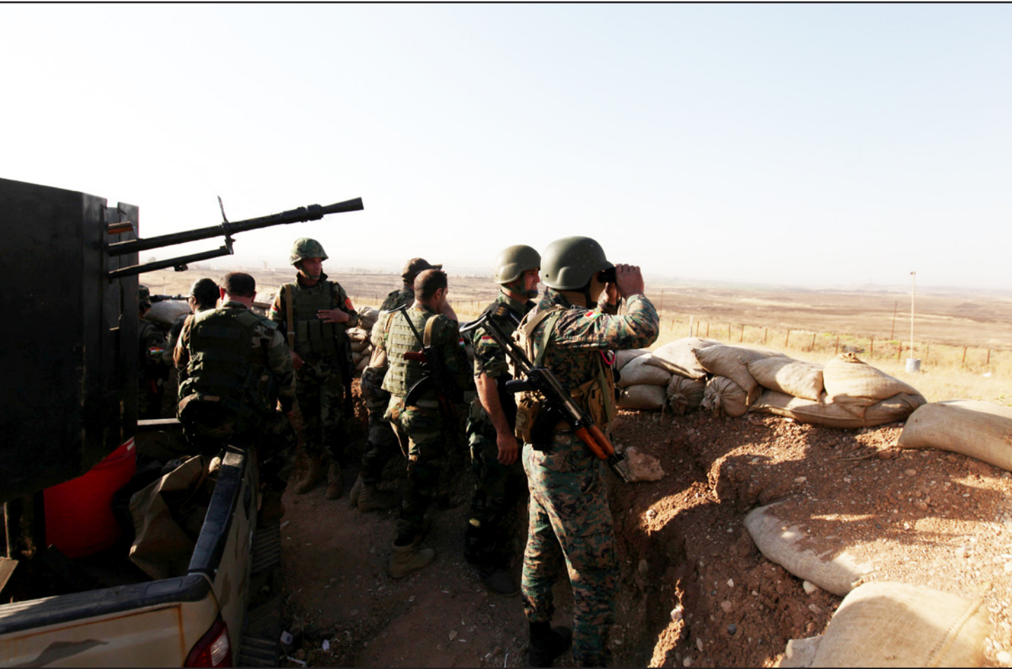
عناصر من قوات البيشمركة الكردية المشاركة في التحالف ضد «الدولة» لاستعادة المناطق من تحت سيطرتهم تقف خلف خطوط الجبهة (أ ف ب)

ويقول إغناطيوس إنه لاحظ في رحلته مع الجنرال