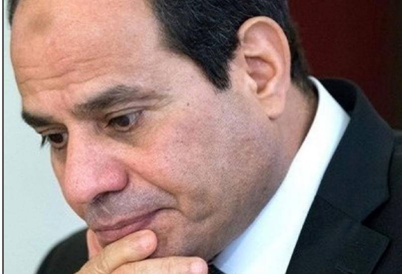
يشعر الرئيس المصري عبدالفتاح السيسي بالغضب من بنيامين تننياهو

بانه يهدد اسرائيل «عصا سياسي» حقيقي. هذه هي رواية بيبي لـ«القسوتامي السياسي» اياه لايهود باراك. ويعرف رئيس الوزراء ما الذي يخاف منه. او بامام سيكون حرا ويطلع على التالين تشرين الثاني وكانون الاول، الاوروبيون شرعوا بالمبادرات، والخطر حقيقي. وهو يستيق ذلك بخطة اقليمية لا تكفه حاليا إلا بالاقوال. ماذا سيفعل تقالي بيتين؟ هذا بالتأكيد سمعنا في اثناء الليل. أو في الصباح. فهل يمكن لاسحق هرتسوغ ان يقق جانبا؟ من معرفتي له، ليس مؤكدا. ماذا سيخرج في النهاية من كل هذا؟ كالمعتاد، ليس كثيرا.