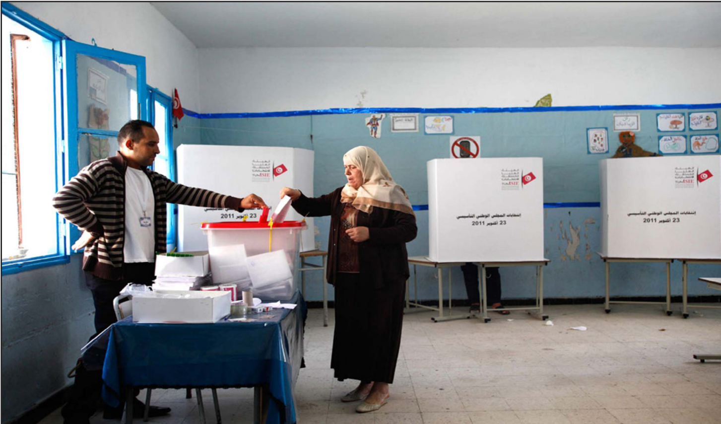
الانتخابات البلدية في تونس

ويتضمن الاقتراح الأول منح القائمة الحائزة على أكبر عدد من الأصوات الأغلبية المطلقة من المقاعد، فيما يتضمن الاقتراح الثاني إتاحة تمويل الحملات الانتخابية للأقائمة المترشحة من قبل الأشخاص «بحسب ثلاثين مرة الأجر الأدنى المضمون في القطاعات غير الفلاحية للفرد الواحد، بالنسب للانتخابات البلدية والجهوية». وكان الناطق باسم حزب «آفاق تونس» وليد صفر اعتبر قبل أيام أن الانتخابات البلدية «مصرية»