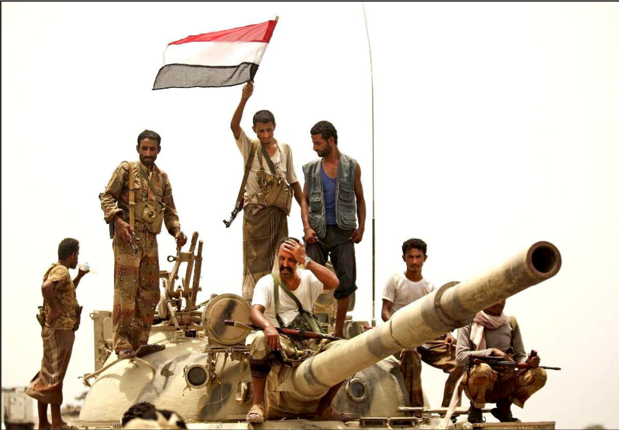
قوات موالية للرئيس عبد ربه منصور هادي خلال مواجهات مع الانقلابيين الحوثيين

قوائم الأسرى والمعتقلين التي تم تبادلها مساء الأحد الماضي، تمهيدا للإفراج عنهم، قبيل حلول شهر رمضان، ولقلا للاتفاقات البدئية، حسبما ذكر المصدر ذاته. والخمس الماضي، دخلت المشاورات اليمنية، أسبوعها السادس، دون إحراز أي اختراق حقيقي لجدار الأزمة، فيما لجأ المبعوث الأممي إلى عقد جلسات غير مباشرة بين الوافدين، منذ الثلاثاء الماضي، من أجل ردم الهوة وتقريب وجهات النظر.