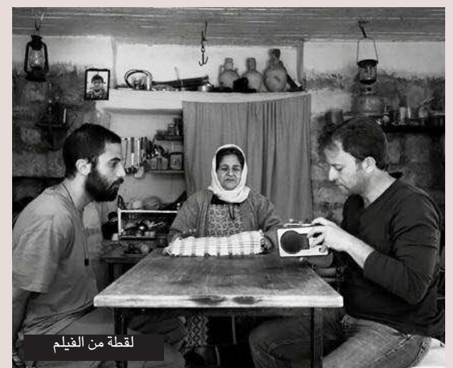
لحظة من الفيلم