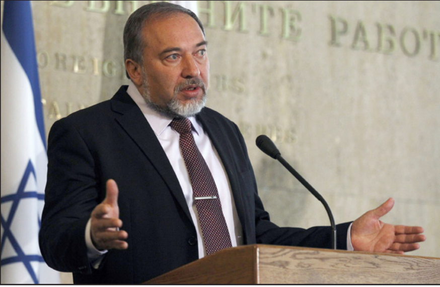
كيف سیتصرف أفیدغور لیبرمان مع احتمال تصاعد العمليات في رمضان

ومع أن الدول أعلنت الحرب الواحدة على الأخرى، إلا أن الجيوش بقيت بلا حراك وانتظرت التطورات، ودعا تشرتشل هذه الفترة باسم «الحرب الصامتة»، وهو عنوان مناسب أكثر لما يجري عندها، إذ أنه يعبر عن الفترة التي بين انفجار وأخر.