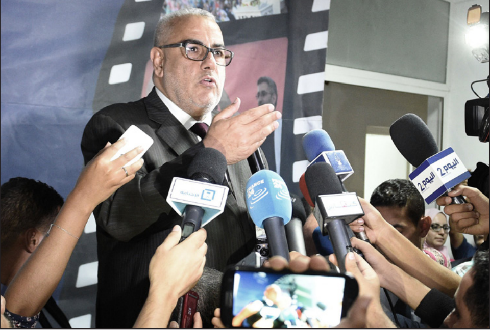
رئيس الحكومة المغربية عبد الإله بن كيران

أن المغرب أصبح «منبع الإهمام» و «أمل» لكثير من دول العالم. وجدد التأكيد على إرادة المغرب في الحفاظ على «علاقات متميزة» مع جميع الدول الأوروبية، مشددا على أن بلاده حرة في اختياراتها الإستراتيجية من أجل الدفاع عن مصالحها العليا وقيمها المتجنزة.