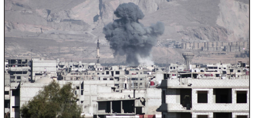
صورة أرشيفية لدخان متصاعد بسبب غارات النظام على الغوطة