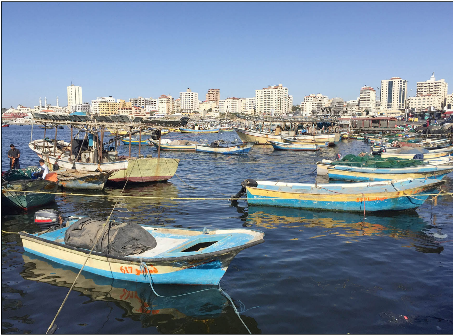
قوارب الصيد في بحر غزة أول من أمس