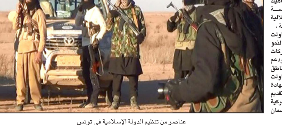
عناصر من تنظيم الدولة الإسلامية في تونس

الماضي والهجمات الأخرى على بن قردان هي تذكير بالخطر الحقيقي الذي يشكله هواء على تونس. ووفقاً لشهادة جون ديسروجر، نائب مساعد وزير الخارجية لشؤون الشرق الأدنى أمام لجنة الشؤون الخارجية في مجلس النواب الأمريكي فإنه لا يمكن مناقشة التحديات في تونس بدون التطرق إلى المشكلة الليبية إذ قال بيان عدم الاستقرار في ليبيا يشكل تهديداً للأمن القومي في تونس حيث تلقى عدد كبير من مهاجمي بارنو وسوسة تدريبات في معسكرات إرهابية ليبية كما يعيش حالياً أكثر من مليون مواطن ليبي في تونس بعد أن فروا من حالة عدم الاستقرار في بلادهم مما أزمق «القدر على خدمة مواطنيها واحتياجات مجتمعها» لذا تظهر الحاجة ماسة لدفع باتجاه حكومة وفاق وطني قابلة للحياة في ليبيا قادرة على إحلال السلام والأمن ومواجهة تهديد تنظيم «الدولة الإسلامية».