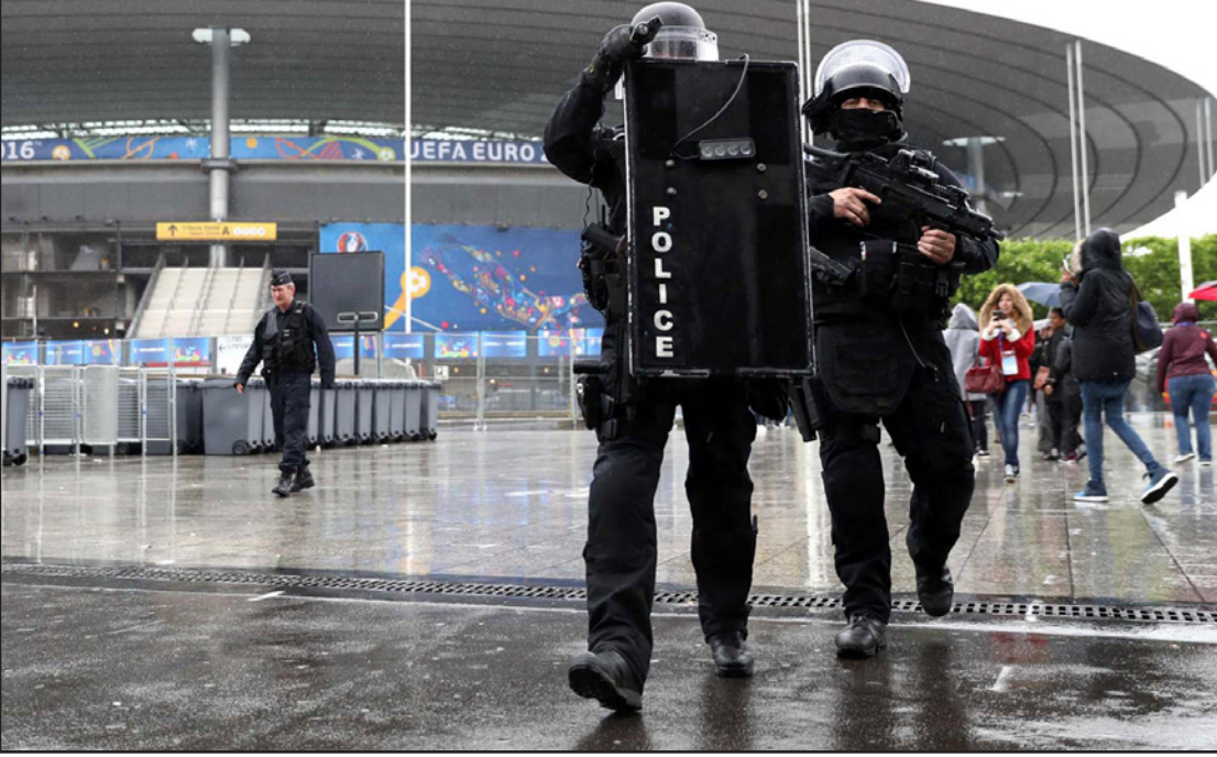
رجال أمن من القوات الفرنسية الخاصة أمام استاد «دو فرانس» الذي يستقبل المباراة الافتتاحية

الفرنسي بيار غازان، قائد نقابة الكونفدرالية العامة للعمل (سي جي تي) بالتصرف مثل «قطاع طرق أو اراهبيين»، وقال المسؤول في الحزب الاشتراكي جان كريستوف كامباديليس: «لن يكون هناك اضراب للقطارات وشبكة المترو» خلال «يورو 2016»، وأضاف معلقا على سلوك المسؤولين في النقابة التي تقف وراء الاحتجاجات: «لا يمكنني أن أصدق ولو للحظة أنهم يرهنون مصير البلاد»، ووضع المسؤول عن نقابة «سي جي تي» فيليب مارتينز الكرة في ملعب الحكومة قائلا: «لن نمنع الناس من التوجه لمشاهدة المباريات لكن على الحكومة أن تظهر رغبة في التحاور. مفتاح الحل لديها»، وبعد مراجعة النص الأصلي للحصول على دعم النقابات الإصلاحية رفضت الحكومة تقديم مزيد من التنازلات، ولجأت إلى بند في الدستور يمكن استخدامه استثنائيا لتعريض اصلاحها في البرلمان من دون تصويت النواب، وقال رئيس الوزراء مانويل فالس إن الإصلاح «نص عليه» مؤكدا مؤكدا ورئيس الفرنسي فرنسوا هولاند تصميمهما على المضي «حتى النهاية» رغم معارضة قسم من نواب اليسار، وترى الحكومة على العكس أنه سيسمح بان تتماشى قواعد العمل أكثر مع واقع كل شركة وبالمناسبة للبطالة المتصاعدة التي بلغت 10%، لكن منتقدي الإصلاح يعتبرون أنه على العكس سيؤدي من هشاشة الأوضاع الموظفين.