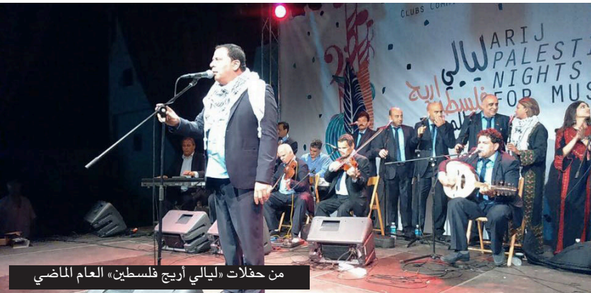
من حفلات «ليالي أريج فلسطين» العام الماضي