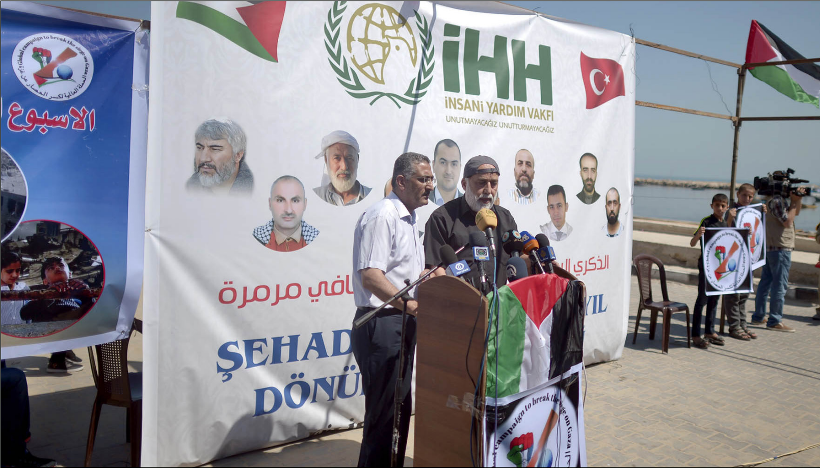
وقفة في غزة لإحياء ذكرى سفينة «مافي مرمر» التركية أمس