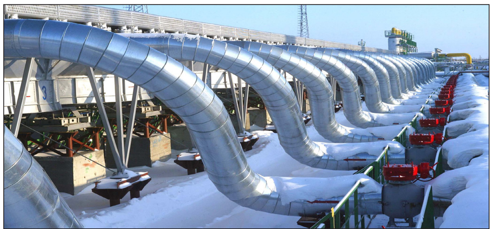
جانب من محطة تحكم بتدفق الغاز تابعة لـ «غازبروم»

موسكو - رويترز: قال ألكسندر ميدفيديف، نائب الرئيس التنفيذي لشركة «غازبروم» الروسية العملاقة للغاز، أمس الثلاثاء ان الشركة لا ترى حاجة لشن حرب أسعار في قطاع الغاز الطبيعي في أوروبا لإبعاد منافسين، بما في ذلك واردات غاز طبيعي مسال متوقعة من الولايات المتحدة. وتؤكد «غازبروم» ثقتها في الغاز الذي يستهلكه الاتحاد الأوروبي، ولكن العلاقات ساءت