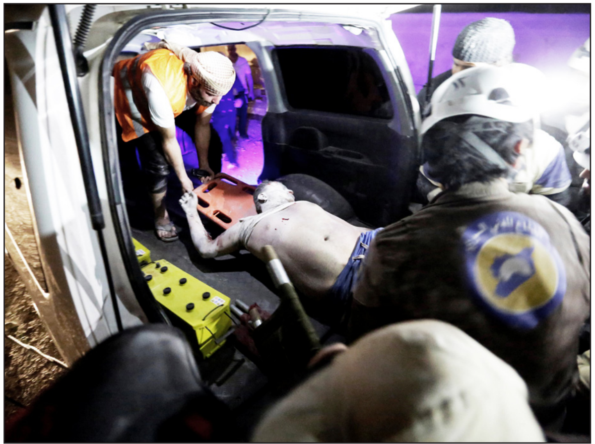
عنصر من الدفاع المدني يتفقد رجلا مصابا بعد الصربات الجوية الروسية على مدينة إدلب أمس الأول

■ عاصم وكالات: قال قادة عسكريون في المعارضة السورية، إن التحالف الدولي ترك فصائل المعارضة وحيدة في مواجهة تنظيم «الدولة» داعش، مشيرين إلى وجود «مؤامرة» دولية لإنهاء المعارضة في ريف حلب الشمالي، وتسليم مواقعها لمنظمة «ب ي د» الإرهابية، بهدف إظهارها كقوة شرعية وحيدة تحارب «الدولة». وأهم رقيب زعموط قائد «جيش الشمال»، أمس الثلاثاء، أمريكا وروسيا ودول الغرب بـ «التآمر» على المعارضة السورية في ريف حلب الشمالي، والعمل على تصفيته، حتى يتفرد حزب الإتحاد الديمقراطي «ب ي د» بالمنطقة، ويظهر كما لو أنه الجهة الوحيدة القادرة والمؤهلة لحاربة التنظيم. وأوضح أن «التحالف لم يكن جدياً في دعم قوات المعارضة السورية، وهو يعمل منذ 6 أشهر على تضليل تلك القوات وإفشال معاركها ضد داعش»، لافتاً إلى أن التحالف لا يلتزم بالوعود المتكررة التي قطعها لدعم المعارضة في إطار مكافحة التنظيم، وأشار زعموط أن التنظيم شن هجمة شرسة على المنطقة خلال الأيام القليلة الماضية، وسيطر على قرنتي «عفر كلين» و«كلجبرين» جنوب شرق أعزاز (تحت سيطرة المعارضة)، لقطع بذلك طريق الإمداد الوحيد لمقاتلي المعارضة في مدينة مارع، ويحاصر المدينة من 3 جهات، فيما يتمركز لسيطرتها رداً على الجبهة الغربية من المدينة. وذكر أن الوضع العسكري في ريف حلب الشمالي «سببي للغاية»، وأن الجهد العسكري لفصائل المعارضة يركز على استعادة قرنتي عفر كلين وكلجبرين وفك الحصار عن مدينة مارع. من جانبه، قال سيف الدين بولاد، قائد «فرقة المصرة للقطاعات خاصة» (معارضة)، إن التحالف خفف من طعانه الساندة لفصائل «الجيش الحر» بشكل كبير في الأونة الأخيرة، متمسكاً بالتحالف بالسعي لإتاحة الفرصة لـ «ب ي د» للتقدم نحو