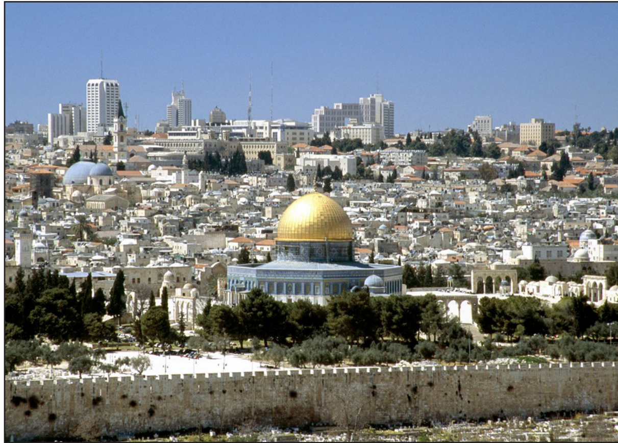
منظر عام لمدينة القدس

وقيل أيضاً إنه تتم في الوقت الحالي «دراسة امتكانية زيادة ساعات العمل للمركزيين من 8 ساعات إلى نصف وظيفة، كما هي الحال في غربي المدينة».