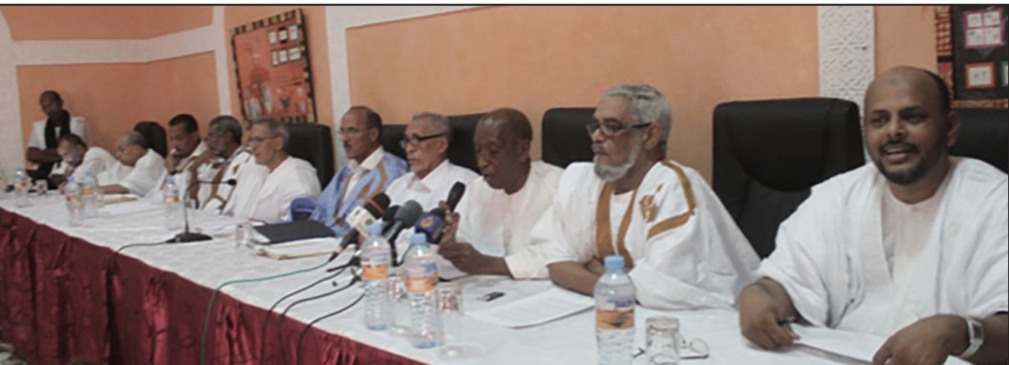
المعارضة الموريتانية أثناء اجتماع سابق لها

انتخابيتين رئاسيتين عام 2009 وعام 2014 على التوالي، وكذا في الانتخابات البلدية والتشريعية لعام 2013، وأضاف الحزب «وفي خضم جميع تلك الاستحقاقات الانتخابية التي جرت كلها على مسمع ومرأى من كل أشقاء وأصدقاء وشركاء موريتانيا على المستويات العربية والإسلامية والقارية والإقليمية والدولية، كانت إرادة الانتفاخ والدعوة إلى الحوار بين شركاء الهم الوطني الموريتاني دون استثناء عنوانا بارزا وخيار لا يتزحزح لدى رئيس الجمهورية السيد محمد ولد عبد العزيز ولدينا في حزب الاتحاد من أجل الجمهورية وفي كل مكونات وأحزاب الأغلبية السياسية، رغم نزوع المعارضة المقاطعة للمسار الديمقراطي والرافضة للحوار وللتعاطي الديمقراطي البناء تارة إلى لغة العنف اللغوي والمادي ومصادرة الأغلبية الموريتانيين، وتارة أخرى إلى اللجوء إلى الأساليب الاستصدار الفاشل لثورات وحروب أهلية عانت من ويلاتها شعوب دول شقيقة واكتوت بغيرها المنظمة الدولية جمعا، إرهابا وتدميرا وزرعا للفتن والحروب العنيفة، كما ظلت هذه المعارضة المعزولة داخليا وخارجيا متمادية دون حياة في فيها وضلالها، ضاربة عرض الحائط بالدروس والتجارب التي خاضتها في مختلف مراحل تفككها وتحللها الفردي والجماعي». «وما دامت التقديرات السيئة تؤدي حتما إلى النتائج السلبية، يضيف حزب الاتحاد، كان لزاما على صف روافض الحوار الديمقراطي، أشهرها قلبية بعد تشكيل منداده الهجين، أن يتجرع بمرارة كأس هزيمة جديدة للمراهنة غير المحسوبة على تأليب الرأي العام الوطني والدولي ضد مسار ديمقراطي ناجح وشفاف، عيبه