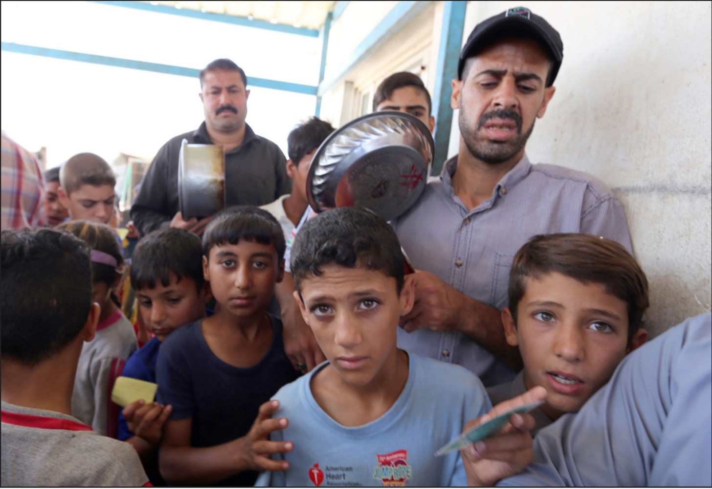
فاران في معسكر إغاثة في انتظار بعض الطعام أمس

واكد ان «القوات العراقية تصدت للهجوم وقتلت 75 مسلحا، وواصلت تقدمها باتجاه مركز المدينة»، من دون ان يدلي بمعلومات عن عدد الضحايا في صفوف القوات العراقية.