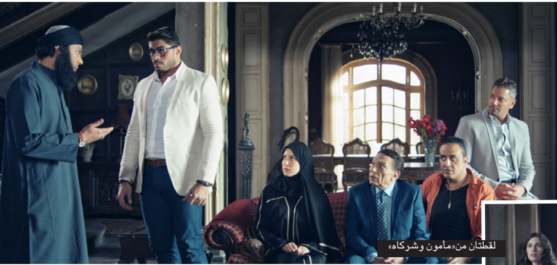
لقطة من «مأمون وشركاه»