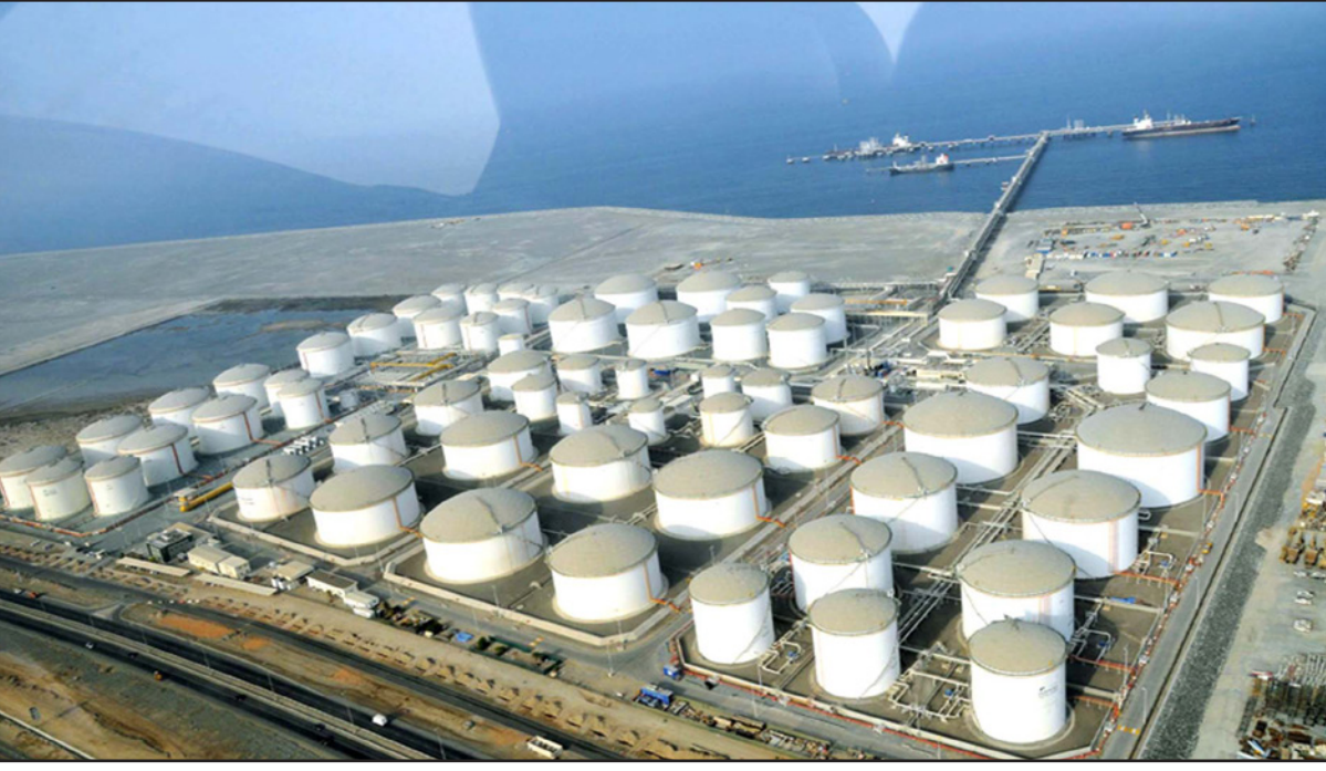
خزانات نفط عملاقة في الشارقة

يتراحون بين 600 ألف و800 ألف برميل يوميا، فإن السوق عموما ستظل متخمة بالمعرض مع توقع استمرار ضعف نمو الطلب.» ويتوقع معظم المحللين أن يتباطأ العرض المرشح أن تزيد إيران الإنتاج بما لا يقل عن 500 ألف إلى مليون برميل يوميا في الأمد القريب، ورغم انخفاض الإنتاج الصخري الأمريكي بما