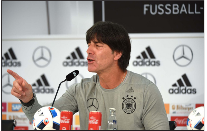
لوف مدرب ألمانيا يشرح أسباب استبعاد رويس والآخرين أمس

قائمة المستبعدين أيضا، لاعبي باير ليفركوزن، كريم بلعربي وجوليان براندرت وكذلك سيسبستيان رودي لاعب هوفنهايم، وتضم القائمة النهائية القائد باسيتان شفاينشتايفر والمدافع ماتس هوميلز رغم أنهم في مرحلة استعادة اللياقة، لكن لوف قال إن بإمكانهما اللعب، وقال لوف عن استبعاد رويس: «ماركو يواجه مشاكل صحية كبيرة، فالآن لا يمكنه الركض سوى في خط مستقيم. قرار استبعاده مؤلم لنا وله، كان سيشكل إضافة بالتأكد»، وضمت القائمة النهائية اللاعبين الشبان جوشوا كيميشت وجوليان فيغل وليروي ساني، وضمت القائمة في حراسة المرمى: بيرند ليتو (ليفركوزن) وماثيو نويزر (بايرن ميونخ) ومارك أندري تير شتيغن (برشلونة)، الدفاع: جيروم بوتاتينغ (بايرن ميونخ) وإيمري جان (ليفربول) ويوناس هينكتور (كولون) وبينديكت هوفيدس (شالكة) وماتس هوميلز (بايرن ميونخ) وشكودران مصطفى (بلنسية) وأنطونيو رود غير (روما)، وفي الوسط: جوليان دراكسلر (فولفسبورغ) وسامي خضيرة (يوفنتوس) وجوشوا كيميشت (بايرن ميونخ) وتوني كروس (ريال مدريد) وتوماس مولر (بايرن ميونخ) ومسعود أوزيل (أرسنال) ولوكاس بودولسكي (غالطه سراي) وأندريه شورله (فولفسبورغ) وباسيتان شفاينشتايفر (مانشستر يونايتد) وجوليان فيغل (بوروسيا دورتموند)، وفي الهجوم: ماريو غوميز (يشكتا) ومايو غوتزه (بايرن ميونخ) وليروي ساني (شالكة).