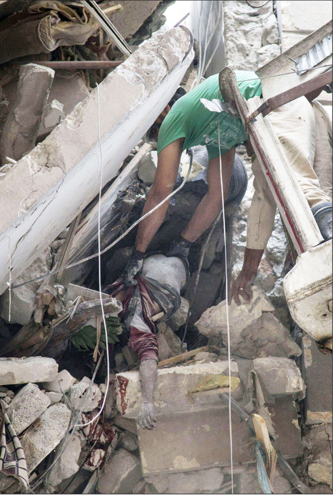
عنصر من الدفاع المدني السوري ينتشل جثة من مبنى قصفه النظام في حلب أمس

للرئيس السوري بشار الأسد. ومن جانبها، تقوم موسكو بشن غارات جوية خاصة بها لدعم القوات الموالية للحكومة. وقال مستولنتيرج إن «الهجمات المروعة في حلب هزتها جميعا»، مضيفا أن العنف، بما في ذلك هجوم على قافلة إغاثة الأسبوع الماضي بالقرب من المدينة السورية، وكان «غير مقبول تماما من الناحية الأخلاقية... كما يعتبر انتهاكا صارخا للقانون الدولي».