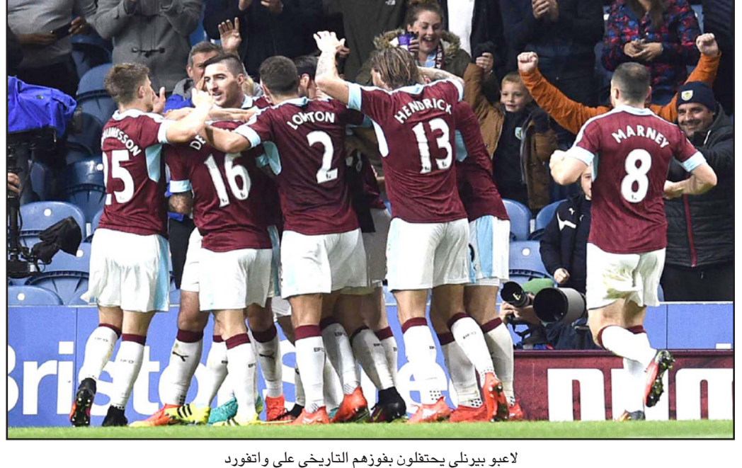
لاعبو بيرنلي يحتفلون بفوزهم التاريخي على انغفورد

اللاعبين يخضون عند اتخاذ قرار باستبدالهم، والأن يجب أن يصب تركيزنا على مباراة «العدو» وأضاف: «أخذت القرار الصحيح الذي يصب في مصلحة اللاعب، علينا أن نتعامل مع ذلك، وأنا لست سخيًا وهو ذلك وكاننا لدينا الأهداف ذاتها».. وحول مواجهة ريال مدريد أمام مضيعة الألماني بوروسيا دورتموند، في الجولة الثانية