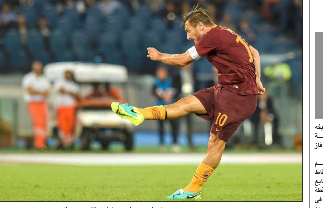
أسطورة روما توتي شارف الأربعين من العمر

اللاعبين يخضون عند اتخاذ قرار باستبدالهم، والأن يجب أن يصب تركيزنا على مباراة «العدو» وأضاف: «أخذت القرار الصحيح الذي يصب في مصلحة اللاعب، علينا أن نتعامل مع ذلك، وأنا لست سخيًا وهو ذلك وكاننا لدينا الأهداف ذاتها».. وحول مواجهة ريال مدريد أمام مضيعة الألماني بوروسيا دورتموند، في الجولة الثانية