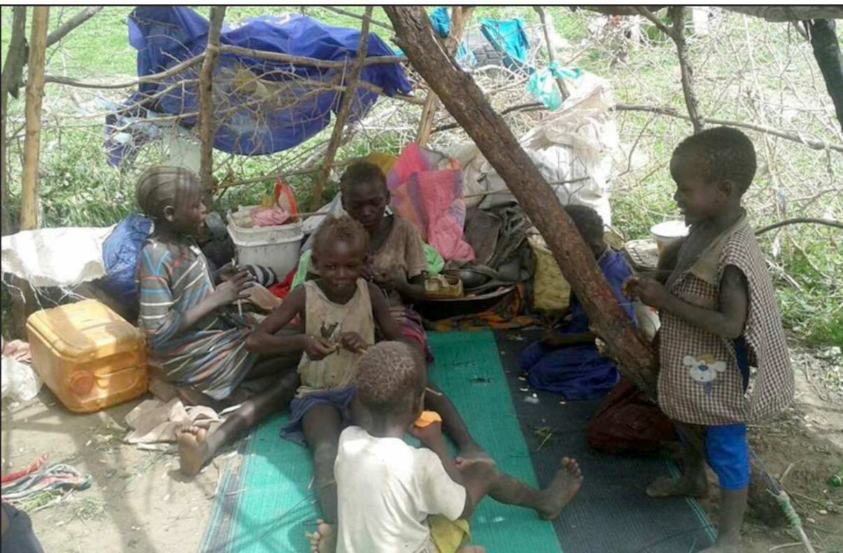
أطفال من جنوب السودان في معسكر في دارفور

أراضيها سيتم التعامل معهم بوصفهم أجناب لدى تلقيهم لخدمات الصحة والتعليم، وبذلك ينتهي مفعول قرار البشير الذي أصدره في العام الماضي باعتبار أبناء الجنوب مواطنين سودانيين. وأعلنت دولتا السودان وجنوب السودان في الثاني والعشرين من آب/أغسطس الماضي، فتح المعابر والنقاط الأمنية بينهما في فترة لا تتعدى ثلاثة أسابيع، وذلك حسب الاتفاق السابق المبرم بين البلدين، وتعددت حكومة الجنوب بطرد الحركات السودانية المسلحة من أراضيها، لكن ذلك لم يحدث حتى الآن الأمر الذي جعل الحكومة السودانية تهدد بإغلاق الحدود ووقف إيصال المساعدات الغذائية عبر أراضيها.