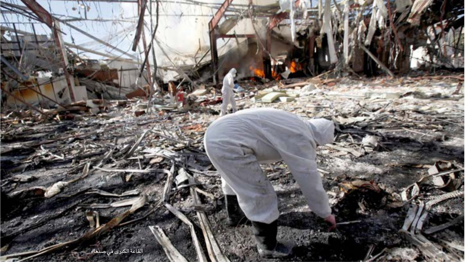
القاعدة الكبرى في صنعاء

وقالوا له«القدس العربي» «على الرغم من حجم الجريمة الشنيعة التي ارتكبت في القاعدة الكبرى غير أن الاعتراف الصريح بارتكابها كان مؤشرا جيدا، ينصف ذوي الضحايا، ويحاسب من يقف