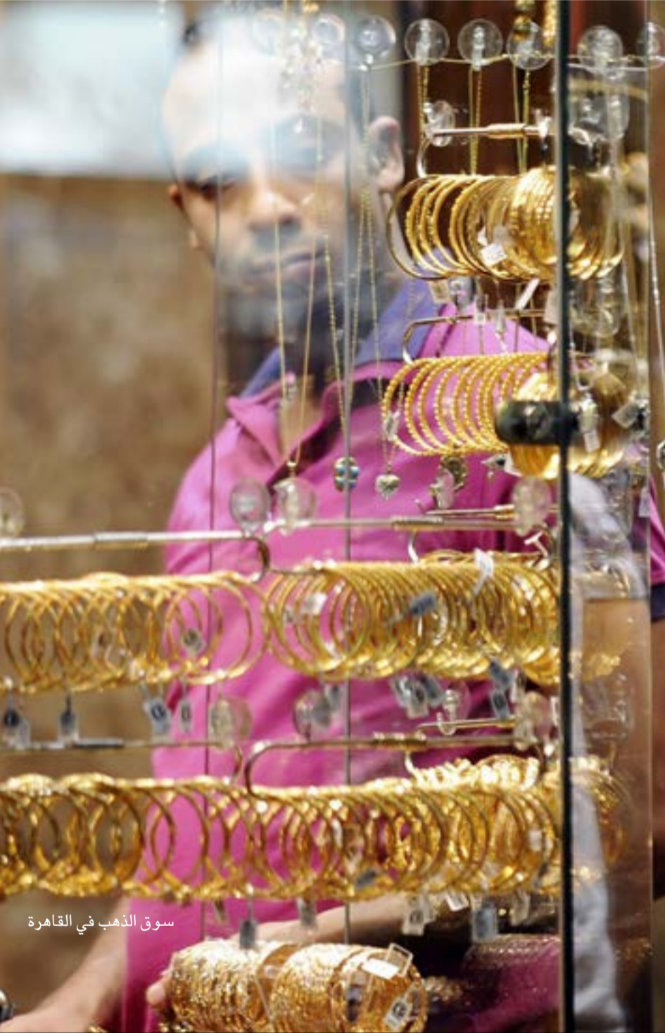
سوق الذهب في القاهرة

المهندس شريف إسماعيل، أن مصر تسلمت وديعة بعلياري دولار، من الملكة العربية السعودية، في سبتمبر/أيلول الماضي، وكان البنك المركزي المصري أعلن في وقت سابق من أكتوبر/تشرين الأول الجاري عن ارتفاع احتياطي البلاد من النقد الأجنبي من 16.564 مليار دولار نهاية أغسطس/ آب إلى 19.582 مليار دولار بنهاية سبتمبر/ أيلول بعد تسلمه الوديعة السعودية.