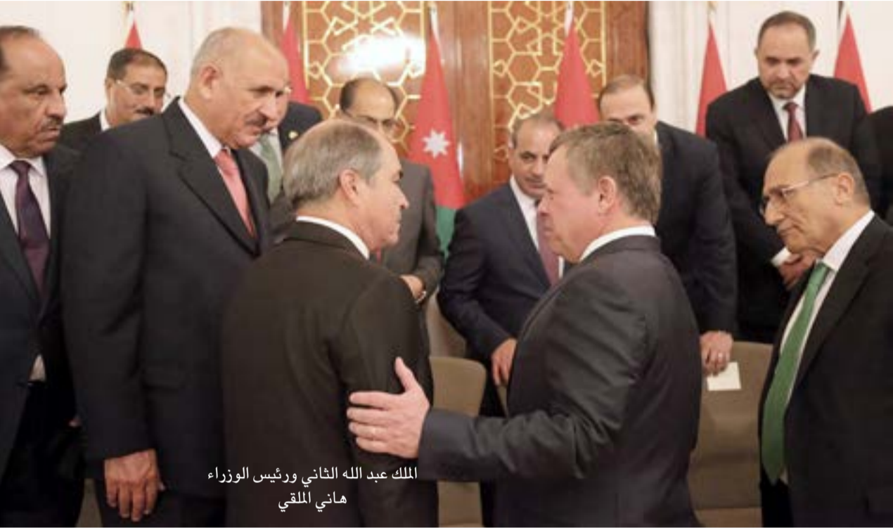
الملك عبد الله الثاني ورئيس الوزراء