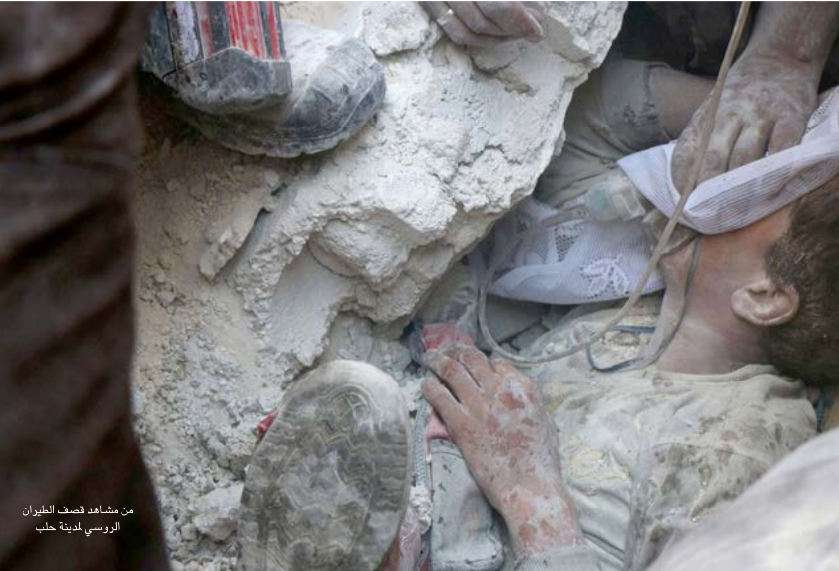
من مشاهد قصف الطيران الروسي لمدينة حلب

نفوذ كل من طهران وأنقرة في المنطقة أيضا.