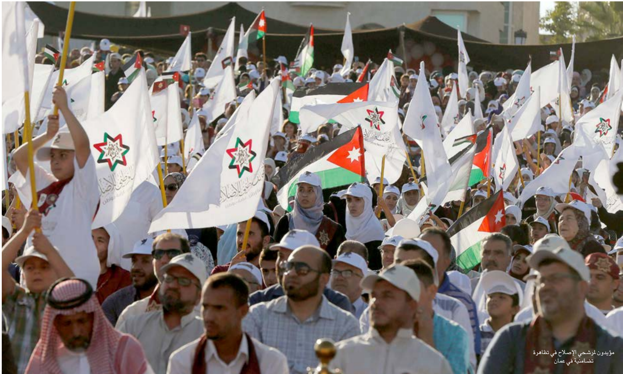
مؤيدون لمرشحي الإصلاح في تظاهرة تضامنية في عمان

الحرية الإسلامية. لم أفهم حتى اللحظة الأسباب التي دفعت بعض المستويات الرسمية في الماضي القريب لتغذية وتسمين محاولات انشقاق وتفجيت داخل الحركة الإسلامية فكتت اعتقد وما زلت ان التعامل مع هذه الحركة كجسم واحد وموحد هو الأفضل بدلا من التفرغ والتفريع.