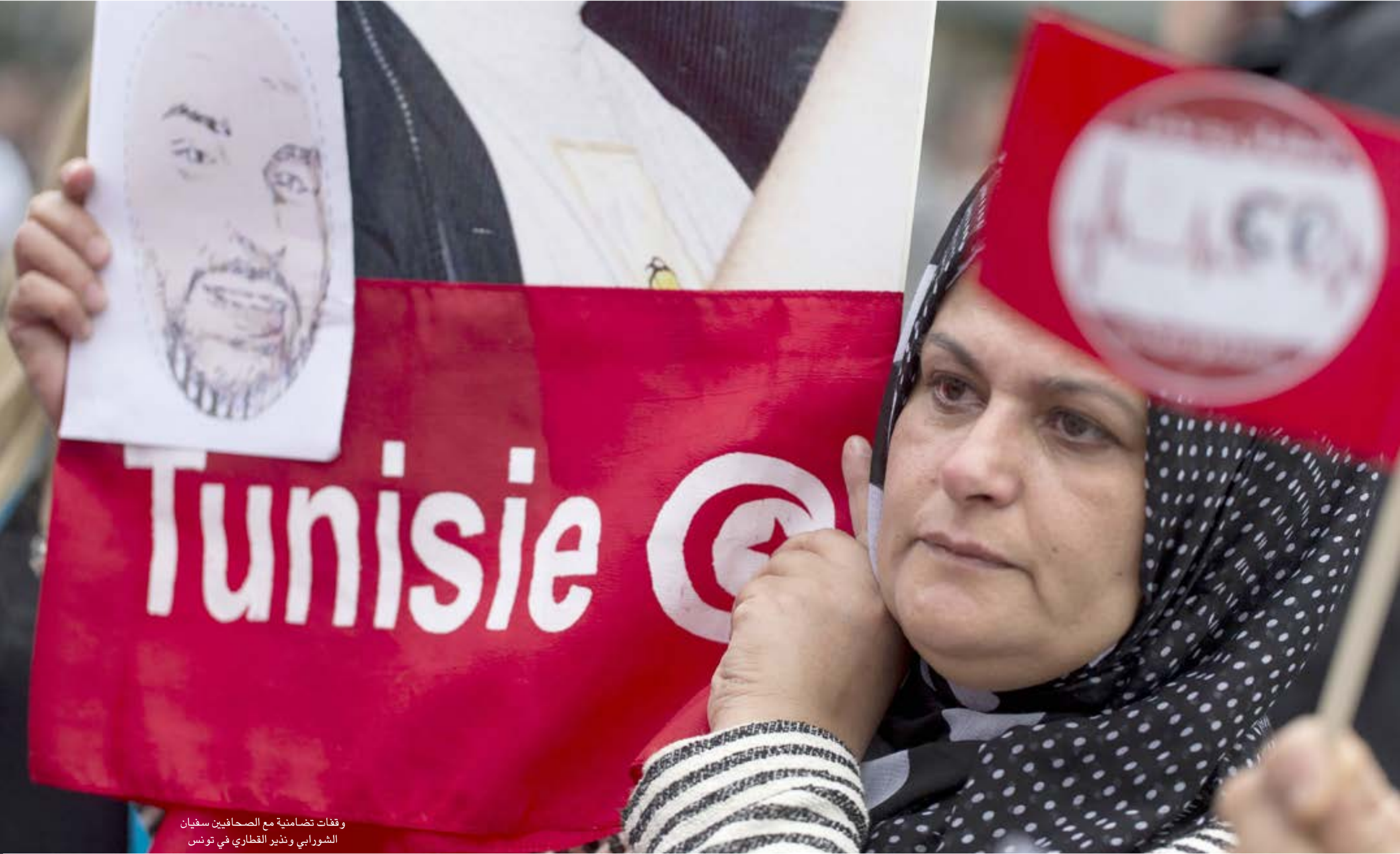
وفتات تضامنية مع الصحافيين سفينان

ويتابع: «ليست لنا دبلوماسية في تونس ولا يجب أن ننتظر الكثير من وزارة ليبيا الجاورة ولم يتمكن أحد من تحريرهم رغم ادعاء وجود علاقات جيدة مع كل الفرقاء الليبيين. بل أن سياسة المسافة الواحدة من الجميع يبدو أنها لم تؤت