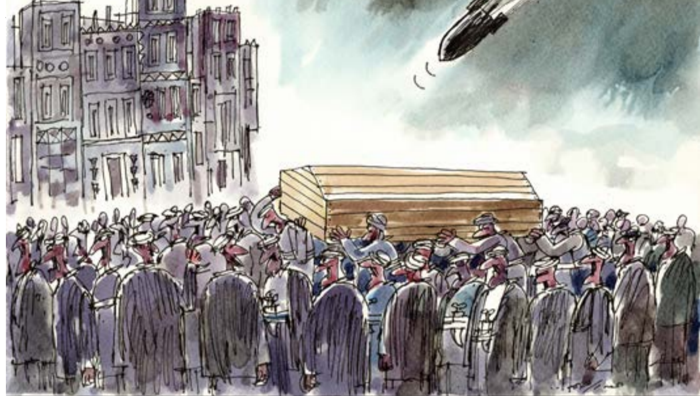
كاريكاتير: عبد الرحيم ياسر