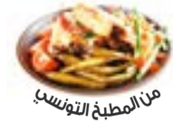
من المطبخ التونسي