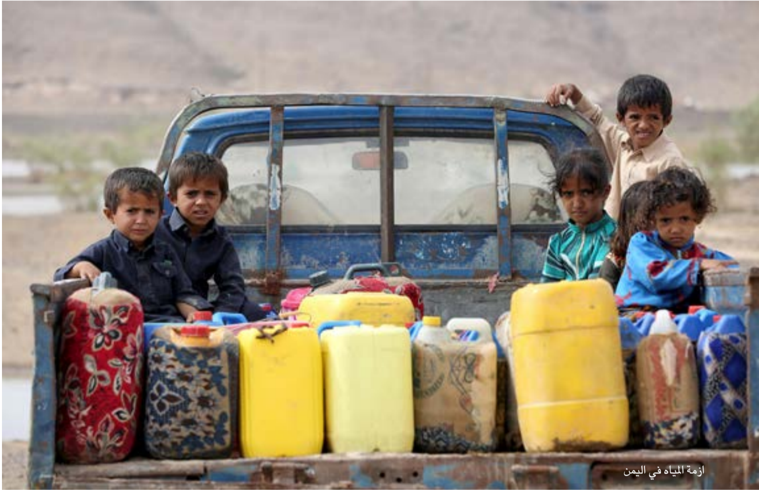
أزمة المياه في اليمن

بشكل أكثر حدة، على الأخص البلدان التي يتنامى فيها السكان بسرعة كالصومال واليمن وأفغانستان والمناطق الصحراوية من السودان.وترى دراسة نشرت بالروسية إن سلسلة سدود «النهضة» التي بدأت أثيوبيا في تشييدها على النيل الأزرق في عام 2013 وستنجزها في عام 2017 تعتبر كارثة بالنسبة إلى مصر، إذ ستحصل مصر على كمية من المياه أقل بمقدار الثلث، وسيقلص توليد الطاقة الكهربائية فيها بنسبة 40%.. وترى دراسة أخرى أنه: «لا تتوفر أي فرص للحفاظ بلا مساس على اتفاقية تقاسم مياه النيل الموقعة في أعوام الخمسينيات تحت رعاية الإنكليز، والتي تنص على تقاسم غالبية كمية مياه النهر بين السودان ومصر».