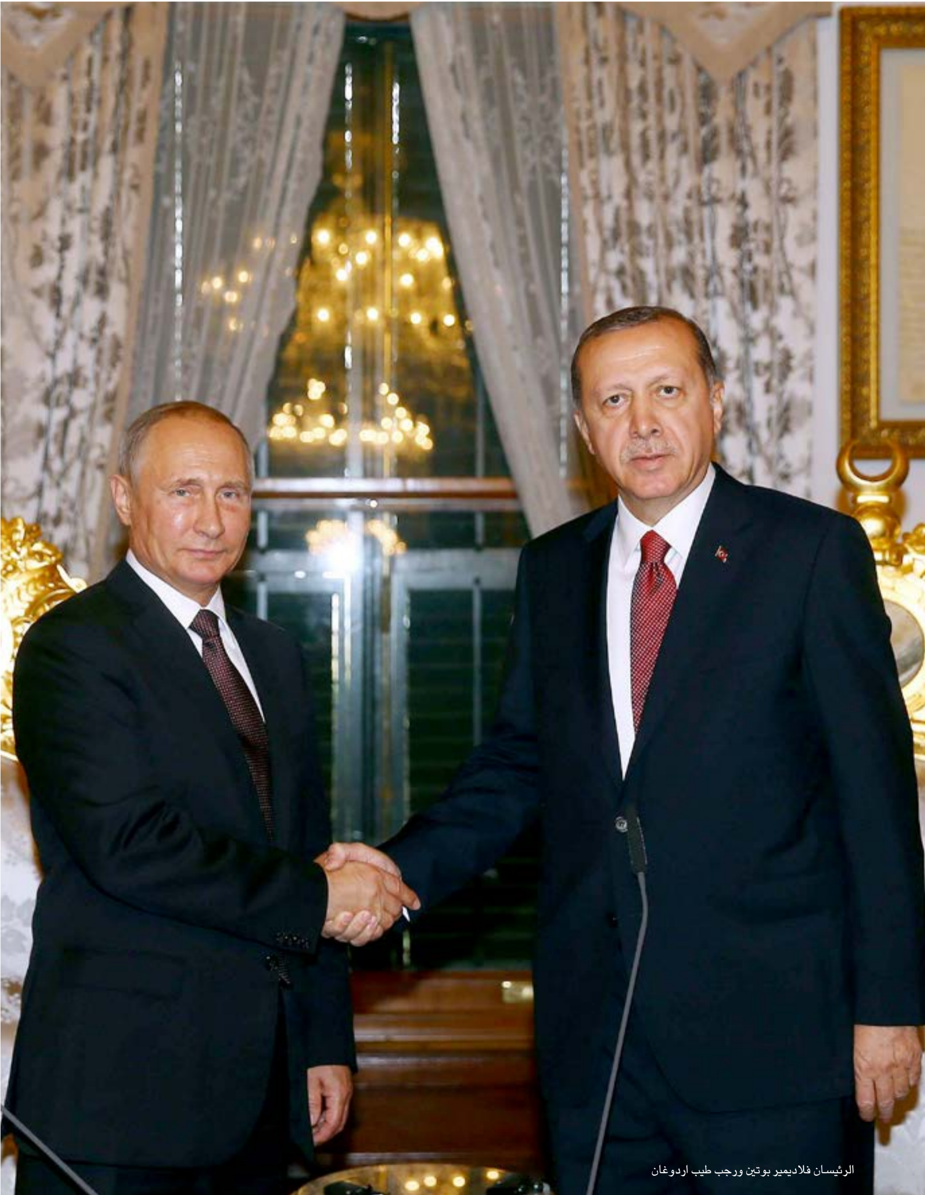
الرئيسان فلاديمير بوتين ورجب طيب اردوغان

وهكذا أصبح بوتين محاصر عسكريا في سوريا من الغرب وأمريكا بصورة شبه علنية، ومن إيران بصورة خفية غير معلنة، وبقي أمام التراجع عن الخطا الذي ارتكبه في سوريا نتيجة الخديعة الإيرانية والأمريكية، فالتقى الرئيسان التركي والروسي على نقاهم جديد يعالج مسار كليهما في المرحلة السابقة، فتركيا غير معنية في الصراع مع روسيا إطلاقاً، بل هي بحاجة لها لمواجهة حرب الانقلابات العسكرية وفسادا في الأرض.