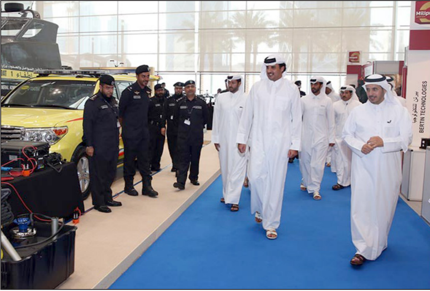
أمير قطر الشيخ تميم بن حمد آل ثاني أثناء زيارته لمعرض «مليبول قطر 2016»

أمير قطر زار المعرض واطلع على أبرز الابتكارات في مجال حماية المنشآت