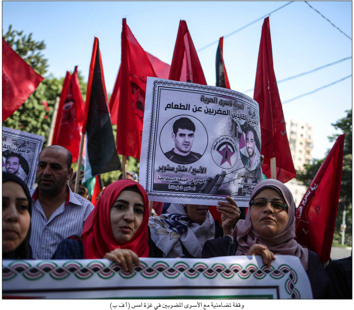
وقفة تضامنية مع الأسرى المضربين في غزة أمس