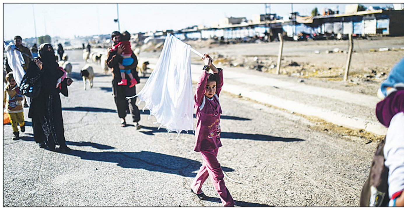
طفلة عراقية هاربة من عائلتها من منطقة قوقلي تحمل علما أبيض أمس

تركيا، كما دعا اتباعه إلى شن هجمات ضد السعودية واستهداف قوات الأمن ومسؤولي الحكومة وأعضاء العائلة الحاكمة ووسائل الإعلام. ميدانيا قالت القوات المشتركة، أس الخميمس، إنها استعادت حي الكرامة، ثاني منطقة تدخلها القوات العراقية داخل الموصل بعدما استعادت السيطرة على كوكلي عند البوابة الشرقية لمدينة الموصل، وقالت قوات مكافحة الإرهاب إنها «خاضت معارك عنيفة وتمكنت من اقتحام حي الكرامة بعد يومين من السيطرة على مبنى التلفزيون الحكومي المجاور». وأقاد قائد عمليات «قادمون يا نينوى»، الفريق الركن عبد الأمير رشيد يار الله، بأن قطعات الفرقة المدمرة التاسعة وقوة من التدخل السريع اقتحمت حي الانتصار في الساحل الأيسر من مدينة الموصل وتوغلت في شارع 60.