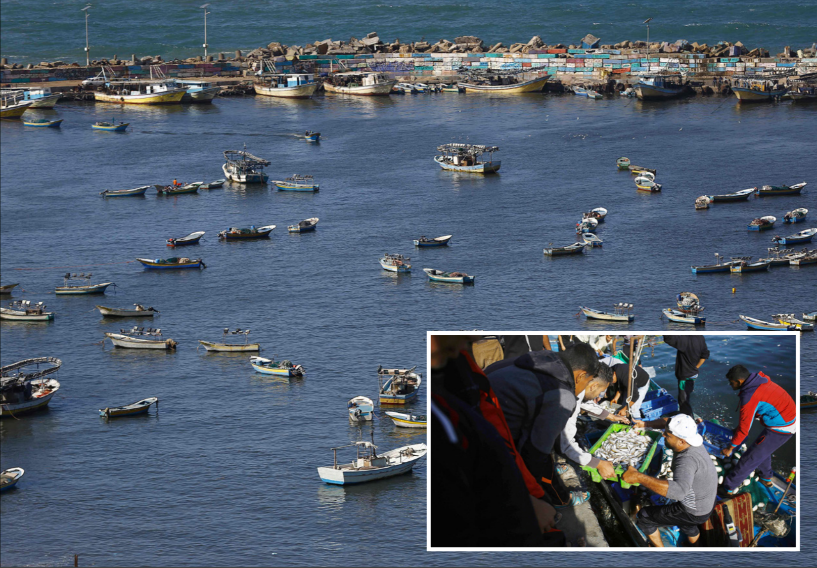
مناطق الصيد أمام سواحل غزة

وتقرض سلطات الاحتلال ضمن إجراءات الحصار المشدد على غزة قيودا صعبة على حركة الصيادين، وكثيرا ما تقوم بملاحقتهم وإطلاق النار عليهم واعتقال عدد منهم، وتخريب معدات الصيد الخاصة بهم. ويوم أمس أطلقت زوارق البحرية الإسرائيلية نيران أسلحتها الرشاشة صوب مراكب الصيادين قبالة بحر مدينة غزة، وحققت أضارا بمركيبي صيد. وقبل يومين هاجمت صيادين وأصاب أحدهم بجراح متوسطة، قبل أن تعود في اليوم الثاني وتقتل ستة منهم وتصادر مراكبهم. من جهته أدان مركز «إليزان» لحقوق الإنسان بشدة الانتهاكات الإسرائيلية بحق