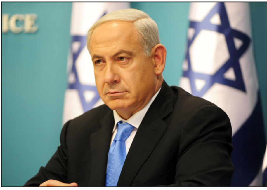
بنيامين نتنياهو يكتب ويعتذر

أيد طرد سلطة البث من الساحة الإعلامية، لم يقصد ذلك في البداية. وقد قال ليرمان في هذا الاسبوع إنه عند التوقيع على الاتفاق الائتلافي مع اللبكو، أوضح أنه نتنياهو أنه «ستحدث تغييرات» فيما يتعلق بعمل اتحاد البث، وبدون هذه الشهادة أيضا، فإن نتيجة خطوات رئيس الحكومة تشير إلى بدايتها: هو لا يريد بث جماهيري مستقل، بل يريد احتداد بث خاص مثل «إسرائيل اليوم». لم تكشف هنا مواقف نتنياهو المشوهة تجاه وسائل الإعلام الحرة فقط، بل أيضا الصفات الشخصية له وطريقة ادارته للدولة. يستخدم نتنياهو الكذب كأمر قانوني في السوق السياسية من أجل التخلص من الأراج وتحقيق أهدافه، إنه يعن بكل وقاحة أن المواطنين العرب يتدفقون إلى صناديق الاقتراع، وينبغي أنه أوجد مقارنة بين الاهالي التلكي وبين أهل الجيور ازاري.