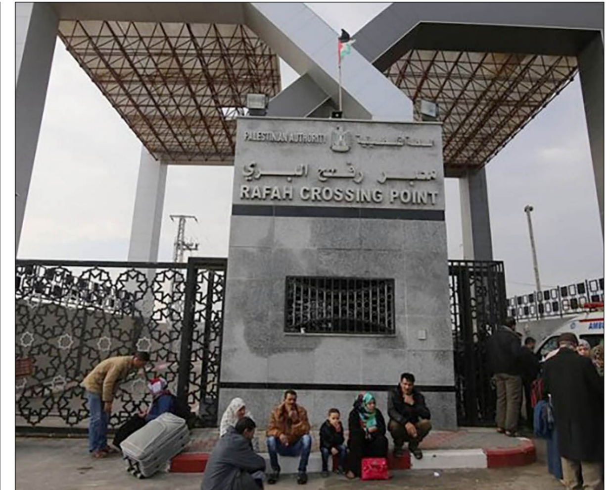
الرئيس المصري يسمح بفتح معبر رفح من 14 إلى 18 نوفمبر الحالي