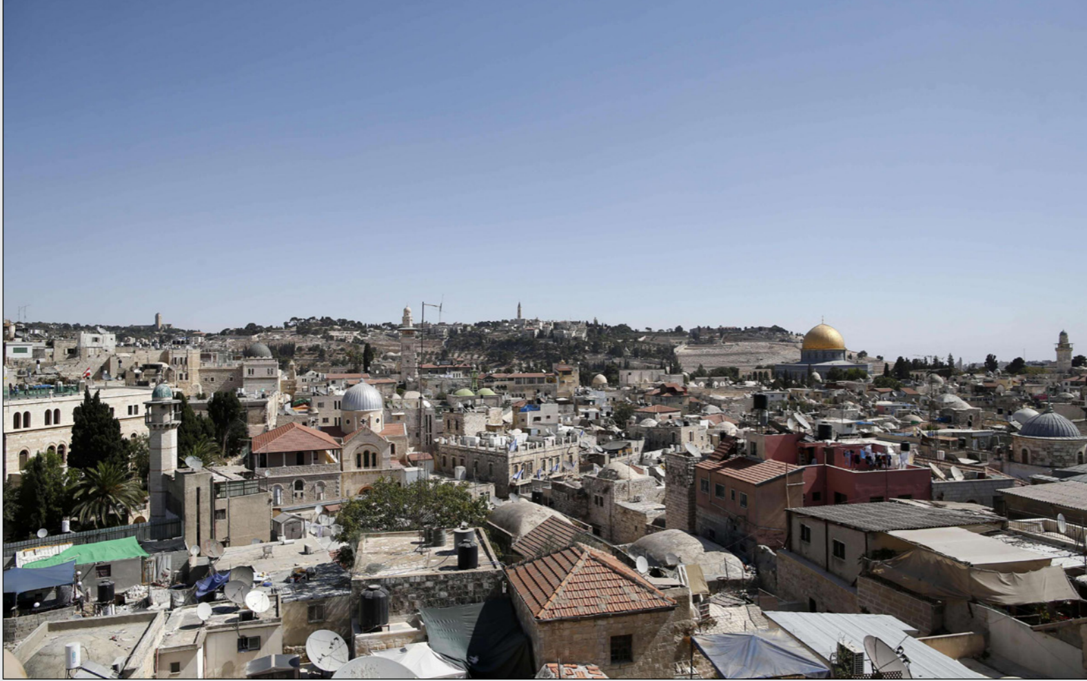
مشهد عام للقدس