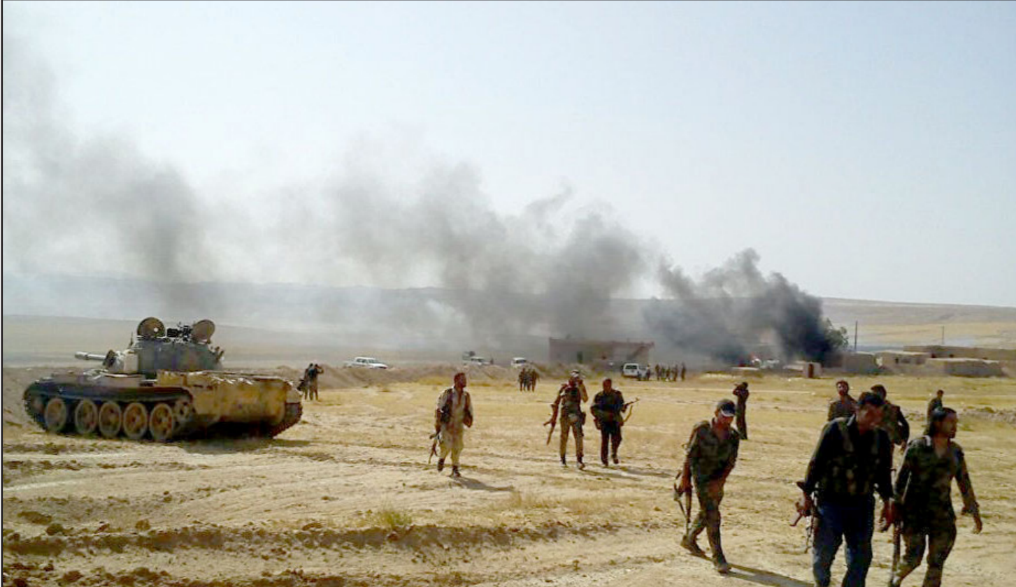
عناصر من الجيش الحرب داخل إحدى القرى المحررة في ريف حلب

في غضون ذلك، كشف مصدر مسؤول في محافظة ريف دمشق أن «عملية المصالحة قسي بلدة زاكبية أصبحت في مراحلها الأخيرة»، وأكدت وكالة الأنباء السورية «سانا» أن وحدة من الجيش استعادت سيطرتها على خربة خان الشيوخ، والمدينة الشرقية في ريف دمشق بعد اشتباكات مع المسلحين، وأن حالتها حرجة. وتتمتعت القوات الحكومية السورية والمسلحون الموالون لها من فرض حصار على بلدة خان الشيوخ في محافظة ريف دمشق أمس الأحد، وقالت مصادر إعلامية مقرية من القوات الحكومية السورية إن الجيش السوري فرض حصاراً مطبقاً على بلدة خان الشيوخ بعد سيطرته على خربة خان الشيوخ.