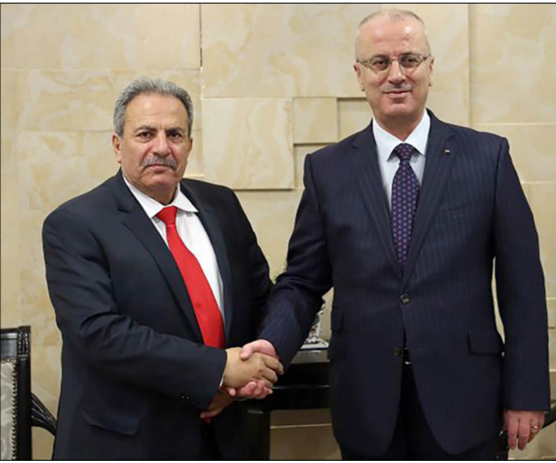
رئيس اللجنة الدستورية محمد الحاج قاسم مع رئيس الوزراء رامي الحمدالله

أعضاء المجلس التشريعي المنتهية ولايته الزمنية مؤقلاً إلى حين إداء أعضاء المجلس التشريعي الجديد اليمين الدستوري، وأن الرئيس لم يجاوز سلطته في إصدار القرار بقانون لرفع الحصانة عن أي عضو من أعضاء المجلس التشريعي في غير أدوار انعقاد جلسات المجلس التشريعي، التي لا يخضع تقديرها لمعيار ثابت وإنما تتغير بتغير الظروف وفقاً لمواجهة أية آثار مادية أو غيرها قد تمس الأوضاع الاقتصادية أو الاجتماعية في البلاد لمواجهة حالات الضرورة للمحافظة على كيان الدولة وإقرار النظام فيها كرخصة تشريع استثنائية لعدم انعقاد المجلس التشريعي وعدم قدرته على الانعقاد. يشار إلى أن الخلافات تصاعدت مؤخراً بين فتح وحماس، بعد فشل الحركتين في التوصل لاتفاق خلال جلسات عدة عقدت في العاصمة القطرية الدوحة، حول تشكيل حكومة الوحدة الوطنية، وإنهاء ملف موظفي غزة الذين عينتهم حركة حماس بعد سيطرتها على غزة. والتقى الرئيس عباس قبل أكثر من أسبوع مع خالد مشعل رئيس المكتب السياسي لفتح حماس، ونائبه إسماعيل هنية خلال زيارة الرئيس للدوحة، وبحث خلال اللقاء في مختلف المواضيع ذات العلاقة، والتأكيد على ضرورة استئناف الحوار الذي تستضيفه دولة قطر بين فتح وحماس.