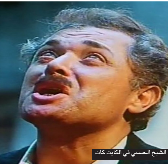
الشيخ حسني في الكايت كات

جائزة أحسن ممثل عن فيلم «سوق المتعة» من مهرجان القاهرة السينمائي الدولي، جائزة أحسن ممثل عن فيلم «الكيت كات» من مهرجان الإسكندرية السينمائي الدولي. والجائزة الأهم هي جائزة حب الجماهير، التي حصل عليها الساحر باقتدار والتي ستجعل فنه يعيش طويلاً رغم رحيل جسده.