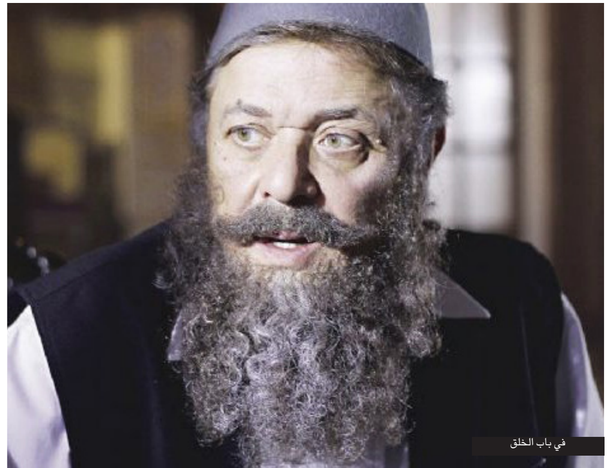
في باب الخلق

الفنان مكسيم خليل كتب عبر صفحته على «فيسبوك»، «رحل الساحر.. رحل رافت الهجان.. رحل من اجلسني أمام