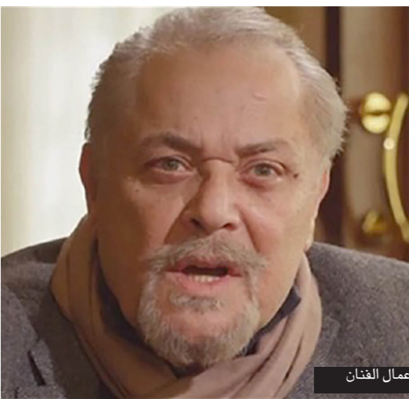
جانب من أعمال الفنان