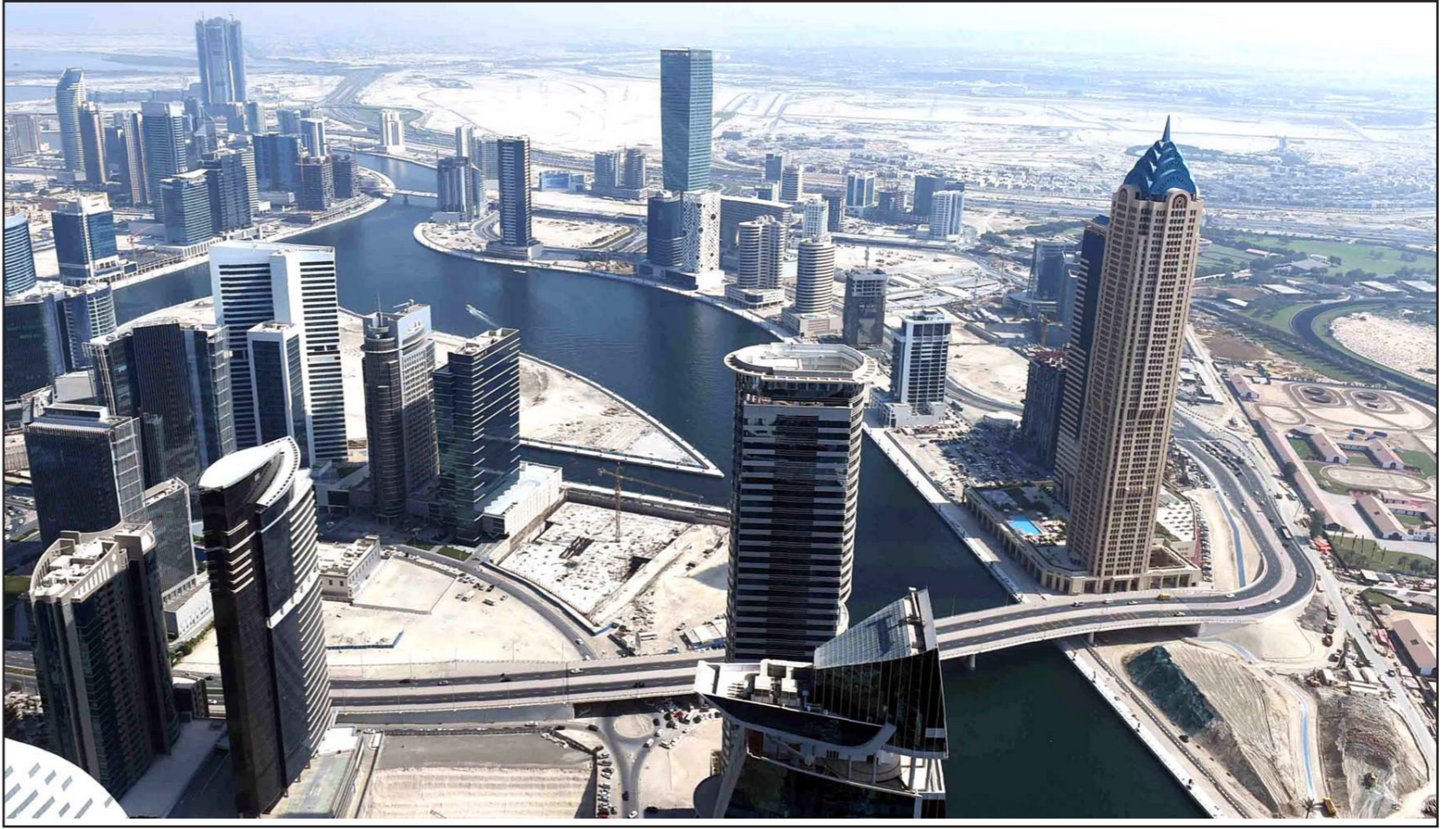
مقطع من قناة دبي المائية

دبي - رويترز: كشفت دبي النقاب عن أحدث مشاريع البناء الضخمة الخاصة بها في حفل افتتاح فخم لقناة دبي المائية. وتربط القناة الصناعية التي يبلغ طولها 3.2 كيلومترا القلبي التجاري للمدينة بمنطقة الخليج، ويتراوح عرض القناة بين 80 مترا و120 مترا. وهذه هي المرحلة الأولى من مشروع سيتمثل في نهاية المطاف فيلات فاخرة ذات واجهة مائية وخدمات تجارية، في كل من قطعي الأمام والترفيه، فضلا عن الحدائق ومسارات المشي ومسارات للركض وثلاثة جسور بديعة للمشاة.