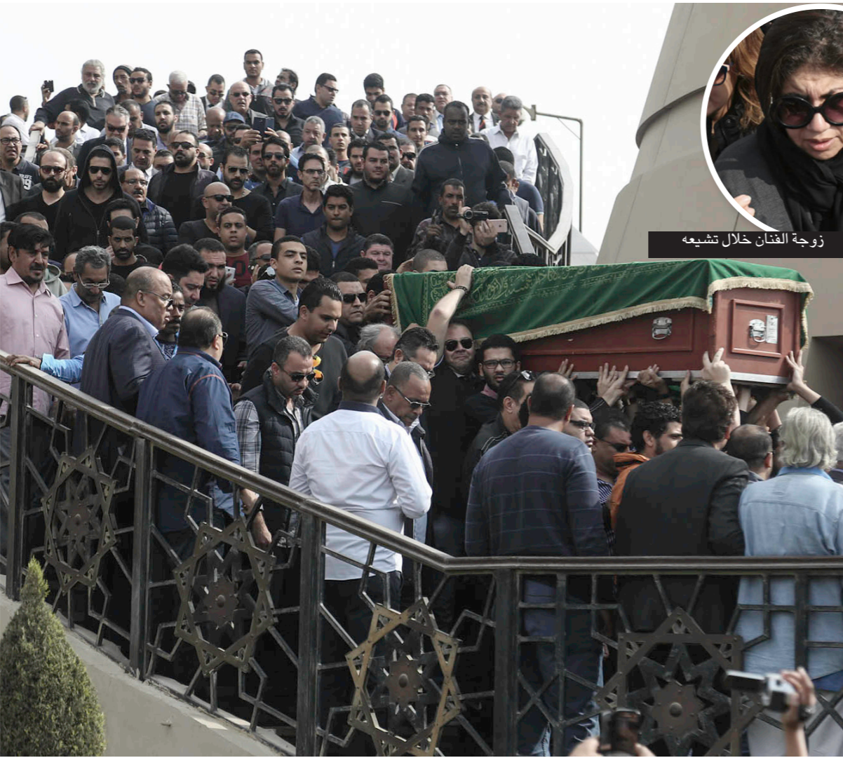
زوجة الفنان خلال تشييعه

الحزن على عبد العزيز لم يقتصر على الوسط الفني فقط، بل