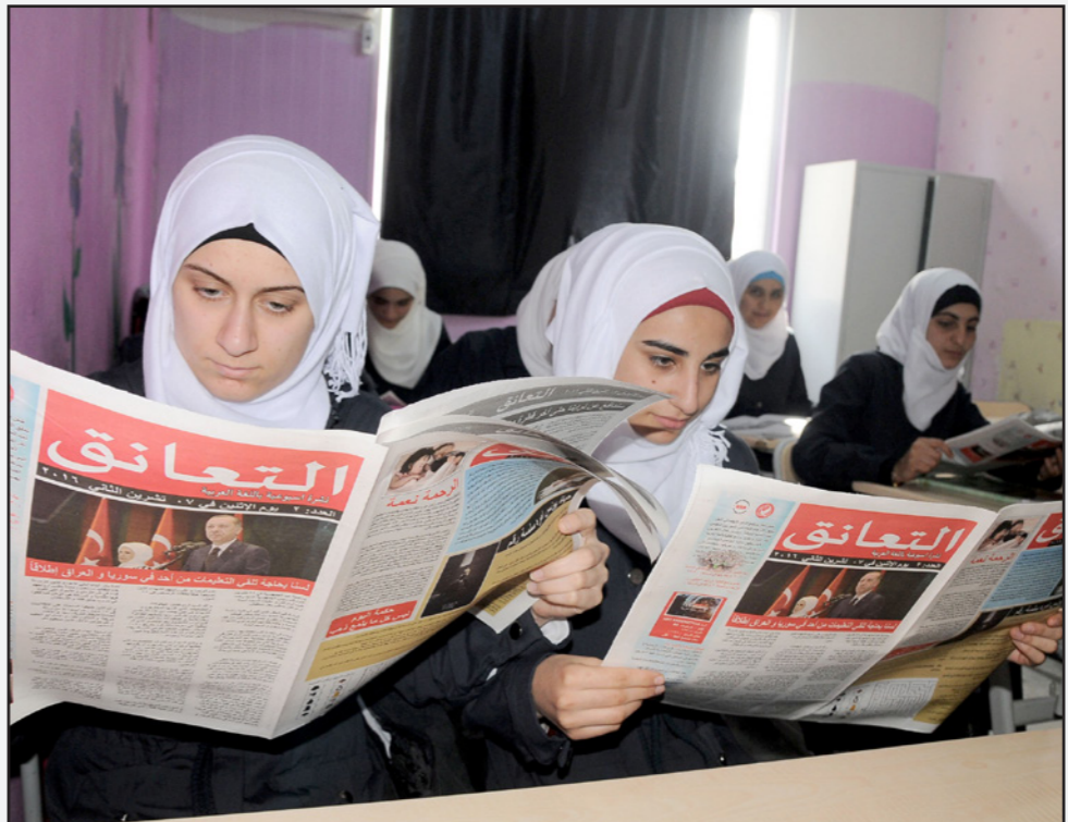
طليات سوريات يطلعن على صحيفة «التعاقب» في ولاية هطاي التركية

أطلق ناشطون دمشقيون وسمّاً أنتشر على مواقع التواصل الاجتماعي لأجل مدينة دوما بريف دمشق الشرقي المحاصر، والتي بات يطلق عليها اسم «مدينة الشهداء»، لإيصال معاناة أهالي المدينة المحاصرين إلى الرأي العام العالمي، وتوضيح معاناتهم بعد مرور خمسة أعوام على عمر الثورة السورية، وما حملته معها من نكبات. وقال الناشط الإعلامي أبو الحسن الاندلسي من محاصري مدينة دوما في اتصال هاتفي معه ان الحملة جاءت بهدف لفت نظر العالم النائم لما يحصل بحق المواطنين في المدينة، من جرائم يقوم بها نظام الأسد وروسيا، وخاصة التصعيد العسكري الأخير على المدينة، يوماً بعد يوم يزداد تصعيد القصف الروسي على مدينة دوما وياعتف الوسائل، ومنها التبادل والفسفور والعنقودي المحرم دولياً، الأمر الذي أسفر عن تدهيم