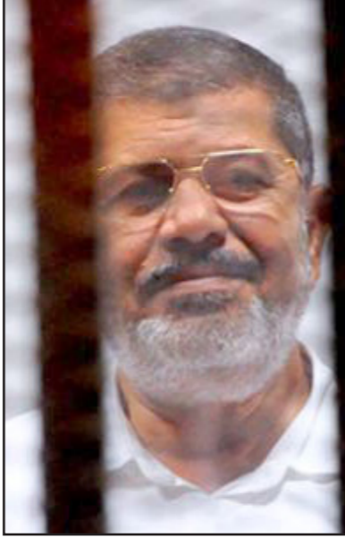
الرئيس المعزول محمد مرسي

وقعت أحداث القضية إلى الفترة ما بين حزيران/ يونيو 2012 وحزيران/ يونيو 2013، وأسندت النيابة إلى المتهمين في القضية ارتكاب جرائم «اختلاس تقارير صادرة عن جهاز المخابرات العامة والحربية، والقوات المسلحة، وقطاع الأمن الوطني في وزارة الداخلية، وهيئة الرقابة الإدارية، من بينها مستندات سرية تضمنت بيانات حول القوات المسلحة وأماكن تمركها والسياسات العامة للدولة». وقالت النيابة في تحقيقاتها إن «اختلاس التقارير كان يقصد تسليمها إلى جهاز المخابرات القطري وقناة الجزيرة الفضائية القطرية، وذلك بغرض الإضرار بمركز مصر العربي والسياسي والدبلوماسي والاقتصادي وبمصالحها القومية».