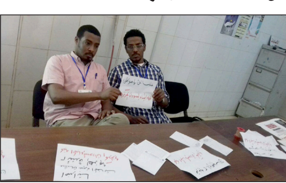
«شكناك يا مواطن» رسالة من الأطباء للمواطنين

وقالت في بيان لها: «تطلعت نتابعون ما هو خلال الفترة الماضية على جموعنا من ظلم واعتقال، كان الهدف منه تقويض الحراك العظيم وحرف وجهته، ولكن غاب عنه من يقومون بذلك أن شئوكة الأطباء لا تنكسر، وعودهم لا ينحني أبداً، وغير سيعيضون قدماً رغماً عن كل الصعاب، ولن يرضوا غير تحقيق بنود مذكرتهم بندا بندا». ونفذ الأطباء في الأسبوع الماضي حملات إعلامية واسعة على وسائل التواصل الاجتماعي كافة نادت بإطلاق سراح جميع الأطباء المحتجزين والتعريف بقضيتهم وأسباب الإضراب. وكانت لجنة أطباء السودان قررت العودة للإضراب مرة أخرى ابتداء من أول هذا الشهر وذلك بشكل مبرمج بعد أن رفعته في الشهر الماضي. وعزت اللجنة هذه الخطوة لعدم التزام الحكومة السودانية بتنفيذ ماتم الاتفاق عليه في المذكرة التي رفعت لنائب رئيس الجمهورية.