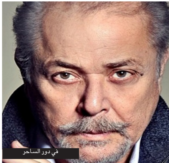
في دور الساحر