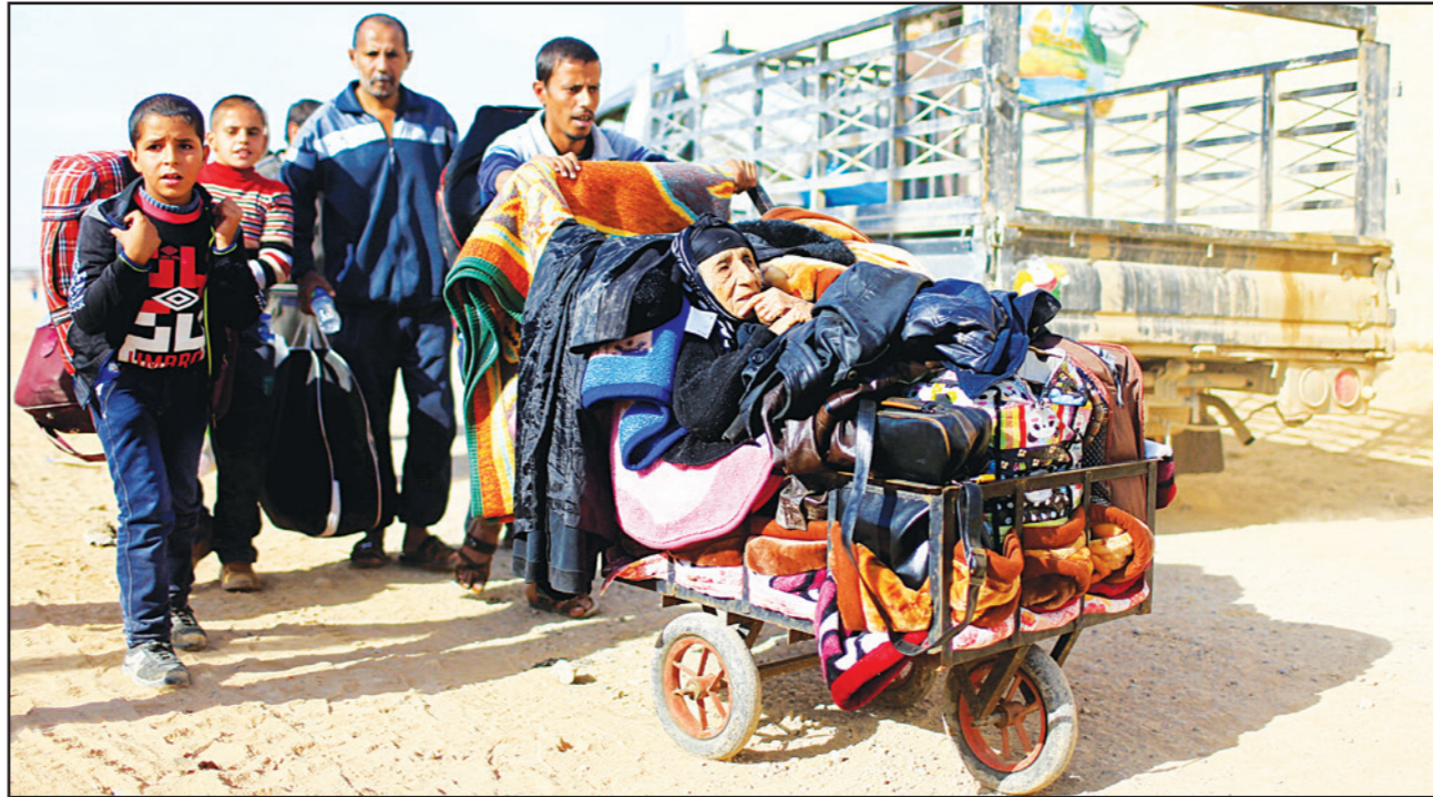
نازحون يغفرون من حي السماح بعد تجدد المعارك بين الجيش العراقي وتنظيم الدولة في الموصل

الموصل وهم يرون على مرصم بصرمه أحياء المدينة أمس الأحد، إنهم جاهزون لتضييق الخناق على مقاتلي تنظيم الدولة الذين يدافعون باستماتة عن معقلهم في العراق. (تفاصيل ص 2)