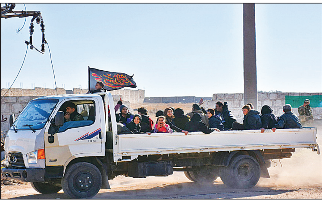
عائلات سورية مهجرة من شرق حلب باتجاه مخيم في منطقة جبرين أمس