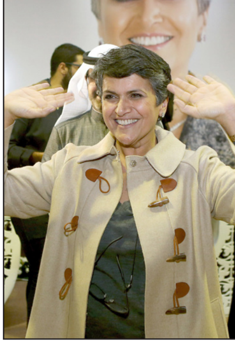
صفاء الهاشم المرأة الوحيدة الفائزة في الانتخابات