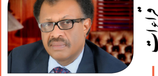
أمير تاج السر*

قال: لا.. كنت بصدد القراءة لك، والآن لن أفعل. هذا بالضبط عكس ما فعلته، حين قرأت عن شبحية نصي، لأبحث عن كتابات من انتقدني، وكنت أتمنى لو فعل طالب النصح مثلما فعلت.