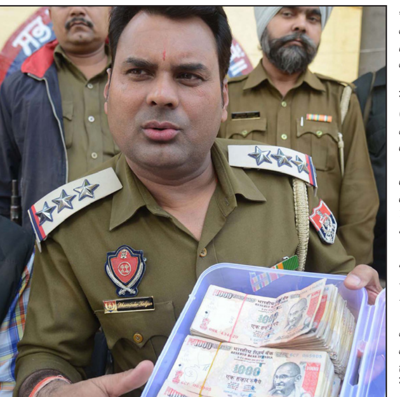
ضابط أمن يحمل صندوق نقود ملغاة من فئة الف روبية

تسعين في المئة من مشتريات المستهلكين في الهند نقدية. ورغم أن طفرة الهواتف المحمولة وتراجع تكلفة الإنترنت على الهواتف المحمولة أدت لزيادة المدفوعات الرقمية في السنوات الأخيرة إلا ان النسبة تظل منخفضة.