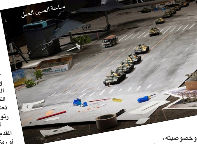
ساحة الصين العمل

أعداء الفوتوغرافيان السويسريان، جوايكيم كورتيس وأندريان سوندرديجار، إنتاج صور فوتوغرافية أيقونية تاريخية في متحفها الفوتوغرافي، حيث قاما بوضع مجسمات صنعت باليد لتكون مطابقة للعناصر الموجودة في الصور الفوتوغرافية الحقيقية، أعلنتا منذ اللحظة الأولى عن الصور بأنها ليست صوراً حقيقية وإنما إعادة إنتاج عن صور فوتوغرافية تاريخية، على الرغم من أن الألمان سيرف مشهورة جداً، مثل الصورة