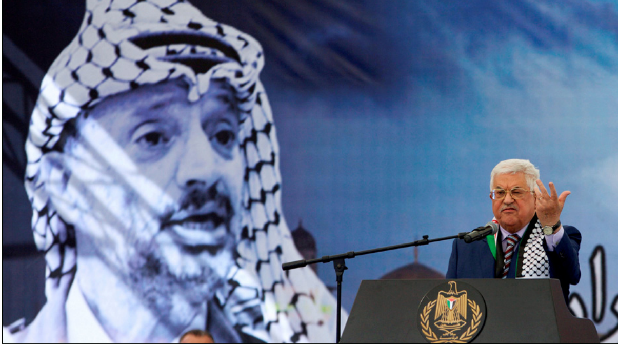
الرئيس عباس يلقي كلمة في رام الله

وأضاف: أن «رئيس اللجنة الإدارية والفنية في اللجنة التحضيرية، عضو اللجنة المركزية لحركة فتح حسين الشيخ، وأصل اتصالاته على كافة المستويات لتأمين التصاريح المطلوبة لأعضاء المؤتمر سواء القادمين من قطاع غزة أو من خارج الوطن، وأن اتصالاته ما زالت متواصلة لتأمين كافة التصاريح المطلوبة». وكان أبو الهيجا، قد أعلن في وقت سابق، أن غالبية أعضاء المؤتمر وصلوا إلى رام الله، وأن النصاب القانوني للمؤتمر اكتمل بوصول غالبية