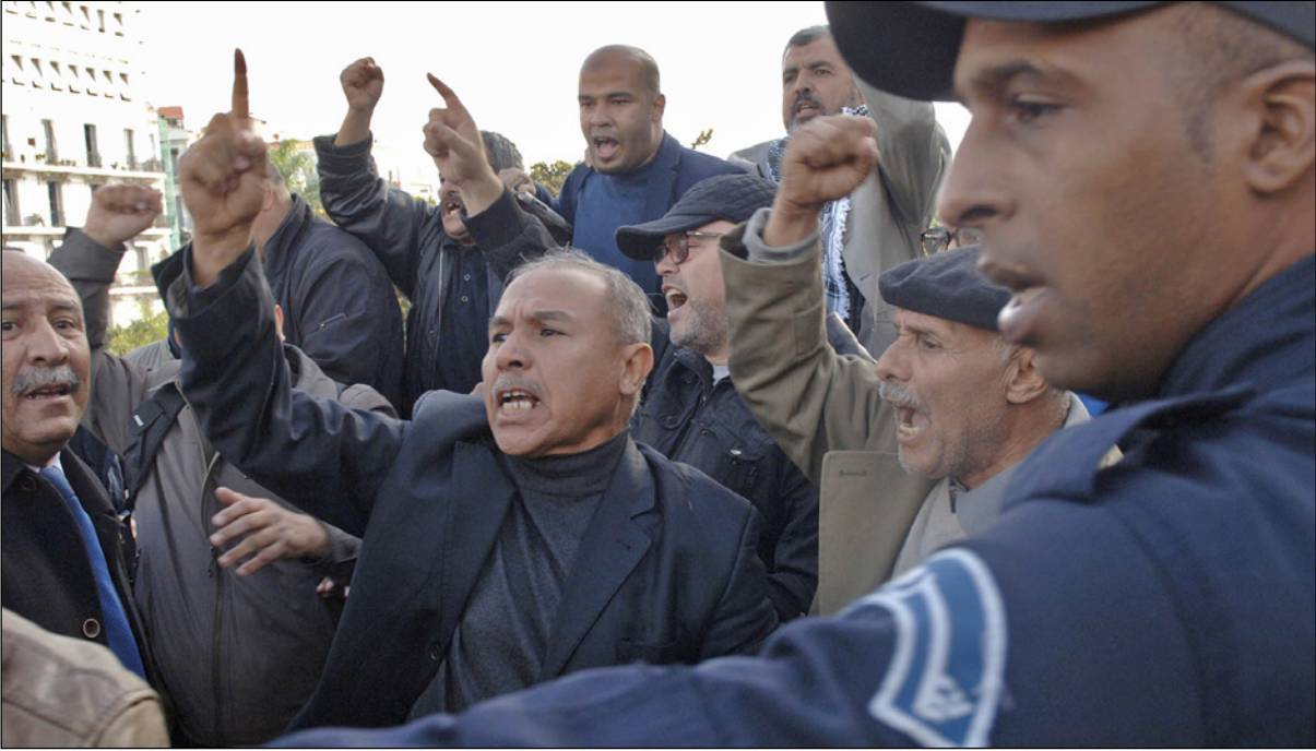
الشرطة الجزائرية استخدمت العنف لتفريق المحتجين