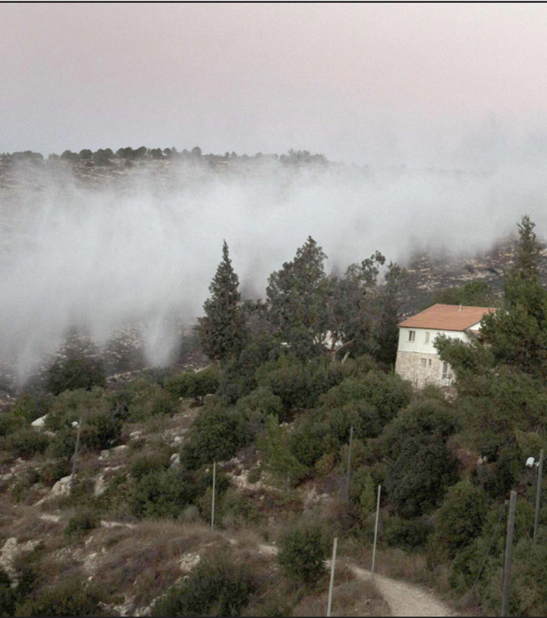
جانب من عمليات إطفاء الحرائق في إسرائيل

■ هل الحريق الناتج عن عمل تخريبي يساوي أكثر من الحريق العادي؟ هل المعايير لاعطاء التعويضات المدنية للاسرائيليين الذين تضررت منازلهم واملاكهم ستؤخذ حسب مصدر النيران؟ وسينشأ تسلسل هرمي للحاصلين على التعويضات والمساعدات؟ هل الحريق الذي