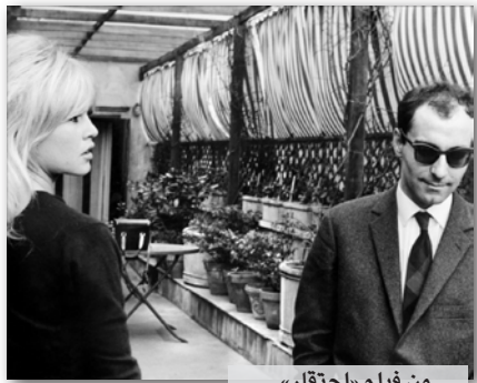
من فيلم «احتقار»

أما الأفلام العشرة الأولى من اللائحة، ونهني بها هذه الأسطر، فاولها هو «فيريغو»، للبريطاني الفريد هيتشكوك، الثاني هو «احتقار» للفرنسي جان لوك غودار، الثالث هو «شرق» للالائي مورنا، الرابع هو «ملهو لاند درايف» للامريكي ديفيد لينش، الخامس هو «حكاية طويكو»، للياباني ياسوجيرو أوزو، السادس هو «سيدة...» للالائي ماكس أوفس، السابع هو «الغشا تحت المطر» للامريكي ستانلي دوين، الثامن هو «الأم والعاهرة»، للفرنسي جان أوستاش، التاسع هو «آني هول» للامريكي وودي آلن، العاشر هو «ليلة الصياد» للبريطاني تشارلز لايفون.