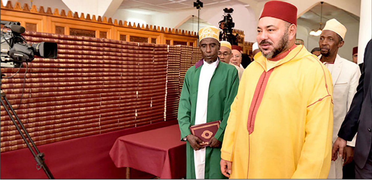
الملك محمد السادس يتحدث للصحافة في مديغشر

منذ إعلانته العرش سنة 1999، حيث كان آخر حوار له مع الصحافة منذ 13 سنة ومن الحوارات النادرة التي أجراها مع الصحافة الأجنبية، حواره مع مجلة «التايم» الأمريكية سنة 2000، ومجلة «ساري ماتش» الفرنسية سنة 2001، وأيضاً حواراً مع صحيفة «لوفينغارو» الفرنسية سنة 2001، وأكد الملك في حوار مع الصحافة المغاربية، أنه يتطلع إلى إقامة نموذج للتعاون جنوب- جنوب قوي ومتضامن، بين عدد من بلدان القارة الإفريقية، كما قلت في خطابي جديري بالذكر أن وسائل إعلام وتنشطاء «فيسبوك» في المغرب، يتفعلون بشكل كبير مؤخراً مع جدلية استعمال عناصر الشرطة للسلاح من عدمه للحد من الجريمة في البلاد، وذلك بعدما أشارت بعض وسائل الإعلام المحلية لبعض التدخلات التي أسفرت عن ضحايا بسبب استعمال رجال الأمن للسلاح.