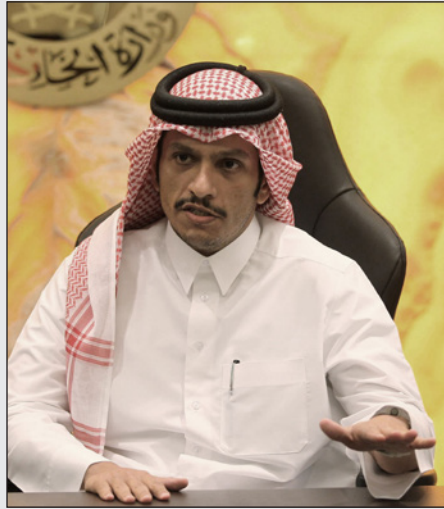
الشيخ محمد بن عبد الرحمن آل ثاني خلال مؤتمر صحافي في الدوحة

بأنها جماعات إرهابية في البلاد. وتغني دول الخليج ذلك وقال الشيخ محمد إن أي جماعة تتشارك تنظيم القاعدة فيه ليست لها أي فاعلية أو فائدة. ويعتقد الأسد الذي ينتمي للأقلية العلوية على الدعم العسكري من روسيا وإيران وفضائل شيعية في الحرب. وأشار إلى أن أراء ترامب في الشأن السوري قد تتبلور ما إن يتولى منصبه عندما يتلقى تقارير الخابرات عن «الواقع» على الأرض. وقال إن الواقع هو أن الأسد والعنف الذي تستخدمه قواته هو الخطر الأمني الرئيسي وأن تنظيم الدولة الإسلامية من نتائج الحرب الأهلية وإذا لم تنته الحرب نهاية عادلة فستظهر جماعات متطرفة أخرى. وأضاف مشيراً إلى خروج تنظيم «الدولة» من عباءة تنظيم «القاعدة إذا لم تعالج سبب كل ذلك... وبدون معالجة قضية الأسد فستظهر لنا جماعة متطرفة أخرى وستكون أشد تطرفاً ووحشية».