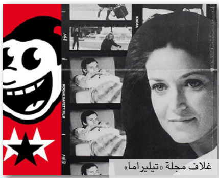
غلاف مجلة «تيليراما»