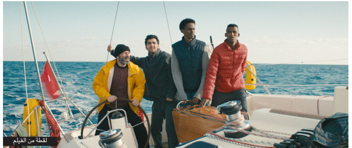
لقطة من الفيلم

الأسوط»، مشيراً إلى أنه ساعد المخرج في بعض تفاصيل السيناريو ببعض الملاحظات كونه يعرف حثيات القضية السورية بشكل أكثر من غيره بحكم انتمائه لسوريا. وأضاف خلال مقابلة إذاعية مع راديو «وروزنة» أنّ «كسرة الفيلم أتت بعد تردد المخرج على جزيرة لسبوس اليونانية حين كان يساعد اللاجئين هناك، فقرر إعادته وثنائقي، إلا أن المنتج فضل أن يكون العمل هو عبارة عن فيلم قصير فكتب المخرج القصة بنفسه».