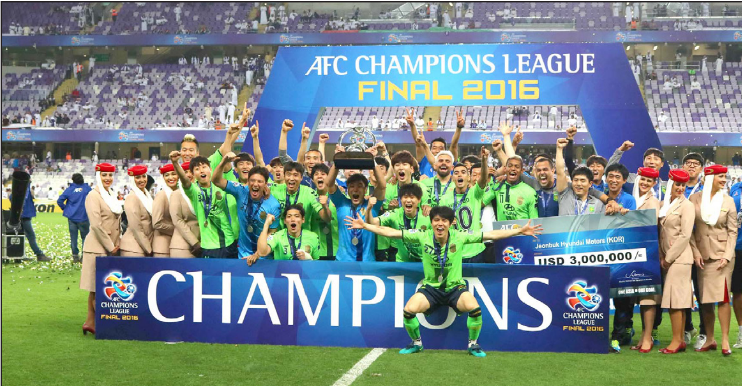
لاعبو وادرايو تشونبوك الكوري يحتفلون بتتويجهم أبطالاً لآقارة آسيا