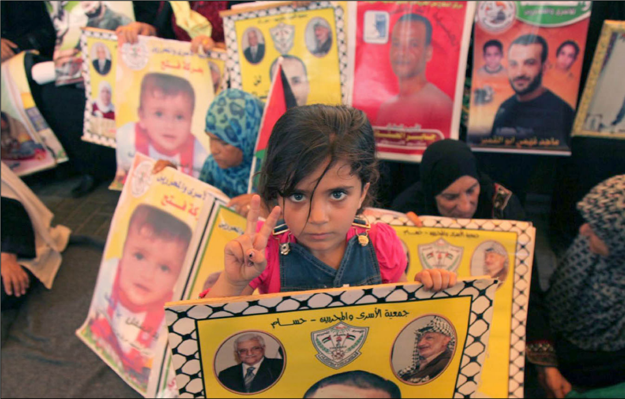
طفلة تشارك في اعتصام تضامني مع الأسرى

الاحتلال لمطالب المضربين بإنهاء اعتقالهم الإداري هو تشريع لقتلهم أو تحويلهم إلى معاقين، مشيرة إلى أن «الوضع أصبح مقلقا جداً».