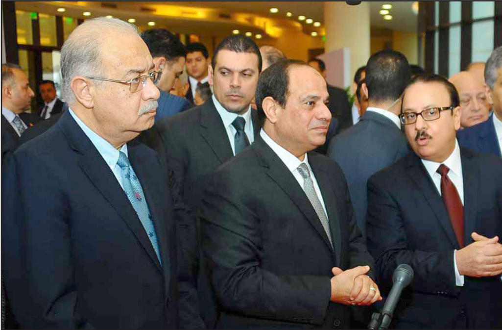
الرئيس المصري عبد الفتاح السيسي ورئيس وزرائه في جولة تفقدية لمعرض القاهرة الدولي للاتصالات

وزارة الاتصالات بتبنيها بالتعاون مع القطاع الخاص، وزار أيضاً الأجنحة المختلفة للوزارات المصرية، حيث اطلع على الخدمات الإلكترونية التي تقدمها للمواطنين في إطار تطوير خدمات الحكومة الذكية، وتفقد الرئيس عقب ذلك أجنحة شركات تصنيع تكنولوجيا الحماية والتأمين، وفي مقدمتها وزارة الإنتاج الحربي وهيئة المجتمعات العمرانية، وأجنحة عدد آخر من الشركات العالمية المشاركة في المعرض، كما زار أجنحة عدد من الشركات العاملة في مجال المدفوعات الإلكترونية، فضلاً عن جناح البريد المصري الذي يعرض ما يوفره من خدمات بريدية متطورة، ونكر يوسف «أن الرئيس قام أيضاً بتسليم كروت معاش وتكافل وكرامة، إلى عدد من المواطنين المستحقين لها من المسنين ونوبي الاحتياجات الخاصة، كما قام بافتتاح المنطقين التكنولوجيتين في مدينتي برج العرب وأسيوط عبر الفيديو كونفرنس، واللذين تمت إقامتهما في فترة زمنية تقل عن عام ويحققا نسبة إشغال عالية تزيد عن 75% للمساحات المخصصة لأعمال تكنولوجيا المعلومات».