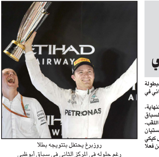
رؤيزرغ يحتفل بتتويجه بطلا رغم حوله في المركز الثاني في سباق أبو ظبي

■ واشنطن - رويترز: أحرز ستيفن كاري 34 نقطة ليقود فريقه غولدن ستيت وايزرز للفوز بلقب في ضيفه مينيسوتا تمبر وولفز 115-102 في دوري كرة السلة الأمريكي للمحترفين. وأحرز كاري 17 نقطة خلال الربع الثالث من المباراة ليحقق فريقه الفوز رقم 11 على التوالي ويعزز موقعه في صدارة مجموعة المحيط الهادئ. وتحقق فوز غولدن ستيت وايزرز في غياب اللاعب الشهير درايموند غرين بسبب معاناته من إصابة بالتهاد في الكاحل الأيسر تعرض لها خلال فوز فريقه على لسوس انجلوس ليكرز