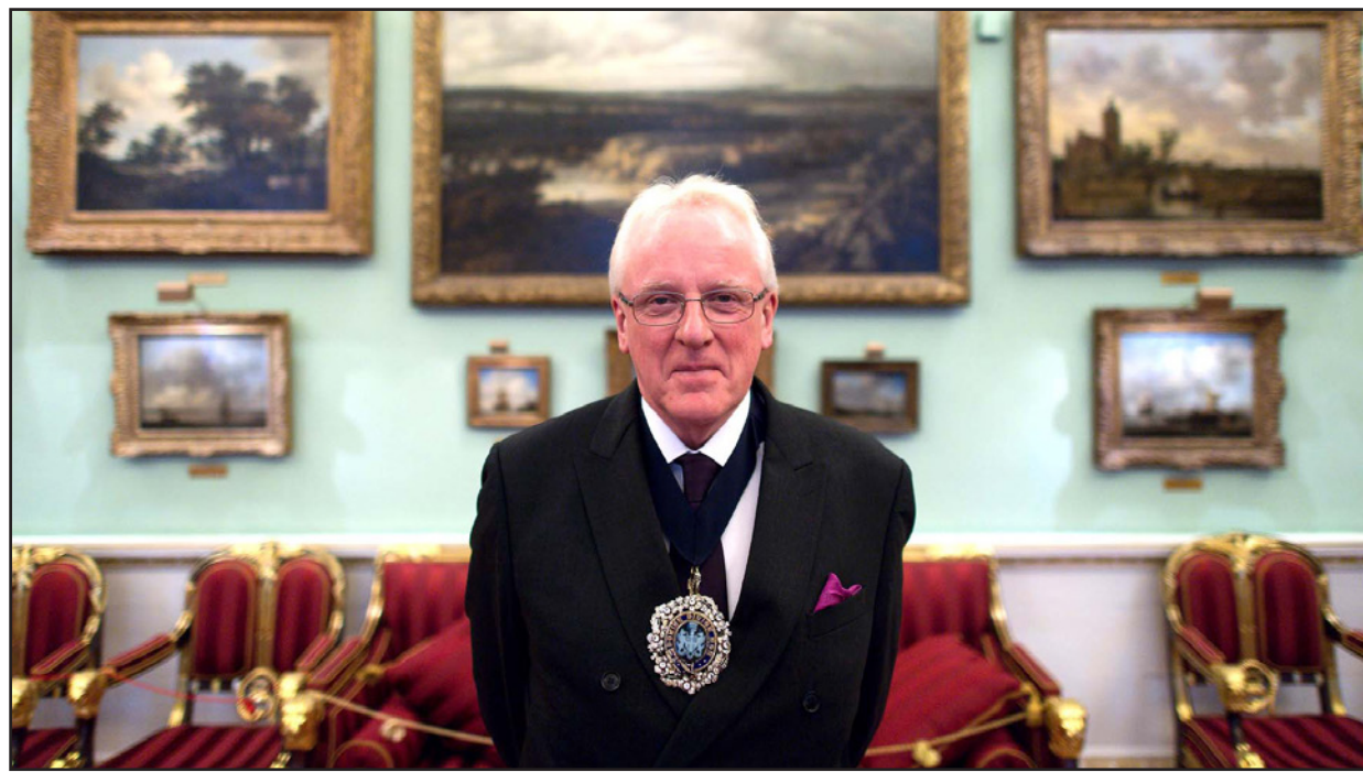
اندرو بارملي رئيس «هيئة مدينة لندن»

ان هذه المدن لا يمكنها منافسة لندن سيعتري لا سيما في منشآت المنتجين التحتية.