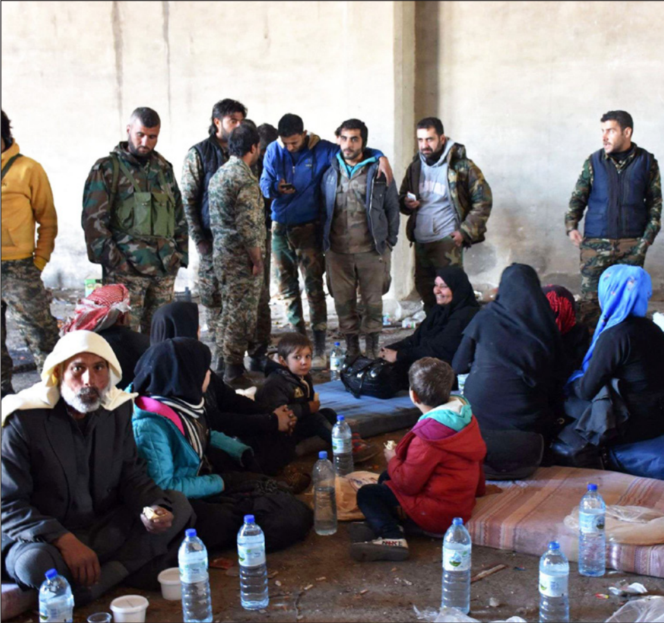
أسر سورية نازحة في مخيم في مناطق سيطرة النظام في حلب

التي قالت مصادر أمنية وطبية إن انفجاراً مز أحد الشوارع في بلدة الراعي بشمال سوريا أمس الأحد فيما يعتقد أنه تفجير انتحاري نفذته تنظيم الدولة الإسلامية وإن 12 مصابا أغلبهم من الأطفال نقلوا لمستشفى تركي. ولم تتوفر تفاصيل إضافية على الفور لكن وكالة