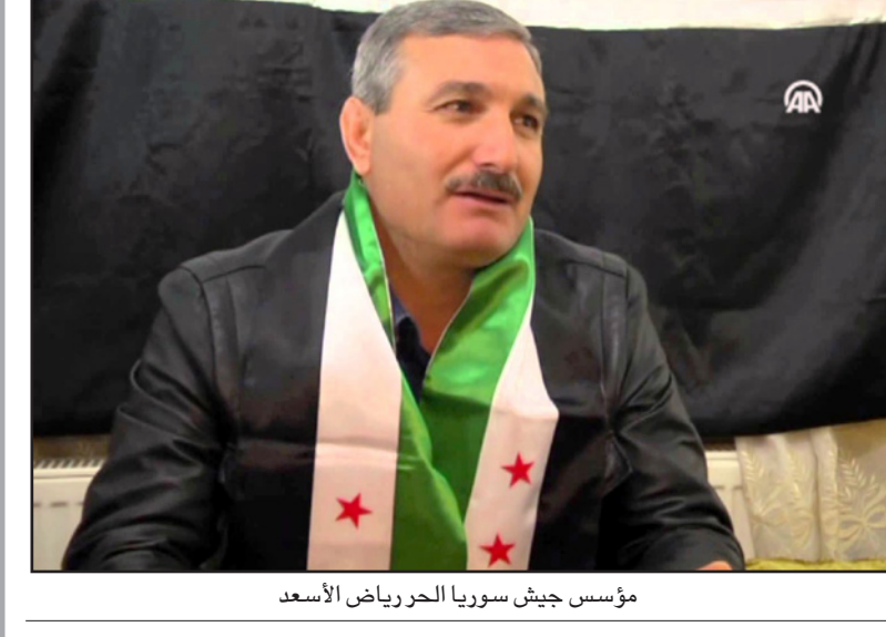
مؤسس جيش سوريا الحر رياض الأسد

الاقتصادية التي تشمل الوجبات الساخنة والمواد الاساسية والفرصة للخروج من القرى والعمل في الاراضي. وتوسع روسيا في توسيع وقف اطلاق النار من اجل التوصل الى وقف شامل لاطلاق النار يهدد الطريق أمام استئناف المفاوضات السياسية. هذه المجالس تحظى بمساعدة منظمات خيرية، وتمويل المليشيات التي تسيطر على هذه المناطق، سواء اقليتها مستقلة أو بقوة تعمل تحت رعاية روسيا. وهكذا يسيطر الاسد على المزيد من المناطق، ويمنع تسلل قوات داعش أو جبهة احتلال الشام. وهكذا ايضا تستطيع القوات السورية والروسية التركيز على المعركة الاساسية على مدينة حلب، لأن السيطرة عليها هي التي ستسمح هذه الحرب.