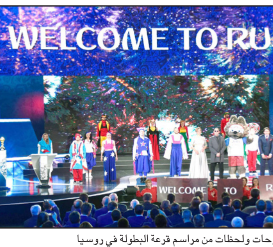
لوحات ولحظات من مراسم قرعة البطولة في روسيا