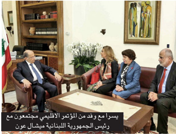
يسرا مع وفد من المؤتمر الإقليمي مجتمعون مع رئيس الجمهورية اللبنانية ميشال عون

الرئيسية وبالأخص الأشخاص الذين يستخدمون المخدرات بالحقن». وأضافت: «إنّ أردنا القضاء على فيروس نقص المناعة في المنطقة علينا إنهاؤه أو لى الفئات السكانية الرئيسية». ورأت «أنّ الأشخاص الذين يستخدمون المخدرات يواجهون مشكلة صعبة عامة، وهؤلاء يستحقون حلولاً صحية شاملة»، مشيرة إلى أنّ نسبة انتشار فيروس التهاب الكبد الوبائي «ج» هي أعلى من نسبة فيروس نقص المناعة البشري في معظم أرجاء المنطقة»، مشددة على «ضرورة إعطاء الأولوية في عملنا لصحة وحقوق الفئات السكانية الرئيسية».