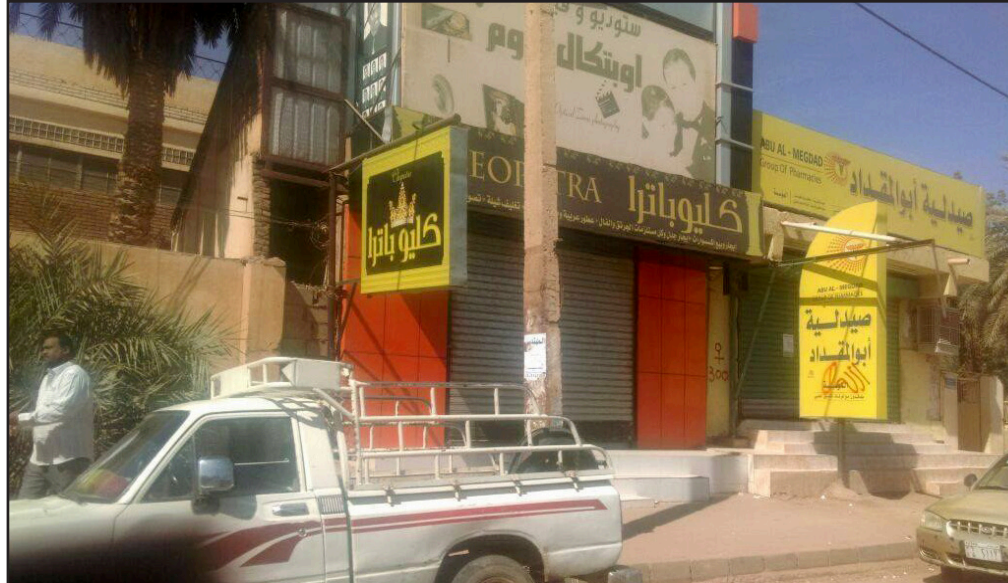
مجال تجارية مغلقة صباح أمس في الخرطوم

كل قيادات الأحزاب لأن هنالك آليات جديدة وبديل غير تقليدية لتوصيل رأي الناس والتأثير على مجرى الأمور كما هو حادث الآن. ونظم ناشطون حملة رفض واسعة لزيادات أقرتها الحكومة على أسعار الدواء بنسبة فاقت 200% لكن وزارة الصحة أصدرت قراراً بإلغاء أسعار الدواء الجديدة، وقال الوزير في مؤتمر صحفي الجمعة إن قائمة جديدة لأسعار للشارع بعد 27 سنة من التعالي والسفور على حد تعبيره، وفي الجانب الآخر يرى أن الشعب السوداني استطاع توصيل صوته للحكومة بشكل مباشر دون اتهامه بتنفيذ أجندة المعارضة كما كان يحدث دائماً. ويصف وداعة ما حدث من تراجع ولو جزئي في موضع أسعار الدواء بأنه كان بسبب رفض واسع عبر مواقع التواصل الاجتماعي في داخل السودان وخارجه الأمر الذي يؤكد أن هذا العالم الافتراضي أصبح يؤثر بشكل مباشر على الواقع. ويقول إن الأجيحة الأمنية استبقت كل هذه الأحداث باعتقال مجموعة كبيرة من قادة الأحزاب والناشطين، لكن ما حدث يؤكد أن مساعي الحكومة سوف تخيب في كبح جماح المواطنين حتى لو اعتقلت