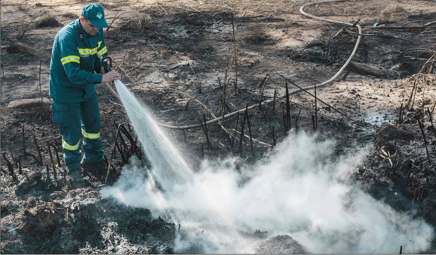
رجل إطفاء يشارك في إخماد الحرائق

الإصلاح الشامل في منظومة إطفاء الحرائق لا يزال من المبكر تلخيصها.. وفي ظل محاولات تنتهاها صرف الأنظار عن فضائحه الجديدة بإشعال حرائق الكراهية بين اليهود والعرب، أن «الحكومة الإسرائيلية وأزعر الإنقاذ فيها، فشلت في توفير الرد المناسب للحرائق». وتابعت «هذا لا يعني التقليل من التقدير للجهود الجبارة والشجاعة التي تحلّي بها محاربو النار، وقوات الشرطة والتطوعون، الذين يخاطرون في بعض الأحيان بحياتهم من أجل إنقاذ المواطنين والأموال». وشددت على أن «الفجوة بين جدية ومهنية الجهات التي تعمل في الإنقاذ، وبين أولئك الذين يسمنون قادة، كبيرة ومثيرة للغضب، وأضاف أن هذه الفجوة هي التي تغذي الآن السباق للعنصرية على متهين يتم تحميلهم المسؤولية، ويحرفون الرياح الساخنة عن وجوه المسؤولين الحقيقيين إلى المشبوهين الاعتياديين»، ولفقت إلى أن «نتنياهو، سارع إلى تحديد الهدف، بقوله: يجب علينا الاستعداد لنوع جديد من الإرهاب، إرهاب الحارقين. كما أن القائد العام للشرطة روني الشيخ، يملك نظرية مرتبة، حيث قال إنه يمكن الافتراض بأن الحرائق ناجمة عن دافع قومي، وطبعاً، كما هو معروف، فإن الدوافع القومية والإرهاب متوفرة فقط لدى نوع واحد من الجمهور، وهم المواطنون العرب في إسرائيل والفلسطينيون، هؤلاء، حسب أقوال نقاليين، لا تتبع البلاد لهم، ولذلك هم فقط بمعنهم إرهاباً»، وأشارت الصحفية بضباط الشرطة الكبار ممن كانوا أكثر حذراً في توجيه اتهامات مشابهة، وخلصت إلى أنهم يعرفون جيداً، كما يبدو، ليس فقط أنه لا يوجد ما يبرر الإسراع في تحديد الأهداف، وإنما في الأساس، إن مثل هذه الاتهامات غير المسؤولة، من شأنها إشعال حرائق أخطر بكثير، لن تنتج أي (سورياتنكر) في إخمادها».