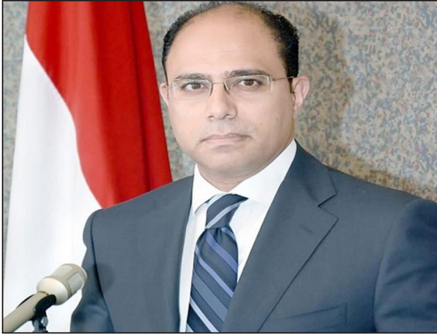
المستشار أحمد أبو زيد

وأكد «على التزام مصر بعمد عدم التدخل في الشؤون الداخلية للدول». وأضاف: «هناك إجراءات دستورية وقانونية ينبغي اتخاذها قبل إرسال أي جندي أو معدة مصرية خارج حدود الدولة». وأوضح المتحدث أن «تلك الإجراءات لا تتم في الخفاء أو دون إعلام الشعب المصري بأهداف أي خطوة من هذا القبيل».