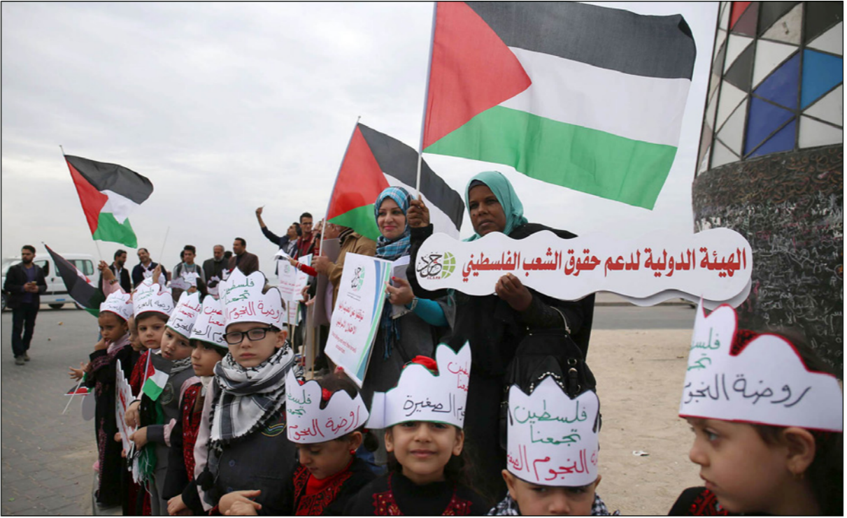
أطفال فلسطينيون يحيون اليوم العالمي في غزة