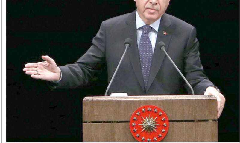
رجب طيب اردوغان

وقعت خلال الأشهر التسعة من العام الحالي، وكان مواطنونا الأتراك الضحية الأكبر لذلك الاعتداء». وأشار إلى أن المجتمع الغربي يرى اللاجئيين كتهدية لمستوى رفاههم الموجود، في وقت تستقبل تركيا أكثر من 3 ملايين، ولا تراهم كذلك، وأضاف «المجتمع الغربي يعتبر 100 شخص أو 200 أو 300 خطرًا عليه، حيث بدأت سياسات العداء ضد المهاجرين والأجانب، تأسر حكومات تلك البلدان». وحول القصة أعرب أردوغان عن أمله في أن تواصل قمة البوسفر التي تعد وسيلة للتعاون ما بين بلدان المنطقة، والقطاع الخاص، انعقادها في السنوات المقبلة. وشارك في القمة، رئيس جمهورية شمال قبرص التركية مصطفى أقينجي، والرئيس الألباني «بوجار نيشاني»، إضافة إلى نائب رئيس الوزراء التركي محمد شيمشك، ووزير التنمية لطفي ألوان. تجدد الإشارة إلى أن جرائم الكراهية الناجمة عن التمييز والتعصب ضد المسلمين في أوروبا، خلال 2015، وصلت إلى مستويات مثيرة للقلق، بحيث بلغت نحو خمسة آلاف و811 جريمة في عدد من الدول الأوروبية، حسب تقرير صادر عن «مكتب المؤسسات الديمقراطية وحقوق الإنسان» التابع لمنظمة الأمن والتعاون في