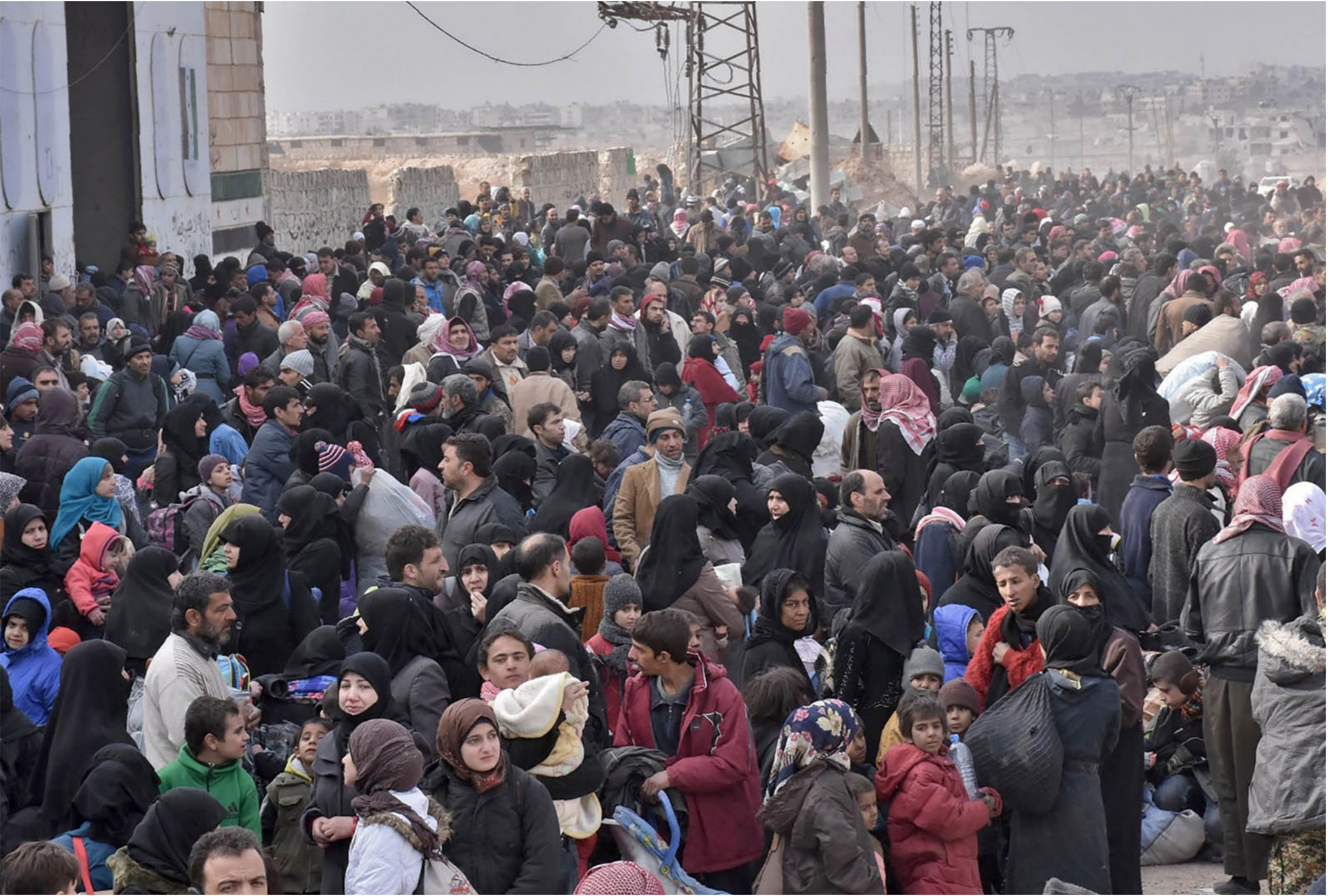
عائلات سورية نازحة من شرق حلب في انتظار نقلهم الى مناطق امته غرب المدينة