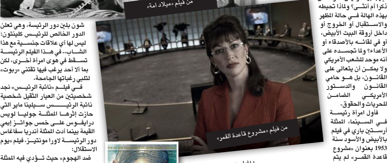
من فيلم «ملياد أمة»

للجنس وللضجاعة والإلهاء، بل شخصية قادرة على اتخاذ القرارات الصعبة تغلب عواطفها من أجل إنجاح الكثير من الظروف الصعبة والقرارات السياسية المهمة التي تضع حياتها في مفترق الطرق وتضع عفة البلاد قاب قوسين أو أدنى من الانهيار. تصور السينما الأمريكية الرئيسة كصانع للسلام ومحاربة للتطرف والإرهاب، بل تعيش لحظات قاسية تتعاطف فيها، تعذب وتواجه بالندف وتحتم الفيتنامي هوشي منه في آخر صورة، يمكن أن نتذكر في هذا الحظ المفاد العناوين الكبيرة التي قدمت الذاكرة عن ذاك الطفل الفوق 22-ذي غدا أفضل جهده ونكاته مع حاميا لامعا قادراً على أن يقود الأمة الأمريكية، في لحظة انفصال بين الشمال والجنوب، وفي لحظة حرب أهلية أن يوحد الأمة التي ذافت ويلات الحرب.