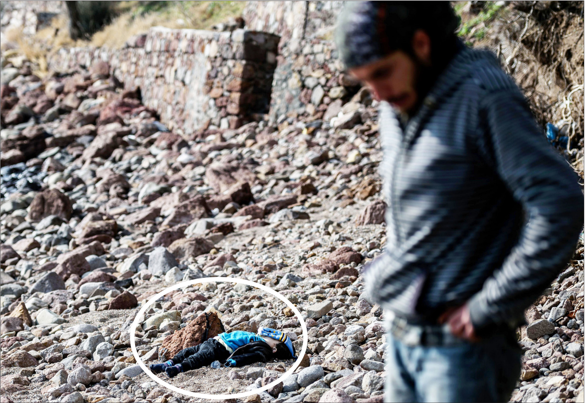
مشهد مأساوي لطفل قضى نحبه خلال قصف النظام لحلب

لحي جبل بدرو والصاخور الاستراتيجي اللذين خسرتهم الفصائل أمس الأول. وتكررت صحيفة «الوطن» السورية القريبة من دمشق في عددها أمس الثلاثاء أن الجيش بدأ الأثنين «المرحلة الثانية من عملياته العسكرية الهادفة إلى تحرير الأحياء الشرقية من حلب باقتحام «الأحياء الجنوبية منها».