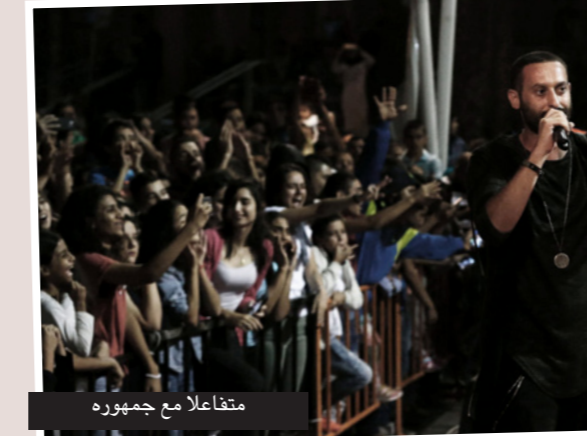
متفاعلاً مع جمهوره