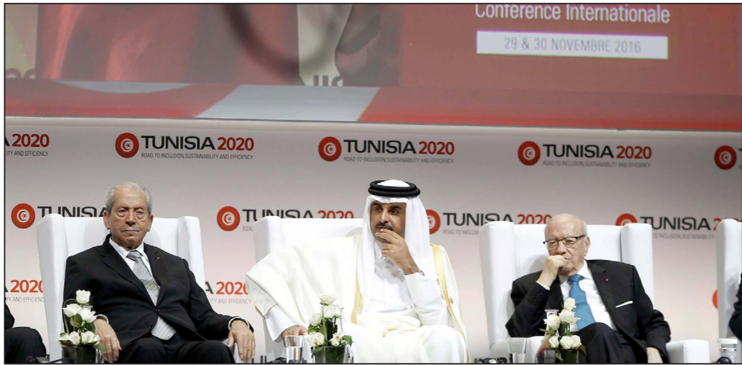
أمير قطر يتوسط رئيس تونس ورئيس مجلس نوابه

■ تونس - وكالات - قالت قطر أنها ستقدم مساعدات بقيمة 1.25 مليار دولار لدعم الاقتصاد التونسي، في حين تعهد شركاء إقليميون وغربيون بتقديم دعم مالي واسع في مؤتمر للاستثمار بدأ في العاصمة تونس أمس الثلاثاء.