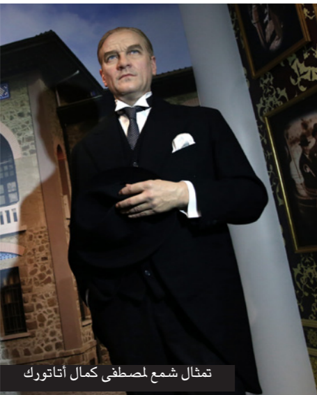
تمثال شمع لمصطفى كمال أتاتورك