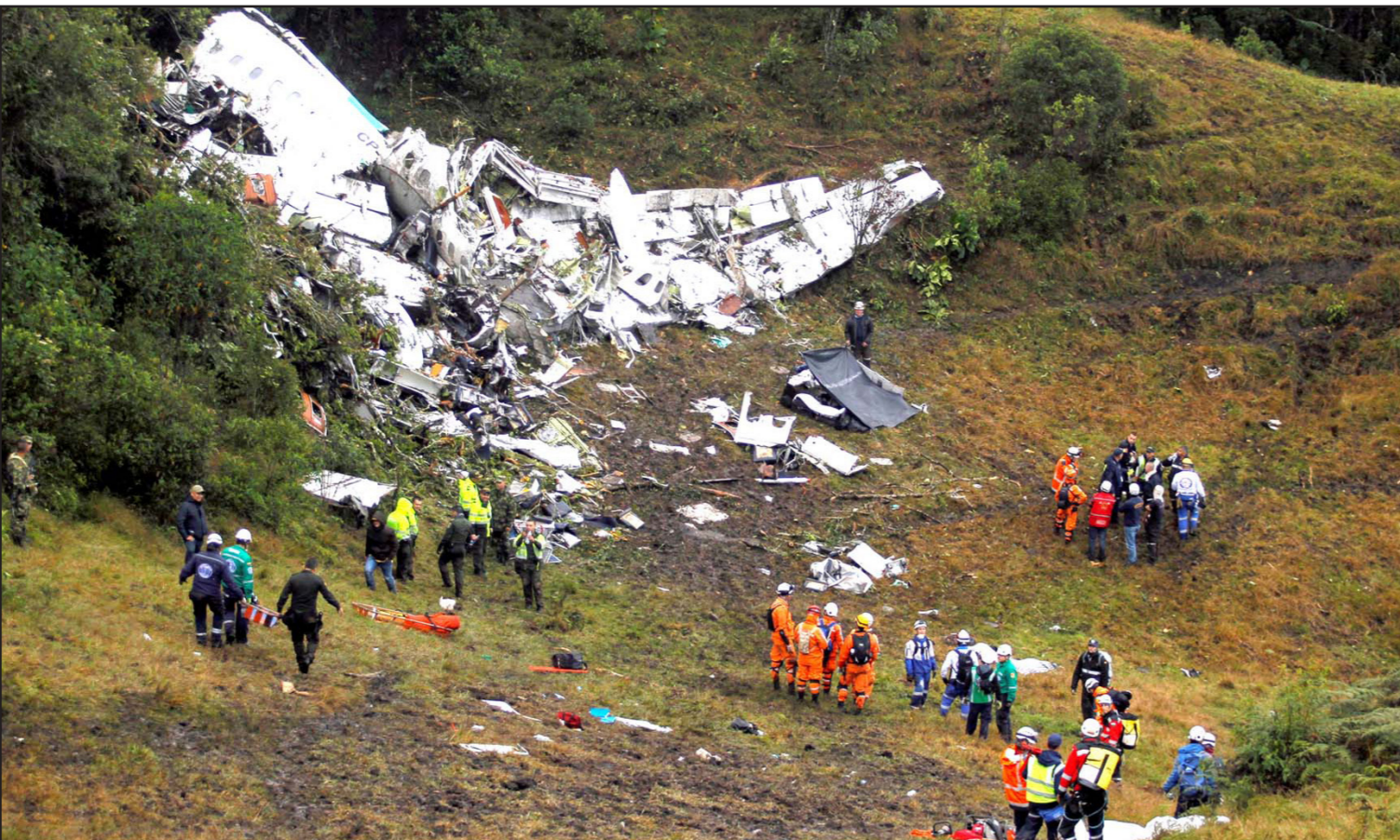
جزء من حطام الطائرة المنكوبة ورجال الإنقاذ الذين انتشلوا الجثث والجرحى

المزيد من المعلومات من السلطات الكولومبية. وتحطمت الطائرة في منطقة جبلية خارج مدينة ميديين وفي وقت ما تسببت الأمطار الغزيرة في توقف عمليات الإنقاذ. وقالت خدمة «فلايت رادار 24» على «تويتر» إنها تلقت آخر إشارة من الرحلة رقم 2933 عندما كانت الطائرة تحلق على ارتفاع 15500 قدم على بعد نحو 30 كيلومترا من وجهتها، وكانت الطائرة المستأجرة تقل 72 راكبا وطاقم من تسعة أفراد عندما تحطمت حوالي الساعة العاشرة والربع مساء بالتوقيت المحلي مساء الاثنين. وقال مسؤولون لوسائل الإعلام المحلية إنه سيجري انتشال الجثث مع بزوغ الشمس، وذكرت منظمات إخبارية برازيلية أن 21 صحافيا كانوا على متن الطائرة. وأعاد الحادث للأذهان كارثة ميونخ الجوية عام 1958 عندما لقي 23 شخصا حتفهم، بينهم ثمانية من لاعبي فريق مانشستر يونايتد الإنجليزي وصحافيين ومسؤولين. وقال الاتحاد الدولي لكرة القدم (فيفا): «قلوبنا مع عائلات ومشجعي لاعبي فريق شابيكوينسي والمنظمات الإعلامية في البرازيل في هذا اليوم المأسوي».