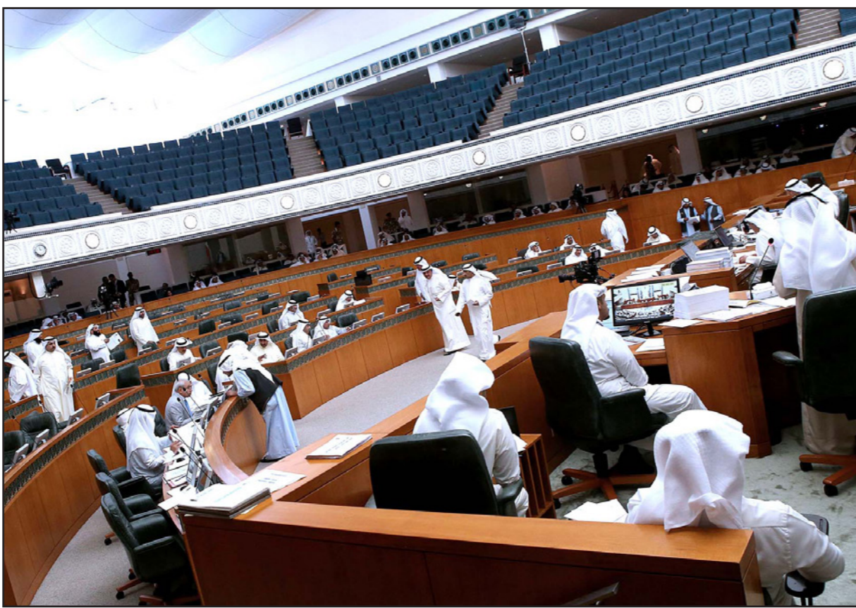
جانب من جلسة سابقة لمجلس الأمة الكويتي

أي من الجالس مدته الدستورية البالغة أربع سنوات.