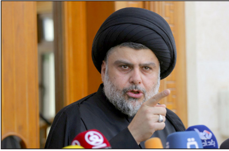
السيد مقتدى الصدر

ونكرت رسالة الصدر، مجموعة من الاقتراحات والمقترحات التي تقدمها بعض الفصائل، وذكروا أنها لا تتواءم مع أهداف الدولة، وأنهم لن يوافقوا على أي اقتراح يهدد أمن العراق أو يهدد وحدة أقاليمه، وأنهم لن يوافقوا على أي اقتراح يهدد أمن العراق أو يهدد وحدة أقاليمه، وأنهم لن يوافقوا على أي اقتراح يهدد أمن العراق أو يهدد وحدة أقاليمه.