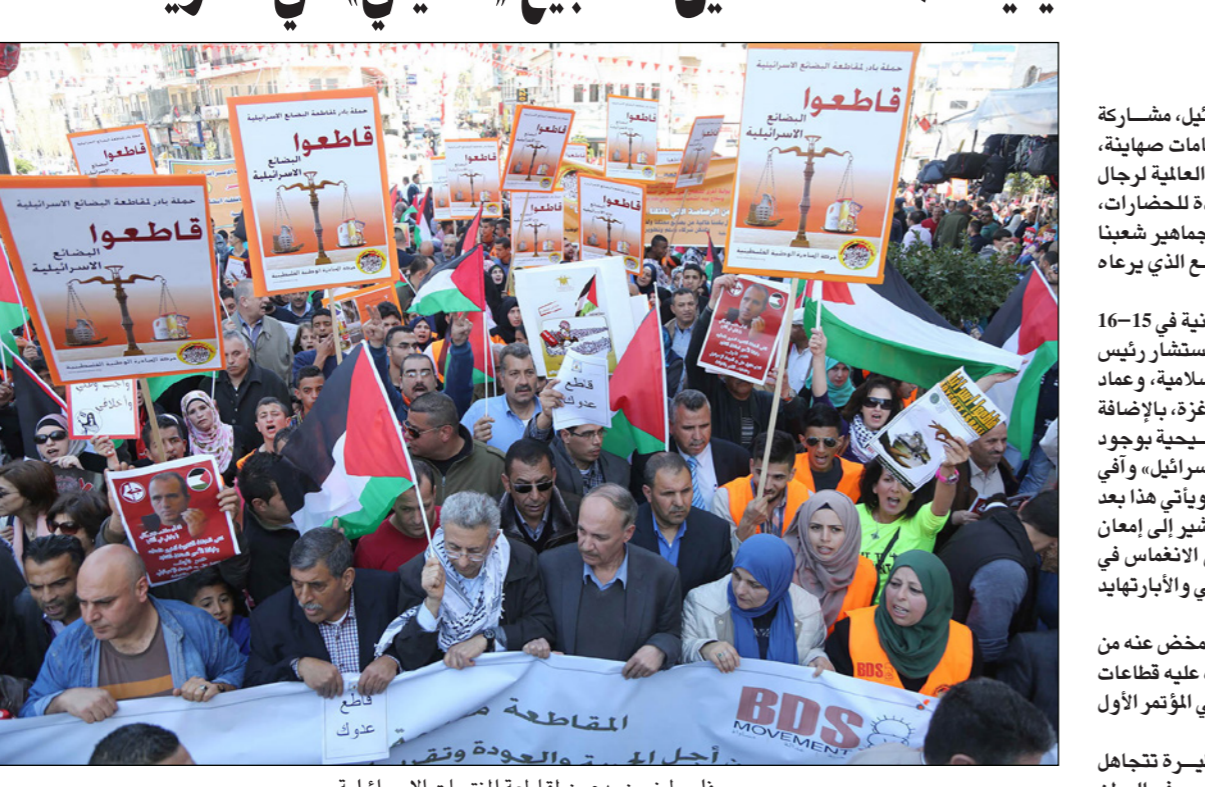
فلسطينيون يدعون لمقاطعة المنتجات الإسرائيلية

شعبنا الفلسطيني العادل نحو حقوقنا غير القابلة للتصرف، وعلى رأسها الحرية والعودة وتقرير المصير. ودعت اللجنة الوطنية للمقاطعة، وهي أوسع تحالف في المجتمع الفلسطيني يقود حركة المقاطعة BDS، الشعب الفلسطيني بمختلف قواه وتجمعاته إلى التصدي بحزم لتسلسل التطبيع مع إسرائيل، والذي لم يجلب إلا خراب بينما ساهم في تغطية جرائم الاحتلال الإسرائيلي.