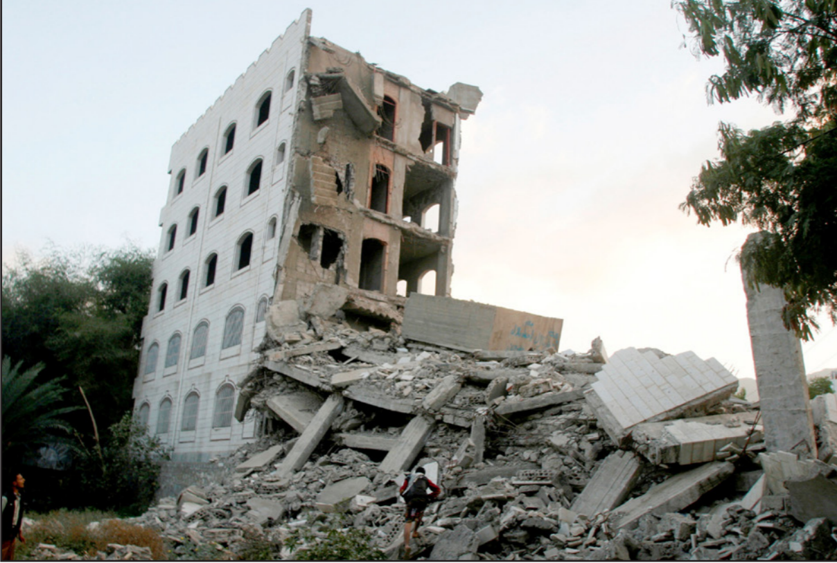
آثار دمار على منزل فجره الحوثيون في مدينة تعز جنوب غرب اليمن