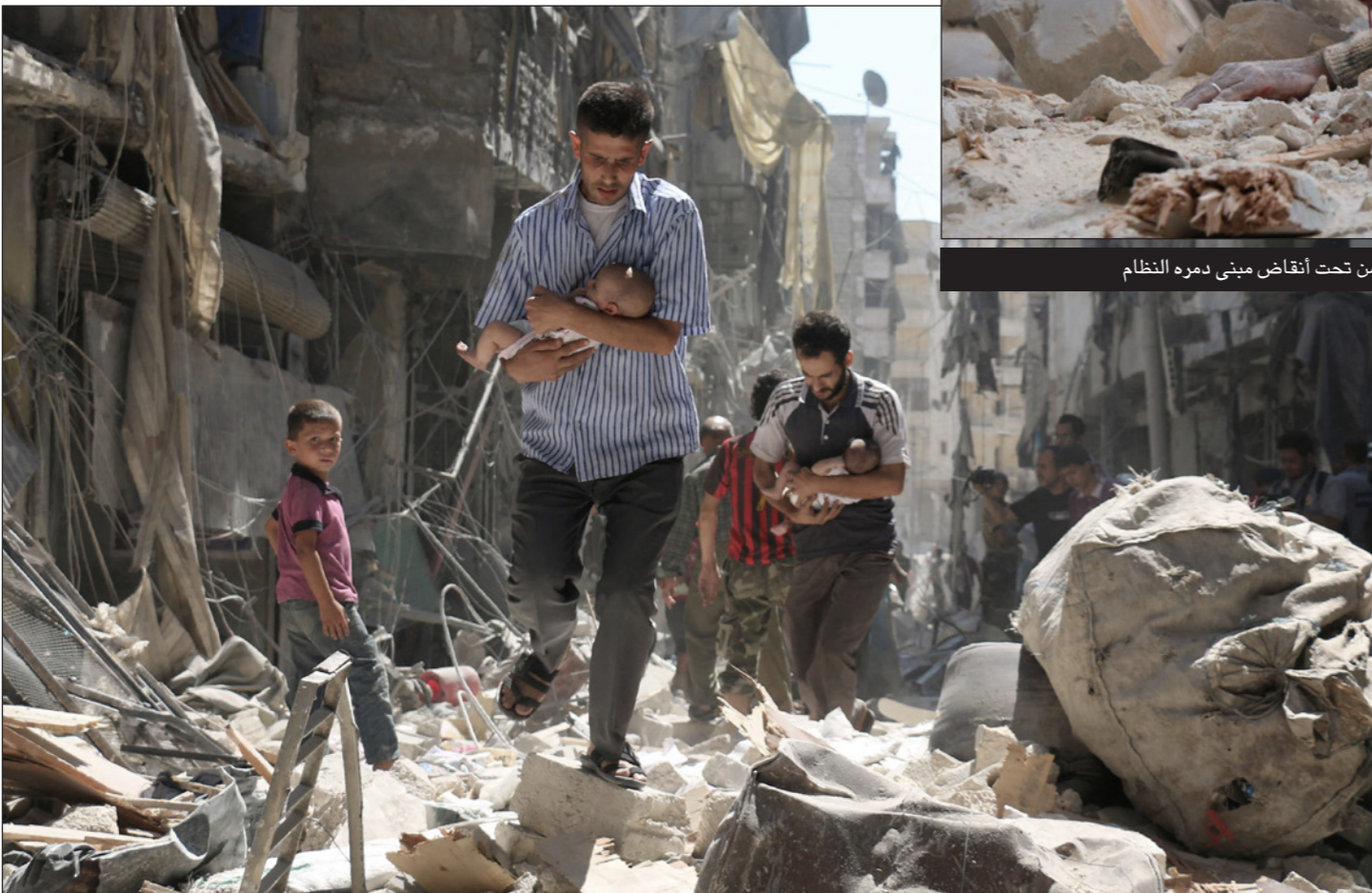
مدنيون سوريون يحملون أطفالهم ويشقون طريقهم وسط الدمار