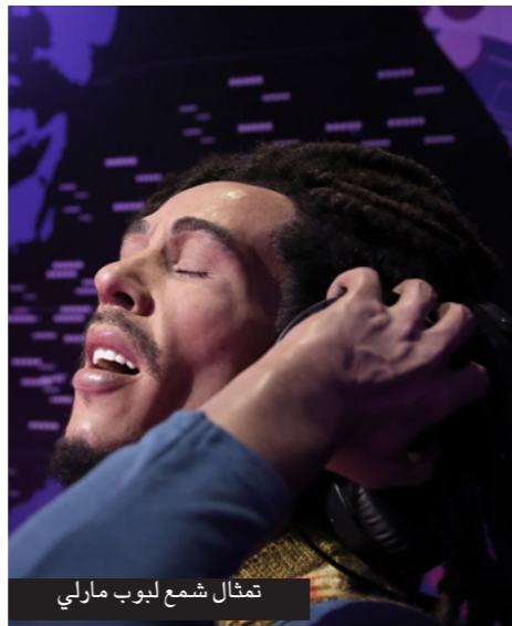
تمثال شمع ليوب مارلي

سرعان ما أصبحت مدونة هيجنس المعروفة باسم براون موزيس من أهم المصادر التي تعتمد عليها وسائل الإعلام في العالم بشأن الحرب في سوريا. كما أصبح الصحافي البريطاني مدونين وصحافيين آخرين مقالات عن سوريا وأوكرانيا وليبيا وغيرها من أماكن النزاعات وذلك عبر موقع بيلينج كات حيث نشر فريقه على سبيل المثال تقارير حمل فيها المسؤولية للقوات الروسية في إسقاط طائرة ركاب «أم أنش 17» فوق الأراضي الأوكرانية واعتمد في ذلك على مراجع منها صور نشرت على مواقع للتواصل الاجتماعي. أوضح هيجنس أن «أصبح شيء هو التعامل مع حجم المعلومات الموجودة على الإنترنت» وقال إن نحو 300 مقطع مصور عن سوريا ينشر يوميا على موقع «يوتيوب» وأنه كان يضطر في سبيل جمع هذه المقاطع وتصنيفها إلى نسخ وربطها أولاً ولا وضعا في قائمة خاصة وأن هذا كان يتطلب منه عملاً شاقاً وكان من الصعب الإلمام بنتائج التصنيف. كما أوضح الصحافي البريطاني أن تطبيق مونتاج الخاص بشركة «جيجسو» -سرع من عملية التصنيف وسهّلها حيث جعل هذا التطبيق على سبيل المثال كتابة تقارير عن هجمات الغاز السام في منطقة الغوطة السورية في آب/ أغسطس عام 2013 أمراً بسيطاً للغاية بعد أن كانت مقاطع الفيديو العديدة بهذا الشأن متضاربة ويصعب الإحاطة بها حيث ساعد برنامج مونتاج في تسهيل فرز هذه المقاطع وافتقائها وتحليلها «فيلست هناك أداة مشابهة لهذا التطبيق».