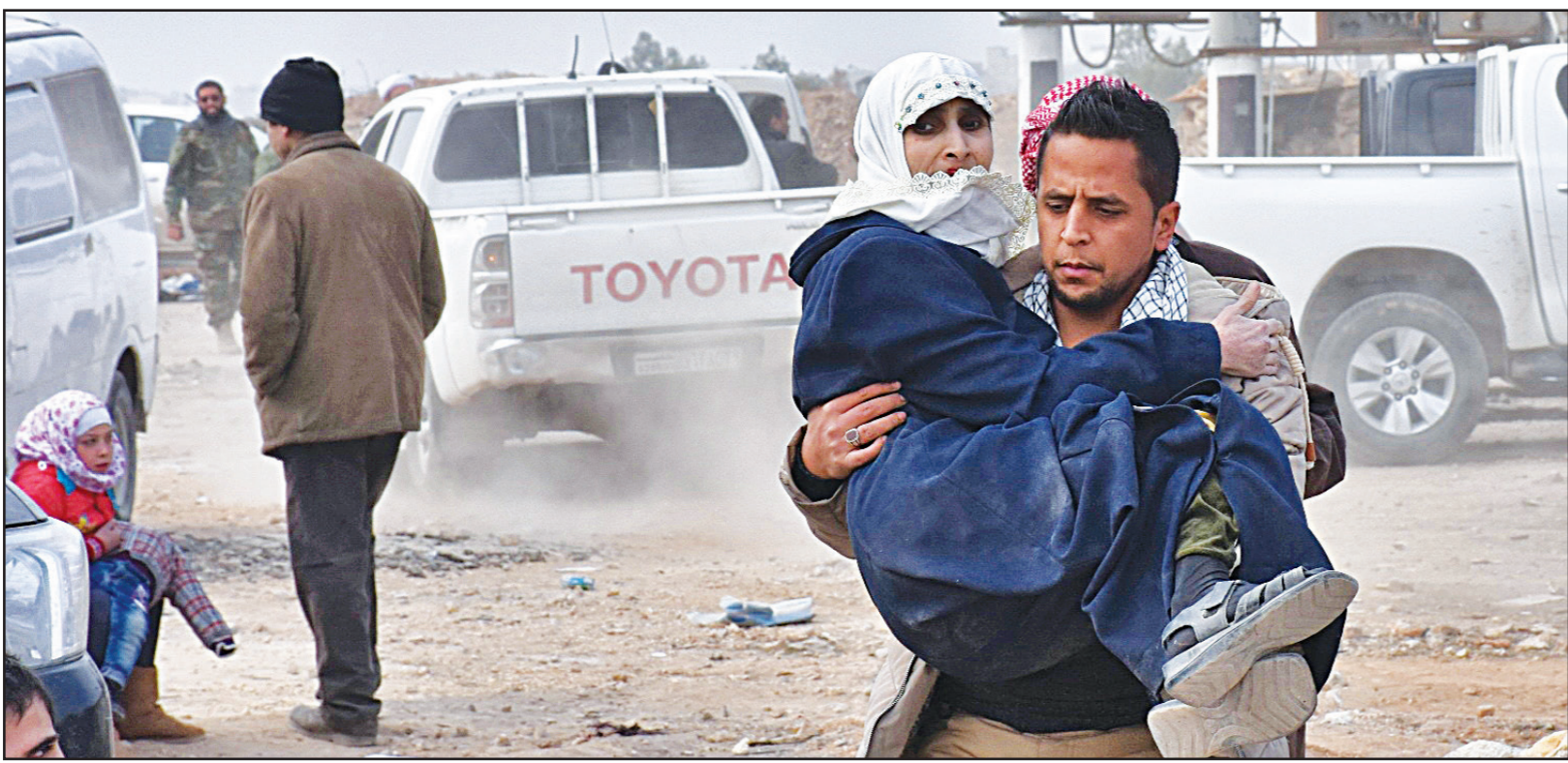
شاب يحمل امرأة نازحة من شرق حلب في انتظار وصول حافلات لنقل الغارين من القصف أمس