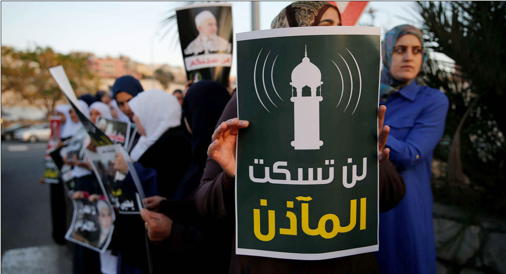
فلسطينيات يرفعن لافتة تدعو لوقف قانون التآذن

وكانت الإدارة المدنية التابعة للاحتلال، قد نشرت قبل عدة أسابيع قائمة بأرقام حوالي 35 قسيسة يجري فحص ما إذا كانت «أملاك غائبين» وامتنت المستشار القانوني عن تحديد موقف