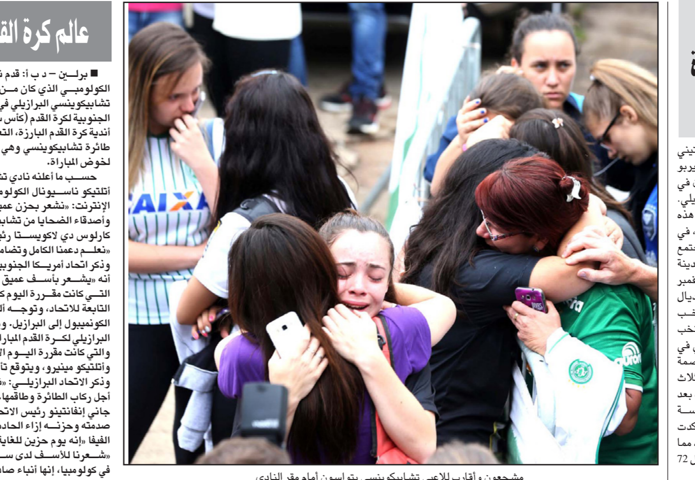
مشجعون وأقرب لاعبي شابيكوينسي يتواسون أمام مقر النادي

بوينس آيرس - د ب أ: استخدم المنتخب الأرجنتيني لكرة القدم، بقيادة النجم ليونيل ميسي، قبل ما يربو على أسبوعين الطائرة، التي تحطمت مساء الاثنين في كولومبيا وكان على متنها فريق شابيكوينسي البرازيلي. وكان ادغاردو باوزا، مدرب الأرجنتين، استقل هذه الطائرة برفقة سبعة لاعبين وأعضاء جهازه الفني، في رحلتهم إلى مدينة بيلو هوريزونتي البرازيلية. واجتمع المدرب الأرجنتيني مع باقي لاعبي فريقه في هذه المدينة لمواجهة البرازيل في العاشر من تشرين الثاني / نوفمبر الجاري في تصفيات أمريكا الجنوبية المؤهلة لمونديال روسيا 2018. وانتهت تلك المباراة بخسارة منتخب الأرجنتين صفر/3 أمام غريمه التاريخي. وعاد المنتخب الأرجنتيني بكامل نجومه بالإضافة إلى ميسي في الطائرة ذاتها، التابعة لشركة لاميا البوليفية، إلى العاصمة الأرجنتينية بوينس آيرس، في رحلة تأخر إقلاعها ثلاث ساعات. وكانت الشرطة الوطنية الكولومبية أعلنت بعد وقوع الحادث أن عدد الضحايا بلغ 76 شخصا وخمسة جرحى. ولكن هيئة الطيران المدنية في كولومبيا أكدت بعد ذلك بقليل أن ستة أشخاص نجوا من الحادث، مما يعني وفاة 75 شخصا. وكانت الطائرة المنكوبة تحمل 72 مسافرا وتسعة أفراد من الطاقم.