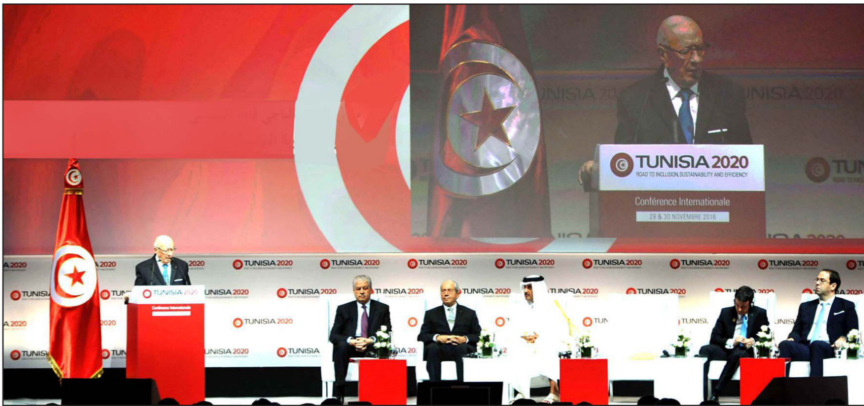
جانب من مؤتمر الاستثمار الدولي في تونس