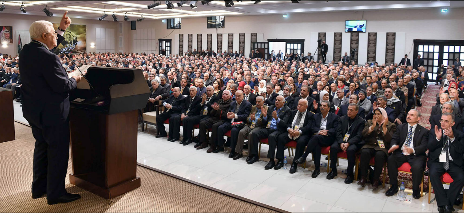
عباس يلقي كلمة خلال مؤتمر فتح أمس

والاستقلال وما زالوا ينتظرون أن تحتل عيون الوطن بالقدس العاصمة الأبدية، أنتم اليوم تؤسسون لحقبة أكثر قوة وأكثر رسوخاً في مسيرة حركتنا الرائدة، وتؤكدون ذات مبادئ الإنطلاقة الأولى، تلك التي كانت للفلسطين وحدها، فلسطين التي هي أكبر من كل شيء، وفيل كل شيء، وفوق كل شيء»، وتابع: «أنتم الآن تؤكدون بوجودكم هنا وبإصراركم الملتزم على التشبيث بفتح والتمسك بها، وبرنامجها الوطني، ومضحا أن «فتح ستبقى غلاية، ولن يتوقف تيارها الهادر قبل أن تتحقق أهدافها محمود أبو الهيجا بكمالات ثورية في حق الحركة، وجاء انتخاب عباس، حسب ما قال عضو اللجنة المركزية السابق، سليم الزعنون، بناء على توصية أجمعت عليها اللجنة المركزية في اجتماعها الأخير، الليلة قبل الماضية في مقر الرئاسة في رام الله، بترشيح عباس إلى هذا المنصب الذي يحلته منذ خلافته للرئيس الراحل ياسر عرفات، في تشرين الثاني/ نوفمبر 2004.