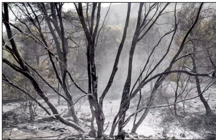
الحرائق انتهت مخلقة دمارا هائلا في الممتلكات في إسرائيل وفلسطين

والأهم من ذلك، القدرة على الحفاظ على مراعاة الشاعر الإنسانية. أنا أعترف: أخطأت عندما كنت وزيرا للمالية، غلبت بنيت حسنة وإيمان كامل بأن إسرائيل يجب عليها أن تقتصد في النفقات