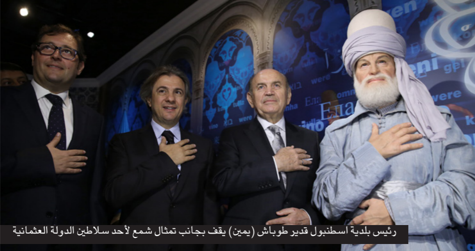
رئيس بلدية اسطنبول قدير طوباش (يمين) يقف بجانب تماثيل شمع لأحد سلاطين الدولة العثمانية