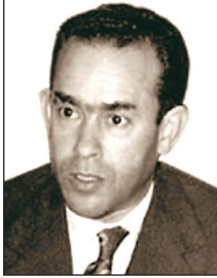
المهدي بن بركة

استبدل الأبرياء التي تستعملها هذه الطائرات باعيرة أخرى تستعمل في التدريبات؛ وذلك من أجل إحداث ثقب في الغطاء الخارجي للطائرة وليس تفجيرها. وواصل سرد المعطيات التاريخية التي توصل إليها، وهي أن أوفقيير كان يريد تأسيس ملكية دستورية مع صلاحيات محددة للملك، بينما كان كل من عبد الرحمن اليوسفي والفقيه البصري يفكران في التخلص من الملكة. أوفقيير كان ليدي الحسن الثاني بروحه». وقال إنه، من خلال حديثه مع عملاء في جهاز الموساد الإسرائيلي حول لغز مقتل المعارض بين بركة، وتبين له أن المخابرات الإسرائيلية لا علاقة لها بمقتل بين بركة، كما أن الحسن الثاني «لم يكن يفكر في قتله، ولذلك أرسل مستشاره رضا كديرة من أجل إقناعه بالعودة إلى المغرب، والمتورط في مقتله هو الزجج به في هذه القضية.