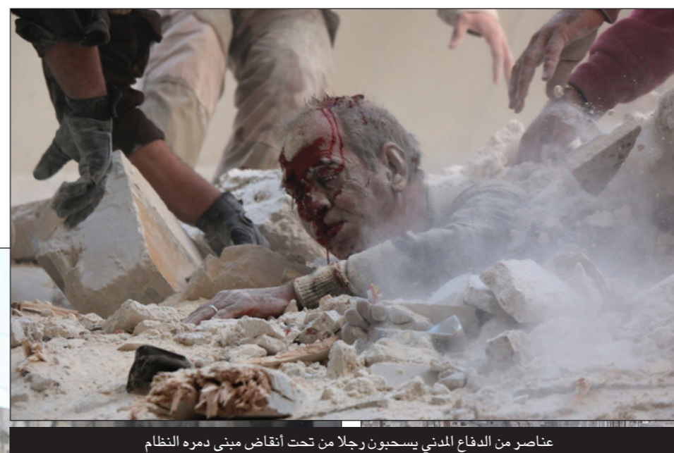
عناصر من الدفاع المدني يسحبون رجلاً من تحت أنقاض مبنى دمره النظام

وأحصى المرصد الثلاثاء فرار أكثر من سبعة آلاف مدني إلى حي الشيخ مقصود ذي الغالبية الكردية وأكثر من خمسة آلاف إلى مناطق تحت سيطرة قوات النظام، بعد حصيلة سابقة