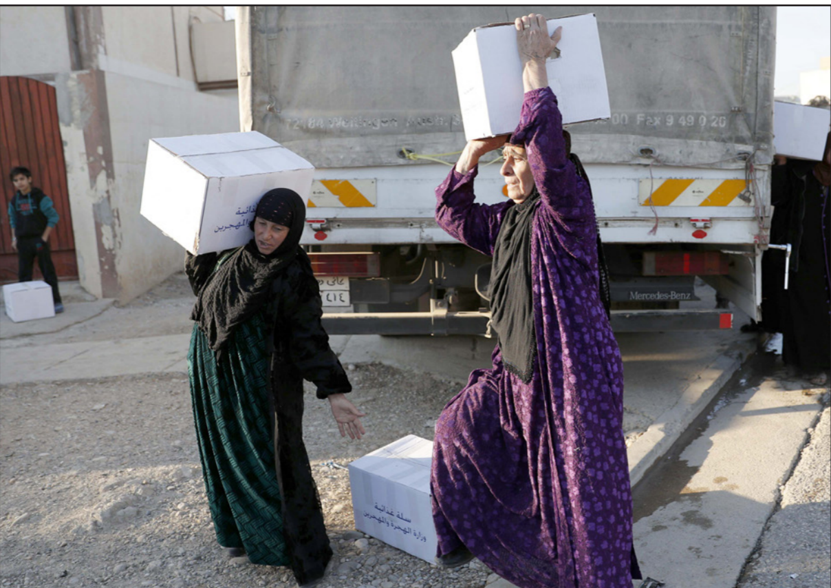
عائلات عراقية تتلقى الإعانات في الموصل

متشدد متحصنين وسط المدينين لتعطيل الغارات الجوية ويقاومون تقدم القوات بسيارات ملغومة يقودها انتحاريون وقناصة وقذائف مورتر مما يؤدي إلى سقوط قتلى من المدينين أيضاً. وقالت منظمة هيومن رايتس ووتش الدافعة عن حقوق الإنسان إن أس غارة جوية تستهدف مقاتلين من تنظيم الدولة الإسلامية أصابت مستوصفاً إلى الجنوب من الموصل يوم 18 تشرين الأول/أكتوبر مما أسفر عن مقتل ثمانية مدينين على الأقل.