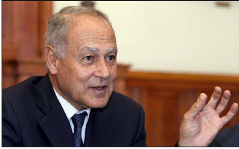
السفير أحمد أبو الغيط

وأشار إلى أنه من شروط الحل في سوريا حكومة توافقية من النظام والمعارضة لفترة معينة، وأن المشكلة مستمرة لبعض الوقت، وأن المنفعة الأمتة في سوريا لا يمكن أن تحدث، وأن روسيا لن تقبل بفرض حظر الطيران لأنها تسيطر على سماء سوريا. وأضاف أن من يعتقد أن الصراع في سوريا وليبيا يمكن أن يحسم عسكرياً فهو واهم؛ مستطرداً بأن الأزمة الليبية أيضاً لن تحسم عسكرياً، ولكن سياسياً، وشدد أبو الغيط على أنه لا بد من وقف القتال في سوريا، ولكن لديه مخاوف من أن هذا القرار قد يساعد المسلحين على الخروج على قري في سوريا. وأضاف أن الجامعة لا تجري أية اتصالات مع رئيس النظام السوري، مؤكداً أن الموقف العربي من الملف السوري هو «إدانة أداء الحكم». وعن ما حدث في «القمعة العربية – الأفريقية» بغينيا في الأسبوع الماضي من حضور جبهة «البوليساريو» القمعة برغم انسحاب تسع دول عربية، احتجاجاً على تمثيلها، أنجى أبو الغيط باللائمة على الاتحاد الأفريقي، متهماً إياه بأنه لم يلتزم بتعهداته للجامعة.