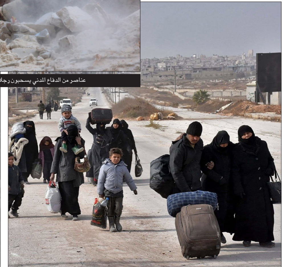
عائلات سورية تهرب من الاقتتال الدائر في حلب