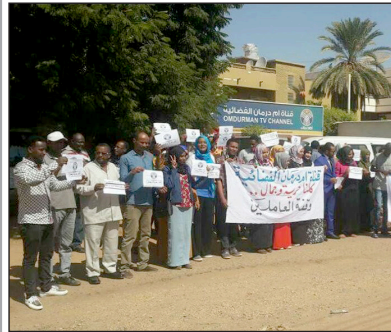
وقفة احتجاجية للعاملين في قناة أم درمان الفضائية

الطبع أصبح نهجاً اعتيادياً وتأتي هذه الهجمة المسعورة تعاقوبة لتكونها غطت أحداث العصيان الشعبي الذي بدأ الأحد وانتهى الثلاثاء، وهي محاولة لإرهاب وتخويف بقية الصحف وممارسة ضغوط على الصحافيين»، وانتهت مجموعة من السودانيين المدافعات عن الحقوق أمس إضراباً عن الطعام تزامن مع الاعتصام المدني وحسب الكاتبة والنشطة أمل هباني فإن النشاطات أعلن عبر هذه المناسبة من مبادرة لخلص الشعب السوداني تطالب برحيل البشير. وتضامن عدد كبير من الإعلام مع الصحف التي تمت مصادرتها وتمهكوا على حديث وزير الإعلام الناطق باسم الحكومة، أحمد بلال عثمان، لقناة (بي بي سي) والذي قال فيه إن مصادرة الصحف يوم الاثنين ليست له علاقة بالصحافيين، وإن السلطات درجت على هذا الأمر قبل بدء العصيان. ورغم أن تاريخ الصحافة السودانية يزيد على القرن، حيث بدأ بصدور صحيفة (السودان) في سنة 1903، لا يوجد قانون يحمي الحريات بصورة واضحة لا يس فيها ويعاني الصحافيون في السودان من تعدد منافع عقابهم بتعدد القوانين الموجودة، فهم يخضعون للقانون العام، قانون الصحافة، قانون الأمن، إضافة لعدم تمكنهم من الحصول على المعلومات، ويُستغل ذلك التعدد في كثير من الأحيان للتضييق والانتقام وتكميم الأفواه وتعرض الصحافيين لتحرقات أمنية بسبب نشرهم للعديد من الموضوعات.