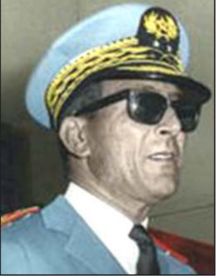
الجنرال محمد أوفقيير