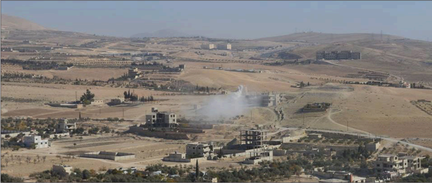
بلدة «التل»

فيما تصدت المعارضة السورية في المدينة إلى محاولات الإحكام التي ترأسها الحرس الجمهوري ومليشيا ربح القلمون، حيث قتلت المعارضة عددا من القوات المهاجمة وأعلنت مذبحة أليات للنظام، بحسب ما أوردته القلمونية. بلدة التل في ريف دمشق تعتبر من البلدا التي وقعت قبل أعوام على اتفاق تهدئة مع النظام، ولم تختلف الهدنة فيها عن بقية مناطق ريف دمشق للأسد، حيث شهدت المدينة تطبيقًا للحصار، وخرقا عسكريًا متكررا، فيما لم يطلق النظام أيًا من معتقلي المدينة، فهل ستلحق مدينة التل برك المدن المهجرة نحو الشمال السوري، هذا ما ستكشفه الأيام القليلة المقبلة.