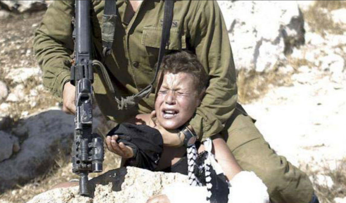
حتى الأطفال لم يفتلوا من عنف الاحتلال الصهيوني

ان مصير الاقلية العربية منوط بالتجربة الإسرائيلية، ومن ينبغي قانونا مختلفا لكل إنسان يعانى من إخساء تروبي، وملقما هي التريبة، كل شيء يبدأ من القيادة، الحاخامون والسياسيون ملزمون بالتوقف عن التحريض، بشكل علني وخفي، وان يشجبوا مظاهر العنصرية، وعلى القيادة العربية، من جهتها ان تتنكر لظاهر الكراهية والشماتة وان تناشد الشبيبة العربية للتطوع للخدمة الوطنية انطلاقا من الفهم بأن الشباب الذي ينضم إلى مقاتلي النازي سيكون سفيرا لناجعا للحرب ضد العنف أكثر من كل شرطي أو مروحية أطفاء.