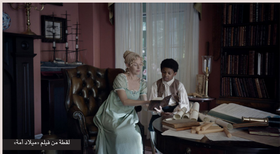
لقطة من فيلم «میلاد أمّة»

الجزائر – من حسام الدين اسلاّم: أعطى فيلم «میلاد أمّة» للمخرج الأمريكي ناث باركر، إشارة افتتاح مهرجان الجزائر الدولي للسینما (أيام الفیلم الملتزم) في طبعته السابعة التي تحتضنها قاعة الوقار في الجزائر العاصمة، (1-8 ديسمبر)، كانون الأول الجاري بحضور وجوه سینمائية جزائرية وعربية وأجنبية.