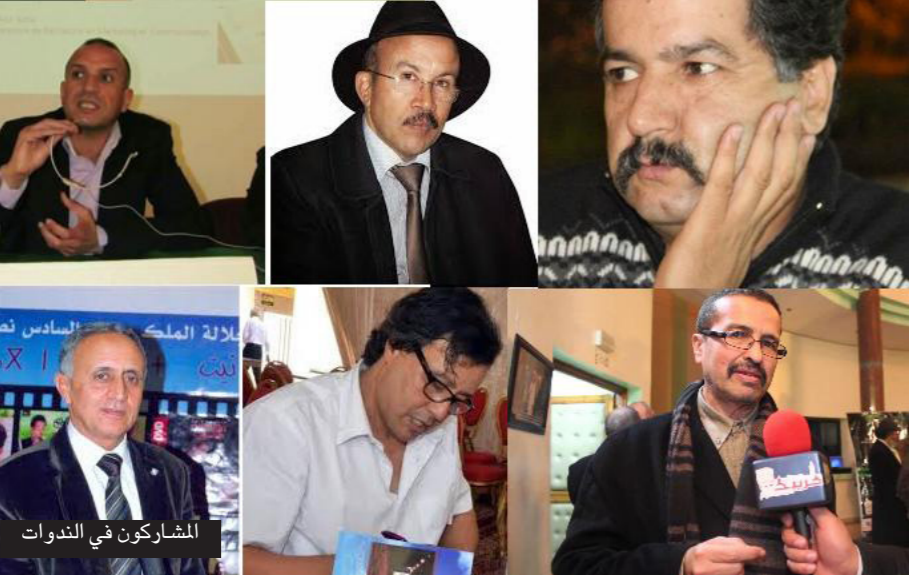
المشاركين في الندوات