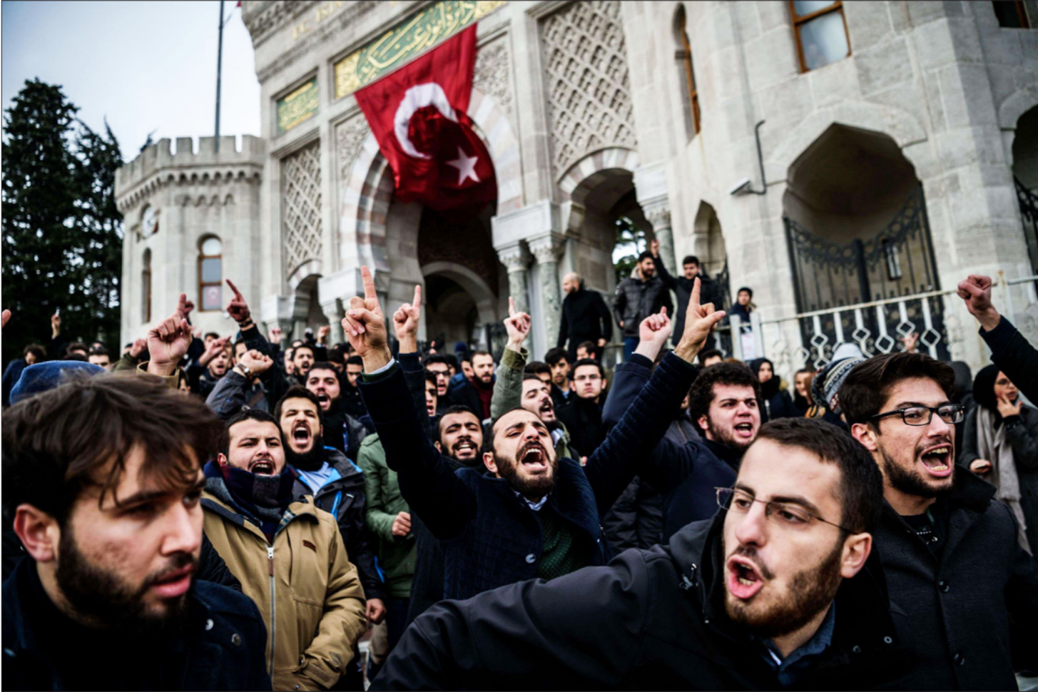
اتراك خرجوا في مظاهرات أمس الأول في اسطنبول احتجاجا على قصف حلب من قبل النظامين الروسي والسوري