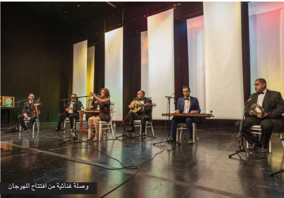
وصلة فنيّة من افتتاح المهرجان

تونس – من رشيد الجراي: افتتحت في العاصمة تونس، مساء الخميس، الدورة الثانية للمهرجان الدولي للموسيقى الكنتونيين، الذي يتيح لهذه الفئة فرصة لإبراز مواهبهم الموسيقية ومهاراتهم في العزف.