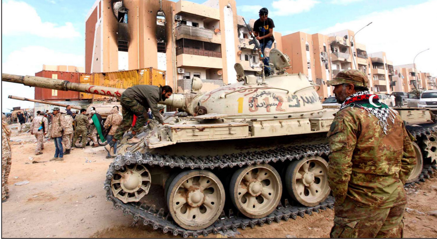
الاشتباكات بين المجموعات المسلحة تتسبب في ترمي الأضواء في ليبيا

مساء الخميس في طرابلس، حيث سمع دوي إطلاق نار وانفجارات في جنوب المدينة، وتم نشر أسلحة ثقيلة، واتخذت دبابات وعربات بيك اب مواقع لها في بعض أحياء جنوب العاصمة الليبية الخاضعة لسيطرة مجموعات مسلحة من انتفاءات مختلفة، ونكرت وسائل إعلام ليبية أن أشخاص على الأقل قتلوا، لكن لم يتسنى على الفور الحصول على حصيلة القتلى من مصدر مستقل. وتودد معارك شبيهة يومية بين هذه المجموعات المسلحة التي انخرطت منذ سقوط الزعيم الليبي معمر القذافي عام 2011، في صراع نفوذ أدى إلى منع الحكومات المتعاقبة من إعادة النظام إلى البلاد في ظل غياب جيش نظامي. وعجزت حكومة الوفاق الوطني الليبية المدعومة من المجتمع الدولي عن فرض سلطتها، رغم أنها تحظى أيضا بدعم بعض المجموعات المسلحة، وهناك مجموعات مسلحة أخرى معادية لحكومة الوفاق الوطني وتدعم رئيس «حكومة الإنقاذ الوطني» السابقة خليفة الغويل الذي يرفض الرجوع، وإلى جانب الدوافع السياسية، هناك خصومة بين مجموعات سلفية من جهة، ومجموعات إسلامية أخرى مناهضة لحكومة الوفاق الوطني ومالية لرئيس دار الافتاء الشيخ المشير للجدل الصادق الغرياني من جهة ثانية. وقد تصاعد التوتر بين الجهتين منذ إعلان دار الافتاء الليبية مقتل احد ابرز اعضائها الشيخ نادر السنوسي العمراني الذي كان خلف قبل أكثر من شهر من امام مسجد في طرابلس في ظروف غامضة، والسلفيون متهمون من جانب خصومهم بالوقوف وراء خطف العمراني وقاتله، الأمر الذي ينفونه.