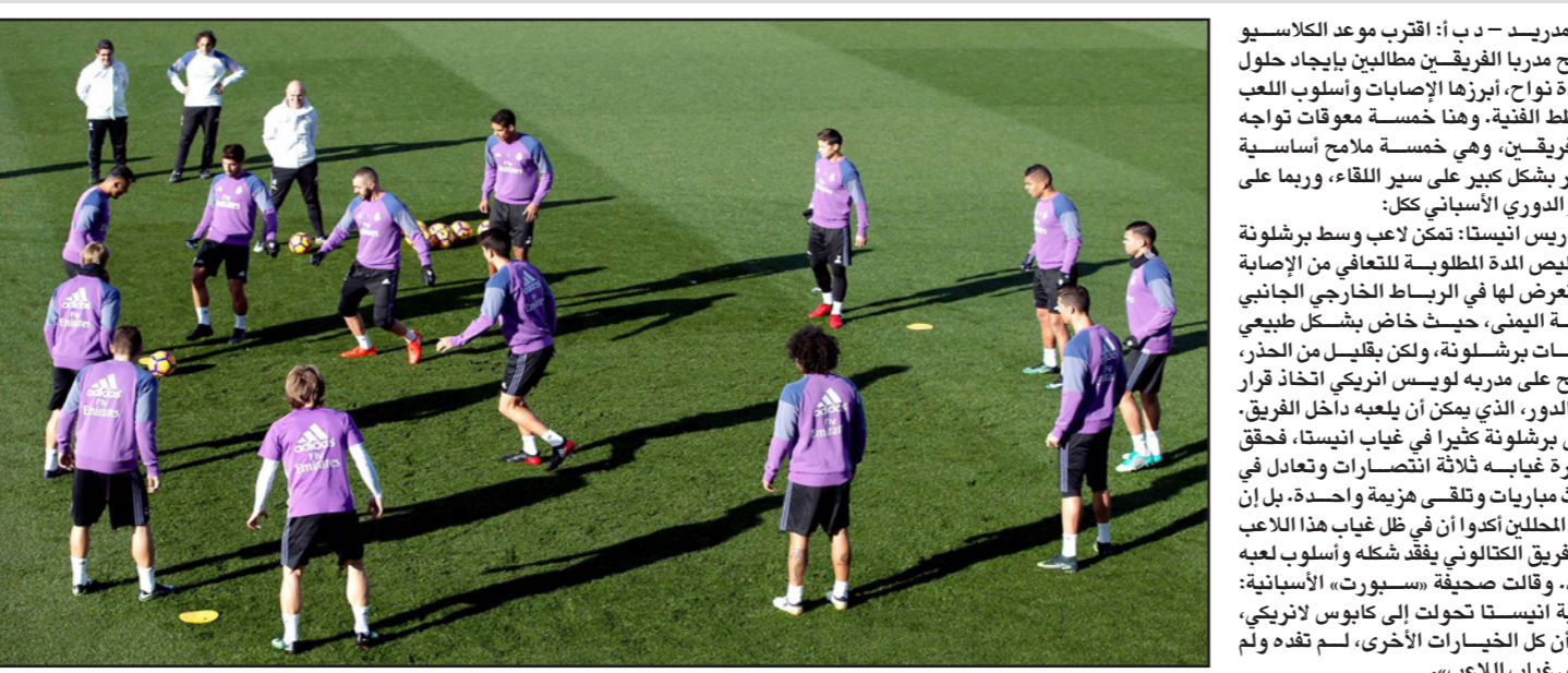
حصنة من تدريبات ريال مدريد الأخيرة قبل كلاسيكو اليوم