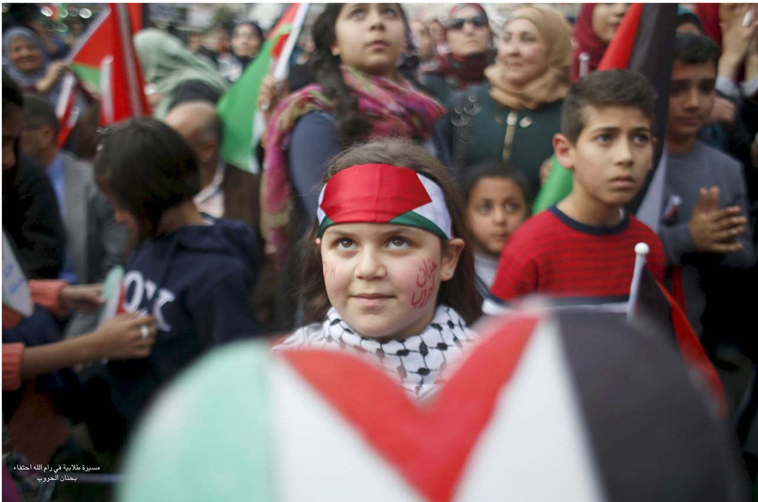
مسيرة طلابية في رام الله احتفاء بحنان الحروب