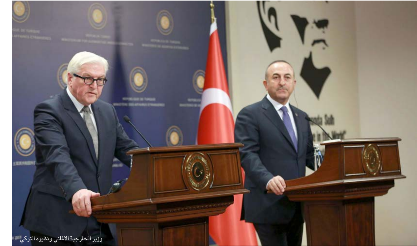
وزير الخارجية الألماني ونظيره التركي

وكانت تركيا وألمانيا قد اتفقتا مطلع العام الجاري على تكثيف التعاون بين وزارتي الداخلية في البلدين وتعزيز التبادل بين الهيئات المعنية بمجال مكافحة الإرهاب. ويعتبر التعاون بين تركيا وألمانيا صعبا وذلك بعد الخلاف بين الجانبين بشأن زيارة وفد من البرلمانيين الألمان الجنود التابعة في قاعدة إنجرليك التركية التابعة لحلف شمال الأطلسي «ناتو» وذلك نتيجة قرار البرلمان الألماني اعتبار الملاحقة الجماعية التي تعرض لها الأرمن بواسطة الأتراك خلال الحرب العالمية الأولى بمثابة إبادة جماعية.