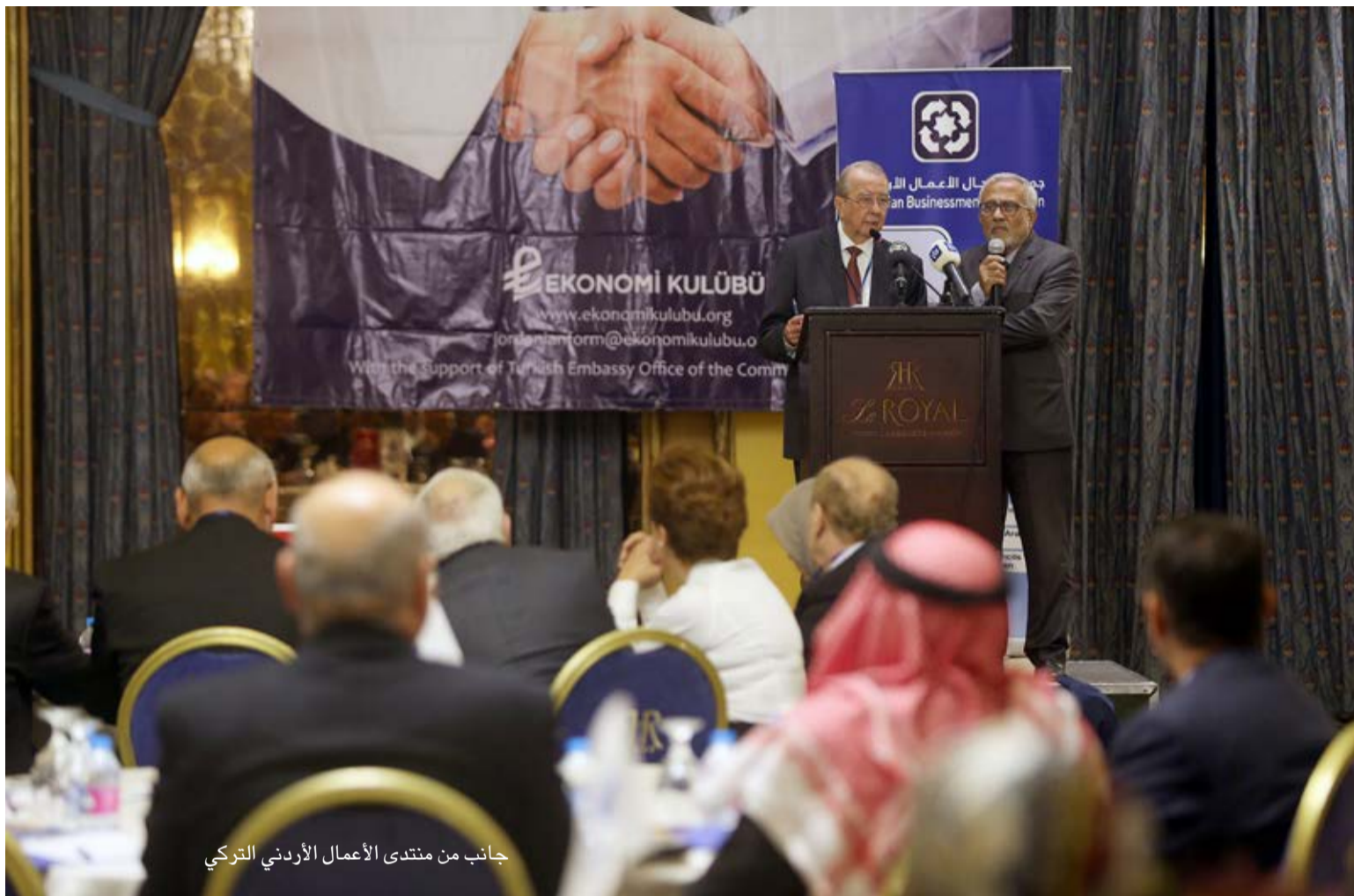
جانب من منتدى الأعمال الأردني التركي

انطلق في العاصمة عمان، امس السبت، منتدى الأعمال الأردني التركي، بمشاركة 20 رجل أعمال تركيا مثلوا قطاعات مختلفة.