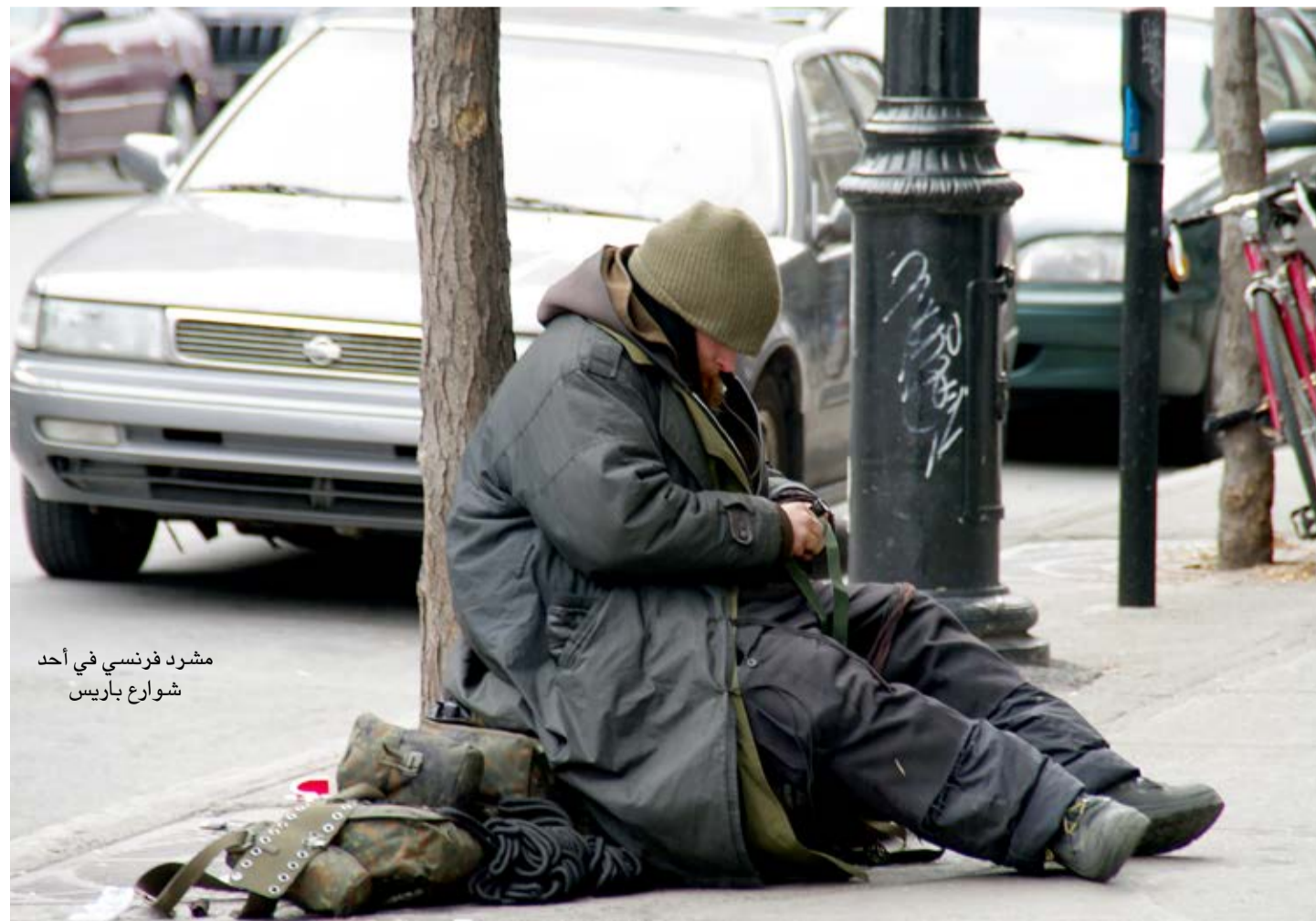
مشرد فرنسي في أحد شوارع باريس

وكل عام من بداية شهر تشرين الثاني/نوفمبر، تنتفض مئات الآلاف من الأسر الفرنسية الصعدا،