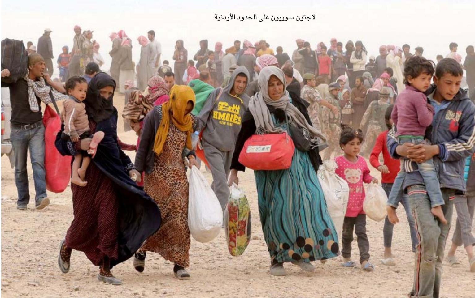
لاجئون سوريون على الحدود الأردنية