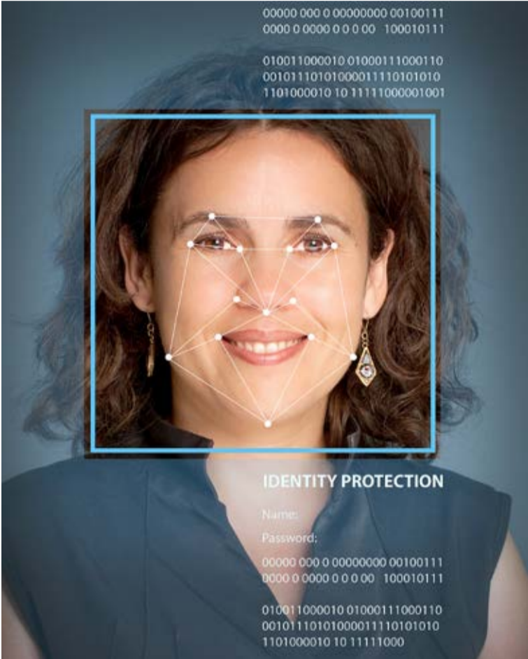
الكاريبية الصغيرة، حيث يُعد المطار هناك أرض اختبار لتقنية تُدعى «التدقق السعيد» على الخطوط الجوية الملكية الهولندية،

ويقول التقرير إن «المطار الذكي» هو اسم صناعة الطيران التي يُتوقّع أن تصبح المسار المعتمد من بداية عمل جهاز التحقق عند دخول المطار وحتى البوابة، وتتوفر هذه التكنولوجيا بالفعل في جزيرة أروبا