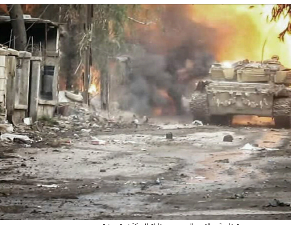
صورة خاصة بـ «القدس العربي» من مناطق المعركة شرق دمشق