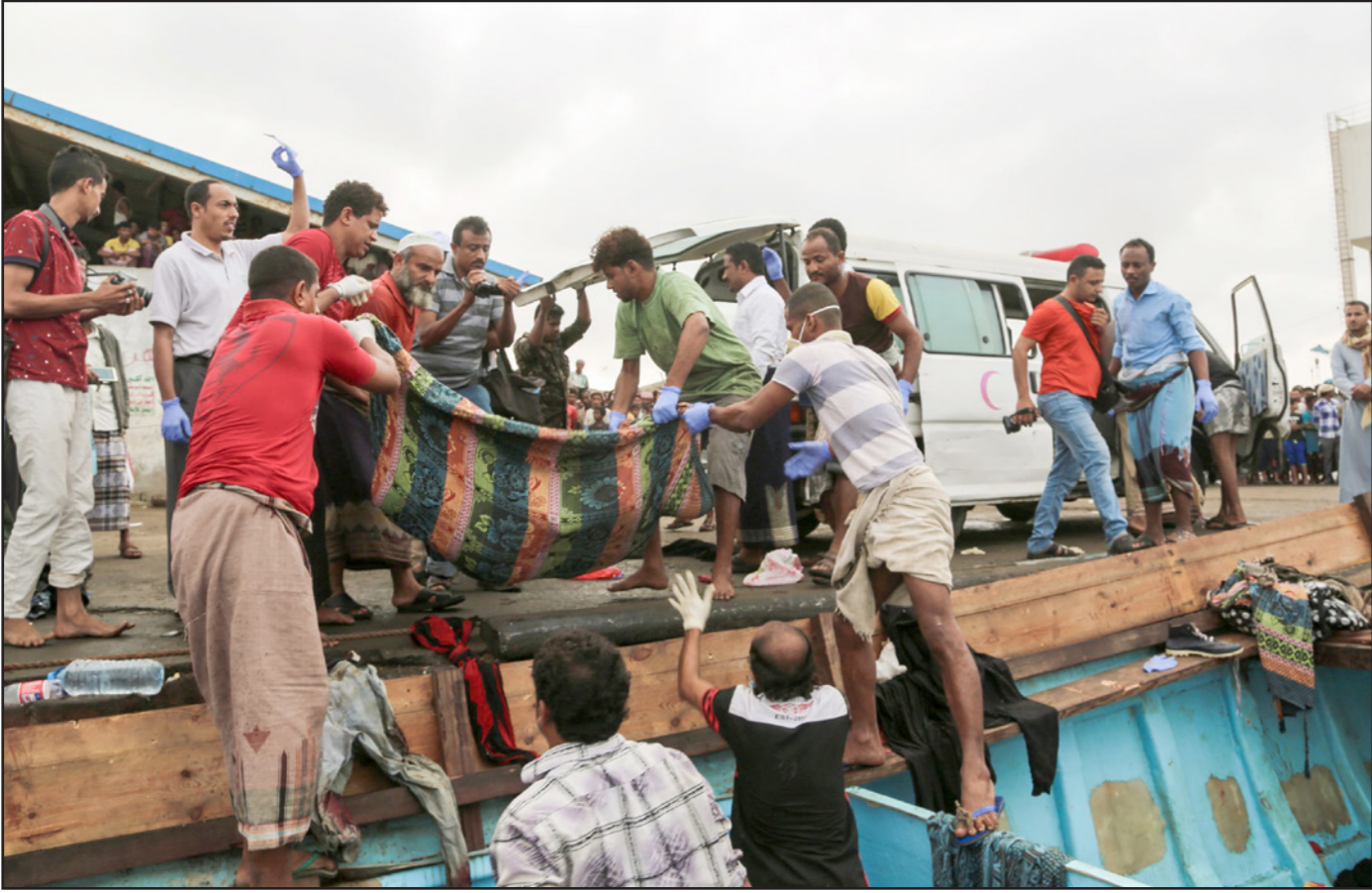
جانب من عمليات انقاذ ضحايا قارب المهاجرين الصوماليين الذي قصفت قبالة الساحل اليمني

قتلى وجرحى من المتمردين في غارات للتحالف في تعز