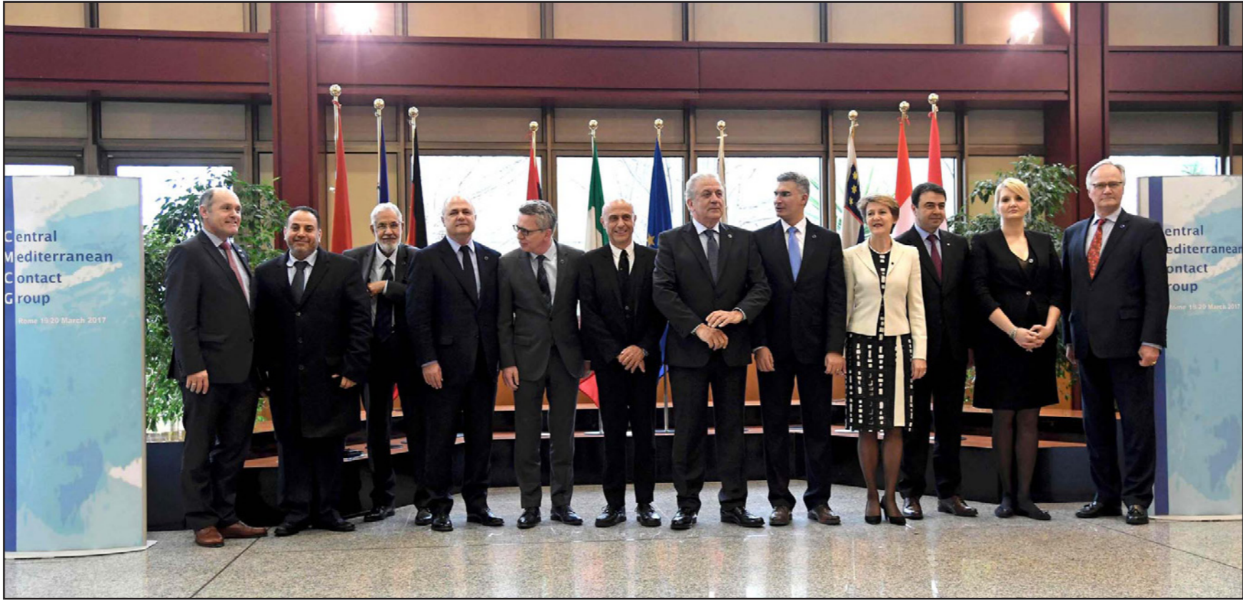
جانب من أعمال لقاء وزراء داخلية دول شمال وجنوب المتوسط حول الهجرة من ليبيا في العاصمة الإيطالية روما

وتابع الوزير الألماني قائلاً: «إن الحكومة الليبية ليس لديها مصلحة في اجترار أي أثر للجريمة عبر أراضيها، وفي أن تتم السيطرة على سواحلها من جانب مهربيين، وفي أن يكون هناك أوضاع غير إنسانية في المخيمات»، وأكد دي ميتر أن جميع الأطراف تعلم أنه من الصعب الحد من عدد المهاجرين جدير بالذكر أن اللقاء يقام بناء على مبادرة إيطالية، وقالت مصادر إيطالية، أمس إن ليبيا تقدمت للمؤتمر بمطالب محددة للحصول على معدات وتجهيزات ومرافق، تناهز قيمتها الإجمالية 800 مليون يورو، بهدف السيطرة والتحكم في تدفق المهاجرين وموجات النزوح من أراضيها. وتطالب السلطات الليبية بتكفيها من عشر سفن للبحث والإنقاذ، وعشرة زوارق سريعة وأربع طائرات عمودية.