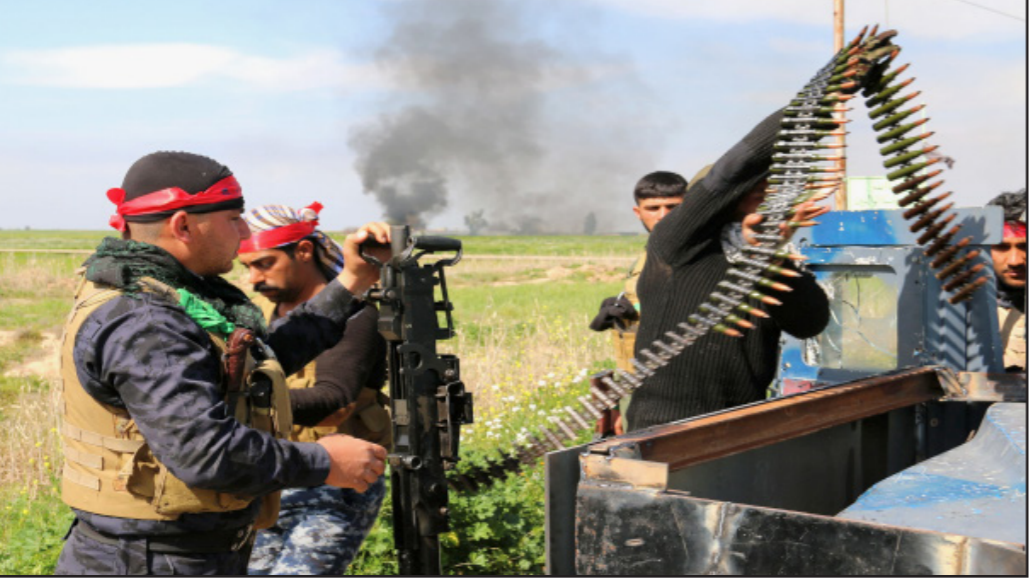
صورة أرشيفية لعناصر من «الحشد الشعبي»

وتعين محافظاً منها، إضافة إلى السيطرة على المناصب العليا في الدوائر العسكرية والمدنية في المحافظة. وأصبحت كركوك في محافظة كركوك الغنية بالنفط، مشاكل أدت إلى إضعاف دوره، ومنها، قلة أعضاء مجلس المحافظة من العرب بسبب عزوف المواطنين العرب عن المشاركة في الانتخابات السابقة. كما أن القوى والعشائر والشخصيات العربية غير متفقة على برنامج موحد للتحرك في المحافظة، ما جعل الكتلة الكردية تسيطر على مجلس المحافظة عموماً ومدينة كركوك خاصة من العرب، وإذا لم يوحد ممثلو العرب جهودهم فإن الكون العربي سيتم إقصاؤه من المحافظ. ويواجه الكون العربي في محافظة كركوك الغنية بالنفط، مشاكل أدت إلى إضعاف دوره، ومنها، قلة أعضاء مجلس المحافظة من العرب بسبب عزوف المواطنين العرب عن المشاركة في الانتخابات السابقة. كما أن القوى والعشائر والشخصيات العربية غير متفقة على برنامج موحد للتحرك في المحافظة، ما جعل الكتلة الكردية تسيطر على مجلس المحافظة