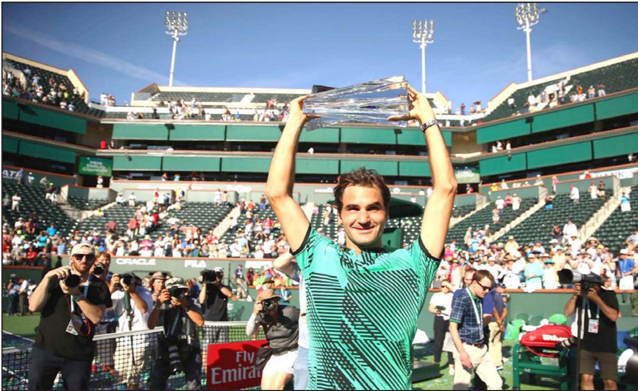
فيدرر يحتفل بلقب البطولة عقب الفوز على موطنه فافرينكا في المباراة النهائية

■ إنديان ويلز (كاليفورنيا) - د ب أ: أكد لاعب التنس السويسري روجيه فيدرر انتفاضته في الموسم الحالي وتوج بلقبه الخامس في بطولة إنديان ويلز للأساتذة أكثر تغلبه على موطنه ستانيسلاس فافرينكا 4/6 و5/7 في المباراة النهائية، واستغرق فيدرر المصنف التاسع للبطولة ساعة واحدة و20 دقيقة للتغلب على فافرينكا المصنف الثالث للبطولة في نهائي سويسري خاص، واللقب هو الثاني ليفيدرر في الموسم الحالي بعد لقبه في بطولة أستراليا المفتوحة، أولى بطولات «غراند سلام» الأربع الكبرى هذا الموسم، وكان هذا النهائي هو السابع ليفيدرر (35 عاماً) في تاريخ مشاركاته ببطولة إنديان ويلز، وتوج فيدرر بلقبه الخامس التنس خلال مسيرته الرياضية حتى الآن، وحقق فيدرر في هذه المباراة الانتصار رقم 20 له مقابل ثلاث هزائم في الواجهات مع فافرينكا خلال مسيرتهما، كما حقق فيدرر الانتصار الخامس عشر في 15 مباراة واجه فيها فافرينكا على الملاعب الصلبة، ومع فوزه باللقب، تصدّر فيدرر بجدارة قائمة اللاعبين المرشحين للمشاركة في البطولة الختامية (نهائي الدوري العالمي) التي تقام الآن.