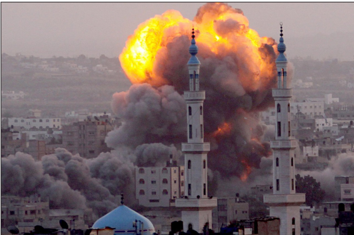
هل تشن إسرائيل حربا جديدة على غزة؟

يجب على إسرائيل في هذه الاثناء فحص رودها، لا سيما على ضوء موقف روسيا. في نهاية الاسبوع تم استدعاء السفير الإسرائيلي في موسكو للمرة الاولى من أجل الاستيضاح في وزارة الخارجية الروسية بسبب هجوم يوم الجمعة. وتقوم روسيا مؤخرا بجهود دبلوماسية تواجهها لأمبالاة وتردد من الادارة الأمريكية الجديدة، من أجل