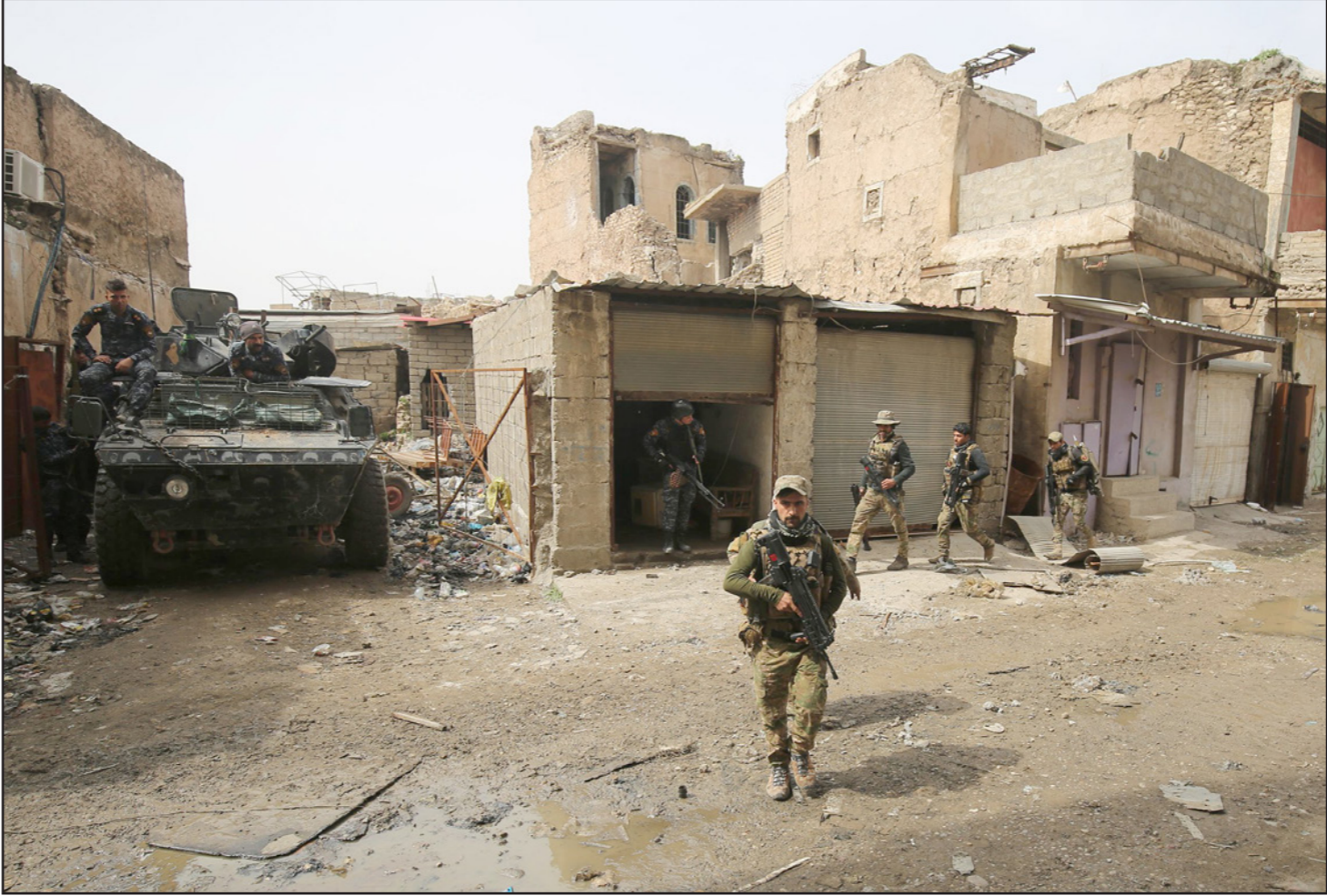
عناصر من الجيش العراقي يمشطون أحد أحياء الموصل