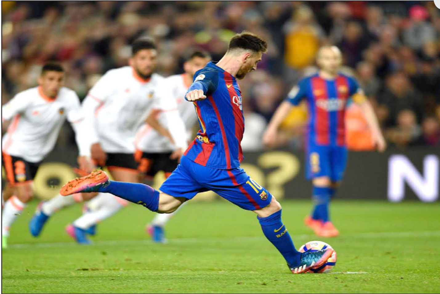
ميسي يسدد ركلة الجزاء التي جاء منها الهدف الثاني لبرشلونة في مرمى بلنسية

■ برشلونة – رويترز: هز ليونيل ميسي الشياك مرتين ليقود برشلونة حامل اللقب للفوز 4-2 على بلنسية العنيد ليستمر في مطاردة ريال مدريد المتصدر على لقب الدوري الاسباني. وسجل انطوان غريزمان للمرة الخامسة في أربع مباريات وصنع هدفا آخر ليقود أتلتيكو مدريد للفوز 3-1 على اشبيلية ليقترب بفارق نقطتين فقط من فريق المدرب خورخي ساميارو الثالث. فاجأ اليكيب مانغالا المعار من مانشستر سيتي الجماهير في "تو كامب" ووضع بلنسية في المقدمة بضربة رأس في الدقيقة 29، لكن لويس سواريز أدرك التعادل على الفور لبرشلونة بعد رمية تماس نفذها نيمار. وحصل المهاجم الاوروغواني على ركلة جزاء بعد عرقلة من مانغالا الذي طرد لحصوله على إنذارين. وتوق ميسي على ديبغو الفيس، الحارس المتخصص في التصدي لركلات الجزاء، للمرة الثانية هذا الموسم، ليتقدم برشلونة في الدقيقة 45، لكن منير الحدادي المعار من الفريق الكتالوني أدرك التعادل لبلنسية في الوقت المحتسب بدل الضائع للشوط الأول. وسيطر برشلونة على الشوط الثاني وتقدم للمرة الثانية عبر ميسي الذي سدده كرة منخفضة داخل شباك الفيس. وفرط الفريق الزائر في فرصة التعادل بعدما تبادلوا الحدادي في تصدي الكرة ليخطفها منه جيرار بيكي، وهز اندريه غوميز لاعب برشلونة الشباك للمرة الأولى مع فريقه الجديد عندما حول تمريرة عرضية من نيمار إلى داخل مرمى فريقه السابق، ويحتل برشلونة المركز الثاني برصيد 63 نقطة