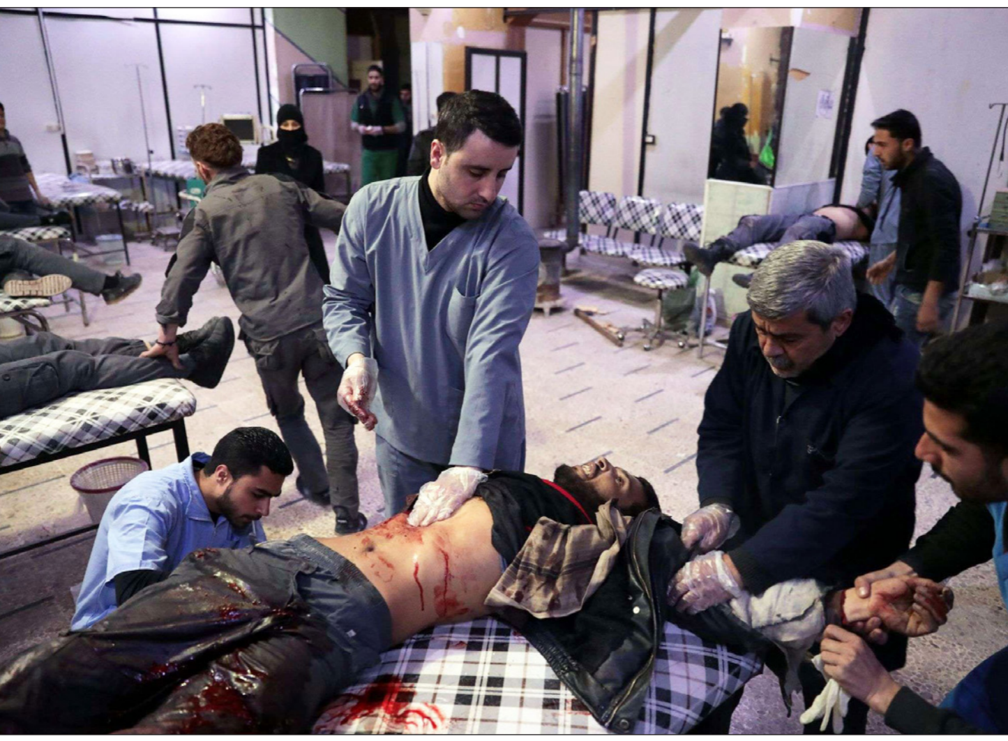
جرحى يتلقون العلاج عقب غارات النظام على دوما أمس الأول

التابعة له في محيط منطقة المعامل شمال جوبر»، وقضت «على كامل المجموعات المتسللة بأفرادها وعقائدها». وأوضحت أن العملية العسكرية «استهدفت المناطق التي انطلق منها إرهابيو جبهة النصرة والمجموعات التابعة له»، ودفع المارك وما رافقها من إطلاق الفصائل المقاتلة قذائف على أحياء عدة في وسط دمشق الأحد، قوات النظام إلى قطع الطرق المؤدية كافة إلى ساحة العباسيين التي بدت خالية من أي حركة. كما أعلن عدد من المدارس تعليق الدروس حفاظاً على سلامة الطلاب.