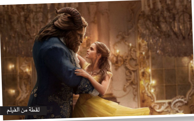
لقطة من الفيلم

السابقة، وانتقدت وهبي عبر «سناپ شات» الخاص بها من ستعتهم بأنهم «ناكرو الجميل»، في إشارة واضحة منها إلى نسرين، التي عملت معها لمدة طويلة وانفصلت عنها من دون معرفة الأسباب التي لا تزال مجهولة حتى الساعة، إذ كتبت معلقة بالقول: «يفاجئنا صاحب الوجهين بأسلوبه المهذب وأخلاقه العالية، ونعتقد أحياناً أنه إنسان كامل ولا ينقصه شيء، وفي الغالب يكون هذا انطباعاتنا الأولى عنه، إلى أن يسقط قناعه المزيف..» هذا وتوجد الإشارة إلى أن هيفاء كانت قد افتتحت الحلقة الأولى من برنامج «عالمك»، لظواهره عبر شاشة الجديده.