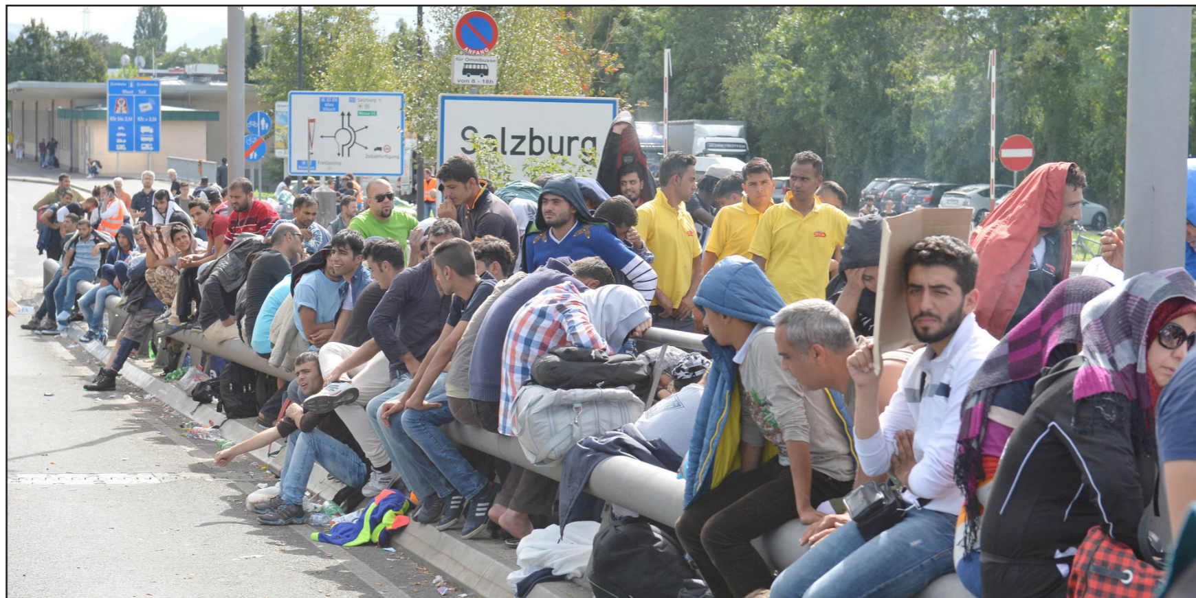
هل سيقتح اردوغان موجات اللجوء ضد ألمانيا؟

20 في المئة مقارنة مع العام السابق. عدد المشوهمين في هذه المخالفات تضاعف، ووصل في السنة الماضية إلى 250 ألف شخص، نصفهم من الأجانب. والمعطى الذي يعتبر تديدا هو أنه من بين جميع المخالفين الأجانب هناك 25 ألف شخص تقدموا بطلب للجوء، ومن ضمنهم 4 آلاف شخص سوري.