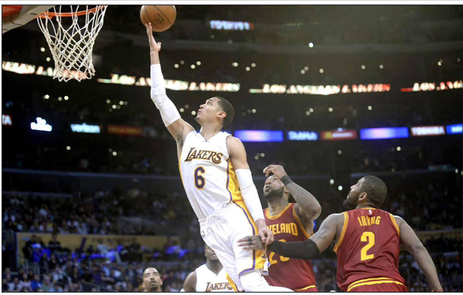
كلاركسون نجم ليكرز يتعمق ليقرب من التسجيل في سلة كافاليرز

■ طوكيو - رويترز: غامر ماكوتو هاسيبي بعلاقة مع ناديه إنترراخت فرانكفورت الألماني بالانضمام إلى تشكيلة اليابان التي ستعد لخوض مباراة في تصفيات كأس العالم أمام منتخب الإمارات يوم الخميس، بالإضافة بعد اصطدامه بأحد قائضي الرمي أثناء إيعاد تسديدة من توماس مولر من على الخط، ونقل إلى المستشفى عقب المباراة لكن فرانكفورت قال بعدها إن هاسيبي يحتاج إلى جراحة، وتحمل اليابان المركز الثاني في المجموعة الثانية بالتصفيات الآسيوية بالتساوي مع السعودية المنصرة وبفارق نقطة واحدة عن أستراليا صاحبة المركز الثالث، ويتأهل أول فريقين مباشرة لنهائيات في روسيا بينما يمكن لصاحب المركز الثالث الصعود أيضاً عن