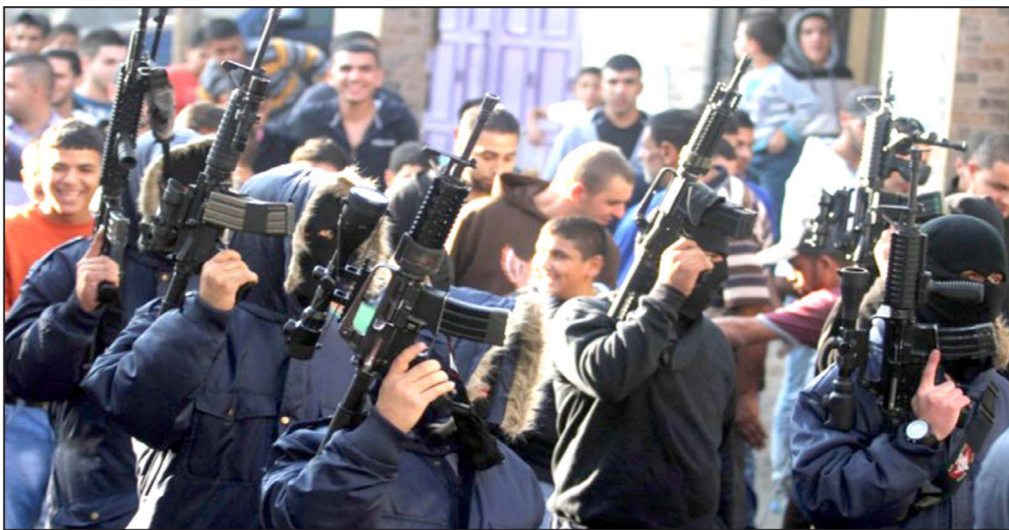
مسلحون في نابلس