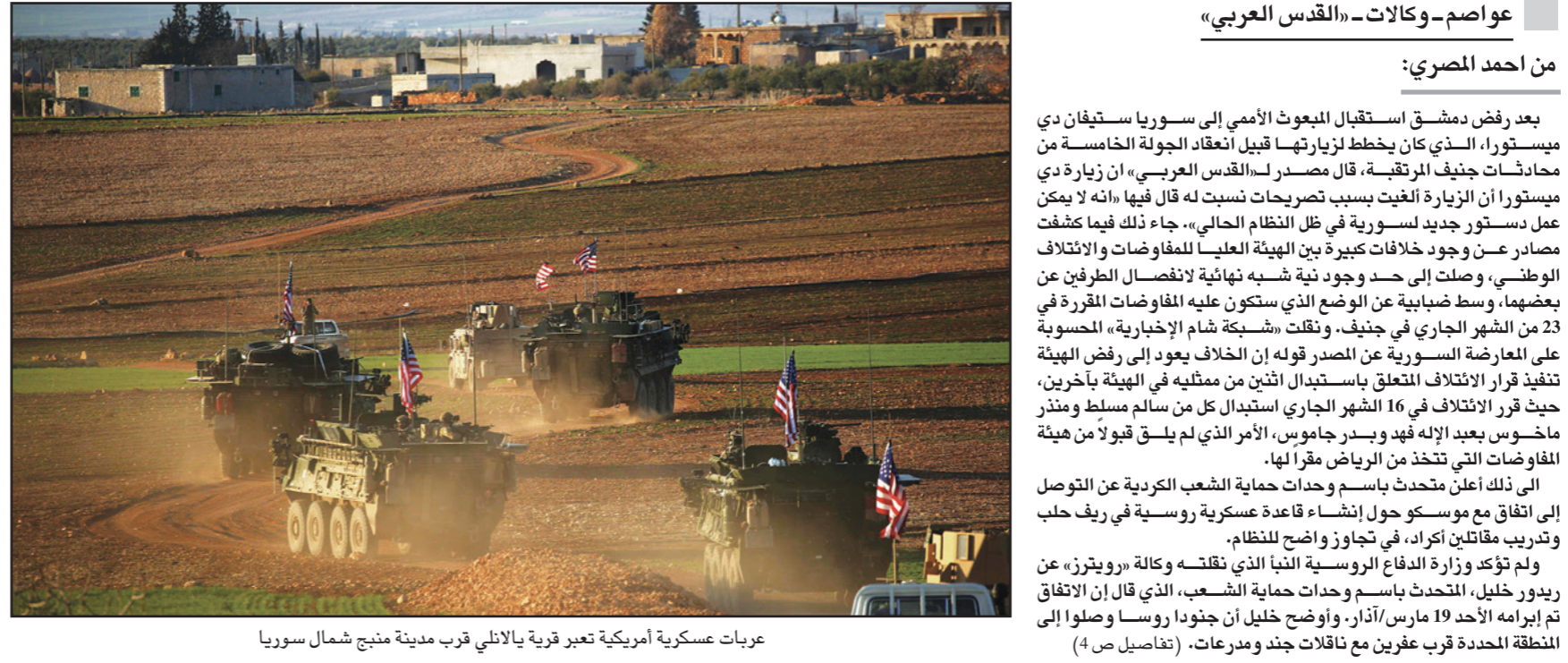
عربات عسكرية أمريكية تعبر قرية يالانلي قرب مدينة منبج شمال سوريا

بعد رفض دمشق استقبال المبعوث الأممي إلى سوريا ستيفان دي ميستورا، الذي كان يخطط لزيارتها قبيل انعقاد الجولة الخامسة من محادثات جنيف المرتقبة، قال مصدر لـ «القدس العربي»: «إن زيارة دي ميستورا أن الزيارة ألغيت بسبب تصريحات نسبت له قال فيها «أنه لا يمكن عمل دستور جديد لسورية في ظل النظام الحالي».. جاء ذلك فيما كشفت مصادر عن وجود خلافات كبيرة بين الهيئة العليا للمفاوضات والائتلاف الوطني، وصلت إلى حد وجود نية شبيهة نهائية لاتصال الطرفين عن بعضهما، وسط ضبابية عن الوضع الذي ستكون عليه المفاوضات المقررة في 23 من الشهر الجاري في جنيف، وقلقت «شبكة شام الإخبارية» الحسوية على المعارضة السورية عن المصير قوله إن الخلاف يعود إلى رفض الهيئة تنفيذ قرار الائتلاف المتعلق باستبدال اثنين من ممثليها في الهيئة باخرين، حيث قرر الائتلاف في 16 الشهر الجاري استبدال كل من سالم مسطل ومنذر ماخوس بعيد الإله فهد وبندر جاموس، الأمر الذي لم يلق قبولًا من هيئة المفاوضات التي تتخذ من الرياض مقرًا لها.