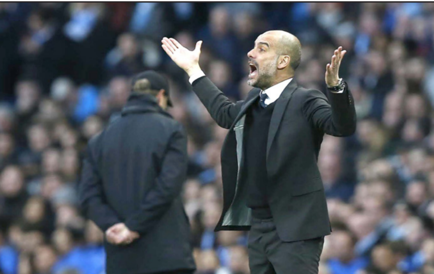
غوارديولا سعيد بأداء مانشستر سيتي رغم التعادل مع ليفربول

■ مانشستر – الأناضول: أبدى الاسباني جوسيب غوارديولا مدرب مانشستر سيتي، رغبته في البقاء في صفوف الفريق الإنجليزي لأطول فترة ممكنة. وقال غوارديولا: "أنا فخور بما قدمه لاعبي فريقي أمام ليفربول، وأسعى للبقاء في صفوف الفريق لأطول فترة ممكنة". وأضاف: "تدريب مانشستر سيتي سيكون أصعب اختبار في مسيرتي التدريبية، فهو يعد أصعب بمراحل من تدريب بايرن ميونخ الألماني وبرشلونة الاسباني". وأوضح: "لا يمكنكم أن تتخيلوا ما أشعر به، إنه واحد من