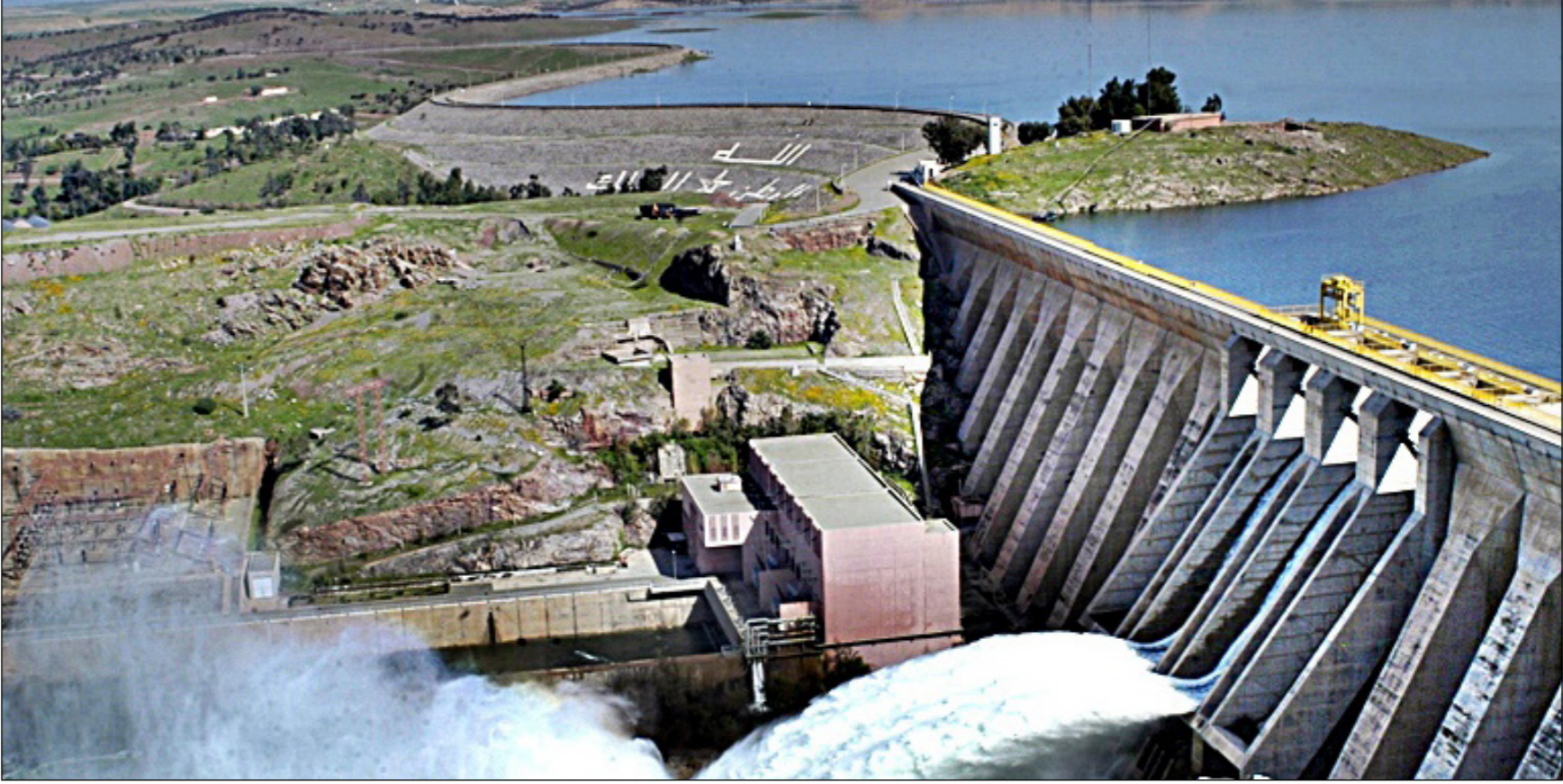
سد في محافظة القنيطرة الغربية

■ الرباط - الأناضول: احتوت السدود الرئيسية في المغرب بحلول منتصف الشهر الجاري، على أكثر من 8.87 مليار متر مكعب من مياه الأمطار، أي ما يعادل 58.4% فقط من سعتها، وهو ما يمثل انخفاضاً عن المستوى المسجل في الفترة من العام الماضي، وهو 9.37 مليار متر مكعب، بنسبة ملة بلغت 61.7%، وفق الوزارة الغربية المكلفة بالماء.