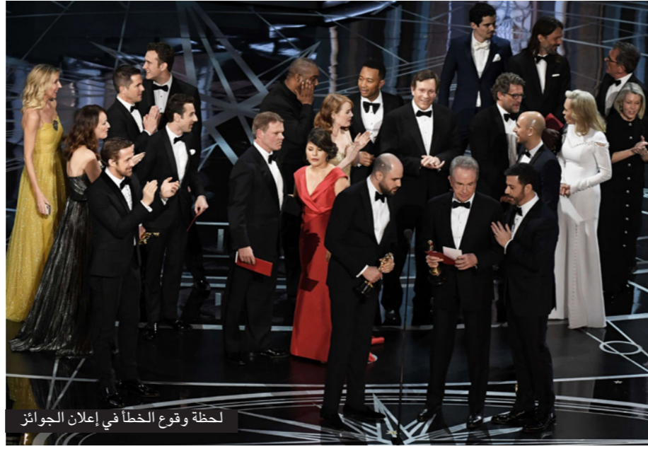
لحظة وقوع الخطأ في إعلان الجوائز