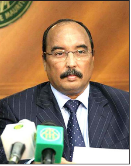
الرئيس الموريتاني محمد ولد عبد العزيز

■ نواكشوط - من محمد البكاي يعقد الرئيس الموريتاني محمد ولد عبد العزيز، غدا الأربعاء، في باريس، جلسة مباحثات مع نظيره الفرنسي فرانسوا أولاند، في إطار زيارة عمل. وقال مصدر حكومي موريتاني، إن «ولد عبد العزيز، سيجري مساء الأربعاء القادم مباحثات في قصر الإليزيه مع نظيره أولاند». المصدر الذي طلب عدم نشر اسمه لأنه غير مخول له التصريح لوسائل الإعلام، لم يذكر تفاصيل بشأن مدة الزيارة، ولا المواضيع المدرجة عليها، كما لم يذكر تفاصيل عن المواضيع التي ستكون على طاولة مباحثات الجانبين. وتأتي زيارة ولد عبد العزيز إلى باريس، بعد أربعة أيام من زيارة أداما وزير الخارجية الفرنسي جان ماركشوط، أجرى خلالها مباحثات مع عدد من المسؤولين الحكوميين، ولقاء بقصر الرئاسة في نواكشوط مع ولد عبد العزيز. والجمعة الماضية، أثنى ماركشوط، في تصريحات صحفية من نواكشوط، على «الجهود التي تقوم بها موريتانيا لضمان الأمن والاستقرار ليس فقط على الصعيد الداخلي ولكن في المنطقة بما فيها الساحل الإفريقي». وقال إنه «ناقش مع ولد عبد العزيز مسألة التعاون بين نواكشوط وباريس». وأشار إلى أن «موريتانيا بلد صديق وشريك مهم لفرنسا، ليس فقط على الصعيد الدبلوماسي والأمني وإنما على الصعيد الاقتصادي، علاوة على كون موريتانيا شريكاً متمتعاً بالأولوية في مجال