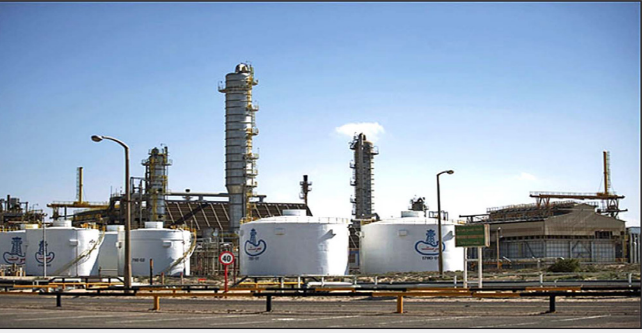
حقل الشراة النفطي الليبي

على انتاج كسول الإغلاقات لابترز أن الدوله... وقال مصدر ملاحى ليبي إنه لا توجد أي سفن في مرفأ الزاوية في الوقت الحالى ومن غير المتوقع وصول أي سفن في المستقبل القريب. وأظهر جدول شحن مبدئي لخام الشراة لشهر