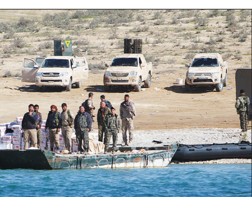
مقاتلون أكراد يستلمون إمدادات غذائية على ضفة نهر الغرات غرب مدينة الرقة أمس

السيناتور الأمريكي يفتتح تقسيم ليبيا أحد مساعدي الرئيس الأمريكي يقترح تقسيم ليبيا