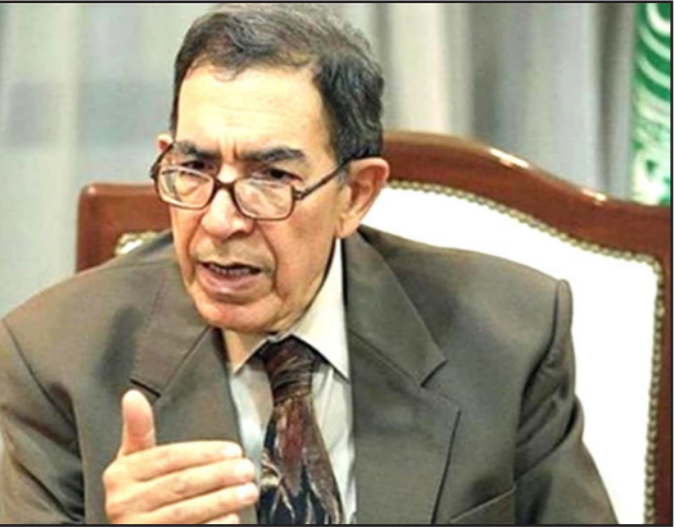
صلاح الدين الجمالي

كل جانب، ضيفاً: وهنا يبدأ الحوار ويمكن الاتفاق على النقاط التي يجب تغييرها وتبدأ ماكينة التطور السياسي بليبيا في التحرك ونبدأ في الانتخابات وقال السفير الجمالي إن دول الجوار لديها مهمة أمنية أكثر منها سياسية في تعاملها مع الأزمة الليبية، خلال الاجتماع المقبل المقرر أن تستضيفه الجزائر نهاية الشهر الجاري، مشيراً إلى مسألة الهجرة غير الشرعية باعتبارها أحد أهم القضايا المقررة مناقشتها بين دول الجوار، خاصة وأن الاتحاد الأوروبي يتحدث عنها باعتبارها مشكلة كبيرة. وقال: مبعوث الأمن العام للجامعة العربية إلى ليبيا، إن الوضع في طرابلس أصبح من الصعب السيطرة عليه، وذلك على الرغم من وجود حرس رئاسي هدفه الأول حراسة المنشآت الحكومية والسفارات، ومواجهة المليشيات وتقليص تأثيرها، مضيفاً أن العاصمة أصبحت مستنقعا للمليشيات، خاصة الإسلامية منها. وأشار الجمالي، في تصريحات إلى وكالة أنباء