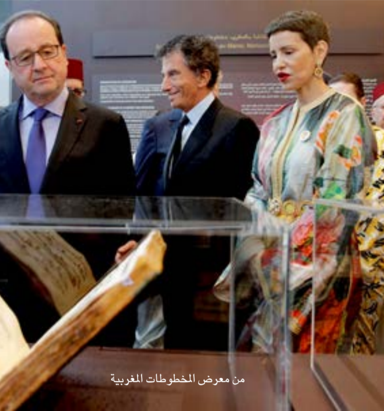
من معرض المخطوطات المغربية

● نسعى دائما إلى نوع من التوازن. وأن تكون كل الدول العربية حاضرة في أنشطتنا الثقافية. ما يحول دون حضور بعض الدول العربية بشكل مكثف، كونها تعيش أزمات داخلية وحروبا يصعب التواصل معها أو تنظيم أنشطة مشتركة معها. ورغم ذلك خصصنا أنشطة كثيفة ومعارض حول الحرب في سوريا، وحول اللاجئين ومعاناتهم.