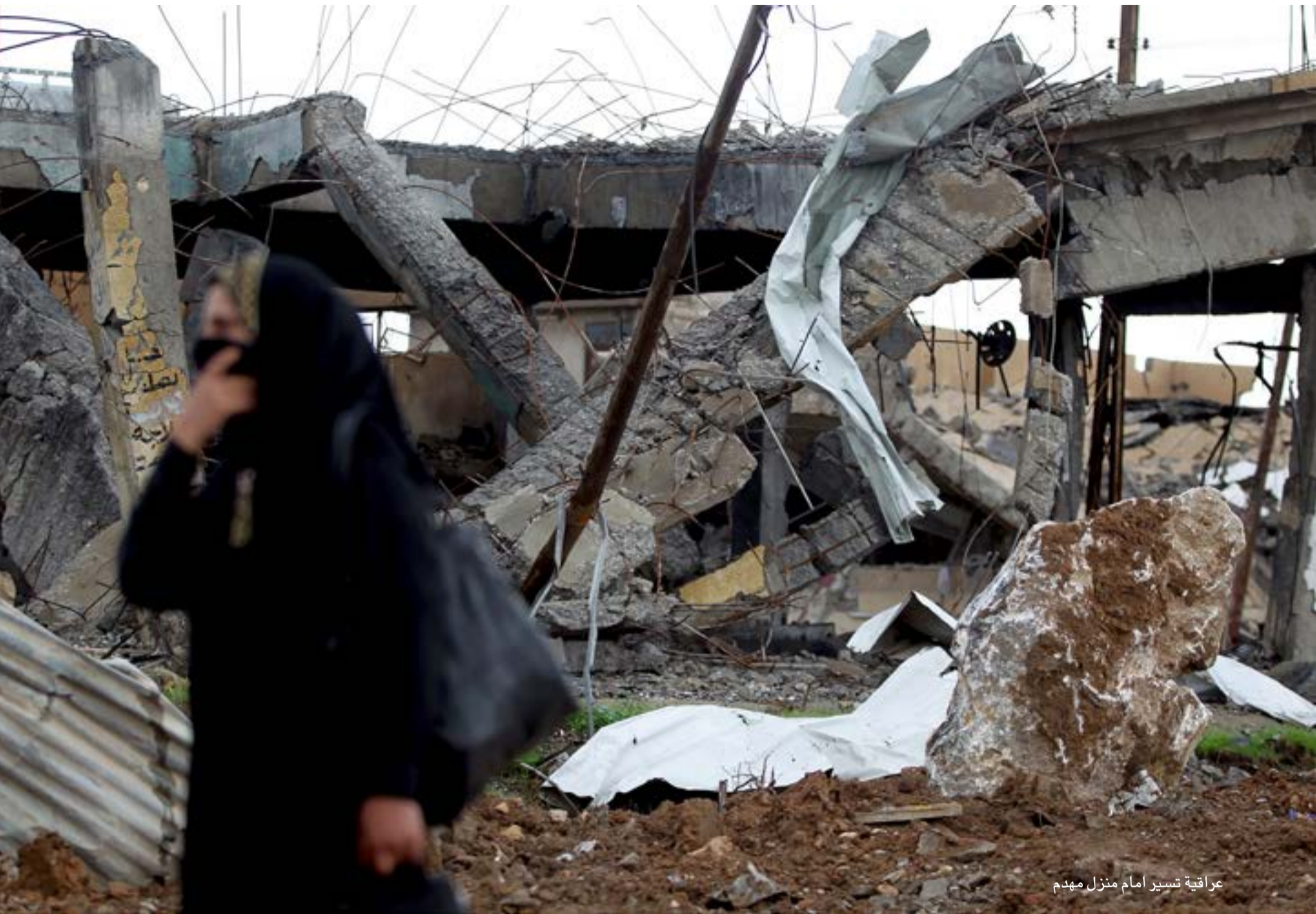
عراقية تسير أمام منزل مهدم

وفي كل الأحوال يبقى النازحون الغارون من المدينة هم الأوفر حظا من المحاصرين بين الحياة والموت، ومهما كانت معاناة النازحين من غرب الموصل الذين بلغوا 300 ألف حتى الآن، حسب الأمم المتحدة، فان الجميع يتفق على انهم محظوظون للنجاة بأرواحهم، وسط تساؤلات محلية ودولية عن مدى صواب قرار تشجيع سكان الموصل على البقاء في دورهم تحت رحمة القصف ونقص مستلزمات العيش وقسوة التنظيم الإرهابي. ولم تكن الموصل منطقة التوتر الأمني الوحيدة في العراق هذه الأيام، بل شهدت عدة مناطق خروقات أمنية نتيجة شن عناصر التنظيم هجمات هنا وهناك لاشغال القوات الأمنية والايحاء بأنهم ما زالوا موجودين.