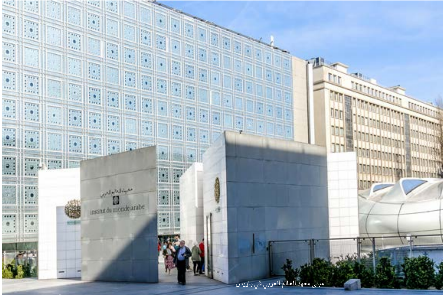
مبنى معهد العالم العربي في باريس

○ هل سيسبب لكم موقفكم الداعم للقضية الفلسطينية مضايقات من طرف إسرائيل؟