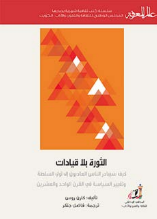
كارن روس، دبلوماسي بريطاني سابق، ترأس قسم السلام في الشرق الأوسط في وزارة الخارجية البريطانية، ومحرر خطابات لوزير الخارجية البريطاني.

ولا حتى انتخابات برلمانية، ولكن عن طريق الفئات الأكثر تأثراً بالمشكلات الراهنة، الأمر أشبه بالعودة إلى الديمقراطية في أنغى صورها، كما مثلها النموذج اليوناني، مع الأخذ في الاعتبار سمات عصرنا الذي نحياه. لتأتي الفكرة الرابعة والأخيرة كمحصلة لما سبق، وهي سلطة حسم الأمور، التي من الممكن أن يحدث فعل عرضي بسيط يقلب الأحداث، والاستشهاد هنا بحادث محمد بو عزيزي وما أحدثه من زلزال «الربيع العربي».