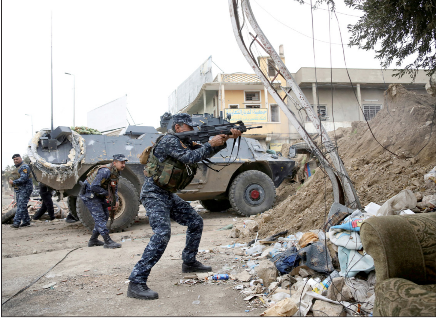
مواجهات بين الجيش العراقي وتنظيم «الدولة» في الموصل القديمة

بغداد - الموصل - «القدس العربي» - وكالات: