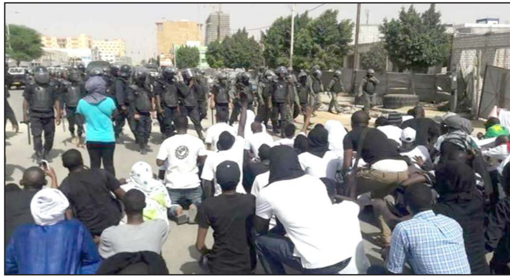
جانب من التظاهرة التي نظمها خريجي الجامعات العاطلين من العمل في موريتانيا

الذي اعتمد عليه النظام لمواجهة المشاغل الواقعية للمواطنين، وإن يدين التراجع الخطير للحريات الفردية والجماعية التي يكفلها دستور الجمهورية الإسلامية، فإنه يدعو القوى الحية وجميع المواطنين الحريصين كافة على احترام الحريات الديمقراطية إلى التنبذ الشديد بهذا التوجه السلبي للنظام.. وفي بيان آخر حول الموضوع، أكد حزب اللقاء الديمقراطي المعارض، «أن الشرطة واجهت بقمع وحشي مسيرة سلمية في وسط العاصمة، قامت بها مجموعة شبابية، كانت تحتج على واقعها المزري، المتخلف في البطالة والتهميش وانسداد جميع الأفاق أمامها. بفعل السياسات الطائشة للنظام، الذي تشكلت ثلاثة أرباع المواطنين تقريباً، ورغم ذلك، فإنها لا تحصل على تعليم وغير واقعها، ولا يصل إلى التعليم الجامعي منها، سوى نسبة 13% سنوياً، وهذه النسبة، رهيعها فقط هو الذي يحصل على العمل»، وأكد حزب اللقاء الديمقراطي الوطني في بيانه أنه «يندد بسياسات النظام اتجاه