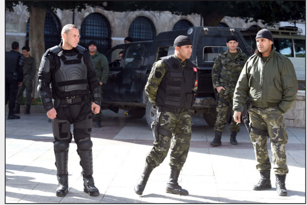
عناصر من الأمن التونسي

تونس - «القدس العربي»: طالب عناصر شرطة تونس بقباضة نائب اقتحم أحد المراكز الأمنية شمال غرب البلاد وعين نفسه مديراً له مطالباً عناصره بالزور إلى الشوارع لحماية الناس، وهو ما نفاه النائب المذكور، مشيراً إلى وجود سوء تفاهم، حول هذا الأمر. وأصدرت تنسيقية نقابة قوات الأمن الداخلي في ولاية «جنوبية»، شمال غرب بيانا طالب فيه برفع قضية ضد النائب فيصل التينيني وعدم تأيين أنشطته في كامل الولاية، فضلاً عن تنفيذ عدة وفيات احتجاجية إثر «اقتحام» التينيني مركز الأمن في مدينة «بوسالم» التابعة للولاية، حيث قام به الاعتداء اللفظي على عناصر المركز وطالبهم بمغادرة المكان والعمل الميداني في الشوارع، مشيراً إلى أنه سيتولى إدارة المركز بشكل مؤقت لحين انتهاء مباراة بكره بين ناديين محليين.