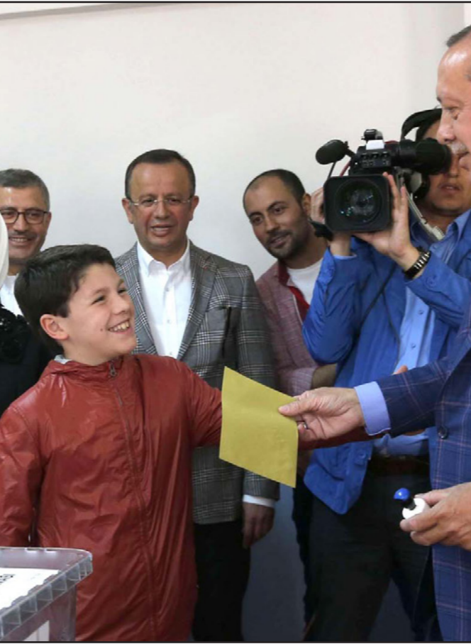
الرئيس التركي رجب طيب أردوغان يدي بصوته خلال انتخابات البلاد في الاستفتاء بتعديل الدستور

كما لا تزال تركيا منقسمة ويعمم بين الفاعلين عن إرث أتاتورك والساعين لحوه وبين المناهضين عن النخلة الألمانية وعاة القيم الإسلامية المحافظة وبين الأكراد والقوميين الأتراك وبين البني التي يحكم بها الجيش والنخبة الحاكمة من حزب العدالة والتنمية. وخلافات كهذه كفيلا بزيادة التوترات. وتضيف الصحيفة أن عملية الاقتراع جرت في مناخ من الخوف وتحولات اقتصادية شجعت دول الإتحاد الأوروبي على فتح ملف عضوية تركيا.