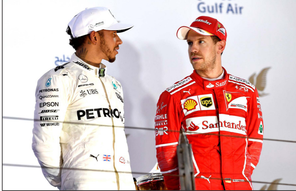
فيتيل (يمين) ما زال يتفوق على غريمه هاميلتون حتى الآن هذا الموسم