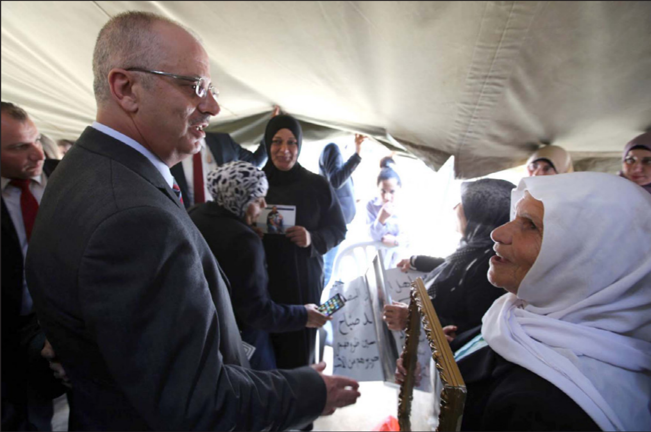
الحمد لله في خيمة التضامن مع الأسرى في جنين أمس (القدس العربي)

في اليوم الثاني لإضرابهم في سجون الاحتلال