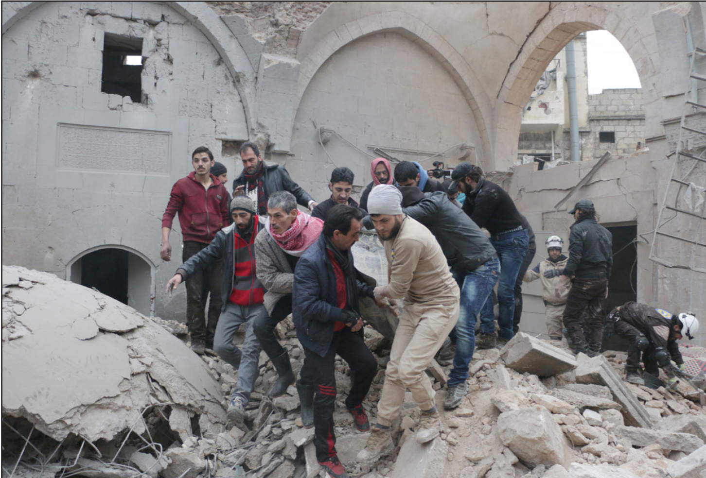
سوريون يحملون أحد ضحايا القصف الجوي الروسي

ثلاث منها إلى مدينة جرابلس وخرجت واحدة إلى محافظة ادلب شمال غرب سوريا، ويقدر عدد النازين غادروا الحي بجوالي 6500 شخص بينهم حوالي ألف مسلح.