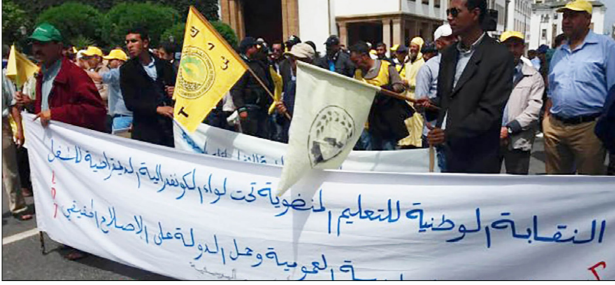
جانب من مسيرة الرباط

الذي اشتغل على إزاحة بنكيران وإضعاف حزب العدالة والتنمية، وخط الأوراق حتى تكون هناك حكومة مخزنية، مشيراً إلى أن «أغلب مسؤوليها الذين يتكفون في الميزانية الأساسية هم خارج الأحزاب السياسية وهم إما من خدام الدولة الأوفياء أو التكنوقراط الذين تم صبغهم في آخر لحظة بالوان سياسية». وكتفت دراسة المجلس الأعلى للتعليم التربية والتكوين والبحث العلمي، صدرت مؤخراً، عن معطيات صادمة لواقع التعليم في المغرب والاقتصاد والاجتماعية المنشودة، وكان قد تم وضع مخطط استراتيجي لعامي 2009 و2012، والذي هدف إلى وضع خريطة طريق جديدة لإعطاء نفس جديد لإصلاح منظومة التربية والتكوين، من أجل ضمان تكافؤ فرص دخول التعليم الإلزامي، ومحاربة ظاهري التكرار والانقطاع عن الدراسة، وشمل تعزيز كفاءات الكوادر التربوية، وتطوير البنيات وتنوع وتقييم الأطر التربوية، وترشيد تدبير الموارد البشرية للمنظومة، واستكمال ورش تطبيق اللامركزية، واسترجاع الثقة في المدرسة، وضمان مشاركة الجميع في هذا الورش الحيوي. وبالرغم من الجهود المبذولة، يرى مراقبون، أن التعليم في المغرب، ما زال يعيش أزمة بنيوية تجعل وضعه وتحسينه أمراً صعباً، خصوصاً في تعليم القدرات على الكتابة والتفكير والحساب وتفريخ أفواج العاطلين.