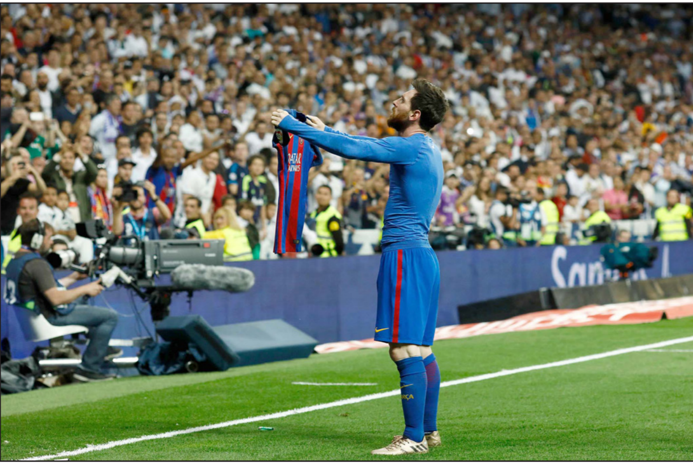
المتائق ميسي يعرض قميصه بفخر على جماهير الريال عقب تسجيل هدف الفوز في الوقت القاتل