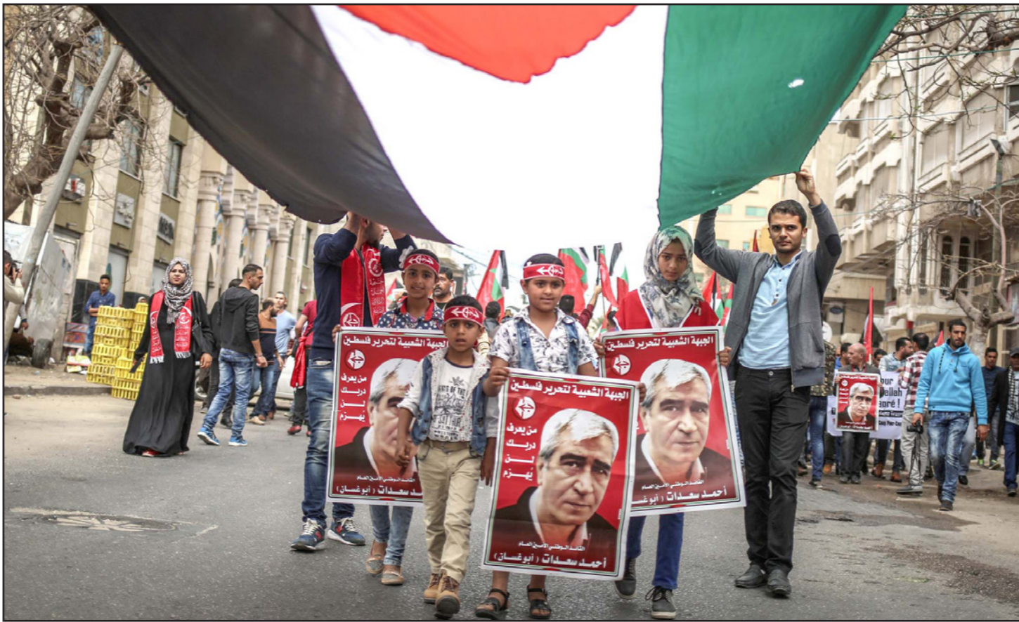
مسيرة للجبهة الشعبية لتحرير فلسطين في غزة تضامناً مع الأسرى في إضرابهم أمس

وأشار إلى «خطة بديلة» دون أن يكشف فحواها، يضعها المضربون للتعامل مع التطورات، ويهدف استمرار الإضراب عن الطعام، لتعمل طرقاً للتواصل فيما بينهم. وتوقع أن يخرج أحد قادة الإضراب قريباً ويوصل رسالة إلى الخارج، على غرار تلك التي بعث بها مروان البرغوثي