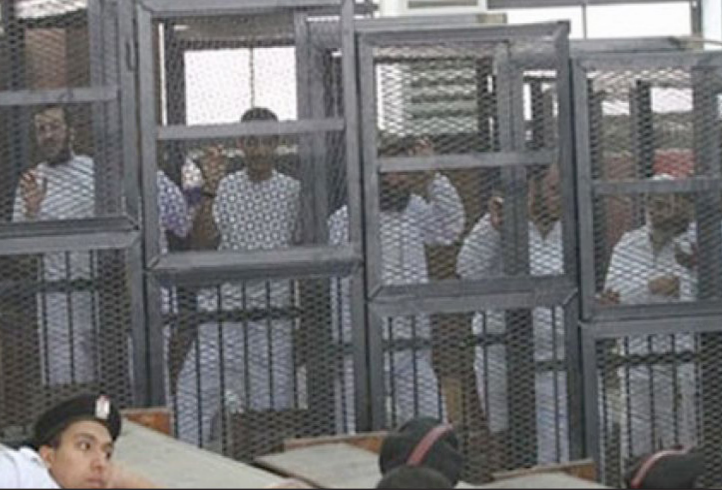
المتهمون داخل المحكمة

حملة للتضامن مع الداعية المحكوم عليه بالإعدام، قبيل نظر الطعن على الحكم بإعدام، تصدرت موقع «تويتر»، ونشرت أسيرة مولى صوراً لتظاهرات في الإسكندرية ضد حكم الإعدام. كذلك، نظمت فعاليات تضامنية مع المولى، الأيام الماضية، أمام محكمة الإسكندرية ونادي المهندسين، للتدبير بالحكم عليه.