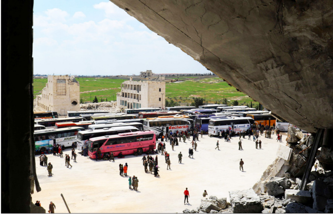
صورة أرشيفية إحدى عمليات تبادل الأسرى لسكان بلدي كفريا والفوعة منتصف الشهر الحالي

الحروقة»، من خلال استخدام القنابل الفوسفورية والقنابل الحارقة على مناطق المدنيين، وقال محمدر رشيد الناطق باسم جيش النصر المنضوي تحت لواء الجيش السوري الحر إن طائرات روسية كثفت قصفها قبل أن يبدأ «النظام» الهجوم البري وإن ذلك ساعد قوات الحكومة على التقدم. وقصفت طائرات حربية حلفايا ومساحات من الأراضي القريبة من الطريق السريع في منطقة شديدة الأهمية لحكومة الرئيس بشار الأسد التي تعزز سيطرتها على غرب البلاد المتخذ بلسكان. وقالت فصائل المعارضة، التي يقودها جهاديون كانوا ينتمون لفرع تنظيم القاعدة وتضم أيضاً جماعات تابعة للجيش السوري الحر، بشراسة للدفاع عن البلدات في الأيام القليلة الماضية. وتعني سيطرة الجيش في وقت سابق على صوران، البوابة الشمالية إلى حماة، أنه استرد معظم الأراضي التي سيطر عليها مقاتلو المعارضة في هجوم كبير الشهر الماضي. وبمساعدة حلفائها أصبحت للقوات الحكومية اليد العليا في الحرب المستمرة منذ ستة أعوام على مجموعة واسعة من فصائل المعارضة تشمل بعض الجماعات التي تدعمها تركيا والولايات المتحدة ودول خليجية.