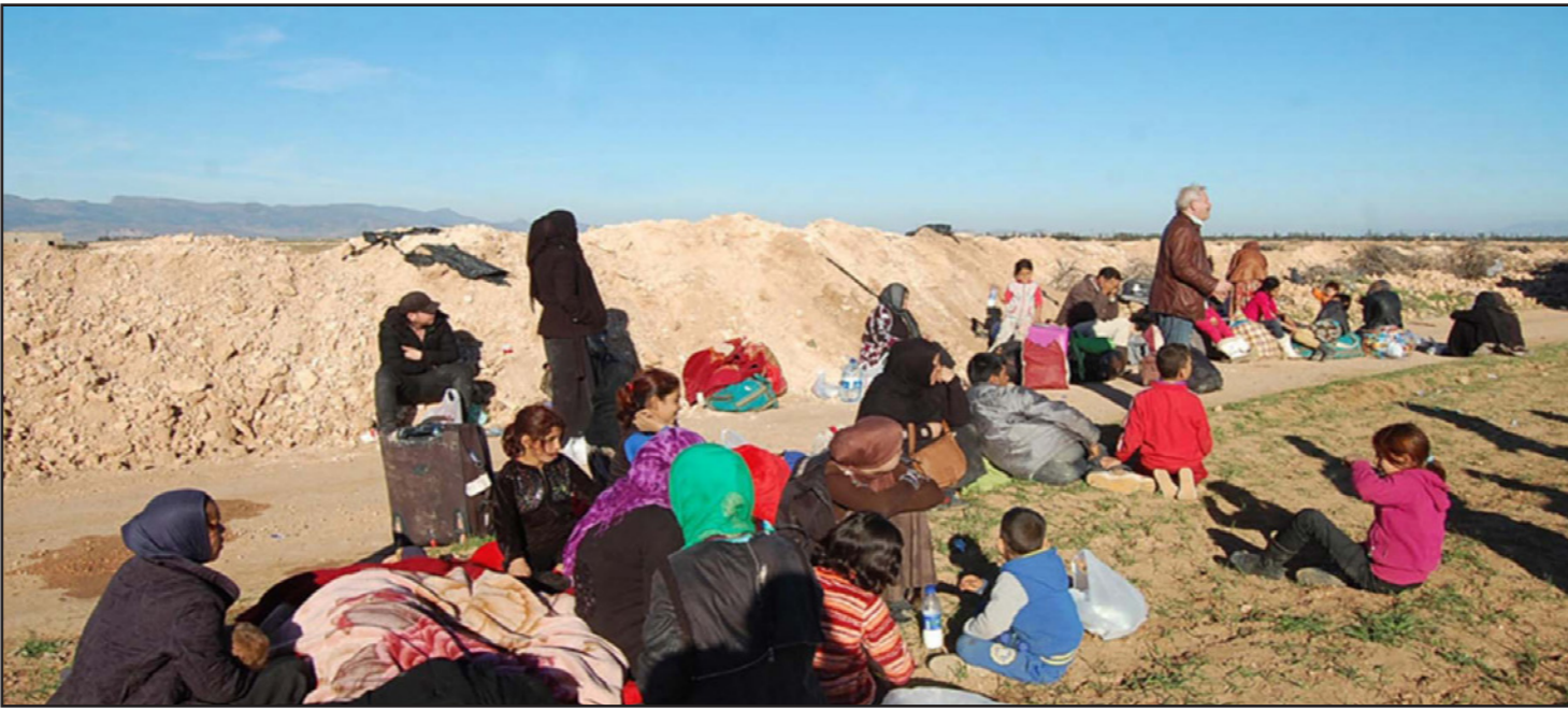
لاجئون سوريون عالقون على الحدود الجزائرية المغربية

استقبلت الخارجية الجزائرية الأحد سفير المغرب بهالرفض القاطع، «لإتهامات» السلطات المغربية «الخطيرة» التي تحمل الجزائر مسؤولية محاولة مزعومة لرعايا سوريين دخول التراب المغربي بطريقة غير قانونية من الجزائر، مؤكدة أن هذه الادعاءات لا هدف لها سوى الإساءة إلى الجزائر، وأن سياسة الهروب إلى الأمام لن تعفي المغرب من الانسدادات التي يعرفها الفضاء المغربي. وقال بيان صادر عن وزارة الخارجية الجزائرية إنه على إثر الاتهامات التي وجهتها السلطات المغربية إلى السلطات الجزائرية، والتي تحملها فيها مسؤولية محاولة مزعومة لرعايا سوريين دخول التراب المغربي بطريقة غير قانونية انطلاقاً من الجزائر، استقبل سفير المملكة المغربية بمقر وزارة الشؤون الخارجية، وذلك لإبلاغه بالرفض القاطع لهذه الادعاءات الكاذبة، كما أكد مسؤولو الخارجية الذين استقبلوه على الطابع غير المؤس تماماً لهذه الادعاءات، والتي لا ترمي، حسب البيان، سوى «للاساءة إلى الجزائر الكرم والضيافة التي تتميز بها». وأضاف البيان أنه تم «لفت انتباه» السفير المغربي أن «السلطات الجزائرية نخصت على السمتة في بني ونيف (بشار) يوم 19 أبريل / نيسان على السمتة لـ 55 دقيقة صباحاً محاولة من السلطات المغربية طرد لثلاثة عشر شخص منهم نساء وأطفال نحو الأراضي الجزائرية قادمين من التراب المغربي»، وأنه «تمت ملاحظة خلال اليوم نفسه على السمتة الخامسة لـ 30 دقيقة مساءً في المركز الحدودي نفسه، إقدام السلطات المغربية على نقل 39 شخصاً آخر،