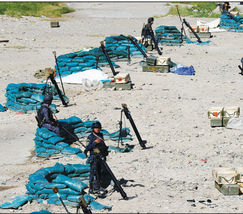
عناصر من الشرطة العراقية خلال استراحة من القتال مع تنظيم «الدولة الإسلامية» في غرب الموصل أمس