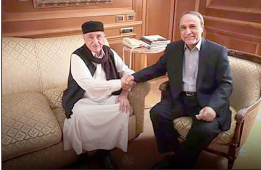
«لقاء روما» السري الذي جمع مؤخراً رئيس المجلس الأعلى للدولة الليبي عبد الرحمن السويحلي ورئيس البرلمان عقيلة صالح