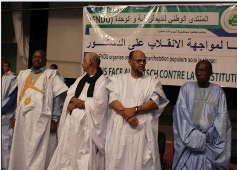
جانب من الحملة

وزاد التجاذب حدة أمس بسبب اعتقال الأمين الويرتاني مجموعة من شباب حركة «حال تغيير الدستور» في مدينة نواذيبو شمال البلاد، بعد أن انتهزوا وجود الرئيس ولد عبد العزيز في المدينة فردوا شعارات وعممو كتابات على جدران الأحياء ورافضة للتعديلات الدستورية. وأعلن محمد جميل منصور رئيس حزب التجمع (محمسي على الإخوان) والرئيس الدوري لمنتدى المعارضة في مهرجان نظمته المعارضة تحت شعار «معاً لمواجهة الانقلاب على الدستور»، «أن المعارضة بمناضليها ونشطاتها ستنتزل إلى الشارع للتعبير عن رفض تعديلات الدستور التي تسعى الحكومة جامدة