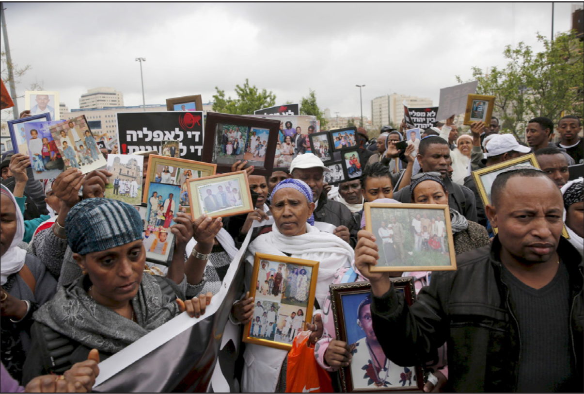
احتجاجات اسراييليين من أصول اثيوبية في تل ابيب

الآخرى، لاحظ ان هذه هي الجماعة الأكثر تعليما في إسرائيل، في سارق واضح مع الجماعة الأخرى. فمستوى التعليم، ليس فقط في إسرائيل، هو بشكل عام ميزة واضحة للجماعات التي تميل إلى قبول الجماعات الأخرى في المجتمع. ثمة في جملة العطايات مكتشفات ايجابية، ايجابية كبيرة من الإسرائيليين، يهود وعرب، يشعرون بارتياح من كونهم في إسرائيل. ثمة امور لا تزعمهم، ربما كانت كذلك ذات مرة، فمثلا، عندما سألنا إذا كان ينبغي للشركيين والغربيين في إسكتلندا في احياء مشتركة، كان الجواب جازفا، نحو 90 في المئة من اليهود يعتقدون أن نعم، نسبة صغيرة جدا فقط (بيرزون بين اليهود الذين جاؤوا من دول الاتحاد السوفياتي، أي من لعلم لم يستوعبوا بعد رمز آتون الصهر الإسرائيلي) أكثر تحفظا، وفي التوزيع إلى بين المجتمع المشترك مع غير اليهود أقل، هناك غير قليلين يهود يربون مثل هذا الاختلاف، بمعنى أن نصف اليهود (46 في المئة) قالوا انهم يوافقون تماما أو جزئيا على القول بكت أو ان يتعلم في مدرسة ابناي تلاميذ غير يهود أيضا»