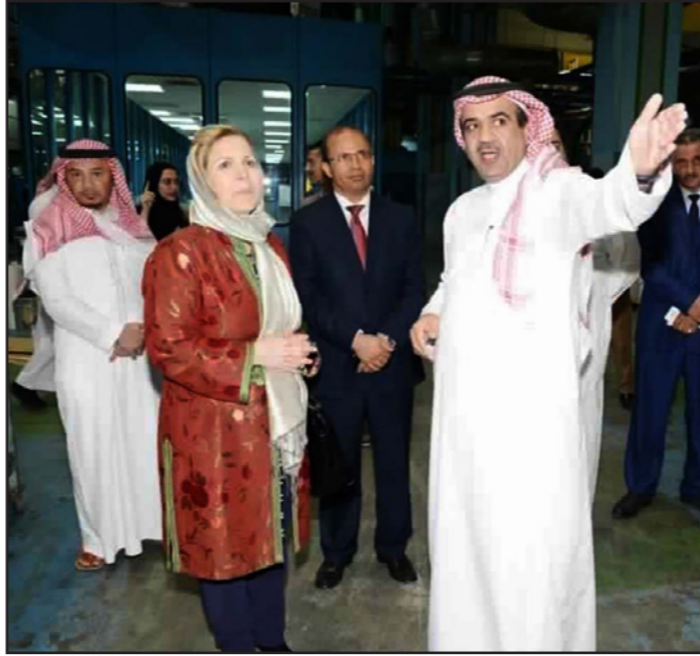
وزيرة السياحة التونسية سلمى اللومي خلال زيارتها الأخيرة إلى السعودية

وتساءلت إحدى مستخدمي موقع «فيسبوك» عن «الرسالة» التي تنوي اللومي إيصالها عبر ارتدائها للحجاب في السعودية، رغم أنها تنتمي إلى حزب علماني (نداء تونس)، فيما أنشاد مستخدم آخر بتهنئة الخطوة، داعياً اللومي إلى استغلال هذا الأمر لعودة الدين وارتداء الحجاب، على اعتبار أن تونس هي بلد مسلم.