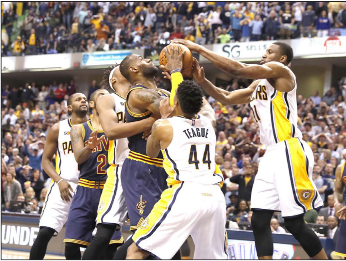
لاعبو بيسرز يحاولون جدهم تخليص الكرة من نجم كافاليرز لبيرون جيمس

■ واشنطن - رويترز: ستلعب الولايات المتحدة في ضيافة بيلاروسيا في نهائي كأس الاتحاد للسيدات للفرق السيدات في نوفمبر/ تشرين الثاني المقبل بعد اجتياز الفريقين الدور قبل النهائي. وفي فلوريدا تفوقت أمريكا 2-3 على التشيك بعد الفوز في مباراة الزوجي الحاسمة والأخيرة. وتألقت كوكو فاندفيجه المصنفة 24 عالمياً وفازت بمبارتين للفردى قبل أن تعود بعد ساعات للعب مع بيتاني ماتيك-ساندرز وتحقق الفوز في لقاء الزوجي 2-6 و3-6 على كريستينا بليسكوفا وكاترينا سينياكوفا. وحسنت فاندفيجه الانتصار بفصل ضربات إرسالها القوية وحققت فوزها الثالث في المواجهة لتتأهل أمريكا إلى النهائي لأول مرة منذ 2010. وأنهت مسارة الفريق التشيكي، الذي خاض المواجهة بتشكيلة من الصف الثاني في ظل غياب عدة لاعبات بارزات، أماله في الفوز باللقب للمرة الرابعة، ونجحت بيلاروسيا على أرضها في الفوز بمباراتي الفردى لتتقدم المواجهة بالتقدم 3-1 أمام سويسرا التي قلصت الفارق في مباراة الزوجي الأخيرة غير المؤثرة. وضمنت بيلاروسيا التأهل للنهائي عقب فوز أريتا سابلينكا على فيكتوريا يولوبيتش 3-2 و6-2 و4-6 وبعدها تفوقت قبلها البياكسندرا ساسنوفيتش على تيميا باشينسكي 2-6 و7-6. ولم يفز الفريق الأمريكي بكأس الاتحاد منذ 2000 بينما استحوذ بيلاروسيا النهائي للمرة الأولى وستستضيف المواجهة في 11 و12 نوفمبر.