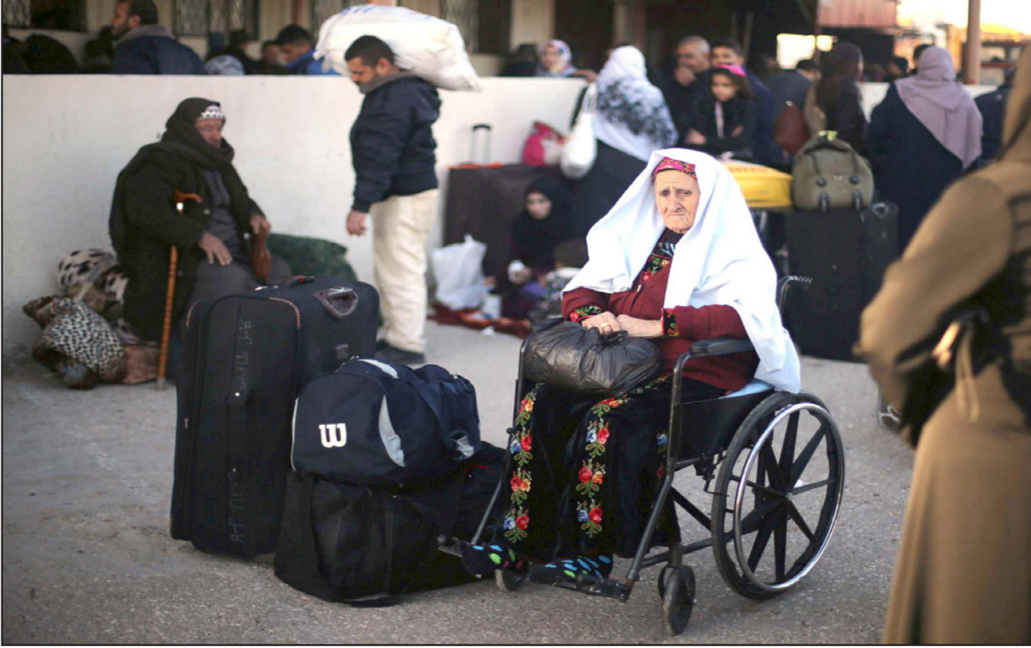
حالات إنسانية صعبة تنتظر فتح السلطات المصرية لمعبر رفح

تلك تضر عملية الإغلاق بأصحاب الإقامات في الخارج، الذين يخشون كما مررت سابقا أن تنتهي مدد تأشيراتهم في