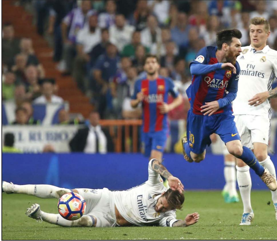
اللحظة التي أعاق فيها راموس نجم البارسا ميسي بخشونة وجنى على أثرها البطاقة الحمراء

■ مدريد - د ب أ: أكد جيرارد بيكيه، مدافع برشلونة، أن الجيل الحالي من لاعبي فريقه كان الوحيد القادر على إلحاق الهزيمة بريال مدريد على ملعبه في الوقت بدل الضائع للمرة الأولى في التاريخ. وردا على سؤال عما إذا كان يعرف أن الريال لم يتذوق أبدا طعم الهزيمة على ملعب (سانتياغو برنابيو) في الدقيقة 92، قال بيكيه: «كنت أعرف هذه المعلومة وهي غريبة للغاية»، وأضاف: «تاريخ الريال يمتد لسنوات وكان جيلنا الوحيد القادر على القيام بمثل هذا»، وأعرب عن سعادته بالفوز، مؤكدا أنه سيكون أمرا مؤسفا إذا لم يتمكن برشلونة من تحقيق اللقب هذا الموسم، واستطرد: «سيكون من المؤسف ألا نفوز باللقب، لأن مباراة مثل هذه تظهر مدى قوتنا كفريق، لكننا في الحقيقة ارتكبنا حماقات كثيرة، وإذا لم نغز بالبطولة فإن ذلك سيكون بسبب المباريات التي قدمناها»، وأوضح بيكيه، الذي تجمع بعد دفاع الريال سيرجيو راموس حرب شعواء عبر مواقع التواصل الاجتماعي، أن البطاقة الحمراء التي ضاعها قائد النادي الملكي في الدقيقة 76، بسبب تدخله العنيف ضد ميسي، كانت مستحقة، وتابع: «عندما يصل إلى بيته سيحضر بالندم على الكلمات التي قالها لأنها كانت لعبة واضحة»، في إشارة إلى تحدث راموس معه بحدّة خلال خروجه من الملعب بعد حصوله على البطاقة الحمراء.