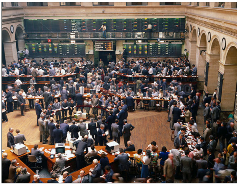
قاعة المعاملات في بورصة باريس