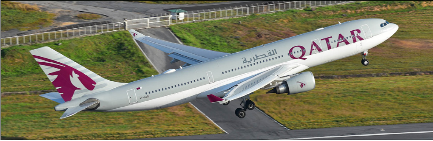
طائرة من «الخطوط الجوية القطرية»

شركة الطيران الإيطالية، و«ميرديانا»، التي تُسبِّر رحلات إلى ومن جزيرة سردينيا ووجهات أخرى في إيطاليا، مملوكة لرجل الأعمال أفغان زعيم الطائفة الإسماعيلية، كما قال الباكر ان شركته ستقدم طلبا مع «جهاز قطر للاستخبارات» للحصول على رخصة تشغيل شركة هندية للطيران الداخلي في الأسابيع القليلة المقبلة، وسيملك الجهاز حصة الأغلبية في الشركة القطرية، فيما ستسيطر «القطرية» على حصة أقلية.