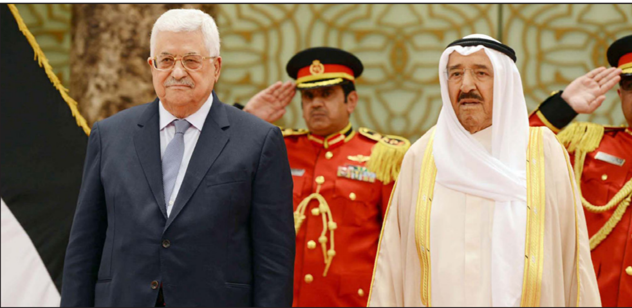
أمير الكويت الشيخ صباح الأحمد الجابر الصباح خلال استقباله الرئيس الفلسطيني محمود عباس

الحمد الصباح، ورئيس مجلس الأمة الكويتي مرزوق علي الغانم، واستقبل الرئيس وفق ما ذكرت وكالة الأنباء الفلسطينية «فانا»، في مقر إقامته بخصر بيان في الكويت، مساء الأحد، وزير الخارجية وسبل تعزيزها وتنميتها على كل الأصعدة، إضافة إلى توسيع أطر التعاون بين البلدين بما يخدم مصالحهما المشتركة، ودعم وحدة الصف وسيرة العمل العربي المشترك، وآخر المستجدات على الساحة الإقليمية والدولية.