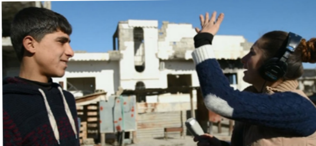
مشهد من «راديو كوباني»

اختتمت في مدينة الإسماعيلية في مصر مساء الأحد فعاليات الدورة التاسعة عشرة لمهرجان الإسماعيلية السينمائي الدولي للأفلام التسجيلية والقصيرة