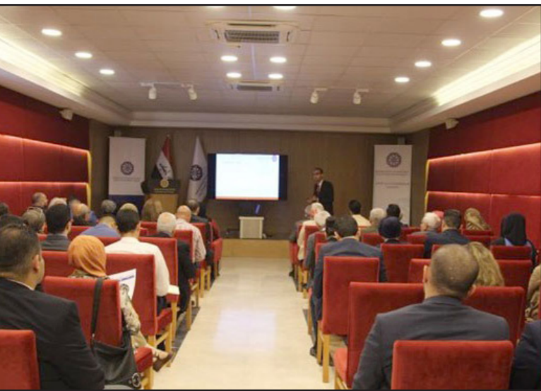
جانب من الندوة

وكانت مصادر في مدينة البصرة، أكدت لـ«القدس العربي» أن النزاعات المسلحة بين عشائر المحافظة تتفاقم بعد استخدام العشائر أسلحة متوسطة وثقيلة في مصادمات شبه يومية.