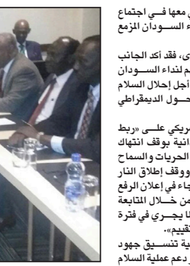
صورة أرشيفية للمفاوضات بين الحكومة السودانية والمعارضة

الافريقية رقيقة المستوى بقيادة امبيكي وأمريكا». وأبدى رغبة بلاده في مواصلة الجهود مع الحكومة السودانية لحل العديد من القضايا، بينها تعزيز أوضاع حقوق الإنسان والحريات في البلاد، مشيراً إلى أن ذلك يسهم في تدعيم العلاقات بين أمريكا والسودان.