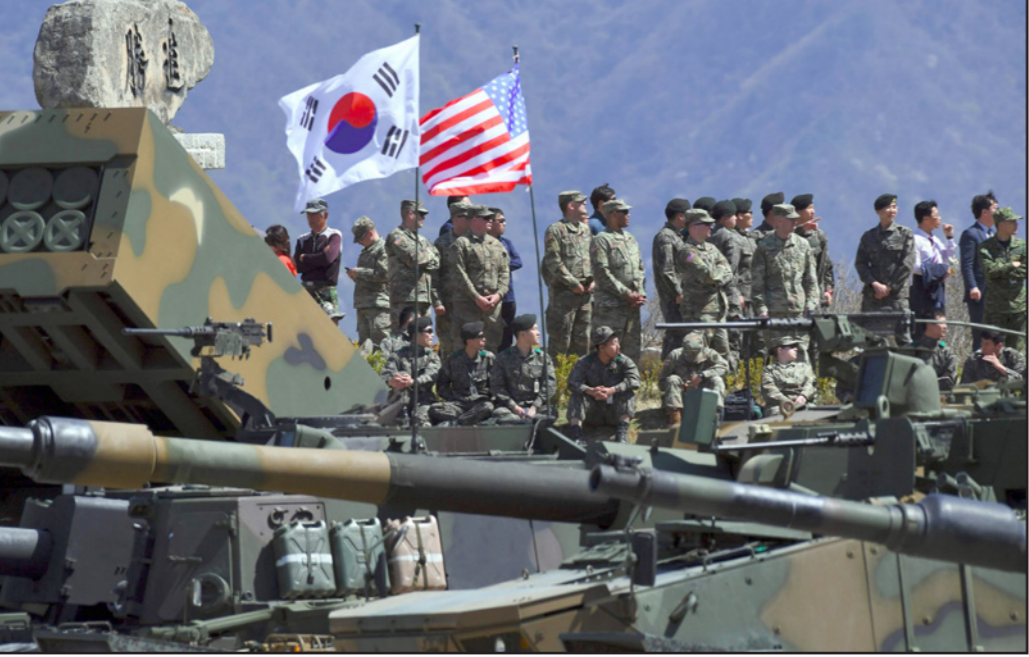
تدريبات عسكرية أمريكية كورية جنوبية

للخطوط الحمراء لن تسمح به الولايات المتحدة. إن استدعاء اعضاء مجلس الشيوخ المنة لاجراء لقاء ارشاد مع القيادة السياسية والعسكرية هدف إلى التأكيد على أن الادارة تصمم على بلورة تاييد واسع من الحزبين في حال اضطرت إلى عملية عسكرية ضد كوريا، حيث يمكن أن تشدد الازمة وتصبح مشابهة للازمات التي حدثت في زمن الحرب الباردة. نحن الآن موجودون في ظروف واضحة، حيث أن التشاور وتقديم التقارير في حالة الطوارئ يتم في العادة مع رؤساء المجلسين أو مع جماعة منهم، لكن ليس مع جميع الشريخين، ومن اجل منح هذه الخطوات المصادقية فقد قرر الرئيس اشراكهم في الاعمال الميدانية، وعبر عن استعداد للاقتراب من شفا الهاوية إذا استمرت بيونغ يانغ في اعمالها التصديدية والخطيرة. هذه الاقوال والافعال لا تهدف إلى ردع الديكتاتور في كوريا الشمالية فقط، بل تهدف إلى حث القيادة الصينية لاستخدام الضغط على بيونغ يانغ، المرخصة وغير المنصاعة، وما زال من السابق لأوانه القول أن كانت التحذيرات والتهديدات التي كبحت كيم في «يوم الشمس» سستنجح في هذه المرة أيضا في تقيد الزعيم غير المتوقع، وهذا لأن المناورة التي تجري الآن في كوريا الشمالية ردا على الاجراءات الأمريكية، تؤكد على أنه ما زال من المبكر الاحتفال، وأن كيم لن يتنازل بسهولة في موضوع تجميد الشروع النووي.