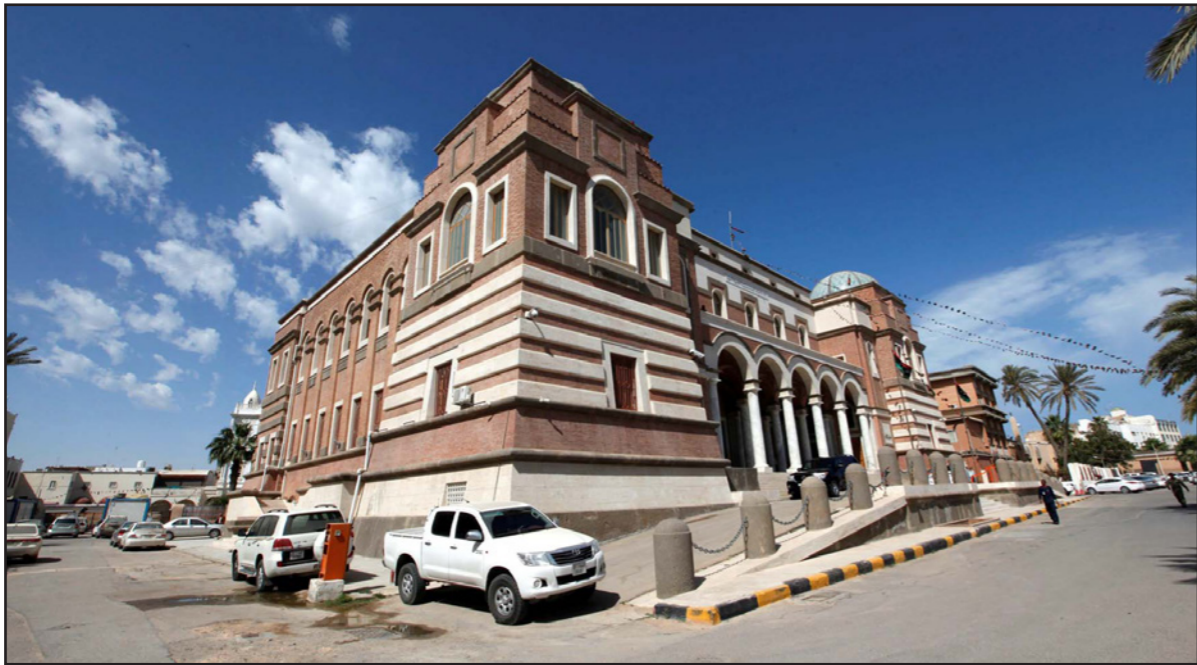
المقر الرئيسي للبنك المركزي الليبي