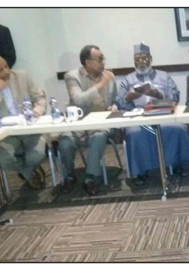
صورة أرشيفية للمفاوضات بين الحكومة السودانية والمعارضة

الافريقية رقيقة المستوى بقيادة امبيكي وأمريكا». وأبدى رغبة بلاده في مواصلة الجهود مع الحكومة السودانية لحل العديد من القضايا، بينها تعزيز أوضاع حقوق الإنسان والحريات في البلاد، مشيراً إلى أن ذلك يسهم في تدعيم العلاقات بين أمريكا والسودان.