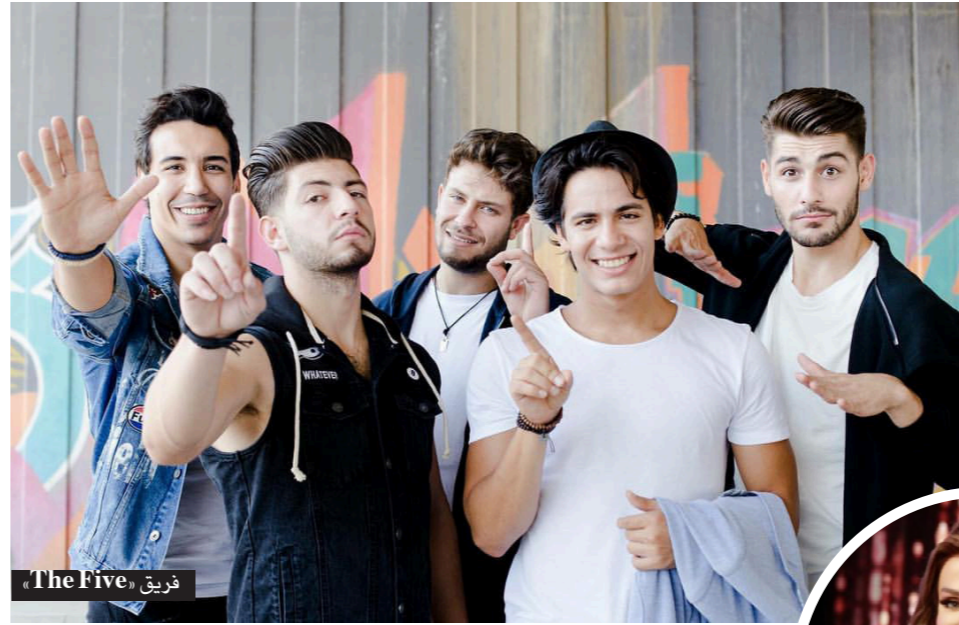
فريق «The Five»

وفازت النجمة مايا دياب بجائزة أفضل فيديو كليب عن كليتها «سبع تروح»، وكذلك نال المخرج جو بوعيد جائزة أفضل مخرج فيديو كليب. وشكرت دياب في المناسبة جهاد المر لأنه قرر أن يأخذ الجوائز إلى منحنى عالمي، وقالت «إن أمنيته كانت أكبر ولكي تتحقق أمنيته كنت أتمنى أن يكون كل الفنانين المرشحين موجودون ويعلمون اسم الفائز مباشرة لتتعلم أن نصفك لبعضنا وأن نحب نجاح الآخر. ولهذا سأبارك لكل فنان نال جائزة في هذا الحفل.. في كثير جوائز نعم ندفع ثمنها لننالها لكن الجائزة الأهم هي التي ننالها بجدارة بعد تعب وجهد كما جائزة اليوم». كما كانت جائزة تكريمية للموسيقار الراحل ملحم بركات ستسلمها اللجنة المنظمة إلى عائلة بركات التي تعيّن عن الحفل، وكان لافتًا للغاية التكريم من قبل نجوم برنامج «The Voice Kids» لبن الحايك، زين عبيد، أمير عموري وغدي بشارة للموسيقار ملحم بركات عبر تقديمهم باقة من أجمل أغانيه التي تقابل معها الحضور. أما جائزة أفضل ملحن للعام 2016 فنالها فضل سليمان، وحظيت الفنانة شيرين عبد الوهاب وحسام حبيب بجائزة أفضل ديو غنائي. وجاءت بقية الجوائز على الشكل التالي: - نجم البلد المضيف: الفنان وائل جبار الذي غادر الحفل قبل أن يستلم جائزته. - الأغنية الأكثر تحميصًا واستماعًا: «ملاكي» للفنان حسين الديك الذي شكر القيمين وهدى الجائزة إلى بلده سوريا. - جائزة الموسيقى المستقلة: فرقة المربع الأردني. - موزع العام: عمر الصباغ. - أفضل أغنية لفنان من المشرق العربي: «نسخة منك» للفنان أدهم نابلسي.