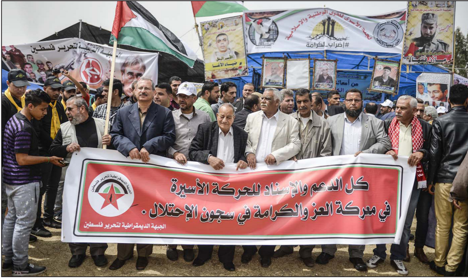
مسيرة للجمعية الديمقراطية في غزة تضامناً مع الأسرى

مسيرات ووفود رسمية وشعبية تواصل التضامن مع المضربين 500 قيادي في الجهاد يضربون اليوم عن الطعام إسناداً للأسرى.. ومركز حقوقي يطالب بـ«التدخل الفوري» لإنقاذ حياتهم