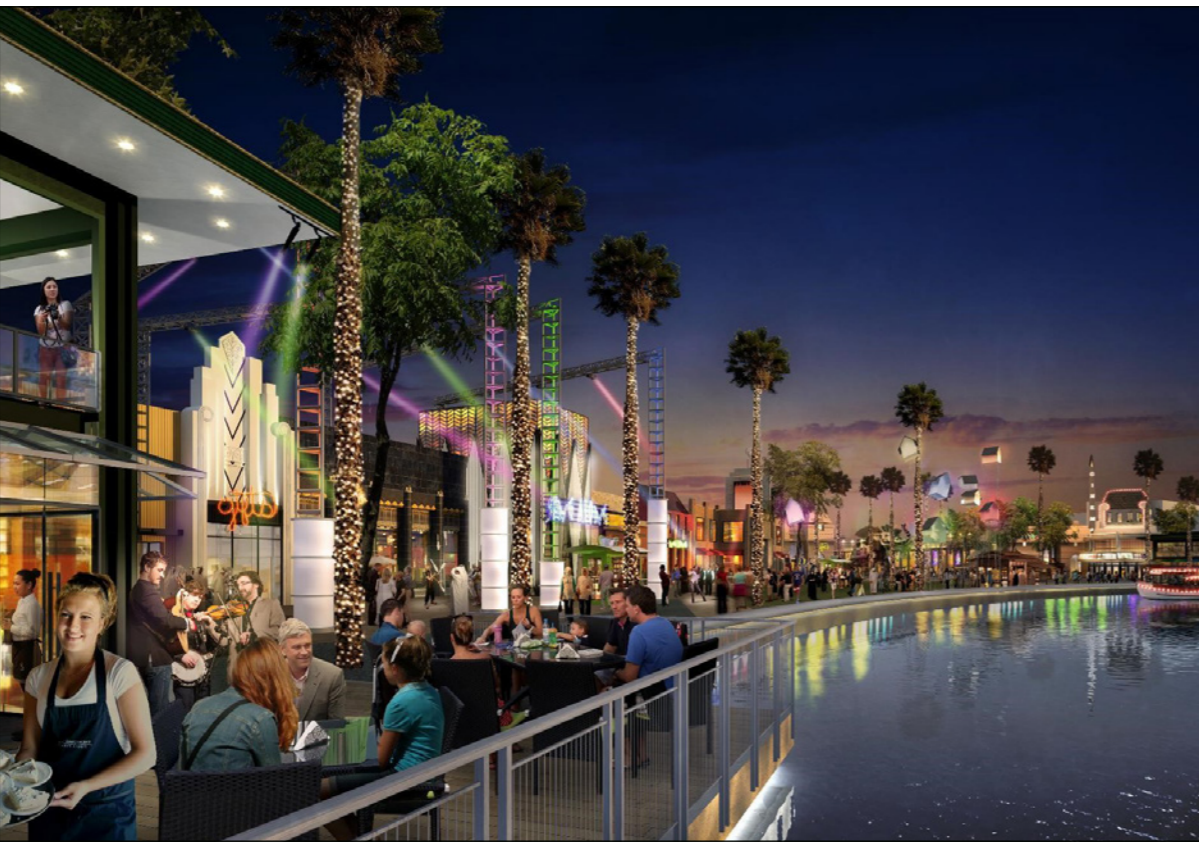
مقاهي ومطاعم تطل على قناة اصطناعية في احد مشروعات «ديزني باركس»