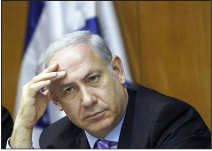
رئيس الوزراء الإسرائيلي بنيامين نتنياهو

يكره إسرائيل هو هتكر، والعالم ينقسم إلى قسمين، الأمم المتتورة من جهة والاساميون النازيون من جهة أخرى، وبالتالي، فإن كل انتقاد لاسرائيل يعتبر لاسامية». ريفلين لم ينكر نتنياهو باسمه، لكنه وصف بالضبط طبيعة تصريحاته ومواقفه دائما. بالنسبة لتنتياهو كان ياسر عرفات هتكر وكذلك محمود احمدي نجاد، وكان جيمس بيكر لاساميا وكذلك براك اوباما، وكى لا يشك أحد بان ما كان هو ما سيكون، جمع نتنياهو في خطابه الذي القاه بعد ريفلين، بين إيران وتنظيم الدولة الإسلامية «الذين يسعون إلى القضاء علينا»، وبين اللاسامية الجديدة - القديمة التي تسود في الغرب وفي مؤسسات الامم المتحدة.. بعد ذلك اقسام نتنياهو بالدفاع عن اسرائيل «باسم ضحايا الكارثة»، وبجملة من الصعب القول إذا كانت ذروة التعلق أو ذروة