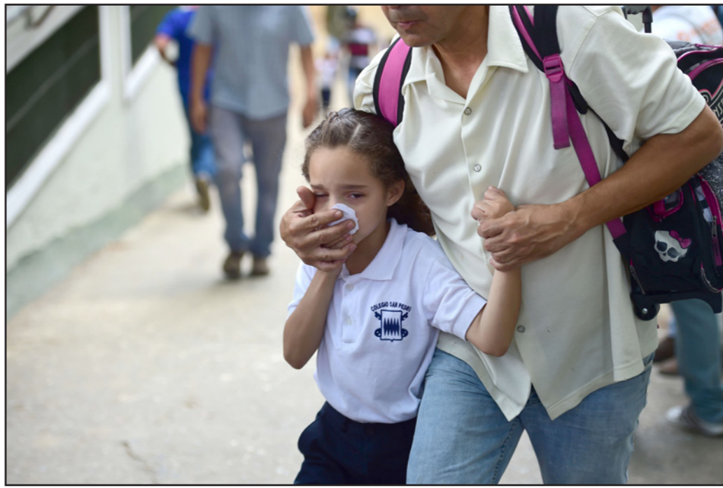
طلاب مدارس يغرون من الغاز المسيل للدموع أثناء مظاهرات في كراكاس

واتهامات من المعارضة بتنفيذ «انقلاب» على البرلمان. ويشهد هذا البلد الغني بالنفط الذي تأثرت عائداته بسبب تراجع سعر الخام، نقصاً في المواد الغذائية والأدوية. ودعا الرئيس الفنزويلي المعارض إلى استئناف الحوار المجدد منذ كانون الأول/ديسمبر 2016 ودعا الجابيا فرنسيس إلى «مواكبة» هذه المباحثات، وكانت وساطة برعاية البابا فشلت العام الماضي. وقال كيريلوس «الحوار الوحيد الذي يريده الفنزويليون هو إجراء انتخابات حرة وديمقراطية والتصويت».