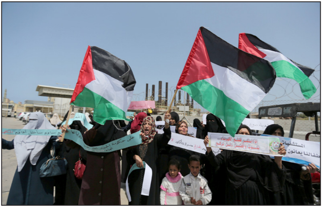
فلسطينيات يتظاهرن لصعوبة الظروف المعيشية في غزة

رام الله للبحث في الموضوع وللإطلاع على الاتصالات بين ممثلي فتح في القطاع وممثلي حماس. وكان عباس عرض في الشهر الماضي موضوع تشديد العقوبات في محاولة لممارسة الضغط على حماس عشية سفر عباس إلى واشنطن للقاء بالبرئيس الأمريكي دونالد ترامب، ولكن في حماس لا يخافون آثار رفضهم، بشكل رسمي على الأقل. وقال عضو المكتب السياسي لحماس في القطاع صلاح البردويل أن للمنظمة أوراق مساومة كثيرة ولكنها لن تستسلم للتهديدات بعباس. وأوضح: «نحن لن نلتقي الاملاءات التي لا تؤدي إلى أي مكان».