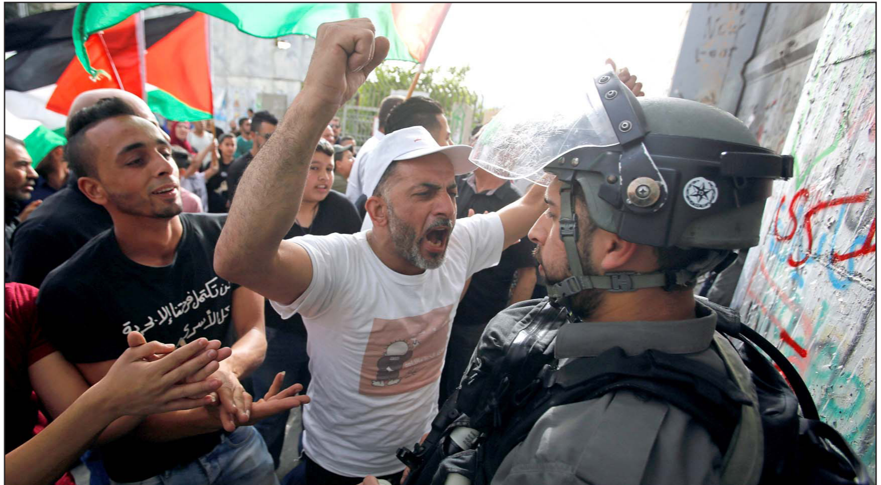
متظاهرون متضامنون مع الأسرى يتحدون جنود الاحتلال في بيت لحم جنوب الضفة أمس