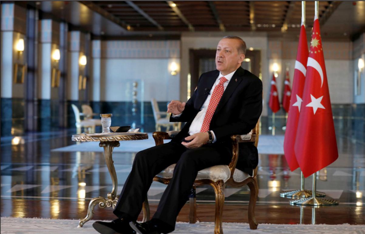
الرئيس التركي رجب طيب اردوغان يتابع سياساته في التخلص من جماعة فتح الله غولن

تشكيل الأمن التركي. وكشفت صحيفة حربييت التركية تفاصيل جديدة عن العملية، لافتة إلى أن الأمر متعلق بالأمم المتحدة وبالتعاون مع الاستخبارات من الوصول إلى قائمة أسماء «خطيرة» تضمنت أسماء عناصر فاعلين منتمين إلى تنظيم غولن في بنية الدولة وخاصة الأمن. وأوضحت الصحيفة أن القائمة تضم قرابة 7 آلاف اسم، وأن الإدعاء العام والأمن يعملون على سرعة اعتقالهم جميعاً، وأشارت إلى أنه جرى إصدار قرار اعتقال بحق 4672 شخص، بينما تبين أن 1448 من الموجودات اسمائهم بالقائمة هم معتقلون فعلياً عقب محاولة الانقلاب بتهمة الانتماء والولاء لغولن. وفي الخامس عشر من يوليو/تموز الماضي جرت محاولة انقلاب عسكرية شارك بها عدد كبير من قيادات الجيش لكن الحراك الشعبي والأمني الذي قادته أجهزة أمنية مقربة من الرئيس رجب طيب اردوغان تمكن من إفضال المحاولة خلال ساعات. وعلى مدى الأسابيع التي أعقبت هذه المحاولة، شنت السلطات التركية حملات اعتقال واسعة شملت أكثر من 100 ألف متهمين بالمشاورة المباشرة أو الولاء إلى ما باتت تسميه الحكومة «تنظيم غولن الإرهابي». ما زال قرابة 47 ألف منهم يقعون في السجون. لكن الأشهر الأخيرة شهدت انخفاضاً كبيراً في أعداد المعتقلين على هذه الخلفية. وفي بداية العملية صباح الأربعاء، قال مكتب الإدعاء العام في أنقرة إنه توجد عملية أمنية