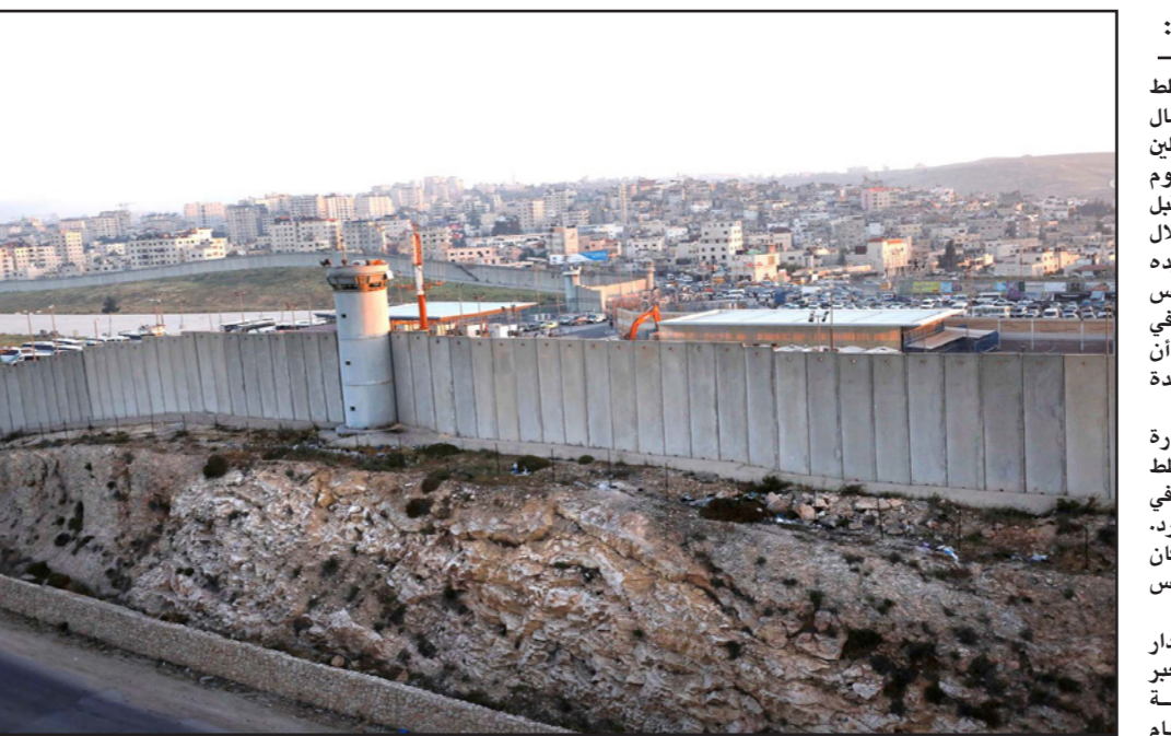
مشهد عام لمنطقة مطار قلنديا شمال القدس حيث تخطط سلطات الاحتلال لإقامة أكثر من 10 آلاف وحدة استيطانية

أرقام استيطانية منذ بداية العام الحالي فقط هو 16 ألف وحدة استيطانية وهو ما يفوق العام الماضي بنسبة 400 في المئة، كما أن المخطط يهدف بالخوض إلى استكمال بناء غلاف القدس الخارجي الذي يفصل القدس الشرقية عن محيطها الفلسطيني تماما. وتشرت بلدية الاحتلال في القدس خريطة لصدارة منطقة في حي راس العامود في القدس الشرقية، مجاورة للمقبرة اليهودية على جبل الزيتون، وذلك بهدف إقامة مركز للزوار والعلومات في المقبرة، وكما يبدو فقد بدأ العمل لإقامة المركز حتى قبل نشر الخريطة، ولا يعرف حتى الآن من هو صاحب الأرض. وتقع قطعة الأرض بين الشارع الرئيسي وجدار المقبرة في حي راس العامود، على مسافة قريبة من الحرم القدسي وبالقرب من مسجد راس العامود. وتم إعداد الخريطة من قبل سلطة تطوير القدس بالتعاون مع بلدية الاحتلال، وكتب في مقدمة الخريطة إنه «مقابل جبل الهيكل» أي الحرم القدسي» يقترح إقامة مركز خدمات للمعلومات والدين ومكان تجمع، هذا الموقع يسمح للزوار بتلقي الإرشادات والعلومات حول أماكن بدء إنشاء العائلات والأقارب، بواسطة الشرح والخرائط، وستتطلب من المركز مسارات للجوال بين القبور وسقاف فيه قاعة للتجمع وكنائس وتخطيط».