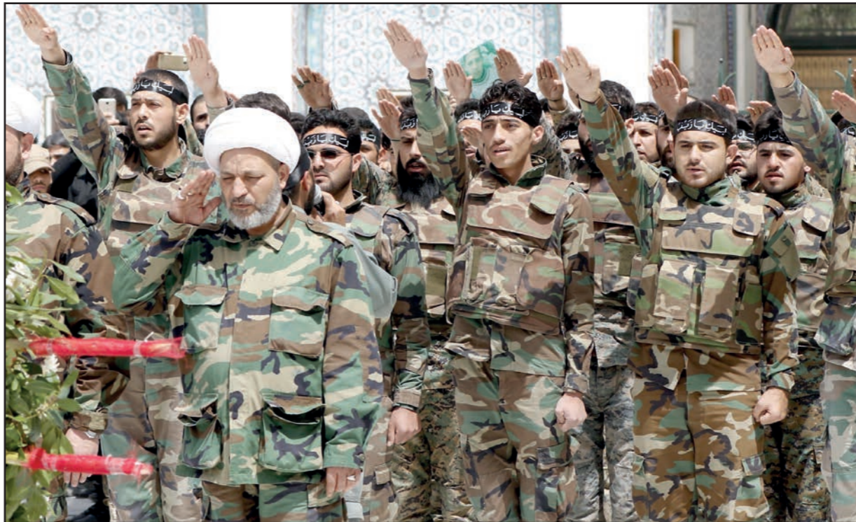
عناصر ميليشيا شيعية تابعة للنظام السوري خلال تآبين قتلى من قريتي كزريا والوفاة أمس