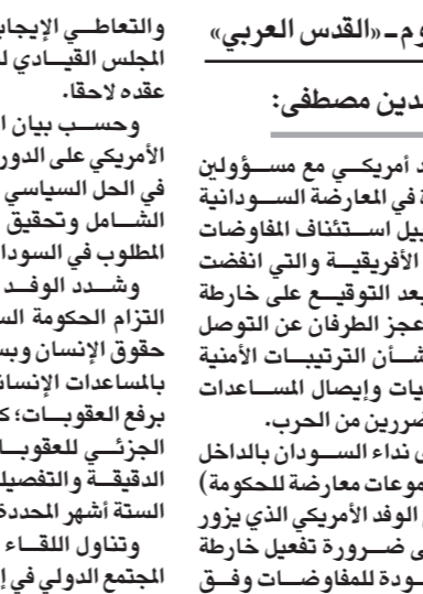
صورة أرشيفية للمفاوضات بين الحكومة السودانية والمعارضة

الافريقية رقيقة المستوى بقيادة امبيكي وأمريكا». وأبدى رغبة بلاده في مواصلة الجهود مع الحكومة السودانية لحل العديد من القضايا، بينها تعزيز أوضاع حقوق الإنسان والحريات في البلاد، مشيراً إلى أن ذلك يسهم في تدعيم العلاقات بين أمريكا والسودان.