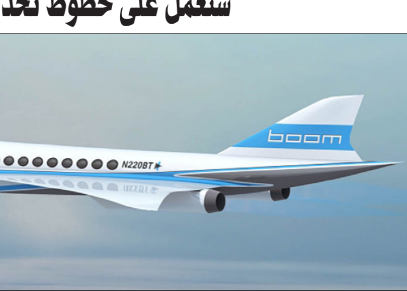
طائرة «يوم سوبر سونيك» الجديدة

■ دبي - د ب أ: شهدت مدينة دبي الإماراتية أمس الأربعاء عرض طائرة «يوم» التي تطير بسرعة تفوق سرعة الصوت، وتزيد سرعتها عن سرعة الطائرات التقليدية بمقدار 2.6 ضعف. وقال مسؤولون في شركة «يوم» للصحافيين أنه المقرر أن تربط الطائرة التجارية الجديدة دول الخليج ببقية دول العالم، وأوضحوا أن الرحلة بين دبي وسيدني في أستراليا تستغرق بالطائرات التقليدية نحو 15 ساعة، بينما سوف تستغرق 8 ساعات و17 دقيقة مع طائرة «يوم»، أما الرحلة من دبي إلى نيويورك فسوف تستغرق 7 ساعات و35 دقيقة بدل الساعات الـ 14 التي تستغرقها حالياً. وتتخذ شركة «يوم سوبر سونيك» من مدينة دنفر في ولاية كولورادو الأمريكية مقراً لها، وتستخدم تقنيات