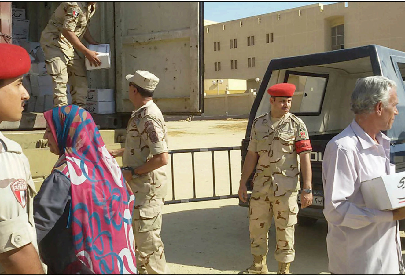
شاحنة الجيش المصري تتبع للمواطنين سلع بأسعار مدعومة

■ القاهرة – وكالات: أعلن الرئيس المصري، عبد الفتاح السيسي، أمس الأربعاء أن الجيش يقوم بدور تنموي مواز للدولة. وسبق للسيسي أن قال في نهاية 2016 أن حجم مشاركة القوات المسلحة في الاقتصاد الوطني لا يتجاوز 2% مستنكراً ما يردده منتقدون من أن الجيش يسيطر على نحو 50% من الاقتصاد المصري. وخلال كلمة له أمس أمام المؤتمر الدوري الثالث للشباب في مدينة الإسماعيلية، قال السيسي «قسما بالله الجيش يقوم بدور تنموي مواز للدولة (...). أنا شغلت الجيش عندكم، ومشغلته تحت رجلكم (أقدمكم عشان منقش (حتى لا تقع مصر)». ودعا المصريين إلى التحلي بالصبر لمواجهة المشاكل الاقتصادية، وشدد على أن «التحدي ما زال قائماً». واعتبر أن المواطن لن يشعر بالتحسن الحقيقي طالما لم يبلغ معدل النمو 8 و9% في ظل زيادة النمو السكاني بنحو 2.5%.