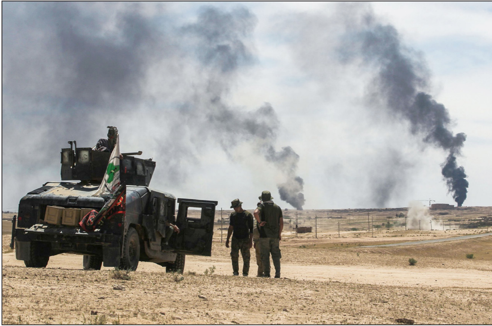
ناصر من الحشد الشعبي خلال معارك في العراق