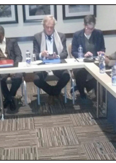
صورة أرشيفية للمفاوضات بين الحكومة السودانية والمعارضة

الافريقية رقيقة المستوى بقيادة امبيكي وأمريكا». وأبدى رغبة بلاده في مواصلة الجهود مع الحكومة السودانية لحل العديد من القضايا، بينها تعزيز أوضاع حقوق الإنسان والحريات في البلاد، مشيراً إلى أن ذلك يسهم في تدعيم العلاقات بين أمريكا والسودان.