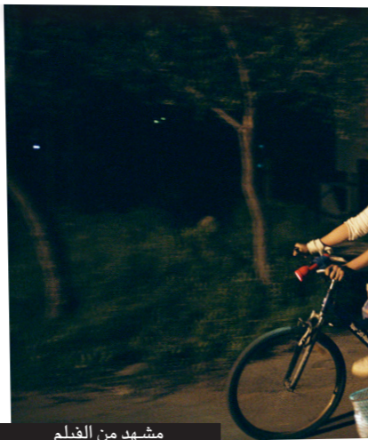
مشهد من الفيلم