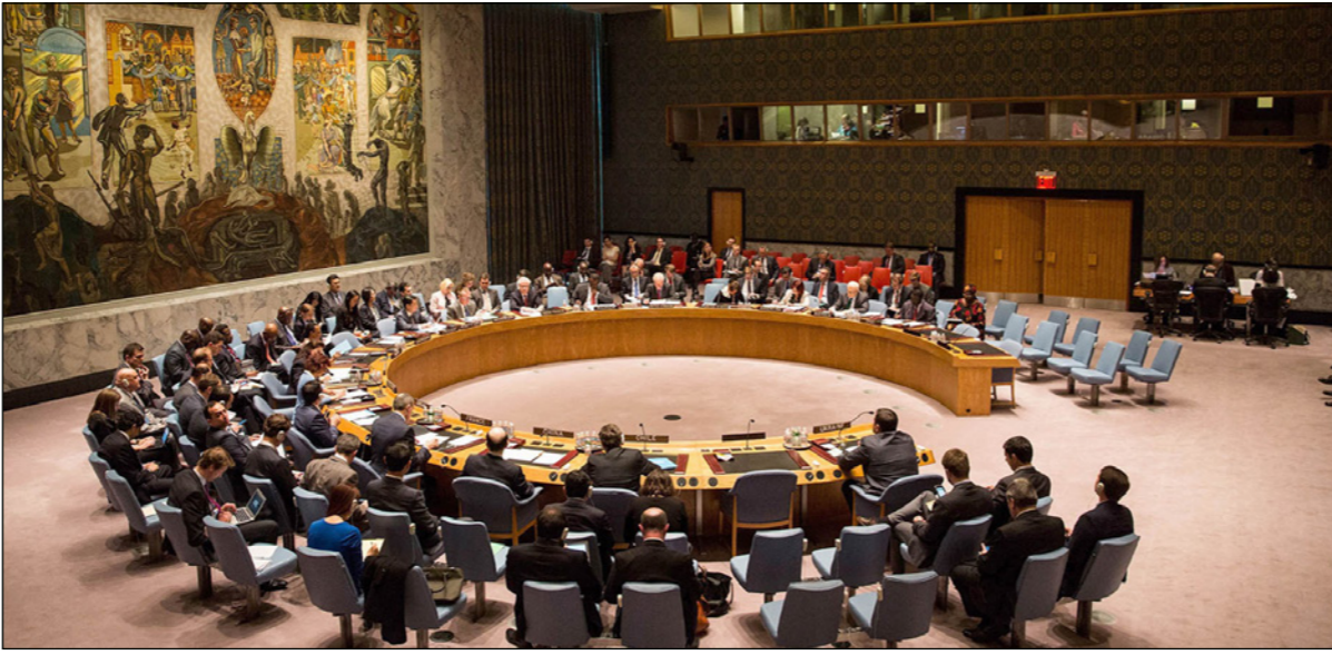
جانب من مجلس الأمن

مجلس الأمن ولاية البعثة لفترة أخرى تمتد 12 شهرا حتى 30 نيسان/أبريل 2018، وطلب من مجلس الأمن «دعم طلب البعثة تعزيز الوحدة الطبية (في الصحراء) التي توفرها بنغلاديش عبر إضافة ثلاثة موظفين طبيين و11 مساعدا طبياء». وقال الأمين العام للأمم المتحدة أنطونيو غوتيريش: «الجلسة في تقريره لجلسة الأمن قال إنه ينوي اقتراح حل دبلوماسي جديد والترويج له بدناميكية جديدة، لحل هذا النزاع الإقليمي حيث أن الصعوبة في حل قضية الصحراء تكمن في أنه لكل من طرفي الصراع رؤية وقراءة مختلفة للتاريخ والوثائق المتصلة بالنزاع».