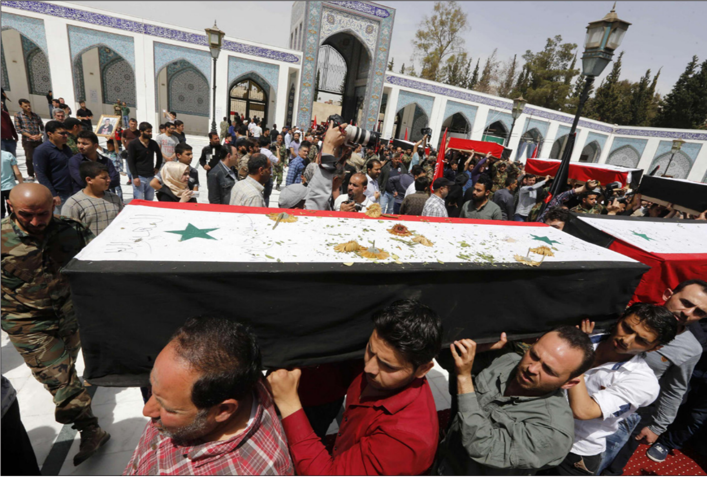
سوريون خلال جنازة ضحايا التفجير الذين تم إجلأؤهم من بلدي فوعة وكفريا المحاصرتين

وتوجهت القوات الأمريكية توجهت إلى مواقع القصف