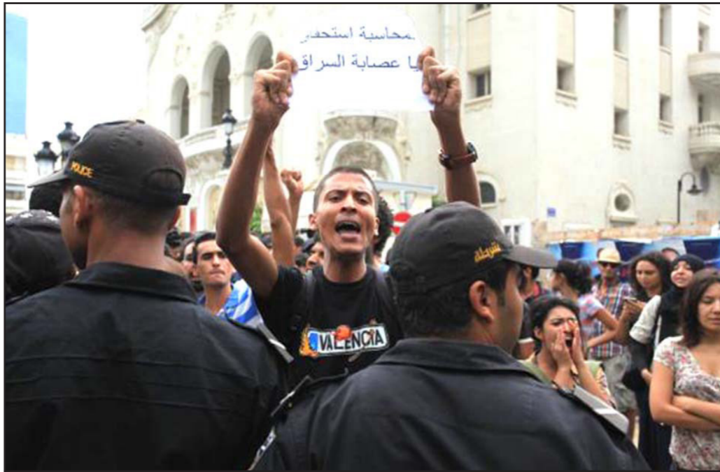
جانب من مظاهرة احتجاجية ضد مشروع قانون المصالحة الاقتصادية

ومحامية رجال الأعمال الفاسدين ولكن الفصيل بيننا سيكون الشارع ولن يبروا». وكانت أحزاب معارضة من بينها التيار الديمقراطي والجبهة الشعبية تعهدت باسقاط القانون ووصفته بأنه يعارض مع مسار العدالة الانتقالية ويهدد التحول الديمقراطي في تونس. وأظهرت وثيقة مسربة نسبتها