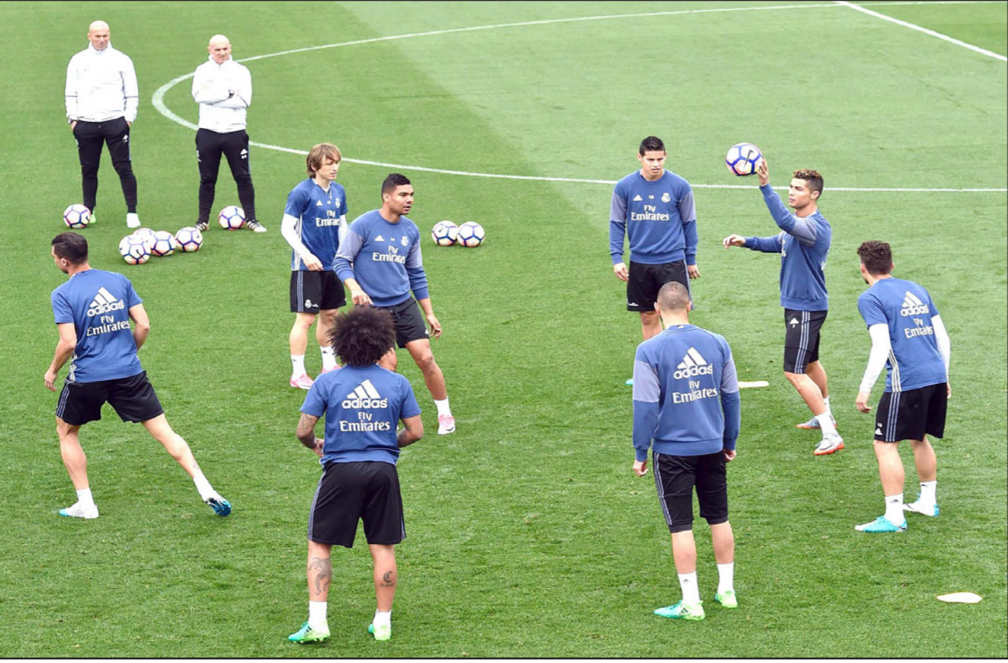
نجوم ريال مدريد خلال حصة تدريبية قبل لقاء غرناطة اليوم