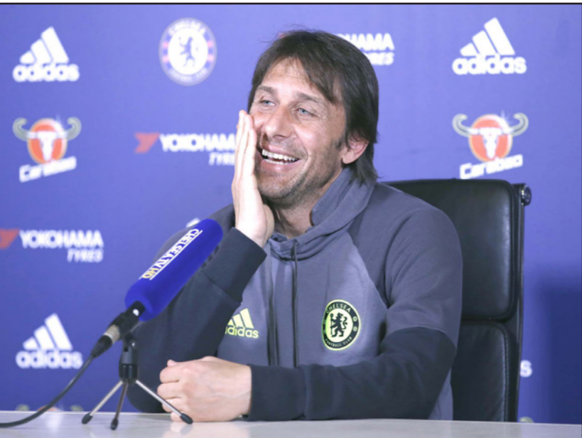
كونتي مدرب تشلسي يتحدث خلال مؤتمر صحفي

■ لندن - رويترز: يشعر انطونيو كونتي مدرب تشلسي بالرضا عن موسمه الأول في الدوري الانكليزي في استاد «ستامفورد بريدج» ويرغب في إنهائه بصورة «رائعة» من خلال التتويج باللقب. ويتصدر تشلسي بفارق أربع نقاط أمام توتنهام الثاني قبل أربع مباريات على النهاية وسيواجه آرسنال في نهائي كأس الاتحاد يوم 27 الجاري أيضاً. وقال كونتي: «في هذه المرحلة من الموسم من الصعب تدارك الأخطاء من المهم أن نضع ذلك نصب أعيننا وأن نحافظ على تركيزنا»، وقال: «إنها المرة الأولى التي أدرّب فيها خارج بلدي... وأنا راض عن تأديرتي في هذه المسابقة». وأضاف: «لكنني أريد أن أكون البطل في نهاية المسابقة مع النادي الجماهير. هذا أمر مهم للغاية ليكون موسمًا رائعًا».