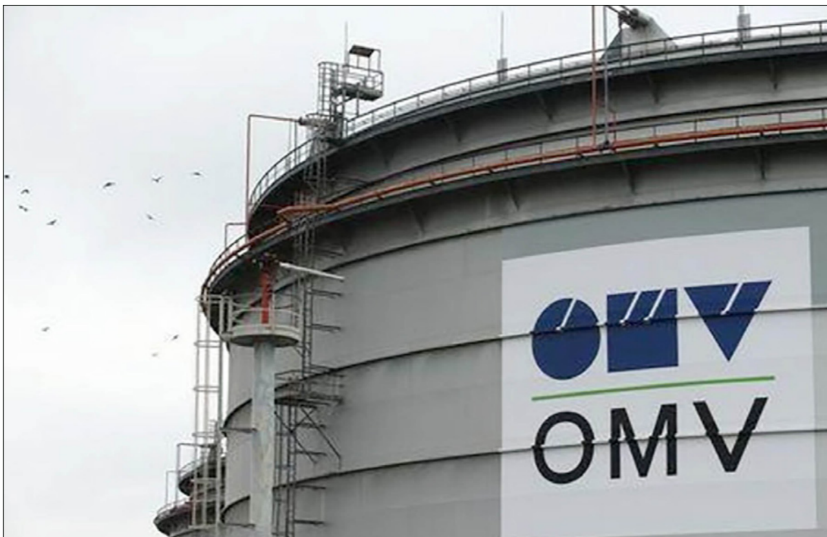
شركة «أو. أم. في» النمساوية لإنتاج النفط

■ تونس - (د ب أ) : قالت شركة «أو. أم. في» النمساوية لإنتاج النفط، أمس الجمعة، إنها سحبت ما يقارب عن 700 من موظفيها