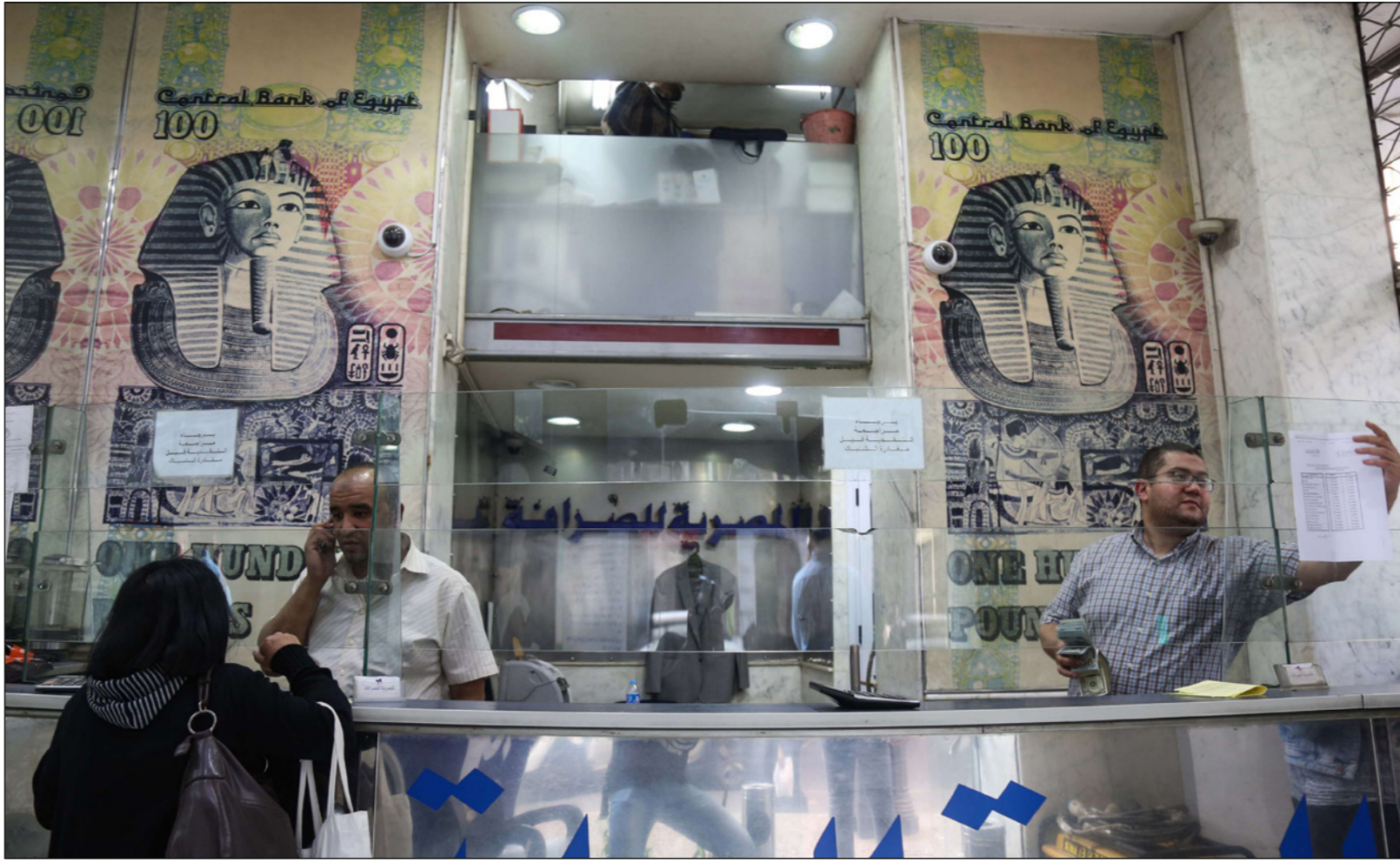
أحد محلات الصرافة في مصر

وبينما خفض صندوق النقد الدولي توقعاته لمعدل نمو الاقتصاد المصري إلى 3.5% في العام المالي الجاري 2016/2017، مقابل 4% سابقا، توقع أن يبلغ معدل التضخم إجمالا 22%، مقابل 10.2% في العام المالي السابق، وأن يتراجع إلى 16.9% في العام المالي المقبل.