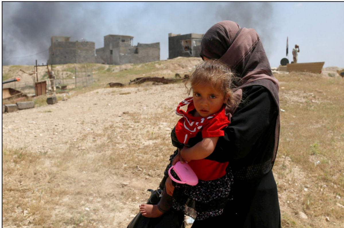
نازحة عراقية تحمل ابنتها هربا من المعارك في الموصل