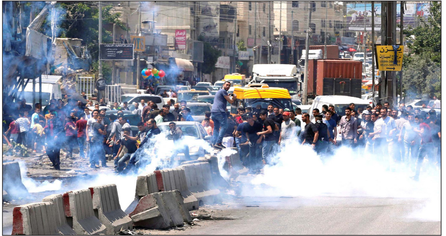
مواجهات فلسطينية مع جنود الاحتلال عند حاجز قلنديا شمال القدس المحتلة أمس... وشباب يشاركون في المواجهات رغم ساعده المتكسور أمس

تسببت باستشهاد الأسيرين راسم حلاوة وعلي الجعفري في سجن «فح» عام 1980، خلال إضرابهما عن الطعام. وبيئت أن التغذية القسرية تتم باستخدام ما تسمى به «الزوائد»، التي توضع إما بالأنف أو بالفم، ويتم ذلك بشكل متكرر بعد تكبير الأسير بقلع، وغالباً ما يصاحب هذه العملية تزييف بسبب تكرار إدخالها. واستخدم الاحتلال هذا النوع من التغذية بحق الأسرى الفلسطينيين في ثلاثة إضرابات بين العامين 1970 و1980، وتوقف عن استخدامها بقرار من المحكمة العليا وذلك بعد استشهاده الأسيرين الجعفري وحلاوة، فيما عاود «الكنيست» إقرار هذا القانون عام 2015. يذكر أن قرابة 1500 أسير يواصلون معركة الحرية والكرامة في سجون الاحتلال، مطالبين بتحقيق عدل من المطالب الأساسية التي تحرمهم إدارة سجون الاحتلال منها، والتي كانوا قد حققوها سابقاً من خلال الخضوع للعديد من الإضرابات على مدار سنوات الأسر، وأبرز مطالبهم: إنهاء سياسة الاعتقال الإداري، إنهاء سياسة العزل الانفرادي، إنهاء سياسة زيارات العائلات وعدم انتظامها، إنهاء سياسة الإهمال الطبي، وغير ذلك من المطالب الأساسية والمشروعة.