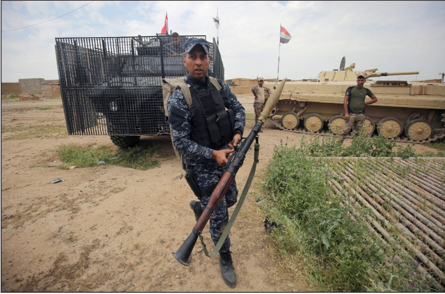
جندي عراقي خلال مواجهات مع تنظيم «الدولة» في الموصل

مقتل وإصابة 5 من عناصر «البشمركة» العراقية غرب تكريت