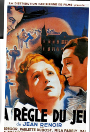
«قانون اللعبة»، البرجوازية الفرنسية عشية الحرب العالمية الثانية

هو الفيلم الرابع ضمن لائحة مجلة «سايت و ساوند» لأعظم مائة فيلم، اللائحة الأكثر وثوقية. يُعتبر، مع أفلام قبيلة غيره، من أهم الكلاسيكات في السينما العالمية. أنجز عشية الحرب العالمية الثانية، ويحكي عن التجمع البرجوازي آنذاك والنفاق الاجتماعي فيه، ما أعطاه قيمة تاريخية وإضافة إلى قيمته السينمائية الجارية. لكنه، ككثير من كلاسيكات السينما الآن، لم يلق ترحيباً حين خرج إلى الصالات.