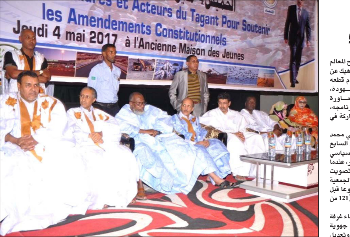
جانب من ندوة للمعارضة الموريتانية أمس في مدينة النعمة شرق البلاد

وهو في النهاية طريق واضح المعالم نحو الغد الذي نتشده، ناهيك عن جانبه المتعلق بالوفاء بالتزام قطعه، الرئيس للشعب في ليلة مشهودة، ولنخبة السياسية المتصاروة بأغليبتها المنتقبة بالرئيس وبرنامجه، وبمعارضتها المسؤولة والمشاركة في صناعة القرار».