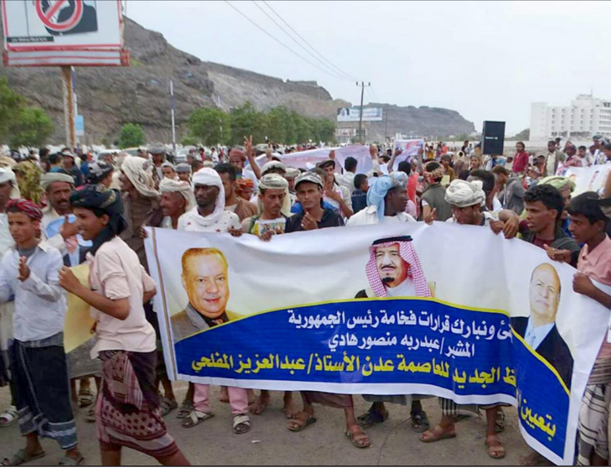
تظاهرة مؤيدة للرئيس اليمني في عدن عقب تظاهرات مؤيدة له