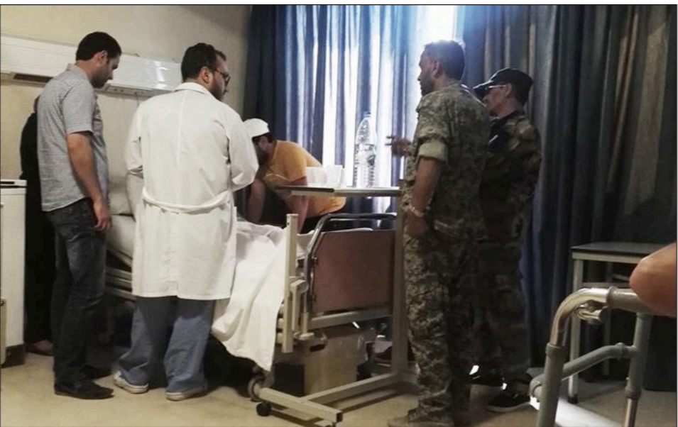
أحد مستشفيات دمشق يستقبل مصابين من «الحشد الشعبي»

وأكد ولائي ان الميليشيات العراقية التابعة لـ الحشد الشعبي، تتجه لدخول معركة لتحرير الحدود العراقية السورية ومنع القوات الأمريكية من قطع طرق الاتصال بين العراق وسوريا، حيث قال: «الآن بعد ان حُسمت الخيارات، نحن ذاهبون إلى الحدود في معركة قريبة، الاسبوع المقبل إن شاء الله، باتجاه الحدود السورية، وخلال الأيام القليلة، ستبدأ عملياتنا من مدينة البير باتجاه النخف، على محور بطول 170 كلم وعلى ثلاث صفحات، الصفحة الأولى تشترك فيها قوات النظام السوري، والثانية حزب الله اللبناني، والثالثة ميليشيات الحشد الشعبي العراقية بمختلف مسمياتها، ليصلوا إلى أطراف الحدود، من العراق أيضا على شكل 3 صفحات، الأولى في تحرير القيروان كخط صد، والصفحة الثانية تحرير العجاج، والثالثة أن نلتقي باخواننا على الحدود السورية - العراقية ونفوت الفرصة على الأمريكان إذا أرادوا الذهاب إلى الحدود وإسماكتها فيحصلون سوريا عن العراق»، حسب تعبيره. وتابع الأمين العام لميليشيا «سيد الشهداء» «ما لم تنته المعركة في سوريا لن تنتهي المعركة في العراق، عندما قاتلنا في سوريا قبل سنتين من بدء الأحداث في العراق كنا نعلم جيدا أن المعركة ستنتقل إلى العراق، واليوم أيضا نقول ما لم تنته المعركة في سوريا لا تنتهي المعركة في العراق، لذلك نحن عامزون على ملاحقة الدواعش سواء في العراق او خارج العراق»، حسب المصدر.