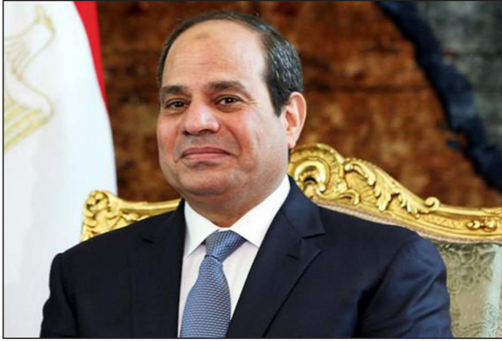
الرئيس المصري عبد الفتاح السيسي

ينتظر الفريق الرئاسي في مصر، الهادف إلى التوافق على اسم مرشح لخوض انتخابات الرئاسة في 2018، موقف النظام حول الضمانات التي طلبها للمشاركة في الانتخابات المقبلة. وقال أمين عويان، عضو المكتب السياسي للمبادرة له القدس العربي «موقف المبادرة النهائي من الانتخابات المقبلة سيحدد وقت استجابة النظام السياسي في مصر للضمانات التي طلبت بتوفيرها المبادرة لنزاهة الانتخابات». وأضاف أن «لجنة التواصل بالمبادرة ستعقد لقاءات مع أحزاب سياسية وشخصيات عامة خلال الأسبوع المقبل للاتفاق على طريق اختيار مرشح وتوافق وتشكيل الفريق الرئاسي حال استجاب النظام للمبادرة». وأوضح أن «الاتصالات ستشمل كل الأحزاب والقوى السياسية التي تنتمي لثورة يناير مثل تيار الكرامة، والتحالف الشعبي والعيش والحرية والمصري الديمقراطي، وستستفيد الأحزاب التي تأييدها للسلطة أو شاركت في نشر خطاب الكراهية بين أبناء الشعب المصري». وبيّن أن المبادرة «ستستفيد من حوارها مع الأحزاب التي أيدت السلطة القمعية أو ذات المرجعية الدينية».