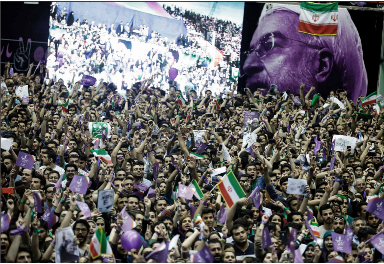
مؤيدون للرئيس الإيراني والمرشح الرئاسي حسن روحاني يجتمعون في مسيرة حاشدة في العاصمة طهران

الساعة السادسة صباحا حتى الواحدة صباح اليوم التالي، ويتساءل عما حدث له ولجيله؛ ويعتقد أن البلاد تناخر ولا تتقدم، ويقول إنه مع ذلك فسيفسوت لروحاني «لأنه المرشح الأقل سوءا»، ويكافح فراحي من أجل توزيع بضاعته على المحلات التجارية إلا أنه ليس وحيدا في هذا ففهدى خازنده درس العمار ولم يجد عملا مناسبا.