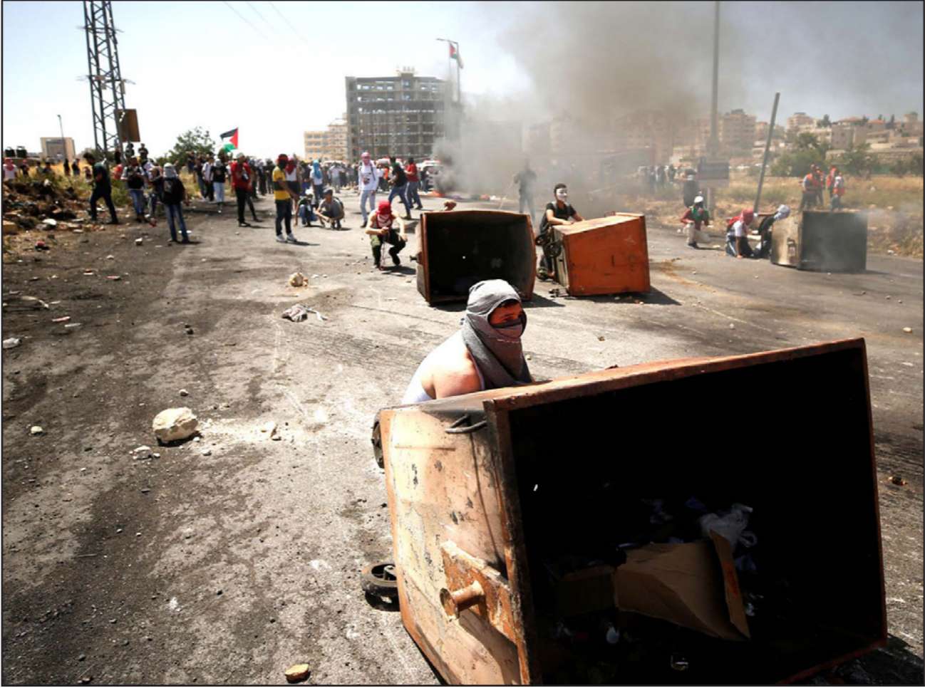
جانب من المواجهات التي شهدتها نقاط التماس في مدن وقرى الضفة الغربية إحياء لذكرى النكبة وتضامنا مع الأسرى المضربين أمس