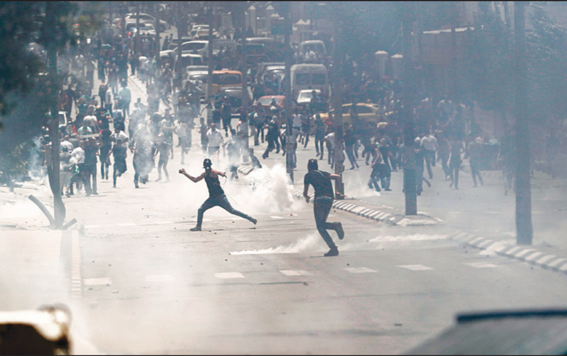
فلسطينيون يرمون الحجارة على قوات الاحتلال خلال مظاهرات في الذكرى 69 للنكبة في مدينة بيت لحم أمس

التضامن مع الأسرى في سجون الاحتلال الذين يدخل إضرابهم شهريه الثاني وسط تحذيرات من احتمال فقدان عدد من المضربين حياتهم جراء إهمال سلطات سجون الاحتلال وعدم تلبية مطالبهم المشروعة.