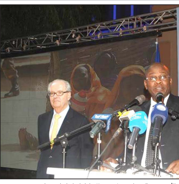
بعثة الاتحاد الأوروبي في السودان تحتفل بمرور 60 عاماً على اتفاقيات روما

السلام والاستقرار». وشدد على «مناقشة هذه الأمور مع الحكومة الجديدة ومع المعارضة ومع المجتمع المدني». ونفى وجود صفقات سرية أو أجدات خفية، جازماً أن الحوار، «سيظل بشأن حقوق الإنسان في صميم مناقشاتها». وحسب دومون، الاتحاد، «سيسعمل عن كذب، من دول الاتحاد الأوربي والشركاء الإقليميين والدوليين، لضمان