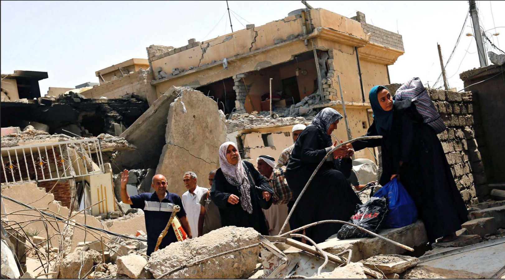
عراقيون يتفقدون آثار الدمار عقب الاشتباكات بين القوات النظامية وتنظيم «الدولة» الإسلامية في الموصل

■ الموصل - الأنبار - «القدس العربي» - وكالات: أعلنت القوات العراقية، أمس الإثنين، أنها تواصل التقدم في أحياء غربي مدينة الموصل، شمالي العراق، فيما تمكنت من استعادة قريتين ومنطقة جديدة غرب المدينة.