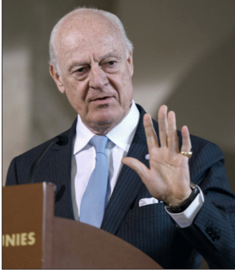
المبعوث الأممي إلى سوريا ستافان دي ميستورا في مؤتمر صحافي، أمس في جنيف

تنطلق اليوم الثلاثاء جولة جديدة من مفاوضات السلام حول سوريا في جنيف، تطفى عليها إلى حد كبير محادثات أستانة، بالإضافة إلى إخفاق جديد للمفوضات المعارضة بعد إجلاء مقاتليها من ثلاثة أحياء في دمشق. وأكد المبعوث الأممي إلى سوريا، ستافان دي ميستورا، خلال مؤتمر صحافي، أمس الاثنين في مبنى الأمم المتحدة في جنيف والتي سيصدق فيها مؤتمر جنيف 6، والذي يضم وفدي المعارضة السورية والنظام السوري، أن أعمال العنف تعيق العمليات الإنسانية في سوريا. وقال دي ميستورا إن الجولة المقبلة من المفاوضات السورية ستكون يومي الجمعة والسبت، وستركز على قضايا سياسية وإنسانية.