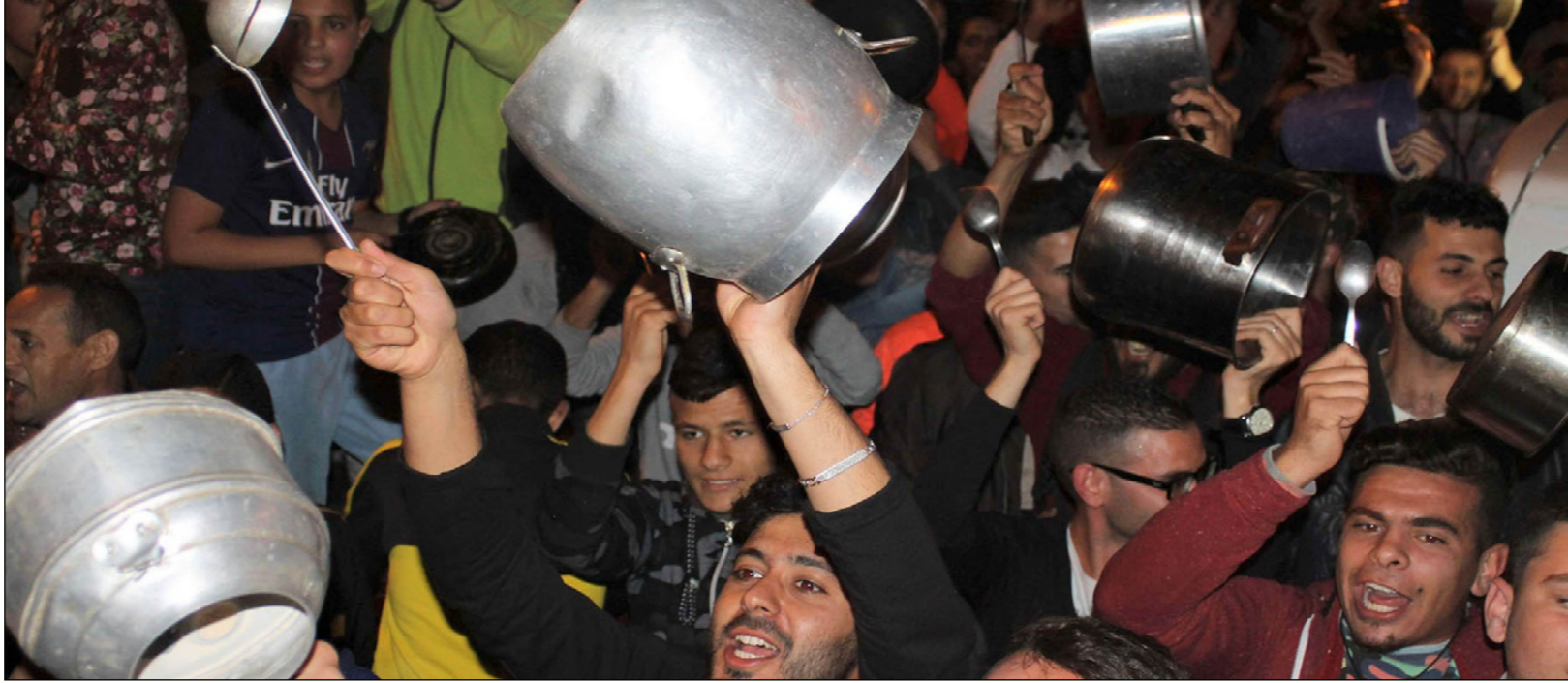
جانب من مظاهرات مدينة الحسيمة