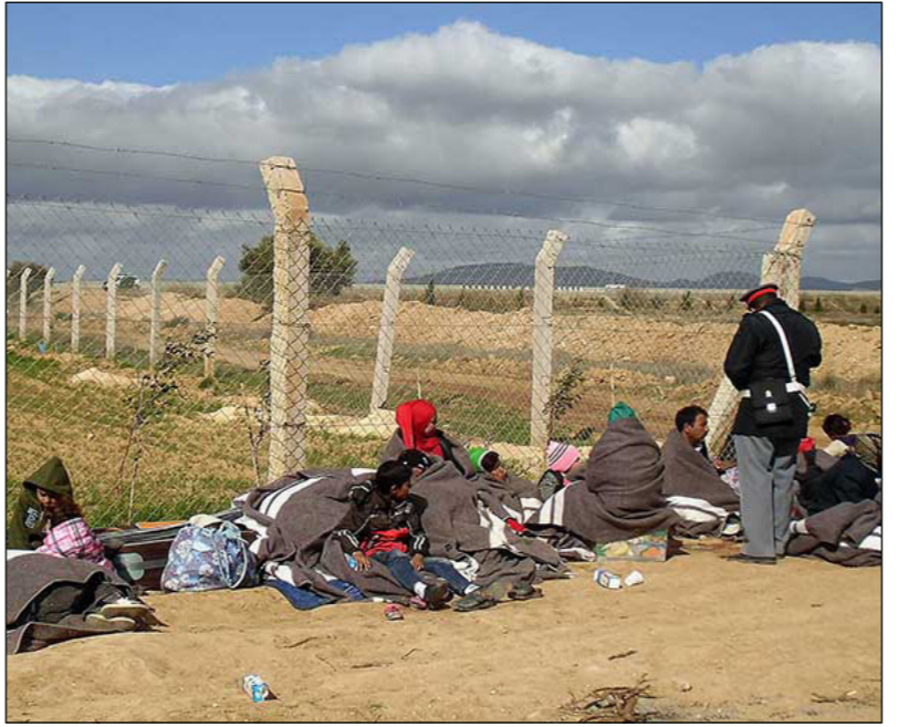
لاجئون سوريون على الحدود الجزائرية المغربية

الغربية في منطقة «فجيج» الصحراوية بين مدني «بني ونيف» الجزائرية و«فجيج» المغربية، وهي منطقة حدودية تشبه المناطق العازلة، إذ لا يدخل إليها عادة أي طرف. وتتبادل المغرب والجزائر الاتهامات بالأسوأية عن وصول هؤلاء اللاجئين إلى هذه المنطقة والعازلة التي حلت بهم. وتقول الرباط إنهم عبروا الأراضي الجزائرية قبل محاولة دخول المغرب، بينما تقول الجزائر إنها لاحظت، يوم 19 نيسان / أبريل الجاري، محاولة السلطات المغربية طرد عدد من هؤلاء اللاجئين قدموا من داخل المغرب نحو الجزائر. ودعا برلمانيون وحقوقيون ونشطاء مغاربة السلطات المغربية إلى استقبال هؤلاء اللاجئين، الذين فروا من الحرب الدائرة في سوريا منذ أكثر من ستة أعوام، ووجهت منظمة حقوقية مغربية نداءً إلى تسريع إنقاذ وإجلاء حالات مستعجلة، منها نساء في حالة وضع وأطفال مرضى وضع، ودعت إلى فتح ممرات من أجل إيصال المساعدات الإنسانية إلى هذه المنطقة الحدودية. وتعلق الجزائر حدودها البرية مع المغرب منذ عام 1994، رداً على قرار الرباط فرض تأشيرة دخول على الجزائريين، بعد هجوم استهدف مدينة مراكش المغربية، حيث اتهمت الرباط ضباط مخابرات جزائريين بالوقوف خلف هذا الهجوم، وهو ما نفته الجزائر.