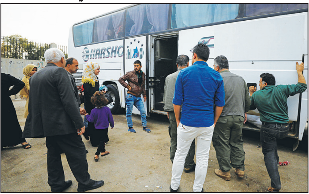
ركاب ينتظرون في مدينة القامشلي للتوجه إلى مدينة حلب أمس