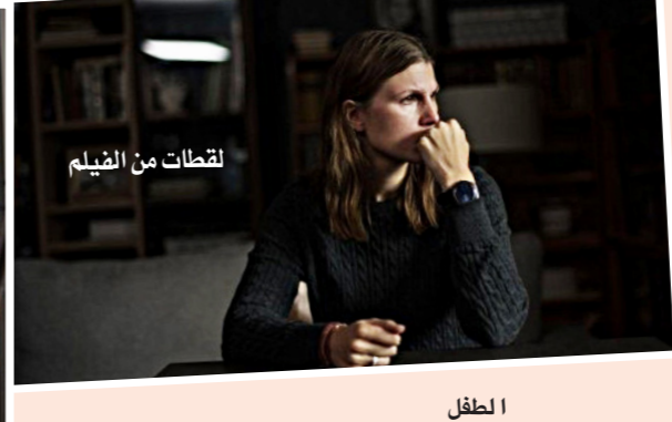
الطفل وعرايته، ولا يابه أي منهما إلى ذلك المسكين الذي ينسحق، جراء علمه بأنه غير مرغوب فيه. يبدو اليوشا شاحبا كشيخ، منعزلا في عالم تهمه الحياة الافتراضية والإنترنت، ويكسب في صمت ليلا دموع من يعلم أنه غير محبوب من ذويه. لا يعلم

رعايته بعد الطلاق. ولعل زياغينتسيف يخلق في هذا الفيلم مشهدا من أشد المشاهد التي شاهدناها في السنوات الأخيرة «السعيدة»، لأن ذلك يقدم صورة صحية براقية للشركة، دون الأخذ في الاعتبار ما يشعر به الموظفون حقا. وفي مشهد آخر نشهد رجالا للشرطة يتخلص من مسؤولية البحث عن اليوشا المفقود، ويرسل الأب والأم لجمعية أهلية للمساعدة في البحث عن الصبي. وفي مشهد آخر نلمح امرأة جميلة في مطعم أنيق تنود إلى رجل ثري لصق الحائط يتشنج جسده الصغير ليكسب دموعا لا يشعر بها أحد ولا يتعاطف معها أحد، يبكي أسيرة بلا حب، وحياء لا تعني شيئا لمن جلوه إليها. نرفع من مشاهدة الفيلم ويبقى ذلك المشهد يسكتنا ولا يبرحنا.