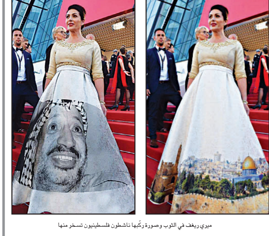
ميري ريغف في الثوب وصورة ركبها ناشطون فلسطينيون تسخر منها

لندن - «القدس العربي»: في مشهد بدأ أقرب إلى مقلب «الكاميرا الخفية» قطعت مساعدة جمال ولد عباس، رئيس حزب جبهة التحرير الوطني (حزب السلطة الأول) مؤتمرا صحافيا كان فيه، مساء أول أمس، في حضور كاميرات كثير من القنوات الجزائرية، لتسلمه هاتفًا نقالًا قبل أن يخاطبها: «ماذا أحضرت لي... هل أتوقف؟!»، لتخبره: «نعم، إنهم في انتظارك»، فاستفسرها أمام الملا عن هوية المتصلين، فترد وهي تهمس في أنه أمم أنظار وسمع الصحافيين، الذين كانوا يسجلون ويسمعون كل شيء: «لديك اتصال من «القوق»... من الرئاسة». واصل ولد عباس بعدها