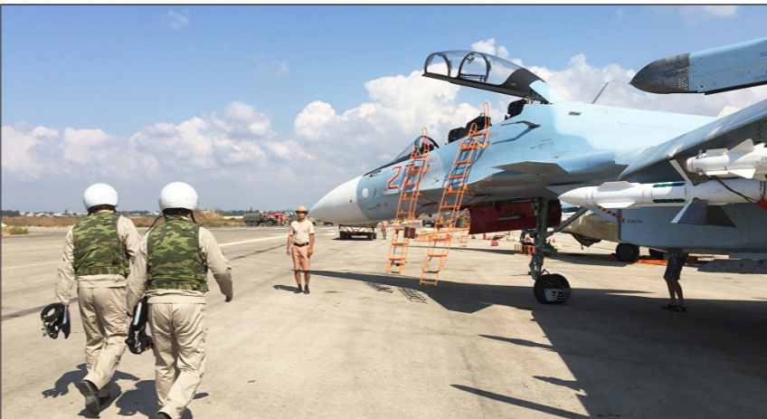
قاعدة حميميم حيث يلقح الطيران الروسي

ويذكر أن تنظيم «الدولة»، يسيطر على معظم مناطق محافظة دير الزور منذ منتصف العام 2014، فيما يحاصر ما تبقى من أقدم نظام الأسد في عدد من الأحياء التي باسحت تحتل العون من خارج المدينة في إطار حملة عسكرية ربما تتطرق قريباً.