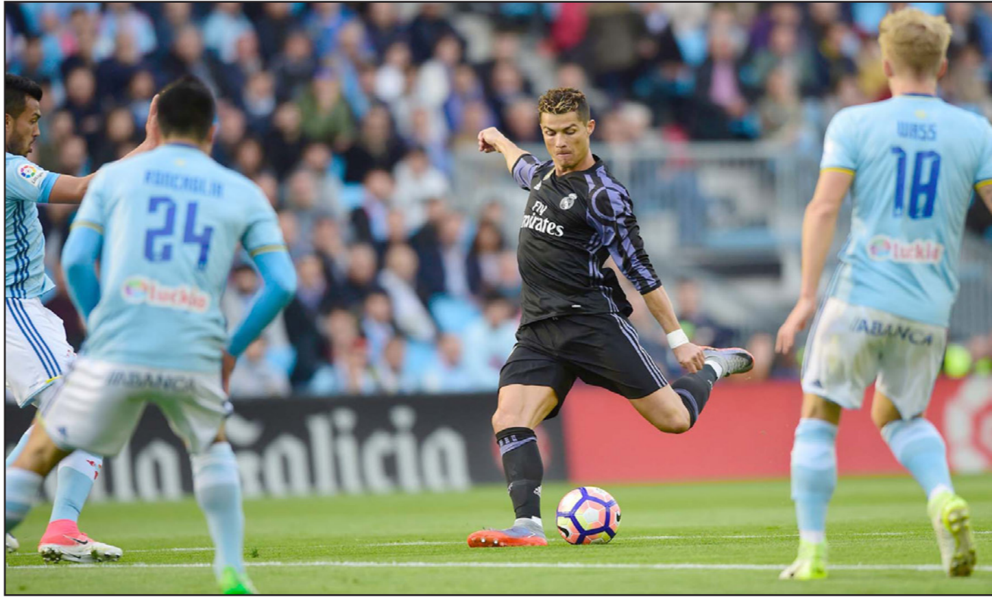
رونالدو يهجم بتسديد الكرة التي جاء منها الهدف الأول للريال في مرمى سيلتا

■ مدريد - رويترز: قاد كريستيانو رونالدو الفاتق ريال مدريد لفوز عريض 4-1 على سيلتا فيغو، ليتبعه فريق المدرب زين الدين زيدان بثلاث نقاط في صدارة الدوري الإسباني ويصيح على مرمى حجر من الفوز باللقب للمرة الأولى في خمس سنوات. ويتصدر الريال الترتيب برصيد 90 نقطة، ما يعني أنه يحتاج إلى نقطة واحدة من مبارياته المتبقية أمام ضيفه ملقة يوم الأحد ليتفوق على برشلونة ويحرز اللقب للمرة الأولى منذ فاز به بقيادة جوزيه مورينيو عام 2012. ووضع رونالدو الريال في المقدمة بعد عشر دقائق بتسديدة من خارج منطقة الجزاء ليتخطى جيبي غريغز مهاجم انكلترا السابق في قائمة الهدافين على مر العصور في أكبر خمس مسابقات للدوري في أوروبا برصيد 367 هدفاً. وضاعف المهاجم البرتغالي النتيجة في الدقيقة 48 بعدما استفاد من تمريرة ايسكو المبدع ليقرّب الريال من الفوز بالدوري للمرة الـ33. وطرّد اياغو أساسيس مهاجم سيلتا لحصوله على انذارين بسبب ادعاء السقوط، لكن فريقه قلص الفارق بهدف جون غيديتي من تسديدة أبدلت اتجاهها وسكنت شبك الحارس كيلور نافاس في الدقيقة 69. لكن كريم بنزيمة قتل المباراة بهدفه من مسافة قريبة، وأهدر المهاجم الفرنسي وزميله البرتغالي العديد من الفرص قبل أن يكمل توني كروس الرباعية في الدقيقة 88. وقال زيدان: «أصعب جزء ما زال في الطريق رغم أننا مقربون (من اللقب) كل يوم». وأضاف: «أمامنا مباراة متبقية لكن لقاء اليوم كان مهماً للغاية، نعرف ما علينا فله... علينا الاستعداد جيداً والتعافي من مباراة اليوم لأننا لدينا الكثير من الجهد». وكانت المباراة مقررة في الأساس في فبراير/ شباط لكنها تأجلت بعد تحطم أجزاء من استاد «البادوس» في عاصفة وهو ما