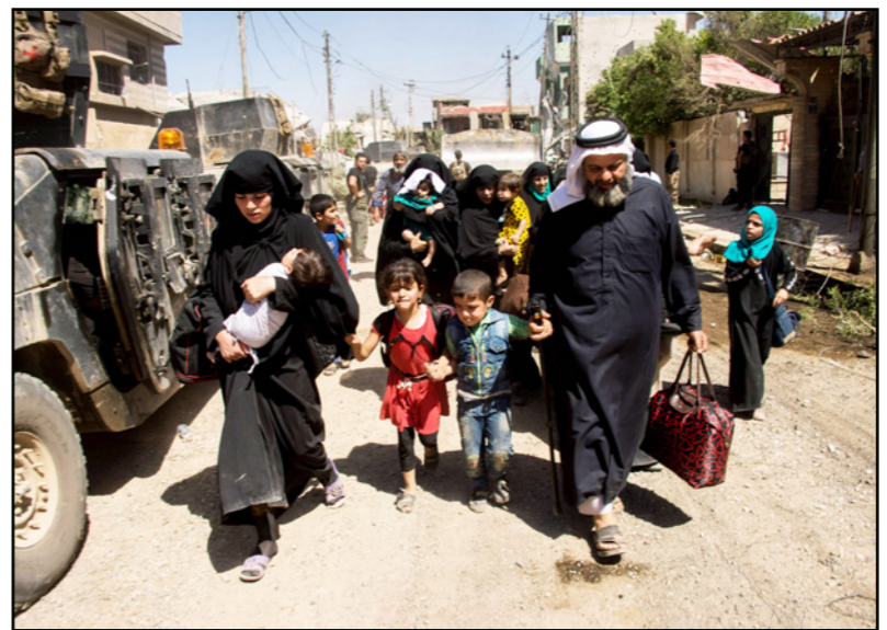
ناحون فارون من معارك الموصل

العليل، 30 كيلومتراً جنوبي غرب الموصل، قبل فترة بين شهر وشهرين». وأضافوا أن «لنا في إمام الخيم ساعتين لجمع العائلات خيامهم وأموهم بالمغادرة لأن الخيم امتلأ». وحسب الشهود «أملت بعض العائلات ساعتين للمغادرة، فيما وجهت أوامر إلى عائلات أخرى بالمغادرة على الفور، دون تمكين الأفراد من جمع متعلقاتهم». وقال سكان غرب الموصل، الذين أعيدوا جبراً، إنهم «لم يرغبوا في العودة نظراً لنقص الغذاء والمياه والمرافق الصحية».