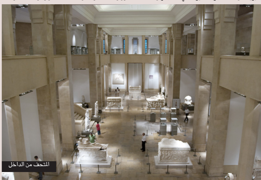
المتحف من الداخل

وما زالت هذه الفجوة التاريخية موجودة حتى الآن، وقد وضع القائمون على المتحف إلى جانبها لوحة، ويستطيع الزائر أن يقف أمام الفجوة وأن يسترجع من خلالها التاريخ الدائم الذي كان المتحف جزءاً منه. وخلف عيش، ما بين 1995 و2000 تركزت أعمال التهيئة على مبنى المتحف من حيث الإنارة والتكيف والصوت ونظام الحماية وتركيب المصاعد وتركيز الواجهات وتجفيف طبقة المياه الجوفية، وذلك بجهود وزارة الثقافة والمديرية العامة للآثار والمؤسسة الوطنية