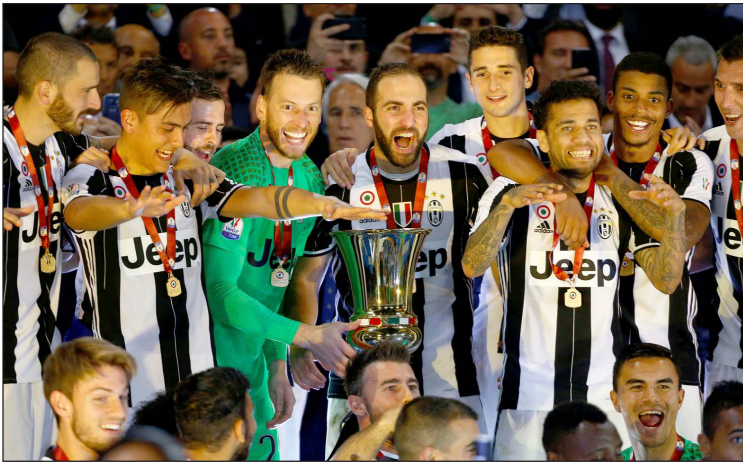
لاعبو يوفنتوس يحتفلون باللقب الأول ضمن ثلاثية ياملون بإحرازها هذا الموسم