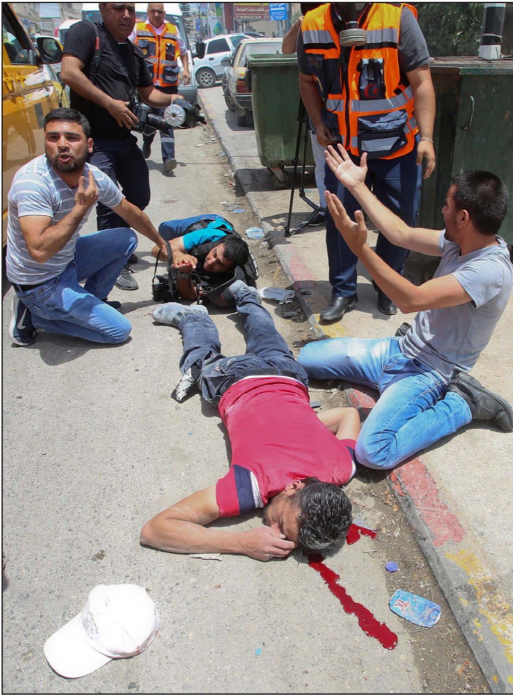
صحافي فلسطيني ينزف بعد أن أصابه مستوطن برصاصة في جنوب نابلس أمس

وأضاف «نخشى سقوط شهداء في صفوف الأسرى الذين انهارت صحتهم بشكل كبير جدا وأن حكومة إسرائيل بإجراءاتها العنصرية والقمعية بحقهم واستمرار مواقفها المتطرفة أدت إلى هذا التدهور المتسارع على صفة عدد كبير من الأسرى»، واعتبر أن ما يجري حاليا هو بمثابة سباق مع الزمن، حيث أن الأوضاع لم تعد تحتفل لدى الشعب