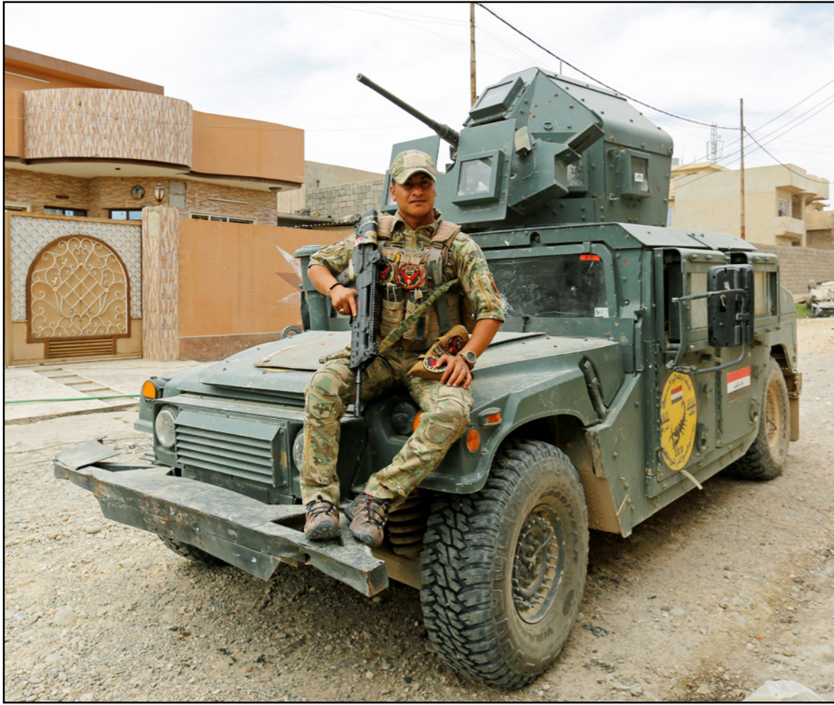
جندي عراقي في أحد أحياء غرب الموصل

■ الموصل - الأناضول: «اقتربت ساعة الحسم» في الموصل، إجماع التقى عليه المسؤولون العراقيون و«التحالف الدولي» وموعدهم قبل رمضان، لكن محللين عسكريين يتوقعون قبل المعركة نسيجا، بسبب تحديدين رئيسيين يتعلقان بالمدنيين وطبيعة مسرح المعارك. في الخامس عشر من الشهر الجاري، أعلن المتحدث باسم قيادة العمليات المشتركة (تتبع للجيش العراقي) العميد يحيى رسول، عن تحرير القوات العراقية أكثر من 90 في المئة من الجانب الغربي للمدينة. وبعد يوم، خرج رئيس الوزراء العراقي في حيدر العبادي في مؤتمر صحافي في بغداد يعلن أن «عملية التحرير (الموصل) ستحسم خلال الأيام القليلة المقبلة (دون تفاصيل)»، وهو ما اعتبر تأكيداً لكلام رئيس أركان الجيش العراقي الفريق أول ركن عثمان الغانمي، مطلع الشهر الجاري أن القوات العراقية ستستعيد الجانب الغربي بالكامل قبل حلول شهر رمضان. ومع أن القوات الحكومية تمكنت من تقليص المساحة التي يسيطر عليها تنظيم «الدولة» غربي الموصل إلى 12 كيلومتراً مربعاً، لكن مختصين في الشأن العسكري العراقي، يقولون إن حسم معارك الأحياء المتبقية في الجانب الغربي تحتاج إلى بعض الوقت، ومن غير المرجح السيطرة عليه قبل رمضان. وتفاصيل القوات العراقية المدينة القديمة (حي)، وأحياء الشفاء، والزنجيلي، والنجار وهي آخر المناطق التي يتواجد فيها مسلحو «داعش» والواقعة على ضفة نهر دجلة غرب الموصل. وأمس الأول، قال العميد جون دوريان المتحدث باسم قوات التحالف في مؤتمر صحافي في بغداد إن التنظيم «محاصر تماماً في المدينة» ويجري تدمير موارده، مضيفاً أن «الدعوة على وشك الهزيمة التامة». واستكدر وتوت، عضو لجنة الأمن والدفاع في