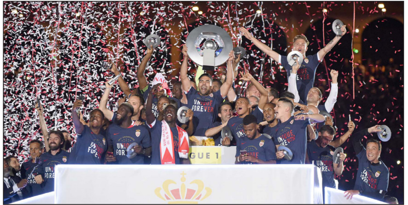
لاعبو موناكو يحتفلون بكسر احتكار سان جيرمان واحراز بطولة الدوري