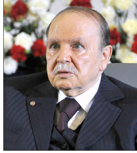
عبد العزيز بوتفليقة

تعدّد حركة مجتمع السلم (إخوان الجزائر) اجتماعاً استثنائياً اليوم الجمعة للفصل في موضوع المشاركة في الحكومة من عدمها، وبعد العرض الذي قدمه رئيس الوزراء عبد الملك سلال إلى الحركة نقلاً عن الرئيس عبد العزيز بوتفليقة، الذي يريد توسيع قاعدة المشاركة في الحكومة الجديدة، وهو العرض الذي تحول إلى فتنة داخل الحركة بين معارض ومؤيد لفكرة العودة إلى الحكومة والاقتراب مجدداً من السلطة. وستكون كل الأنظار موجهة إلى مجلس الشورى الذي سيعقد اليوم، والذي سيكون حلية صراع بين تيارين، أحدهما ممثل في عبد الرزاق مقري رئيس الحركة، والذي يرى أنه من مصلحة البقاء في المعارضة، للاستثمار في الرصيد الذي تكون لديها خلال ثلاث سنوات، ولأن المكافأة التي حصلت عليها في الانتخابات البرلمانية الأخيرة لا تؤهلها لاحتلال مركز مهم في الحكومة، الأمر الذي يجعل تواجدتها مجرد ديكور للزينة لا أكثر ولا أقل، فيما يعتقد هذا التيار أنه ضحية تزوير في الانتخابات الأخيرة، وأن مشاركته في الحكومة تركيبة للنشائج العلن عنها، ويهدد مقري بالاستقالة من منصبه وكذا باستقالة المكتب التنفيذي الوطني في حال ما إذا كانت الغلبة لتيار المشاركة.