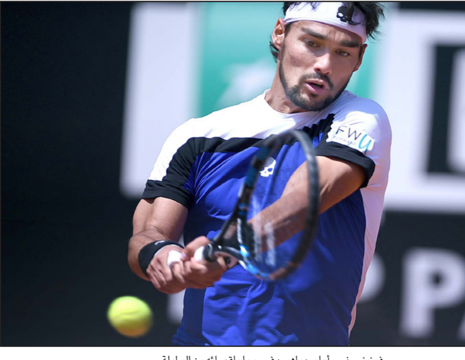
فونيني خسر أمام جماهيره في روما باصطائه من البطولة

واشنطن - رويترز: انتقدت شركة «هيد» راعية مضرب كجملة التنس الروسية ماريا شارابوفا الوكالة العالمية لمكافحة المنشطات بعد قرار بطولة فرنسا المفتوحة برفض منح شارابوفا البطاقة الأولى عالمياً سابقاً لبطاقة للاشتراك المباشر في ثاني البطولات الأربع الكبرى للموسم الحالي. وعادت شارابوفا إلى ملاعب وبطولات التنس بعد انتهاء إيقافها الذي استمر 15 شهراً بسبب مخالفة لوائح العقاقير في 2015، واستخدامها مادة ميلدينيوم في أبريل/نيسان الماضي وتوقع كثيرون ظهورها في بطولة فرنسا في