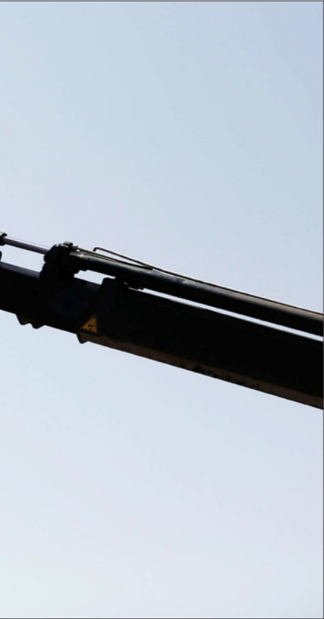
التحضيرات في مدينة القدس لاستقبال الرئيس الأمريكي (دويتز)

ورغم ما قدم له من معلومات وقصصات صحافية عن أحداث العالم إلا أنه لن يهتم كثيرا قدر اهتمامه بالوضع المحيط به ومشاكل البيت الأبيض. وحسب جيمس بي ستينجر الدبلوماسي السابق في عهد أوباما فعدم تحضير ترامب نفسه