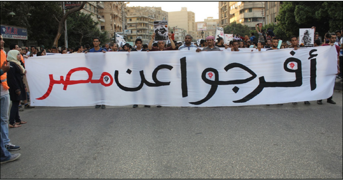
من مظاهرة سابقة تندد بقانون التظاهر

عشوائية، معتبرة أن وراء هذه الهجمة انتخابات الرئاسة المقبلة، وصفتها بإرهاب لمن يفكر في التحرك والتحضير للمنافسة». وأعلنت بدء عدد من الأحزاب والقوى السياسية في التشاور وإطلاق المبادرات من أجل خوض الانتخابات الرئاسية، لافتة إلى تلقي العديد من شباب الأحزاب تهديدات واتصالات من أمن الدولة تستدعهم لما يطلق عليه «الدرشة». وأوضحت أن فجر أمس الخميس ألقي القبض على اثنين من أعضاء الحزب في محافظة المنيا، جنوب مصر، ومن قبلهما عضو في محافظة السويس، وآخر في الشرقية، غير المقبوض عليهم وهم ليسوا تابعين للحزب.