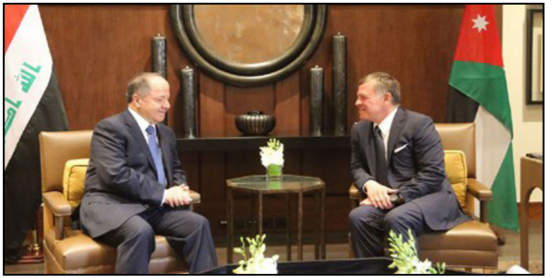
رئيس إقليم كردستان وملك الأردن يؤكدان على تمتين العلاقات الثنائية

الدائمة والسندة للشعب العراقي». وخلال وجوده في الأردن، بارزاني، جرحى قوات «البشمركة»، الذين أصيبوا جراء القصف الذي شنته مقاتلات الجيش التركي في سنجار، في أحد مستشفيات العاصمة الأردنية.