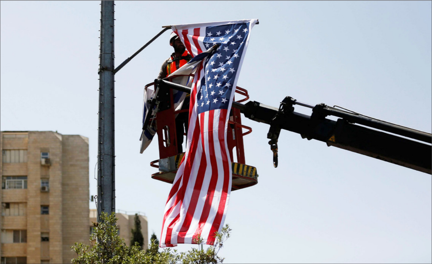
التحضيرات في مدينة القدس لاستقبال الرئيس الأمريكي (دويتز)

وبالنسبة للسعوديين فهي مناسبة لهم للاحتفال بها وحضورها له البساط الأحمر وقائمة من المطالب. ومن بين التحضيرات معرض للسيارات الأمريكية الكلاسيكية ومباريات رياضية وحفلات موسيقية.