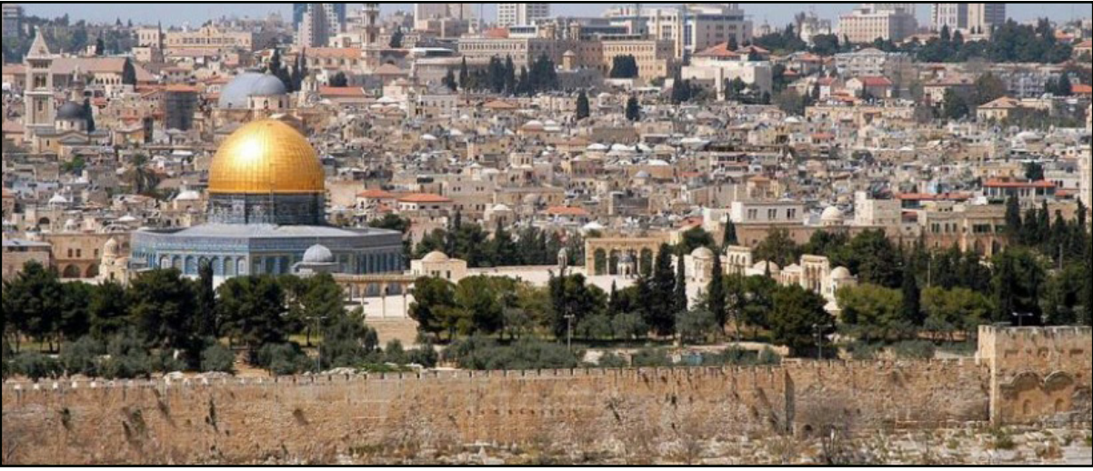
الميزان الديموغرافي في القدس يعيل لصالح الفلسطينيين

حوما وخطة البناء في شمعون الصديق، بين غروب القدس وجبل الشارف - مجمدة، ففي ثمانتي سنوات اوباما حتى التخطيط لبنا متجدد تباطأ جدا.