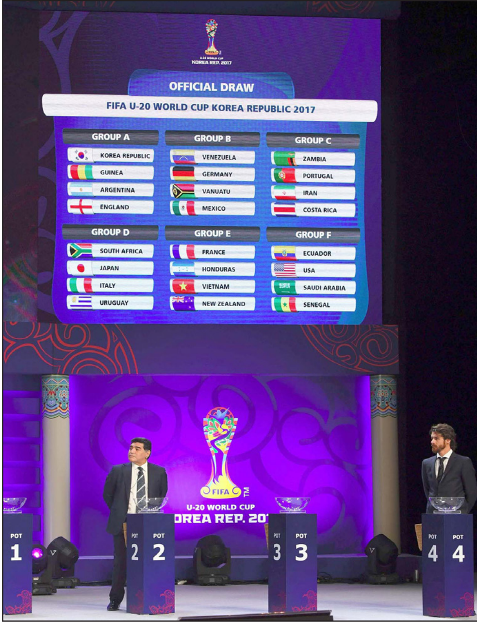
قرعة المونديال الذي ينطلق اليوم أجريت قبل شهرين