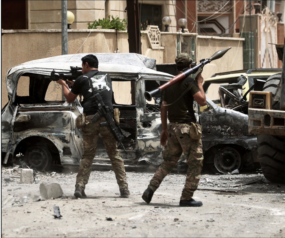
عناصر من الجيش العراقي خلال المعركة في أحد أحياء غرب الموصل

قال قائد الحملة العسكرية لتحرير الموصل شمالي العراق من تنظيم «الدولة الإسلامية»، أمس الجمعة، إن قوات الخنقة في الجيش، انتزعت، حياً في الجانب الغربي. وأوضح الفريق الركن شيد بار الله، في بيان عاجل بثه التلفزيون الرسمي، إن قوات مكافحة الإرهاب، وهي قوات خنقة في الجيش، حررت حي الورشان غربي الموصل. كذلك أكد بار الله في بيان، آخر أن «قطعات الفرقة الدرعة التاسعة استعادت، الجزء الشمالي من حي 17 تموز في الساحل الايمن من مدينة الموصل»، وتقرب القوات العراقية من تضييق الخناق على مسلحي التنظيم في المنطقة القديمة، وسط الجانب الغربي، حيث من المرجح أنها ستكون المحطة الأخيرة في معركة الموصل. ومنذ تشرين الأول/أكتوبر 2016، تشن القوات العراقية، عملية عسكرية واسعة لطرد «الدولة» من الموصل، وهي آخر المعارك الكبيرة لتنظيم في العراق. واستعادت هذه القوات النصر الشرقي من المدينة في يناير كانون الثاني الماضي، ونقل منذ فبراير/شباط الموصل لانتزاع النصف الغربي. ويقول قادة الجيش إن «الدولة» أوشك على الهزيمة في الموصل وأن رقة سيطرة التنظيم لا تتجاوز عشرة في المئة من مساحل الشطر الغربي، إنسانياً، أعلن وزير الهجرة والمهجرين،