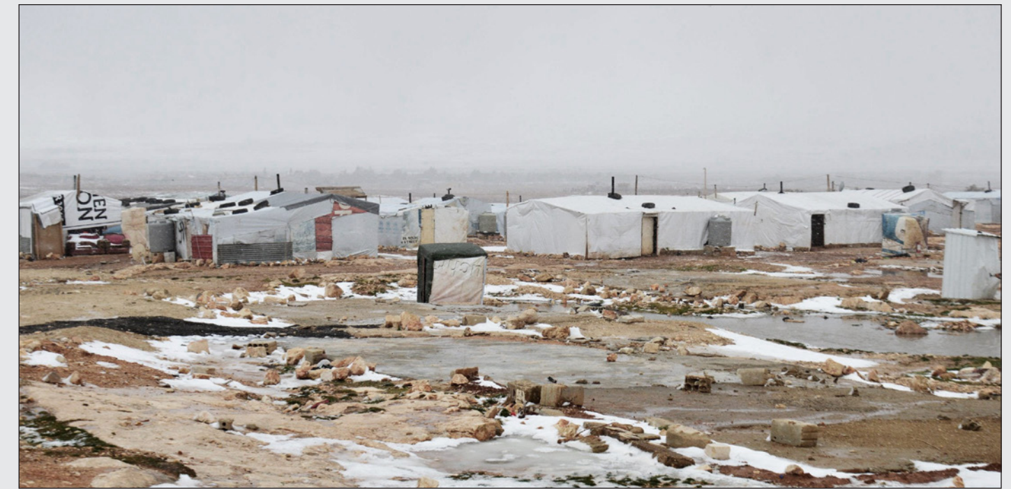
مخيم للاجئين السوريين في البقاع

فإنه «سيحارب بكل طاquته كي يمنع أي اجنبي من مزاوله مهن غير المهن المتاحة له، لفتح باب الفرص أمام الشباب اللبناني الذي وصلت نسبة البطالة فيه أكثر من 25 بالمئة». وأشار إلى أن «مفتشين من وزارة العمل أوقفوا داخل مطعم معروف وراق جداً في بيروت 40 عاملاً اجنبياً من الجنسيات كافة يعملون دون أي رخصة ولا حتى شهادة طبية وبشكل سيء».