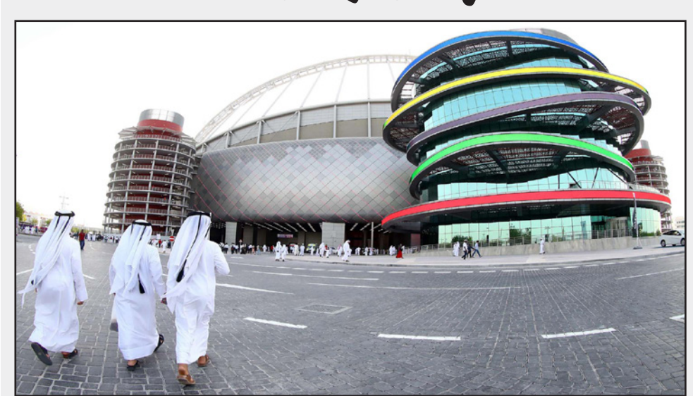
الجماهير القطرية متوجهة إلى استاد «خليفة» لحضور المباراة النهائية بعد افتتاحه