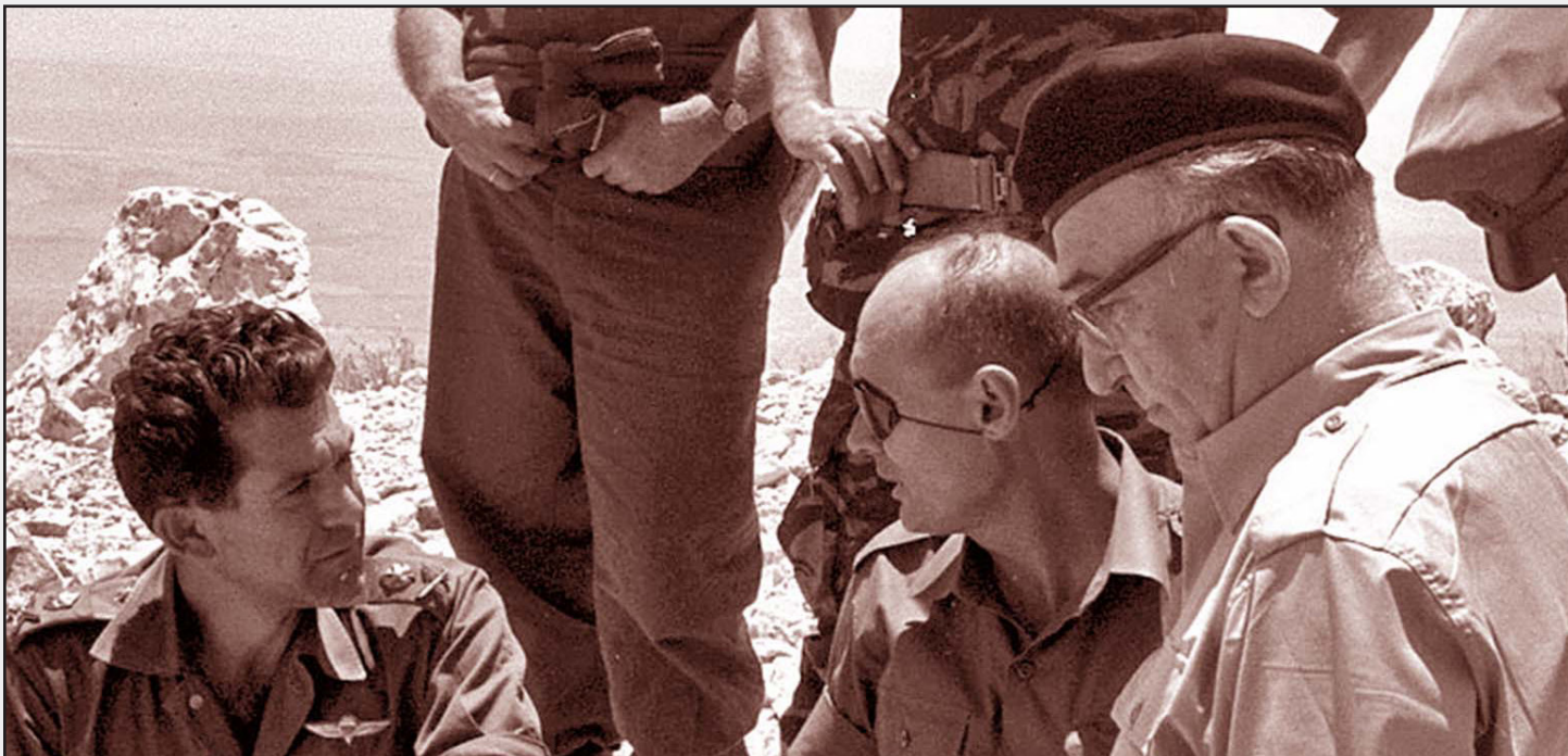
وزير الجيش الإسرائيلي الأسبق موشيه ديان (الثاني من اليمين) خلال حرب 1967

إقناع يهود العالم على الأقل، ويتابع «لنقرضن أن العالم سيسأل هذا السؤال. حتى لو قبلنا بأن الحد هو نهر الأردن فماذا سنستعمل بالعرب هنا؟ ربما بعد سنوات سنرغب بالقول للفلسطينيين إنهم لا يستطيعون المشاركة في الانتخابات لكننا لا نستطيع اللحاق بهم من ناحية التكاثر والزيادة الطبيعية وعدادت سيقولون: نحن في إسرائيل أقلية كبيرة فلماذا نحرّم من حق التصويت؟ عندئذ سنواجه مشاكل دولية مرعبة. لا يمكن استيعاب 1.2 مليون فلسطيني آخرين لأن نتيجة هذا تعني أننا مفقودون» «أين الجيوش العربية؟ في المقابل يرد بيغن بالافتراض بتوطين اليهود في المدن الفلسطينية الكبرى كبيت لحم والخليل وتحولها لمدن مختلطة كي لا نتركهم في حالة مدينة الناصرة من قبل قيام الدولة» «واوضح بيغن من جهته: «أرض إسرائيل الغربية لنا كلها. لذا تخافون من قول ذلك، فنحن من تعرض للهجوم. أين رأينا شعباً ينتصر ويسبلك دمه ثم يتنازل؟ أي جيوش سيرسلونها ضداً لحقنا؟ ما هذا الإسراع لتسليم الحصين جزءاً من أرض إسرائيل الغربية؟ يحظر علينا استدعاء الضغط علينا، ويحظر علينا تسليم شبر من أرض إسرائيل لسلطة أجنبية.. كل ذكر لافتتاح باقاة دولة فلسطينية بهذا الطريقة أو تلك سينزل علينا كارثة».