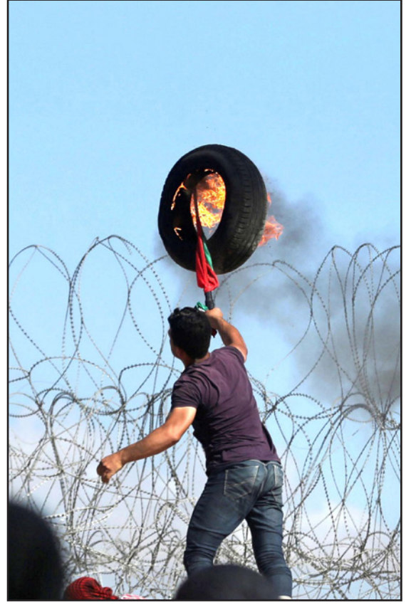
مواجهات بين الشباب الفلسطيني في غزة والضفة تضامنا مع الأسرى المضربين أمس

المعروف باتحاد أبناء رام الله في أمريكا والمنظمة الأصول خدمة في الشتات، أنه يدعم إضراب الأسرى الفلسطينيين المفتوح عن الطعام، وأعراب الاتحاد عن دعمه للأسرى المشاركين في الإضراب، معتبرا أن قلقه إزاء الظروف التي يعيشها الأسرى، وديتوييت في ولاية ميشيغان عام 1959 من أجل قدر استطاعته بدءا بالسلطة التي تملك الكثير لو كانت معنية بقتيتهم، وأكد أن الحراك الحالي مع قضية إضراب الأسرى المستمر باهت، ولا يرقى بكتاسا لحجم التضحيات التي يقدمها الأسرى بأجسادهم. وأضاف «بعد 34 يوماً من الإضراب المفتوح ليس أمام الأسرى إلا الإصرار على موقفهم، فقد اقتربت لحظة النصر وتحقيق المطالب، خاصة أن المطالب معيشية تتعلق بحياة الأسير في الأسر وليست مطالب سياسية أو مطالب تتعلق بالإفراج، فالتطوُّب أن تكون وقفة جادة مع الأسرى من كل الجهات حتى يحققوا الأهداف المرجوة». وأعلن الاتحاد الأمريكي لرام الله فلسطين فلسطين حرة.