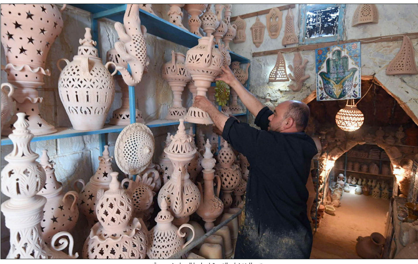
متجر للخزفيات التي يقبل عليها السياح في جربة

فيينا - رويترز: قالت مصادر في منظمة البلدان المصدرة للبترول «أوبك»، أمس الجمعة إن لجنة من المنظمة تنظر في سيناريوهات الاجتماع المقرر لها الأسبوع المقبل في فيينا، لتحديد سياسة الإنتاج تحت خيار تمديد اتفاق خفض إنتاج النفط وتعميق التخفيضات في مسمى لتصريف المخزونات ودعم الأسعار. وكانت السعودية وروسيا، أكبر منتجي النفط في العالم، اتفقتا على ضرورة تمديد العمل بتخفيضات الإنتاج الحالية حتى مارس/آذار 2018، وإن كان وزير الطاقة السعودي خالد الفالح قال إن حجم التخفيضات سيظل كما هو إذا تم تمديد الاتفاق. واجتمع مسؤولون ممثلون لسدول «أوبك» إلى جانب مسؤولين من الأمانة العامة للمنظمة في فيينا يومي الأربعاء والخميس، وذكرت مصادر من المنظمة أنه كان من المقرر الانتهاء من اجتماع مجلس اللجنة الاقتصادية أمس الأول لكنه مدد حتى الجمعة. وقال أحد المصادر إن تعميق تخفيضات الإمدادات خيار يعتمد على تقديرات نمو الإمدادات من خارج المنظمة، لا سيما شركات النفط الصخري الأمريكي، وقال مصدر ثانٍ لم تنفق على السيناريوهات النهائية. ولا يحدد مجلس اللجنة الاقتصادية سياسة «أوبك»، ويسبق اجتماع المجلس اجتماع وزراء نفط الدول الأعضاء في المنظمة وعدد من المنتجين المستقلين في 25 مايو/أيار، لاتخاذ قرار بخصوص تمديد اتفاق خفض إنتاج الخام لما بعد 30 يونيو/حزيران، وكانت «أوبك» وروسيا وغيرهما من المنتجين اتفقا في الأصل على خفض الإنتاج بواقع 1.8 مليون برميل يوميا لمدة ستة أشهر بدءاً من الأول من يناير/كانون