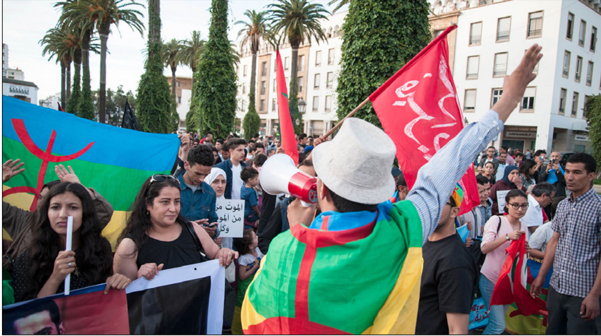
جانب من المظاهرات في مدينة الرباط

وشملت مطالب المظاهرين في الرباط، رفع مظاهر العسكرة عن الحسيمة ونواحيها والحوار والتشديد بمواقف الأحزاب اللفية التي وزعت اتهامات بالانفصال على نشطاء الريف الغاضبين، وحمل المحتجون لافتات تعبر عن تلك المواقف، من