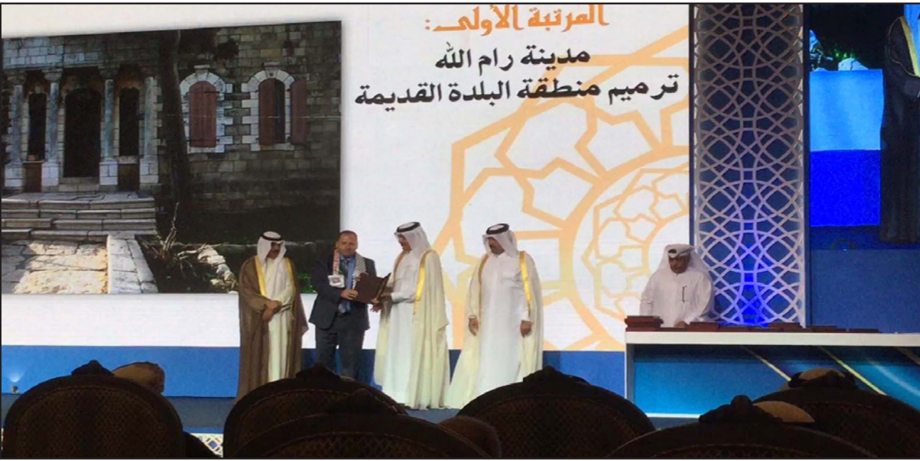
ممثل عن بلدية رام الله يتسلم جائزة منظمة المدن العربية في التراث المعماري (القدس العربي)

والحفاظ على التراث للبلدة القديمة، حيث تم تعيين حدود وجميع فئات التراث في المنطقة التاريخية من ميان وأحواش وأزقة، وحرصاً من البلدية على ضرورة المحافظة على هذا الأثر المعماري للمدينة تم الاتفاق مع مركز حفظ التراث في مدينة بيت لحم على إعداد دراسة شمولية للبلدة القديمة والأبنية التراثية المنفردة مراعية التطور العمراني للمدينة.