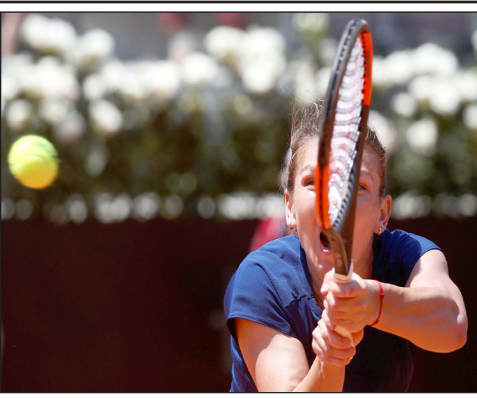
هاليب تتفوق على نظيرتها الاستونية كورتنافيت وتصل الى الدور قبل النهائي

لندن - رويترز: قالت لاعبة التنس الروسية ماريا شاربوا فبلة ويمبلدون السابعة إنها لن تلطب بطاقة للاشتراك المباشر في ثالث بطولات الأربع الكبرى للموسم الحالي، بعدما فشلت في التأهل مباشرة للدخول في القرعة الرئيسية. وقالت شاربوا (30 عاما) التي عادت للملاعب الشهر الماضي بعد إيقافها 15 شهرا بسبب المنشطات، إنها ستحوض تصفيات بطولة ويمبلدون التي تقام على الملاعب العشبية الخضراء. وأضافت: «بسبب تحسين ترتيبتي في قائمة التصنيف بعد ثلاث بطولات أشارك فيها بعد العودة فإنتي سأشارك أيضا في تصفيات بطولة ويمبلدون... ولن أطلب بطاقة للاشتراك المباشر في القرعة الرئيسية»، وتحتل بطلا ويمبلدون 2004 المركز 211 في قائمة التصنيف العالمي حاليا، ما يمنحها من دخول القرعة الرئيسية، لكن فوزها في الدور الأول ببطولة إيطاليا يعني ضمان مشاركتها في تصفيات ويمبلدون. وبإمكان اللجنة التي تمنح بطاقات الدعوة بويمبلدون، والتي ستجتمع في 20 يونيو/حزيران المقبل، منح بطاقة للمصنفة الأولى على العالم سابقا، وكانت شاربوا بحاجة للتأهل إلى قبل نهائي بطولة إيطاليا لحجز مكان بالقرعة المباشرة في ويمبلدون، لكنها انسحبت من الدور الثاني بسبب إصابة في عضلات الفخذ الأيسر. ورفض المنظمون وبشكل مفاجئ يوم الثلاثاء الماضي منح بطاقة مشاركة لشاربوا في بطولة فرنسا، التي ثالث لقبها مرتين، لتحترم من دخول القرعة الرئيسية أو تصفيات البطولة التي تنطلق يوم 28 مايو/أيار الجاري.