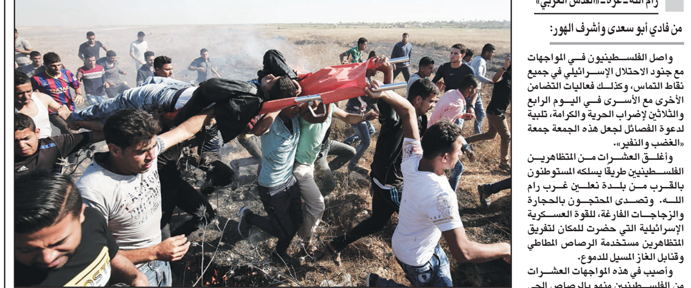
محتجون فلسطينيون يحملون زميلا جريحا خلال اشتباكات مع جنود الاحتلال على الشريط الحدودي لغزة

واصل الفلسطينيون في مواجهات مع جنود الاحتلال الإسرائيلي في جميع نقاط التماس، وكذلك فعاليات التضامن الأخرى مع الأسرى في اليوم الرابع والثلاثين لإضراب الحرية والكرامة، لتلبية لدعوة الفصائل لجعل هذه الجمعة «جمعة الغضب والنفير». وأغلق العشرات من المظاهرات الفلسطينية طريقًا يسلكه المستوطنون بالقرب من بلدة تلعين غرب رام الله، وتصدى الحنجسون بالحجارة والزجاجات الفارغة، للقوة العسكرية الإسرائيلية التي حضرت للمكان لتفريق المظاهرات مستخدمة الرصاص المطاطي وقنابل الغاز المسيل للدموع. وأصيب في هذه المواجهات العشرات من الفلسطينيين منهم بالرصاص الحي ومنهم بالرصاص المطاطي وأخرون في حالات اختناق بفعل قنابل الغاز المسيلة للدموع، وحسب ما ذكر الهلال الأحمر الفلسطيني فقد زادت الإصابات عن الخمسين إصابة في غزة ونابلس والخليل وبيت لحم ورام الله والقدس وقلقيلية وبيت لحم وأريحا. وقبل انطلاق السيارات نحو مناطق