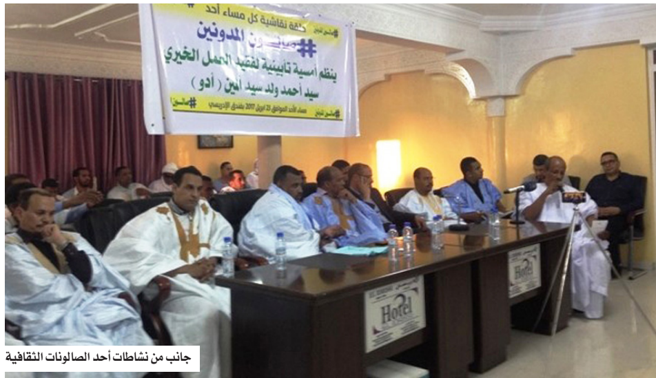
جانب من نشاطات أحد الصالونات الثقافية