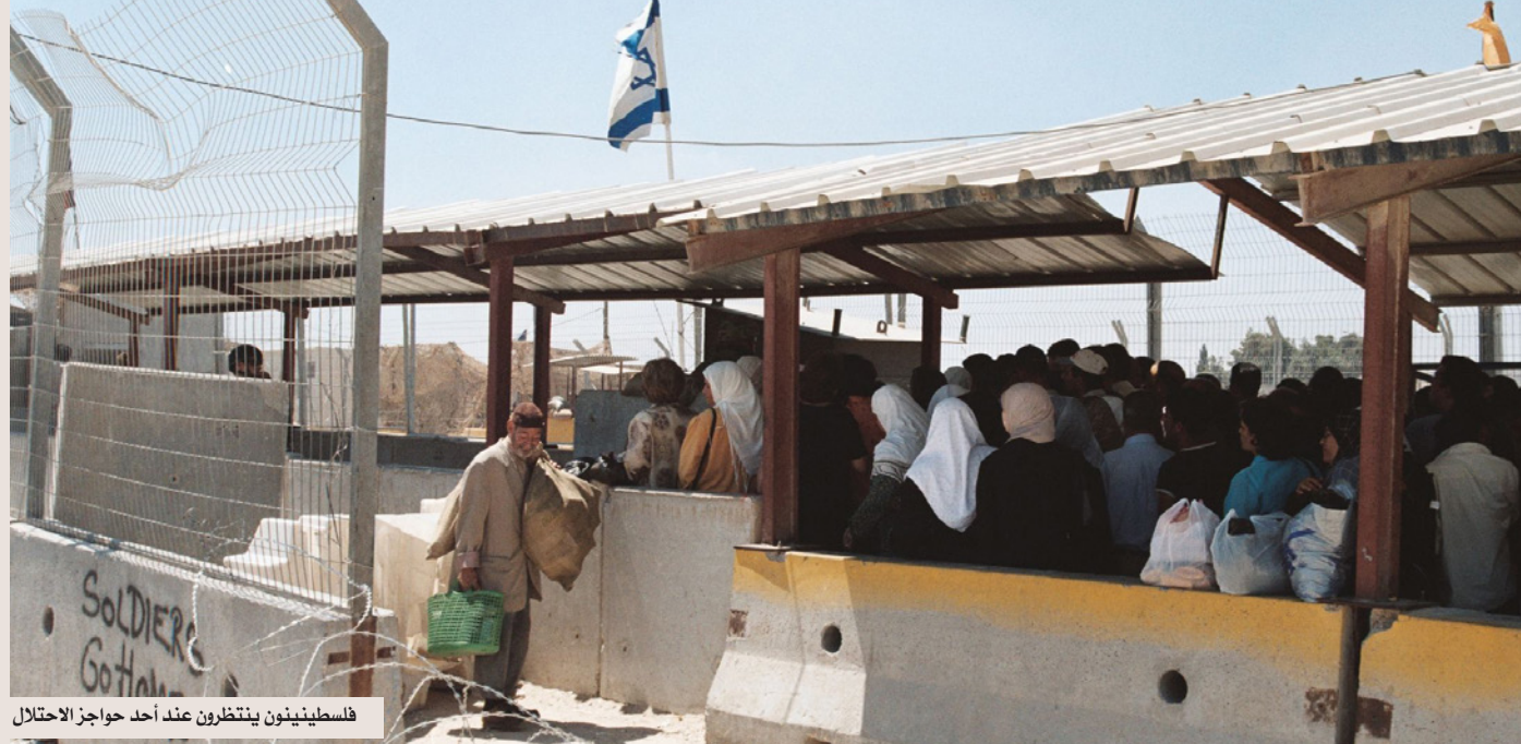
فلسطينيون ينتظرون عند أحد حواجز الاحتلال

شهر كانون الثاني/يناير لعام 2017، بينها 59 حاجزا داخلها منصوبة في عمق الضفة الغربية بعيدا عن مناطق الخط الأخضر، تشمل 18 حاجزا بعيدا عن الطلاب والموظفين تخلوا عن جامعاتهم ووظائفهم في المدن البعيدة عن أماكن سكنتهم، بسبب الحواجز العسكرية التي كانت تقطع ساعتين أو أكثر من دوامهم في الذهاب وتقطع ما تبقى من نهارهم بالإياب. وفق تقرير مركز المعلومات الإسرائيلي لحقوق الإنسان «بيتسيلم»، عدد الحواجز الثابتة المنصوبة في الضفة الغربية وصل إلى 98 حاجزا مع نهاية