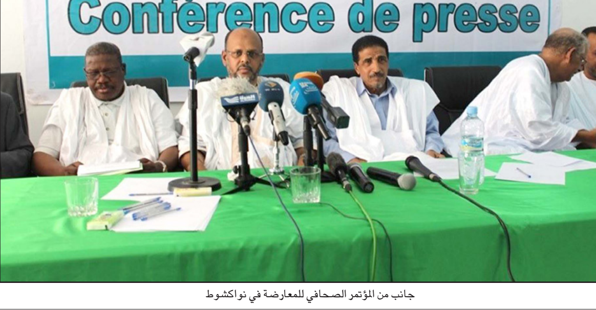
جانب من المؤتمر الصحافي للمعارضة في نواكشوط

السنوات الماضية»، وخلصت المعارضة للتأكيد بأنه «لا يختلف اثنان على استحالة إعداد ملف انتخابي ذي مصداقية ولا قائمة انتخابية متكاملة في ظل الممارسات التي تتبناها وكالة الحالة المدنية، والمتمثلة في التعتيم وعدم الشفافية، وتعتيد الإجراءات وتكاليها، وبعد مراكز التسجيل من المواطنين، سواء في الداخل أو الخارج، وتعد