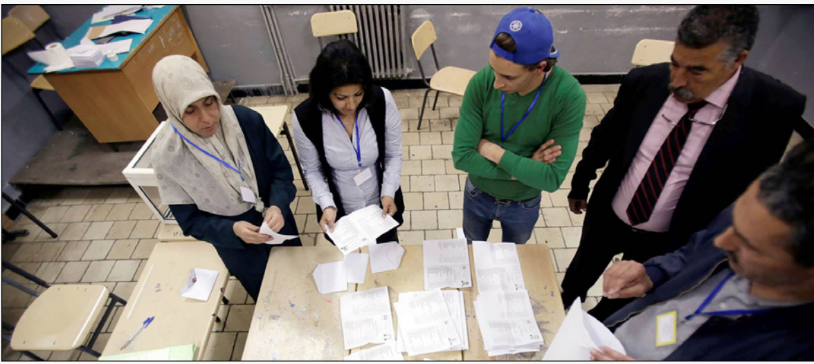
خلال فرز الاصوات

وكان مراد مدلسي رئيس المجلس الدستوري قد أعلن مساء الخميس عن النتائج النهائية للمجلس الدستوري، والتي طال انتظارها، مؤكداً أنه تم رفض 275 طعناً، وقبول 20 طعناً، بدون أن تكون هناك تغييرات كثيرة على النتائج، عدا في ولايتين، هما البلدية والمدينة، وبعد دراسة