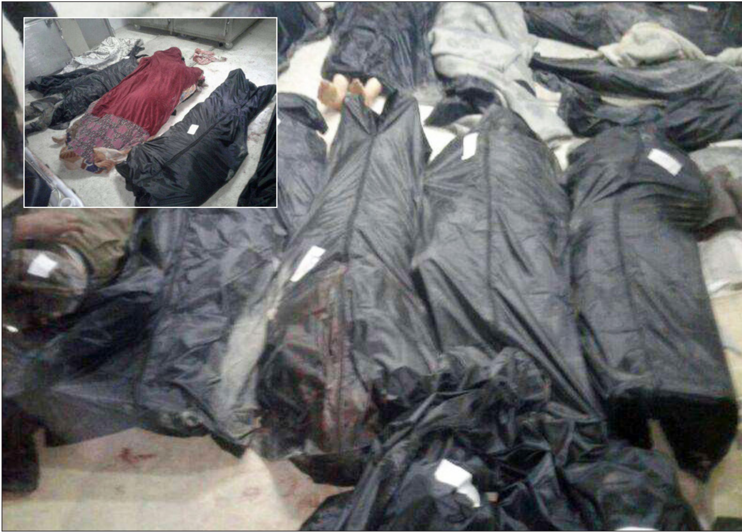
صورة وزعتها وكالة النظام الرسمية «سانا» لجثث ضحايا تنظيم «الدولة» في حماة (رويترز)

■ عواصم - وكالات: قال بشار الجعفري رئيس وفد الحكومة السورية بمحادثات جنيف أمس الجمعة إن الضربة الجوية التي نفذتها الولايات المتحدة في سوريا أمس الأول تمثل «إرهاب حكومات» وتسيبت بمجزرة في حين وصفت روسيا الضربة بأنها انتهاك غير مقبول للسيادة السورية. وقال مسؤولون أمريكيون إن الجيش الأمريكي نفذ الضربة الجوية الخميس ضد مسلحين تدعمهم الحكومة السورية شكلوا تهديدا للقوات الأمريكية ومقاتلي سورين تدعمهم الولايات المتحدة في جنوب البلاد، وقال الجعفري إنه أثار الواقعة خلال محادثات السلام في جنيف مع ستافان دي ميستورا مبعوث الأمم المتحدة الخاص إلى سوريا. وقال للصحافيين «كنا نعتقد بشكل مسهب عن المجزرة التي أحدثها العدوان الأمريكي أمس في بلادنا وأخذ هذا الموضوع حقه من النقاش والشرح ولم يكن غائبا عن أنظارنا».