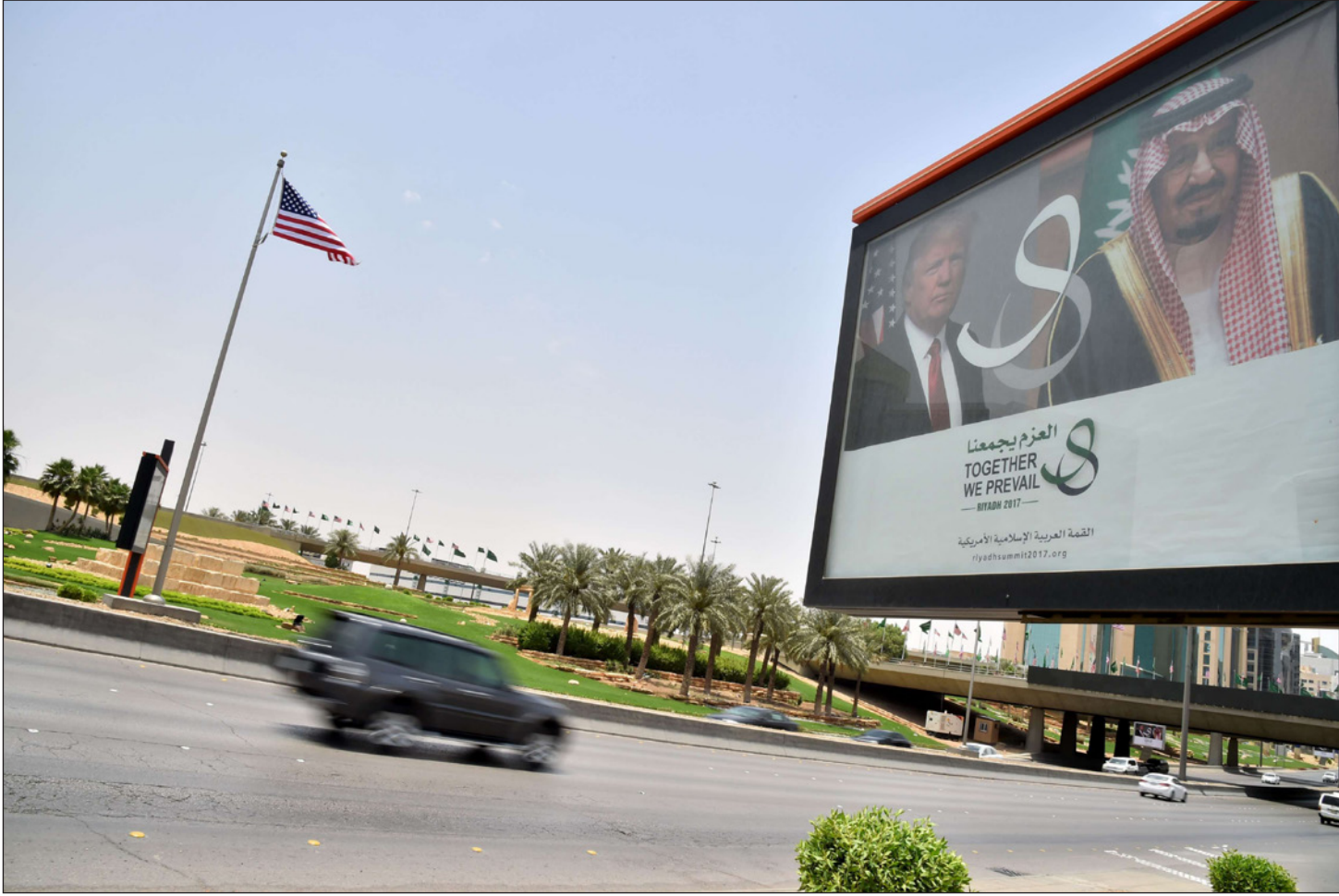
شارع الرياض تتزين تحضيرا لاستقبال الرئيس الأمريكي دونالد ترامب

ومن هنا تعلق صحيفة «التايمز» في افتتاحيتها على جولة ترامب قائلين أن الزيارة للسعودية مهمة من ناحية أن الشرق الأوسط بحاجة لكي يستمع لراي الدولة