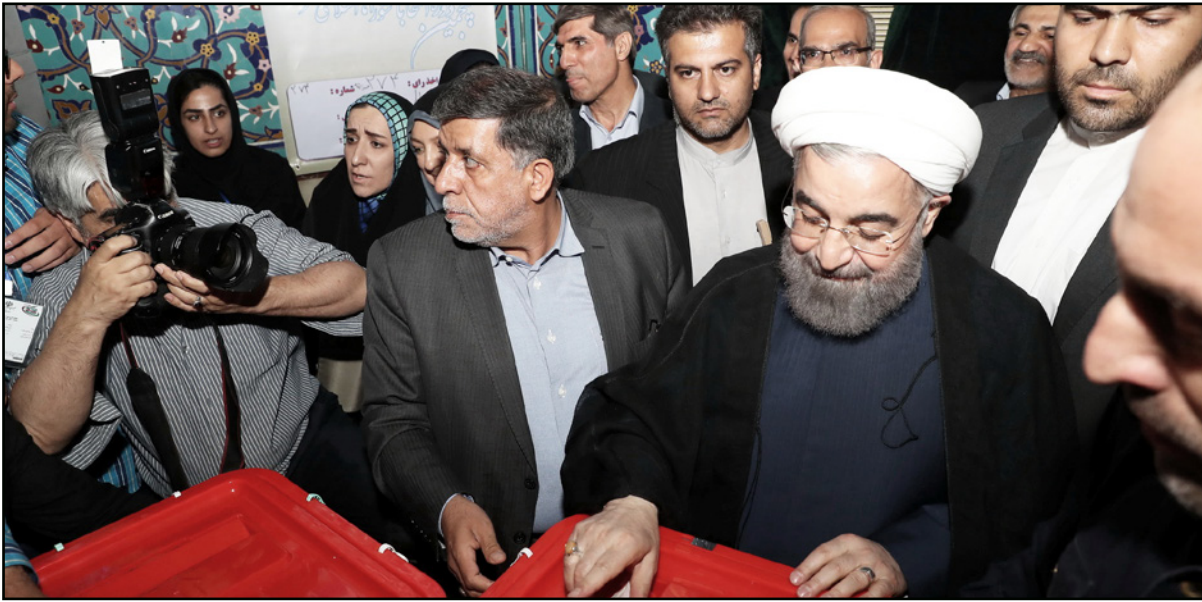
الرئيس الإيراني حسن روحاني يدي بصوته في الانتخابات الرئاسية في طهران أمس

الاسبوع في قمة مع قادة العالم الإسلامي في السعودية، المنافس الإقليمي للرئيس لـطهران. ورغم عداء واشنطن العلن تجاه بلاده، يطمح روحاني إلى مواصلة الإقناح على العالم بهدف جذب مزيد من الاستثمارات، وفي حين يسعى رئيسي إلى الدفاع عن الطبقات الأكثر حرمانا. ويصعب التخفاض للمحوظ في معدل التضخم الذي يبلغ 40% عام 2013 ويات نحو 9,5% حاليا في صالح روحاني ايضا.