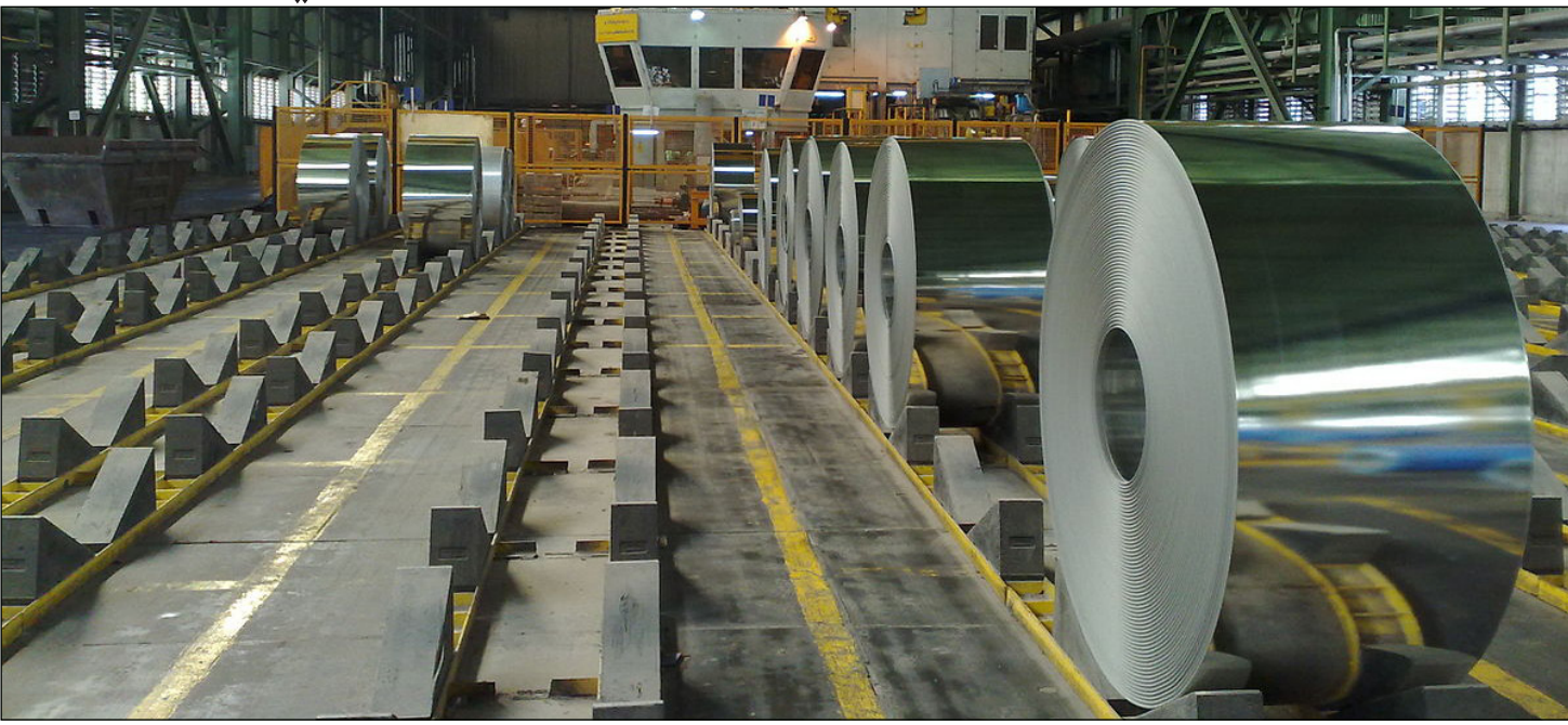
داخل مصنع «مباركة» لدرفلة الفولاذ في اصفهان

إضافية، وهي عدم تأثر هذه الأسهم عادة بالأحداث العالمية مثل تصويت بريطانيا لصالح الخروج من الاتحاد الأوروبي أو سياسة مجلس الاحتياطي الاتحادي (البنك المركزي الأمريكي). لكن مديري هاردينغ، مدير استراتيجيات الأسواق في الوقت الراهن بسبب انشطتها في الولايات المتحدة، يرون أنها ستستغفر في إيران يوما ما. وقال كارولس هاردينغ، مدير استراتيجيات الأسواق البنديشة في مجموعة «ميتلسون إيمرجنج ماركس» الاستثمارية «نشعر بحماس كبير تجاه الاقتصاد الإيراني، فقد يكون الأكبر في الأسواق المبتدئة. لديهم شركات على مستوى عالمي وشعب على مستوى عالمي أيضا». وأضاف «في غضون عشرة أعوام سنستثمر كثيرا في إيران».