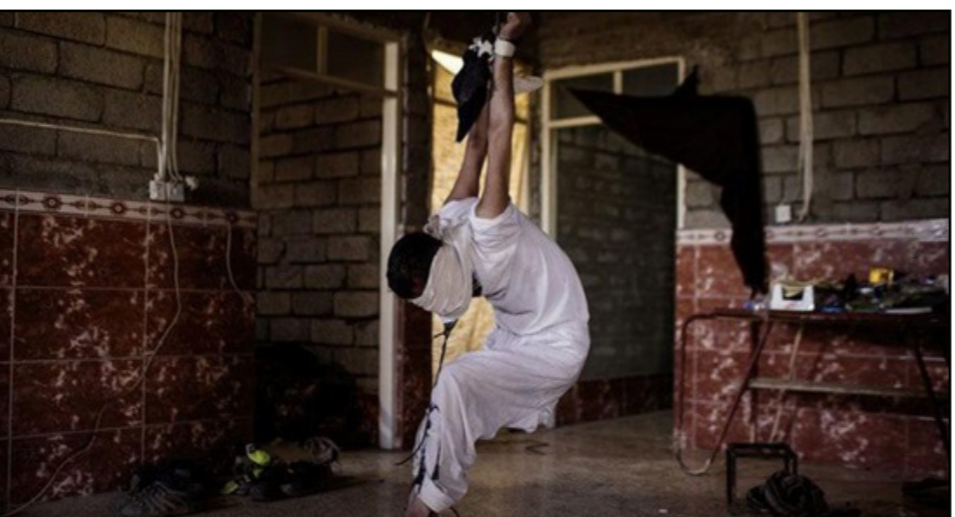
أحد الذي تعرضوا للتعذيب على يد الشرطة العراقية

إلى محكمة عسكرية وينفذ بهم القصاص العادل، لأن تصرفهم يسيء إلى المؤسسة العسكرية». وتابع: «هذه الجرائم تدعم التنظيم فقط، ونحن مجتمع إسلامي وجرائم الإغتصاب تعتبر فيه من أبشع الجرائم التي يجرمها الشرع والعرف». وأضاف: «هذا ما تم رسده في الإعلام، ولكن ما خفي كان اعظم». يذكر أن مجلة «دير شبيغل» الألمانية، قد نشرت قبل أيام صوراً وبيث، على موقعها الإلكتروني، فيديوها تظهر عناصر من قوات الشرطة العراقية، وهم يقومون بعمليات قتل وتعذيب لمواطنين.