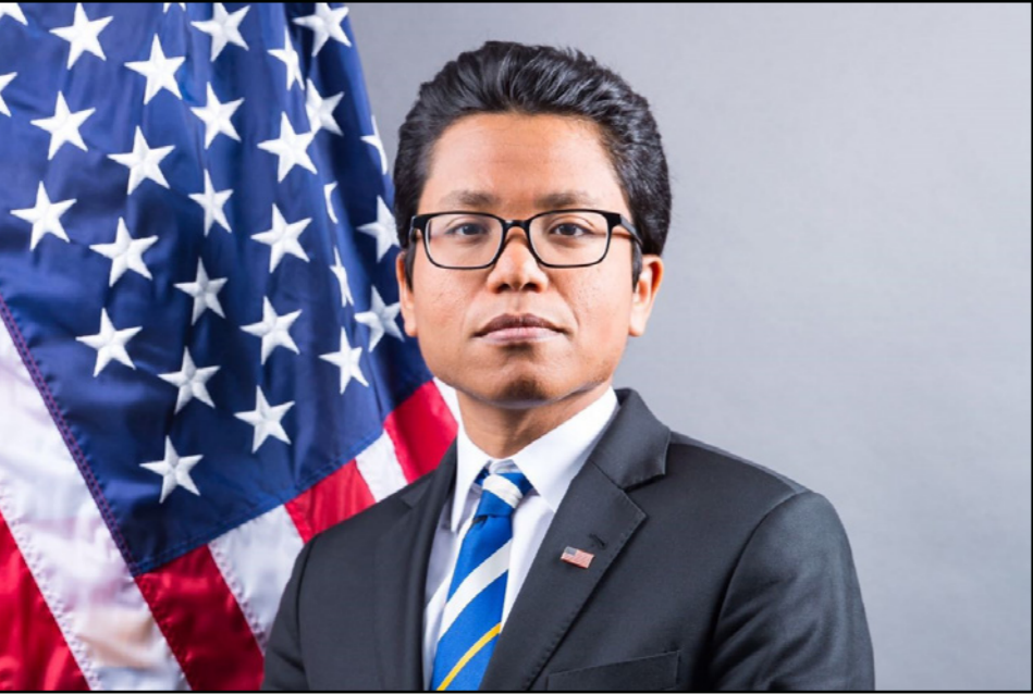
ناثان تيك المتحدث باسم الخارجية الأمريكية لشؤون الشرق الأوسط

*ما الذي تنتظره الولايات المتحدة الأمريكية من الرئيس