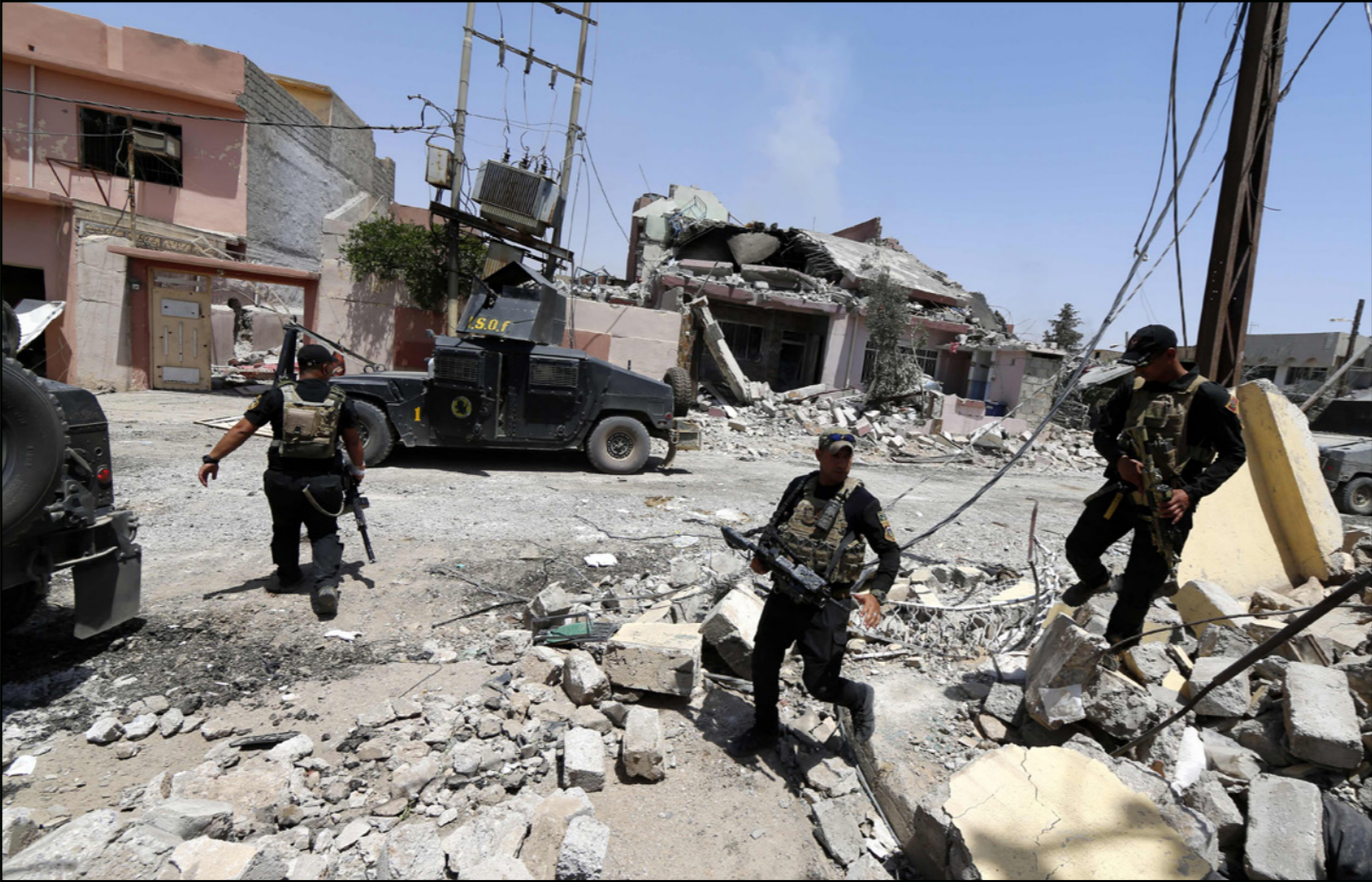
عناصر من مكافحة الإرهاب العراقية غرب الموصل

الموصل - ديالى - «القدس العربي» - وكالات: