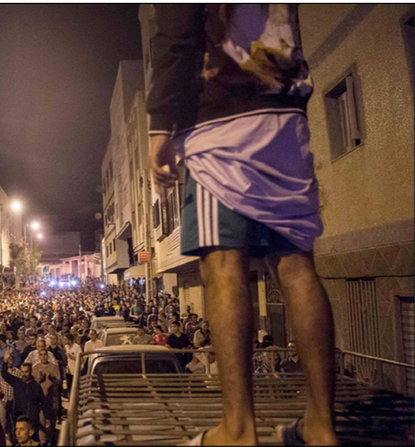
جانب من المظاهرات

ويعود هذا الاهتمام لكون ولد محمد الأغظف وهو من أقوى رجال الحكم، إما أن يكون معزولاً ويبدل ذلك على خلل كبير في النظام الحاكم، أو فرقا ليكون مرشحاً للرئيس ولد عبد العزيز ومجموعته في انتخابات 2019 وهو ما أشجع على السابق مرات عدة، أو موجهاً لقيادة الحزب الحاكم وهو ما يطرح تساؤلاً كبيراً آخر عن مصير سيدي محمد ولد محم رئيس الحزب وأحد أكبر مساعدي الرئيس، ولد التعديل الحكومي أمس على انقراض جناح رئيس الوزراء يحيى ولد حديمين على جنا الووزير مولاي ولد محمد الأغظف، وهما الرجلان اللذان يقودان أجنحة الصراع الحزبي في يرأسهما نظام الرئيس محمد ولد عبد العزيز. كما دل التعديل الجزئي على قوة رئيس الوزراء يحيى ولد حديمين الذي احتفظ بمصنبه رغم