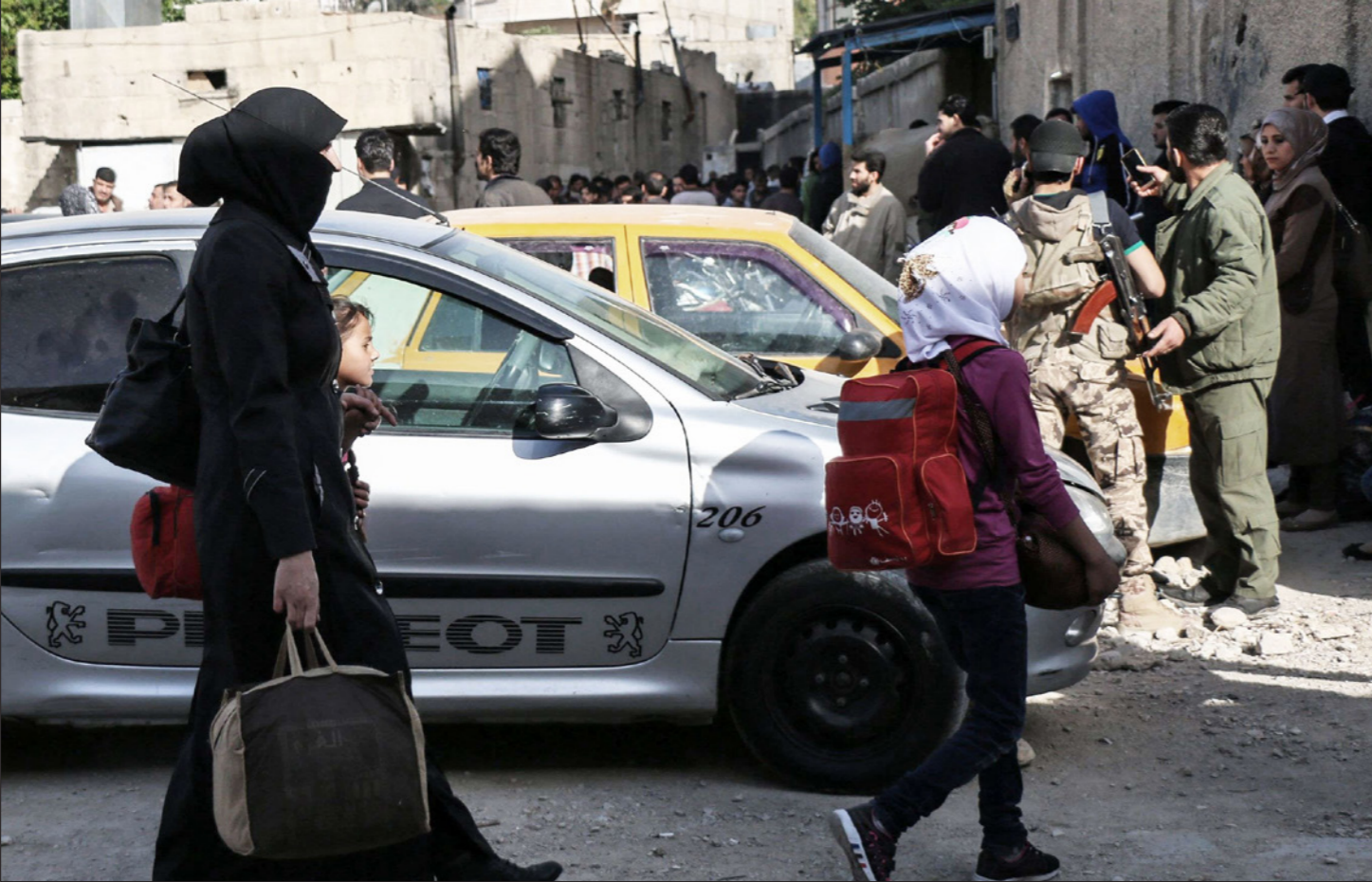
معارضون وعائلاتهم يتجمعون عند نقطة انطلاق في حي برزة استعداداً لإخلائهم من المنطقة