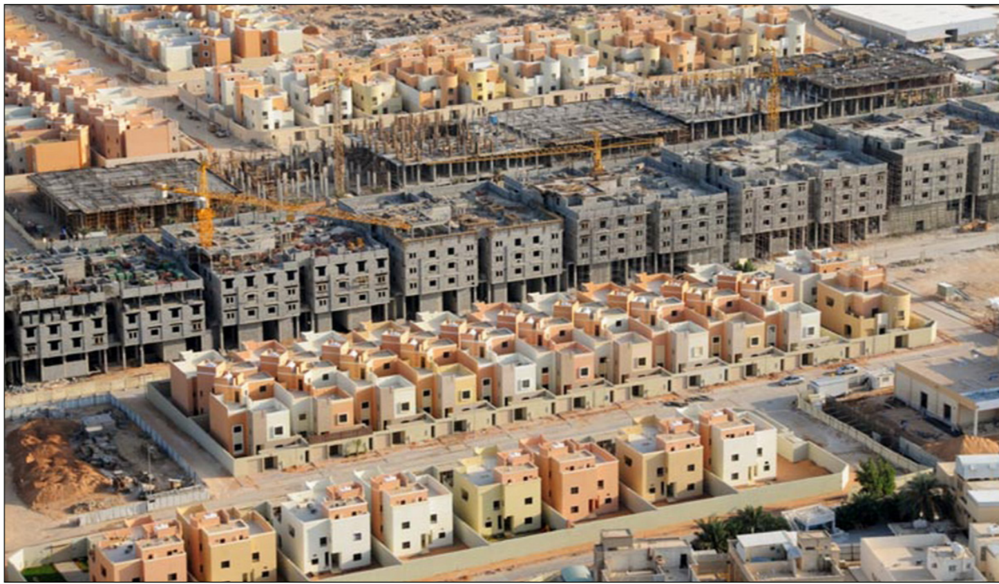
مشروع اسكان مدوم حكوميا قرب الرياض