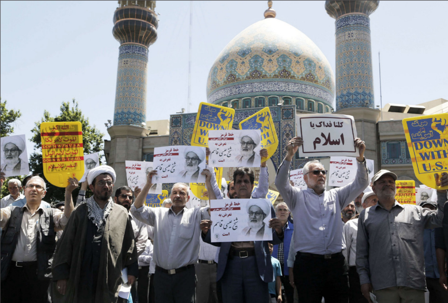
إيرانيون يطلقون شعارات ضد الحكم في السعودية والبحرين في طهران

ولم يستطع حسين شيخ الإسلام مستشار ظريف إمكانية عقد محادثات مباشرة مع الأمريكيين ولكنه قال إن الإيرانيين يحاولون فهم ترامب «هسو رجل أعمال» ولكن في عالم رجال الأعمال لا يزال يتصرف بطريقة انفعالية و غير متوقعة». يذكر أن العلاقة بين البلدين توقفت بعد الثورة الإسلامية عام 1979 ولكنها تادتاً مباشرة في أثناء المفاوضات على الاتفاق النووي الذي بدأت سرا عام 2013 وقبل انتخاب روحاني ذلك العام.