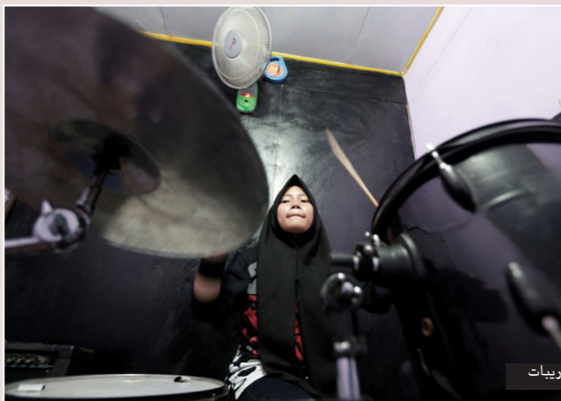
الفرقة خلال التدريب

بحقوق الإنسان، فإذا كانت الفتاة المسلمة موهوبة في العزف على الطبل أو القيثارة، فهل لا يسمح لها بالعزف؟ في رأيي أن الأمر يتصل بمواهب المرء وبإضافته إلى تناول الموضوعات الكلاسيكية تؤدي الفرقة أغاني خاصة بها تتصدى لقضايا مثل حالة التعليم في إندونيسيا. ويتشكل المسلمون ما يقرب من 90 في المئة من السكان البالغ عددهم حوالي 250 مليون نسمة. وتشكلت الفرقة في بلدة جاروت وهي موطن لعدة مدارس إسلامية، وليس هناك إجماع في البلدة أو شعور جماعي بأن المجتمع مستعد لقبول الفرقة أو