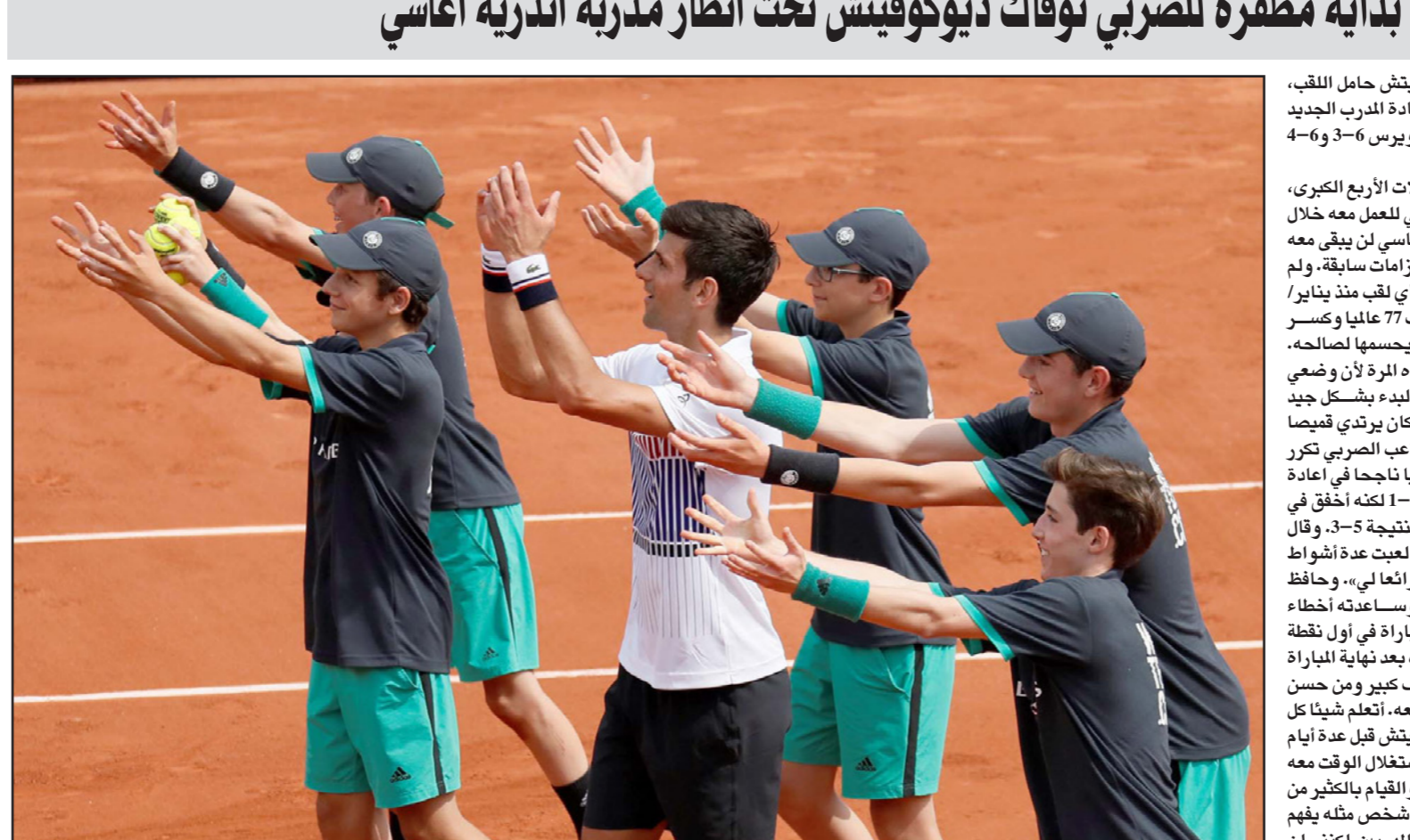
ديوكوفيتش يحتفل مع جماعي الكرات تحقيق انتصاره الأول