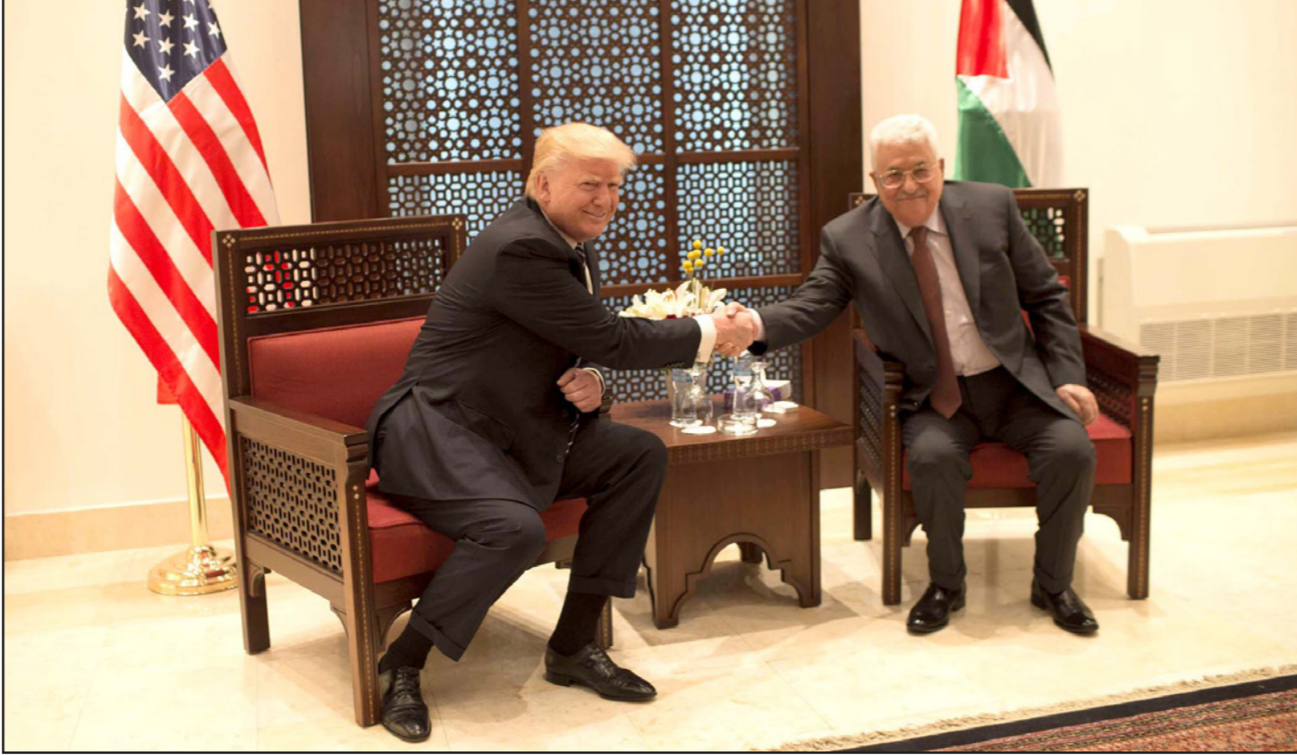
عباس لدى استقباله لترامب في بيت لحم

وحسب أقوال المسؤول الرفيع فإن ترامب فقد صبره وقاطع أبو مازن وهو يضرب بقبحه يده على الطاولة ويوحى: «أنت تحدثت عن مدى رغبتك بالسلام، وعمليا لا يوجد لذلك أي تعبير، الإسرائيليون عرضوا أمامي إثباتات على أنك ضالع شخصيا في التحريض، تشجع