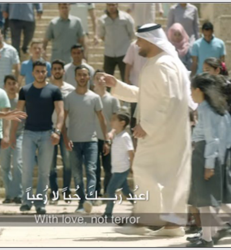
مشهد من الإعلان

محاولة تشويه صورة الثورة السورية وتحسين صورة نظام الأسد واستغلال صورة الطفل عمران التي حصلت على تعاطف كبير في مختلف أنحاء العالم».