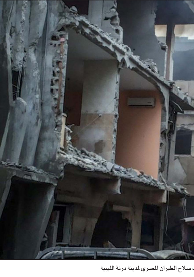
مبان مدمرة جراء قصف سلاح الطيران المصري لمدينة درنة الليبية

وأوضح بن علي شريف، أن الوزراء الثلاثة سيعدون «تقييماً للجهود التي يبذلها الليبيون أنفسهم ودول الجوار وأعضاء المجتمع الدولي الآخرون وكذا تلك المبذولة في إطار هذا التشاور الثلاثي الرامي إلى مراعاة الأطراف الليبية على درب التسوية النهائية اللازمة التي تضرب هذا البلد الشقيق والحار»، ويأتي الإعلان عن هذا اللقاء، بعد قرار مصر بشن غارات جوية على مواقع للجماعات المسلحة في ليبيا، على خلفية الهجوم الإرهابي الذي استهدف حافلة في منطقة المنيا وخلف عشرات القتلى والجرحى.