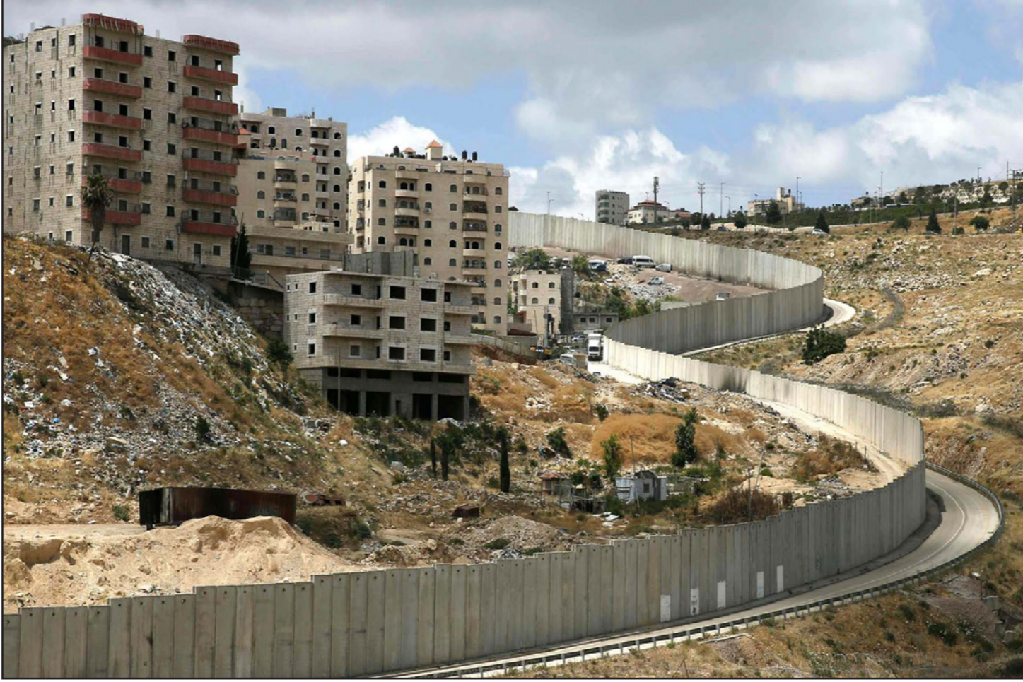
بناء في مستوطنة يسبغات زئيف قرب القدس المحتلة

يرأي تعارض مندبليلت على الرغم من طلبات المسؤولين الحكوميين وعلى رأسهم نتنياهو بالمصادقة على بناء المستوطنة، وأعرب مندبليلت قبيل عدة أسابيع عن معارضته لأمر القائد العسكري، وطلب بالمصادقة على إقامة البيوت وفقا للمسار المتعارف عليه قانونيا، وجاء