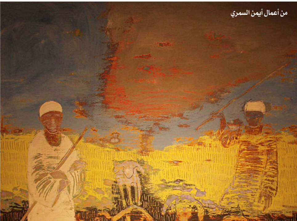
من أعمال أمين السمري

أصبح عالم الريف المصري اليوم وكأنه عالم بعيد، لم تعد العين - خاصة عند أبناء المدن - تلاحظ وجود القرية المصرية، أو مشاهد ريفية قد تراها حتى في طريق السفر، اللهم إلا بعض المساحات الخضراء التي تظهر على استحياء ويندهش لها الكثيرون. كما أن الدائرة الآن تلتجج بدورها عن تجسيد حياة الفلاحين ومناخاتهم الاجتماعية والثقافية، رغم المغالطات الغادحة التي كانت تصور هذه الحياة وصراعاتها.