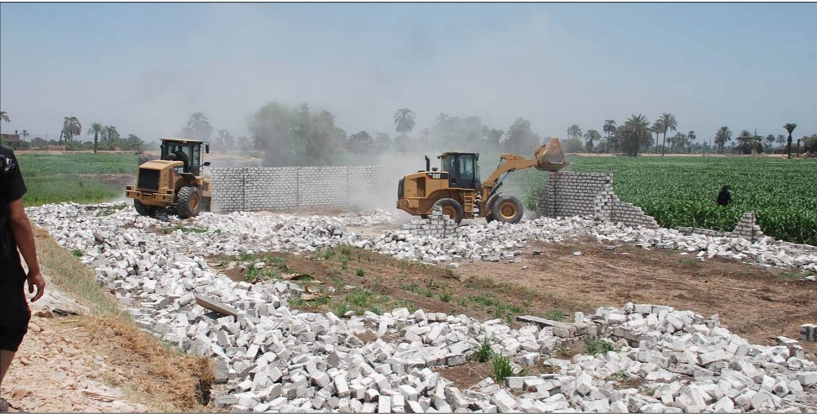
جرافات حكومية تزيل مبنى اقيم على ارض حكومية

القاهرة-رويترز: قال رئيس الوزراء المصري، شريف إسماعيل، أمس الأربعاء ان الحكومة نجحت في استرداد مساحات كبيرة من أراضي الدولة من واضي اليد، وأن الحملة مستمرة لاسترداد مزيد منها.