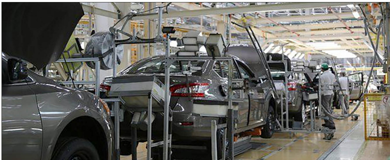
مصنع لسيارات نيسان في المكسيك

وزاد إنتاج وصادرات المكسيك من السيارات بأكثر من 14 في المئة في الأشهر الخمسة الأولى من 2017 . وتذهب حوالي ثلاثة أرباع صادرات السيارات المكسيكية إلى الولايات المتحدة