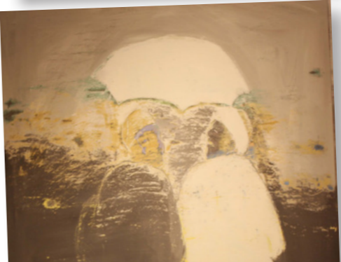
حياة الريف اليومية

الكثير من الفنانين يتناولون موضوع الحياة في الريف المصري، لتكون موضوعاً لأعمالهم الفنية، ومنه الوهلة الأولى تستطيع أن تفرق بين الفنان العالم بتفاصيل هذه الحياة، والأخر المُدعي الذي لم يرها إلا من خلال شاشة السينما أو التلفزيون، وهو بذلك ينقل تزييفه عن نسخة مزيفة في الأصل. اللقطات والمشاهد التي جسدها الفنان أمين السمري توحى بأكثر من معاشية هذه الحياة، وهو كثيراً ما عبر عنها خلال معارضه المختلفة، رغم تباين التقنيات التي جسدها بها هذه اللقطات، ومحاولة