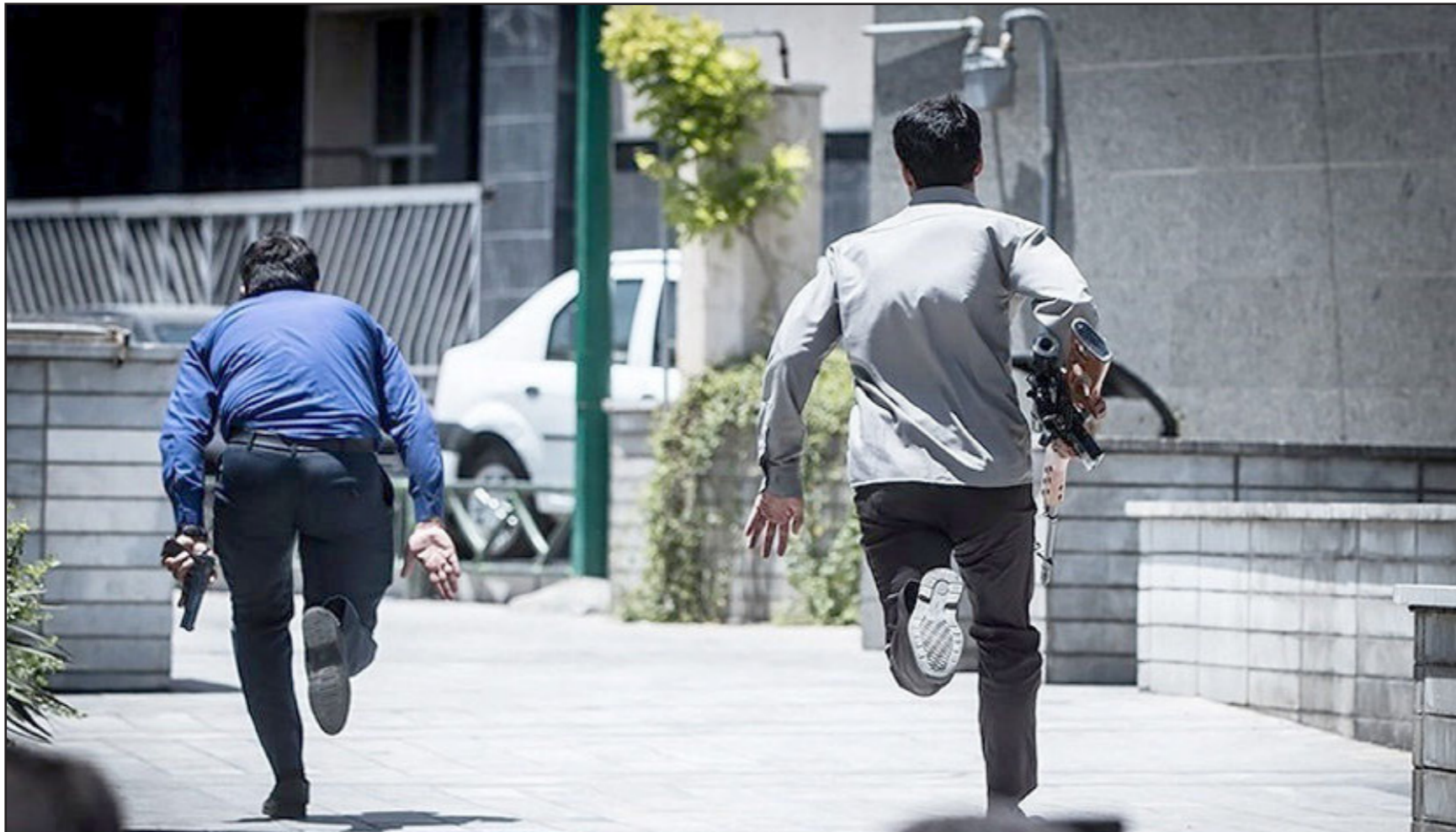
عناصر من الشرطة الإيرانية يطاردون المسلحين في طهران