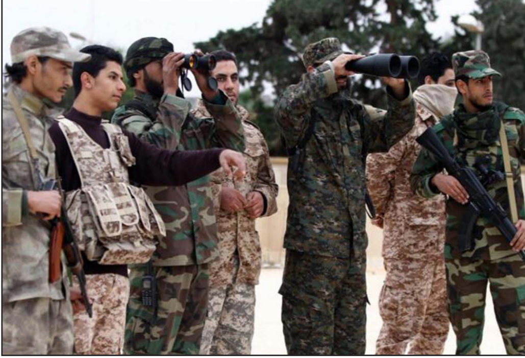
عناصر من القوات التابعة لخليفة حفتر

الجانب، مما اضطر القوة الثالثة (تابعة لكتائب مصراتة) إلى الانسحاب من قاعدة «تمنيت» الجوية قرباني من مدينة سبها (750 كلم جنوب طرابلس).