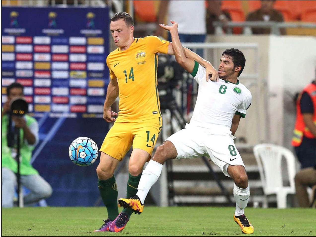
صراع أستراليا والسعودية يتكرر اليوم في مدينة أدليد

■ أدليد (أستراليا) - د ب أ: تتجه أنظار الملايين من عشاق الكرة السعودية اليوم صوب استاد «أدليد أوفال» لمابعة واحدة من أهم وأصعب المباريات في التصفيات الآسيوية المؤهلة لنهائيات كأس العالم 2018 عندما يلتقي المنتخب الأسترالي والسعودي في الجولة الثامنة من المجموعة الثانية بالدور النهائي للتصفيات. وتمثل المباراة ساعة الحقيقة لكلا المنتخبين، لأن الفائز فيها يقطع خطوة مهمة على طريق التأهل للمونديال، لا سيما وأن إحدى المباراتين المتبقيتين لكلا الفريقين في التصفيات ستكون أمام المنتخب الياباني العنيد. وسبق للفريقين أن تعادلا 2/2 في الذهاب في جولة أولى خلال تشرين الأول/أكتوبر الماضي، وسيكون الهدف الأساسي للمنتخب السعودي الفوز أو الخروج بنقطة التعادل على الأقل، لتعزيز موقعه في المركز الثاني بالمجموعة والاقتراب من المونديال الروسي والاحتفاظ بالمعنويات المرتفعة للفريق قبل الجولتين الأخيرتين من التصفيات. ويحتل المنتخب السعودي المركز الثاني برصيد 16 نقطة، بفارق الأهداف فقط خلف نظيره الياباني، وبفارق ثلاث نقاط أمام نظيره الأسترالي، ما يعني أن فوز «الأخضر» يمهده له الطريق بقوة ليلوغ النهائيات، فيما سيكون التعادل بمثابة تعزيز رائع لوضع الفريق، لكنه سيحتاج مزيد من الحذر في المواجهتين الباقيتين، والتسبب يلتقي فيها الإمارات واليابان. ولن يكون أمام المنتخب الأسترالي بقيادة أنجي بوستوكولو سوى حصد النقاط الثلاث إذا أراد الحفاظ على فرصه في المنافسة على إحدى بطاقتي التأهل المباشر، حيث يتاهل الأول والثاني في كلا المجموعتين إلى النهائيات مباشرة، فيما