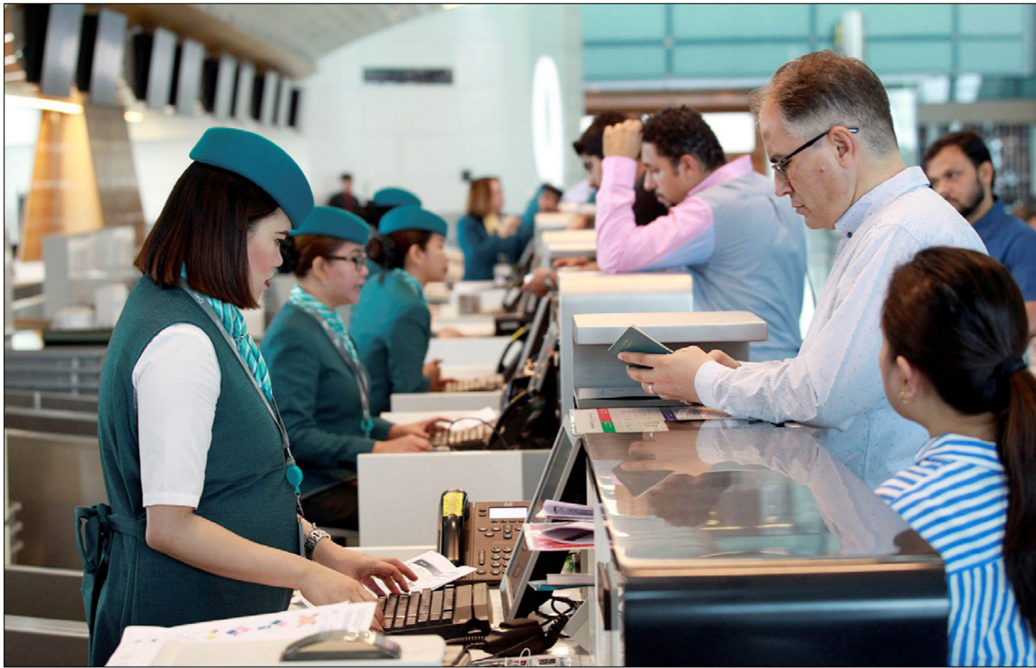
جانب من مطار حمد الدولي في العاصمة القطرية الدوحة