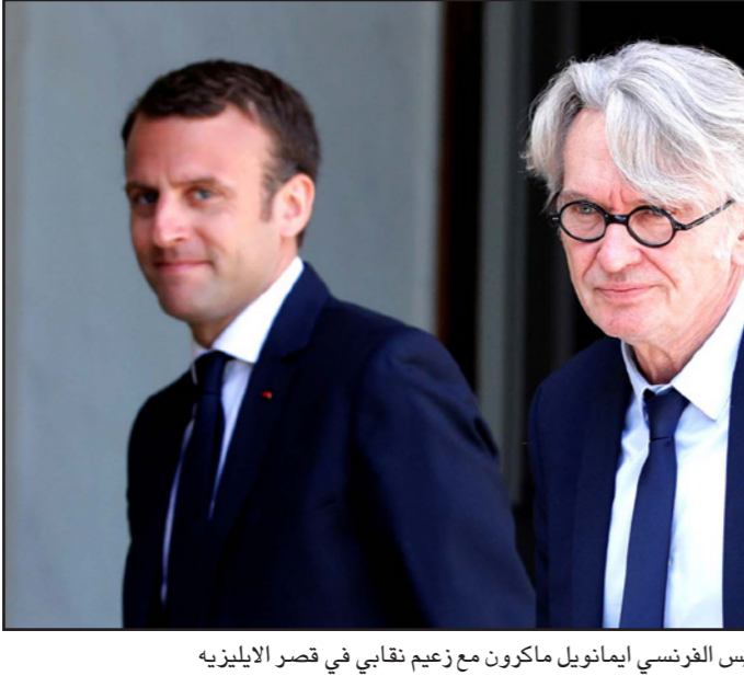
الرئيس الفرنسي إيمانويل ماكرون مع زعيم نقابي في قصر الإليزيه

من هشام حصاحص: دفعت الهجمات الإرهابية الأخيرة التي عرفتها عدد من الدول الأوروبية، بينها اعتداء باريس أول أمس ضد قوات الأمن، الرئيس الفرنسي إيمانويل ماكرون إلى اتخاذ إجراءات أمنية جديدة بهدف حماية المواطنين، من التهديدات الإرهابية، خصوصاً أن البلاد مقبلة على انتخابات تشريعية الأحد المقبل. وأعلنت الرئاسة الفرنسية يوم أمس الأربعاء إنشاء «مركز وطني لمحاربة الإرهاب»، يعمل تحت إمرة الرئيس ماكرون مباشرة، وجاء الإعلان خلال اجتماع للمجلس الوطني للدفاع في قصر الإليزيه، الذي شهد حضور كافة كبار القادة الأمنيين في أجهزة الاستخبارات الداخلية والخارجية، والقادة العسكريين، إضافة إلى رئيس الحكومة وعدد من الوزراء والمستشارين الأمنيين. وتمحور الاجتماع حول التدابير الجديدة التي يعتزم إيمانويل ماكرون اتخاذها من أجل محاربة الإرهاب خلال ولايته الرئاسية.