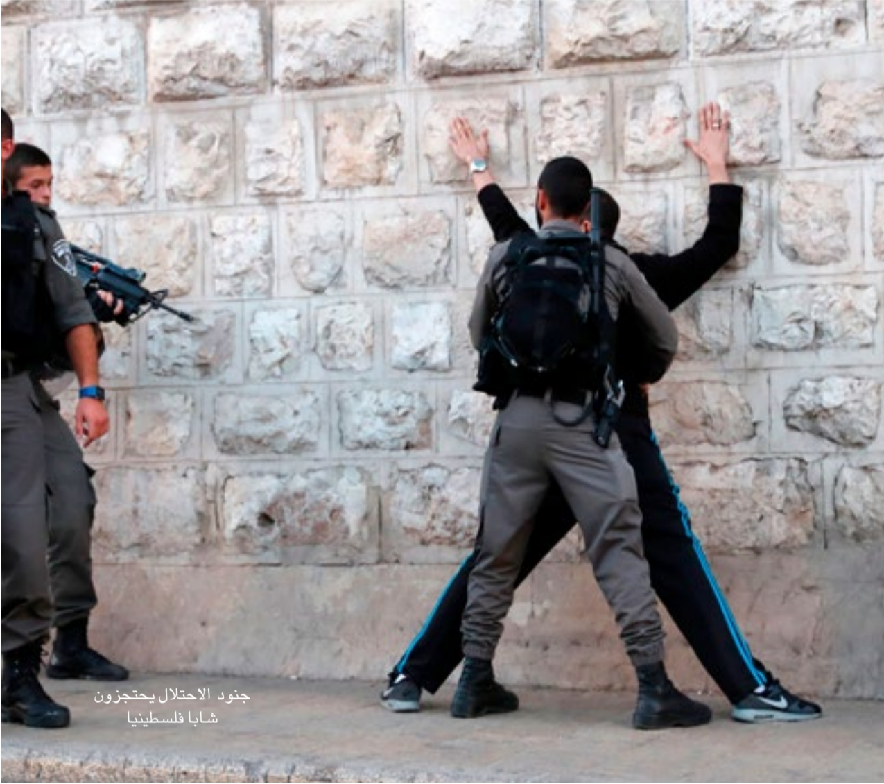
جنود الاحتلال يحتجزون شبابا فلسطينيا