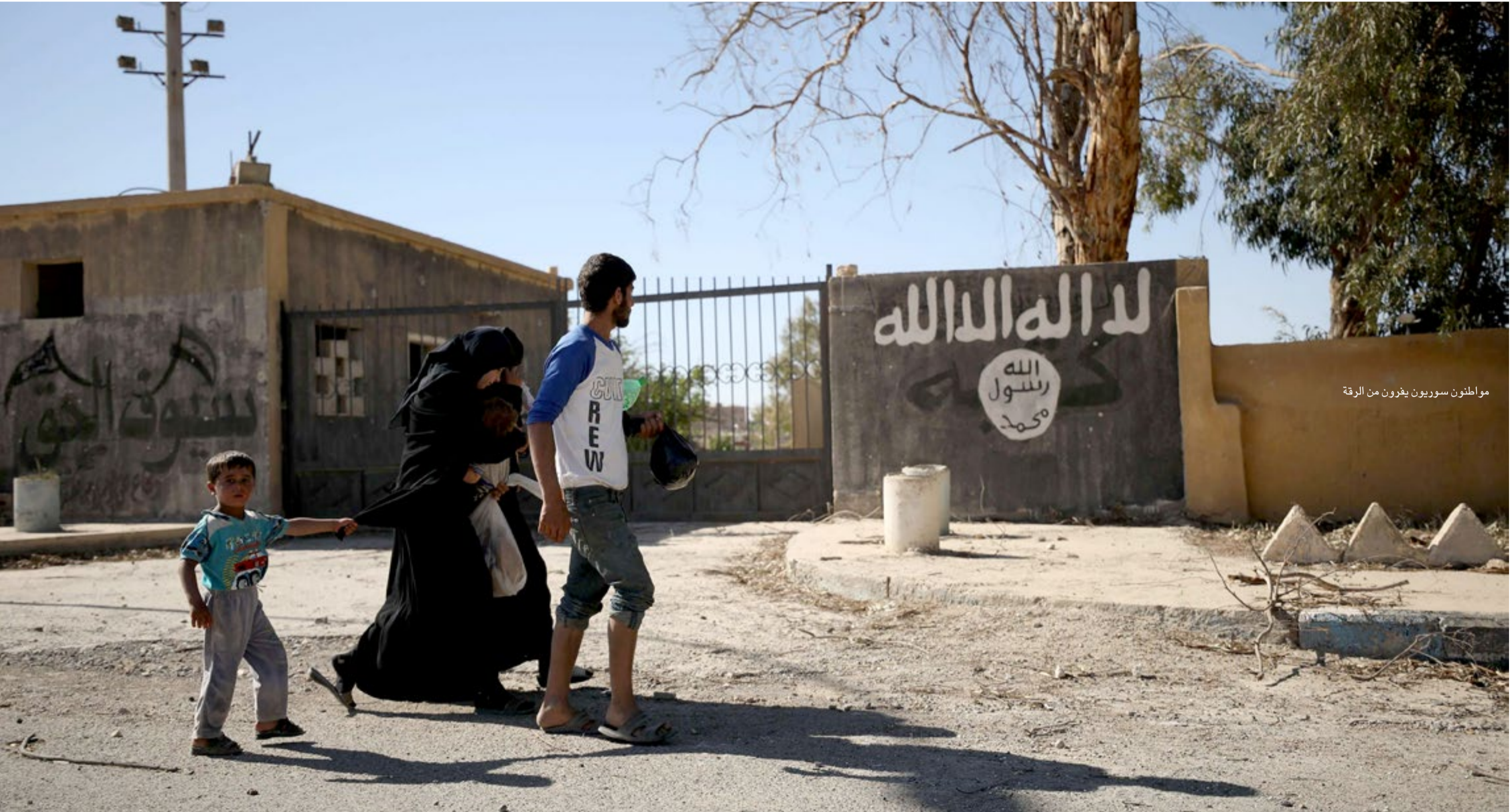
مواطنون سوريون يفرون من الرقة

.. في حضور «داعش» كما في غيايها، بالطبع؛ فالأمر عنده سيان!