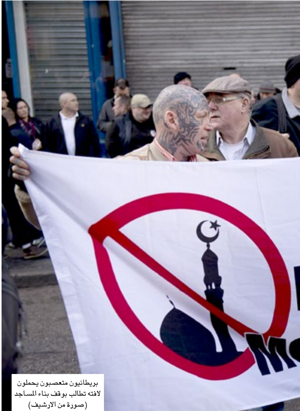
بريطانيون متعصبون يحملون لافتة تطالب بوقف بناء المساجد (صورة من الارشيف)