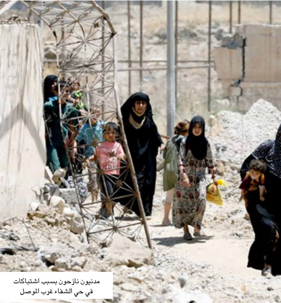
مدنيون نازحون بسبب اشتباكات