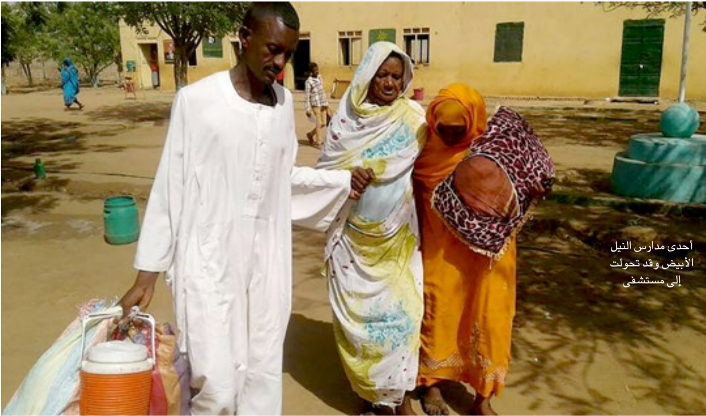
أحدى مدارس النيل