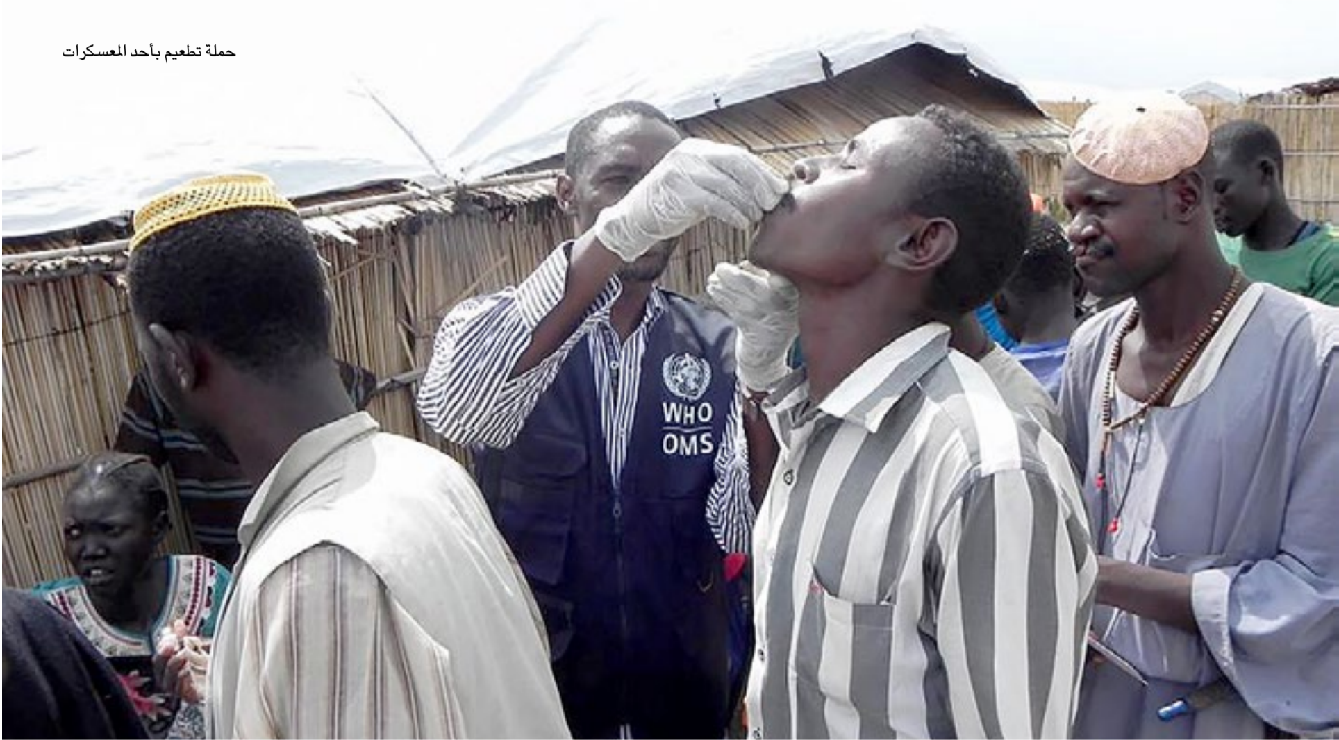
حملة تطعيم بأحد المعسكرات