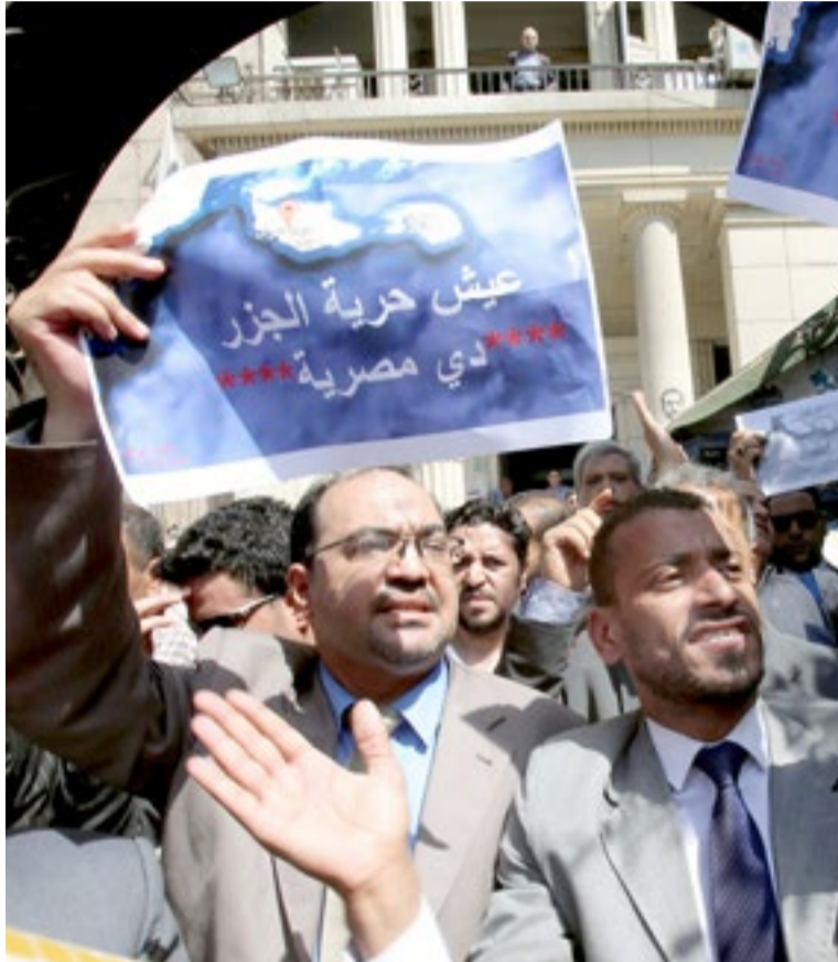
متظاهرون يحملون شعارات احتجاجا على التنازل عن الجزيرتين

السنة التاسعة والعشرون العدد 8859 الأحد 18 حزيران (يونيو) 2017 – 23 رمضان 1438هـ