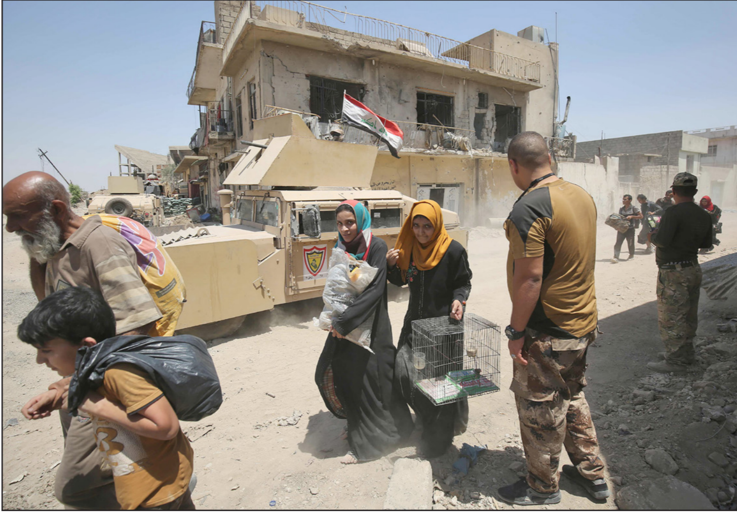
نازحون خلال فرارهم من المعارك غرب الموصل

وتعد منطقة الموصل القديمة التحدي الأبرز للقوات العراقية في حملة تحرير المدينة، بسبب أزقتها الضيقة والمتشعبة، ما يجعل المركبات العسكرية عاجزة عن