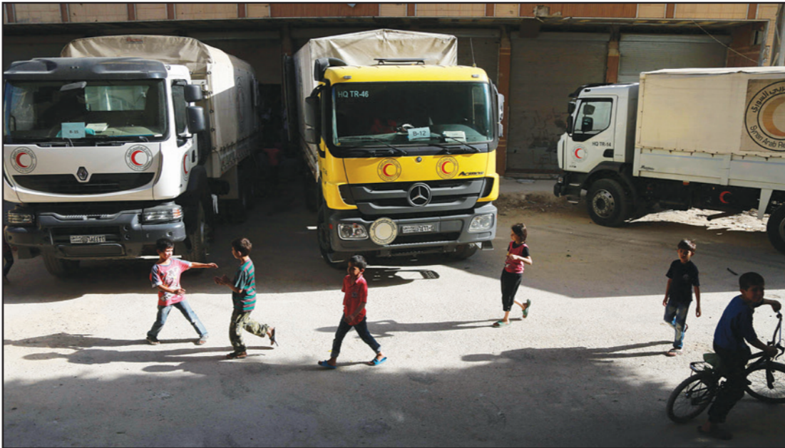
أطفال سوريون يلعبون قرب شاحنات الهلال الأحمر تحمل مساعدات إلى بلدة حرسنا المحاصرة قرب دمشق

■ لندن - «القدس العربي» - من أحمد المصري: انسحب كل من معاذ الخليل، الرئيس السابق للاتصالات الوطني لقرى الثورة والمعارضة السورية، ورئيس اللجنة القانونية في هيئة المفاوضات محمد حسام حافظ، من الهيئة العليا للمفاوضات السورية، منددين بالتجاهل السياسي داخليا، والخوض الذي يكتنف حراك الهيئة واتباع سياسة المحاصصة وليس الكفاح ونفى الخليل أي علاقة لاستقالته بالأزمة الخليجية. وانتقد الخليل في رسالته التي اطلعت على «القدس العربي» على نسخة منها، الهيئة، وقال «إن فخاذا عديدة مررت تحت غطاها سواء في أستانا، التي كانت فخا للفضائل