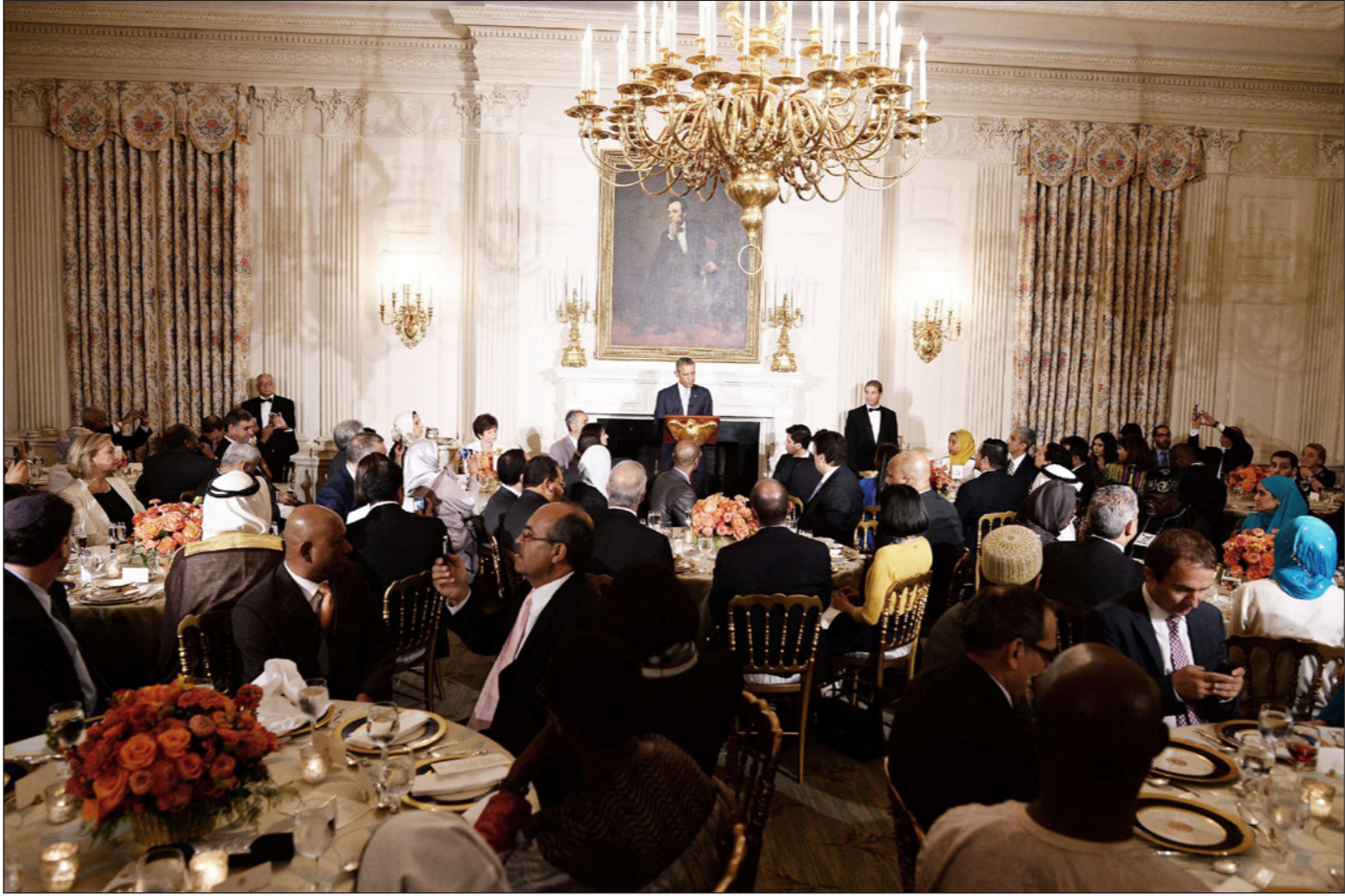
صورة أرشيفية للرئيس السابق أوباما في إظهار للجالية المسلمة الأمريكية حيث اعتاد البيت الأبيض إقامة هذه المائدة منذ عهد بيل كلينتون

ونكر اسم جماعة العمل الوطني أو «ناشيونال أكت» والتي تنشر رسائل معادية للمسلمين وكشفت الصحفية أن عدد المتطرفين الذين ينتمون لليمين ممن أجلبوا إلى سلطات مكافحة الإرهاب زادت في الفترة الأخيرة بنسبة 30%.