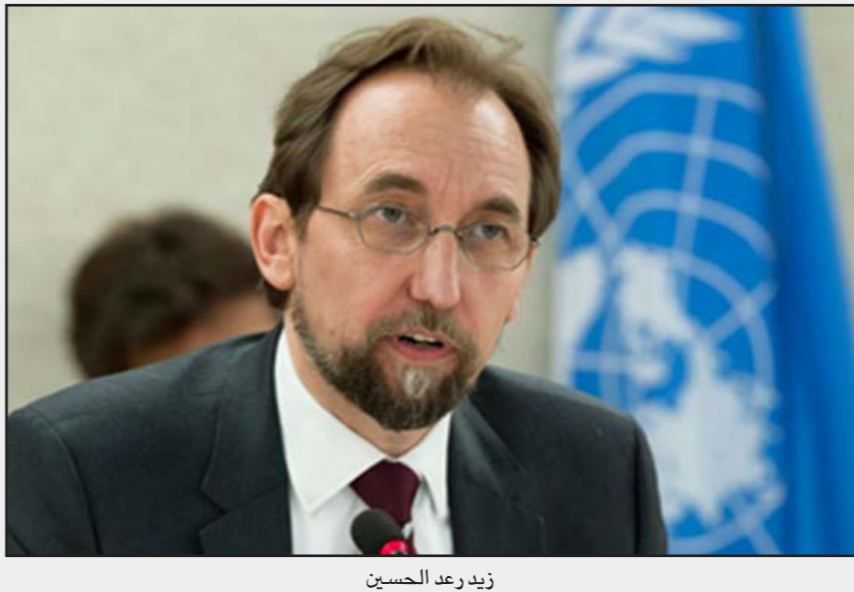
زيد رعد الحسين

وأكد على ضرورة أن يتحمل المجتمع الدولي مسؤولياته بالضغ على إسرائيل، لوقف الاستيطان