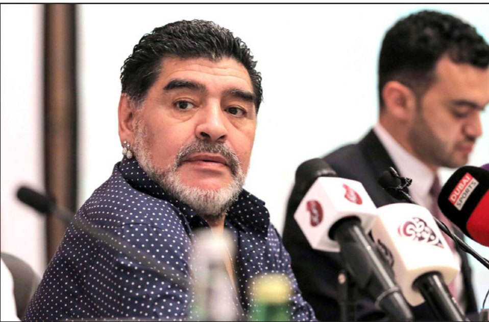
مارادونا شن هجوماً نارياً على عدد من الرموز والشخصيات الرياضية