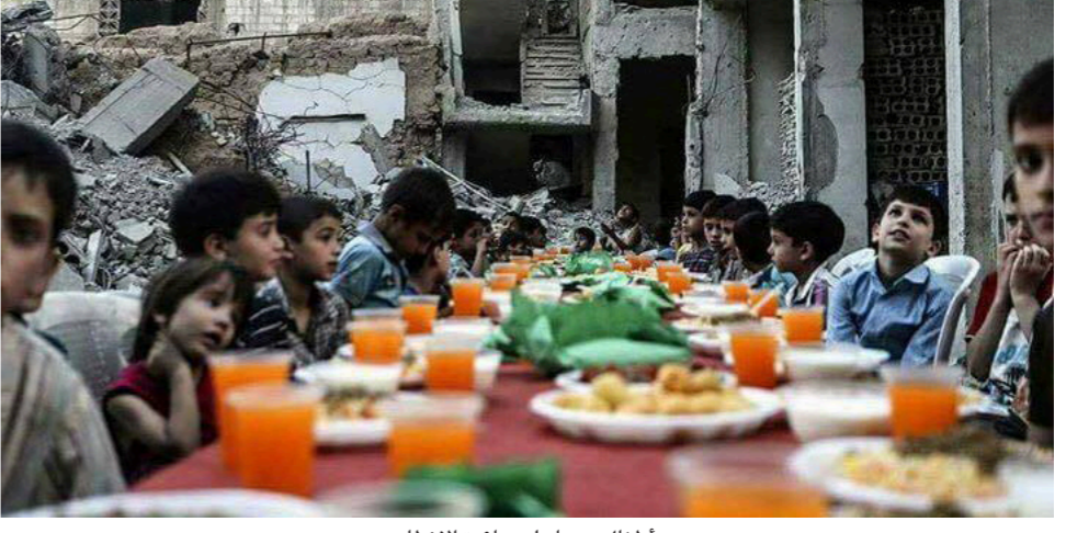
اطفال دوما على مائدة الإفطار

اللافت حضور الأطفال بشكل كبير إذ بلغت نسبتهم ثلث عدد الحاضرين تقريبا وما زاد في فرحتهم الأناشيد الرمضانية التي وضعناها على موائد الإفطار، وتتنوع الوجبات بين المذيق والأرز بالبازلاء وبعض المقبلات إضافة إلى الشربويات