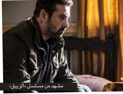
مشهد من مسلسل «الزيبق»

الكويدية، التي تقدم من خلال «دراما الواقع» التي يبذل الفنان الكوميدي عماد فراجين، بعرضها من خلال «وطن على وتر»، وغيرها من الأعمال المشابهة، التي تكثر متابعتها على الإنترنت، إضافة إلى «دراما المقاومة»، ظلت تحافظ على مكانتها عند الكثير من السكان، على اختلاف أعمارهم. وعلى خطى المواسم الماضية، التي قدمت فيها فضائية حماس «الأقصى» مسلسل «الفدائي» الذي يحاكي قضية المقاومة المسلحة مع الاحتلال، تقدم هذا الموسم عملا آخر يحاكي ما تتعرض له مدينة القدس المحتلة من ضغوطات واقتحامات للمسجد الأقصى، وعمليات تهويد واسعة للمدينة من قبل سلطات الاحتلال، أطلق عليه اسم «بوابة السماء». ولم تمنع ضعف الإمكانيات الفنية من إبراز العمل بشكل جيد، كما لم تمنع القيود الإسرائيلية والحصار المفروض على قطاع غزة، من تصوير العديد من