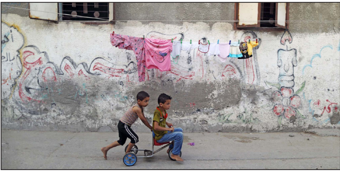
طفلان فلسطينيان يلعبان في مخيم الشاطئ في غزة