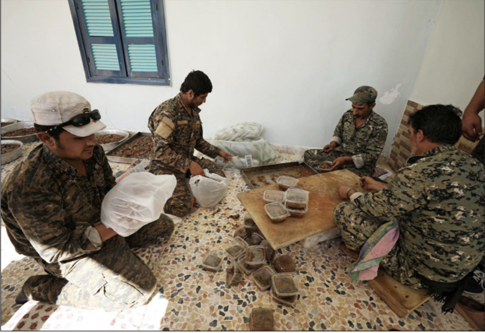
عناصر من «قوات سوريا الديمقراطية» يحضرون الأطعمة لزملائهم على الجبهة

ومنذ سيطرة تنظيم الدولة الإسلامية على مدينة الرقة في العام 2014، يعيش سكانها في خوف دائم من أحكام الجهاديين المتشددة. ويغذي هؤلاء الشعور بالرعب من خلال الإعدامات الوحشية والعقوبات من قطع الأطراف والجلد وغيرها التي يطبقونها على كل من يخالف أحكامهم أو يعارضها. في شارع ترابي يتجول فيه مقاتلون من قوات سوريا الديمقراطية، يقف الشاب باباسه العسكري وشاله الاخضر فوق رأسه ويندبته على كتفه يتذكر