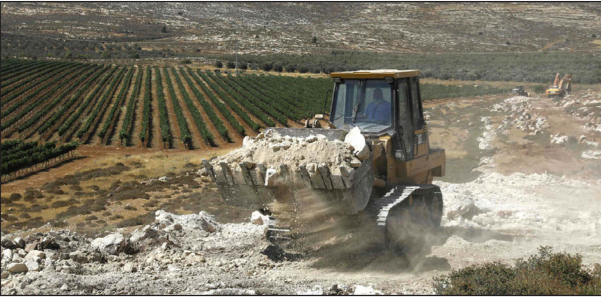
جانب من أعمال الحفر التي تجري لبناء المستوطنة الجديدة

تحت إشراف وزير الدفاع الإسرائيلي إيهود باراك، بدأ العمل في بناء مستوطنة جديدة في الضفة الغربية المحتلة، وذلك في إطار سلسلة من الخطوات التي تتخذها إسرائيل لتوسيع نطاقها الاستيطاني. وتأتي هذه الخطوة بعد أسابيع من إعلان إسرائيل عن خططها لبناء ثلاثة آلاف منزل مستوطن في مناطق أخرى بالضفة الغربية. وتعتبر معظم الدول أن المستوطنات التي بنتها إسرائيل على أرض احتلتها في حرب عام 1967 غير مشروعة، وترفض إسرائيل ذلك وتقول إن هناك روابط دينية وتاريخية وسياسية بالضفة الغربية بالأضافة لصالح أمني.