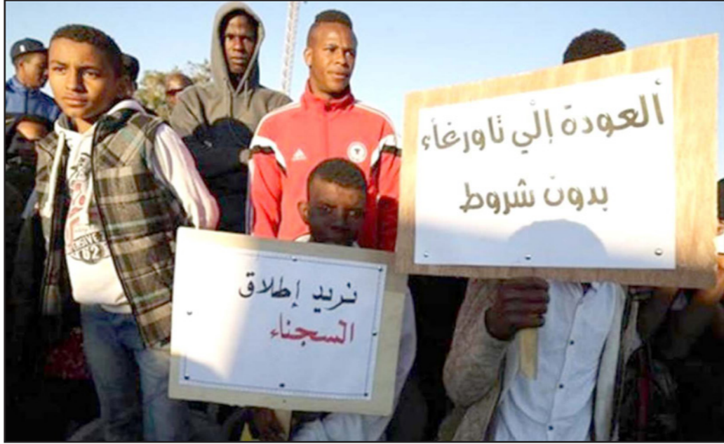
أهالي تاورغاء المهجورون ينظفون في بنغازي