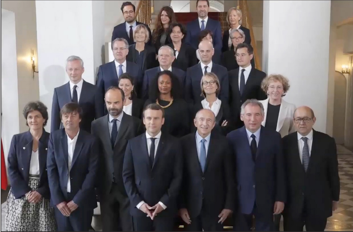
الرئيس الفرنسي إيمانويل ماكرون وحكومته الجديدة

والإصلاحات التي ينوي الرئيس ماكرون تنفيذها، باعتبار أن الحزب له توجه يساري راديكالي يرفض المالية العالمية والرسامة المالية والعمولة والإصلاحات الاقتصادية التي تستهدف الطبقات العمالية الضعيفة. وحصل اليمين المتطرف على 8 مقاعد فقط، وهو ما يعتبر فشلا كبيرا لأنه كان يعول أكثر من 15 مقعدا ليتمكن من تشكيل فريق برلماني. وفازت زعيمة حزب الجبهة الوطنية مارين لوبان، بمقعد برلماني، عن مدينة هينان بومون، وهي أول مرة يستحصل فيها قبة البرلمان بعد فشلها في انتخابات سابقة. ويعيش اليمين المتطرف خلافات وانقسامات حادة بين قياداته وهو ما يقصر حصوله على نسبة هزيلة من المقاعد مقارنة مع نتائج الجولة الثانية من الانتخابات الرئاسية، بعد حصول مارين لوبان على نسبة 32 في المئة من نسبة الأصوات.