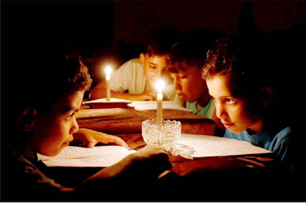
أطفال فلسطينيون يقرأون على ضوء الشموع عقب تقليص الكهرباء في غزة

وهو ما يشكل «كارثة بيئية» بكل المقاييس، وحول مخاطر هذا التلوث على حياة الإنسان، ذكر التقرير أن السياحة تسبب الإصابة بالميكروبات التي تسبب أمراضاً عدة يمكن أن تهدد حياة السكان، منها الأمراض الجلدية لدى الصغار والكبار، انتشار الطفيليات المعوية، والتسبب في إصابات في العين وفي الأذن، قد تتطور إلى ضعف في النظر والسمع. وكانت سلطة البيئة في غزة، حذرت من السباحة في معظم شواطئ قطاع غزة، مع بداية فترة الاستجمام، بسبب التلوث، وأساسه ضخ كميات كبيرة من المياه العادمة دون معالجة، بسبب توقف محطات الصرف الصحي عن العمل، مع بداية أزمة الكهرباء التي تعصف بالقطاع، ولا تكفي ساعات وصل التيار لعمل محطات المعالجة، حيث تضطر لضخ الكميات الأكبر من هذه المياه للبحر، بشكل مباشر، دون أن تخضع لعمليات التنظيف السابقة، وحسب التقرير الحقوقي فإن ساحل قطاع غزة الذي يمتد بطول 42 كيلو متراً تقريباً، يتعرض لأنواع كثيرة من التلوث والمخاطر الضارة التي تؤثر بشكل سلبي على البيئة البحرية، وعلى مناطق الاستجمام، والثروة السمكية، وغير ذلك من أوجه الحياة العامة، لافتاً إلى أن بلديات القطاع تضخ مياه الصرف الصحي في مياه البحر، نظراً لقصور محطات معالجة مياه الصرف الصحي الموجودة في القطاع في معالجة المياه العادمة بالشكل المطلوب، بسبب انقطاع التيار الكهربائي ونقص الوقود ومنع دخول المضخات وقطع