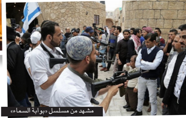
مشهد من مسلسل «بوابة السماء»

المشاهد في أزة «البلدة العتيقة»، من المدينة المقدسة، بعد أن تمكن فريق العمل من بناء جزء منها في «مدينة أصداء الإعلامية»، جنوب قطاع غزة، أظهرت الشوارع والحال وبيوت القدس وساحة المسجد الأقصى. ويسيطر الضوء على المرابطين والمرابطات في باحات الأقصى، ويتطرق لأعمال منع دخولهم لمنطقة الحرم من قبل الجنود والمستوطنين الإسرائيليين. وعلى غرار مسلسل المقاومة السابق «الفدائي» يتفاعل المتابعون لـ «بوابة السماء» مع الأحداث المتلاحقة، والتي تظهر شيئا من عمليات المقاومة ضد إسرائيل، والتي ينفذها أبطال العمل، إضافة إلى متابعتهم عبر مشاهد عدة لتصدي سكان المدينة بأجسادهم وبالحجارة لاقتحامات جنود الاحتلال بساحات المسجد الأقصى، ومحاولات المستوطنين سرقة منازل المدينة من سكانها الأصليين. ويوفر موقع «يوتيوب» فرصة لسكان غزة، لمشاهدة هذه الأعمال الدرامية، من خلال تطبيق الموقع على أجهزة الهاتف المحمولة والتابلت، كبدل عن أجهزة استقبال القنوات الفضائية، للتغلب على أزمة نقص الكهرباء التي تصل لأربع ساعات يوميا فقط، في حين يتربح سكان عدة مواقع إعادة بث هذه الأعمال لملامتها وجدول توزيع الكهرباء.