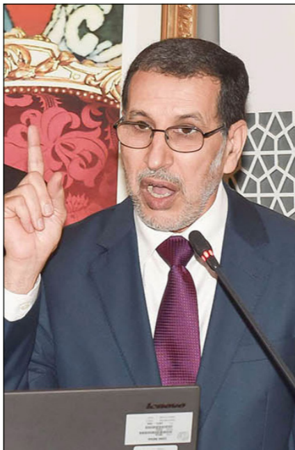
سعد الدين العثماني

القناتي، خاصة على المستوى الاقتصادي، إلا أن المبادرات التجارية لا تزال دون المستوى المطلوب، ودون تطلعات الشعبين والأهداف التي تم تسطيرها خلال اجتماع آخر لجنة عليا مشتركة، داعياً إلى إعطاء دينامية جديدة للعلاقات الثنائية في هذا المجال.