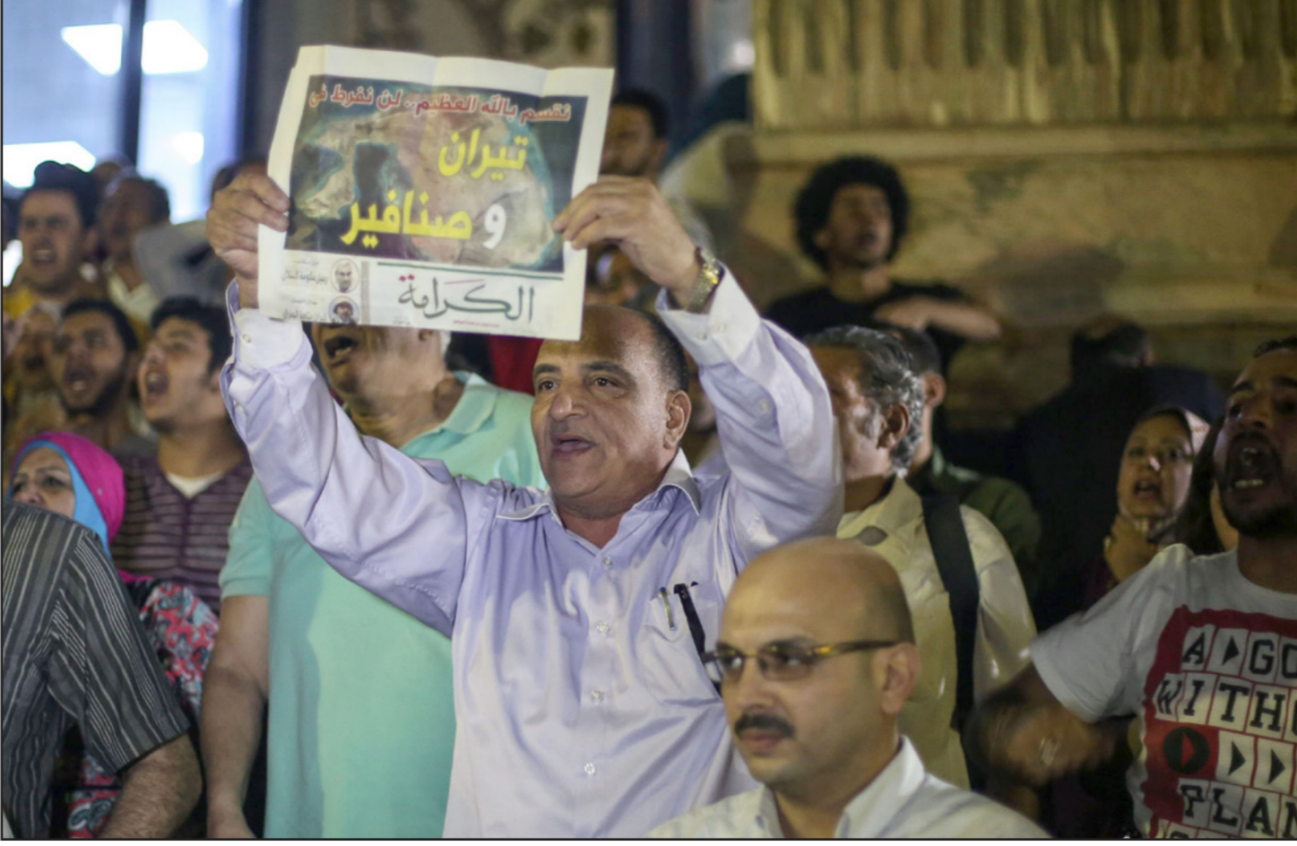
مصريون يتظاهرون ضد بيع الجزيرتان في القاهرة

كذلك من بين الانتهاكات «الإقدام المشين على التفریط والتنازل عن جزء من إقليم الدولة بالمخالفة لحكم الفقرة الأولى من المادة الأولى من الدستور والتي تنص على: جمهورية مصر العربية دولة ذات سيادة، موحدة لا تقبل التجزئة، ولا يتنازل عن شيء منها، والفقرة الثالثة من المادة 151 من الدستور والتي تنص على «وكل ما يمس جميع الأحوال لا يجوز إبرام أية معاهدة تخالف أحكام الدستور، أو يترتب