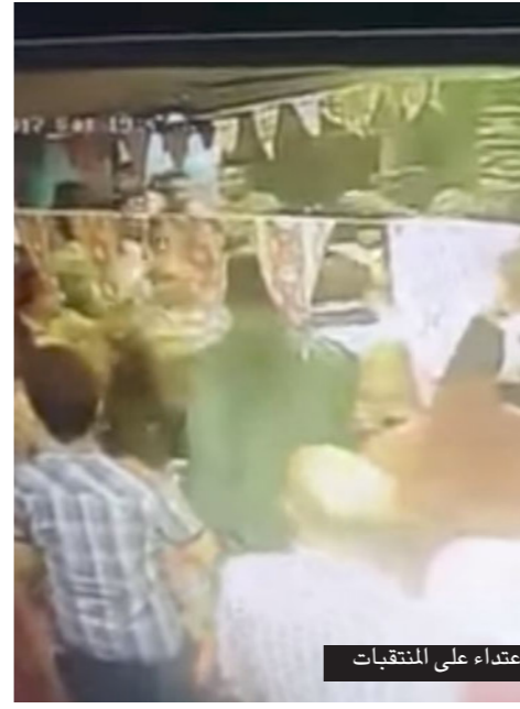
إفطارن تظهرن لحظة الاعتداء على المنتقبات

وذكرت أن الاشتباك حدث مع الأسرة ورجلين برفقتها، وليس من العاملين بالمطعم بعدما رأتهم وهم يغادرون المكان عقب المشكلة، مستنكرة ما حدث وما فعله عاملان من المطعم بخصوص الإساءة للنتقبات، والذي حول الأمر لدى الفتيات إلى هجوم على النتقبات، وعدم احتواء الأمر من البداية وأصفا «التوهيل الذي حدث وهذه الهجمة على مقاطعة محل بياكل عيش بسبب غلظة فرد ولا فردين كان ممكن يتأدبوا من الإدارة».