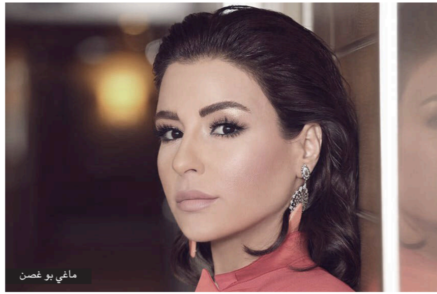
ماغي بو غصن

درامي كوميدي طريف، وتبدأ الأحداث من الحياة الهادئة التي تعيشها «مايا» (ماغي بو غصن) مع والدتها «جمانة» (مسي صايغ)، وأختها «فادي»، وخبيبها «أياد» (جوليان فرحات)، لكن «قطعة من الكراميل» كانت كفيلا بتغيير حياة «مايا»، بعد أن تعرّف إلى «رجا» (ظافر العابدن) الشاب الغني، الذي عاد من فرنسا إلى لبنان، لتأسيس شركته الخاصة. وسجّل حبة الكراميل هذه «مايا» طرفا في الصراع الذي يخوضه «رجا» ضد منافسه رجل الأعمال «فؤاد شاهين» (النجم بيار داغر)، وأيضاً ضد شقيقته «كارلا» (النجمة كارن لنبير)، التي ستحاول الاستحواذ على قلب «رجا». وهكذا يكون وقع حبة الكراميل سحرا على كل من مايا ورجا اللذين يعيشان لحظات درامية وكوميديا ويعتان المشاهدين بجرعات من الحب والافتعالات والشاكسات، هذا المسلسل الذي تعرضه LBC1 قبل نشرة الإخبار المسائية الساعة 8 بتوقيت بيروت هو من الفيلم السينمائي «BeBe». ويشاركها البطولة النجم التونسي ظافر العابدن، ضمن ثنائية رومانسية لاقفة وسط قالب اجتماعي