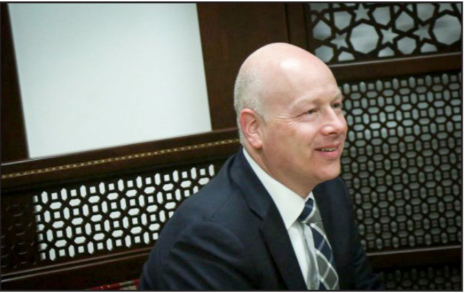
جيسون غريبلانت معوث ترامب إلى الشرق الأوسط

بعيدا عن الاضواء، وبعد أن تراجع الاهتمام السياسي والإعلامي بالشرق الأوسط إلى أماكن أخرى في أعقاب زيارة الرئيس ترامب في الرياض والقدس، تستمر المحاولات الأمريكية لإعادة تحريك العملية السياسية في المسار الإسرائيلي الفلسطيني. تعبير بارز عن التصميم لاقتحام الجسود ووضع مبادئ أساسية متفق عليها بين الأطراف تؤدي إلى التقدم التدريجي نحو الحل، يمكن ملاحظته في قيام شخصين من مستشاري الرئيس إلى المنطقة، غراد كوشنر وجيسون غرينبلت، رغم أنه في المرحلة الحالية يبدو أن الوصفة السحرية التي ستؤدي إلى الاتفاق على هذه المبادئ ما زالت بعيدة عن التحقق، إلا أن هناك حقيقة واضحة: في الوقت الذي اعتبرت فيه إدارة أوباما منذ بداية طريقها أن الحل الدائم هو شرط مبدئي وخضية قفز ضرورية من أجل الوصول إلى شرق أوسط جديد، برعاية الولايات المتحدة، فإن الإدارة الجديدة لا تعتبر أن هذه الجبهة هي أساس كل شيء. بل على العكس، في نظر الإدارة الحالية الحديث يدور عن لعبة واحدة فقط داخل مبنى إقليمي واسع يربط ترامب بتشكيله وخلق الاستقرار فيه مع منح الأولوية في هذا الإطار لكافة الخط السعودي وليس الفلسطيني. حقيقة أن المملكة السعودية التي تشعر بالتهديد بسبب ازدياد قوة إيران في أعقاب «اتفاق فيينا» جعلتها تتحرك سياسة المصالحة التقليدية مع