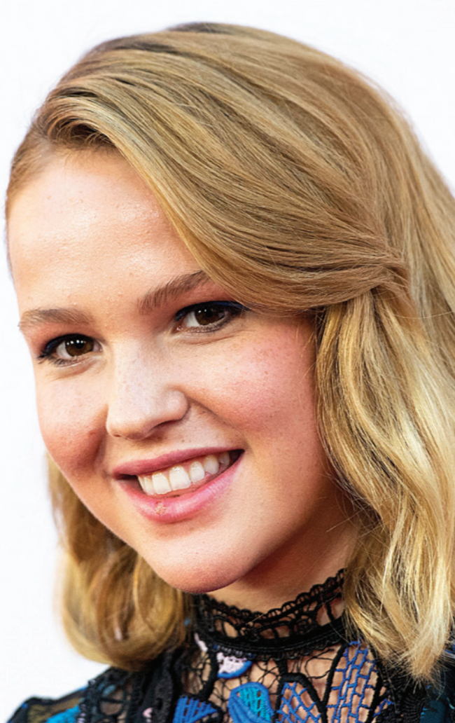
النجمة الشابة تاليتا باتمان حضرت حفل العرض الأول لفيلم «أنابيل... الخلق» في لوس انجليس