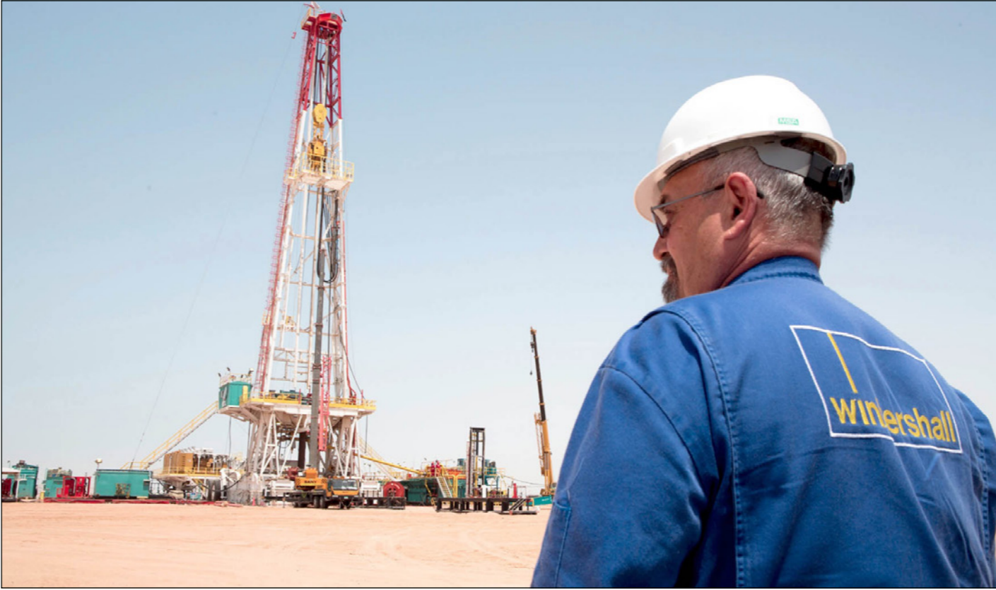
حفار في حقل أبو طفل الليبي الذي تديره فينترشال

■ لندن – رويترز: قال مصدر نفطي ليبي امس الأول ان إنتاج ليبيا من النفط الخام ارتفع أكثر من 50 ألف برميل يوميا إلى 885 ألف برميل يوميا، بعد أن انفتحت «المؤسسة الوطنية للنفط» على استئناف إنتاج كان قد توقف بسبب خلاف مع «فينترشال» الألمانية. فقد توصل الطرفان إلى اتفاق مؤقت الاسبوع الماضي بشأن خلاف تعاقدى حول أنشطة المنبع، كان قد تسبب في خفض الإنتاج بنحو 160 ألف برميل يوميا. وفي الاسبوع الماضي قالت المؤسسة أنها تتوقع انتعاش إنتاج ليبيا، عضو منظمة «أوبك»، إلى 900 ألف برميل يوميا في المدى القصير، في نطاق هدفها في الوصول بالإنتاج إلى مليون برميل يوميا مع نهاية يوليو/تموز.