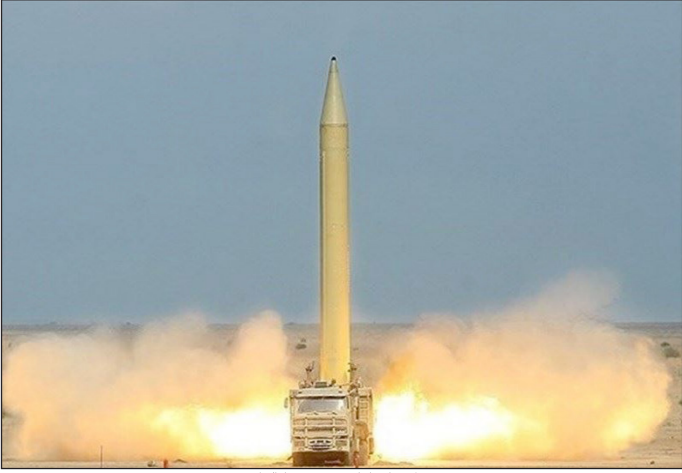
معظم صواريخ إيران وقعت في صحراء العراق