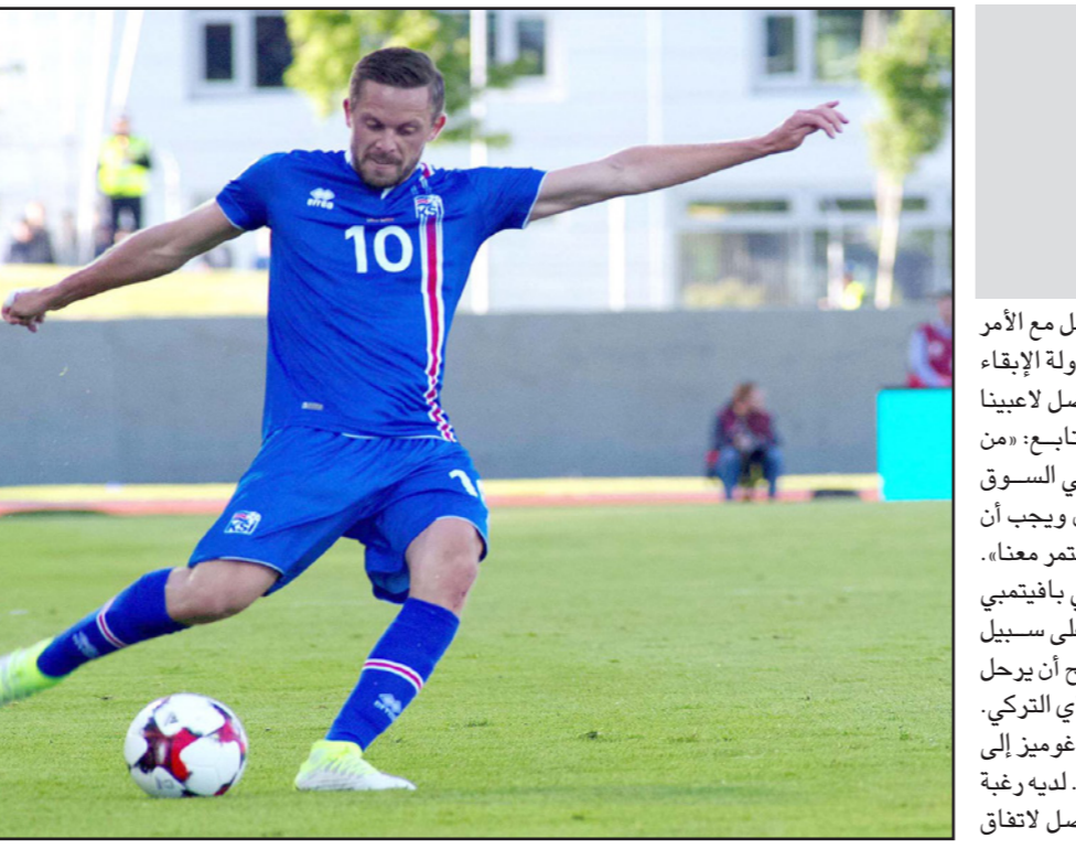
سيغوردسن أبرز نجوم سوانزي خلال الموسم الماضي ولن يسمح له النادي في الرحيل

■ أمستردام - د ب أ: أعلن الاتحاد الهولندي لكرة القدم، أمس، أن هانز فان بروكلين سيستقيل من منصبه كمدير فني للاتحاد بعد شغل المنصب لمدة عام واحد. وذكر الاتحاد الهولندي، في بيان، أن الحارس السابق فان بروكلين سينيته منته مطلع آب/أغسطس المقبل. وشهدت الفترة التي تولى فيها فان بروكلين منصبه حدوث تغييرات في الاتحاد وفي جهاز تدريب المنتخب الهولندي، وتعرض فان بروكلين لانتقادات فيما يتعلق بصلته بالبحث عن مدرب للمنتخب، حيث حصل ذلك أدفوكات في النهاية على المنصب، بينما قال مرشح آخر، وهو هينك تين كاتنه إن فان بروكلين وافق على جعله المدرب، وقال فان بروكلين: «سأترك مناصبي بشعور جيد لأنني أعلم أنني فعلت كل شيء لإدراك أهدافنا، ولكنني سأطلب انق نفسي»، وفشل المنتخب الهولندي في التأهل ليورو 2016، ويعاني حالياً في التصفيات الأوروبية المؤهلة لوندوبال روسيا 2018.