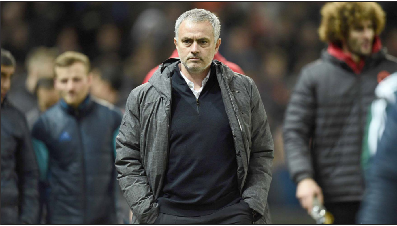
مورينيو أصبح آخر نجوم التهرب الضريبي ومن أبرز ضحايا القضاء الإسباني