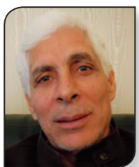
الحبيب السالي *

في المدرسة سوى حمام واحد يستعمله الصبية والبنات. وحفظا لمحبيتهن بنت المدرسة لهن حماماً صغيراً، إلا أن إسرائيل التي تعرف كل جدار بشيد في فلسطين بغضل كاميرات المراقبة التي ذات واجهة بسيطة فيها ثلاث قاعات تتجسس على الفلسطينيين، هدمت الحمام بذريعة أنه شديد دون أن تمنح المدرسة ترخيصاً بذلك.