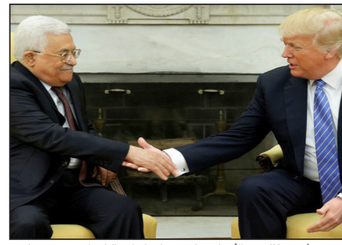
صورة أرشيفية للرئيس الأمريكي ترامب مصافحا نظيره الفلسطيني محمود عباس

الحرية، يقاتلون من أجل حرية فلسطين مستخدمين السلاح الوحيد الذي يملكونه: استهداف المدنيين، الهدف السهل. ترامب قال ما هو مفروغ منه: كل عمل إرهابي هو عمل شيطاني، ويجب القضاء على كل إرهاب. لا يوجد سبب يبرر قتل المدنيين الابرياء. لا فرق بين هجوم على ابراج التوائم في نيويورك وإطلاق النار على المدنيين في شوارع لندن أو عمل مخرب منتهر في مطعم في تل أبيب. القاعدة، داعش، حزب الله وحمام هي منظمات إرهابية، قال ترامب، ولم يبق لنا سوى أن نرد بالتصفيق. عندما يقول إن إيران هي دولة داعمة للإرهاب،