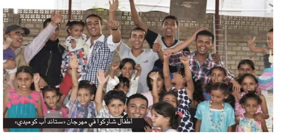
أطفال شاركوا في مهرجان «ستاند أب كوميدي»