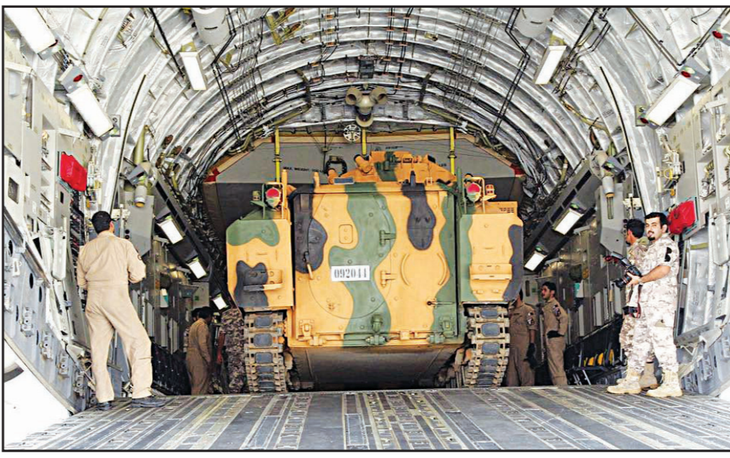
معدات عسكرية تركية إثر وصولها إلى قطر أمس

أثارت قائمة المطالب الثلاثة عشر التي قدمتها دول الحصار الثلاث (الملكة العربية السعودية والإمارات العربية المتحدة ومملكة البحرين)، مطالبة دولة قطر بتنفيذها خلال 10 أيام، ردود فعل تراوحت ما بين السخرية والاستغراب والرفض، في انتظار رد الفعل الرسمي من السلطات القطرية، فيما طالب فيه وزير الخارجية البريطاني جونسون بتقديم مطالب «واقعية لاستعادة وحدة الخليج»، واستتكرت شبكة «الجزيرة» بنسدة ما وصفته بالمحاولات البائسة لتكتميم الإعلام الحرس، في إشارة إلى المطالبة بإغلاق قنوات شبكتها.