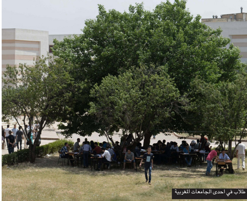
طلاب في إحدى الجامعات المغربية

الأخيرة على الصدارة، بتعداد يناهز 36768 مغربياً ومغربية مسجلين في الجامعات الفرنسية، بنسبة 11.8 في المئة من مجموع الطلبة الأجانب الموجودين في هذا البلد. تركز أغلب اهتمامات الطلاب المغاربة في فرنسا حول شعب العلوم التطبيقية والتقنية، والهندسة بكافة مناحيها.