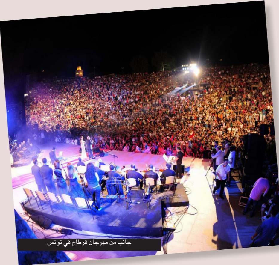
جانب من مهرجان قرطاج في تونس

وسيكون للمسرح نصيب ضمن أنشطة المهرجان حيث سيقدم عرض (عبدلي شو) للممثل التونسي الكوميدي لطفي العبدلي وعرض كوميدي آخر للمسرحي الفرنسي ميشيل بوجناح