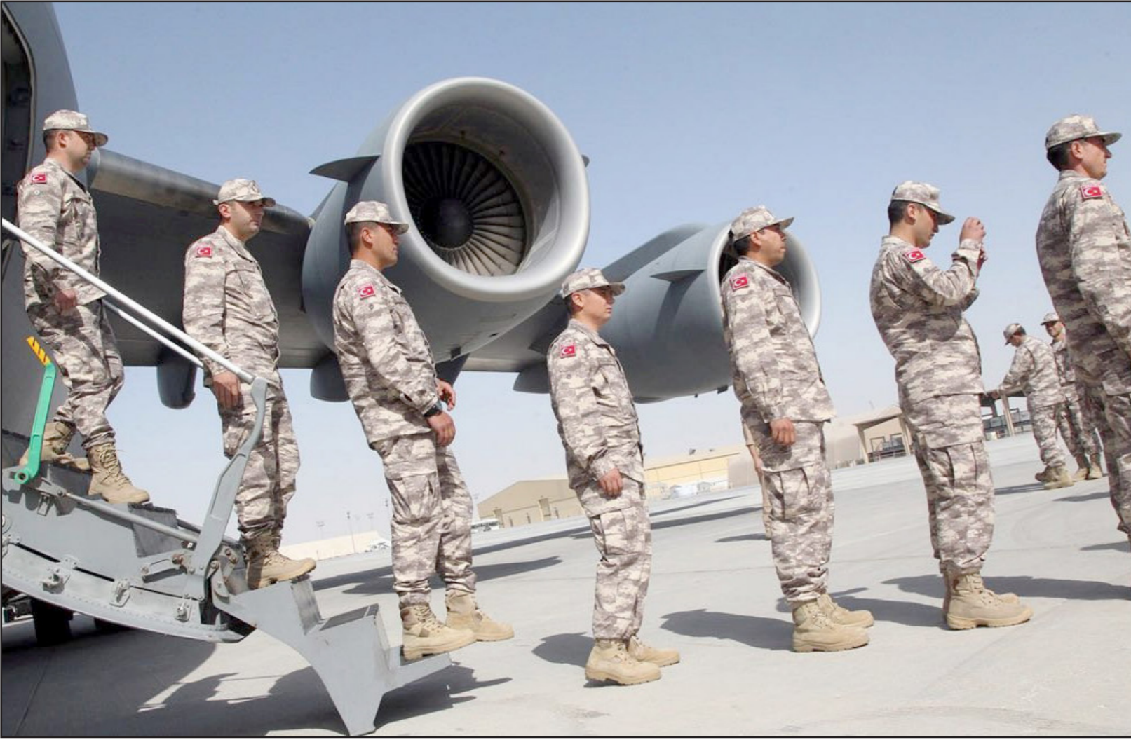
تعزيزات عسكرية تركية إلى قطر