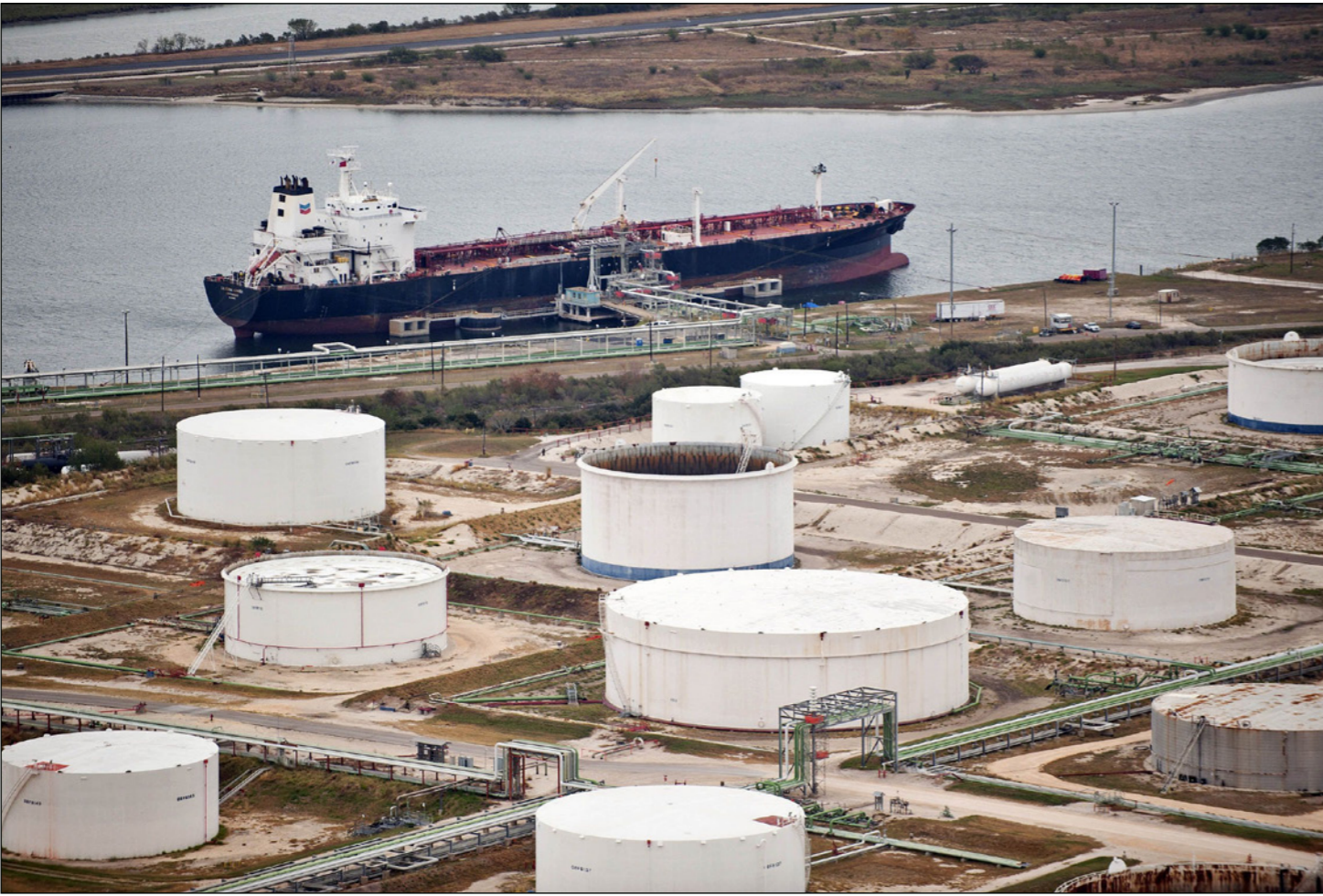
صهاريج تخزين نفط في منشأة في سنغافورة وسفينة تخزين راسية