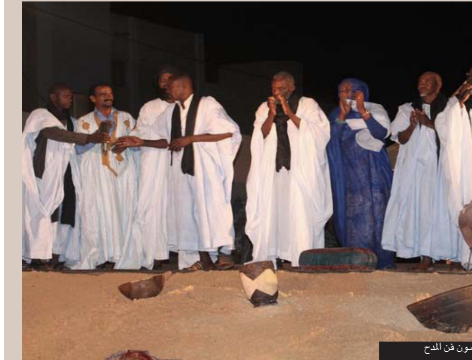
موريتانيون يمارسون فن المدح

وقال له القدس العربي: «في السنوات الأخيرة بدأت ثقافة التطرف والعنف تنتشر بين الشباب