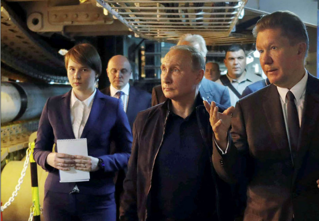
بوتين على متن سفينة لتعميد الانابيب يصفي الشرح عن انزالها إلى قاع البحر