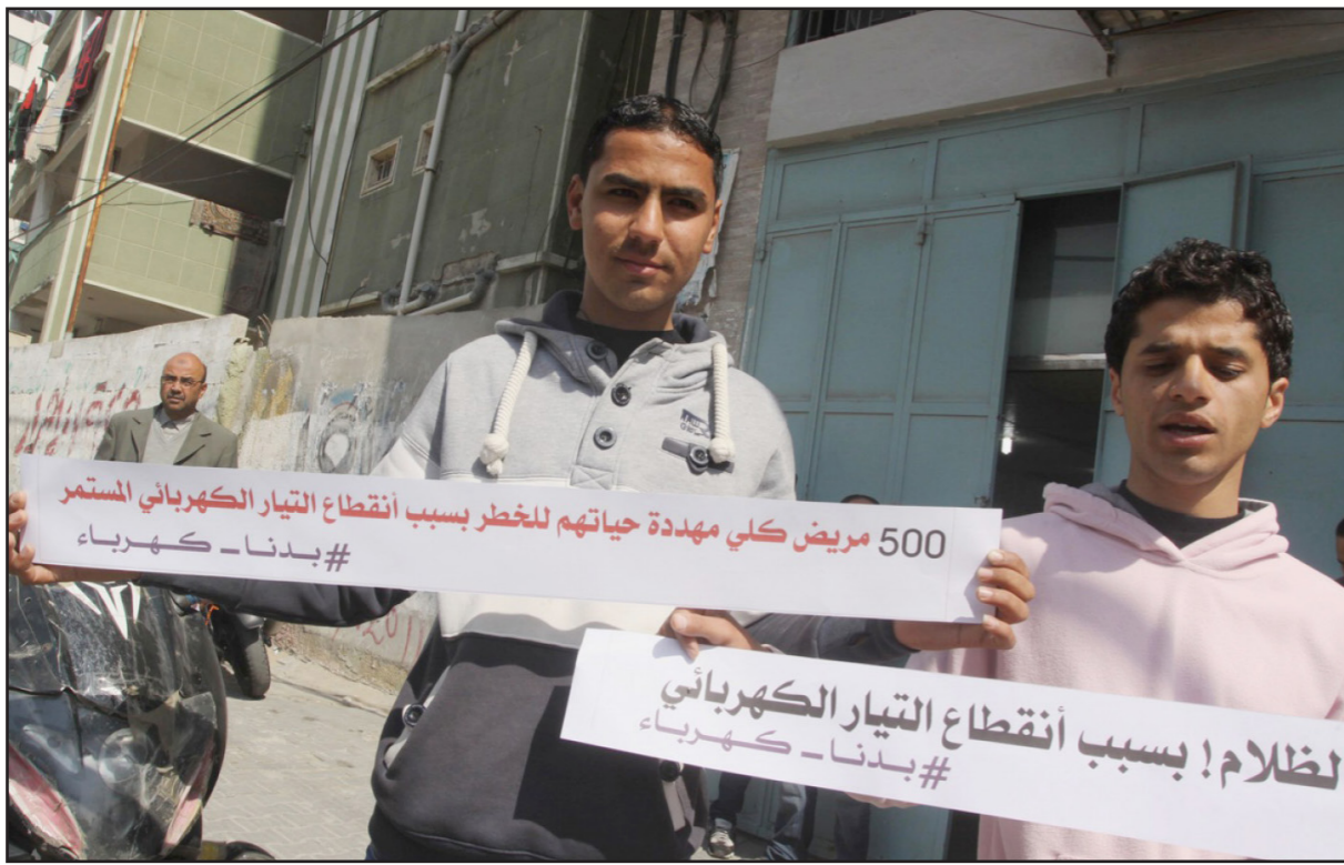
فلسطينيون يحتجون على الانقطاع المستمر للكهرباء في غزة

الإسرائيلية يقوم بشراء «الموديم» الذي يمكن ربطه مع بائع الانترنت الإسرائيلي. وهذا يعتبر غير قانوني ويحظر قوله، لكن هذا هو ايضا أحد الحلول.