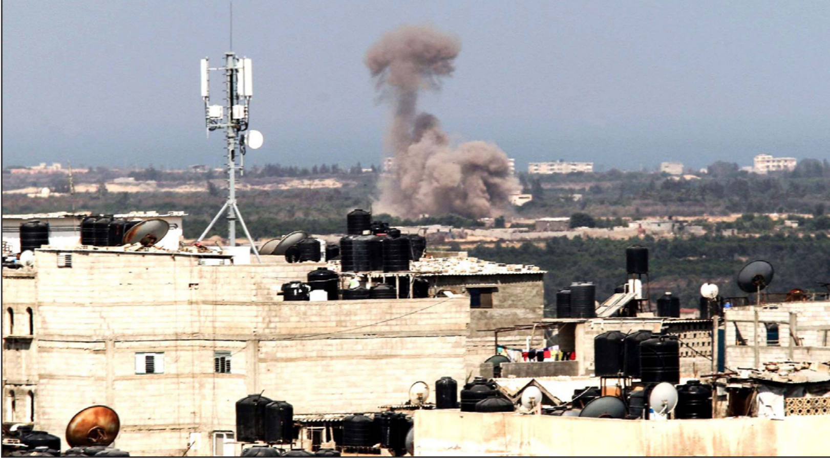
الدخان يتصاعد من أحد الأبنية في شمال سيناء على الحدود مع مدينة غزة

وأعتبرت الجبهة أن استمرار استهداف الجيش المصري ومواقع في سيناء، يأتي في سياق «استهداف الدولة المصرية»، وقالت الجبهة إن محاربة الإرهاب وقوى التطرف في المنطقة العربية «تتطلب تضامناً من الجهود على الصعيدين الوطني والقومي والرسمي والشعبي، لاستئصاله وجذوره الفكرية».