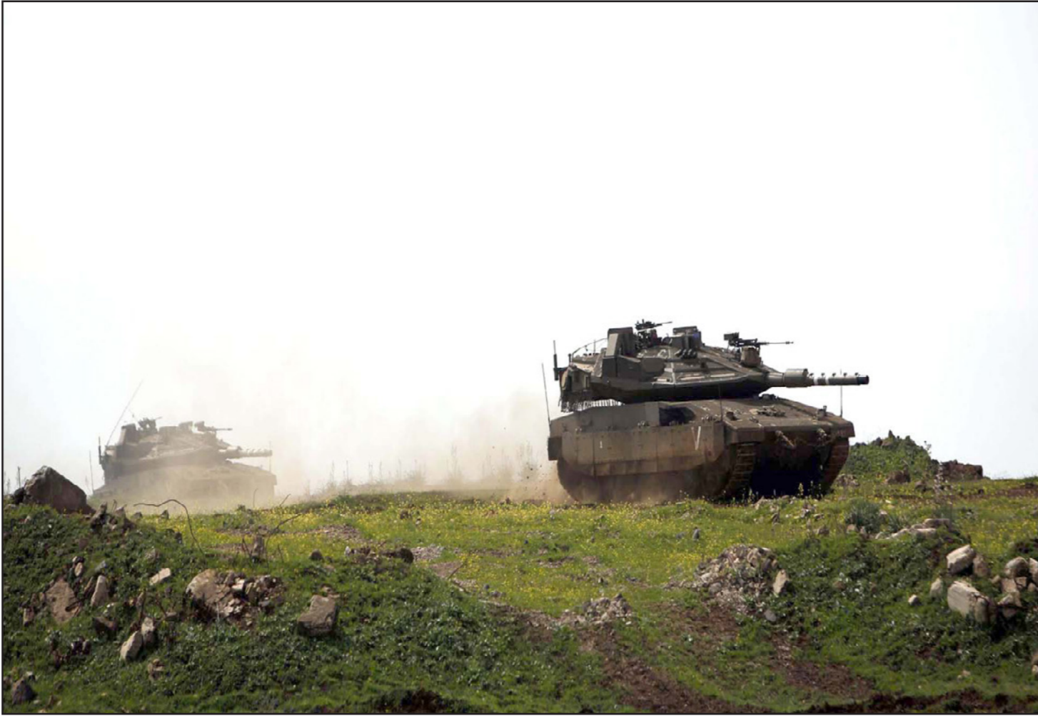
مدرعتان تابعتان للجيش الإسرائيلي خلال تدريبات في الجولان

ويعتبر محرر الشؤون العربية في صحيفة «هآرتس» د. تسمي بريثل أن الاتفاق المذكور لن يكون الأول من نوعه الذي تم تجريته في سوريا، لكن ما يميزه هو أنه أول نتاج لاتفاق روسي - أمريكي بعد تبادل لكلمات بين ترامب وبوتين. الجانب المهم، والمثير للنسك، في وقف إطلاق النار القريب برأي بريثل هو أن تنظييمات المعارضة وإيران وحزب الله ليست شريكة في الاتفاق، وليس من الواضح ما إذا ستنفذه.