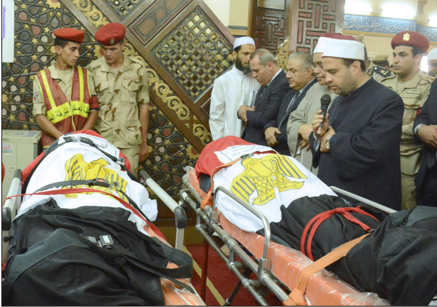
من تشييع الجنود المصريين الذين سقطوا في رفح

بدورات لتأهيل العناصر الانتحارية تمهيدا للدفع بهم لواصله نشاطهم العدائي بصقوف التنظيم.. وحسب البيان «تم التعامل مع المعلومات وتبين اتخاذ الكوادر الإرهابية من المنطقة الصحراوية الكائنة بنطاق الكيلو 11 دائرة مركز شرطة الإسماعيلية معسكرا لهم، حيث تم استهدافها في 8 يوليو الجاري (عقب إستئذان النيابة) وحال اقتراب القوات بادرت العناصر الموجودة في المعسكر بإطلاق وابل كثيف من النيران تجاهها، فتم التعامل مع مصدرها مما نتج عنه مصرع 4 إرهابيين أمكن تحديد عدد 5 منهم».