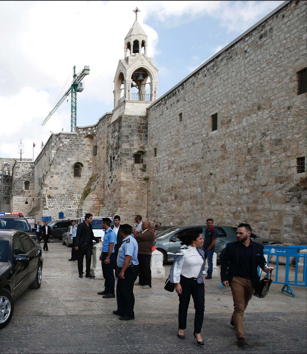
كنيسة المهد في بيت لحم جنوب الضفة الغربية