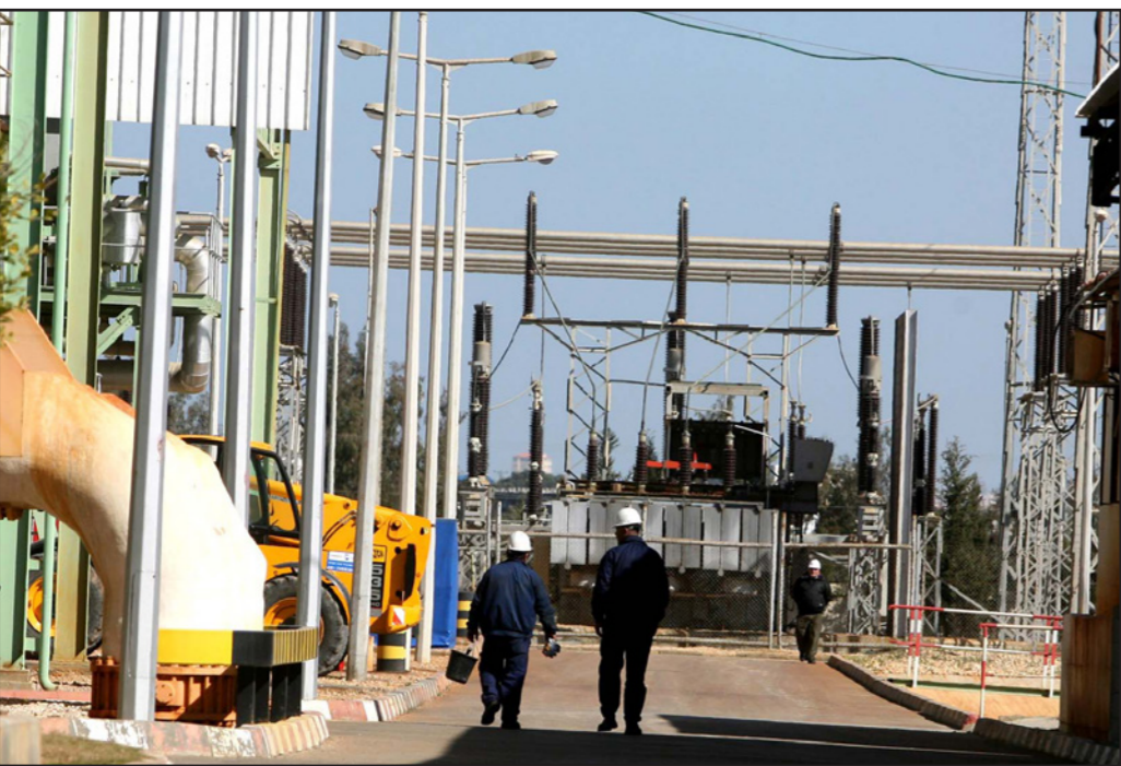
محطة كهرباء غزة