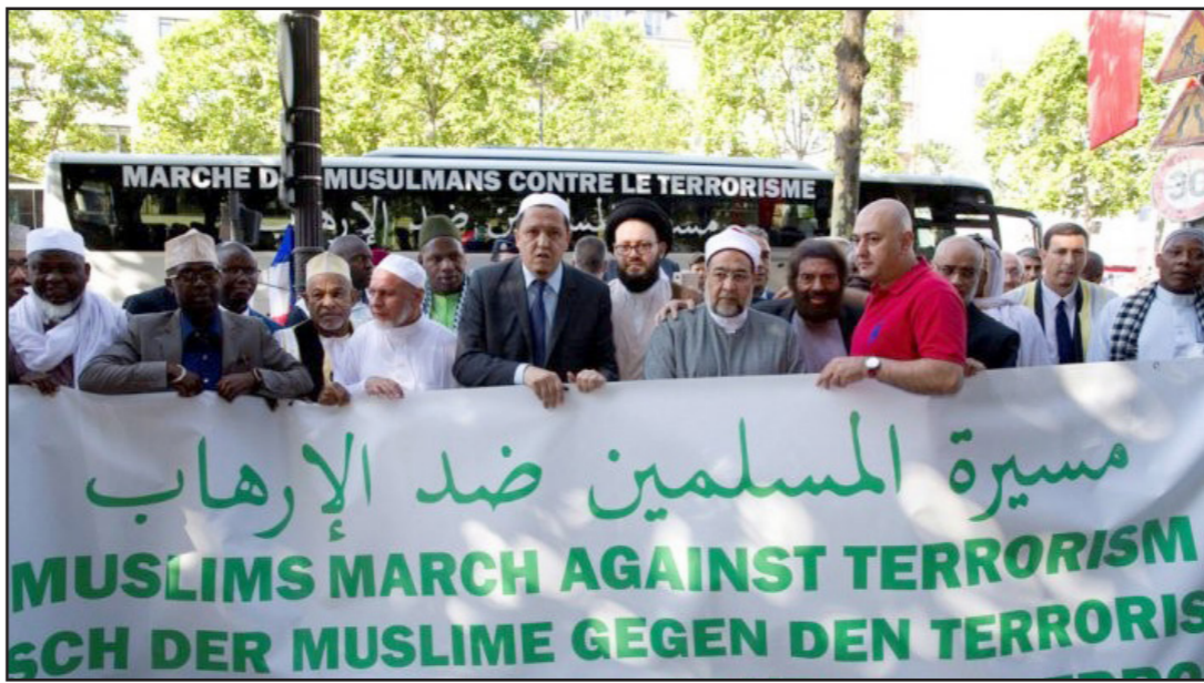
جانب من المسيرة التي نظمها المسلمون في فرنسا