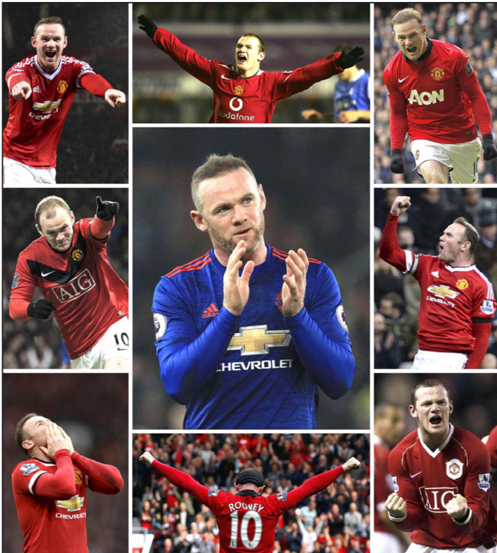
لحظات من مسيرة روني مع مانشستر يونايتد طيلة 13 عاماً

■ لندن - رويترز: عاد وين روني مهاجم مانشستر يونايتد وقائد منتخب إنكلترا السابق إلى إيفرتون، النادي الذي نشأ فيه منذ طفولته بعقد يمتد لعامين بعد حصوله على 13 لقباً خلال فترته في «أولد ترافورد». وتحدث روني (31 عاماً)، الذي انتقل لاستناد «غوديسون بارك» بدون مقابل، بحماس عن عودته للنادي الذي بدأ معه مسيرته. وقال: «الفوز بالقباب مع إيفرتون سيكون قصة الجيد وأشعر غان النادي يتجه حقا إلى المسار الصحيح ويضم لاعبين يمكنهم اللعب المطلوب. أريد أن أشكل جزءاً من فريق ناجح». وأضاف: «العودة تمنحني شعوراً رائعاً ولا أظن الانتظار حتى أقابل زملاء وأتدرب مع الفريق». وتفجرت موهبة روني في الدوري الممتاز عندما سجل هدفاً رائعا ليقود إيفرتون للفوز على أرسنال وكان يبلغ حينها 16 عاماً، ثم انتقل ليونايتد بعد عامين مقابل 30 مليون جنيه استرليني. وسجل ثلاثية في مباراته الأولى أمام فناربخسه في دوري أبطال أوروبا، وحاض أكثر من 550 مباراة مع يونايتد وحاز 253 هدفا ليصبح هدافه على مر العصور متخطياً رقم الأسطورة بوبي تشارلتون. وروني هو الهدف التاريخي لمنتخب إنكلترا أيضا برصيد 53 هدفاً والأكثر حوضاً