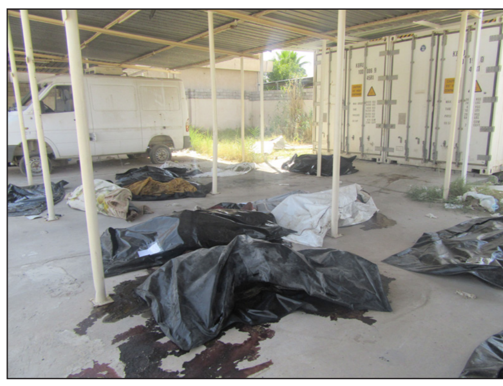
جثث مدنيون في المركز الطب العدلي في نينوى

والمقودين»، ونوه إلى أن «مشكلة نقص التلجالات لحفظ الجثث المجهولة تم حلها باستخدام حاويات مخصصة لحفظ الأدوية، كما تم استخدام تلاجوات موجودة في الجانب الأيمن في مناطق محررة مؤخراً». وأوضح أن «الجثث المجهولة يتم حفظها في التلاجوات لمدة 60 يوماً وإذا لم يراجع احد لاستلامها من أقربهم يجري دفنهم في مقابر عمري». وتتكدس في الجثث في قسم الطب العدلي، داخل التلاجوات، إضافة إلى أن الكثير منها خرجها لكثرة العدد، بعض الجثث يعود لرجال ونساء وأطفال، ويصعب تمييز معالمها، بسبب النقص بعد مرور أيام