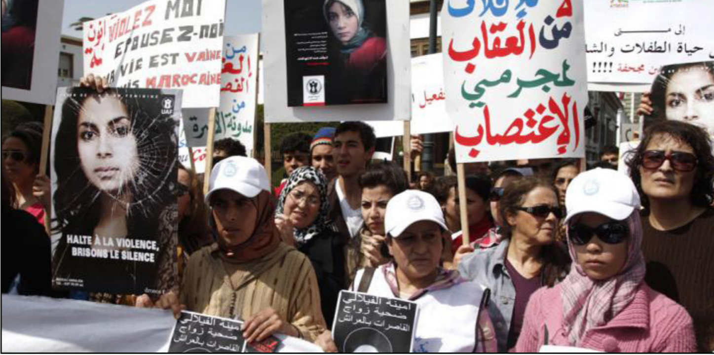
جانب من تظاهرة أمام البرلمان المغربي