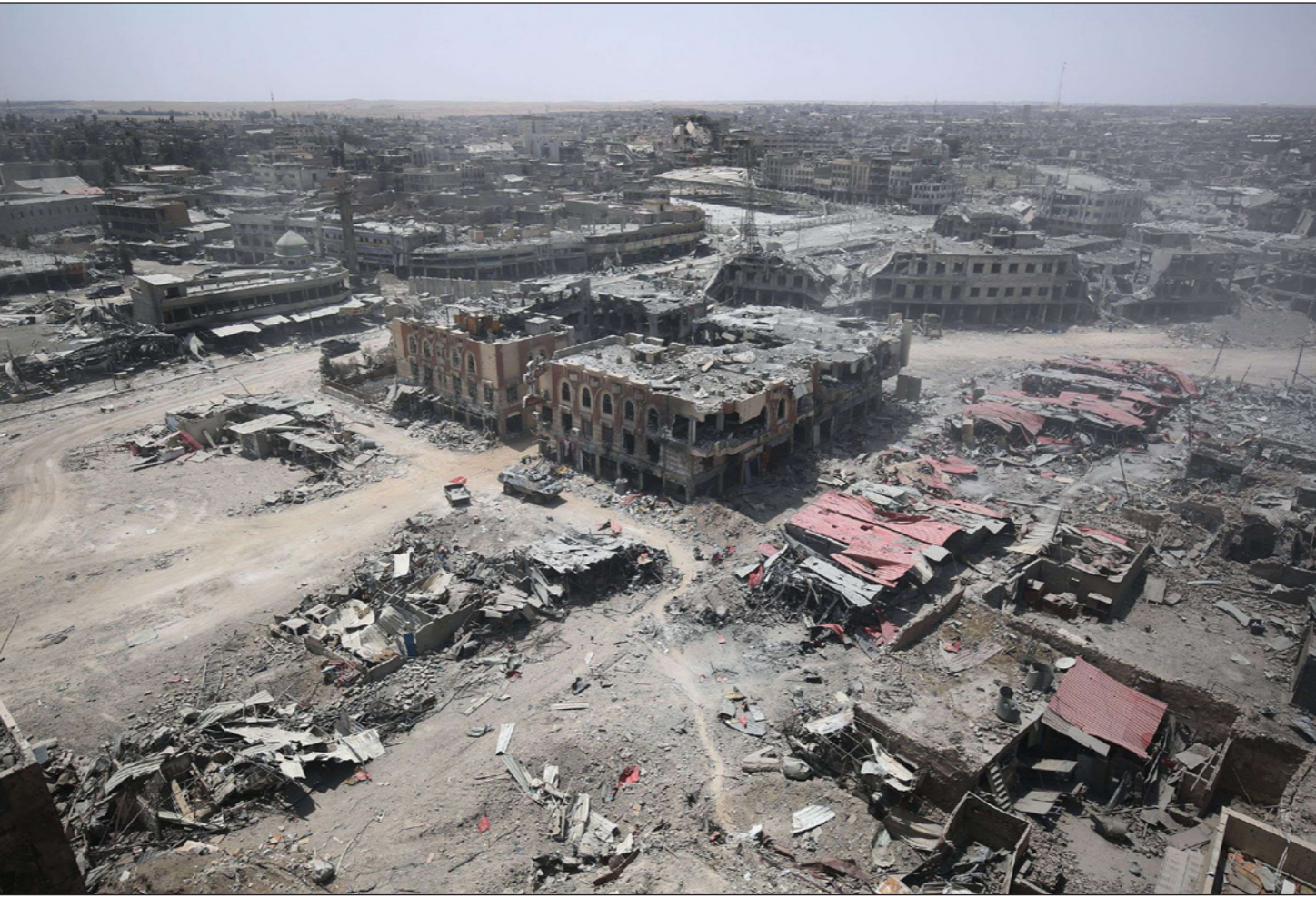
صورة توضح مدى الدمار الذي خلفه الاقتتال بين القوات العراقية وتنظيم «الدولة» في الموصل

ولن يحل سقوط الرقة أزمة سوريا بل سيعمقها»، ولن تنتهي بالضرورة مشكلة تنظيم الدولة، وفي الوقت الذي يتلاشى فيه حلم بناء «إمبراطورية» في كل أنحاء العالم الإسلامي ستظل أيديولوجيته مغفوسة بالسلم وخلافته ستبقى «افتراضية» وتستمر.