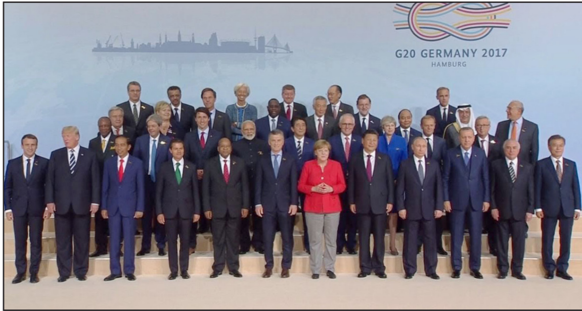
صورة تذكارية لزعامة قمة العشرين في هامبورغ

كيسنجر، وليس الطموح إلى التوصل إلى حل شامل خطوة واحدة. هكذا ولد في هامبورغ أساس نظام جديد بين واشنطن وموسكو. وفي جميع الحالات، من الواضح منذ الآن أن الشائعات حول تبني خط أمريكي متسامح تجاه موسكو، كانت سابقة لأوانها، وهذا على خلفية الصيغة الجديدة التي تعتمد على مبدأ التبادلية.