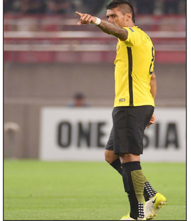
باولينيو يبحث عن مخرج من ناديه الصيني إلى برشلونة

■ برشلونة - د ب أ: أكد لاعب الوسط البرازيلي باولينيو أنه سيعيداً لو انتقل إلى برشلونة، داعياً فريقه الحالي غوانتشو الصيني إلى الدخول في مفاوضات مع النادي الكاتالوني لاتمام تلك الخطوة. أكد باولينيو أنه مستعد لتقليص راتبه لاتمام صفقة انتقاله لبرشلونة، داعياً غوانتشو إلى إبداء بعض السلاسة في التفاوض مع الفريق الإسباني. ورفض غوانتشو عرضاً قيمته 20 مليون يورو تقدم به برشلونة لضم باولينيو لاعب وسط توتنهام السابق. وأصر غوانتشو على الاحتفاظ بنجمه البرازيلي الذي يتضمن عقده مع الفريق شرطاً جازماً بقيمة 40 مليون يورو. وفي الوقت الذي بدأ فيه برشلونة مساعيه لضم ماركو فيراتي لاعب باريس سان جيرمان بعد فشل المفاوضات مع غوانتشو، خرج اللاعب البرازيلي عن صمته في محاولة لإزالة العقائل التي تقف أمام انتقاله إلى «كامب نو». وقال باولينيو: «فجأجت