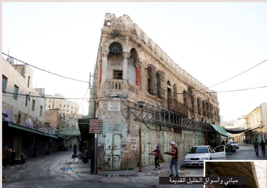
بياني وأسواق الخليج القديمة