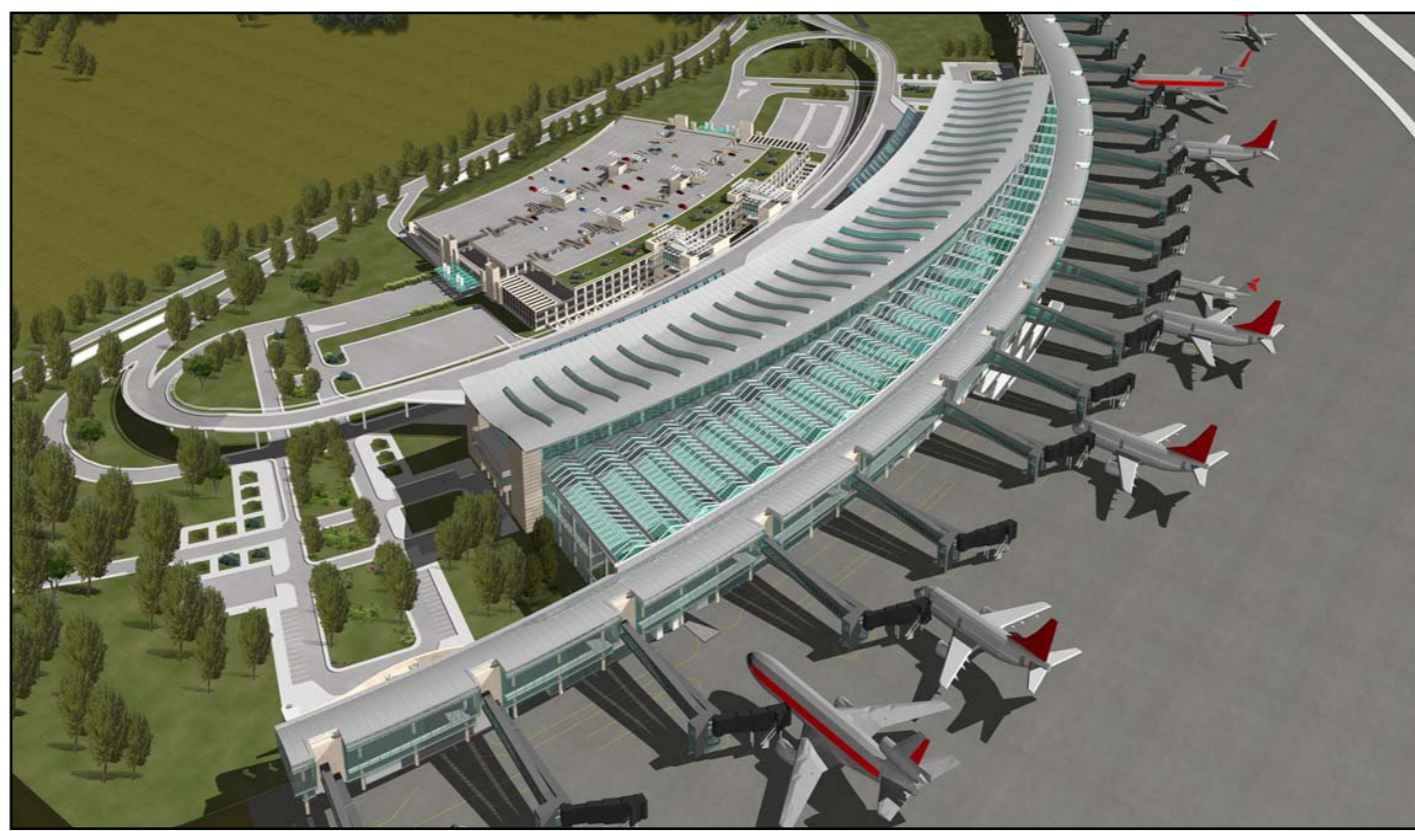
تصميم مطار إسطنبول الثالث

يعملون دون توقف، داخل مشروع المطار الثالث، عبر 8 آلاف آلية متنوعة. وأشار إلى أن المطار سيوفر فرص عمل لأكثر من 100 ألف شخص، عند الانتهاء من بناء المرحلة الأولى العام القادم، جدر بالذكر أن المرحلة الأولى من المطار تنتهي العام المقبل، ويستقبل 90 مليون مسافر سنويا، ويوفر 100 ألف فرصة عمل، ومن المنتظر أن تصل فرص العمل المتوفرة في المطار إلى 225 ألف مع حلول 2025، وسيساهم بنسبة 4.9% في الناتج المحلي الإجمالي للبلاد، وسيغلب المطار دورا مهما في تحقيق تركيا لأهدافها الاقتصادية المتمثلة بدخول قائمة أكبر 10 اقتصادات في العالم بحلول 2023.