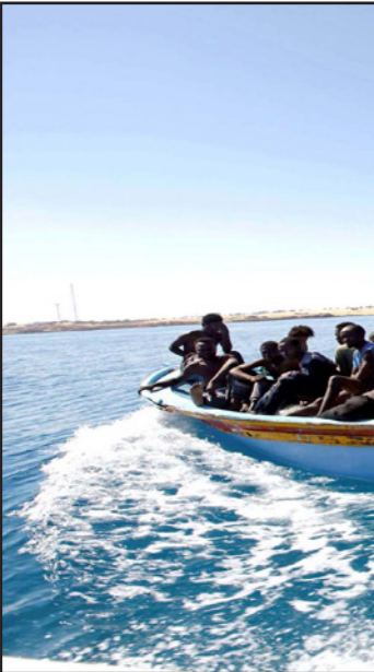
مهاجرون غير شرعيين في المتوسط

القاهرة- طرابلس - من ربيع العسكري ووليد عبد الله: أعلنت وزارة الخارجية المصرية، رسمياً، مساء السبت، العثور على 19 مهاجر غير شرعي من مصر في ليبيا، بعد يوم من إعلان ممثل من الهلال الأحمر الليبي في طبرق، وقالت الخارجية، في بيان إن «السفارة المصرية في طرابلس (تتأسر عملها من القاهرة) علمت من مصادرهما في الهلال الأحمر الليبي، بأنه تم العثور على جثامين نحو 19 شخصاً، في المنطقة الصحراوية الليبية، في طبرق وأجدابيت (شرق)».