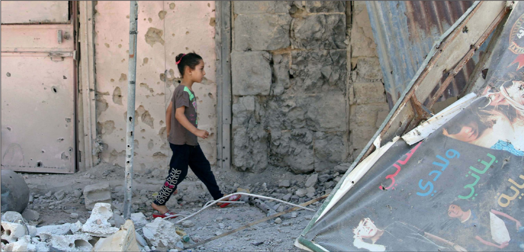
طفلة سورية تمشي وسط الدمار في درعا