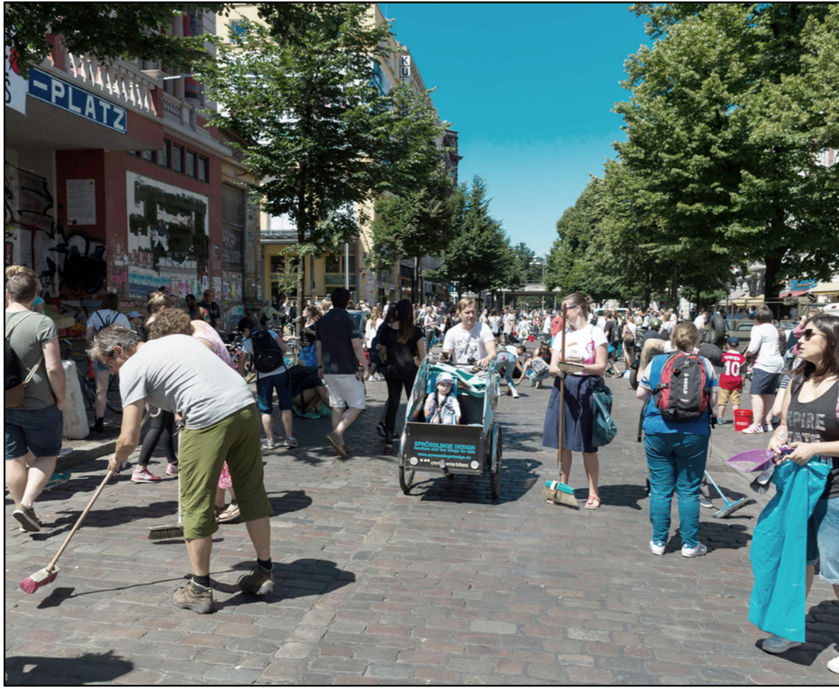
عمليات تنظيف آثار الاحتجاجات ضد قمة العشرين

تكون مصدرا للهجرة الى أوروبا. وشهدت باريس بالتأكيد على أهمية عدم نسيان الدول الأضعف في هذا المجال وخصوصا البلدان الواقعة في منطقة الساحل في الصف الأول لمكافحة التيار الجهادي. لكن مصدرا قريبا من المفاوضات قال إن فرنسا كانت الدولة الوحيدة التي أثارت هذه القضية. وقالت منظمة أوكسفام غير الحكومية السبت إن مبادرة مجموعة العشرين «تستند إلى الفرضية التي تتسم بمسألة خطيرة بأن تطوير الاستثمار الخاص سيساعد بشكل تلقائي أكثر ففرا في القارة». فقد ذكرت منظمة «وان» غير الحكومية أنه «يجب أن تكون ظروف الاستثمار جيدة مع سكان مؤهلين إلى درجة كبيرة». ما يتطلب «مساعدة عامة كبيرة وزيادة التفتاح في الدول الإفريقية» لقطاع التعليم.