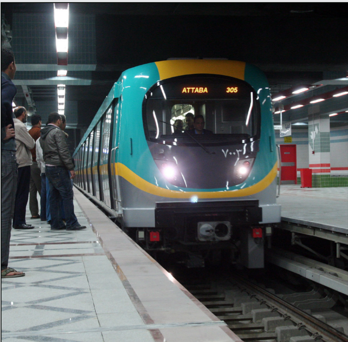
إحدى محطات المترو في القاهرة

بالمئة لتصل إلى جنيهين للتذكرة. يأتي الإعلان عن الزيادة الجديدة بعد أيام قليلة من رفع حكومة شريف إسماعيل أسعار جميع المواد البترولية والكهرباء ورفع رسوم عدد من الخدمات.