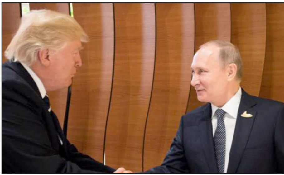
الرئيس الأمريكي ترامب ونظيره الروسي بوتين يتصافحان أثناء مشاركتهما في قمة العشرين في هامبورغ

■ واشنطن - أف ب: أعلن الرئيس الأمريكي دونالد ترامب أمس الأحد أنه لن يتم تخفيف العقوبات المفروضة على روسيا طالما لم تحل المشاكل في أوكرانيا وسوريا، في حين طالب نواب جمهوريون بتشنيد اضافي للعقوبات على روسيا، بسبب تدخلها في الانتخابات الرئاسية الأمريكية. وقال ترامب في تغريدة أثر عودته من جولة استمرت اربعة ايام في أوروبا التقى خلالها للمرة الاولى الرئيس الروسي فلاديمير بوتين «في يتم القيام بشيء حتى حل المشاكل في أوكرانيا وسوريا»، مضيفا بأنه «لم يتم التطرق إلى العقوبات، خلال الاجتماع».