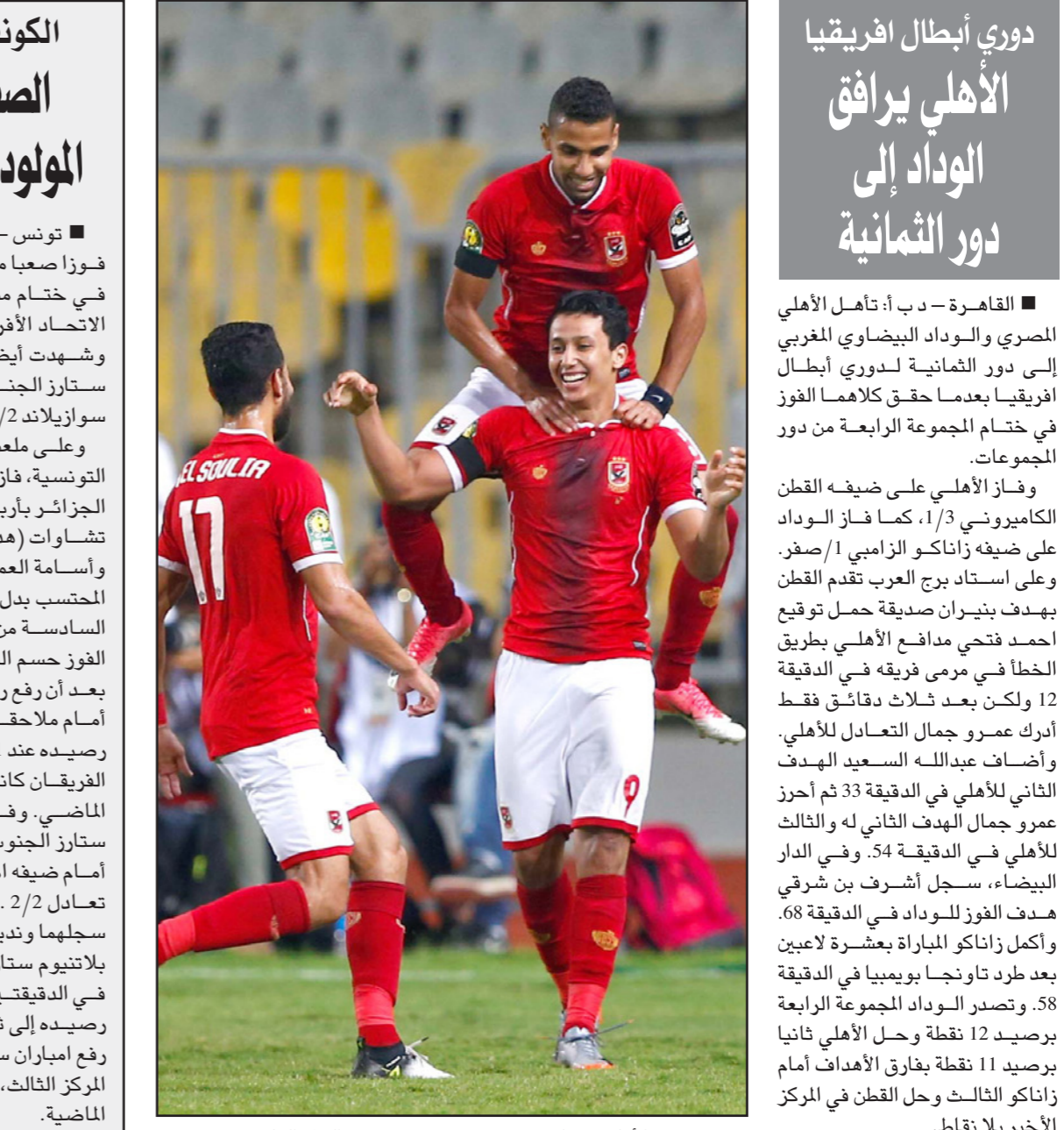
لاعبو الأهلي يحتفلون بعد تسجيل هدف في مرمى القطن الكاميروني