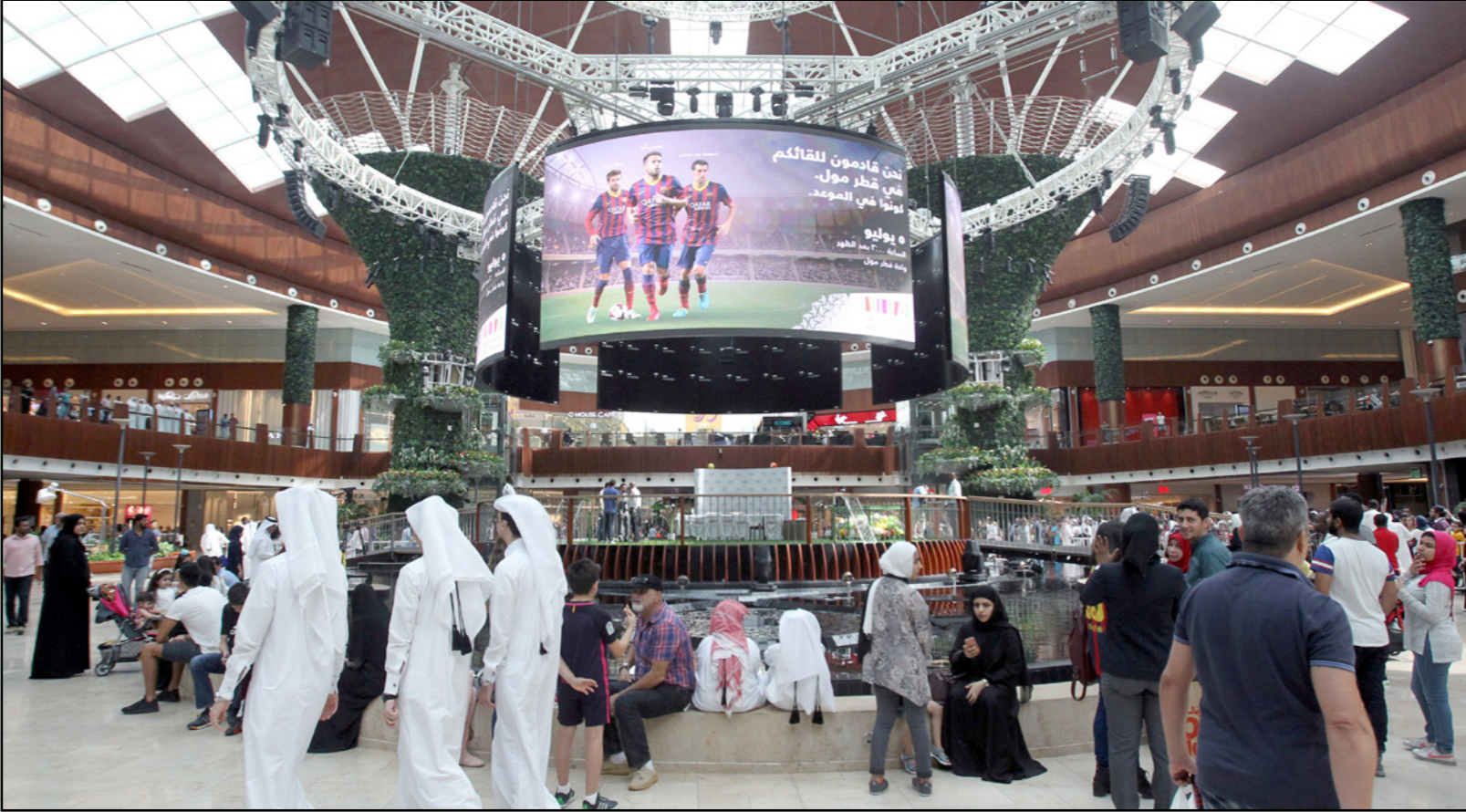
قطريون يتسوقون في أحد مولات الدوحة

الدوحة - «القدس العربي»: أكد الشيخ خليفة بن جاسم بن محمد آل ثاني رئيس غرفة قطر أن القطاع الخاص القطري أثبت قدرته على تجاوز تبعات الحصار الاقتصادي الذي تفرضه الدول المقاطعة على دولة قطر، حيث سارت قطاعات الأعمال المختلفة منذ بداية الحصار إلى فتح قنوات جديدة لاستيراد السلع الغذائية والمواد الأولية المتعلقة بالبناء. وقال في تصريح نقلته وكالة الأنباء القطرية أمس إن جهود القطاع الخاص في هذا المجال وضمت استمرار تدفق تلك السلع إلى السوق المحلية بنفس الوتيرة التي تضمن عدم حدوث نقص في أي من السلع الاستهلاكية. وأشار إلى وجود تنسيق متواصل بين غرفة قطر وتنسيق الوزارات والمؤسسات الحكومية المعنية سعياً لتذليل كافة العقبات أمام قطاعات الأعمال بما يمكنها من الاستمرار في أدائها على الوجه الذي يضمن تدفق السلع إلى السوق بشكل طبيعي ودون حدوث أي نقص في السلع والمواد الاستهلاكية، خاصة في قطاعات الأغذية والمواد الأولية و مواد البناء موضحة أن الغرفة تعقد اجتماعات يومية مع التجار والموردين لمناقشة كافة العوائق التي تواجههم في هذا السبيل وإحالة ما يواجههم من عقبات إلى الجهات ذات الاختصاص لوجود حلول فورية. وأشاد بالتعاون الكبير الذي تبديه مختلف الوزارات والمؤسسات الحكومية في هذا الخصوص حيث أثمر هذا التعاون عن وجود حلول لجميع المشاكل التي تواجه التجار القطريين كما أثمر أيضاً عن فتح آفاق جديدة أمام رجال الأعمال لتوسيع أنشطتهم بهدف تغطية و سد أي عجز قد ينتج عن تبعات الحصار في الإنتاج المحلي وتوسيع قنوات الاستيراد من الخارج. وقال إن الفترة المقبلة ستشهد توجها نحو التركيز على تشجيع رجال الأعمال على توطين المزيد من