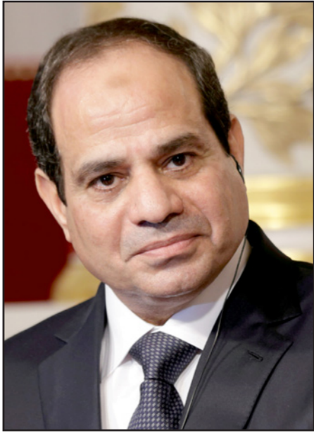
الرئيس المصري عبد الفتاح السيسي

ويحاكم في القضية 151 متهما حوزوريا، و141 غيابيا، فيما نفى المتهمون وهيئة الدفاع عنهم تلك الاتهامات، ووصفوها بـ«البعيثة».